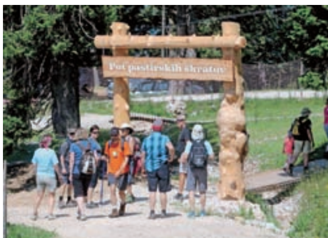
Mogočni vhod na Pot pastirskih škratov