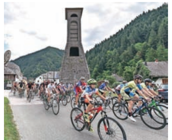
Tekmovalci so se po zlato čipko podali iz Železnikov proti Davči.