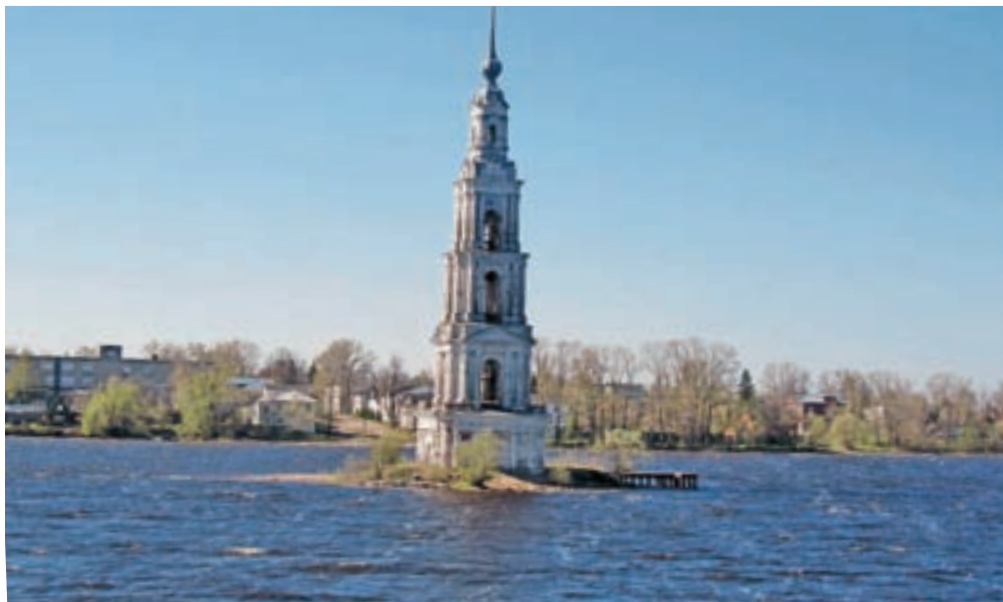
Zaradi gradnje kanalov so bila potopljena številna polja, na tisoče vasi. Da je pod vodo vas, spominja iz vode štrleči zvonik pri Kaljasinu.

začetek vodne poti do drugega največjega ruskega mesta Sankt Petersburg, v nekdanjih časih Petrograda, do leta 1924 in kasneje do leta 1991 Leningrada. Blizu dva tisoč kilometrov dolga plovba do