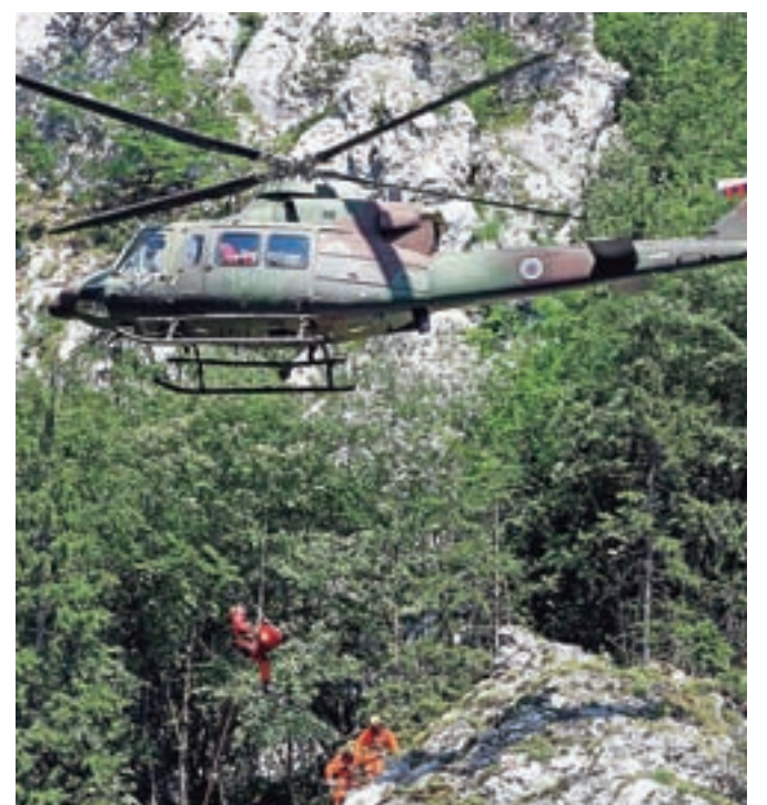
Dežurna ekipa GRS in posadka helikopterja Slovenske vojske sta minuli konec tedna večkrat poletela na pomoč ponesrečenim planincem.

V petek zgodaj popoldne se je planinec zaplezal