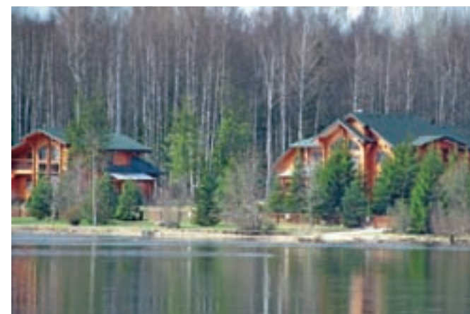
Razkošne dače premožnih Rusov v zavetju brez

Sankt Petersburga poteka potem po vodnih širjavah mimo Kaljasina in za rusko zgodovino pomembnega Ugliča s 143 kilometrov dolgo zaježitvijo Volge. Potovanje na sever proti Petrovem mestu na obali Baltika oziroma Finskega zaliva poteka do Rybinskega še po Volgi. Tu, v leta 1941 zgrajeni umetni zaježitvi, dolgi kar 217 kilometrov, se najbolj slavna ruska reka obrne desno proti Jaroslawlu, plovba na sever pa se nadaljuje po tem ogromnem umetnem jezeru. Jez so gradili večinoma politični zaporniki, ki jih v Stalinovem času ni manjkalo, voda pa je zalila 4000 hektarov polj in 700 vasi. Prebivalce so, tako pravijo, preselili neznano