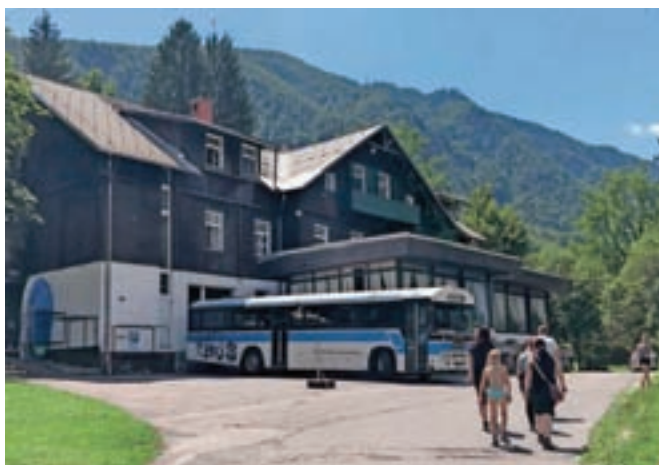
Hostel Pod Voglom je namenjen vsem generacijam, predvsem tistim, ki iščejo športne aktivnosti.

Na dražbo se je sicer prijavilo sedem dražiteljev, a je eden od njih prepoznano položil varščino, zato mu ni bilo