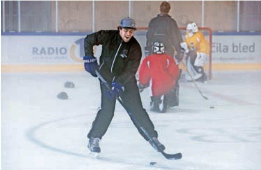
Anže Kopitar, skupaj z ostalimi hokejisti in trenerji, na Bledu radodarno razdaja svoje znanje in izkušnje.