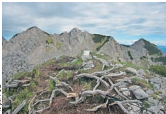
Vrh Srednje peči, s Svačico in Jelenčkoma v ozadju

proti Stolu. Kmalu se precej spustimo, izgubimo višino, saj smo v škrbini, ki nas pripelje V Kožne. Nadaljujemo še kar naprej proti Stolu, mimo nekaj ogromnih balvanov. Ko smo na vrhu strmejšega dela, ki mu sledi izravnavo, zapustimo markirano pot in se po občutku, morda se bo celo videla rahlo shojena pot, povzpnejo do začetka grebena gore, ki je na naši levi strani. Ko smo na začetku