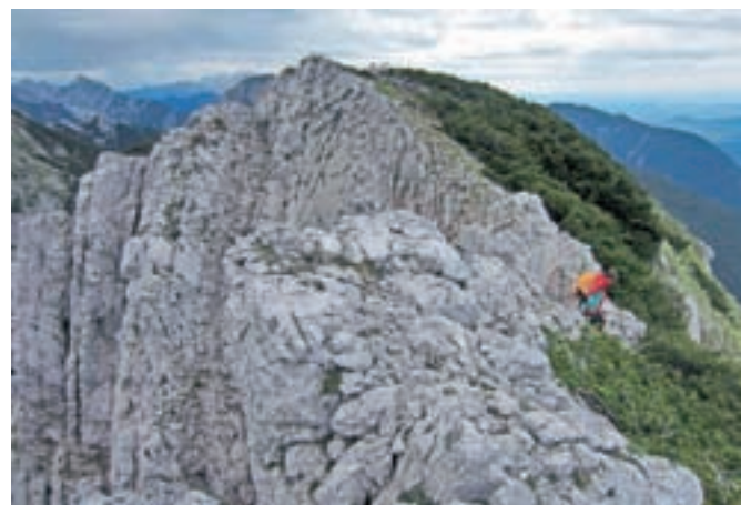
Grebena proti vrhu Srednje peči