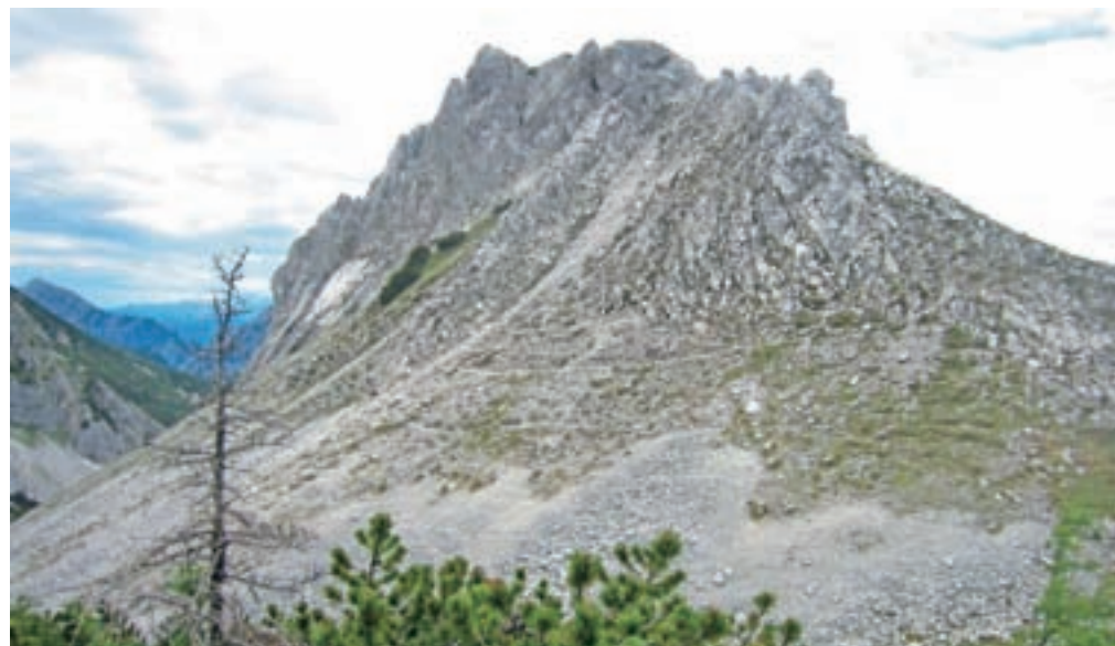
Srednja peč, osamljena, krušljiva dama v neposredni sosesčini Stola

Vrtači. Ko prečimo smučišče in dosežemo gozd, je pred nami prijetna pot, kjer na svoj račun pridejo ljubitelji alpskega cvetja: Clusijevega svišča, Sternbergovega klinčka, snežnega svišča, dišečega volčina itd. Sledi pas ruševja in ko prečimo daljše melišče, je skala z markacijo; desno se gre proti Vrtači, levo proti Stolu. Nadaljujemo levo, proti Stolu. Po krajšem času pridemo na razpotje; levo gre pot na Srednji vrh, desno pa proti Stolu. Nadaljujemo