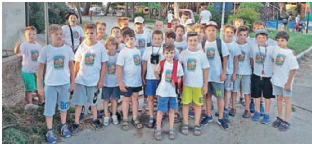
Udeleženci košarkarskega tabora v drugem terminu