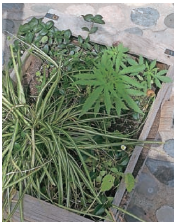
Konopljo v koritu reklamne table za hišo Layer v centru Kranja so kranjski policisti že zasegli.

Kranj – Pred dnevi so nas budni opazovalci mestnega utripa v Kranju opozorili, da v cvetličnem koritu pod usmerjevalno reklamno tablo, ki na Glavnem trgu vabi goste v bližnjo hišo Layer, raste nenavadna roža. No, v bistvu je šlo za travo oziroma konopljo. V soboto smo se o tem prepričali tudi na lastne oči, že kmalu zatem pa so jo »poželi« kranjski policisti. Kljub vsem prizadevanjem za legalizacijo marihuane je namreč v Sloveniji pridelava konoplje še vedno prepovedana, pa četudi le kot okrasne rastline ... Zaseg »rastline, ki daje videz konoplje«, so nam včeraj potrdili tudi na Policijski upravi Kranj, kjer zdaj vodijo postopek zoper neznanega vrtnarja oz. storilca.