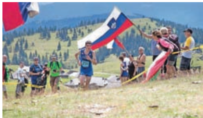
Glasni navijači za spodbudo na zadnjih metrih proge