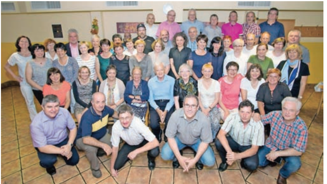
Da spomini ne bodo prehitro zbledeli, bo poskrbela tudi fotografija, ki je ob nastala ob srečanju.

Večer, ki se je prevesil v noč, je minil hitro. Dogovorili so se, da se naslednjič srečajo čez pet let in ne deset, kolikor je minilo od njihovega zadnjega srečanja.