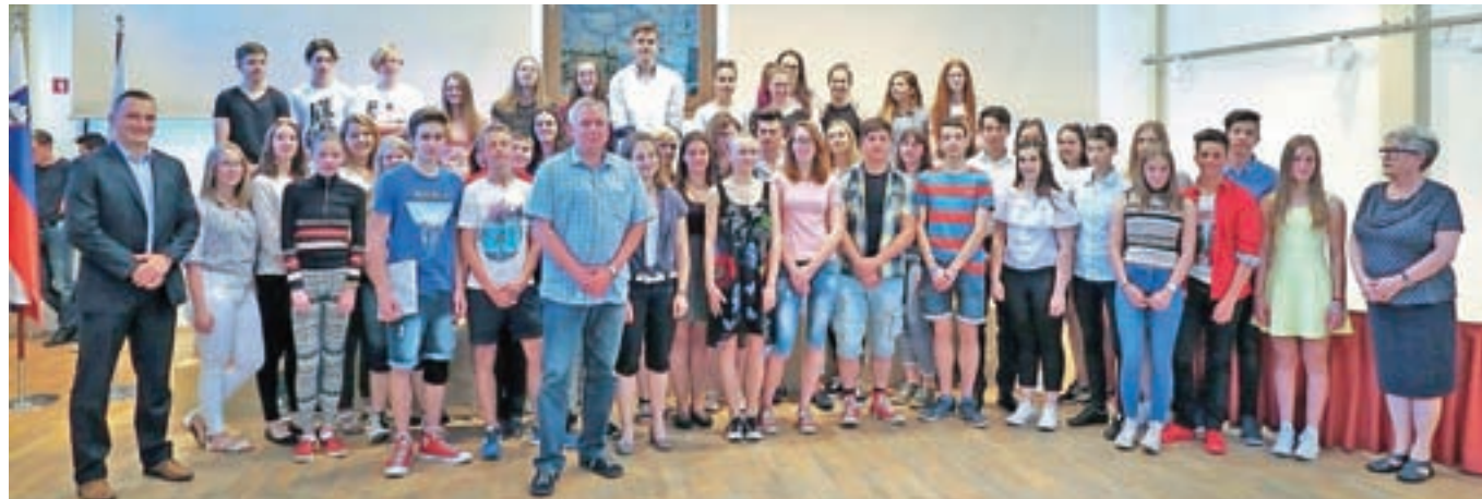
Najboljši jeseniški učenci in dijaki z županom in podžupanoma

Duša slovenska, jim zaželel veliko uspeha in sreče na nadaljnji poti, za kulturni program pa so poskrbeli učenci Glasbene šole Jesenice.