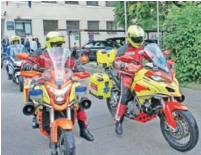
Policisti in reševalci bodo imeli odslej na motorjih nameščen napredni sistem za samodejno ugašanje smernikov.

Mnogi policisti in reševalci pri svojem delu uporabljajo starejša motorna kolesa oz. motorna kolesa, ki nimajo vgrajenih smernikov, ki bi se samodejno izklopili, zato bo napredni sistem STS še kako prispeval k njihovi večji varnosti v prometu. Namestitev sistema STS na motorje policistov in reševalcev bo zagotovil AVP v sodelovanju s slovenskim zagonskim podjetjem ABCS sistem, ki je sistem razvil.