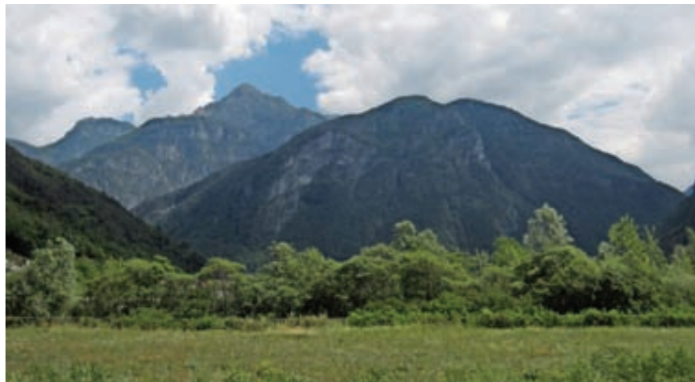
Pogled na poraščeno Monte Jama

nas opomni, da je bila to nekoč verjetno pot, ki so jo uporabljali prebivalci vasi Patoc, ko so v dolino Bele odhajali po opravkih. Ko višina malce popusti in preči pobočje, pridemo do hudourniške grape, ki jo prečimo. Od tu dalje pot postane strma, zares strma. Steza je tudi slabše ohranjena, deloma zaraščena. Vmes na poti so tudi skale, kar zna biti po dežju problematično zaradi nevarnosti zdrsa. Strma pot preči grapo potoka Agadoris. Nato sledijo lepi, zložni okljuki, ki nas pripeljejo na gozdno sedelce, na višini 1089 m. Markirana pot naprej nas vodi do vasi Patoc, mi pa zavijemo levo, strmo navzgor, po sicer neoznačeni poti, z lesenim smerokazom sicer nakazani, ki pa je lahko sledljiva. Vrh je pravzaprav sredi gozda, označuje pa ga velik kovinski križ, v spomin na Marca Solarija. Če od križa nadaljujemo še malce proti zahodu in se spustimo do travnika, smo na vzletišču za jadralne padalce, kjer se nam odpre čudovit razgled. Pod nami se razprostira dolina Bele s Karnijskimi Alpami, med katerimi dominantno izstopita Amariana in Zuc dal Bor.