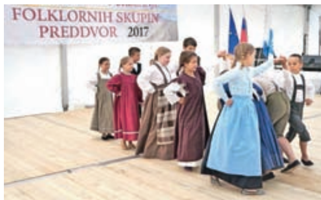
Za uvod v folklorno popoldne so poskrbeli najmlajši: Mlajša otroška skupina Folklornega društva Preddvor.

Letošnji Ex tempore v Preddvoru je udeležencem pustil prosto izbiro ustvarjalne tematike.