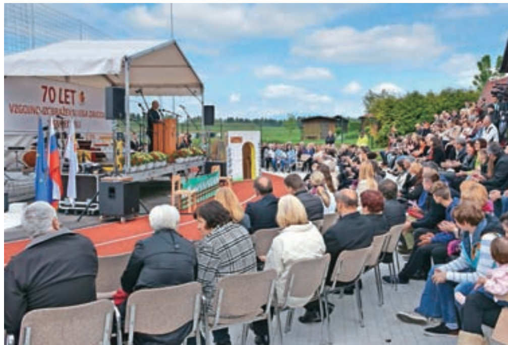
Vzgojno izobraževalni zavod Frana Milčinskega Smlednik je pred kratkim obeležil sedemdesetletnico (na sliki). Bo v prihodnje še samostojen ali ga bodo pripojili Vzgojnemu zavodu Kranj?