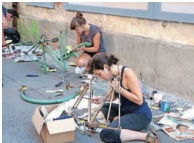
Biciklarna je združila ljubitelje koles in z nekaj domišljije so stara kolesa dobivala novo podobo.