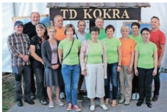
Predstavilo se je tudi Turistično društvo Kokra.

V nadaljevanju dne pa so za vse, ki so jih ob obisku nedeljskega dogajanja v centru Preddvora srbele pete, poskrbeli fantje iz ansambla Pristrčni fantje.