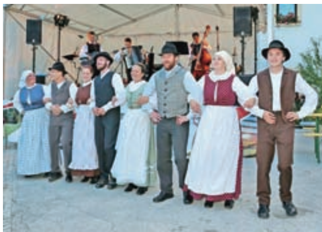
V kulturnem programu tradicionalnega dogajanja so nastopili domači folklorniki Folklorne skupine Dovje - Mojstrana.