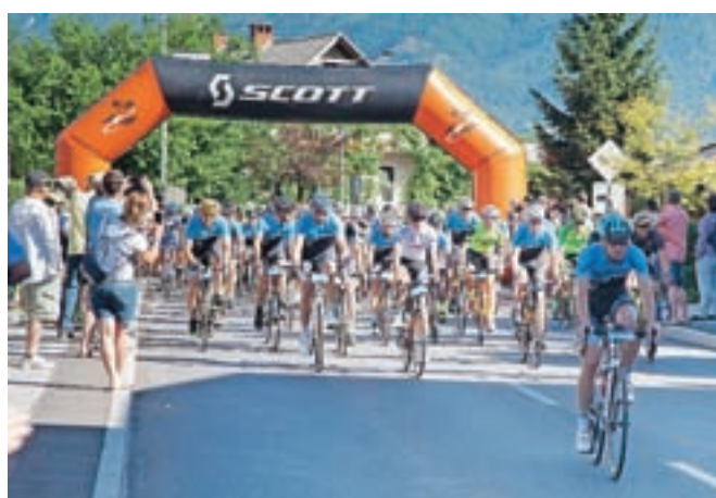
Na kolesarsko preizkušnjo, ki vodi čez tri prelaze, se je podalo petsto devetdeset kolesarjev.

Ene najlepših, a hkrati tudi najtežjih kolesarskih preizkušenj pri nas se je tokrat udeležilo 590 kolesarjev.