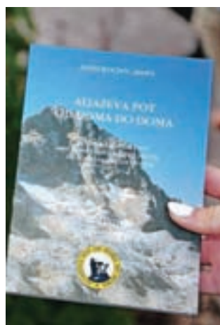
Vodnik in dnevnik po poti

domovine nasploh in še posebno gora, ki jih je Aljaž tako ljubil in jih ohranil slovenske tudi za nas.«