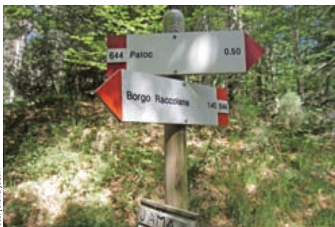
Gozdno sedelce, kjer zavijemo levo na neoznačeno pot.

Z vrha se vrnemo nazaj do gozdnega sedla, kjer nadaljujemo levo proti vasi Patoc, na drugi strani gore, proti skriti gorski vasi, ki je z avtomobilom dosegljiva iz Reklanske doline. Asfaltno cesto dosežemo na zadnjem ovinku pred vasjo in se po cesti sprehodimo do vasi. Hodimo mimo parkirišča po poti št.