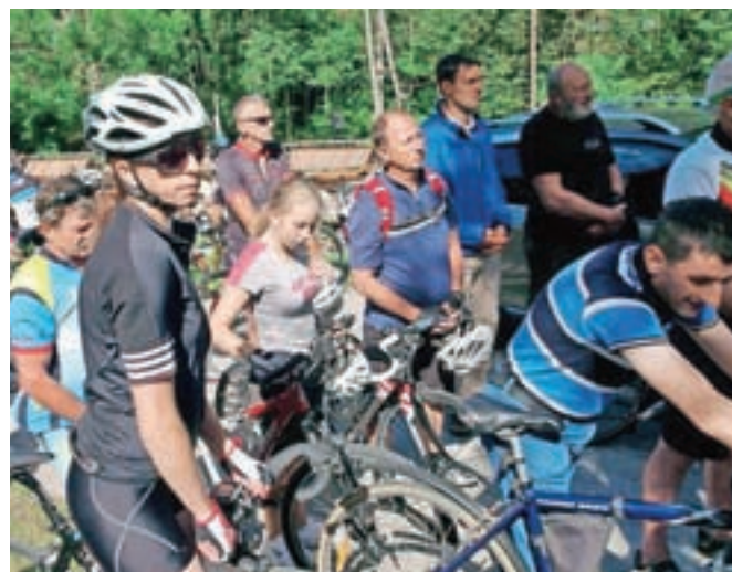
Blagoslov koles v Kokri