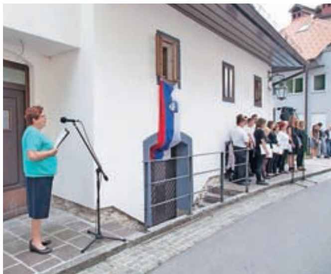
Ob odkritju spominske plošče so pripravili tudi kratko slovesnost.