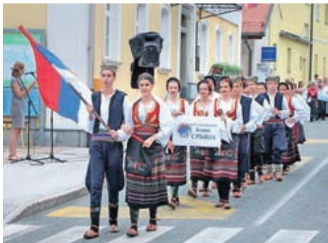
Mednarodno srečanje folklornih skupin je bilo v Preddvoru že enajstič. Na fotografiji med povorko: plesna sekcija KUD Stojan Novaković Blace iz Srbije.

Letošnji Ex tempore v Preddvoru je udeležencem pustil prosto izbiro ustvarjalne tematike.