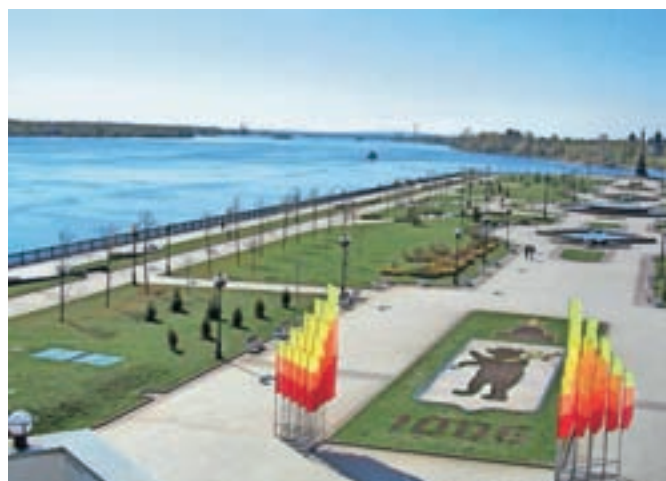
Reka Volga pri Jaroslavu