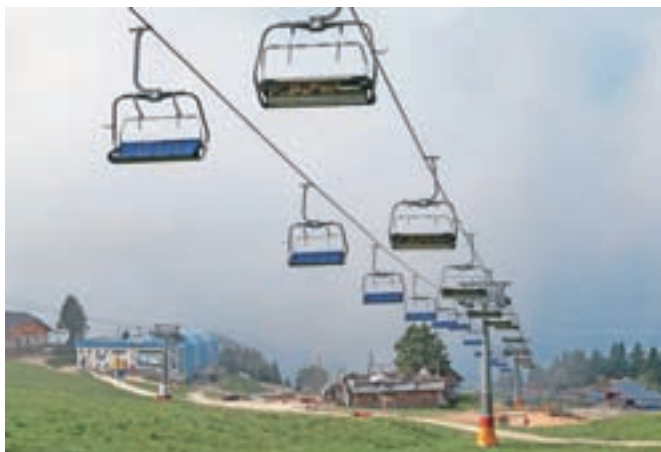
Odločitev o prodaji podjetja RTC Krvavec naj bi bila kmalu znana.

Edini potrjeni interesent je bil konzorcij cerkljanskih