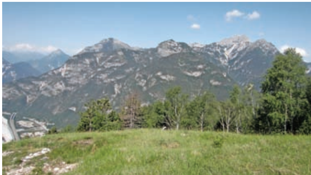
Razgled proti osrčju Karnijskih Alp; Amariana in Zuc dal Bor.