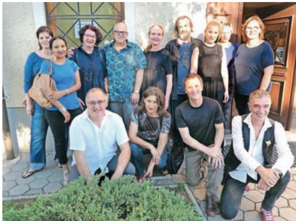
Skupinska slika udeležencev letošnjega simpozija pred Muzejem občine Šenčur, kjer bodo dela ustvarjena v prihodnjih dneh predstavili na razstavi 3. oktobra.

Štirinajstdnevno druženje vrhunskih mojstrov umetniške keramike je bilo že prvi dan simpozija v polnem zamahu. »Naši letošnji gostje so se izkazali za odlično ekipo, saj so že takoj začeli izmenjevati izkušnje pri delu z glino in z neverjetno odprtostjo bili pripravljeni povedati tudi nekatere lastne ustvarjalne postopke,« je povedala Zupan Štembergerjeva in povabila vse, ki vas zanima karkoli v zvezi s keramiko, da se v prihodnjih dneh oglasite v njihovem ateljeju v Vogljah,