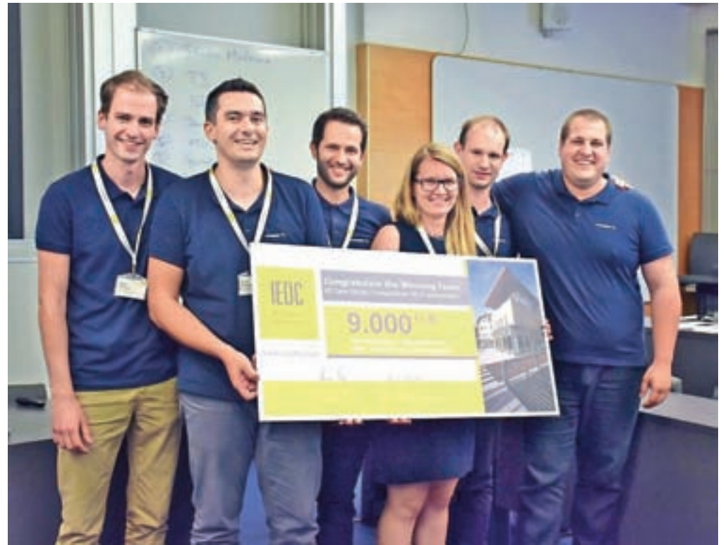
Zmagovalna ekipa iz podjetja Iskraemeco