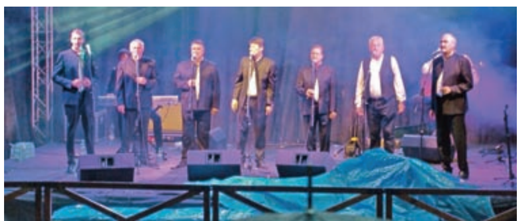
Kljub dežju je več kot tisoč obiskovalcev s klapami vztrajalo do konca.

občinstvu, je povedal, da še nikoli ni bil na koncertu s toliko pozitivne energije, ki je premagala temne dežne oblake, ter dodal, da škofjeloškemu občinstvu ni enakega in da je bil nad njim popolnoma navdušen. Izkazalo se je, da je tudi drugi dalmatinski večer s klapami izredno uspel, tako da organizatorji verjamejo tudi v nadaljnja tovrstna druženja, ki jih povezuje večni dalmatinski melos.