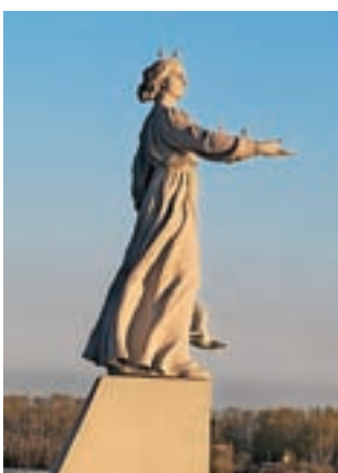
Spomenik Volgi, materi ruskih rek, pri Rybinsku

ko v krajih ob njej, od velenost do vasi, namenjajo svoji reki še posebno pozornost. In ne brez razloga. Volga, ki izvira 226 metrov visoko v Valdajskem hribovju v Tverski oblasti, je s 3690 kilometri dolžine najdaljša ruska in evropska reka. Tudi evropska, saj večina njenega toka poteka po evropskem delu