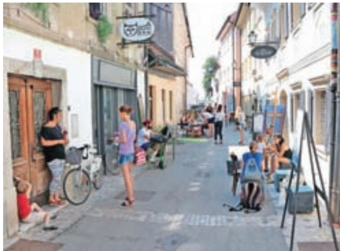
Sobotna Živa ulica