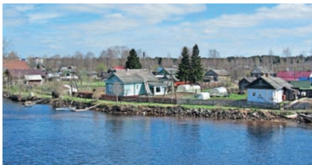
Ena od številnih ruskih vasi ob reki

Porečje Volge je srce Rusije. Na njem živi 42 odstotkov prebivalcev Ruske federacije, porečje pa obsega dve petini površine te največje