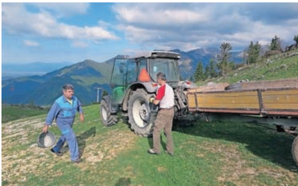
Kmetje so v okviru tlake minulo soboto s pašnikov pobirali kamenje.

»Tlaka je obvezni del za tiste, ki so lastniki pašnih pravic, in vsak pašni upravičenec mora glede na svoj delež opraviti določeno število 'šihov', pri čemer en 'ših' obsega šest ur strnjene dela. In danes bomo znova opravili en tak 'ših'. Največ se nas na tlaki zbere tudi po 14.00, a mnogi so se danes zadržali v dolini zaradi