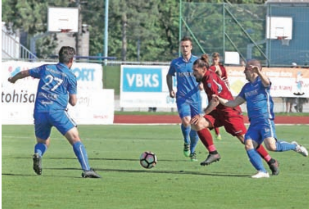
Nogometaši Triglava so tudi na zadnji prvenstveni tekmi sezone zanesljivo slavili, saj so s 5 : 1 premagali Roltek Dob.

»Fantom sem zaupal vso sezono in skupaj smo prišli do zelenega cilja. Res smo imeli malce bolj črn april, saj so nas pestile poškodbe, vendar so fantje vzdržali in ob koncu sezone so za nami rekordne številke in podatki. Imeli smo najboljšo