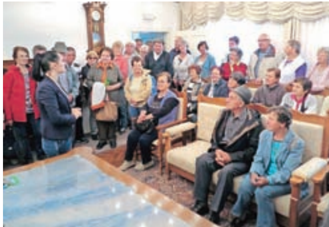
V Ipavčevi hiši je Občina Šentjur uredila protokolarno sobo, ki služi tudi za poročanje parov.