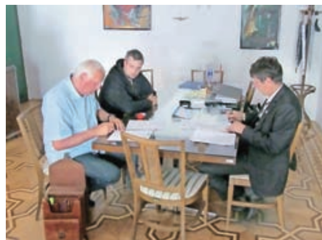
Podpis pogodbe z izbranim izvajalcem del

varen in kvaliteten pod,« je povedal Sajovic. Gre za položitev približno 1200 kvadratnih metrov novega javorjevega parketa, skladnega s certifikati organizacije FIBA. Dela, vredna nekaj manj kot 150 tisoč evrov z vključenim DDV-jem, bo izbrano podjetje opravljalo v letošnjem poletju in zaključilo v prvem tednu septembra. Ob tem bodo posodobili še nekaj opreme in opravili vzdrževalna dela na tribunah. Nadzor nad deli bo opravljal kranjski Domplan.