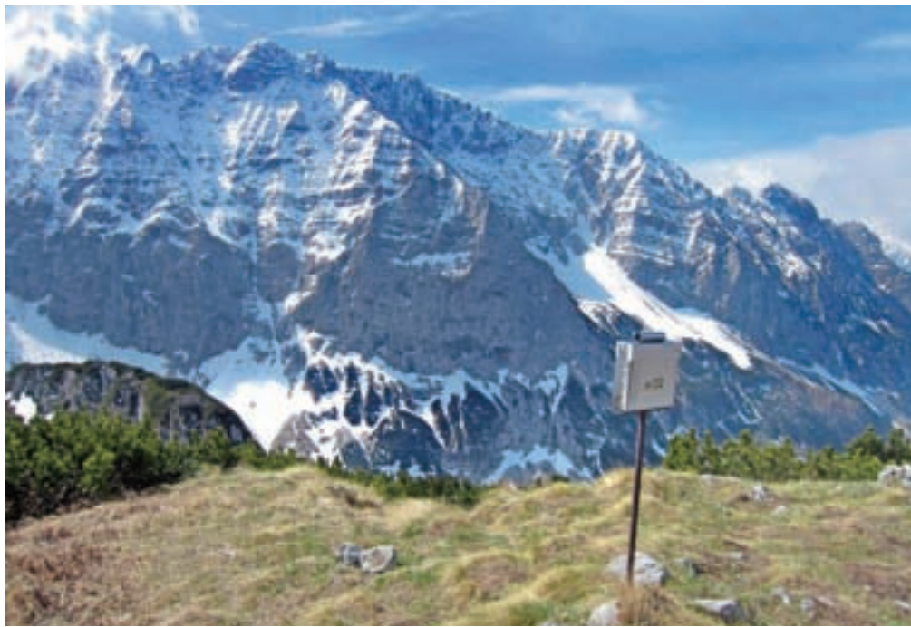
Čisti vrh pogleduje proti severnemu ostenju lepega špičja.

S sedla zavijemo levo in v desetih minutah dosežemo vrh Čistega vrha, ki s svojimi 1875 m navduši z razgledom. Gore nad Sočo pa Prisojnik, Goličica, Germlajt, Kanceljni, Planja, Razor, Kanjavec, kočna na Prehodavcih, Zadnjiški Ozebnik, greben Velikega špičja, pa sosednji Mala in Velika Tičarica ... Ni, da ni! Navdušujoče, v miru in tišini.