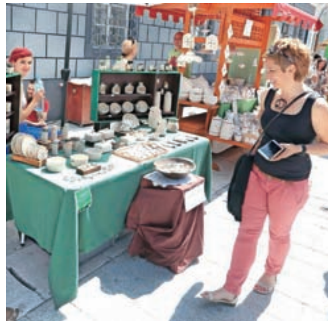
Sončna sobota je v staro mestno jedro Radovljice privabila številne obiskovalce, ki so si z zanimanjem ogledovali razstavljen keramiko in zelišča ter sodelovali na delavnica za otroke in odrasle.

predstavilo dvajset keramikov in šest zeliščarjev; udeležba slednjih je bila letošnja novost, s katero je organizator Turizem Radovljica festival vsebinsko razširil še