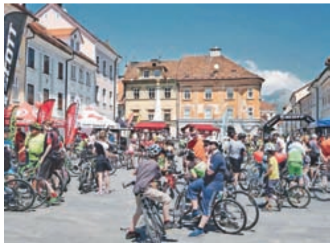
Kolesarji so v nedeljo »okupirali« mestno središče.

skupni imenovalec. Najprej so se po mestnih ulicah vozili najmlajši kolesarji, potem so družine kolesarile od središča mesta skozi Primskovo, Britof, Predoslje, Brdo, Kokrico in nazaj, za njimi pa so se na 47-kilometrski maraton pognali še vsi drugi kolesarji. S to prireditvijo je Kolesarski klub Kranj znova približal kolesarstvo vsem ljubiteljem tega športa in rekreacije. Kranj je kolesarsko mesto in tako mora tudi ostati. Vse kaže, da naše mesto postaja zgled tudi drugim