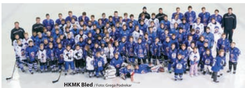
HKMK Bled

V maju smo imeli v Hokejskem klubu mlade kategorije Bled redno letno skupščino. Seznanili smo se z rezultati pretekle tekmovalne sezone in rezultati koledarskega leta. Podatki so spodbudni