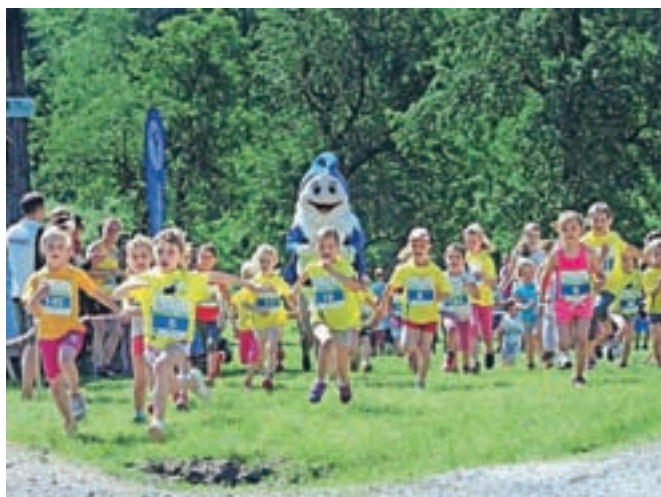
Okrog Tavčarjevega dvorca na Visokem je v različnih kategorijah teklo več kot sto osemdeset otrok.

Visoški tek je drugo leto štel za tekaško serijo Gorenjska, moj planet. Bil je četrti tek v letošnji sezoni. Do konca bodo še štirje, naslednji 23. junija v Radovljici z Radol'sko 10ko.