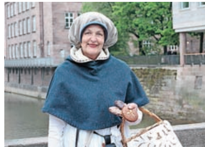
Prodajalka nürnberških medenjakov iz preteklih časov