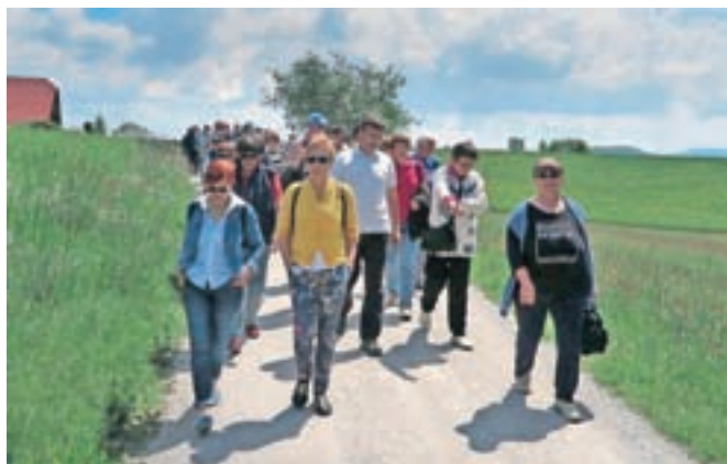
Sprehod po Kalobju, kjer so doma Kalanovi