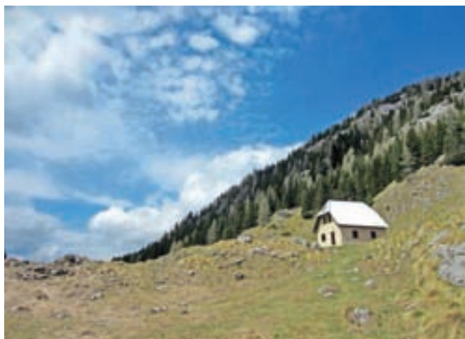
Planina V Plazeh

Z vrha sestopimo po poti vzpona in bodimo pozorni na ključnih mestih, da ne zgrešimo steze. Predlagam, da se pri sestopu ustavimo na planini V Plazeh ob koči Triglavskega narodnega