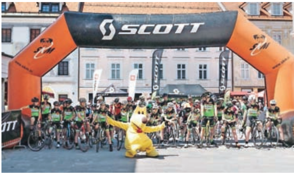
Tik pred startom tretjega Scottovega maratona

Z dirko najmlajših kolesarjev na Trsteniku so se začeli kolesarski dogodki, ki bodo na slavnosten način zaznamovali 60-letnico Kolesarskega kluba Kranj. Eden od vrhuncev prireditve, ki se bodo odvijale vse do jeseni, pa je bil prav gotovo nedeljski Scottov kolesarski dan. Vse od jutra do poznega popoldneva so se v središču starega dela mesta vrstile prireditve, ki jim je bilo kolo