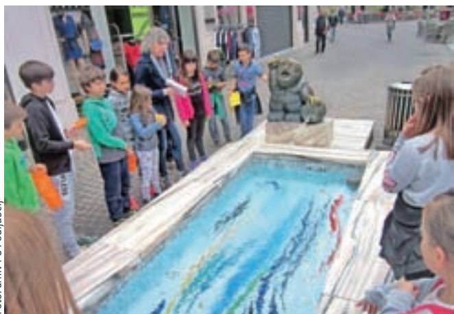
Ena od skupin pri možicu iz Vrbskega jezera

RUBRIKO MULARIJA ureja Mateja Rant. Pišite ji na mateja.rant@g-glas.si.