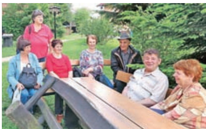
Gostje v sproščenem pogovoru