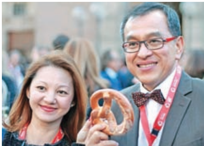
Kaj bi brez prest ...