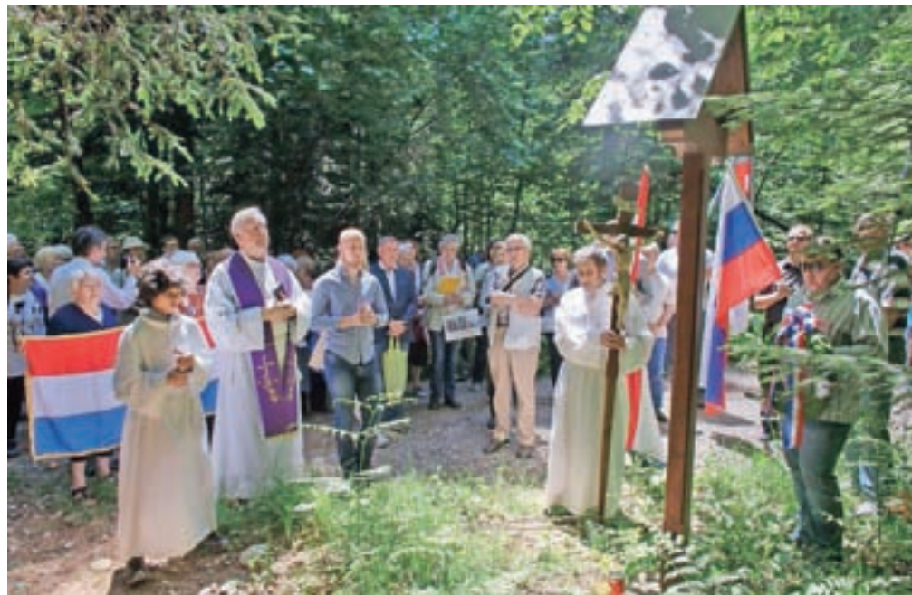
Molitev pri križih v Crngrobu, kjer so grobišča hrvaških žrtev. / Foto: Matic Zorman

Žrtvam poveljnih pobojev sta Hrvaško društvo Ljubljana in Komisija za določanje in evidentiranje prikritih grobišč v Škofji Loki leta 2001 postavila spominska obeležja, pet križev v gozdu pri Crngrobu. Del žrtev v teh grobiščih pripada skupini visokih funkcionarjev medvojne hrvaške vlade in vojske ter njihovim družinskim članom, ki so jih angleške vojaške okupacijske oblasti v Avstriji maja 1945 vrnilo jugoslovanskim oblastem. Z njimi naj bi bilo med 20. in 25. majem 1945 likvidirano še večje število hrvaških civilnih beguncev. Spominska slovesnost je namenjena tistim, ki so brez groba, pobitim