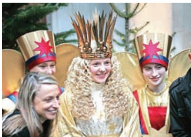
Božični angelčki, s katerimi si se lahko fotografiral