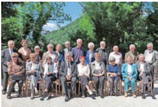
Nekdanji dijaki Gimnazije Kranj, ki so maturirali pred šestdesetimi leti.