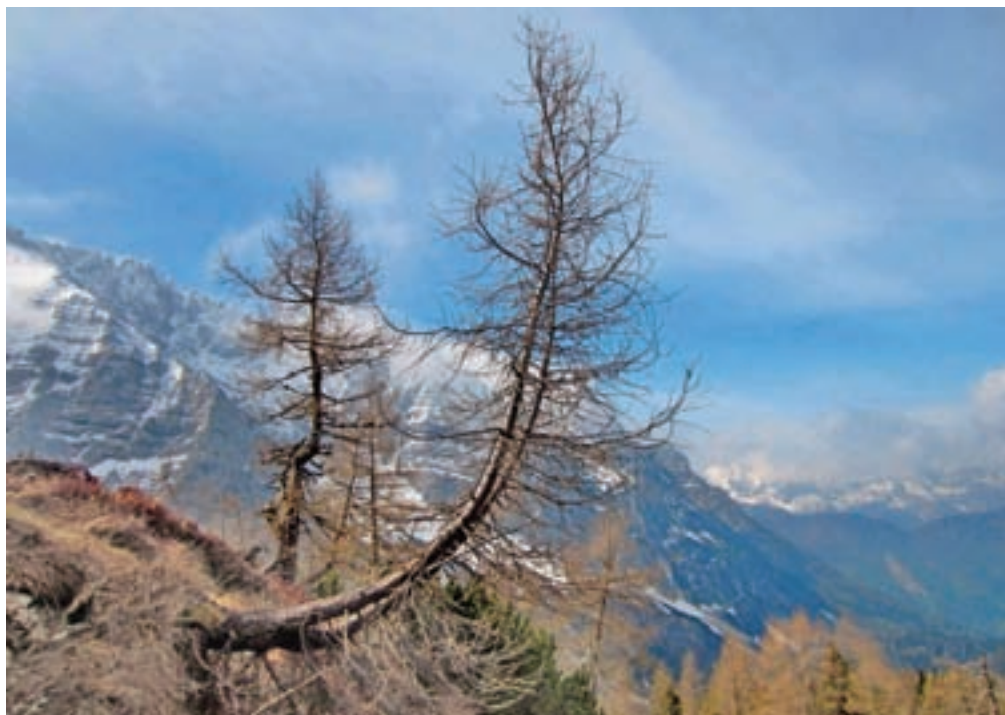
Detajl vzpona na sedlo Čez Drt