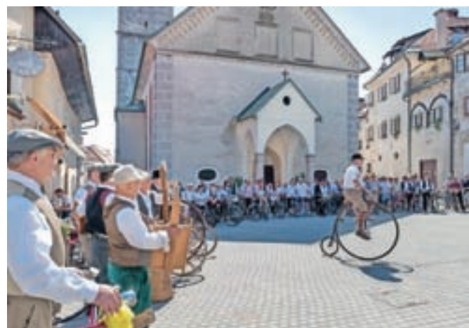
Zbor starodobnikov na Cankarjevem trgu v Škofji Loki