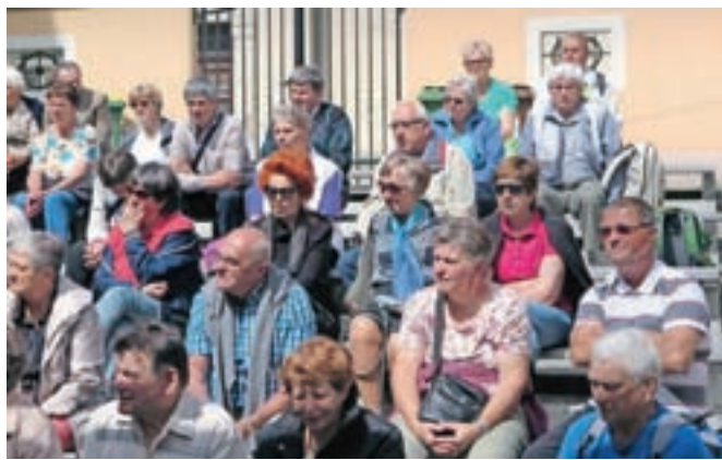
... naši gostje pa so pridno poslušali.