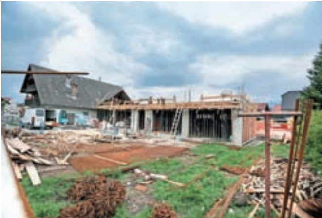
Ob Blagneči hiši nastaja medgeneracijski center.