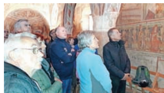
Občudovali smo bogato poslikano notranjost, predvsem znameniti Mrtvaški ples.

je seveda Mrtvaški ples, sprevod različnih ljudi iz takratne družbe, ki skupaj z okostnjaki korakajo proti smrti. Motiv naj bi izviral iz epidemij kuge in sporoča, da smrt ne izbira med bogatimi in revnimi,