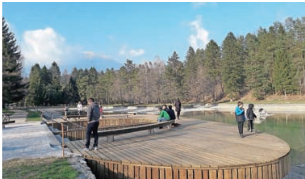
Kamp Šobec so obnavljali vso zimo. Med najbolj privlačnimi pridobitvami je prav gotovo nova lesena ploščad.

»V ozadju hrupa lopat in strojev je potekalo morda še