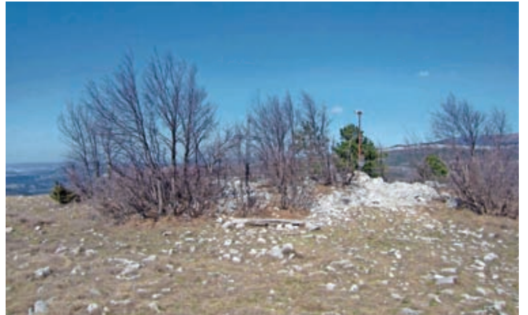
Vrh Kuka / Foto: Jelena Justin