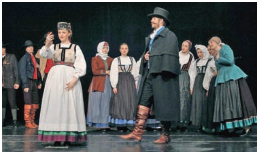
Na jubilejnim koncertu bo vodilna skupina AFS Ozara prikazala tudi nov gorenjski splet z naslovom Ta dovji mož.