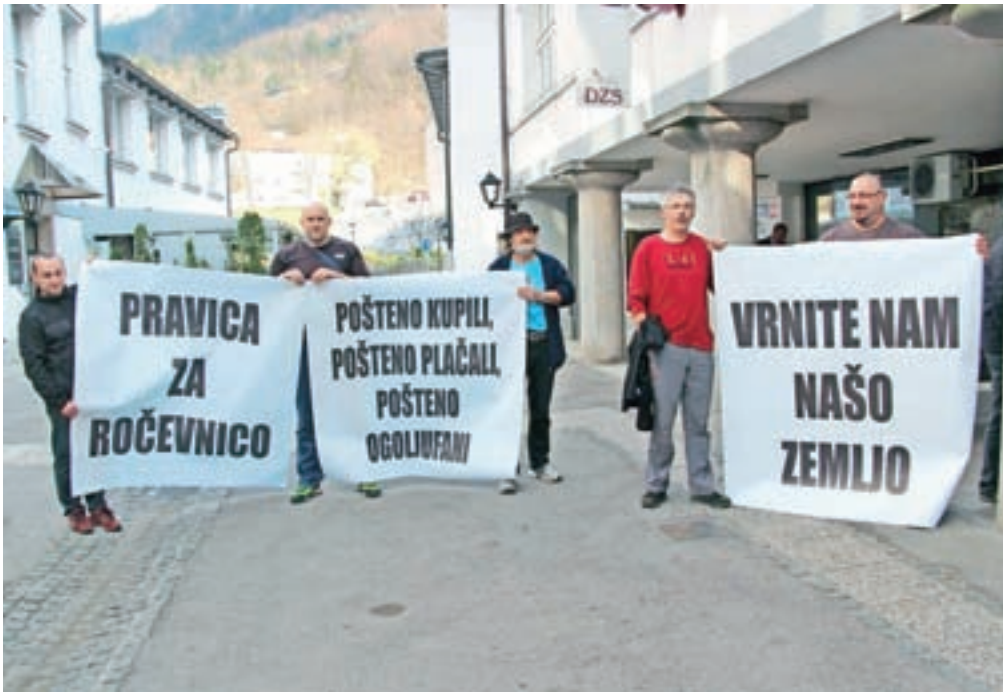
Prizadeti krajanji Ročevnice so na problem opozorili tudi s transparenti, ki so jih razgrnili pred začetkom izredne seje.