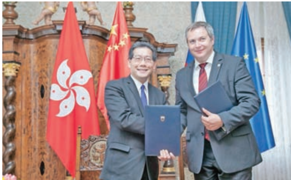
Sekretar Gregory So in minister Dejan Židan ob podpisu memoranduma

Po Židanovih besedah je do poglobitve odnosov med državama prišlo tudi na pobudo vinarjev, ki si želijo večje prisotnosti na kitajskem in azijskem trgu nasploh. Hongkong predstavlja vstopna vrata na kitajski trg, hkrati pa lahko tudi Hongkong izkoristi strateško lego Slovenije za vstop na skupni evropski trg.