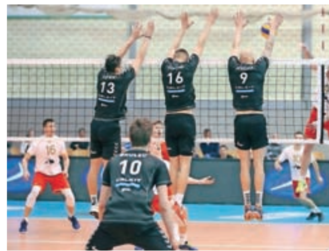
V Kamniku so favorizirani domači odbojkarji (v temnejših dresih) morali priznati premoč Kranjčanom.

Pred dvema tednoma sta se kamniška in kranjska ekipa pomerili že v polfinalu pokala Slovenije. V Kranju so se zmage veselili odbojkarji Calcita Volleyballa, ki so nato v finalu premagali še ACH Volley.