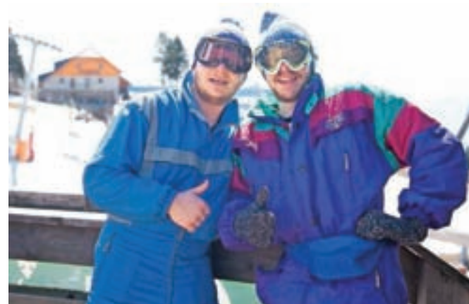
Smučarska oprava iz 80. let je bila v soboto znova aktualna.