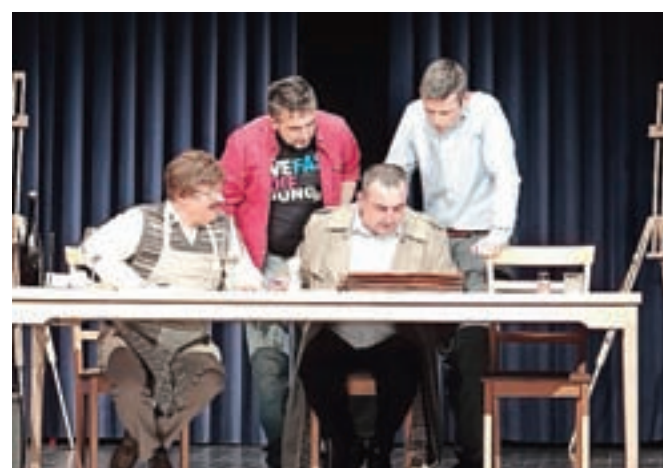
Komedija Butelj za večerjo bo tokrat dobrodelna.