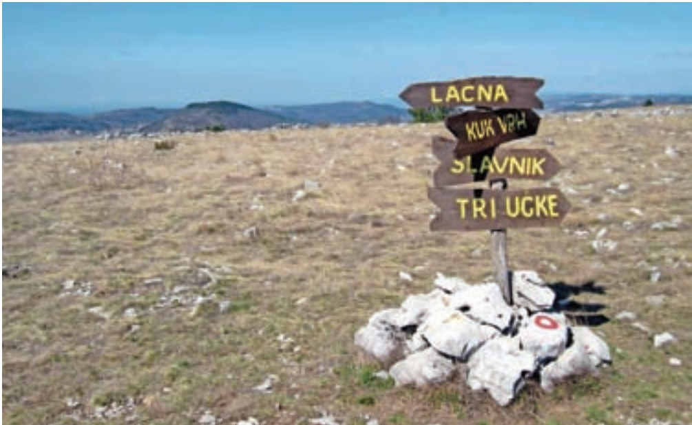
Smerokaz na vrhu Kuka. Zadaj se vidi Lačna.

Nadmorska višina: 507 m Višinska razlika: skupna 350 m Trajanje: 4 ure Zahtevnost: ★★★★★