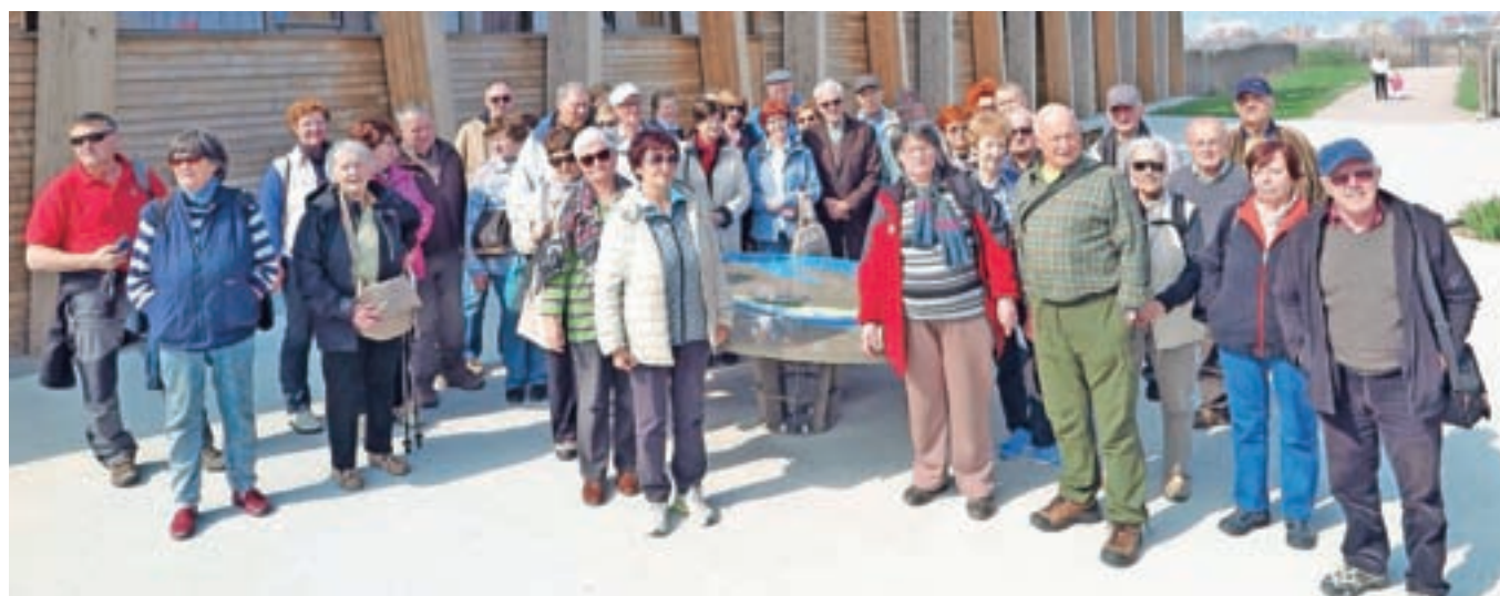
V petek, 17. marca, se je na pot proti Primorski odpravila še druga skupina izletnikov.

Proti večeru smo se odpravili proti Gorenjski, o vtisih preteklega dne pa smo ob šalah, smehu in klepetu razpravljali še vso pot domov.