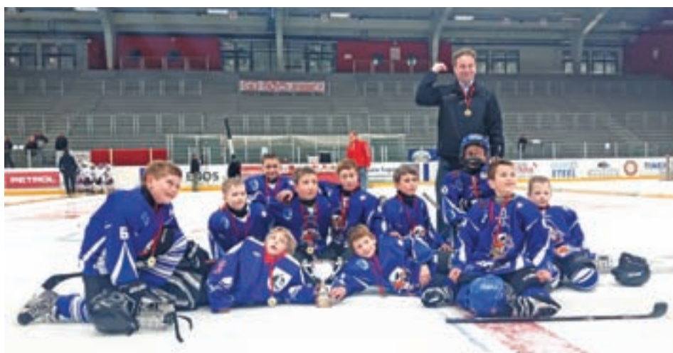
Ekipe U8 je osvojila prvo mesto na mednarodnem turnirju na Jesenicah.

Od petka do nedelje je na Bledu potekal že 24. mednarodni turnir Bled 2017. Na njem je nastopalo 12 ekip v kategorijah U12 in U14 iz Slovenije, Hrvaške, Madžarske in Avstrije. Tekme so bile zanimive in kvalitetne, blejski labodi pa so se izkazali s tretjim mestom v kategoriji U12 in drugim mestom v kategoriji U14. Svoje hokejske spretnosti so na mednarodnem hokejskem turnirju na Jesenicah pokazali tudi naši najmlajši v kategorijah U10, U9 ter U8. Na turnirju so nastopale ekipe iz Hrvaške, Avstrije, Italije in Slovenije. Čestitke vsem našim ekipam za prikazano igro, še zlasti pa ekipi U8, ki na turnirju ni izgubila nobene od enajstih odigranih tekem in je osvojila prvo mesto!