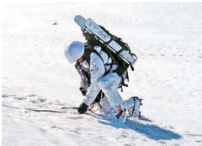
Na zložljivih turnih smučeh

razmerah in dobiti smuči, ki ne bodo moteče pri transportu: »Rešitev je bila nošnja v zloženem stanju, smuči so morale omogočiti hojo