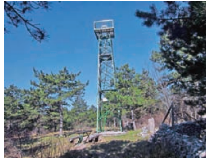
Vrh Lačne z razglednim stolpom

sledimo kolovozu, lahko pa gremo malce po svoje in hodimo bolj po robu, z razgledom na Komare doline. Ko sledimo kolovozu, dosežemo neizrazit, a razgleden Vrh križa. Kolovoz preide v pas borovega gozdička. Z nekaj sreče opazimo na jasi manjšega možica, ki označuje nemarkirano pot na bližnji Krog. Vmes opazimo tudi zanimive table, na katerih je narisana goba. Table označujejo eno od učnih poti, ki so jih pripravili v Gobarsko-mikološkem društvu Slovenske Istre. S kroga nadaljujemo naprej proti Kuku, ki ga že vidimo v daljavi, in slej ko prej spet dosežemo kolovoz. Gozd preidev vse bolj odprt teren, na gola