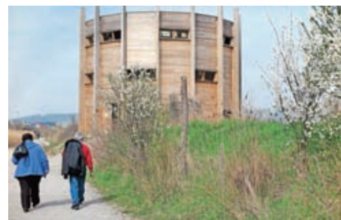
Krožna pot okoli naravnega rezervata Škocjanski zatok je dolga dobra dva kilometra, ravno prav za sproščen spomladanski sprehod.

Polni energije smo se odpravili šev Hrastovlje, slikovito vas pod Kraškim robom. Najprej na kosilo, nato pa peš do visokega obzidja, za katerim stoji znamenita cerkev sv. Trojice. Cerkev je majhna, a se v notranjosti postavlja z največjimi in najbolj ohranjenimi stenskim poslikavami pri nas. Najznamenitejši del