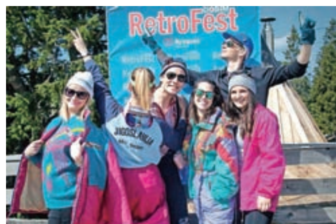
Med smučarskimi nostalgiki je tudi veliko mladih.