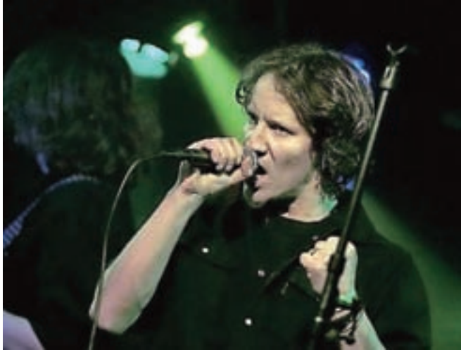
Na peti bitki glasbenih skupin v medvoškem Jedru so slavili Edge of Sins.