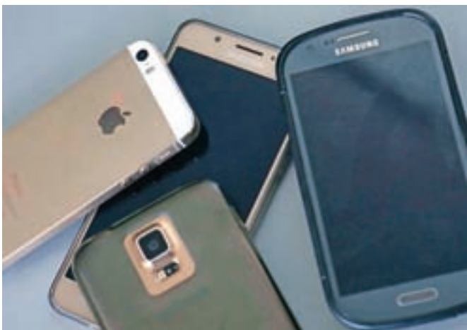
V Sloveniji je v uporabi več mobilnih telefonov, kot je prebivalcev.