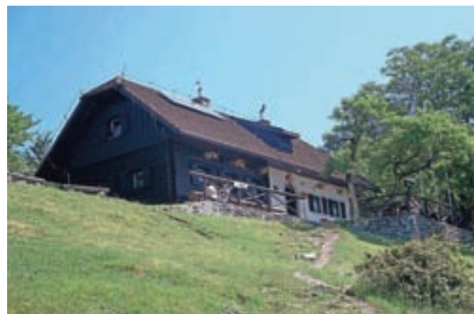
Kočja na Sv. Jakobu