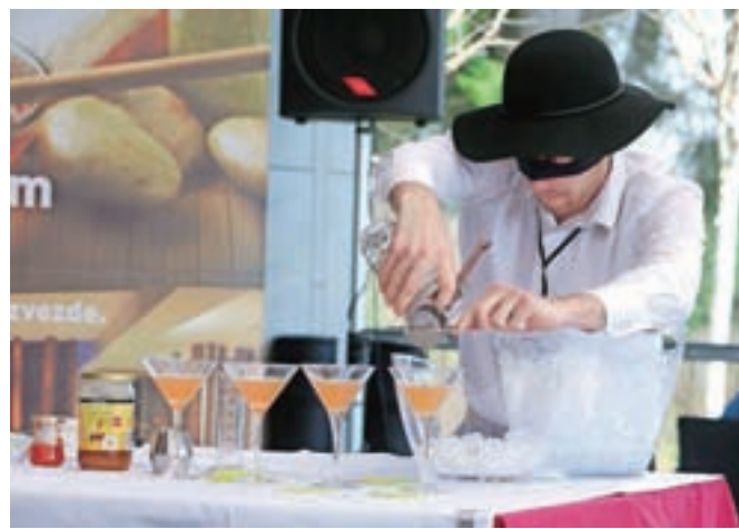
Tudi Don Juan DeMarco je dobil svoj koktajl.