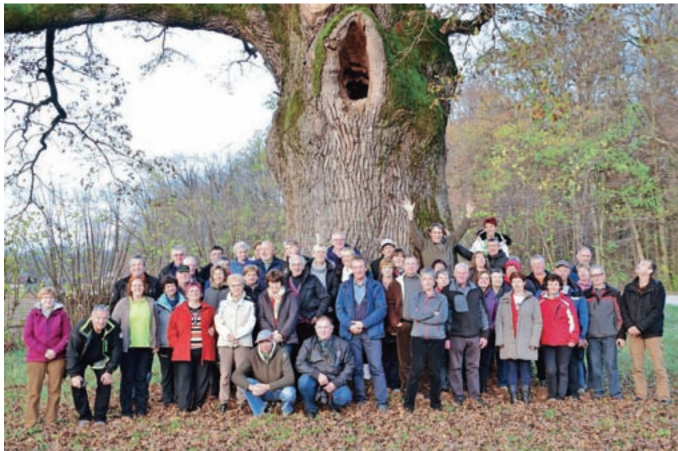
Na jesenski ekskurziji na Dolenjsko so se gorenjski ekološki kmetje na poti na obronke Krakovskega pragozda ustavili tudi pri drugem največjem hrastu dobu v Sloveniji.

Med 251 ekološkimi kmetijami na Gorenjskem je večina še vedno samooskrbnih, s tržno pridelavo ekološke hrane se ukvarja zgolj deset do petnajst odstotkov ekoloških kmetij. V nastajanju je nova zveza ekoloških kmetov Slovenije.