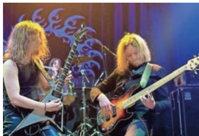
Dolge zimske večere so popestrili tudi medvoški Metalsteel, ki pripravljajo nov album.

Na odru dvorane Danica je nastopilo kar petindvajset zasedb iz dvanajstih držav, med njimi že uveljavljena imena metalne scene, kot so zasedbe Destruction, Belphegor, Rotting Christ, Taake,