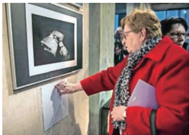
Nekatere izmed fotografij je moč videti tudi s pomočjo tehničnega opisa motiva v braillovi pisavi.