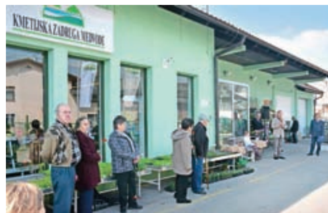
V Vodichah so 25. marca odprli prenovljeno in za tretjino večjo prodajalno.

Za Kmetijsko zadrugo Medvode bo leto 2017 začetek novega investicijskega ciklusa širitve maloprodaje. »Zaključili smo širitev in obnovo prodajalne v Vodichah, ki je za tretjino večja,