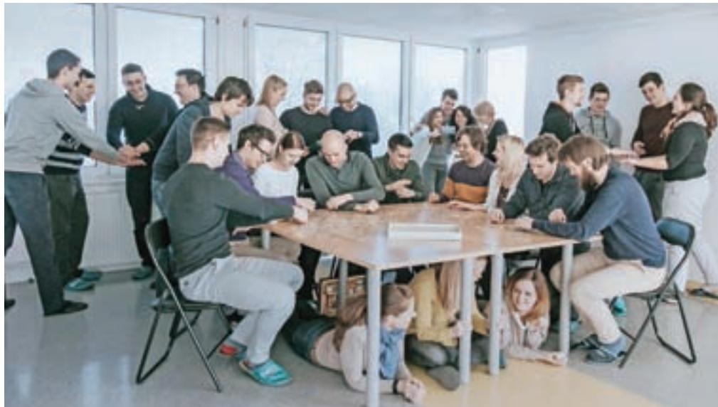
Mlada ekipa Optiweba: med seboj se odlično ujamejo in tudi tu se skriva del recepta za uspeh.

Lavtar sicer ne izhaja iz podjetniške družine, zato je do svojega posla prišel