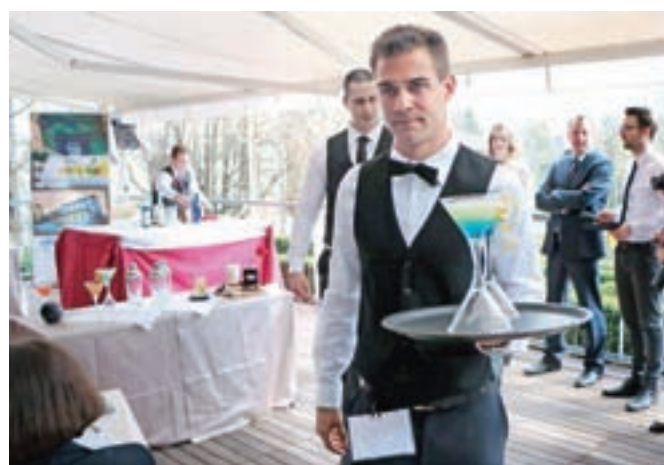
Tekmovalcem tako pri nastopih kot pri mešanju koktajlov ni manjkalo domišljije.