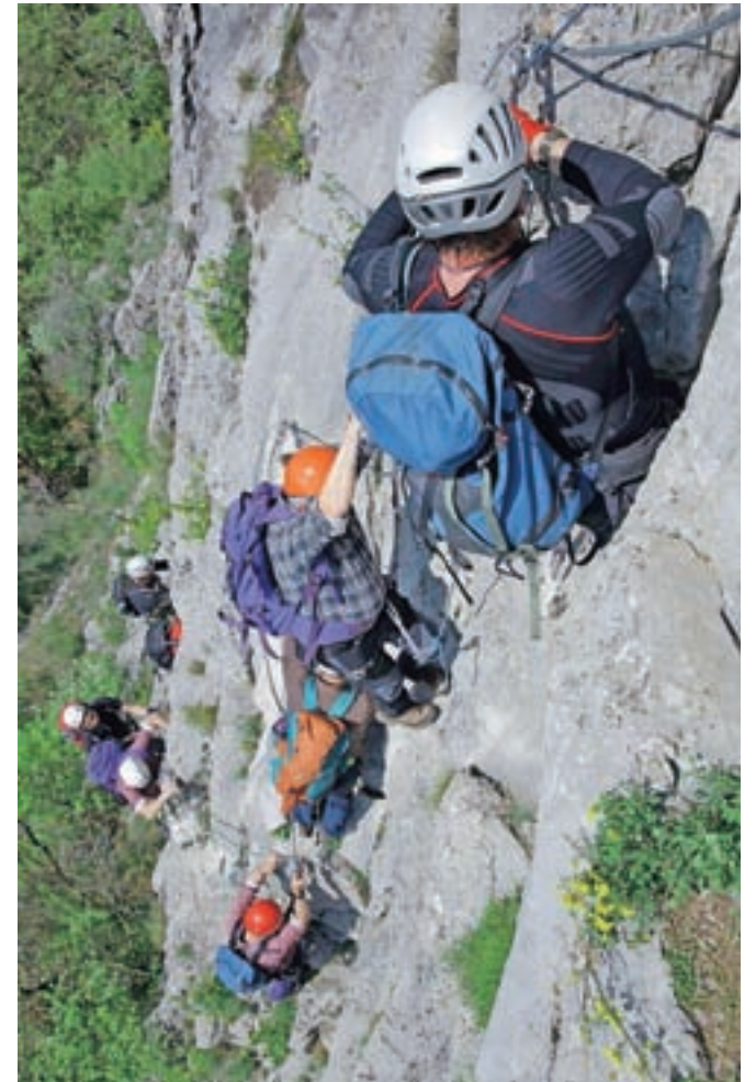
Zasluzni člani GRS Tržič v Glinščici

»Zelo si želimo ureditve prostorskega problema in velikokrat se zalotim v razmišljanju, ali zahtevamo preveč, ali je družba oziroma država dolžna zagotoviti ustrezne prostorske pogoje za normalno delovanja Društva GRS Tržič,«