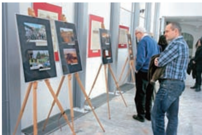
Že ob uradni podelitvi Unescovega certifikata so v preddverju Sokolskega doma razstavili fotografije dogajanj na zasedanju Unesca v Etiopiji.