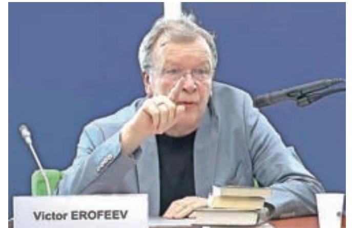
Pisatelj Viktor Jerofejev (1947): »Rusom se je v 20. stoletju dvakrat podrl svet.«