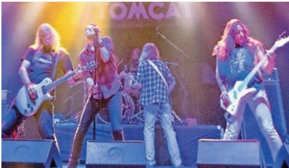
Večerno festivalsko dogajanje ob udarnih zasedbah – navdušila je tudi gorenjska skupina TomCat.

I dilačna zimska pokrajina v zavetju Triglav se je za teden dni prelevila v meko metalne glasbe. Za to so poskrbeli organizatorji v svetu že dobro poznanega festivala MetalDays, ki že leta poteka v Tolminu. Vstopnice so dosegle tako domače kakor tuje ljubitelje trših glasbenih ritmov: od Avstrije, Italije, Nemčije, Belgije pa do Estonije, Velike