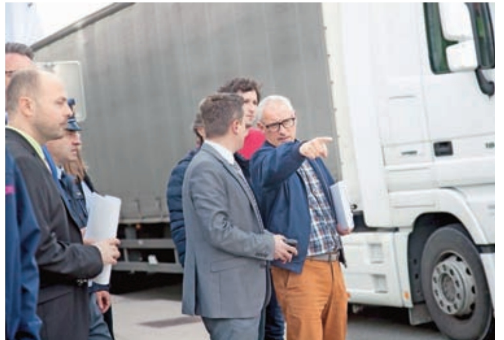
Sestanku je sledil ogled najbolj kritičnih točk ceste.