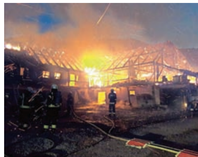
Ko sta prvi ekipi gasilcev iz domačega Podljubelja in Bistrice pri Trziču prispeli do žage, je bila ta že vsa v ognju.