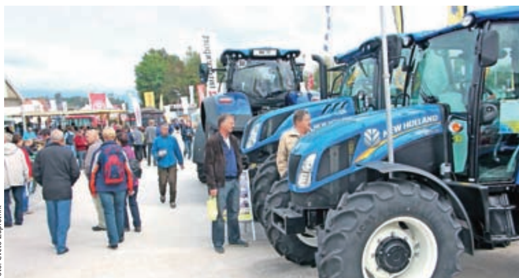
Na spomladanskem sejmju v Komendi se bo predstavilo več kot 650 razstavljalcev.

V petek bo sejem odprt med 10. in 18. uro, v soboto in nedeljo pa med 9. in 18. uro. Ogled sejma bo tudi tokrat brezplačen, enako velja za parkiranje. Obiskovalcem priporočajo, da v čim večji meri uporabljajo urejeno parkirišče v poslovni coni v Žejah, od koder bodo organizirali brezplačni avtobusni prevoz na sejem in nazaj.