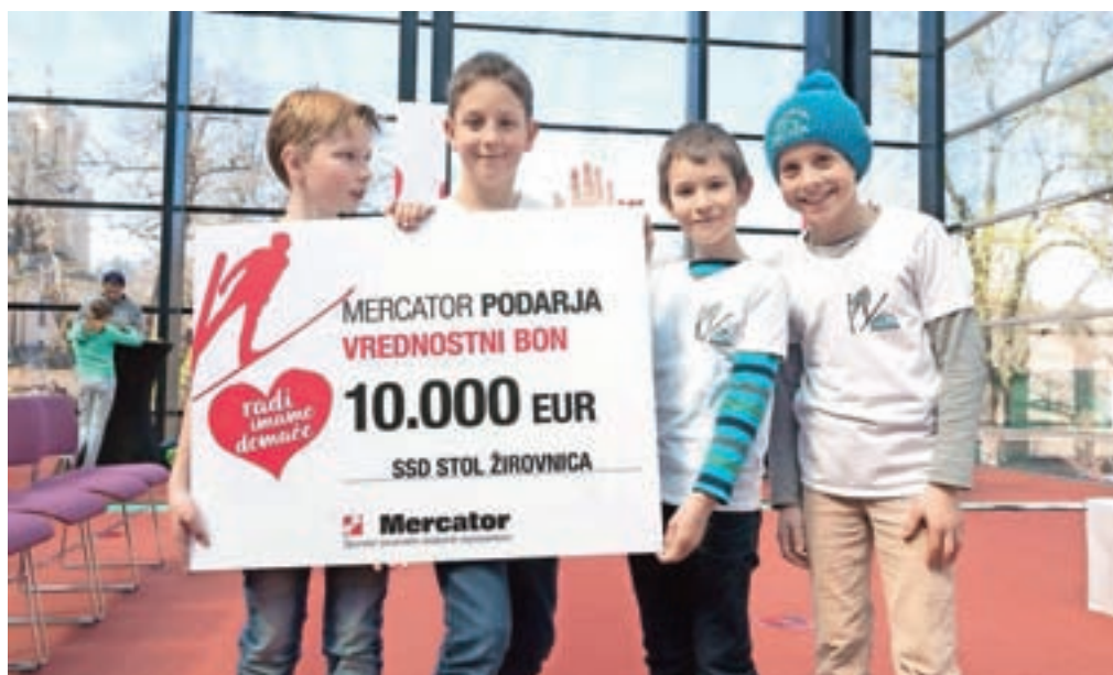
Donacije deset tisoč evrov so se razveselili mladi upi Smučarsko skakalnega kluba Stol Žirovnica.

Tretjega mesta so se razveselili v Smučarskem društvu Vizore, v katerem so prejeli pet tisoč evrov. Donacije so prejeli še Smučarsko društvo Zabrdje, in sicer tri tisoč evrov, Nordijski smučarski klub Tržič FMG je prejel dva tisoč evrov, Skakalni klub Predmeja - Otlica - Kovk pa tisoč evrov.