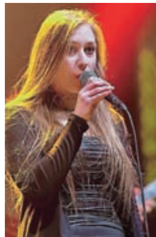
Melodični folk metal: kranjska zasedba Morana

Britanije ter celo Avstralije in ZDA. Festival, pravzaprav prave zimske metalne počitnice, je obiskovalcem poleg kakovostne glasbe ponudil tudi letnemu času primerne dnevne aktivnosti.