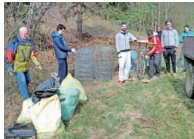
Čistili so okolico kulturnega doma, nogometnega igrišča in taborskega griča.