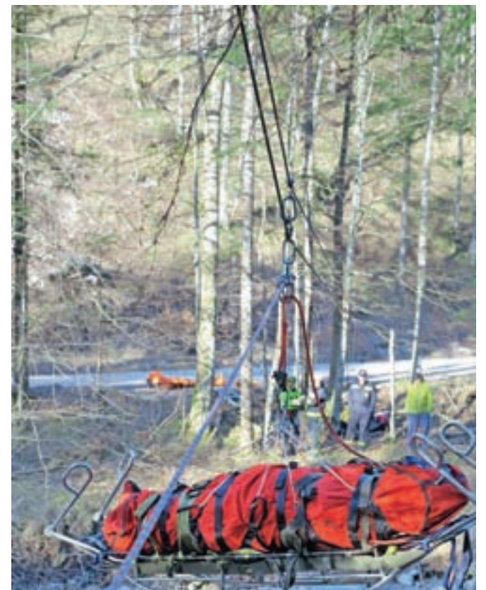
Žičnica danes ob uporabi statičnih vrvi

naglas razmišlja Blaž Belhar. Odgovor na to se razkrije v znani resnici, da če si rešil enega človeka, si rešil cel svet. Zbornik to resnico