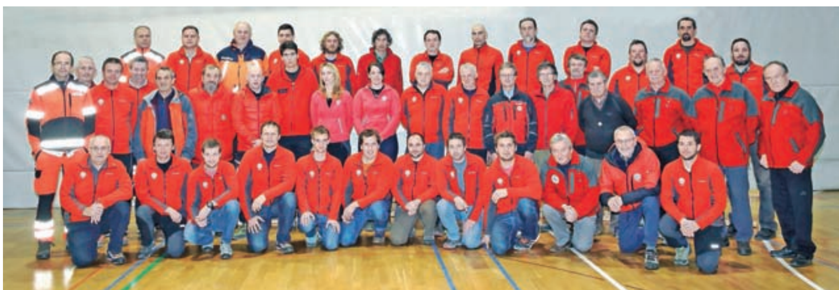
Večina članov GRS Tržič decembra 2016