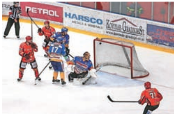
Kljub trem zadetkom v mreži Asiaga jeseniški hokejisti v torek niso razveselili navijačev.

Jesenice – Kljub temu da je večina od okoli dva tisoč osemsto navijačev na četrti polfinalni tekmi Alpske lige v Dvorani Podmežakla v torek zvečer pričakovala zmago domače ekipe SIJ Acroni Jesenice in uvrstitev v finale, so bili Jeseničani za gol slabši od gostov. Hokejisti Asiaga so namreč slavili s 3 : 4 in rezultat v zmagah izenačili na 2 : 2. Peta, odločila tekma je bila tako včeraj v Asiagu, do zaključka naše redakcije pa se še ni končala. Prva finalna tekma je na sporedu že jutri.