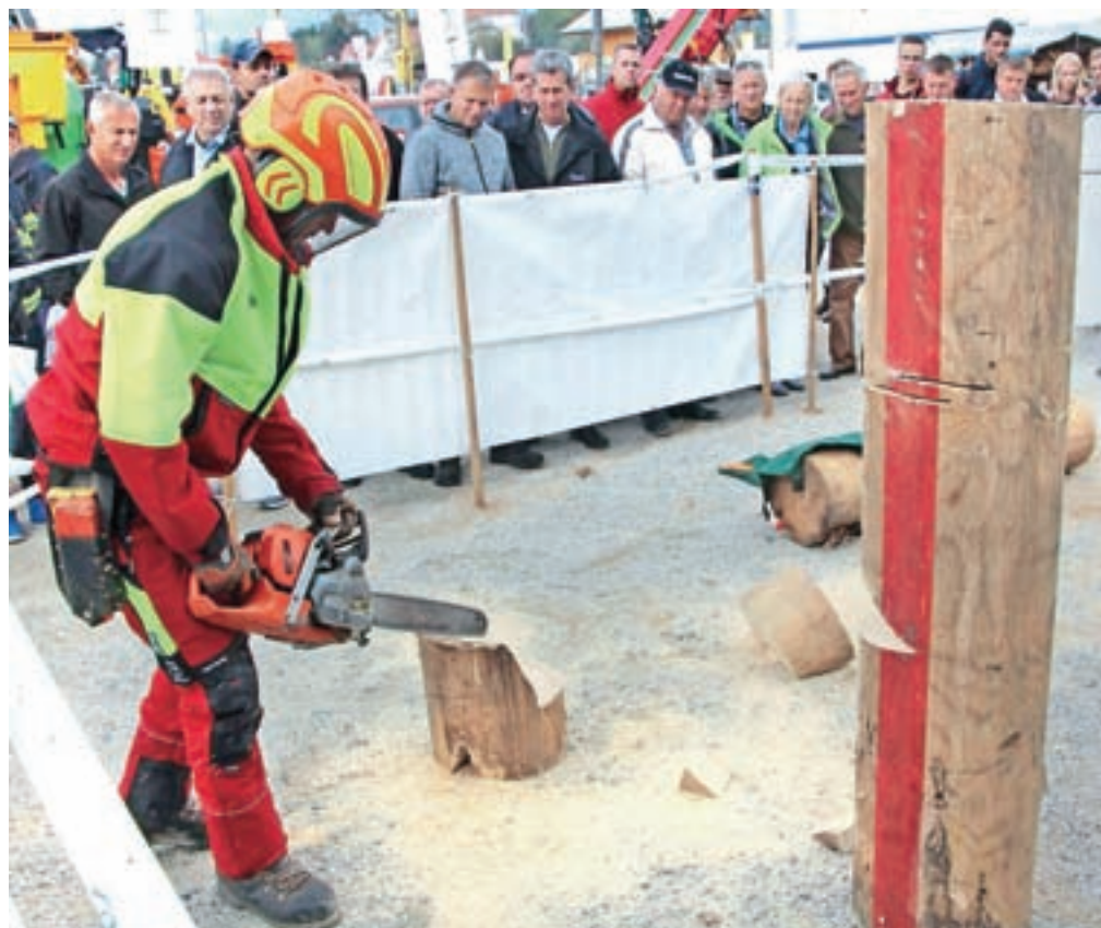
Zavod za gozdove Slovenije bo tudi letos prikazal varno delo z motorno žago.

Že pred uradnim odprtjem bo v petek ob 10. uri Kmetijsko gozdarski zavod Ljubljana pripravil strokovno predavanje o preureditvi hlevov v skladu s potrebami živali na kmetiji, ki bo v prostorih Konjenskega kluba Komenda – nad pisarno pri novih hlevih. Zavod za gozdove Slovenije bo vsak dan sejmja prikazal varno delo z motorno žago. Tudi tokrat si bo možno ogledati razstavo govede, ki jo pripravlja Govedorejsko poslovno združenje, in sicer v soboto med 9. in 14. uro ter v nedeljo med