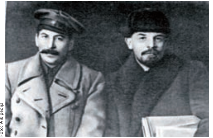
Putinove »moke sanje«: da bi obnovil in posodobil sovjetski imperij, ki sta ga pred sto leti zasnovala Stalin in Lenin.

Sredi marca je bila na Bledu madžarska velemojstrica Judit Polgar, 25 let najboljša šahistka na svetu. Prava oseba za razlago sprememb v sodobnem šahu. »Če želim pretiravati, bi rekla, da je danes šah popolnoma drugačen šport, kot je bil pred 15 leti. Ko sem začela igrati šah, sem imela šahovnico, nasproti mene je sedel trener ali partner, pomembne sklepe smo si zapisali na papir. Na tekmovanja smo hodili z od 20 do 30 kilogrami takih zapiskov. Danes pa sediš za mizo ali na vrtu, pred seboj imaš računalnik, na katerem je šahovski program, v ozadju si povezan na druge računalnike, ker potrebuješ dovolj močno orodje za analizo. Hkrati si s Skypom ali kako drugače povezan s partnerjem ... Vse skupaj je popolnoma drugače ...«