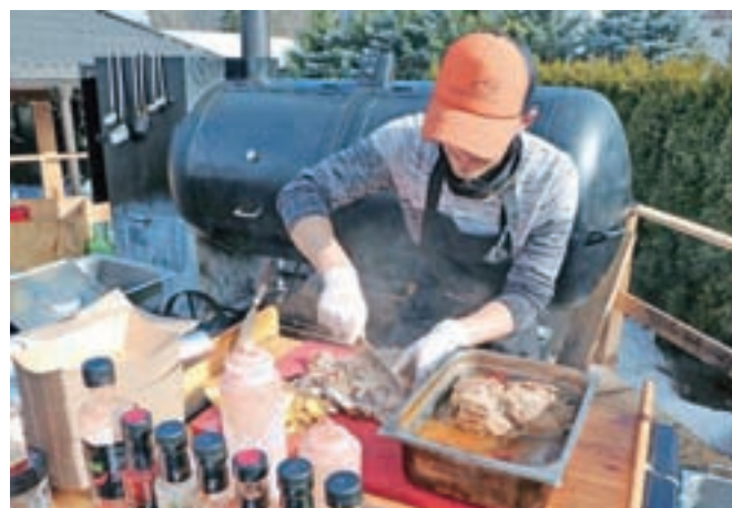
Fant obvlada žar in meso.