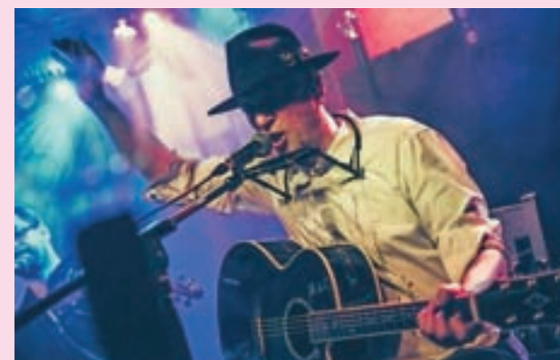
Mož s črno kitaro v KluBaru

Kranj – Sobotni večer je bil v KluBaru ponovno razprodan, saj je v goste prišel legendarni kantavtor Vlado Kreslin, ki je občinstvu postregel s svojim zimzelenim repertoarjem z – kot vedno na koncertih prekmurskega trubadurja – izrazito osebno noto. Intimno glasbeno vzdušje pa obljublja tudi primorski kantavtor Rudi Bučar, ki bo v KluBaru nastopil v soboto, 1. aprila, ob 21. uri. Lani je Bučar napolnil Gallusovo dvorano Cankarjevega doma kakor tudi druga koncertna prizorišča, vedno pa se rad vrača tudi v Kranj. V KluBaru bodo v aprilu nastopili tudi Janez Bončina - Benč, Torul, Hamo in Tribute 2 Love ter Rock Partyzani.