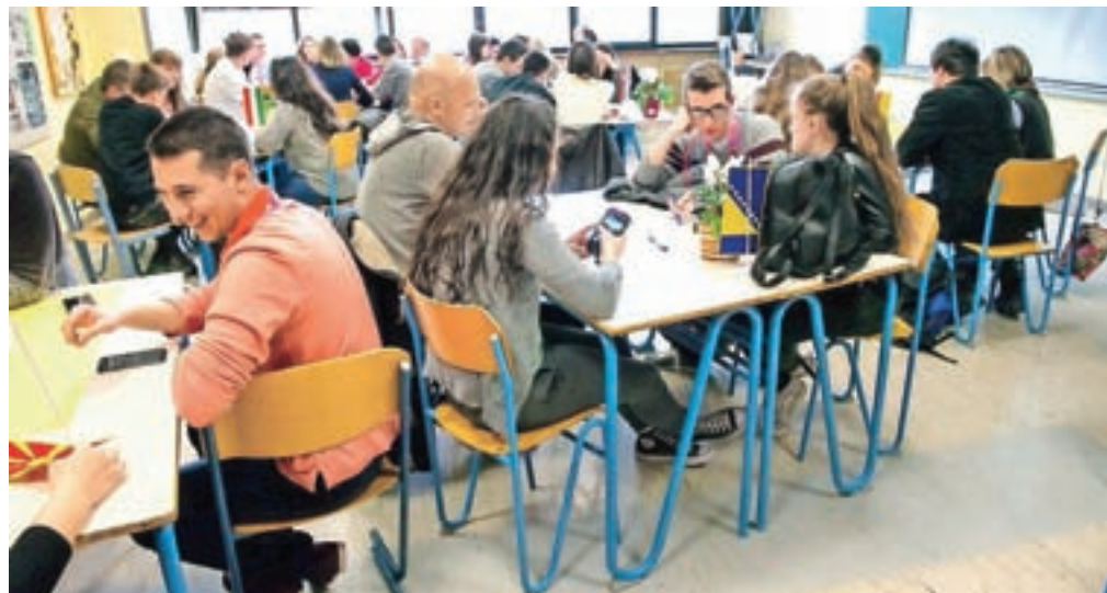
V Gimnaziji Škofja Loka so gostili tretje srečanje evropskih gimnazij.