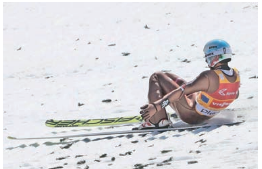
Kamil Stoch je novi rekorder planiške letalnice. Pri 251,5 metra je sicer z zadnjico podrsal po tleh, sodniki pa so nov planiški mejnik priznali.

planiškega rekorda. Bil sem blizu. Za mano je izjemna sezona in izjemen konec tedna. Po vseh podelitvah nisem več držal in priznam, da sem prvič v življenju od sreče zajokal,« je po nedeljski tekmi, ki je bila zaradi vetra izpeljana le v eni seriji, in 250 metrih pojasnil Kraft. V Planico je prišlo okrog trideset članov njegovega navijaškega kluba, tudi družina in dekle. S slavljenjem so začeli v Planici in nadaljevali v Avstriji.