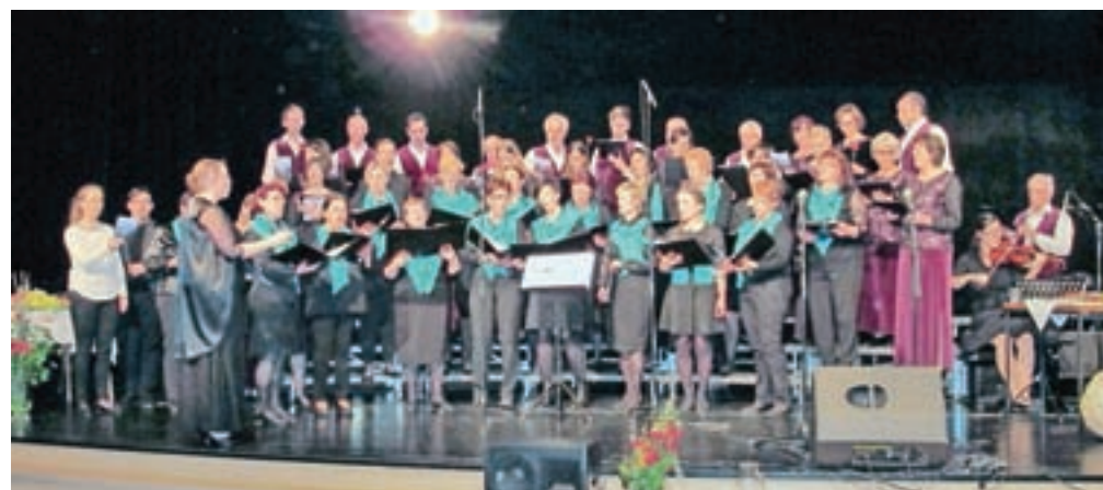
Oba zbora sta skupaj zapela pesem Po jezeru bliz Triglava.