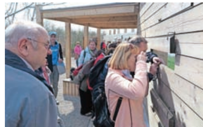
Skozi line lesenih pregrad smo opazovali ptice, ki se v Škocjanskem zatoku spomladi ustavljajo na selitveni poti.

»Prišli ste ravno pravi čas, v teh dneh je v Zatoku zelo živahno,« nas je pozdravila