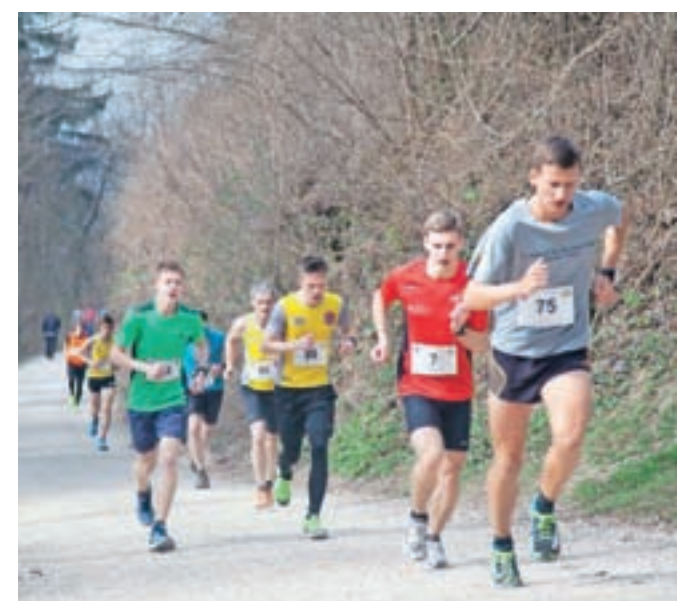
Dvaindvajseti Tek k sv. Primožu je privabil 97 tekačev.

Organizatorji pa so s tekom na petstometrski razdalji poskrbeli tudi za mlajše. Udeležilo se ga je 18 deklet in deklic, tako da je skupaj na sv. Primož teklo 97 tekačev in tekačic.