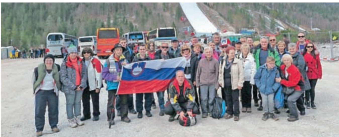
Tudi Glasova navijaška skupina je v petek v Planici spodbujala naše orle.