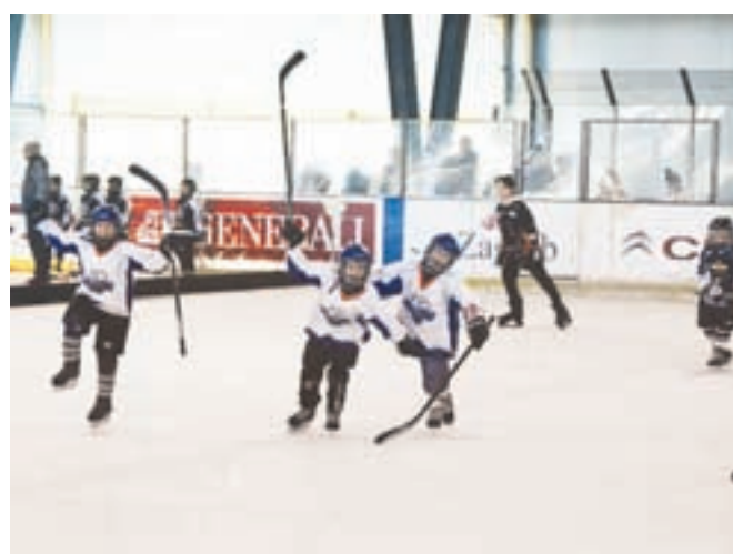
Veseli ob zadetku.