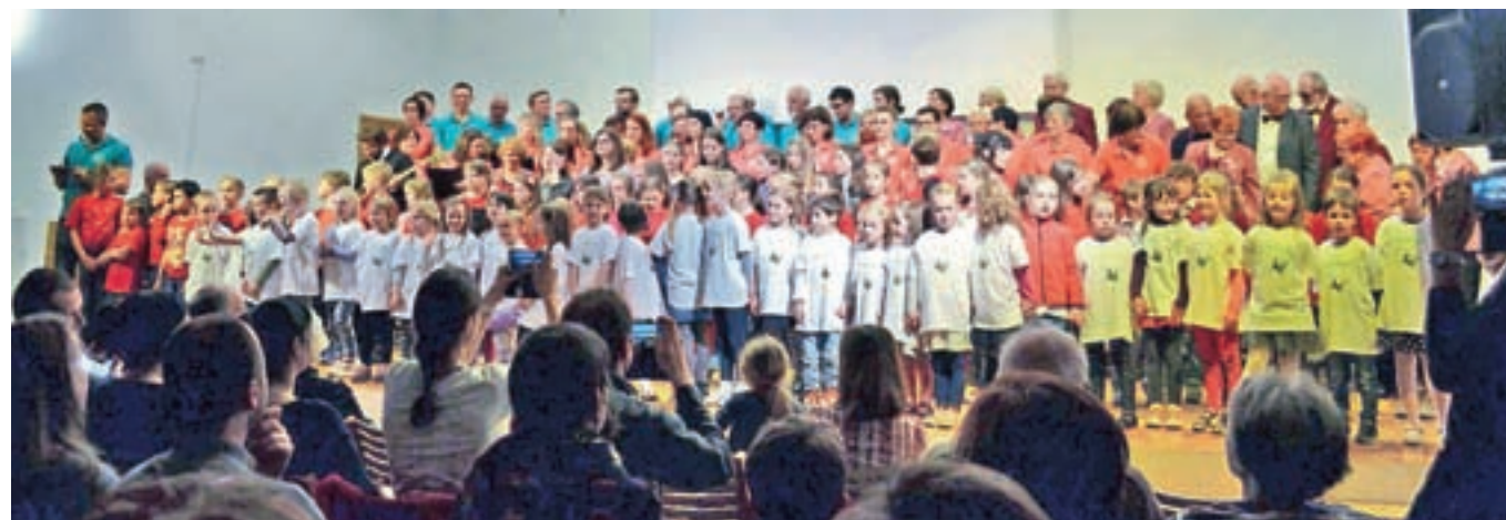
Ob koncu so moči simpatično združile prav vse generacije pevk in pevcev, tako mlajši kot starejši.

– člani Mešanega pevskega zbora Lubnik, ki se približujejo že četrtemu desetletju ustvarjanja. Gre za družabni dogodek, ki omogoča medsebojno druženje oziroma povezovanje pevcev različnih generacij, prav tako s prireditvijo zainteresiranim pevcem oziroma širši javnosti predstavijo možnosti nadaljnega vključevanja v različne pevske zборе znotraj lokalne skupnosti.