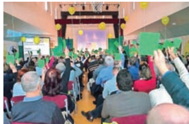
Ustanovnega kongresa nove stranke se je v Stari Loki udeležilo okoli dvesto delegatov.

je bila kritična do nedavno sprejetega družinskega zakonika, češ da samo enkrat omenja razširjeno družino treh generacij, v Sloveniji pa živi veliko takih družin. Tudi član iniciativnega odbora za