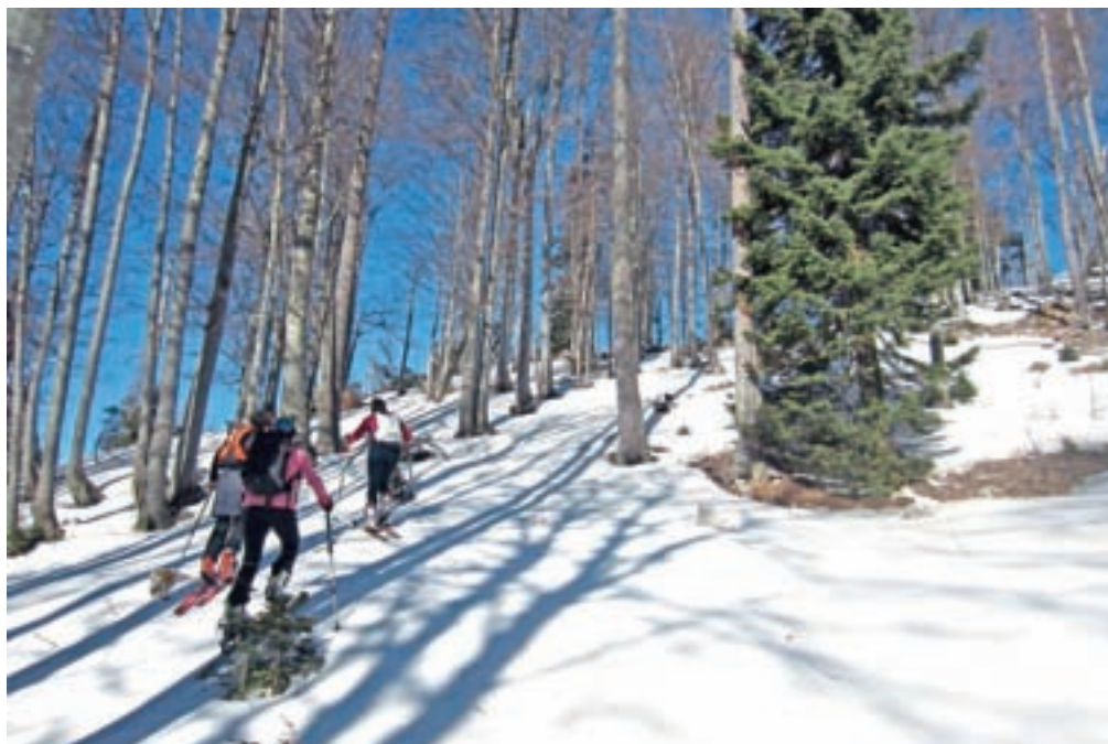
Vzpon skozi gozd nad lovsko kočico Brežiči

Vreme in snežne razmere tudi botrujejo odločitvi, kam naprej. Naša odločitev je