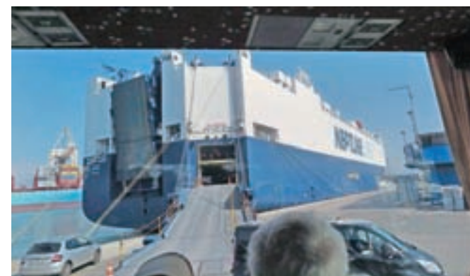
Po neverjetno zanimivi Luko Koper smo se odpeljali z avtobusom in občudovali velikanske tovorne ladje, s katerih vsak dan preložijo stotine ton različnega tovora.