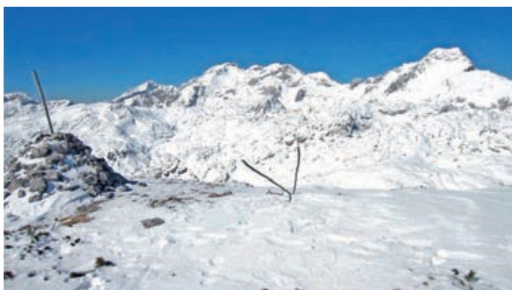
Vrh Deske z velikim možicem in lepim razgledom. Zadaj Grintovec, Planjava in Ojstrica.