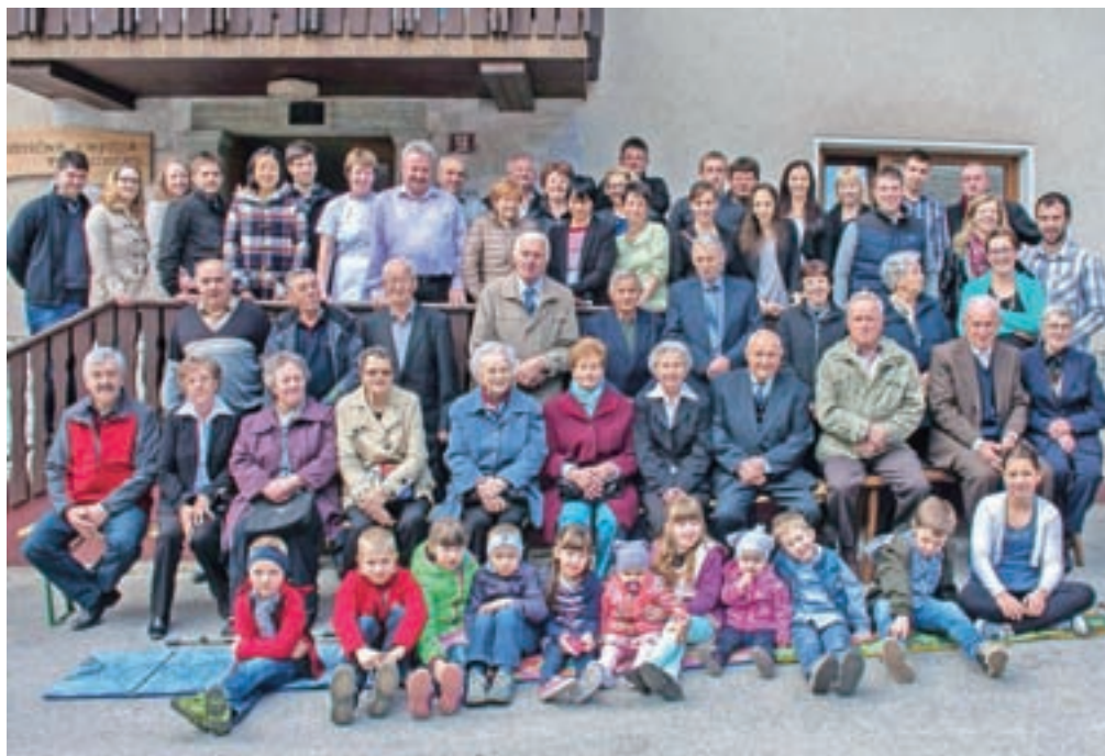
Obletnico poroke sta praznovala kar na domači kmetiji. Obiskali so ju številni sorodniki.