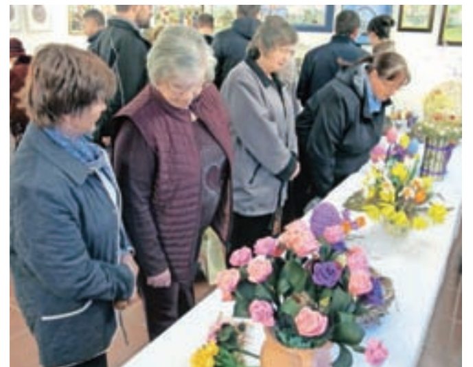
Svoje izdelke so na ogled postavile kmečke žene iz Cerkelj.