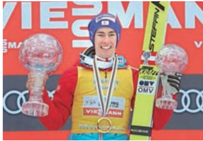
Avstrijec Stefan Kraft je na prestolu nasledil Petra Prevca in osvojil tako veliki kot mali kristalni globus.

Peter Prevc je sezono končal na devetem mestu v skupnem seštevku (716 točk), v seštevku poletov je peti. Najboljši Slovenec v sezoni je Domen Prevc na skupno šestem mestu (963 točk). »Tega pred sezono nisem pričakoval. Bi pa raje videl, da bi imel takšne rezultate in da bi bil drugi najboljši, ker bi ti pomenilo, da bi Petru uspela še ena fantastična sezona. Začeli smo zelo dobro, še sam sem bil presenečen, nato