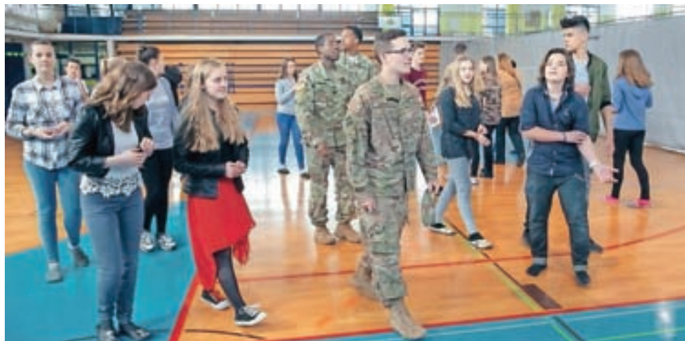
Učenci so ameriškim vojakom predstavili svojo šolo.

Ob obisku so ameriški vojaki učencem najprej predstavili svoj poklic in ameriški izobraževalni sistem, nato pa so prisluhnili predstavam učencev ter se podali na ogled šole in