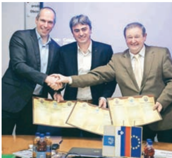
Prvi moške občin Preddvor, Blace in Vodnjan so podpisali listino o sodelovanju