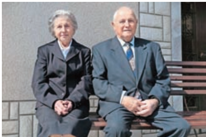
... in danes