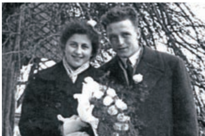
Francka in Miha Berce na dan poroke ...