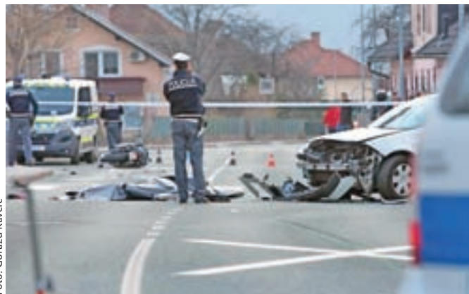
Trčenje z osebnim vozilom, ki mu je zaprlo pot, je bilo v petek popoldne usodno za 51-letnega motorista.

in motoristu zaprl pot. Prišlo je do trčenja, v katerem je motorist umrl na kraju nesreče. Odpadli deli obeh udeleženi vozil so po trčenju poškodovali še dve motorni kolesi, s katerima sta se proti Preddvoru peljala dva motorista, ki pa se pri tem nista poškodovala, prav tako ne povzročitelj nesreče. Na gorenjskih cestah so letos v prometnih nesrečah umrle že tri osebe.