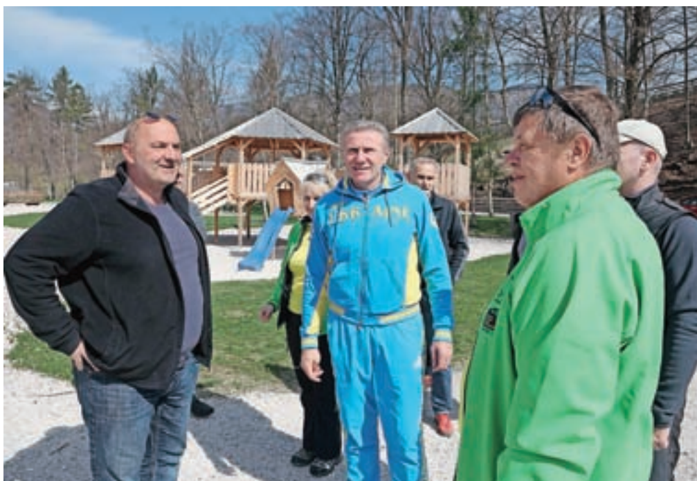
Sergej Bubka na ogledu starta letošnjega evropskega prvenstva v gorskih tekih, ki bo v Eko resortu pod Veliko planino v Godiču

»V Sloveniji sem bil že večkrat doslej, včasih se tu zato počutim že kot doma. Vaša država je znana po