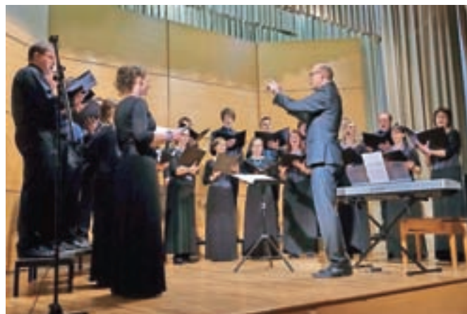
Odlično sprejeti tako doma kot v tujini: KPZ Mysterium na odru Šmartinskega doma v Stražišču

in med kritiki zelo dobro sprejete samostojne celovečerne ter tematske koncerte, samostojno ali z drugimi zbori pa redno izvajajo daljša tehtnejša dela v sodelovanju z instrumentalnimi zasedbami. Poleg rednih koncertnih dejavnosti se z veseljem udeležujejo dobredelnih koncertov, nastopajo na festivalih ter navezujejo stike z drugimi pevskimi zbori po Sloveniji in v tujini. Sodelujejo tudi na Poletnih delavnicah vokalne glasbe, ki jih pripravlja društvo.