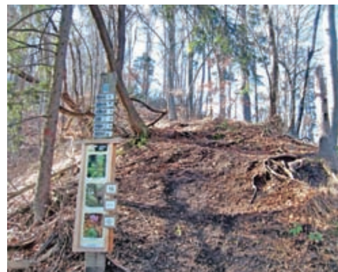
Informacijska tabla št. 16, pri kateri zavijemo strmo desno navzgor.