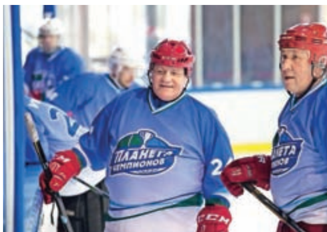
Sergej Makarov in Irek Gimajev, ruski hokejski legendi na blejskem ledu

Jeseničani. Najbolj znana imena na turnirju so bila v ekipi Planet zmagovalcev, za katero sta igrala tudi legendi ruskega oziroma sovjetskega hokeja Sergej Makarov, dvakratni zlati olimpijec, najboljši sovjetski strelec v zgodovini, in Irek Gimajev, ki je za sovjetsko reprezentanco nastopil na štirih svetovnih prvenstvih, na katerih je osvojil tri zlate in eno bronasto medaljo. Zvezdniki različnih športnih panog so v Rusiji ustanovili Planet zmagovalcev, ki želi predvsem med otroki in mladino