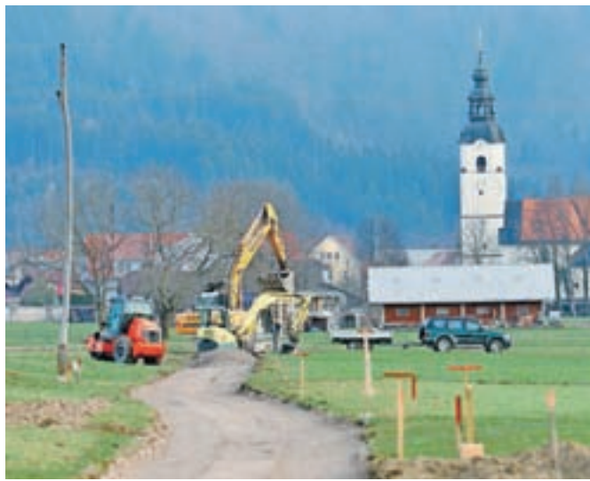
Gradnja pločnika Preddvor–Breg