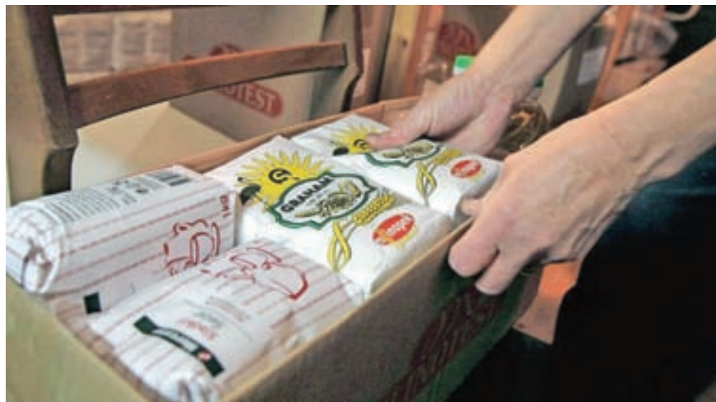
V prvo dobavo hrane so vključeni moka, riž, testenine (polžki in špageti), konzervirana zelenjava (fižol in pelati), mleko in olje.

Rdeči križ Slovenije (RKS) je s prvo dobavo prejel 821,3 tone hrane, od tega so Območna združenja RKS na Gorenjskem prejela 52,8 tone hrane (Jesenice 9,2 tone, Škofja Loka 3,5 tone, Radovljica 9,1 tone, Kranj 21 ton in Tržič pet ton). V to so vključeni moka, riž,