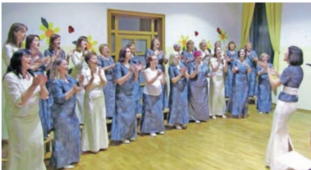
Dupljanke so bile tudi tokrat za svoj nastop nagrajene z dolgim aplavzom.

Sedem zborov in skupin je v soboto pelo v Dupljah.