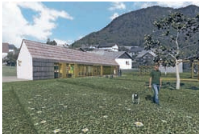
Osrednji objekt se bo odpiral proti parku z medovitimi rastlinami.

Še letos bodo celovito obnovili tudi Janšev čebeljak na Breznici in prvič za javnost odprli tudi notranost čebelnjaka. Vse skupaj sodi v sklop priprav na proglasitev 20. maja, rojstnega dneva Antona Janše, za svetovni dan čebel.