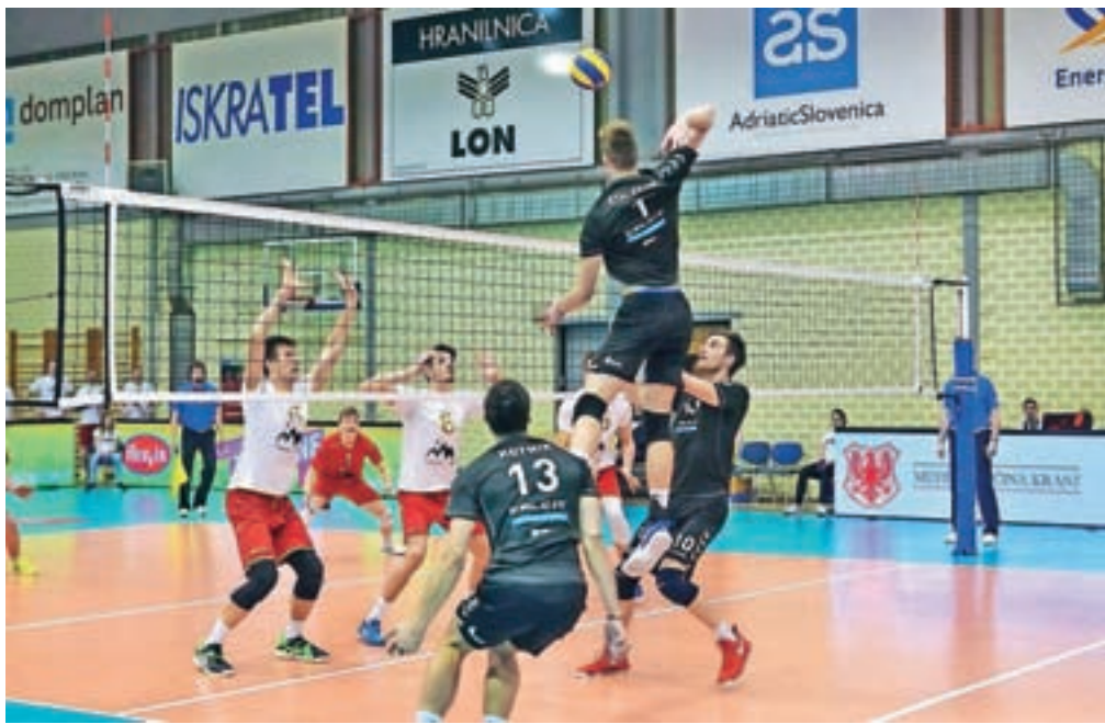
Na sobotnem gorenjskem derbiju med Calcitom Volleyballom in Triglavom so slavili kamniški odbojkarji, ki so nato v velikem finalu ugnali še ACH Volley in se veselili novega naslova pokalnih prvakov.

Prvi tekmi v ženski konkurenci sta bili na sporedu že v petek popoldne, ko sta se v polfinalu najprej pomerila Calcit Volleyball in Formula Formis. Po pričakovanju so bile boljše igralke Calcita Volleyballa, ki so slavile s 3 : 0. Enak rezultat je bil tudi na večernem obračunu, ko je Nova KBM Branik s 3 : 0 premagala VOLLEYBALLjubljano. Tako so se v veliki finale uvrstile odbojkarice Calcita Volleyballa in Nove KBM Branika, ki so se za naslov pokalnih prvakinj nato pomerile v soboto zvečer. Po maratonskem srečanju so pred nabito polnimi tribunami z rezultatom 3 : 2 slavile Mariborčanke in tako še drugo leto zapored osvojile pokalno lovoriko. »Obe ekipi sta ljubiteljem odbojke pripravili fenomenalno predstavo z vrhunsko odbojko. Naše tekmičice so igrale zelo dobro, a smo bile me še za odtenek boljše. Zares smo si želele zmage in mislim, da smo si jo tudi