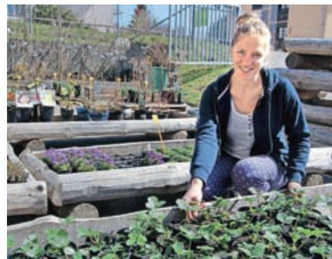
Ana Rimahazi ob sadikah jagod

Marec – mesec, ki prikliče pomlad in z njo delo na vrtu. Zemljo že lahko pripravimo, nekaj malega posadimo, a s sajenjem nikar ne prehitimo narave.