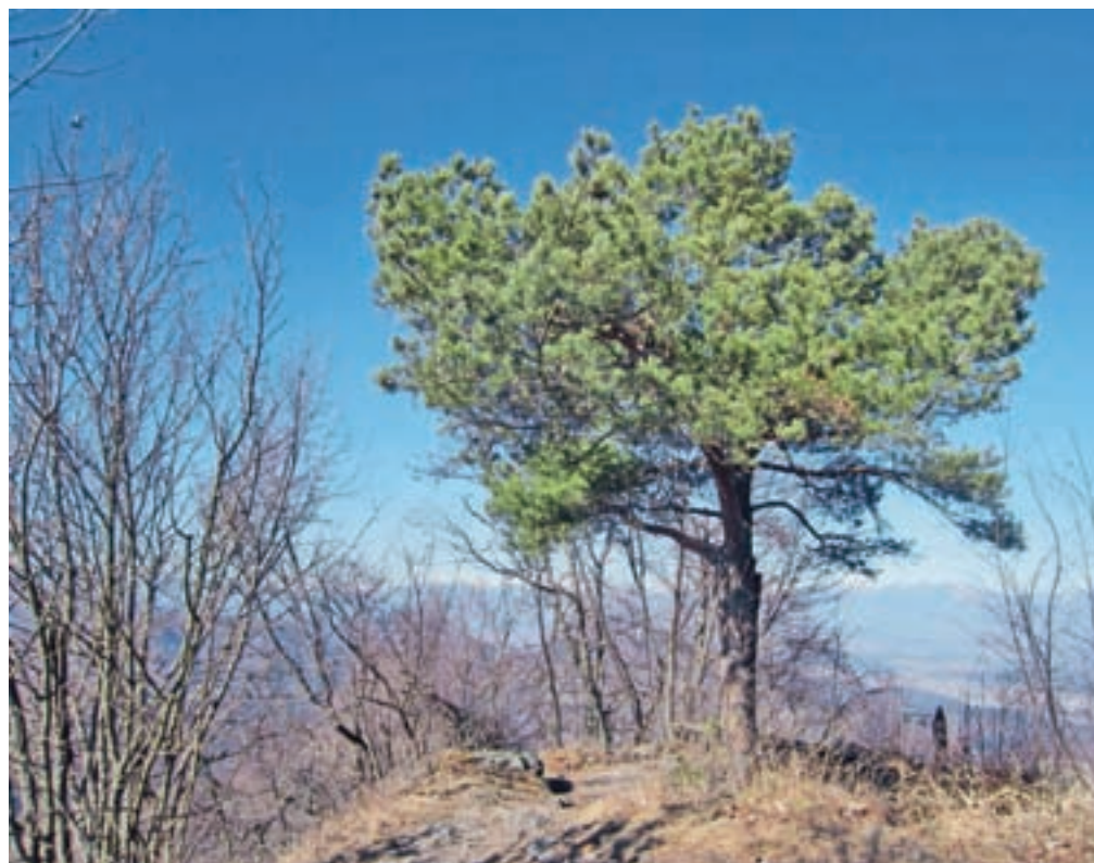
Bor na vrhu, tik pred vpisno skrinjico

Smerne table nas usmerijo levo od parkirišča, po kolovozni poti. Sledimo ji mimo hiše. Kolovoz zavije levo in mi mu še kar sledimo. Kolovoz se precej strmo dvigne, nato pa se zoži in steza je videti morda malce zaraščena, a ne za dolgo. Dosežemo greben, kjer na pomolu na svoji levi strani opazimo klop z razgledom na Kamniško-Savinjske Alpe. Na grebenu tudi vidimo eno od informacijskih tabel o favni in flori okolice. Sledimo grebenu, ko nas ta usmeri strmo desno navzgor. Zagledamo tudi prvo markacijo. Prečna pot poteka po severni strani, in ko dosežemo