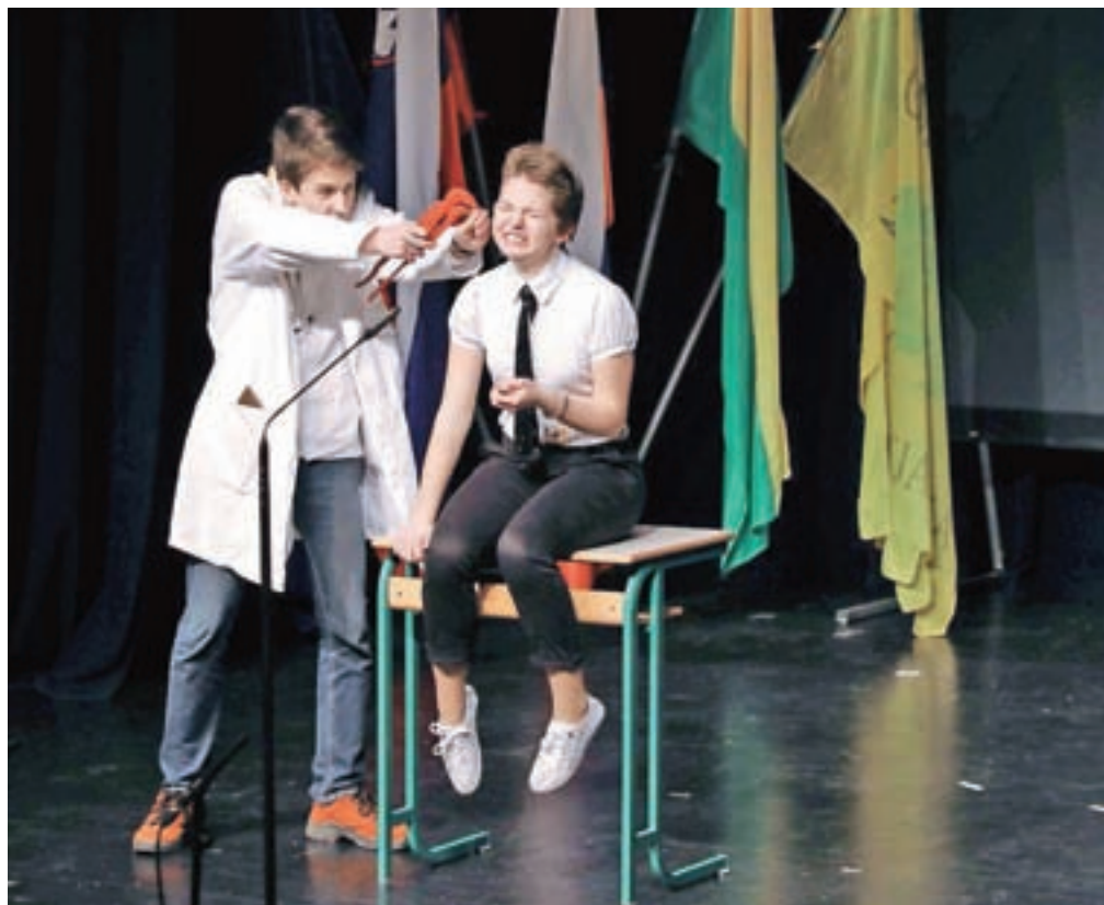
Z mislijo, da je ljubezen do ruščine prav nalezljiva, so napovedali skeč Gimnazije Škofja Loka.