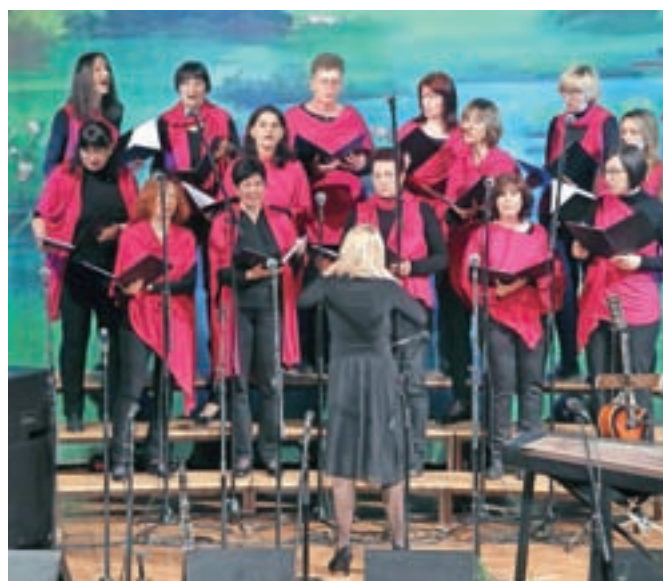
Pevski zbor učiteljic OŠ Šenčur