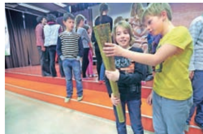
Učenci so prinesli olimpijsko baklo.

POTOVANJA • VINO • HRANA • DOGODIVŠČINE • MOŠKI • ŽENSKO • POTOVANJA • VINO • HRANA • ŽENSKO