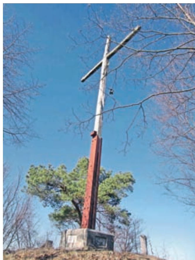
Na vrhu Jeterbenka stoji križ.

Nadmorska višina: 778 m Višinska razlika: 370 m Trajanje: 2 uri Zahtevnost: ★★★★