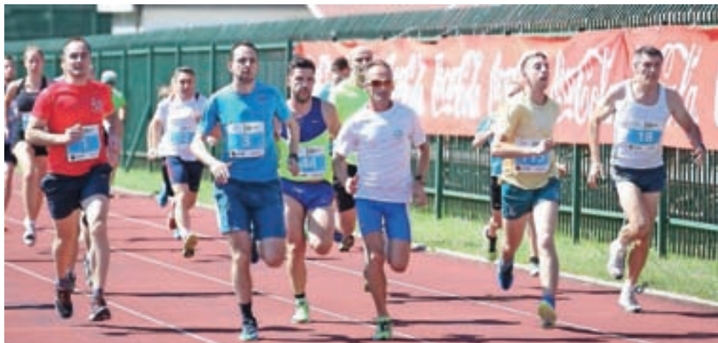
V Kranju bo na atletskem stadionu testiranje 8. aprila.

Lanski projekt Moja olimpijska norma je bil uspešen in organizirali ga bodo tudi letos. Koncept bo enak, testiranje pa bo potekalo na šestih lokacijah, tudi na atletskem stadionu v Kranju, v soboto, 8. aprila, med 9. in 11. uro. Vsako polno uro bodo testirali petdeset posameznikov. Prijavite se lahko na spleto do 6. aprila do 15. ure oziroma do zapolnitve mest. Finalni dogodek bo 17. junija v Ljubljani.