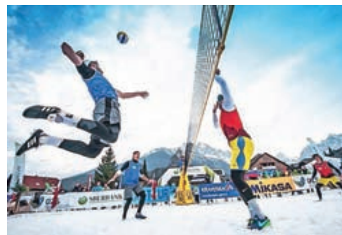
Odbojka na snegu se bo v Kranjsko Goro znova vrnila prihodnje zimo.