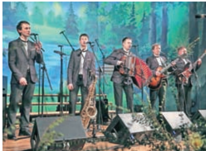
Kvintet Dori

Tokrat je glasbeni večer s Kvintetom Dori v petek gostil Dom krajanov Šenčur.