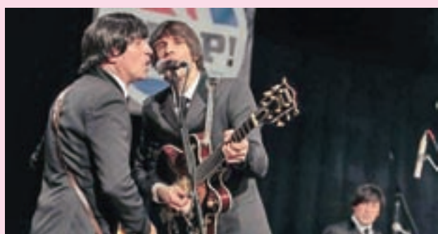
Skupina Help! A Beatles Tribute je navdušila občinstvo v Cerkljah.