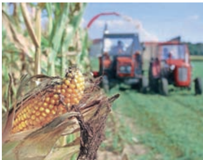
Na Gorenjskem je koruza po obsegu pridelave najbolj razširjena poljščina.

Kmetijskem inštitutu Slovenije vsako leto pripravijo seznam priporočenih hibridov glede na namen pridelave. Pridelovalcem so pri izbiri v pomoč še podatki, ki jih navajajo ponudniki, pa tudi rezultati preizkusov, ki jih opravljajo strokovne kmetijske organizacije. Na Gorenjskem vsako leto poskrbi za poskusni nasad s koruznimi hibridi iz različnih semenarskih hiš Kmetijsko gozdarski zavod Kranj. Pri izbiri hibridov je pomemben tip zrnja, dolžina rastne dobe, višina koruze, odpornost proti lomu, poganjanju ter proti najpomembnejšim boleznim in škodljivcem, dolgozelnost, vlaga zrnja ob spravilu in količina pridelka (zrnja in suhe snovi).