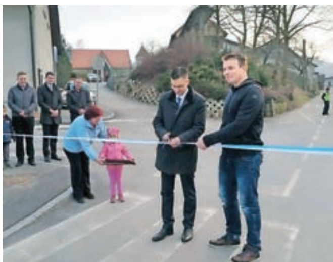
Novo pridobitev sta s simboličnim prerezom traku odprla župan Marjan Šarec in predsednik Krajevne skupnosti Šmartno v Tuhinju Primož Mali.

»Projekt, ki ga danes odpiramo s takim veseljem, je povezan z dolgoletnimi prizadevanji za kanalizacijsko