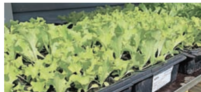
Sadice solat so že na voljo.