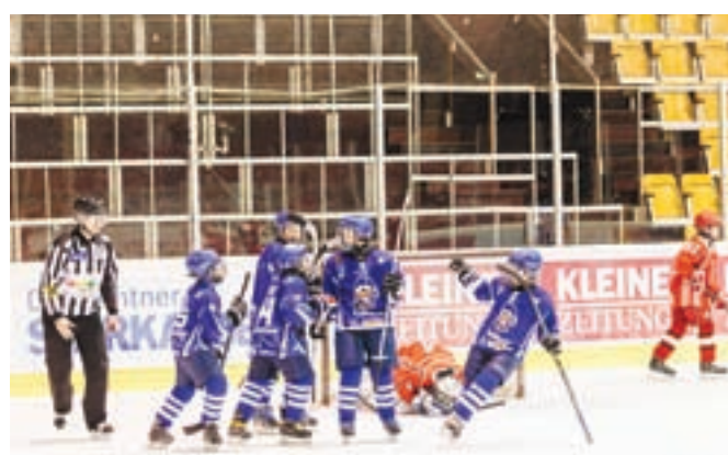
Selekcija U12 v boju za zlato medaljo na državnem prvenstvu