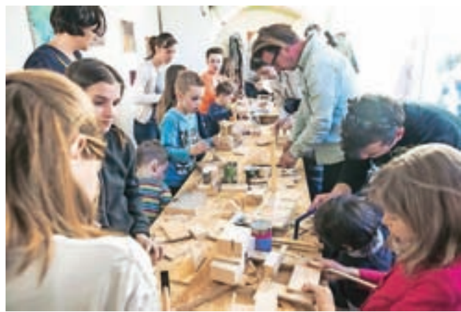
Delavnica izdelovanja gregorčkov v Kranju