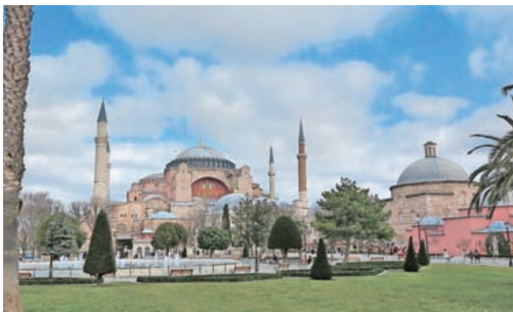
Hagia Sofija je nekdanja patriarhalna bazilika, kasnejša mošeja ter današnji muzej v Istanbulu oziroma Carigradu.

Enkrat sva se s sopotnico znašli pred velikanskimi kamnitimi vrati (lahko bi rekli že kar slavolokom), na katerih se je sončil napis Univerza Istanbul. Namreč, ko sva na Grand Bazarju preveč vneto gledali stojnice z raznovrstno ponudbo, sva se med ulicami in uličicami uspeli izgubiti. A nič zato. Razgrnili sva zemljevid mesta in poskušali ugotoviti, kje sva. Takoj sta pristopila dva mlada fanta, ali potrebujeva pomoč. V odlični angleščini sta razložila, kje sva in na kateri tramvaj naj greva. Je pa uporaba javnih prevoznih sredstev v Carigradu dokaj enostavna. V vsaki trafiki prodajajo kartico za javni prevoz, nanjo naložiš denar in z njo je uporaba podzemne železnice ter tramvaja čisto enostavna. Ljudje z veseljem pomagajo, povsod so napisali tudi v