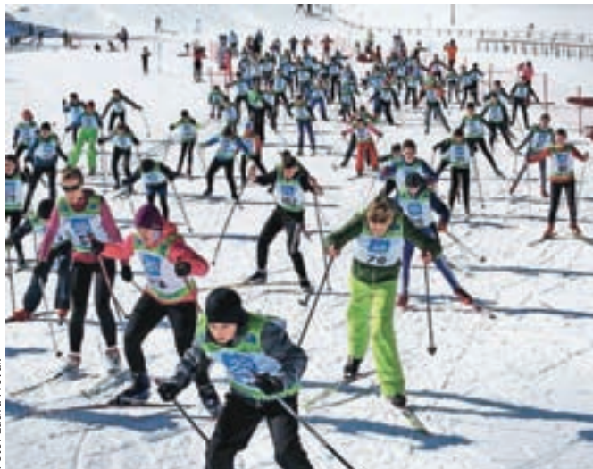
Veliko učencev in dijakov se je preizkusilo v teku na smučeh.