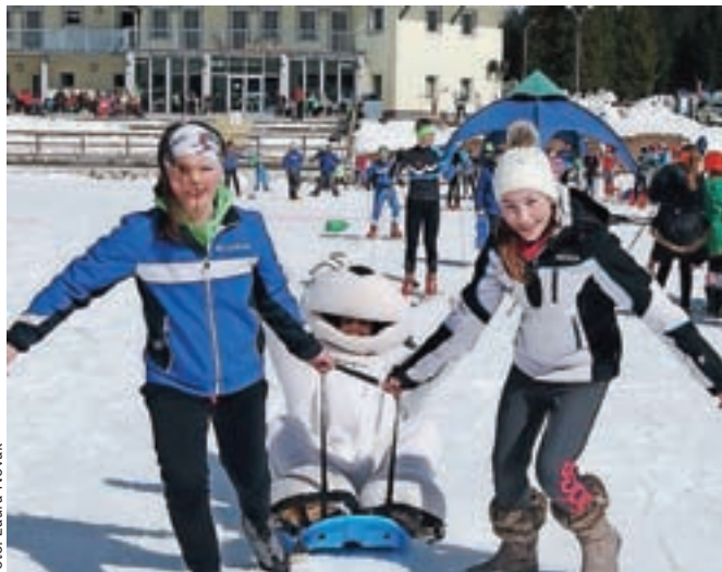
Tudi letos je potekal bogat spremljevalni program.