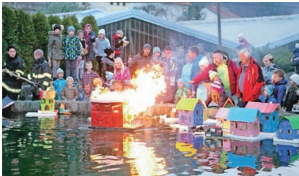
Barčica je maketa iz papirja ali lesa, vanjo postavijo svečko in jo spustijo v vodo. Včasih se kakšna barčica tudi vname, v Kropi se je prav barčica PGD Kropa.