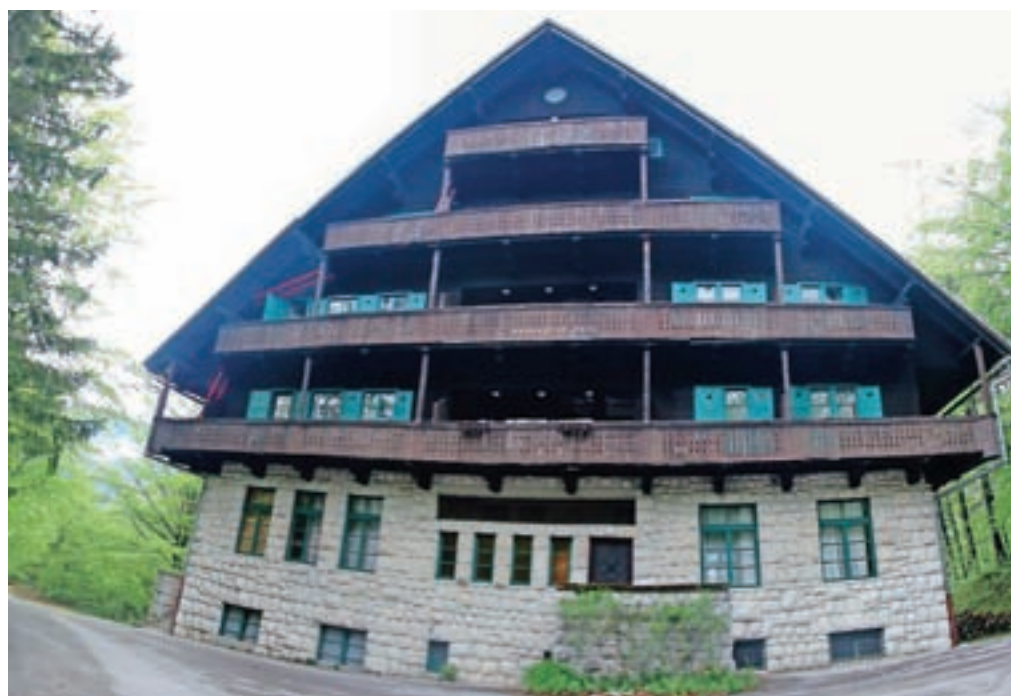
► 2. stran Bohinjski hotel Bellevue je dobil novega lastnika.