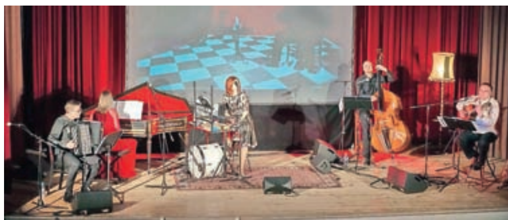
Skupina odličnih glasbenikov Link.Art je občinstvo s svojim nastopom popeljala na glasbeni potep skozi prostor in čas.