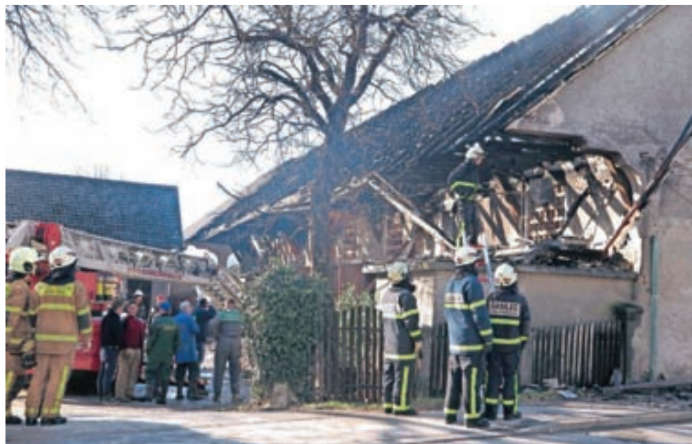
Gasilci so potrebovali tri ure, da so ukrotili požar, medtem ko je čiščenje pogorišča in odstranjevanje pogorelega ostrešja potekalo vse do nedelje zvečer.

Novi vodja operative v Gasilsko reševalni službi Kranj Andraž Šifrer, ki je vodil tudi