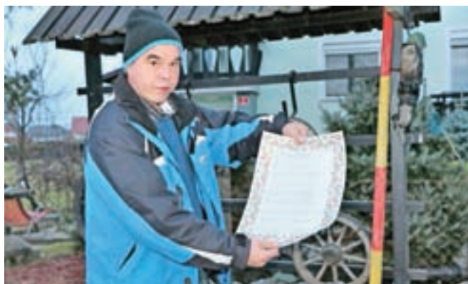
Milan je slavljencu spisal pravo pesnitev.

Je pa slavljencev za prijatelje pripravil še eno praznovanje: v soboto so se zbrali v Adergasu, na Domačiji Vodnik. Ni manjkalo dobre hrane, pijače in humorja, ob živi glasbi pa se je zabava zavlekla v ure naslednjega dne.