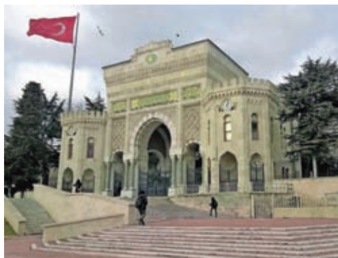
Če se izgubiš Grand Bazarju, se ti lahko zgodi, da nenačrtovano odkriješ še kakšno dodatno mogočno kamnito stavbo v mestu.

Sofijo ter Modro mošejo pa je v času, ko se spusti tema, v soju mestnih luči popolnoma različen od dnevnega. V teh dneh tam tudi ni več množic radovednih turistov – ne podnevi ne ponoči. Prišla je na primer skupina japonskih turistov. Pripeljali so jih z avtobusom, njihov ogled pa je potekal nekako takole: tole je ena mošeja, tole druga, hvala lepa in gremo dalje. (Nadaljevanje prihodnjič)