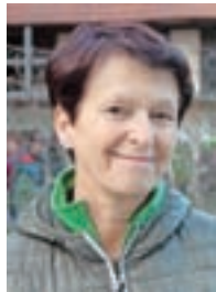
Tea Beton, Kamna Gorica:

»Spuščanje barčic je največja prireditve v vasi, pri organizaciji sodelujemo člani vseh društev. Naštetimo tudi po dvesto barčic. Vsak otrok za trud dobi čokolado, posebej izvirne pa tudi nagradimo.«