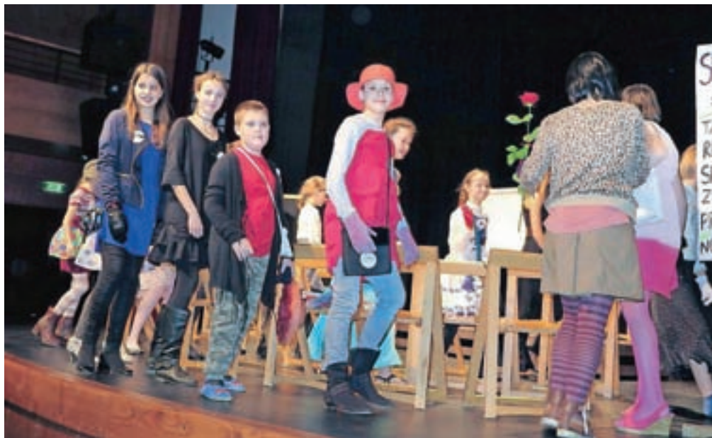
V predstavi Čarovnice so nastopili učenci dramskega krožka OŠ F. S. Finžgarja Lesce.

Nekatere dramske skupine se Linhartovega srečanja udeležijo vsako leto, nekatere pa so na velikem odru stale prvič, med njimi tudi mladi igralci z Osnovne šole Frana Saleškega Finžgarja