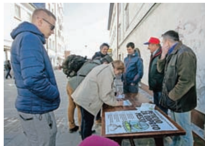
Zbiranje podpisov za odprto mesto so začeli minulo soboto v starem Kranju.