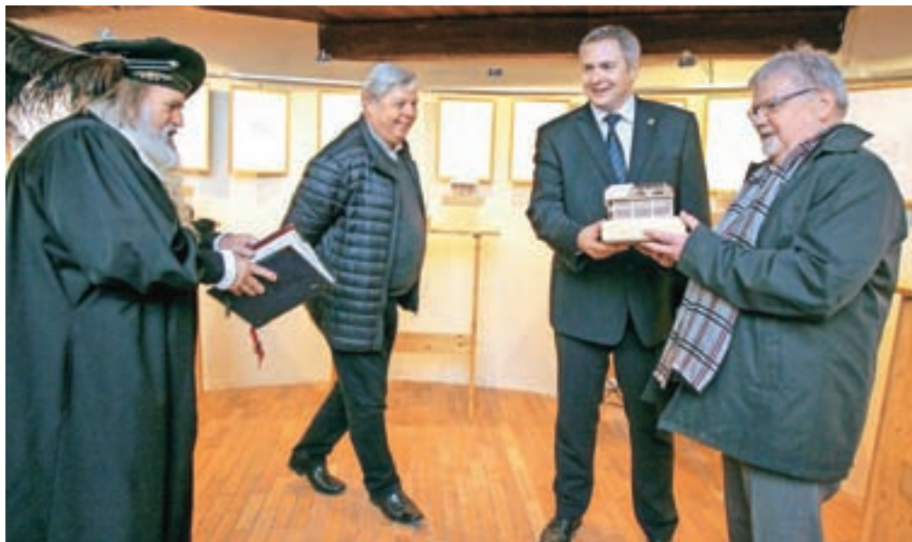
V galeriji Stolp so odprli razstavo Slovenski kozolec.