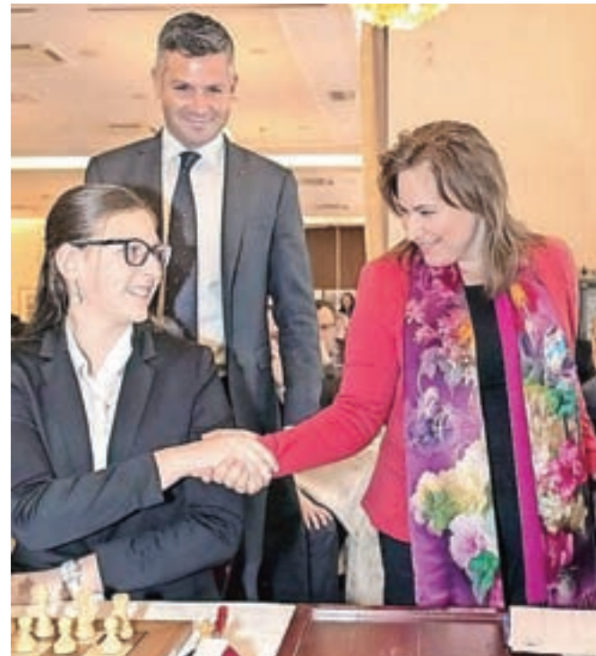
Festival je s svojo udeležbo počastila najboljša šahistka vseh časov Judit Polgar iz Madžarske.