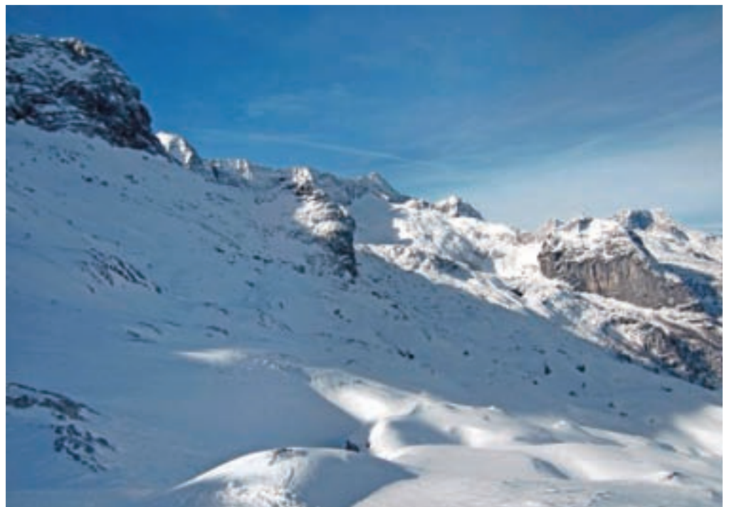
Kraški svet pod Lopo

v času sneženja obisk mulatjere prepovedan. Na začetku dosežemo ruševine stare vojaške postojanke. Pot se zlagoma in uživaško dviga skozi gozd in neverjetno hitro pridobivamo višino. Ko gozd postane redkejši, smo na kraških podih, trenutno zasneženih, ki so prepleteni s številnimi brezni. Na levi strani zagledamo ostaline vojašnice Poviz, ki nosi ime po gori nad njo. V poletnem času je tukaj razpotje; desno proti sedlu Prevala, naravnost pa do sedla Vrh Laških brežičev. Mi nadaljujemo desno in turnosmučarska sled se začne smerno vzpenjati. Svet, po katerem hodimo s smučmi na nogah, nam daje slutiti, da hodimo po izrazitem kraškem svetu. Slutimo lahko, da se vzpenjamo po meliščih pod Lopo. Zadnji vzpon na greben, ki smo ga ves čas videli pred seboj, je strm. Smo na sedlu Golovec, s katerega se spustimo do končne postaje ene od gondolskih žičnic italijanskega smučišča. Od tod odsmučamo, kar s psi na smučeh do sedla Prevala, kjer pa ponovno zagrizemo v klanec ob levem robu smučišča. Nadaljujemo do vrha smučišča oz. do Škrbine pod Prestreljenikom, kjer pogledamo na slovensko smučišče