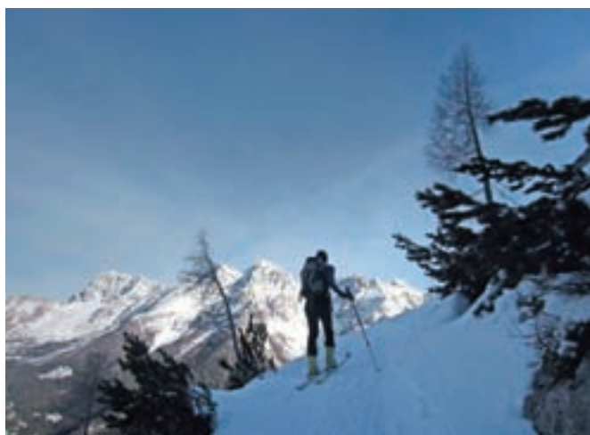
Vzpon po mulatjeri se obrne tudi proti grebenu Poliških Špikov.

Kanin, in z malce sreče se nam bo pogled ustavil na Jadranskem morju oz. na slovenski obali.