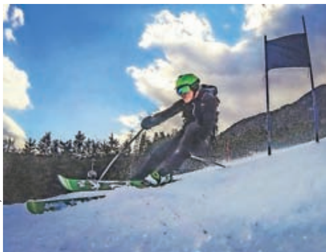
Na veleslalomski tekmi je letos zmagala jezerska ekipa.