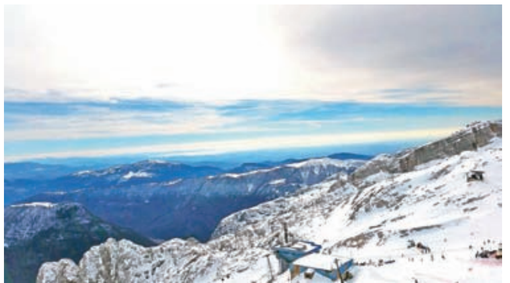
Slovenski Kanin z morjem na obzorju