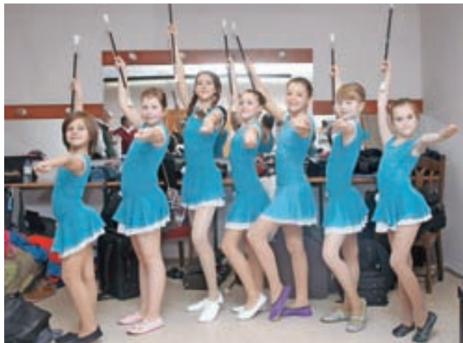
Nastopile so tudi Mengeške mažoretke.