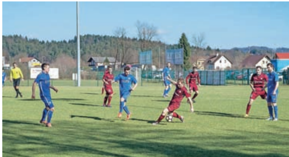
Nogometaši Triglava (v bordo rdečih dresih) so v gosteh premagali Dob in potrdili primat najboljših ekip druge lige.