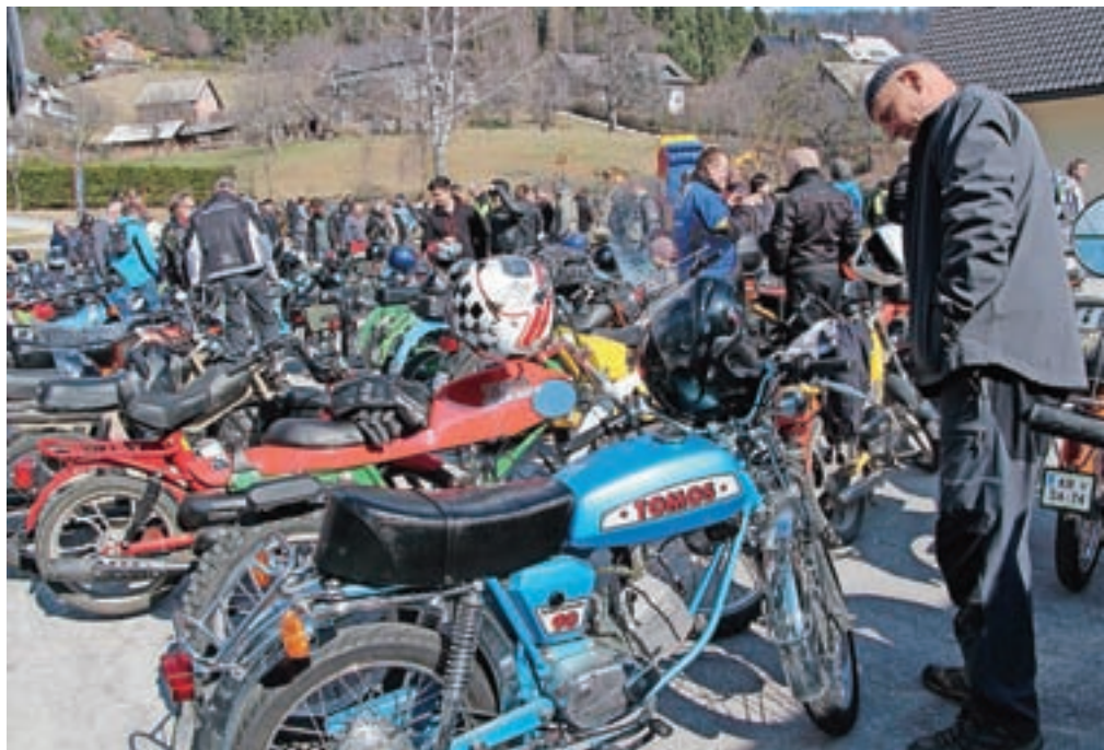
Tomosovi lepotci, naj bo vožnja srečna in varna.