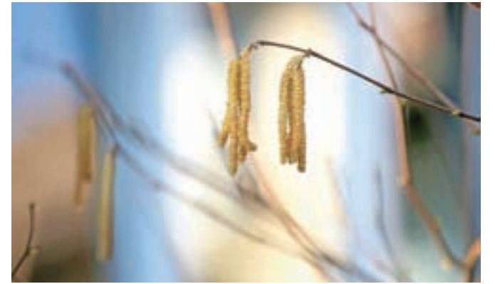
S pomladjo pridejo tudi obremenitve zraka z alergenim cvetnim prahom, slika je simbolična.

v obliki semaforja prikazuje izmerjene dnevne obremenitve za izbrano merilno postajo. Za merilno mesto Ljubljana, ki je nam najbližje, so prve marčevske dni zaznamovale obremenitve zraka z alergenim cvetnim prahom leske, jelše (te še najbolj) in cipresovke/tisovke.