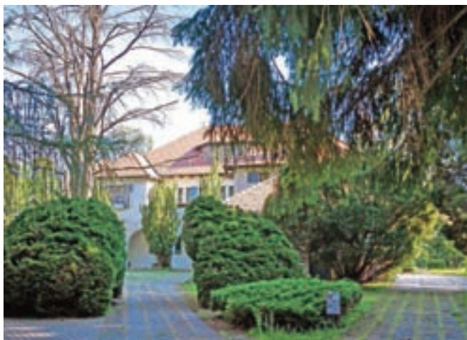
Občina Tržič se bo na zavrnilo sodbo kranjskega sodišča glede zahtevane odškodnine zaradi sodnih napak pri denacionalizaciji Vile Bistrica pritožila.

z ostalimi predpostavkami (vzročna zveza, škoda, krivda) niti ni ukvarjalo in