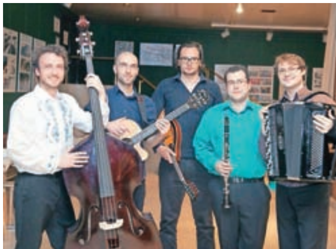
Slovenski Klezmer Band se je predstavil z judovsko glasbo.