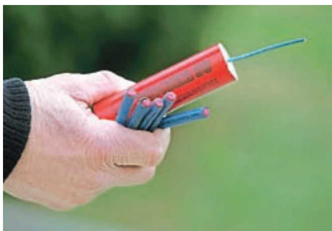
Policisti Policijske postaje Domžale so v preteklih dneh zasegli rekordno količino pirotehnik.