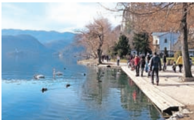
Ker letos še ni bilo snega, se v vseh gorenjskih zimskih turističnih središčih trudijo turiste privabiti s pestrim dogajanjem.

zasedeni bomo vse do 10. januarja, ko se novoletne počitnice končajo tudi na hrvaškem, od koder prihajajo