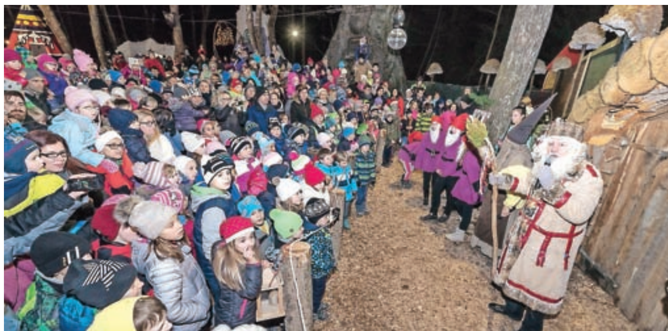
V Pravljčni deželi otroke obišče in obdaruje tudi Dedek Mraz. / Andrej Tarfila