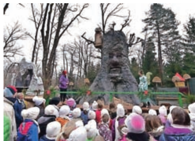
Letošnja največja atrakcija je bil govoreči hrast v deželi Nije. / Andrej Tarfila