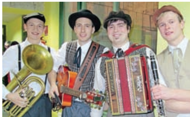
Ansambel Murni prihajajo iz Šentjurja pri Celju. Mladi glasbeniki ne marajo ozkih hlač, ampak širše, da jih dekleta sprašujejo, kaj se skriva pod njimi.