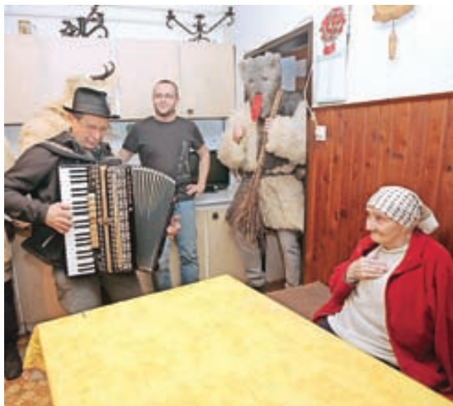
Otepanje je v Stari Fužini dolgoletna tradicija in starejši fante vsako leto željno pričakujejo.