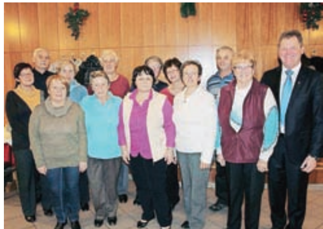
Poverjenice Društva upokojencev Naklo so povabili na druženje ob zaključku leta.