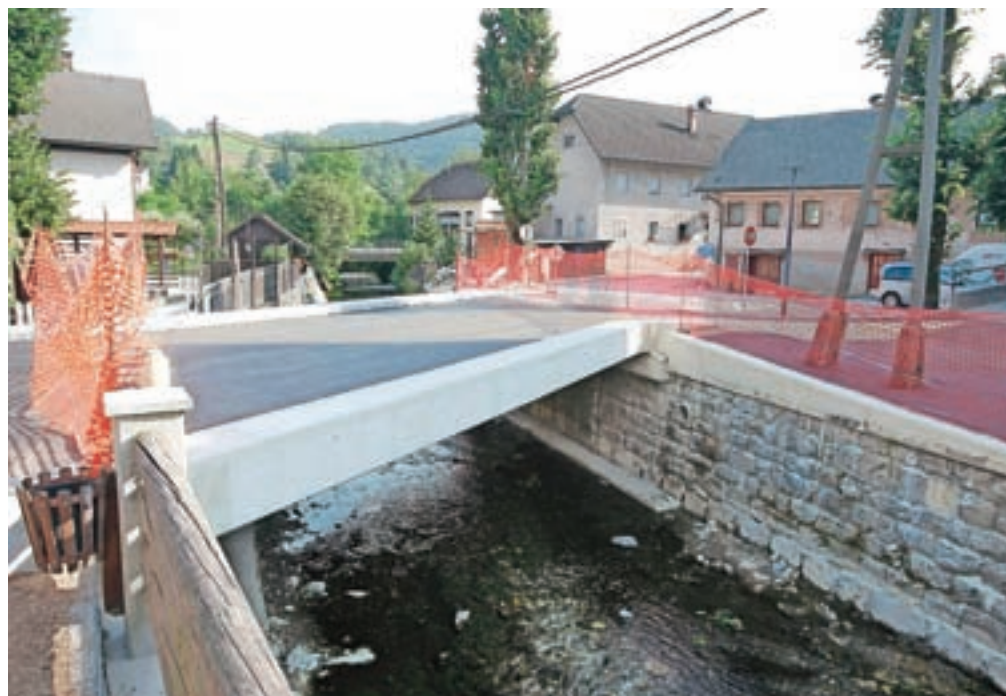
Občina je z lastnimi sredstvi že uredila most čez Ločivnico v Poljanah.

Protipoplavni ukrepi obsegajo regulacijo struge Sore mimo Hotovlje v njen prvotni tok, znižanje terena pred Županovšem za preprečevanje zajezitev poplavne vode in bolj kontroliran razliv, ureditev iztoka Ločivnice v Soro, ureditev struge Ločivnice