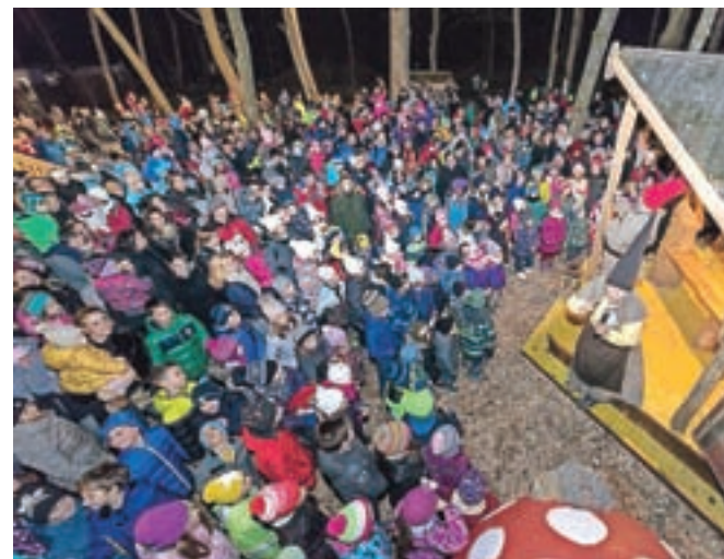
Obiskovalci so v zadnjih dneh povsem napolnili prireditveni prostor.