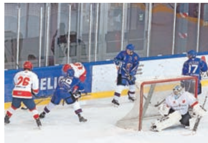
Blejski hokejisti so leto zaključili z zmago proti ekipi Crvena zvezda.

Živahno je bilko v sredo zvečer tudi na Bledu, kjer je domača članska ekipa HKMK Bled v razširjenem državnem prvenstvu gostila hokejiste Crvene zvezde. Blejci so bili boljši in zmagali s 6 : 4. Naslednja preizkušnja jih čaka 7. januarja, ko bodo v Zagrebu gostovali pri Medveščaku.