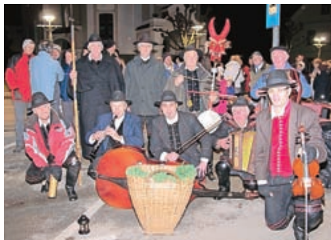
Kranjski furmani so voščili srečo in zdravje v novem letu.

Cerklje – V torek so Cerklje na povabilo Kulturnega društva Folklor Cerklje obiskali božično-novoletni koledniki Kranjski furmani, ki delujejo pri akademski folklorni skupini Ozara s Primskovega v Kranju. Furmani že štiriindvajseto leto v božičnem in novoletnem času hodijo od vrat do vrat z nad tristo let starim obrednim koledovanjem in vsem prinašajo veselje in voščijo srečo. Številnim obiskovalcem v Cerkljah so se predstavili na trgu pred župnijsko cerkvijo Marijinega vnebovzeta. Najprej so se številnim obiskovalcem predstavili člani domače folklorne skupine Cerkljanski gavnarji, sledil pa je nastop gostov. Zapeli so več ljudskih koledniških pesmi in ob ljudski glasbi godcev obudili stari običaj koledovanje ter voščili srečo in zdravje v novem letu. Člani KD Folklor Cerklje pa so obiskovalcem postregli s toplimi napitki ter dobrotami iz kmečke peči.