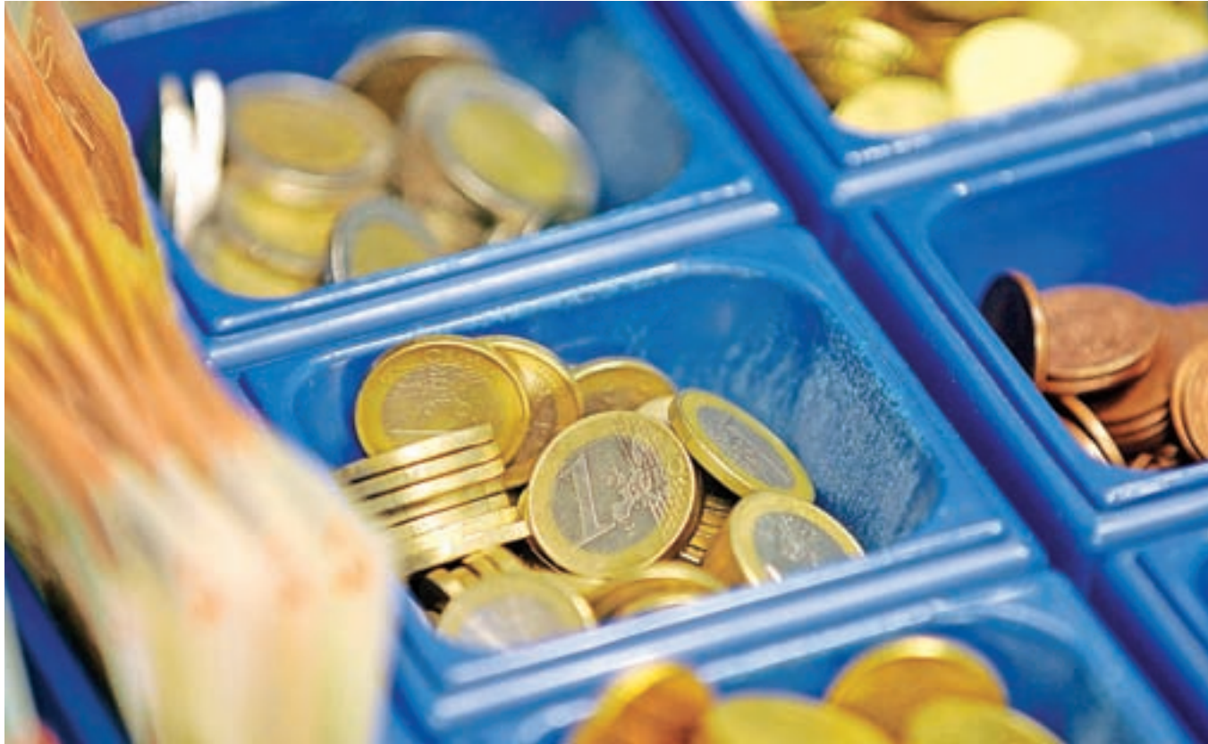
Slovenija je ob uvedbi evra pri Evropski centralni banki naročila 296,3 milijona kosov evrskih kovancev, vrednih 103,9 milijona evrov, in 94,5 milijona kosov evrskih bankovcev, vrednih 2,2 milijarde evrov.

Za vstop v evroobmočje je morala Slovenija izpolniti t. i. konvergenčne (maastrichtske) kriterije, katerih ključna značilnost je stabilnost. Stopnja inflacije tako ni smela za več kot 1,5 odstotne točke presežati povprečja stopnje inflacije treh držav članic, ki so dosegle najboljše rezultate glede stabilnosti cen. Javnofinančni primanjkljaj ni smel presežati treh odstotkov BDP, javni dolg pa ne šestdeset odstotkov BDP (dovoljene so sicer nekatere izjeme). Dolgoročne obrestne mere niso smele presežati povprečja obrestnih mer treh držav članic z najnižjo stopnjo inflacije za več kakor dve odstotni točki, zagotoviti pa je bilo treba tudi stabilen tečaj valute.