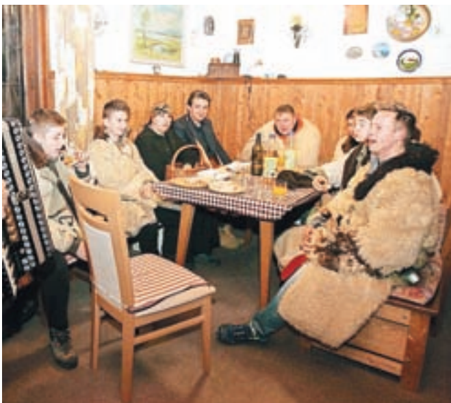
Ponekod otepance tudi pogostijo, ti pa zapojejo kakšno narodno.