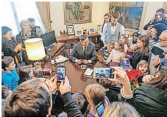
Predsednik Borut Pahor je ob ponedeljkovem državnem prazniku v predsedniški palači gostil blizu tristo obiskovalcev.