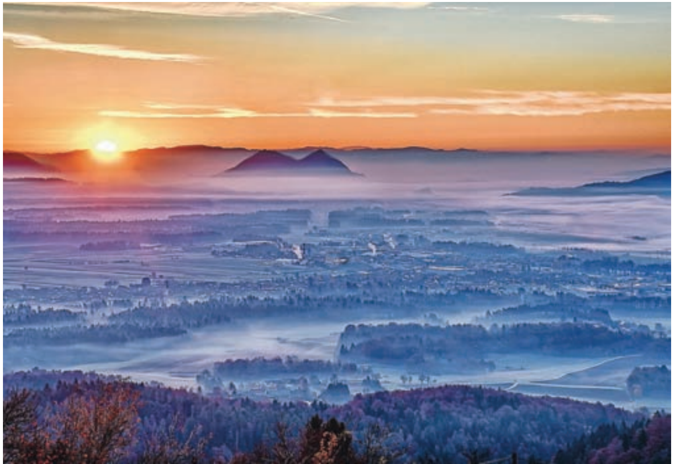
V novem letu vam želimo veliko sreče, zdravja in osebnega zadovoljstva.

Gorenjski glas stopa v sedemdeseto leto izhajanja. Ob visokem jubileju smo za poslovne partnerje pripravili rokovnik zdravja, ki jih bo teden za tednom opominjal, kar je dobro za zdravje na delovnem mestu. Za naročnike časopisa bomo štirikrat v jubilejnem letu pripravili paleto popustov, s katerimi si boste lahko v celoti ali vsaj deloma povrnili naročnino, kar pomeni, da bodo ugodnosti lahko izkoristili vsi naši naročniki. Več o novem naročniškem letu boste prebrali v prvi številki Gorenjskega glasa v novem letu.