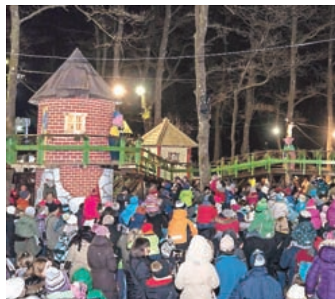
Veliko navdušenja je letos požela tudi pravljica o volku in treh prašičkih.