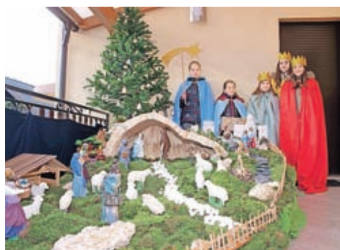
Koledniki ob Boltežarjevih jaslicah