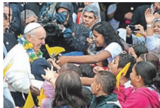
Papež Francišek (na sliki med obiskom v brazilski faveli) je eden redkih prvakov tega sveta, ki mu je mar tudi za spodnjo polovico zemljanov.