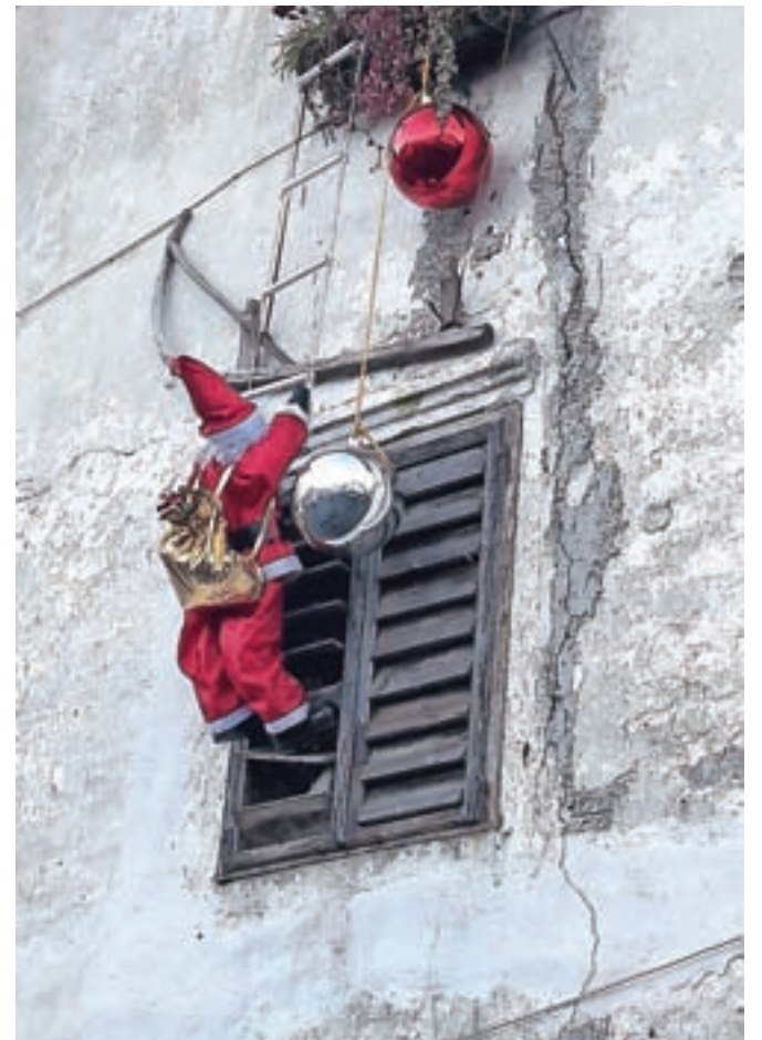
Poskrbite, da bo edini, ki mu bo te dni uspelo priti skozi okno, Dedek Mraz.

nosti in podobno. Varnostni poudarek naj bo tudi na vozilih, ki so lahka tarča za tatove in zelo verjetno to tudi bodo, če bodo ljudje v njih puščali vredne predmete. Za razbitje stekla, kar je najpogostejši način izvršitve kaznivega dejanja, storilec namreč potrebuje zelo malo časa, tatvino pa lahko izvrši zelo hitro. Pogosto mu dejanje lastnik še