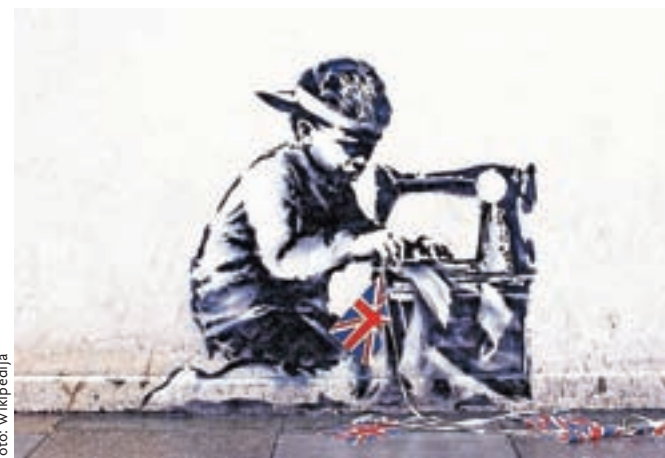
Deček, ki kot suženjski delavec šiva angleško zastavo. Avtor te zidne slike (murala) je umetnik Banksy, v Londonu, 2012.