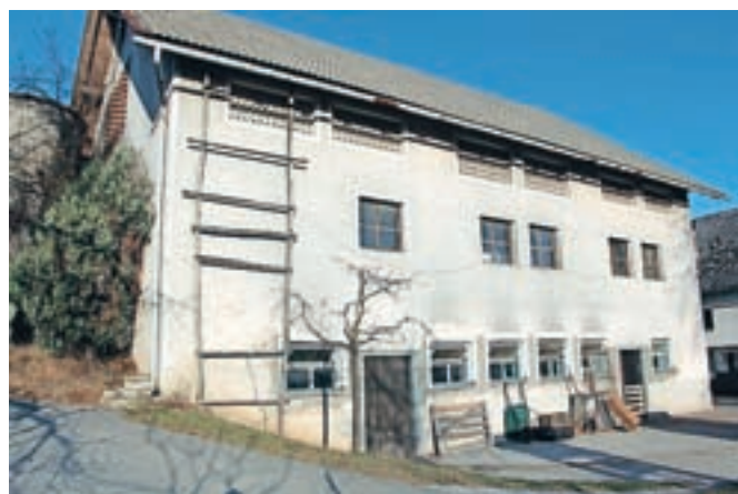
Sedanji hlev je star petdeset let in tehnološko zastarel, radi bi zgradili sodobnega za 40 goved, a časi za takšne naložbe niso najbolj naklonjeni.