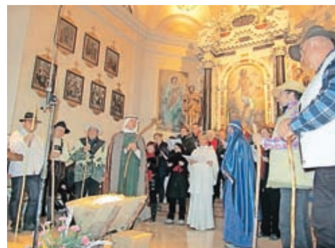
Pevke in pevci iz Kamne Gorice med spevoigro Slovenski božič

Poslušalkam in poslušalcem slovenskega programa avstrijske radiotelevizije ORF je na božični večer v slovenščini voščil krški oziroma celovski škof Alois Schwarz. Po radiu je voščil tudi koroški evangeličanski škof Manfred Sauer.