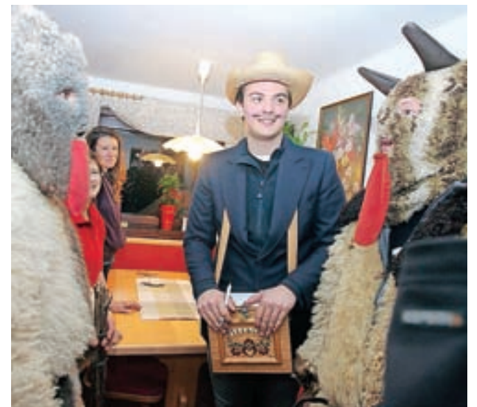
Mer (župan) je med otepanci tisti, ki skrbi za »računovodstvo«.