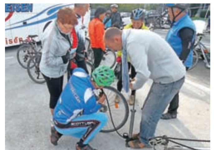
Tudi na takšne dogodke smo pripravljeni.