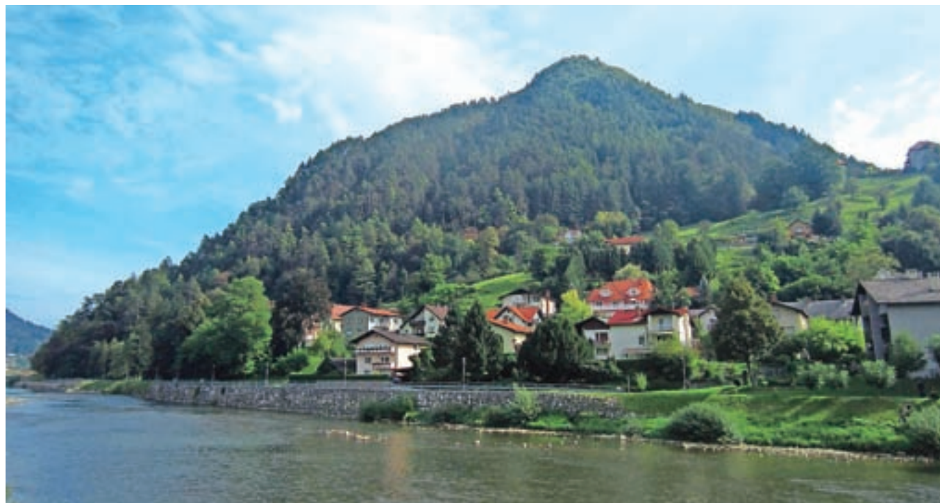
Pogled na Hum s sprehajalne poti ob Savinji

Ruj več kot lepo popestri pestro čudovito floro na Humu.