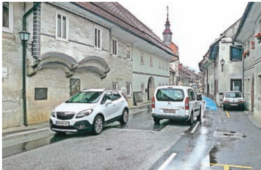
Spodnji trg naj ostane odprt za promet, zahtevajo člani nove civilne iniciative.