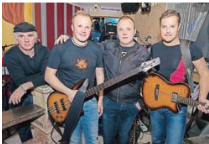
Skupina Calypso je predstavila videospot za najnovejšo skladbo Skok v morje.