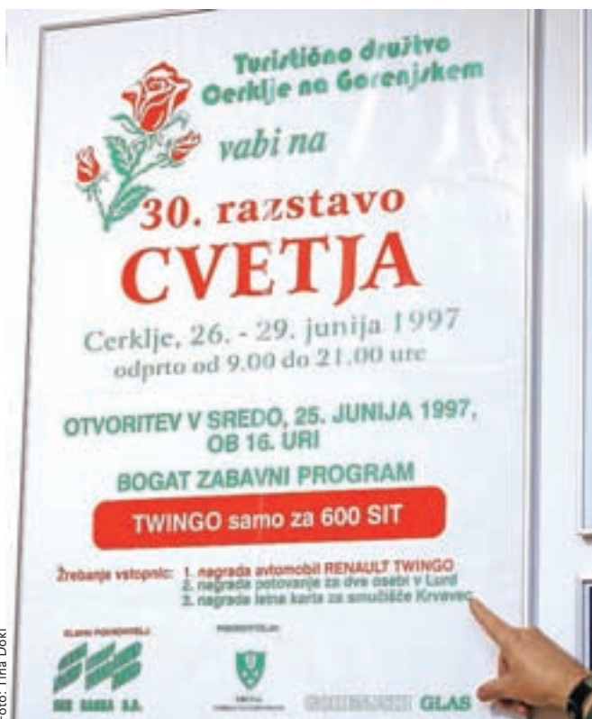
Takole so z bogatimi nagradami za izžrebane vstopnice pred skoraj dvajsetimi leti vabili na razstavo cvetja v Cerkljah.