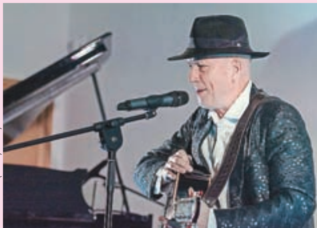
»Če bi midva se kdaj srečala ...«

Šenčur, Železniki – Zimzeleni kantavtor Vlado Kreslin bo ta petek, 21. oktobra, z Malimi bogovi nastopil na humanitarnem koncertu v Šenčurju, dan kasneje pa bo moč uživati na njegovem solističnem nastopu v Železnikih. Rdeči križ Slovenije, Območno združenje Kranj v sodelovanju z Občino Šenčur v petek, 21. oktobra, ob 20. uri v športni dvorani v Šenčurju organizira humanitarni koncert za ljudi v stiski – vsa zbrana sredstva bodo namenili za nakup hrane in plačilo položnic socialno ogroženim. Koncert je vedno dobro sprejet med občinstvom, ki bo tokrat lahko prisluhnilo večnemu Vladu Kreslinu v družbi skupine Mali bogovi. Po številnih uspešnih koncertih pa bo Kreslin po dolgih letih spet nastopil v Železnikih v dvorani Češnjica, in sicer v soboto, 22. oktobra, ob 20. uri. Vlado po navadi nastopa z gosti, tokrat pa bomo lahko поблиže spoznali njegovo intimno plat. Kantavtor in folk-rock glasbenik je svojo glasbeno pot začel daljnega leta 1970, takrat kot bobnar v skupini Apollo. Le kdo ne pozna njegove skladbe Dan neskončnih sanj, s katero je leta 1980 zmagal na Slovenski popevki. Pri aran-