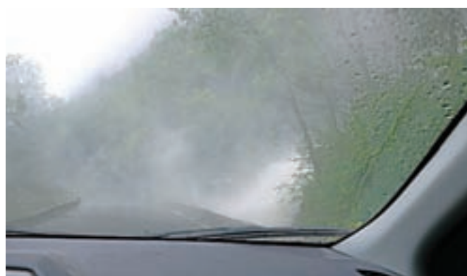
Naj ostanem ali grem – skozi pobesnili hudournik?

Bergna na zahodni obali do Osla krajša, v času visoke zime pa od leta 2000, ko je bil predor zgrajen, tudi edina možna. Na stari cesti čez prelaz zapade toliko snega, da je ta kar nekaj časa neprevozen.