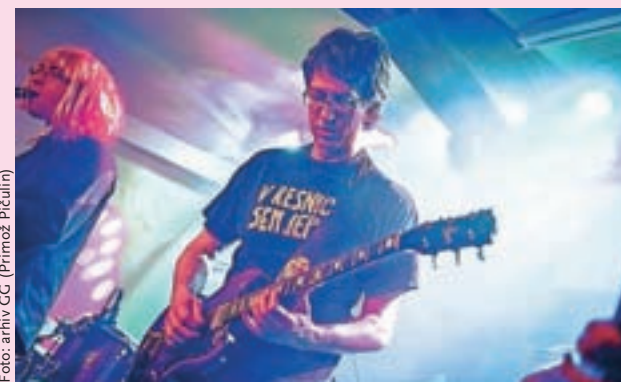
»Dej, nosorog, pazi kam stopaš!« (Zmelkoow)

Škofja Loka – V soboto, 22. oktobra, bo ob 22. uri v Loškem pubu nastopila skupina Zmelkoow s kombinacijo starejših uspešnic in novejšega glasbenega materiala.