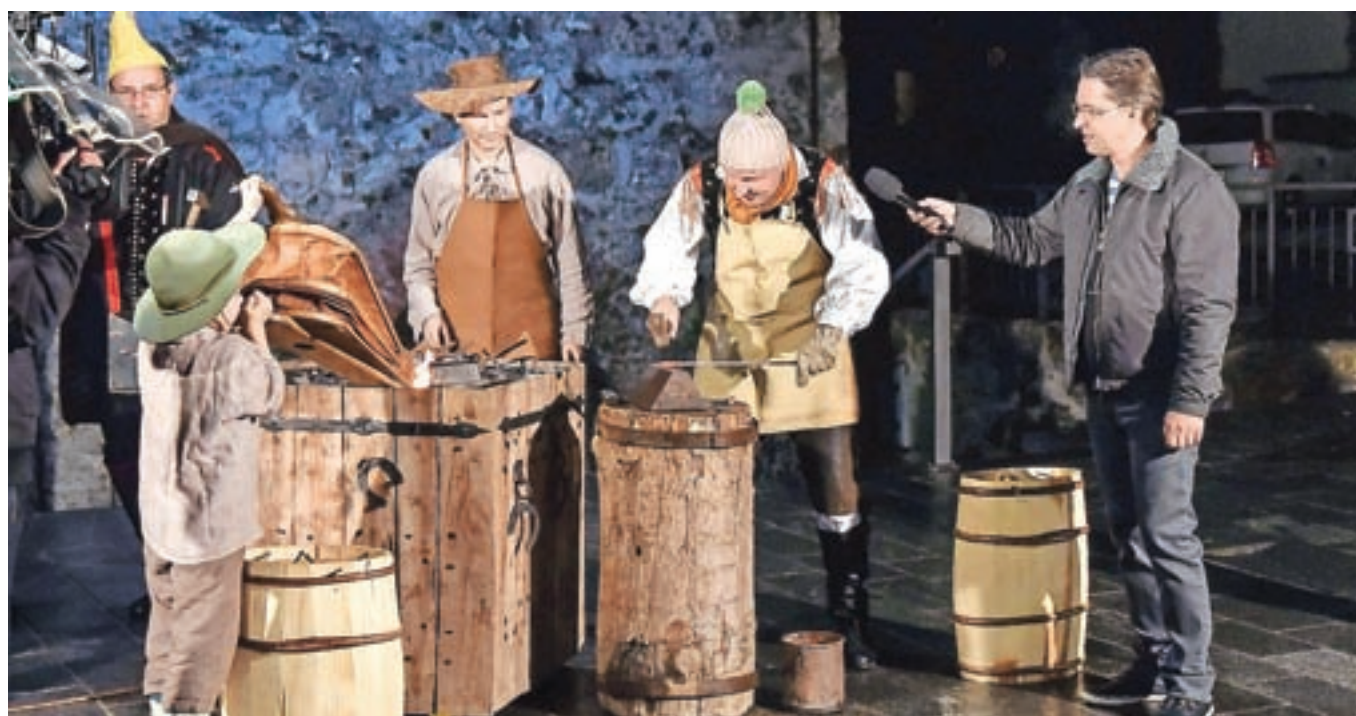
V prvem županovem izzivu je ansambel Slovenski zvoki moral skovati žebelj. / Foto: Andrej Tarfila