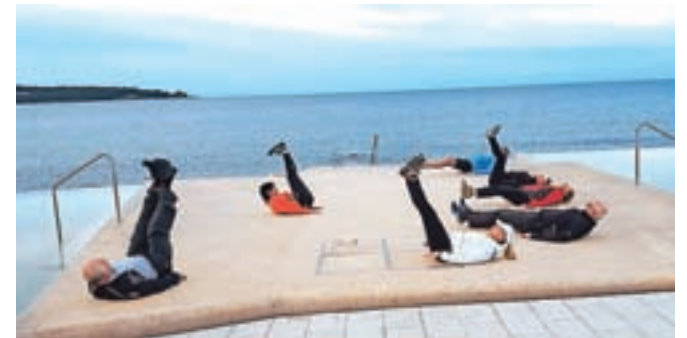
Obvezna jutranja telovadba ob morju

Izbrali smo kar najbližji Grožnjan. Makadamska pot in strm klanec sta nam vzela nekaj moči, a smo jo nadoknadili med počitkom in sedenjem na soncu na eni izmed mnogih teras v mestu. Grožnjan je danes znan kot mesto umetnikov. Med