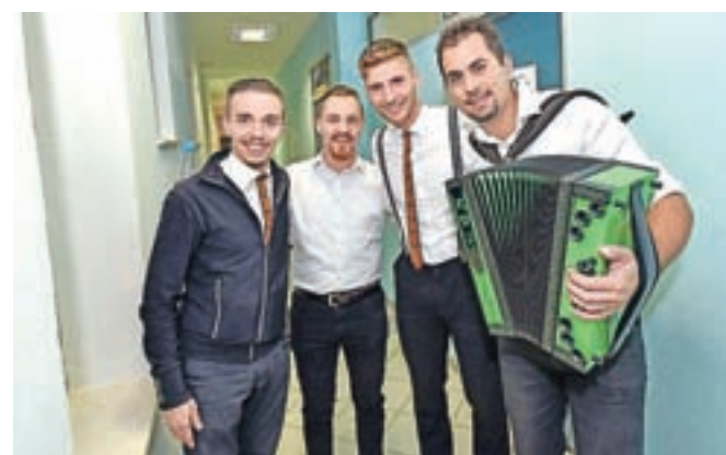
V Železnikih so nastopili tudi Raubarji iz sosednje, Poljanske doline.