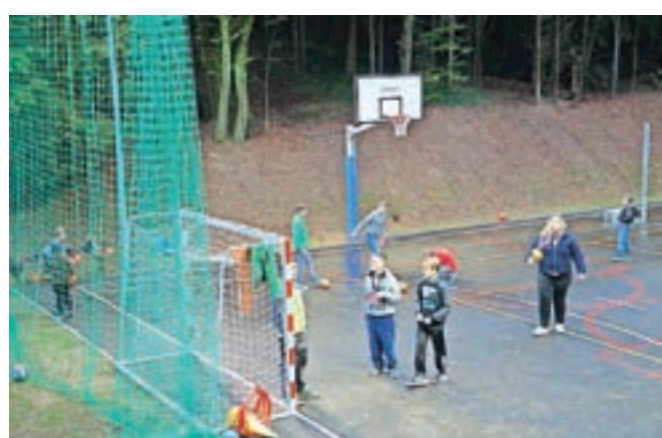
Obnovljeno športno središče Strahovica je zaživelo v novi podobi.

preplastitve igrišča v širini 16 in dolžini 30 metrov z asfaltom in lovilnih ograj obsegala tudi obnovo balinarskih stez, v gozdno jaso nad igriščem pa so umestili novo vadbišče za fitness. Sočasno so poskrbeli tudi za ureditev dostopnih cest in poti, stopnic ter dvorišča ob koči. Občina vodice je pridobila 25 tisoč evrov nepovratnih sredstev od Fundacije za šport, preostalih 48 tisočakov pa je zagotovila iz občinskega proračuna.