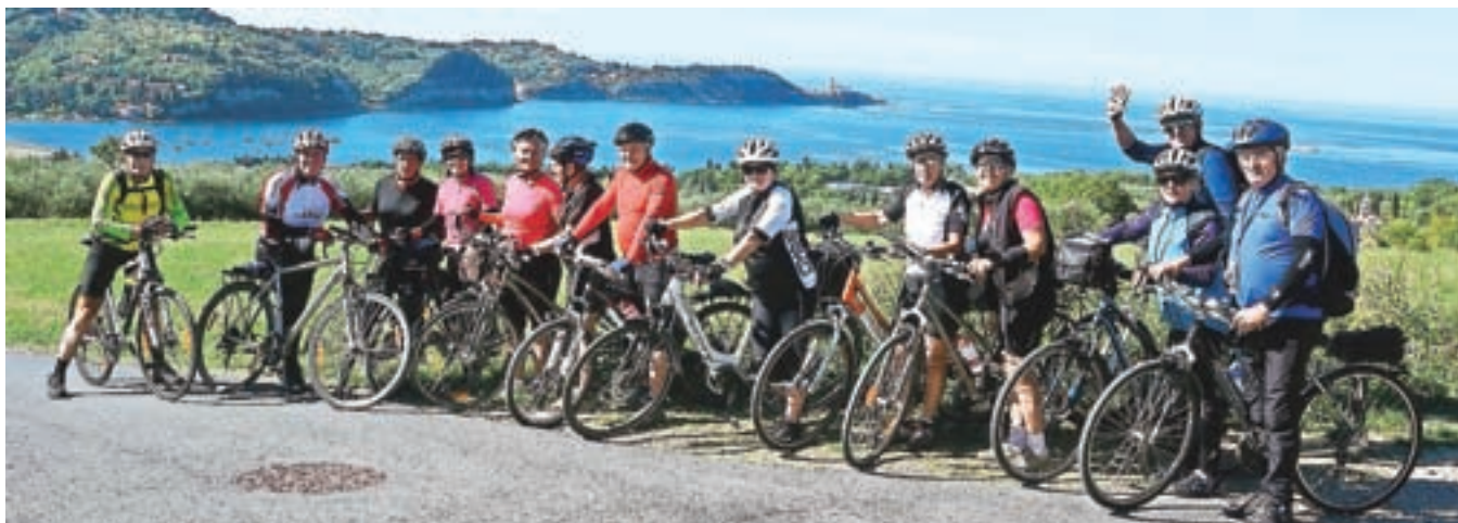
Naša skupina nad Strunjanom, v ozadju Piran