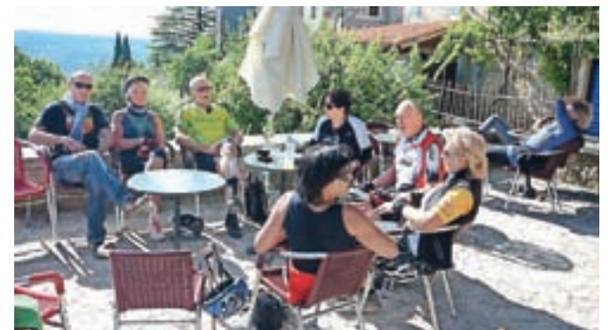
Najlepši del kolesarjenja

obnavljanjem mesta so številne zapuščene hiše preuredili v slikarske ateljeje, galerije in druge objekte, namenjene kulturniški dejavnosti. Tako se v Grožnjaju nahaja dvajset galerij in umetniških ateljev, znana je tudi poletna mednarodna filmska šola. Tudi mi smo si ogledali lepote tega mesta.