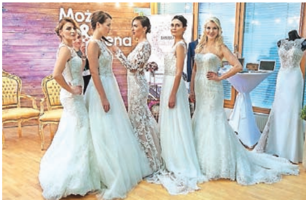
Na Bledu se je odvila tudi prva poročna modna revija v Sloveniji, ki je pokazala smernice za prihajajoče leto.

Vrhunec obeh dni, ki sta postregla tudi z bogatim spremljevalnim programom, je bila prva modna revija poročnih oblek v Sloveniji za prihajajoče leto, za katero so poskrbeli v salonu Sanjska obleka. Kot smo izvedeli, trendi narekujejo predvsem zgoraj prosojne in delno zaprte čipkaste obleke, obleke v kombinaciji bež čipke na podlagi v barvi šampanjca in nežne rožnate