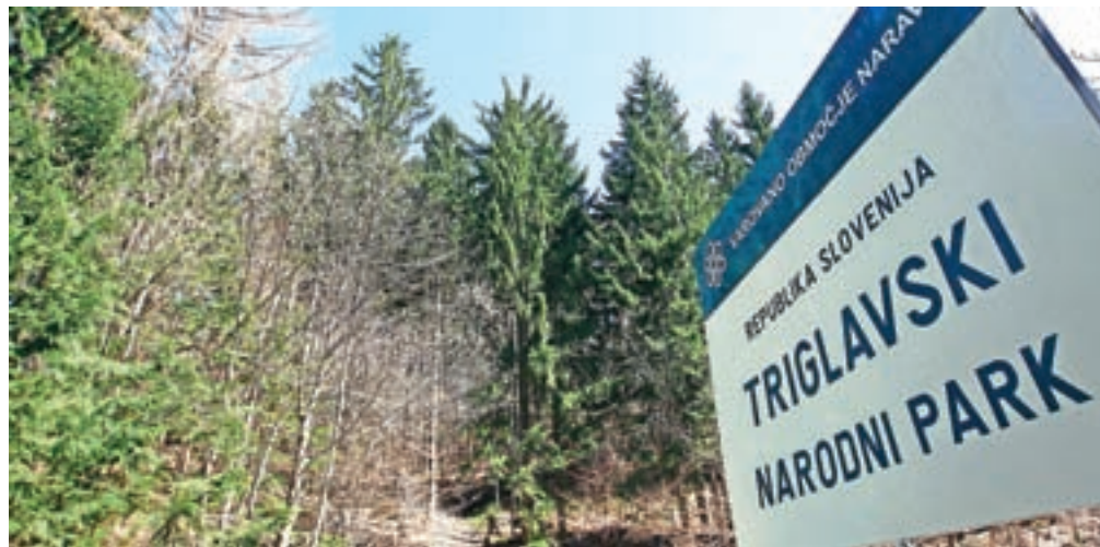
Pretežen del nepremičnin, o katerih še niso odločili, je na območju Triglavskega narodnega parka.

Na področju denacionalizacije kmetijskih zemljišč, gozdov in kmetijskih gospodarstev je bil po besedah Dušanke Dubljevič z Upravne enote Radovljica najboljše in najzahtevnejši prav zahtevek Nadškofije Ljubljana, pri katerem morajo odločiti le še o delu premoženja. »Ta zadeva se zaradi