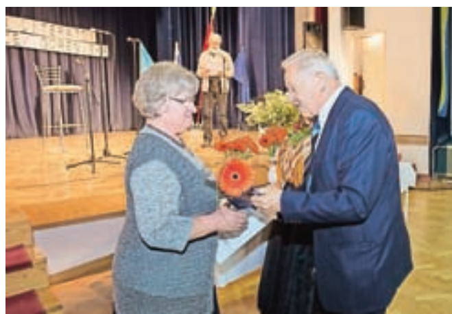
Čestitke in cvet literarnim ustvarjalcem na literarnem srečanju gorenjskih upokoencev