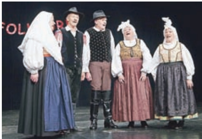
Pevci skupine Klasje