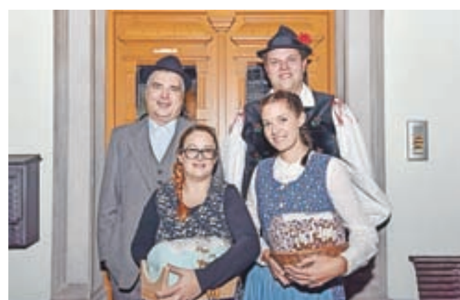
Predstavili so tudi bogato klekljarsko tradicijo. / Foto: Andrej Tarfila