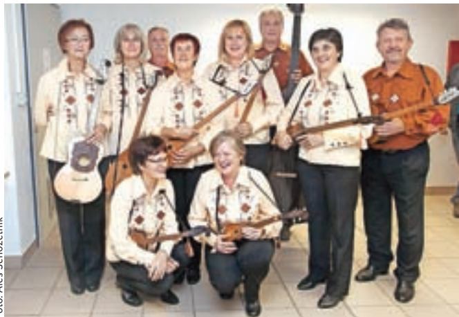
Člani Tamburaške veteranske skupine Bisernica iz Reteč