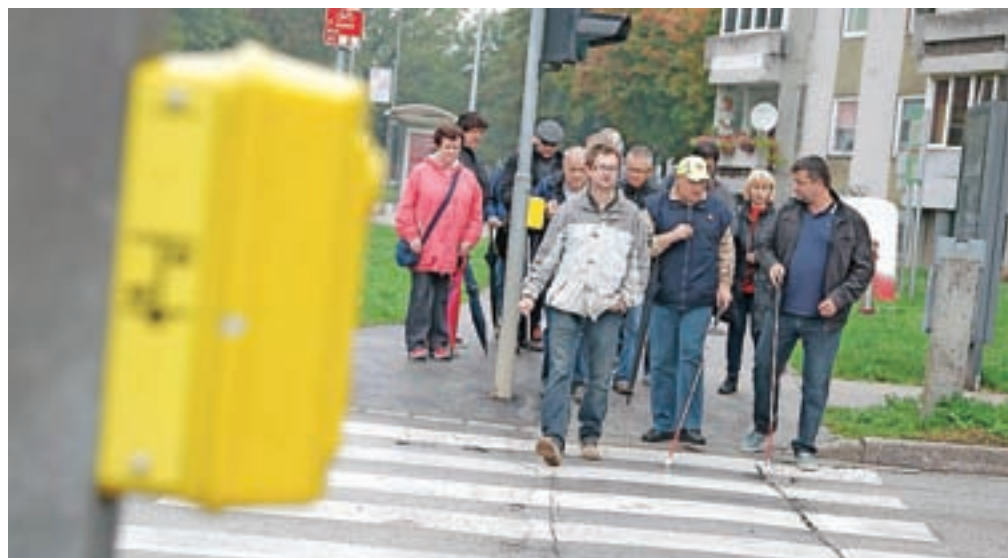
Zvočni semafor z oznako križišča