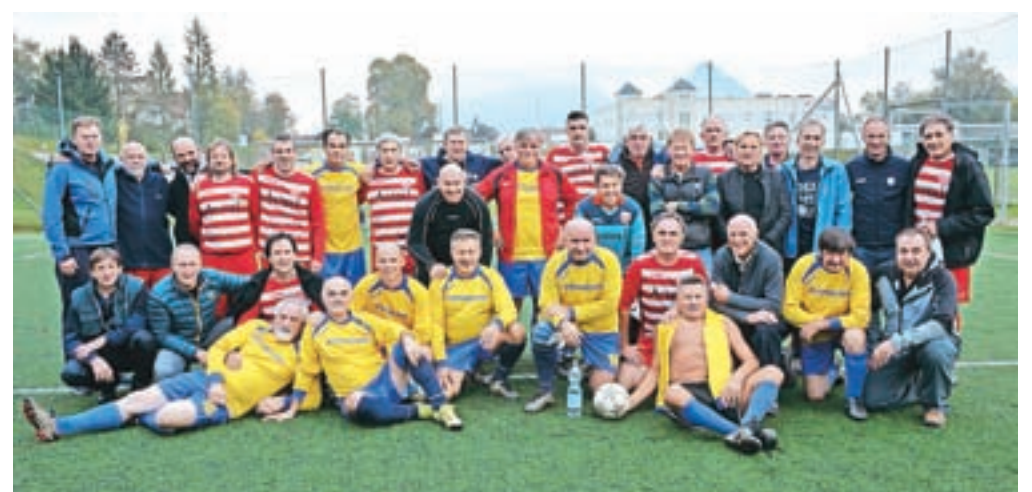
Tri ekipe iz treh držav – vsi starejši od petdeset let

Medvoščani so prvo tekmo igrali z Italijani in remizirali z 1 : 1, enak rezultat je bil na drugi tekmi s Hrvaši pa tudi na srečanju obeh gostujočih ekip.