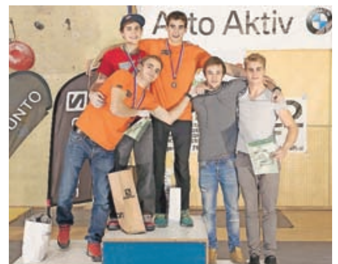
Najboljših pet članov na državnem prvenstvu v Tržiču

Vsekakor se na zaključku v Kranju, na že 21. finalni tekmi svetovnega pokala v težavnostnem plezanju, obeta pravi plezalni praznik. Za slovenske plezalce je letošnja sezona najuspešnejša doslej. Vstopnice bodo v prodaji od 20. oktobra.