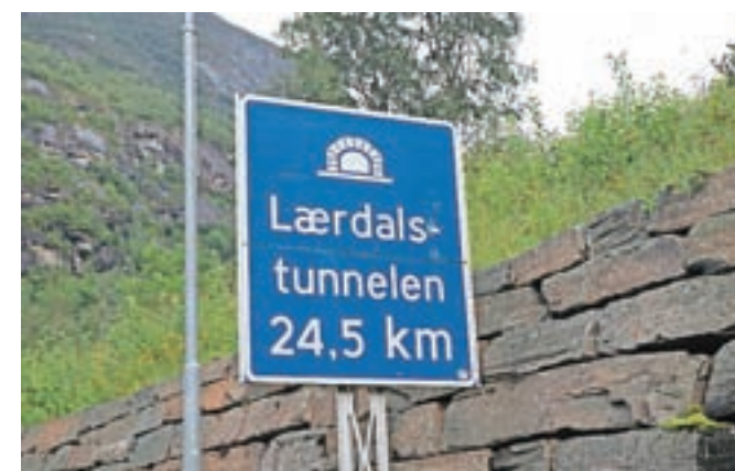
Kranj–Ljubljana ali dvajset minut brez dnevne svetlobe

vožnje razbijeta dve razširitvi, kjer je moč ustaviti, seveda pa ne parkirati. Močna modra svetloba nekoliko razvedri, saj je vse skupaj videti kot v kakšni diskoteki. Z nekaj poguma je bila tako pot iz