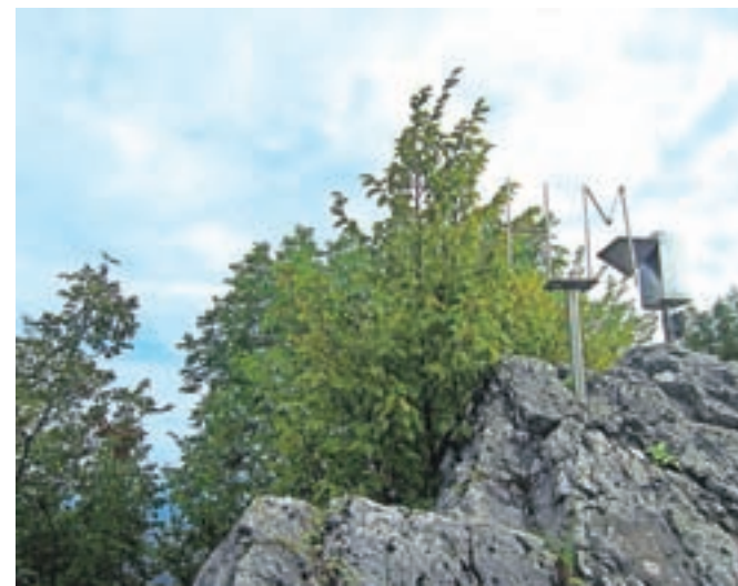
Vrh Huma

vzpenja v okljukih, v pomoč so celo stopnice, nas pripelje do lepega razgledišča, do Prižnice, malce višje pa je prepadna udornina Divji farovž. Zanimivo ime. Pot kmalu zavije na jugozahodno stran in se prečno povzpne s pomočjo jeklenice do križa, ki so ga Laščani postavili leta 1991. Nekaj korakov naprej smo pod vršnimi skalami, kjer je pot zavarovana z jeklenico. Na vrhu, kjer je napis Hum z vpisno skrinjico, se nam odpre razgled na okolico Laškega. Za sestop izberemo pot po vzhodnem grebenu. Že