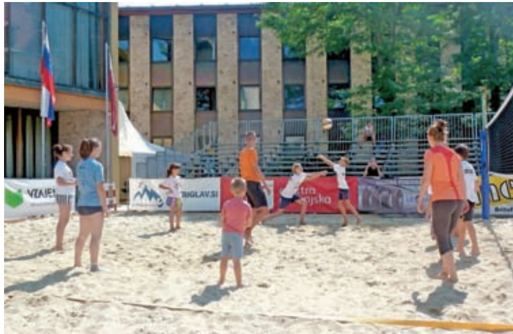
Te dni so se na igrišču pred občinsko stavbo v Kranju zbirali mladi in rekreativci, danes in jutri pa bodo na vrsti tudi obračuni državnega prvenstva v odbojki na mivki.

»Odbojka na mivki je zelo dobra osnova za tehniko in taktiko odbojke v dvorani in hkrati priprava za dvoransko sezono. Zato v klubu mlade spodbujamo, da čim prej začnejo z igranjem. Zanje je to zanimivo in odbojka na mivki je postala del klubskega življenja. Naš klub tudi že tradicionalno pripravljala državno prvenstvo v odbojki na mivki in ob lanskem tekmovanju, ko smo pred občinsko stavbo znova postavili igrišče, nam je župan predlagal, naj pripeljano mivko in igrišče še bolje izkoristimo. Odločili smo se, da letos ne bomo pripravili zgolj rekreativnega turnirja in državnega prvenstva, pač pa smo poskrbeli za več dogodkov, ki smo jih poimenovali