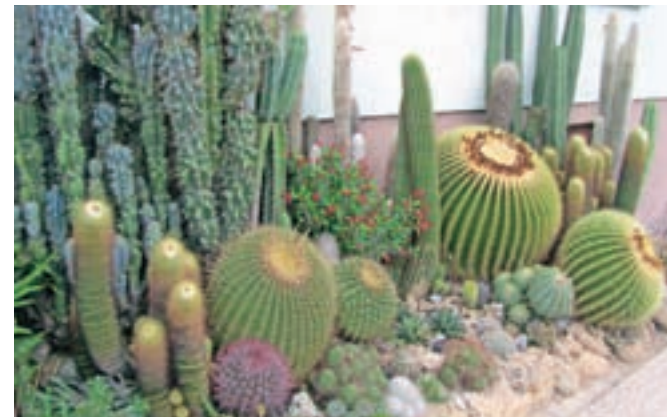
Kaktusi pred Praprotnikovo domačijo v Kovorju

je spoznaval v ljubljanskem društvu ljubiteljev kaktusov, v katerem so člani izmenjevali izkušnje in tudi semena. Znanje je potem na osnovi izkušenj bogatil in danes je zanj skrb za te rastline nekaj povsem vsakdanjega. Običajno jih zaliva enkrat na teden. Pozimi zalivanje ni potrebno. Le pokriti jih je treba, da jih ne poškoduje zmrzal. Kaktusi so še posebej lepi, ko cvetijo. Cvetovi se pojavljajo skozi celo leto, celo pozimi, ko je kaktusov cvet nekaj posebnega! Ključ do uspešnega gojenja kaktusov nista le znanje in potrpežljivost, ampak tudi ljubezen do cvetja. Tega pa pri Praprotnikovih ne manjka.