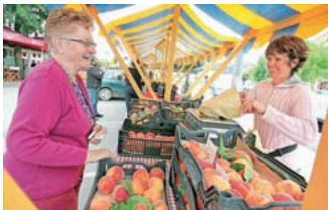
V Šenčurju tudi ponudba iz Brd

mini tržnico pripeljati čim več proizvajalcev domačih pridelkov. Uspeha ne gre pričakovati takoj, sčasoma pa vendarle lahko pričakujemo, da bo tržnica zaživela v polni meri,« je bil spodbuden župan. »Želeli bi, da tu prodajajo svoje proizvode predvsem domači kmetje, saj vemo, kako težko je spraviti te pridelke na trg. Sedaj odziv še ni zadosten, a naj jih spodbudimo, naj jim ne bo neprijetno nastopiti na domači tržnici. S ponudbo sem zadovoljen, veseli pa me tudi, da tržnico vsakokrat popestrita tudi dve domači društvi, Društvo ljubiteljev vin in Turistično društvo Šenčur, kar je sicer na tržnicah redka praksa.«