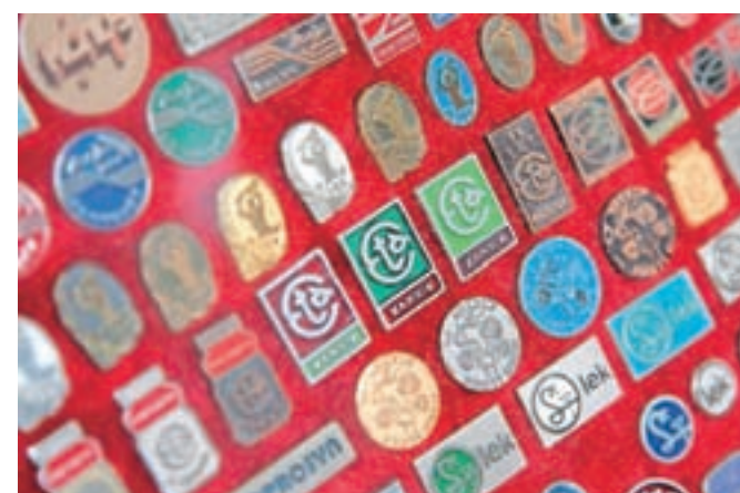
Značke sta izdajala tudi kamniška Eta in Titan.

»Ljudem sem želel pokazati, da so značke moje