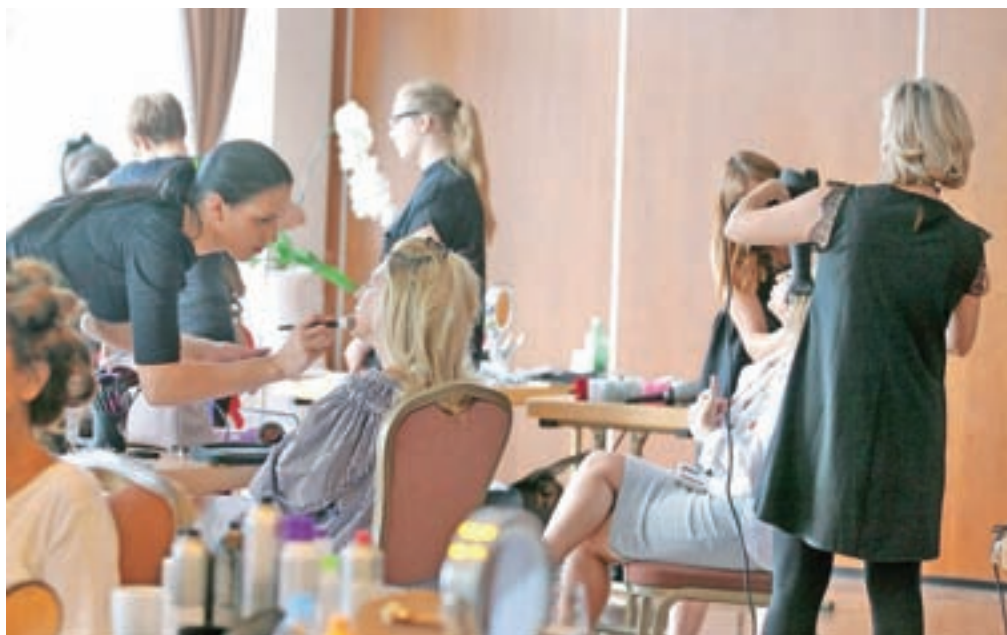
Kongresno dvorano v Grand Hotelu Toplice so spremenili v lepotilni salon.