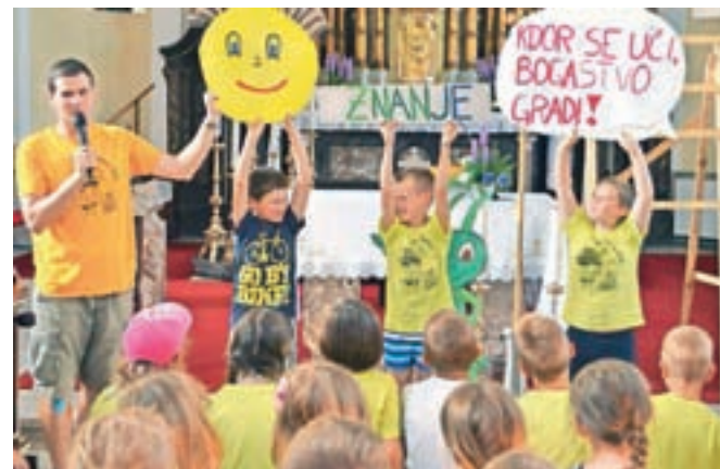
Oratorij je kot vedno potekal v zabavno-poučnem duhu.

Vsak oratorijski dan so tako animatorji v vlogi igralcev predstavili otrokom poučno, predvsem pa življenjsko zgodbo glavnega junaka. Poleg učenja za življenje so v sedmih dneh potekale