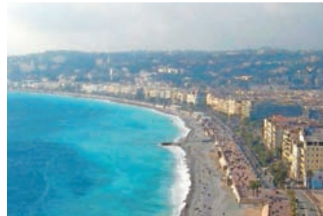
Slovita Angleška promenada (Promenade des Anglais) v Nici, kjer se je zgodil najbolj odmevni teroristični napad v zadnjem času.