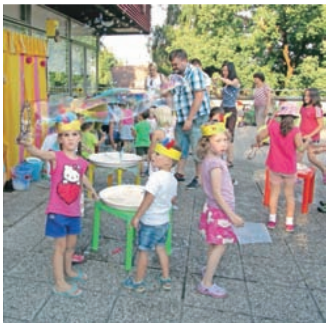
Ob koncu prve sezone Družinskega branja so se mladi bralci zabavali v tovarni mehurčkov.