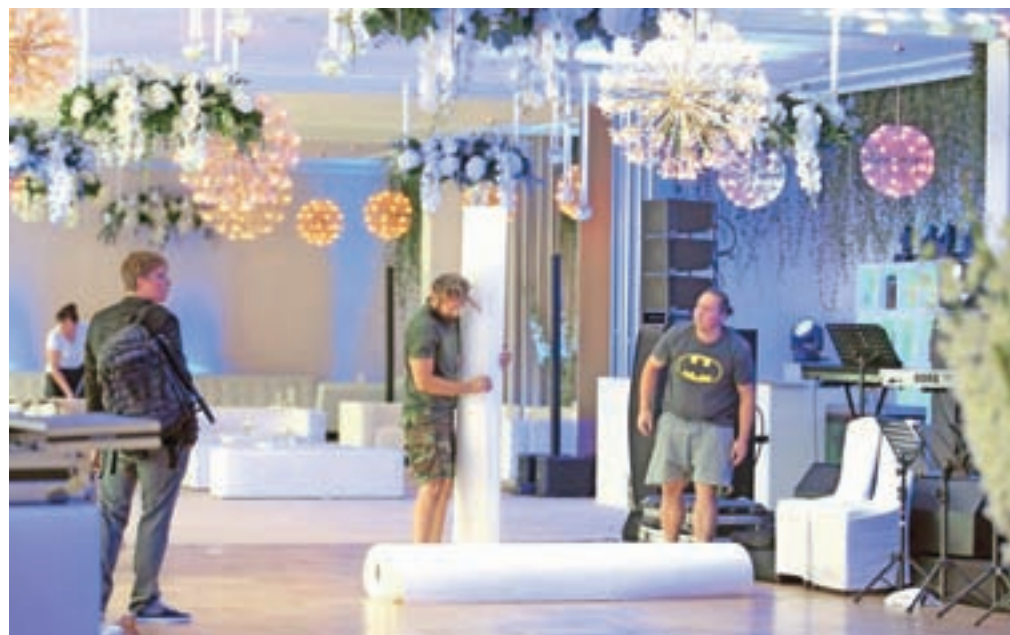
Za potrebe poročnega slavlja so povsem preuredili hotelsko jedilnico.