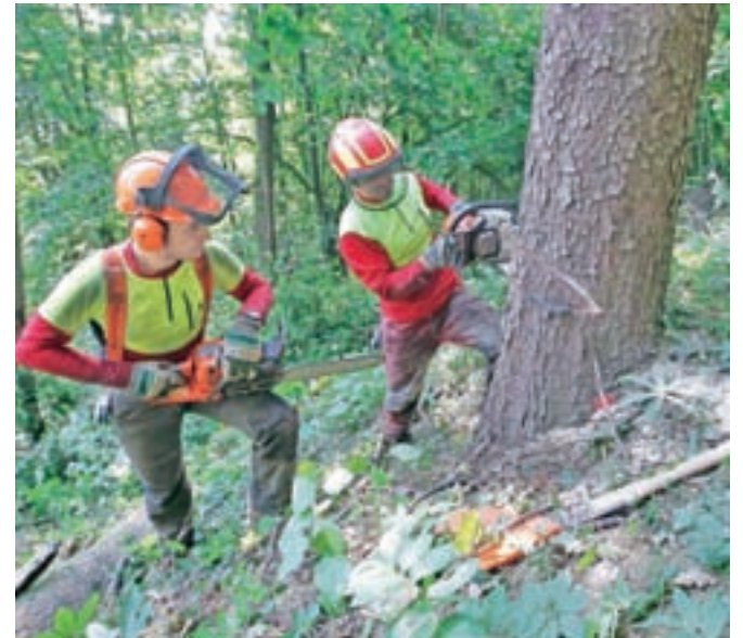
Na Šmarjetni gori je za posek evidentiranih petsto kubičnih metrov lesa.

»Tudi na območju blejske enote zavoda za gozdove je lubadarja zelo veliko, še več