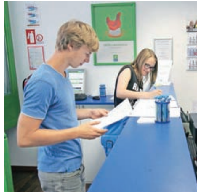
Povpraševanje mladih po prostih delih se med poletnimi počitnicami poveča za kar šestdeset odstotkov.

Prek E-študentskega servisa v poletnem času dela okoli 40 tisoč dijakov in študentov; povprečna urna postavka v Sloveniji znaša 5,18 evra bruto, na Gorenjskem pa 4,9 evra bruto.