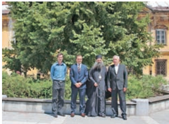
Obisk zagrebško-ljubljanskega metropolita Porfirije Perića na Stari Savi

Jesenice je v iskanju lokacije za bogoslužje pravoslavnih vernikov obiskal zagrebško-ljubljanski metropolit Porfirije Perić.