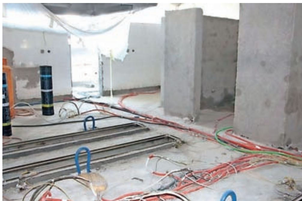
V Osnovni šoli Matije Čopa, kjer prenavljajo kuhinjo, so se dela začela takoj po zaključku pouka.

Največje gradbišče je v Vrtcu Čirče, kjer bosta prostor dobila dva nova oddelka otrok, kar pomeni dvakrat po okoli 80 kvadratnih metrov prostorov v nadstropju, vključno z dvigalom. Obnavljajo tudi obstoječih 40 kvadratnih metrov v pritličju. Vrednost del znaša skoraj 240 tisoč evrov.