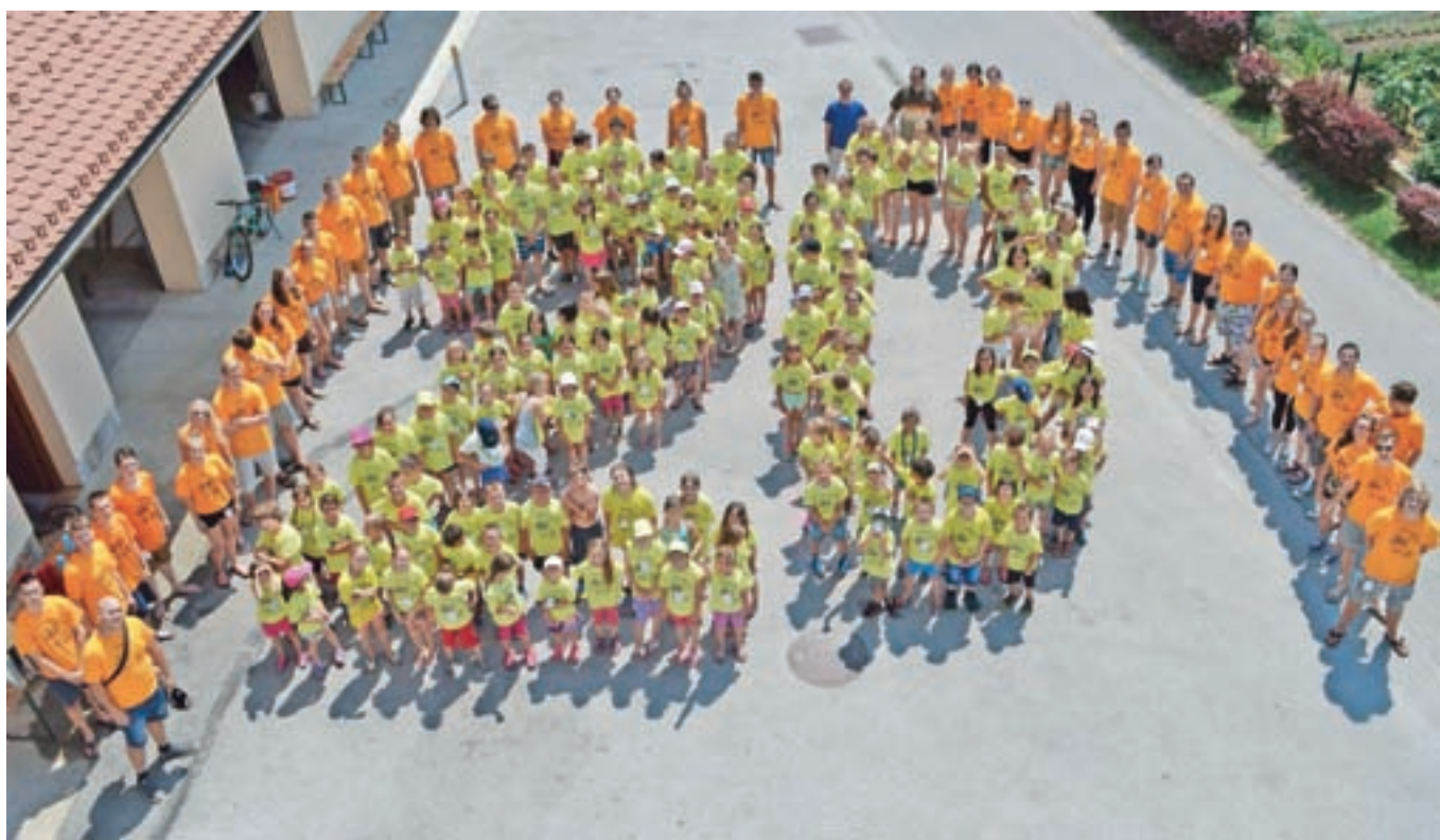
Jubilejna dvajsetica: otroci in animatorji letošnjega oratorija v Šenčurju