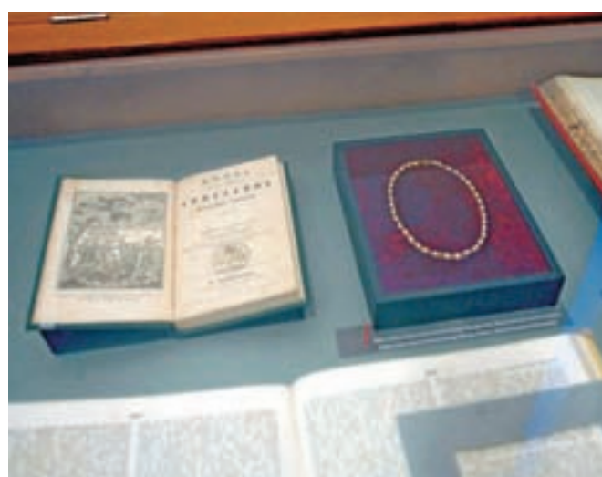
Ogrlica prve Slovenke v ZDA Antonije Baraga, sestre misijonarja Friderika Barage