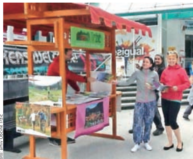
Nova informacijska točka na Ljubelju je dobro obiskana.

V mesecu juniju in juliju se je v TPIC Tržič, ki je odprto po poletnem delovnem času,