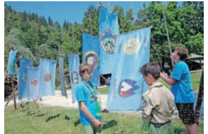
Na Bohinjski Beli so se zbrali taborniki iz vseh desetih gorenjskih rodov, na kar opozarjajo tudi zastave ob vходу v tabor.