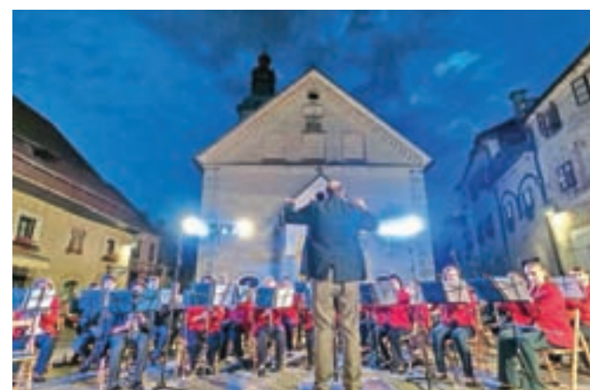
Na Cankarjevem trgu je v sredo nastopilo 120 ameriških glasbenikov.

Škofja Loka – Škofjeločani in obiskovalci so bili v sredo zvečer deležni izjemnega glasbenega dogodka na prostem. V okviru turneje Red Tour je namreč v Škofji Loki gostovalo 120 glasbenikov. Na Cankarjevem trgu, ki je po obnovi postal lepo prizorišče različnih kulturnih dogodkov, so nastopili simfonični orkester, džezovska zasedba, komorni godalni orkester in pevski zbor. Organizatorje je razveselilo lepo vreme, saj bi morali sicer koncert uprizoriti v Sokolskem domu, kjer pa glasbenih užitkov ne bi bilo deležnih toliko ljudi, kot jih je bilo na prostem.