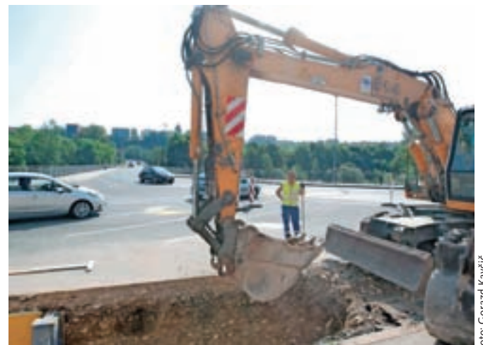
Ta teden se je gradnja krožišča že začela.

Izvajalec del je Gorenjska gradbena družba, vrednost del znaša 44.651,46 evra. Dela bodo zaključena predvidoma do konca avgusta.