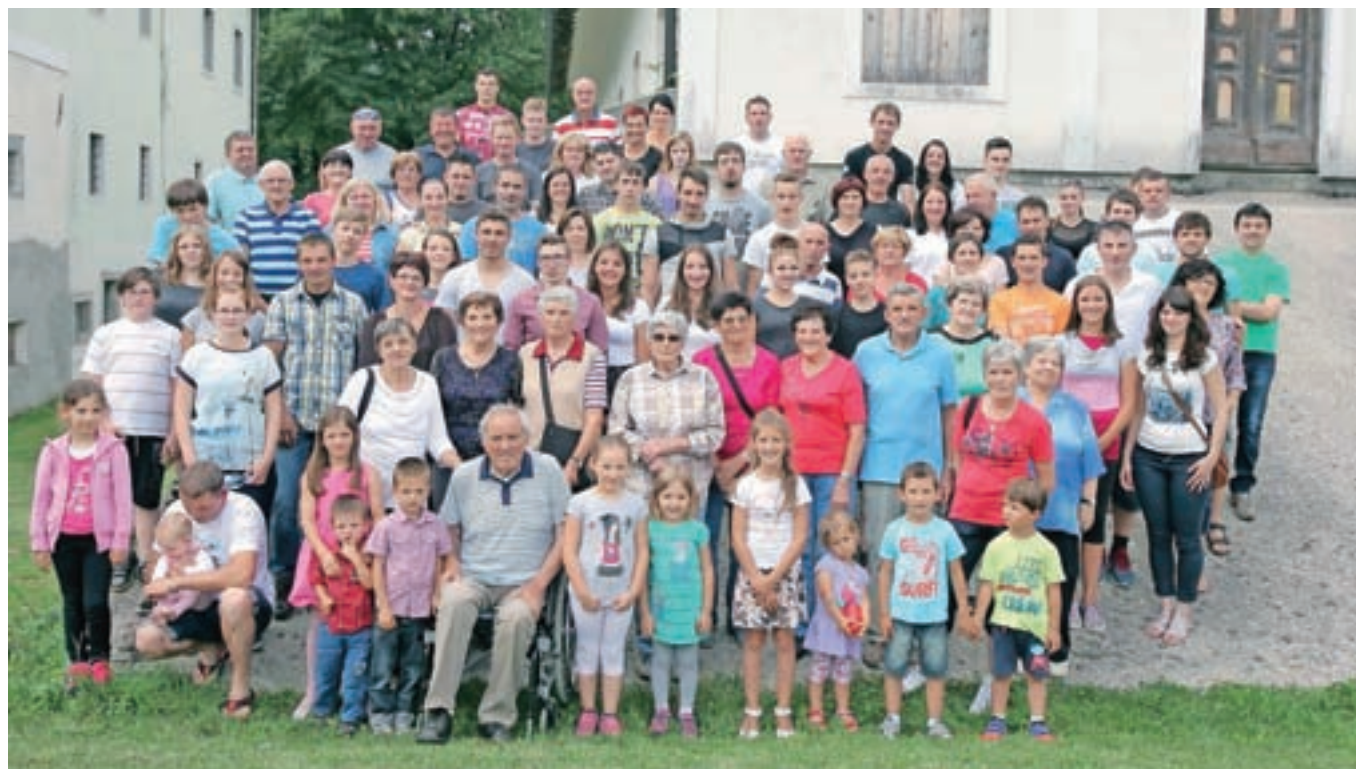
Srečanja Belajčevih se je udeležilo kar lepo število povabljenih.

Tokratno srečanje je bilo za Mici pravo presenečenje, tako da si bo letošnji obisk zagotovo zapomnila tudi po njem.