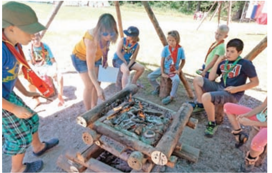
Taborniki ves čas pazljivo bdijo nad »večnim ognjem«, da jim ne bi ugasnil in bi morali domov.