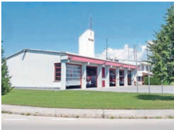
Lokacija Centra za zaščito in reševanje Domžale ostaja pri tovarni Helios na Količevem.