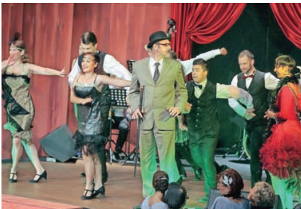
Komičnih zapletov in situacij, plesa in petja v Charleyjevi teti ne manjka.

Za komedijo se je Stražar odločil, ker je dram že tako