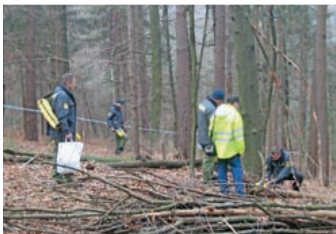
Policija je ta teden pojasnila, da v strmoglavljenem nemškem letalu ni bilo kovčka, polnega evrov (slika je simbolična).