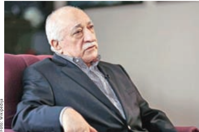
Muhammed Fethullah Gülen (1941), turški pisatelj, bivši imam, pridigar in islamski mnenjski voditelj, ki živi v ZDA in naj bi bil po Erdoganu njegov glavni nasprotnik.

»Volitve pripadajo ljudem. Njihova odločitev je. Če se odločijo obrniti s hrbtom proti ognju in si opeči zadnjice, bodo pač morali sedeti na lastnih opeklinah.« To je svoj čas izjavil Abraham Lincoln (1809–1865), 16. predsednik ZDA. Velja tudi za letošnje volitve 45. predsednika?