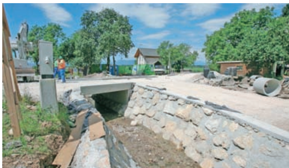
Končujejo se dela v še zadnji vasi na severu občine Šenčur

»Gre za povsem občinsko investicijo, ki jo moramo financirati sami. Z Olševkom pa končujemo investicijo na severnem delu občine, v prihodnje bo na vrsti tudi komunalna ureditev južnega dela, najprej čistilna naprava v Trbojah,« pravi župan Ciril Kozjek.