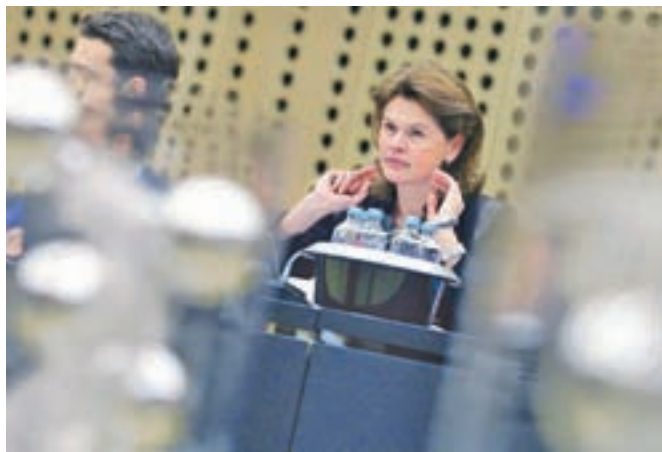
Nekdanja premierka Alenka Bratušek ugotavlja, da je Sodišče EU potrdilo, da so pri razlastitvi imetnikov podrejenih obveznosti v podržavljenih bankah ravnali skladno s pravili Evropske komisije.