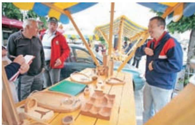
Svoje izdelke je ponudil domači rezbar.