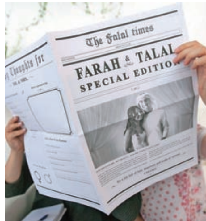
Goste je na mizah pričakal tudi izvod časopisa The Falal times, posvečen ženinu in nevesti.