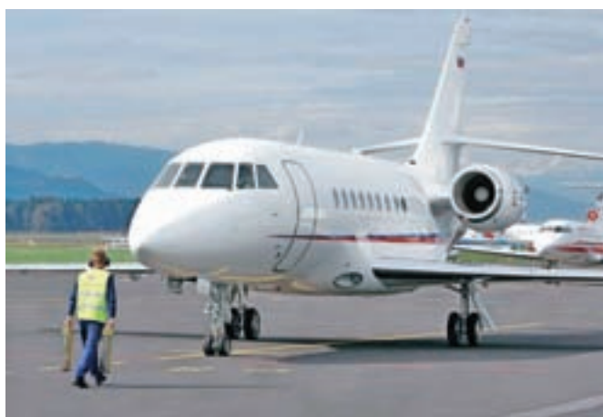
S falconom so letos v Slovenijo iz tujine prepeljali že pet organov za presaditev.