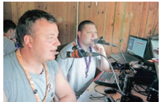
Ves čas tabora na frekvenci 90,8 megaherca oddaja Goot radio.

pri čemer jim bosta dva večera popestrila prevajalec in stand up komik Boštjan