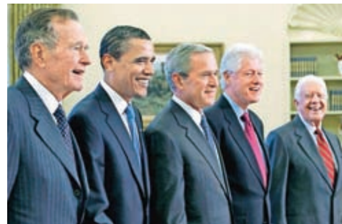
Še živijo predsedniki ZDA. Z leve: George H. W. Bush, Barack Obama, George W. Bush, Bill Clinton in Jimmy Carter v Beli hiši 7. 1. 2009.