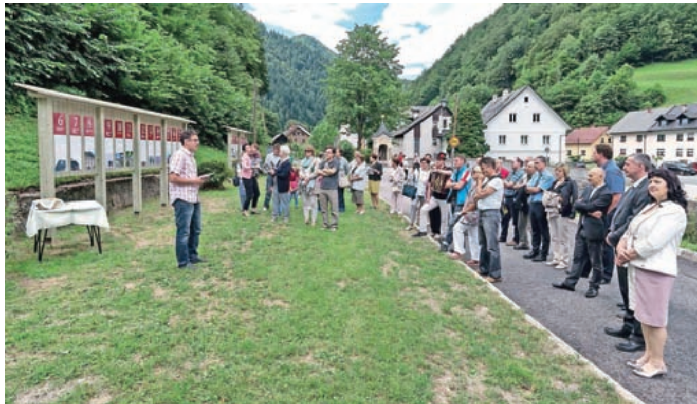
Park s tablami, ki opisujejo železnikarske znamenitosti, so odprli v sklopu nedavnih Čipkarskih dnevov.

Pri mostu na Klovžah v Železnikih so odprli park s predstavitvenimi tablami, na katerih so opisane znamenitosti v starem delu mesta, ki jih povezuje fužinarsko-kovaška pot.