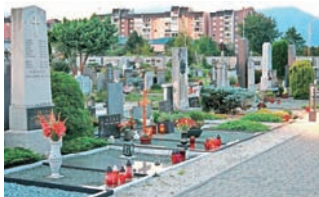
Pogrebna dejavnost naj po mnenju državnih svetnikov ostane v javnem interesu.

Večina državnih svetnikov, ki je ta teden izglasovala odločilni veto, je prepričanih, da je organiziranje opravljanja pokopališke in pogrebne dejavnosti v skladu z veljavno zakonodajo, zakonom o lokalni samoupravi, v izvorni pristojnosti lokalnih skupnosti, ministrstvo za gospodarstvo pa je vanj poseglo brez resne predhodne analize. Zakon bo šel v ponovno odločanje najverjetneje na prvi jesenski seji državnega zbora, za njegovo sprejetje pa bo potrebna absolutna večina.