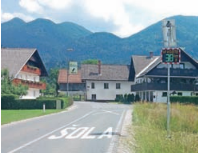
Prikazovalnik hitrosti na Savski cesti v Bohinjski Bistrici