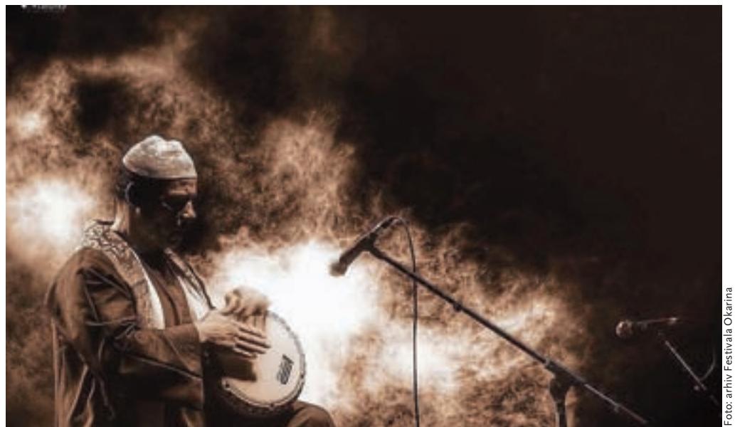
Letošnje Okarino bo v torek odprl zanimiv egiptovski sestav Egyptian Project.

bo nastopila francosko-italijanska skupina Ve-Zou-Via. Pol skupine tvorijo Italijanke iz Neaplja, pol pa Francozi iz Marseilla. O njihovi glasbi pa so zapisali, da gre za nebrzdano orgijo prepričljivo strastnih glasov v harmoniji s tamburicami in divjimi uličnimi zabavami. Desetčlansko zasedbo so sestavili posebej za tokratni nastop ... in kasneje mogoče še kakšnega. Festival Okarina se bo zaključil 7. avgusta s koncertom turške zasedbe Baba Zula. Njihove predstave so mešanica več umetno-