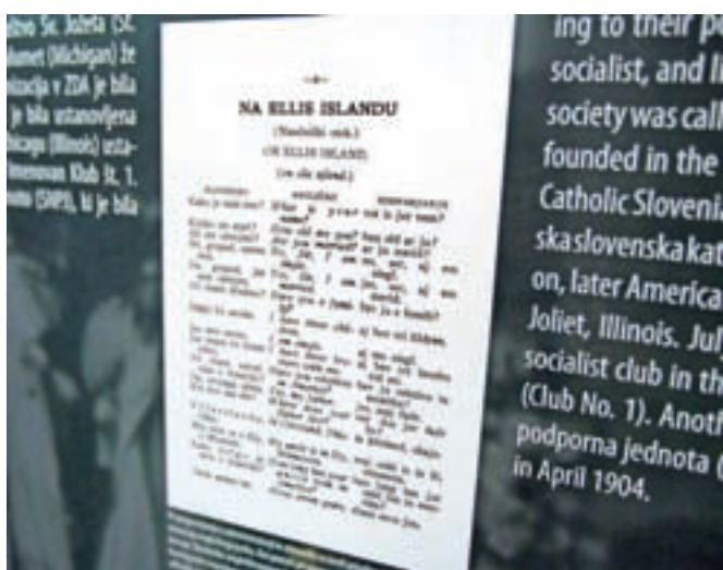
Ko je slovenska mati s tremi otroki prišla na Ellis Island, je, kot piše v priložnem, rekla: »Aj hev tri čildren.«