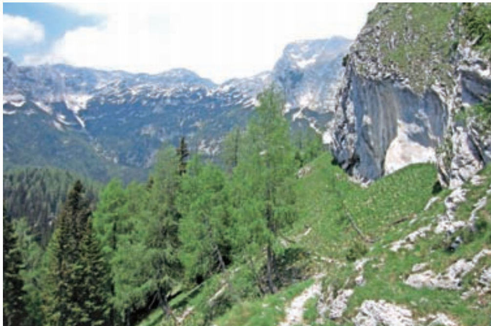
Pot na Ograde pod barvitimi skalami