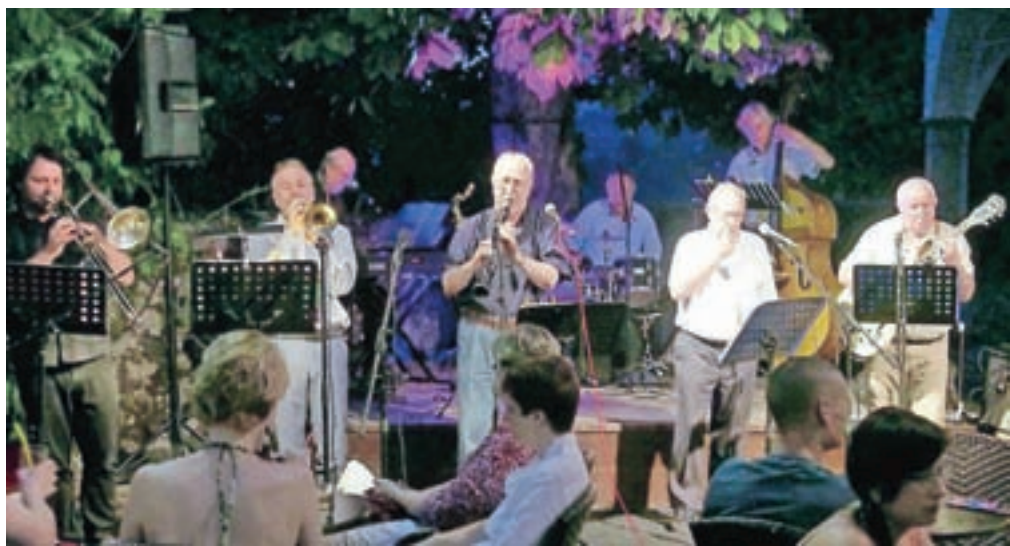
V petek na poletno teraso na Pungertu ponovno pridejo Stari mački.