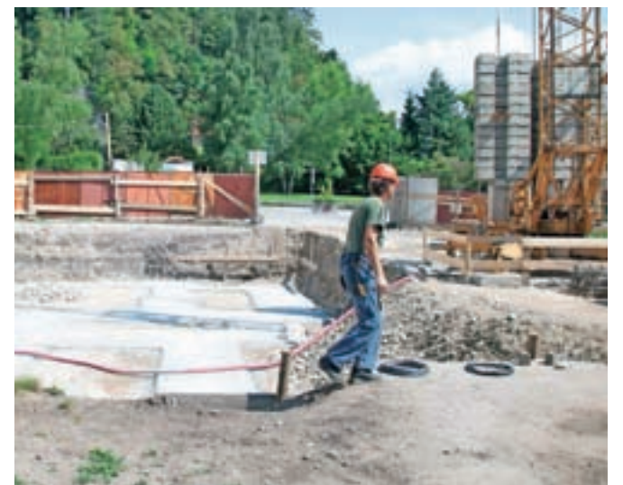
Ta teden so stekla dela za izgradnjo vzhodnega prizidka Osnovne šole Mengeš.

Mengeš – S podpisom pogodbe med Občino Mengeš in izvajalcem del, podjetjem SGP Graditelj, so ta teden stekla dela za izgradnjo vzhodnega prizidka Osnovne šole Mengeš. Vrednost investicije brez DDV je dobrih 520 tisoč evrov, izgradnja objekta, s katerim rešujejo prostorsko stisko v šoli, pa bodo pridobili skupno 826 kvadratnih metrov površin, med drugim tudi šest učilnic in kabinetov.