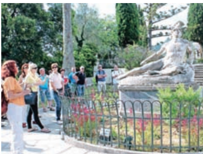
Znameniti kip ranjenega Ahila na vrtu Sissijinega dvorca Achilleion

Potem nekaj malega vožnje in že je bil pred nami