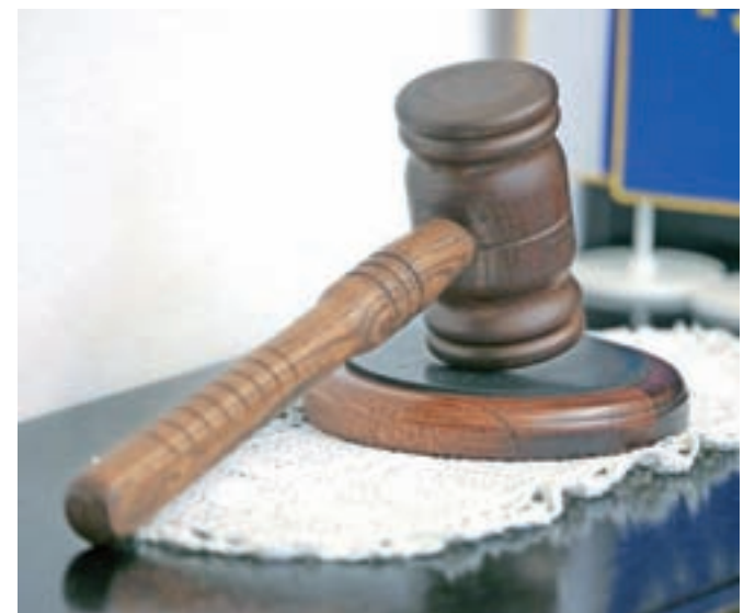
Slovinci od institucij najbolj zaupamo policiji (povprečna ocena 6,3) in zdravstvu (5,8), medtem ko so se sodišča z oceno 4,2 znašla na dnu lestvice, slabše sta se odrezala le vlada in parlament.

Sodelujoči v raziskavi so za izboljšanje delovanja sodstva predlagali pospešitev postopkov in reševanja zadev, reorganizacijo dela in informatizacijo poslovanja, potrebo po spremembah predpisov oziroma postopkov ter spremembe, ki