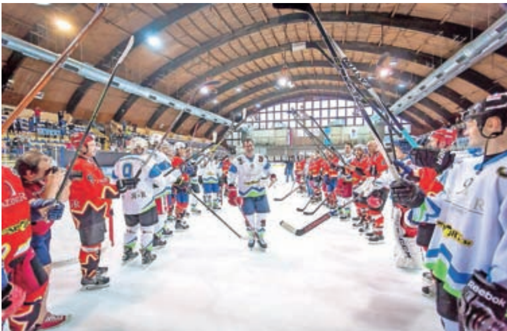
Kapetana Tomaža Razingarja so nekdanji soigralci s špalirjem pospremili z ledu.

»Za hokej se zanimam že od malega, profesionalno pa ga spremljam petindvajset let. Tudi Tomaža sem spremljal vso njegovo kariero in iz spoštovanja do njega sem se