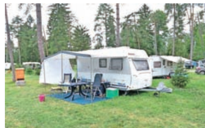
Trenutno beležijo največ nemških gostov, vendar v vrhuncu sezone pričakujejo veliko Nizozemcev.

poletnih šolskih počitnic. »Po številu gostov za zdaj s 44 odstotki še močno prevladujejo Nemci, vendar se bo razmerje do konca poletja zagotovo obrnilo v korist Nizozemcev,« dodaja Gašperin. Beležijo zelo veliko prehodnih gostov, ki potujejo iz Severne Evrope proti Sredozemlju in se na Šobcu ustavijo za dan ali dva, in agencijskih gostov, ki v kampu bivajo teden ali dva. Kot komentira Gašperin, se povprečna doba bivanja gostov v kampu Šobec giblje med tremi