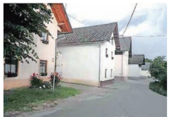
Osrednji del današnjega Predtrga, od Ljubljanske ceste 23 do 37 (od Žilha do Legata), je enak Predtrgu v letu 1826, številke hiš pa so bile takrat od 17 do 9.

objekt) ter za njim vrt (sadovnjak). Tako razporeditev vidimo v Predtrgu še danes na Ljubljanski cesti od št. 23 do št. 37.