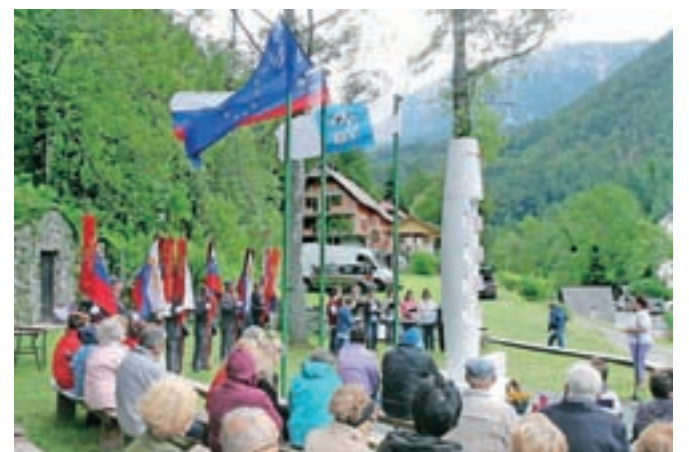
V spomin na požig Kokre in izselitev vaščanov