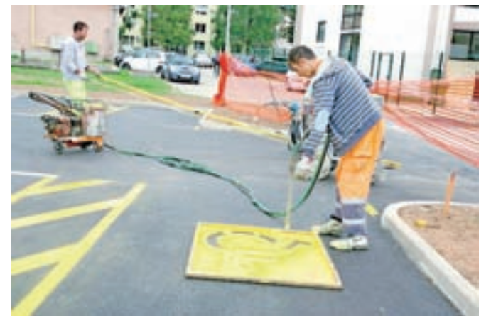
Zarisali so tudi oznake za parkirna mesta, namenjena invalidom.

Kranj – Na novem parkirišču ob Osnovni šoli Simona Jenka v Kranju, namenjenem bližnji stanovanjski soseki, so naredili še zadnja dela, zarisali črte in potrebne oznake. Ena od njih označuje posebno parkirno mesto, rezervirano za invalide. Pomembno je, da ga ostali vozniki upoštevajo in nikoli ne parkirajo na njem. Eden od voznikov, ki je nekoč zasedel parkirno mesto, namenjeno invalidom, je ob vrnitvi dobil na vetrobranskem steklu zataknjeno sporočilo: »Če si mi vzel parkirno mesto, vzemi še mojo invalidnost.« Dovolj, da se zamislimo.