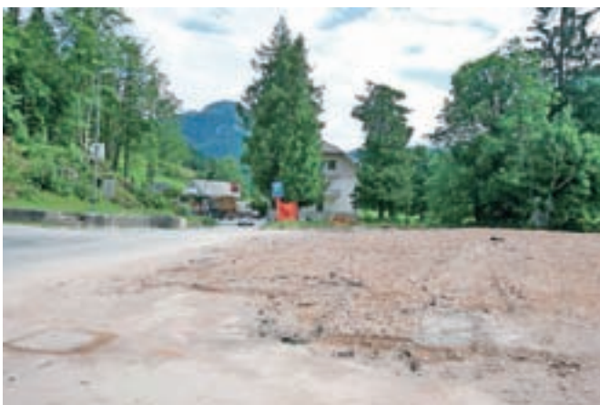
Praznina na mestu, kjer je prej stala jezerska Kazina.

Jezersko – Hotel Kazina na Jezerskem, ki so ga začeli rušiti prve dni julija, je dokončno padel. Ob prihodu na Jezersko se odslej ne bo več odprla značilna veduta s to nekdanjo mogočno stavbo v središču, na praznino se bo pač treba navaditi. Še vsaj do jeseni namreč ne bo znano, kaj bo na mestu nekdanjega hotela, ga bo lastnik, podjetje Altus Consulting iz Ljubljane, prodal ali bo gradil nov turistični objekt.