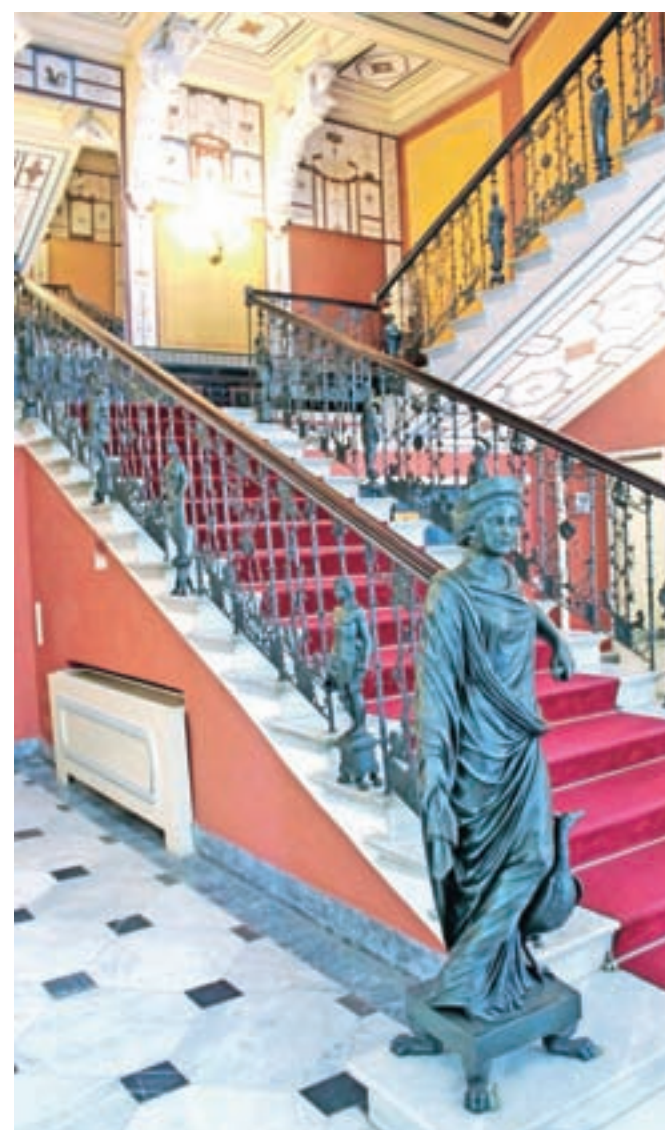
Achilleionova notranjost še danes namiguje na razkošno zgodovino stavbe.