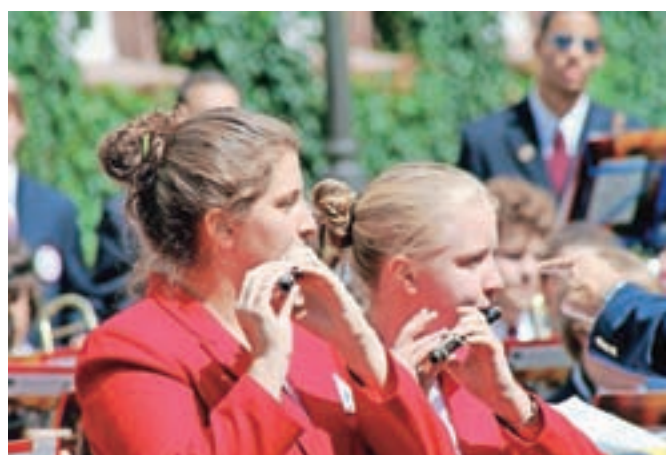
Mladi glasbeniki na Ama Red Touru

Škofja Loka – Jutri, v sredo, 20. julija, bo ob 20. uri na Cankarjevem trgu v Škofji Loki koncert, na katerem bo nastopilo več kot 120 glasbenikov. Uro in pol dolg koncert bodo oblikovale štiri različne zasedbe: simfonični orkester, džezovska zasedba, komorni godalni orkester in zbor. Gre za zasedbe iz ZDA, ki se imenujejo AMA (American Music Abroad), ki uspešno nastopajo po Evropi že več kot štirideset let. The Red Tour (Rdeča turneja) je skupina najboljših srednješolskih glasbenikov, ki nastopajo v štirih omenjenih sestavih. Simfonični orkester šteje petdeset članov, džezovska zasedba dvajset glasbenikov, komorni godalni orkester petnajst članov, zbor pa štirideset pevcev. Nastopajoči so izbrani iz 32 ameriških srednjih šol za glasbo in kolidžev iz držav New Jersey, New York, Ohio in Pensilvanija. Na sedemnajstdnevni turneji po Evropi bodo trikrat nastopili v Avstriji, dvakrat v Nemčiji, enkrat v Italiji ter Sloveniji. Sestavi bodo izvajali različno glasbo, od velikih mojstrovčin klasične in džez, glasbe iz broadwayskih muzikalov, ameriške folk glasbe do del sodobnih ameriških skladateljev. Vstopnine na koncertni prostor ni, organizatorji pa opozarjajo, da bo v primeru dežja Ama Red Tour, kot se koncert imenuje, v Sokolskem domu.