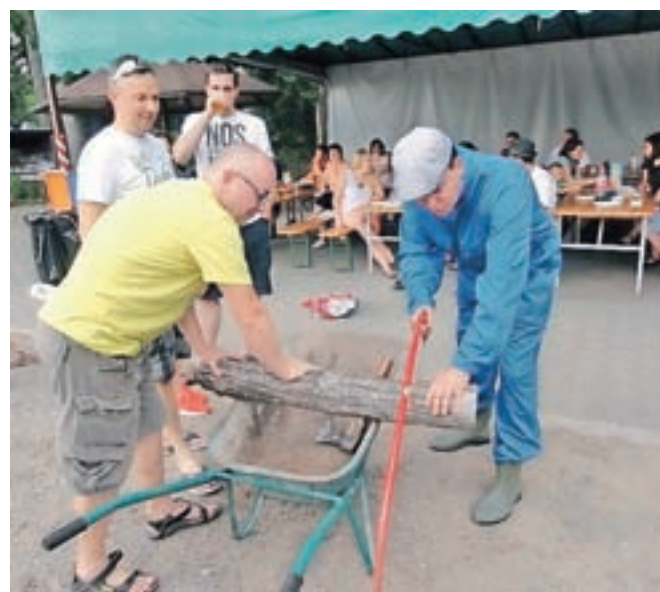
Z delom do miru pred sosedi