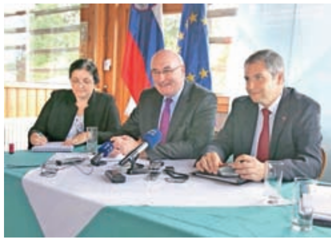
V Poljanski dolini so pretekli četrtek v okviru prvega uradnega obiska v Sloveniji gostili evropskega komisarja za kmetijstvo in razvoj podeželja Phila Hogana.