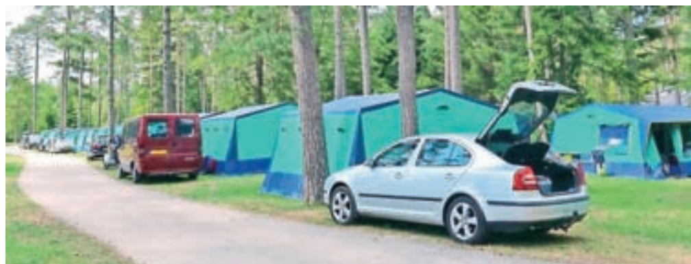
V kampu Šobec v zadnjih dneh prevladujejo predvsem večje skupine gostov.

V kampu Šobec v zadnjih dneh prevladujejo predvsem večje skupine kampistov, po besedah Gašperina pa jih bodo v vrhuncu sezone zamenjali individualni gostje, družine z otroki, ki se za dopust odločajo tudi na podlagi časovnega obdobja