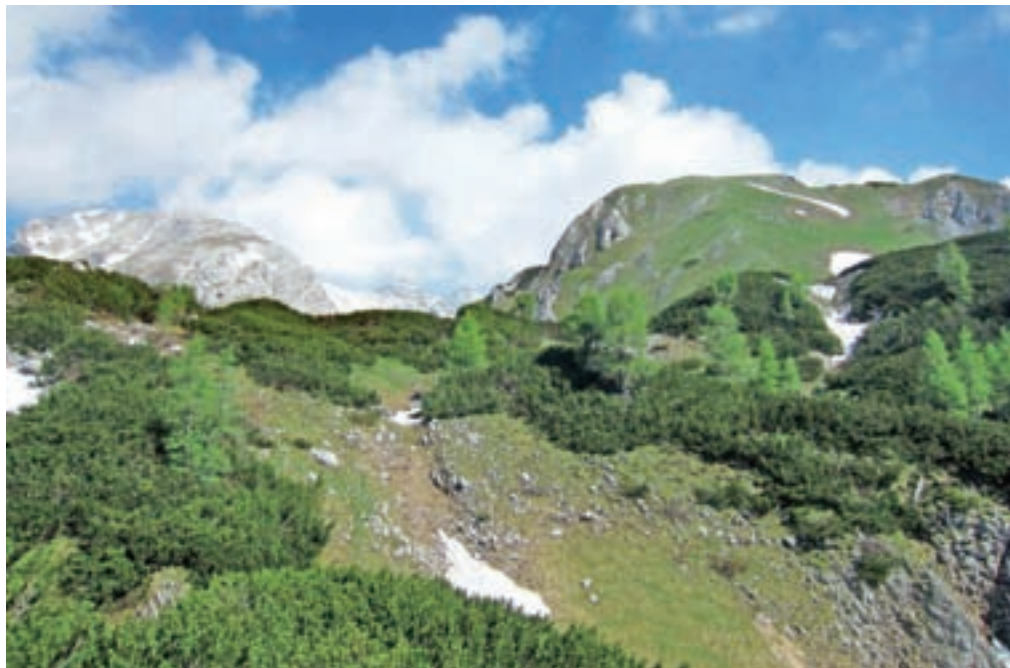
Vrh Ogradov na desni strani, levo Debeli vrh

Nadmorska višina: 2087 m Višinska razlika: 940 m Trajanje: 6 ur Zahtevnost: ★★★★★