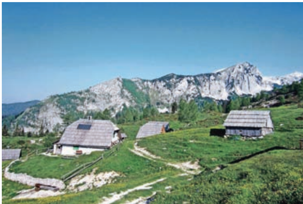
Planina Krstenica, zadaj Ogradi, naš današnji cilj

skalne stene. Pri ruševinah steza zavije levo in se začne vzpenjati prečno po travnatem pobočju. Pot je vse bolj razgledna, saj se pred nami kažejo Kreda, Slatna ter Prvi, Srednji in Zadnji Vogel. V teh dneh so pobočja posuta s cvetjem; avrikelj, jeglič, svišč... Na naši desni je eden od predvrhov, obhodimo večjo kotanjo in se na drugi strani ponovno povzpemo na rob. Od tu v daljavi že vidimo naš današnji vrh, ki ga označuje križ. Vmes za trenutek celoten malenkostno izgubimo višino, nato pa se mimo dišečega borovega ruševja precej strmo po travnatem pobočju povzpemo do vrha. Razgled z vrha Ogradov je fantastičen; proti severu je