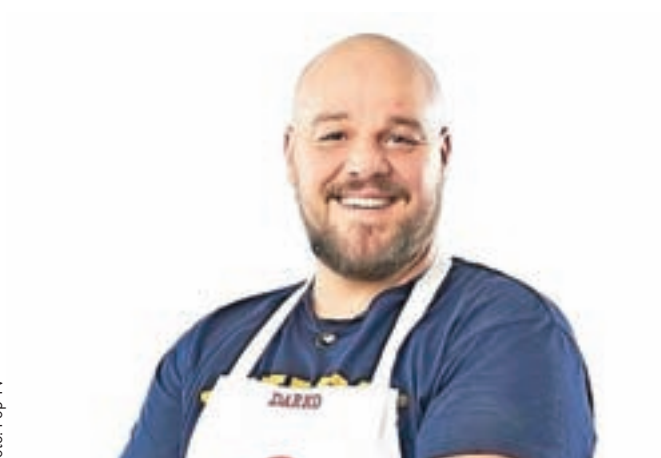
Darko boste lahko v živo videli konec tedna v Kranju.