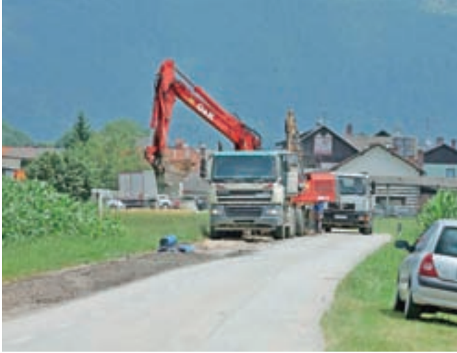
Zaradi gradnje vodovoda bo cesta na Zgornjem Brniku do konca meseca zaprta za promet.

V občini Cerklje se je začela gradbena sezona.