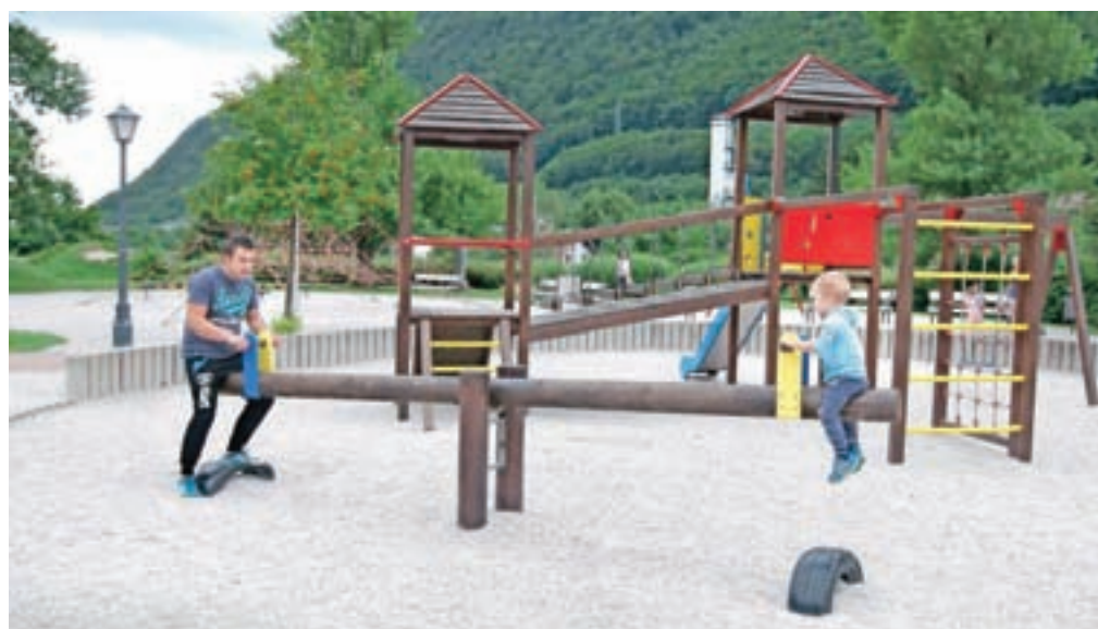
Otroško igrišče na Stari Savi: lahko bi ga razširili na sosednje zelene površine.