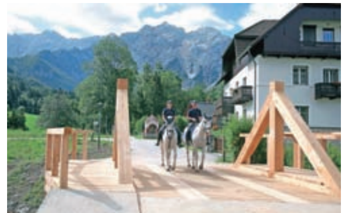
Most čez Jezernico je že skoraj zgrajen.

Spremenjena podoba mostu je naletela pretežno na pozitivne odzive, pravi župan občine Jezersko Jurij Rebolj in doda, da je naložba v novi most veljala približno 35 tisoč evrov. Včeraj se je čez most že sprehodila policijska konjenica, ki je gostovala na Jezerskem v okviru aktivnih počitnic za tamkajšnje otroke.