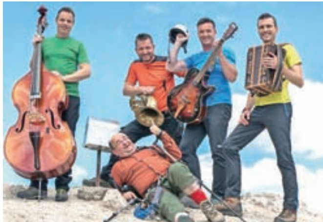
Glavno vlogo so fantje zaupali komiku in igralcu Konradu Pižornu - Kondiju.