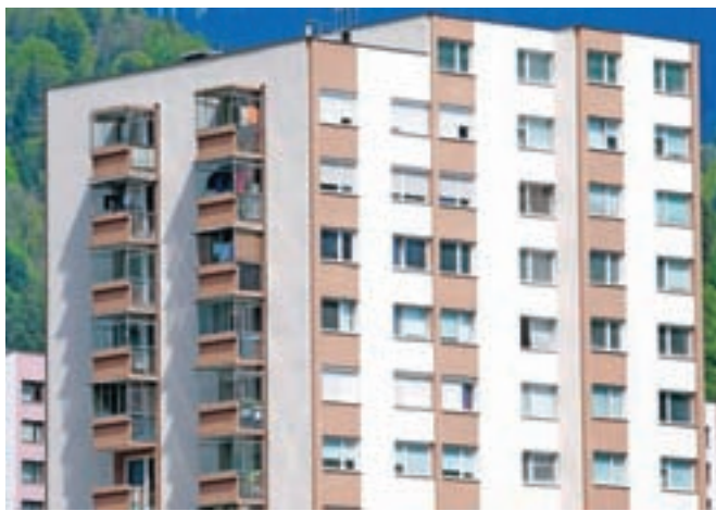
Upravičenci, ki zaradi pomanjkanja neprofitnih stanovanj bivajo v tržnih stanovanjih, so znova izenačeni z najemniki neprofitnih stanovanj.

Ponovna uvedba dodatne subvencije za najem tržnih in hišniških stanovanj za občine pomeni dodaten strošek. Na Mestni občini Kranj ocenjujejo, da bodo za neprofitni del tržnih subvencij morali letno zagotoviti najmanj 30 tisoč evrov, točen znesek pa bo znan šele konec leta. Občina razpolaga s 379 neprofitnimi stanovanji, kar ne zadošča potrebam. Tržne subvencije prejema približno 70 upravičencev, lani pa so za subvencije (neprofitne in tržne) namenili okoli 400 tisoč evrov.