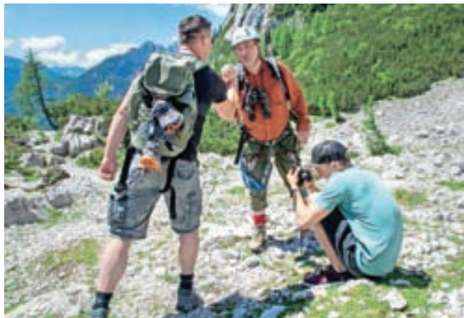
Skupina Špica je za pesem Gora ni nora posnela humoren in hkrati poučen videospot.