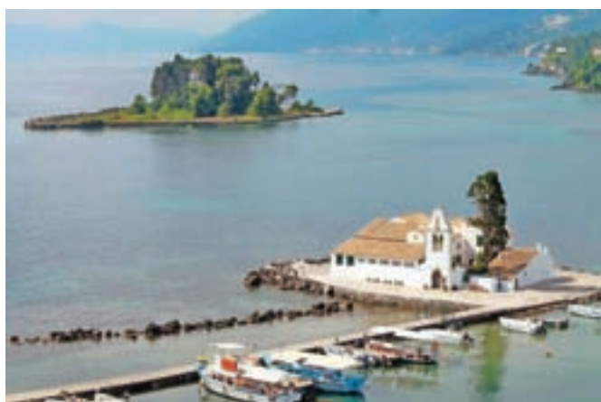
Pogled na Pantikonissi

kavarne popijete kavo in opazujete letalsko stezo ter pristajanje in vzletanje letal.