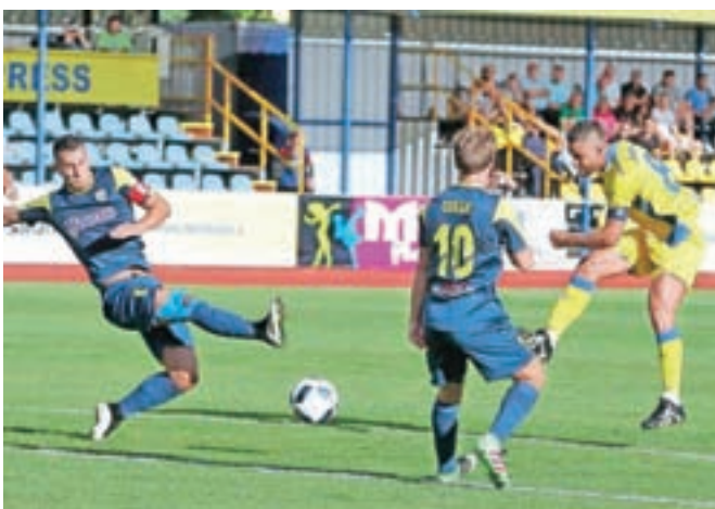
V Domžalah je bil v nedeljo prvoligaški nogometni derbi med sosedi, v četrtek pa se obeta odločila tekma drugega predkroga evropske lige.