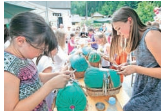
Na klekljarskem tekmovanju so se izkazali tudi učenke in učenci čipkarskih šol.