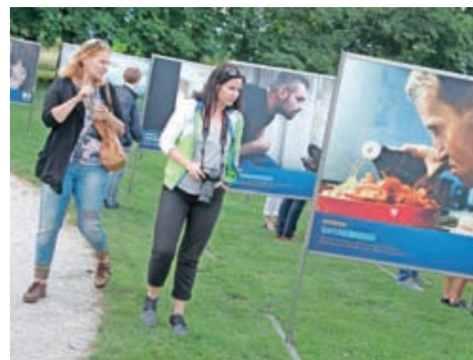
Razstava z naslovom Energija navdiha bo na ogled še vse do 26. septembra.