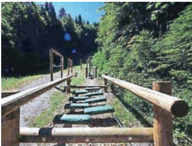
Tematski park za družine na zgornji postaji štirisedežnice Vitranc 1

V Žičnicah Kranjska Gora so tudi podaljšali delovni čas obratovanja poletnih aktivnosti ob koncih tedna, to je panoramskih prevozov s sedežnico na Vitranc 1, poletnega sankališča, kolesarskega parka, poletne tube, Bedančevega doma in tematskega parka. Delovni čas je tako med tednom med 9. in 17. uro, od petka do nedelje pa do 18. ure.