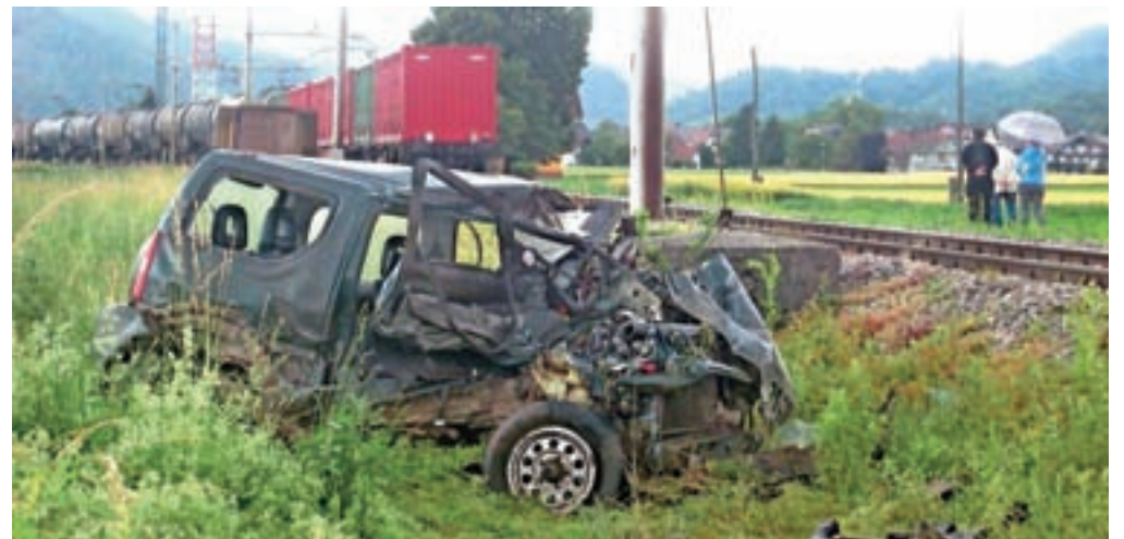
V silovitem trčenju s tovornim vlakom je v torek zvečer umrl 68-letni voznik, ki je na železniško progo zapeljal kljub spuščnim zapornicam.

Zakaj je zapeljal na tire tik pred prihodom vlaka, ni znano. S Policijske uprave Kranj so sporočili, da je v času nesreče signalizacija na prehodu naznanjala prihod vlaka, spuščene da so bile tudi zapornice. Tuje krivde prometni policisti z dosedanjim zbiranjem obvestil niso ugotovili, je razložil Bojan Kos, tiskovni predstavnik PU Kranj.