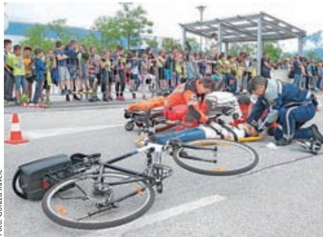
Sredina preventivna prireditev za šolarje pred Mercatorjevim centrom na Primskovem se je končala s prikazom reševanja v primeru prometne nesreče.

ospredje pa so tokrat postavili varnost kolesarjev in v prometu na splošno. Prireditev se je končala še s prikazom reševanja v prometni nesreči, v kateri je voznik osebnega vozila »trčil« v mlado kolesarko. Poleg prostovoljcev iz SPV so na dogodku sodelovali tudi policija, gasilci, AMZS, Ambulanta nujne medicinske pomoči Kranj, Rdeči križ. Agencija za varnost prometa, starodobniki, Kolesarski klub Sava ... »Po- leg rdečega križa so letos na naši prireditvi prvič sodelovali tudi člani Društva zdravljenih alkoholikov Kranj, ki so iz lastnih izkušenj otrokom razkrili, kakšno zlo se skriva v zlorabi alkohola, pomagali pa so nam tudi pri varovanju prireditve,« je še povedal Kojadin.