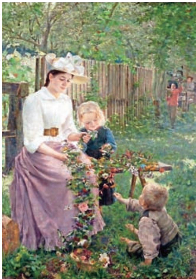
Ivana Kobilca, Poletje, 1889–1890, olje, platno, 180 x 141,5 cm / Hrani: Narodna galerija, Ljubljana

(Viri: Ivana Kobilca, Spomini, po njeni pripovedi zapisal Stanko Vurnik, Zbornik za umetnostno zgodovino, leto III (1923), št. 3–4, str. 100–112. – Pariški bohemi (1889–1895), avtobiografsko poročilo avstrijske slikarke Rose Pfäffinger, Narodna galerija, Ljubljana, 2014. – Sto umetnin Narodne galerije, NG, Ljubljana, 2016)