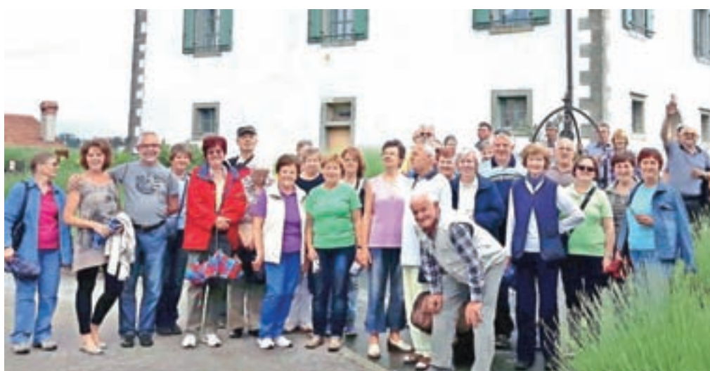
Prva skupina Glasovih izletnikov pred Gredičem