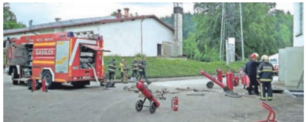
V Savskih elektrarnah Ljubljana so včeraj pohvalili učinkovito sodelovanje zaposlenih z medvoškimi gasilci in civilno zaščito.

Dežurno osebje v HE je o dogodku takoj obvestilo center za obveščanje in lokalne gasilce. »Poziv na intervencijo smo prejeli ob 5.49, nanjo se je z osmimi vozili odpravilo