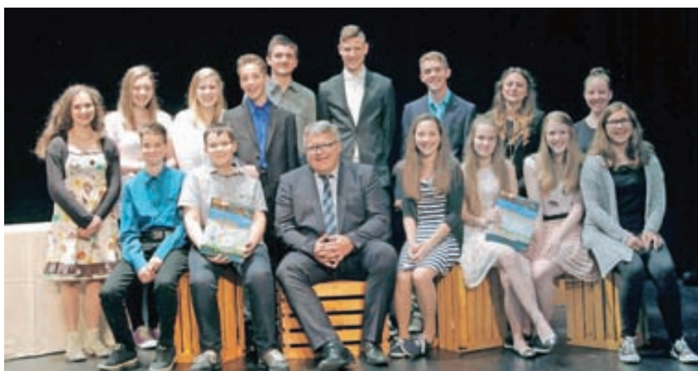
Najuspešnejši učenci iz občine Kranjska Gora na sprejemu pri županu Janezu Hrovatu v Ljudskem domu v Kranjski Gori