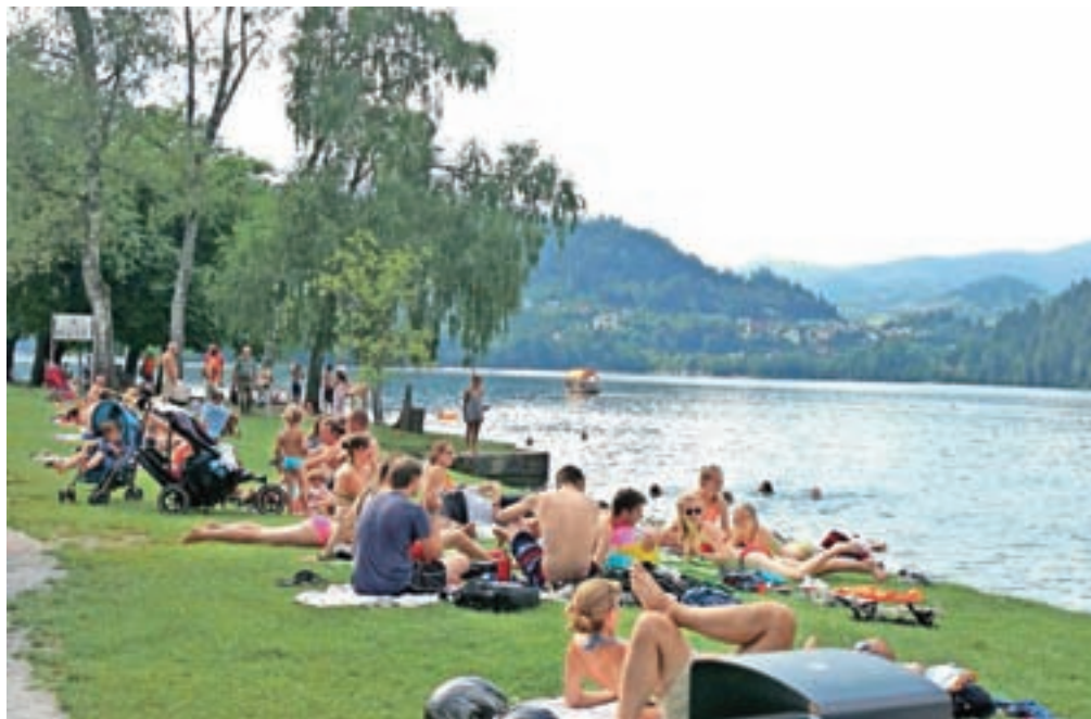
Kakovost večine uradnih kopalnih voda na Gorenjskem je odlična.

V Sloveniji imamo določene 48 kopalnih vod, od tega jih je sedem na Gorenjskem, in sicer na dveh edinih naravnih jezerih pri nas, Blejskem in Bohinjskem. Na teh lokacijah republiška agencija za okolje med kopalno sezono redno spremlja kakovost vode. Ob tem so na Gorenjskem določene še lokalne kopalne vode na Poljanski in Selški Sori ter Kokri, na katerih kakovost vode spremlja