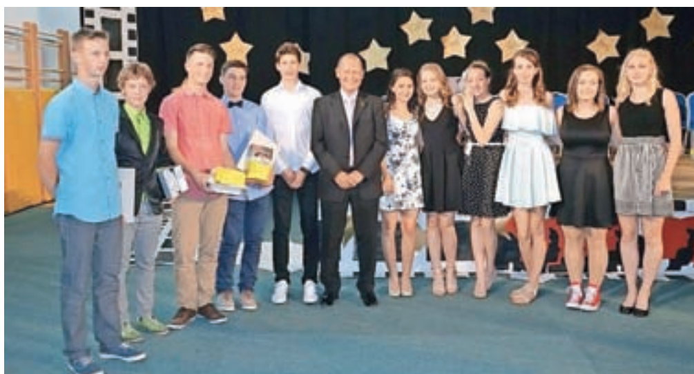
Žirovniški odličnjaki z županom Leopoldom Pogačarjem