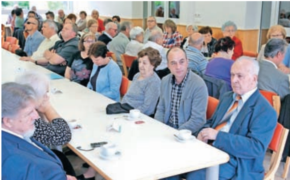
Srečanje članov Društva civilnih invalidov vojn Gorenjske ob 45-letnici

Tako je okoliščine nastanka Zveze društev civilnih