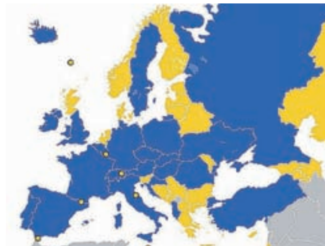
Nogometna Evropa: z modro so označene države, ki zdaj tekmujejo v Franciji, z rumeno izpadle v kvalifikacijah, med njimi Slovenija.