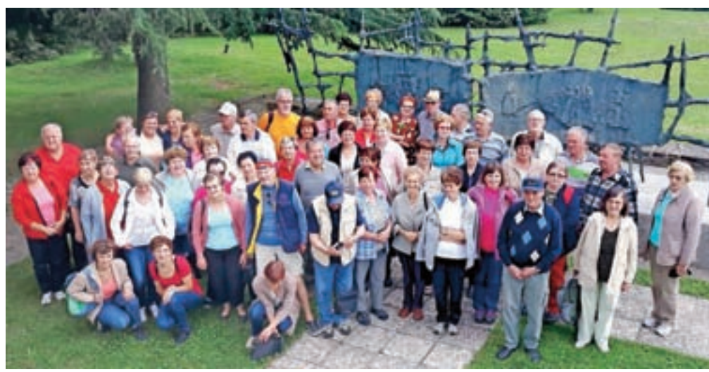
Druga skupina se je fotografirala v Gonjačah.