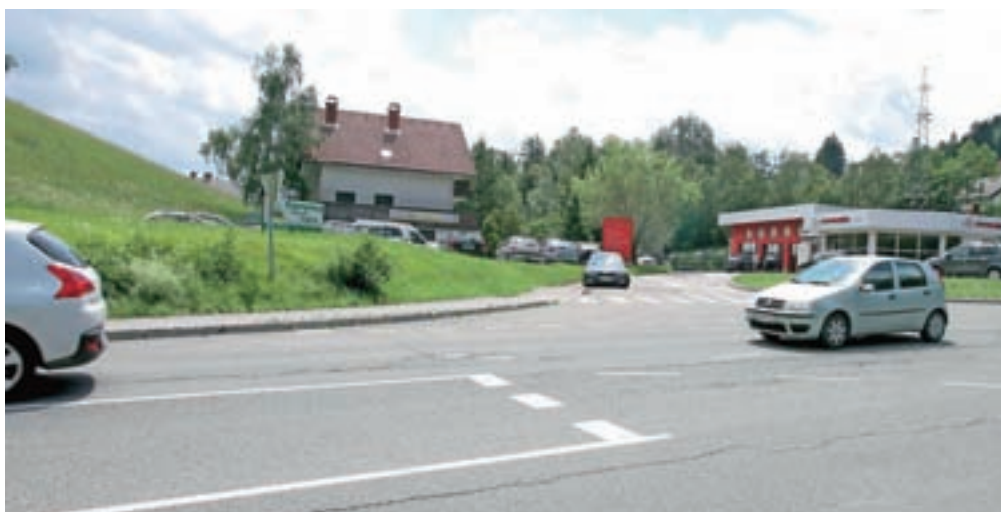
Obvoznica bo potekala od križišča z regionalno cesto pri poslovnem objektu Pančur do območja Črna vas na Blejski Dobravi.

tudi dobra prometna povezava za vse sedanje in bodoče podjetnike v Črni vasi,« so poudarili na občini.