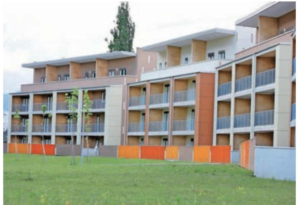
▶ 2. stran Nova stanovanjska soseska Gorenjski sonček na Jesenicah

ponudbo omejenega števila stanovanj, ki so jim znižali cene in ponudili možnost najema ugodnega kredita pri Abanki. In v čem so po Žvipljevih besedah prednosti stanovanj v soseski Gorenjski sonček? Kot je dejal, je to trenutno edina nova ponudba stanovanj na Jesenicah. V soseski je veliko zelenja, okolica je urejena, uredili so veliko otroško igrišče. Zagotovili so tudi dovolj notranjih in zunanjih parkirnih mest, posebnost pa je tudi polnilnica za električna vozila.