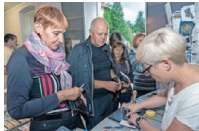
Na razglednice z umetniškimi deli razstavljavcev je bilo mogoče dodati priložnostno znamko in žig.

Hkrati je bila v prostorih hodnika Loškega gradu odprta tudi razstava Filatelističnega društva Lovro Košir. Filatelistično gradivo je