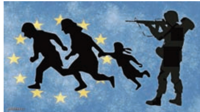
Begunci v Evropi, kritična ilustracija. Se lahko tudi nam še kdaj zgodi, da bomo morali v begunstvo?