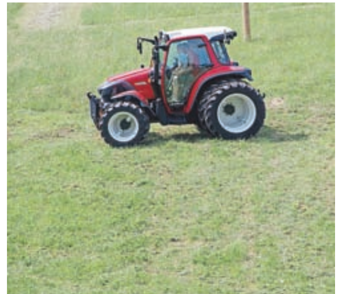
Katastrski dohodek od kmetijskih zemljišč naj bi v obdobju 2017–2019, odvisno od bonitete, znašal od 16,86 do 105,39 evra na hektar.

pridelkov in njihovih cen, ... Skupina je zato predlagala bolj enostaven, manj podroben in bolj pregleden sistem ugotavljanja katastrskega dohodka, ki bo temeljil na podatkih ekonomskega računa za kmetijsko in gozdarsko dejavnost, ki jih za vsako leto posebej pripravlja državni statistični urad. Katastrski dohodek bodo po tem modelu izračunali tako, da bodo od tako ocenjenega prihodka odšteli normirane odhodke, ki za kmetijska zemljišča znašajo 90 odstotkov, za