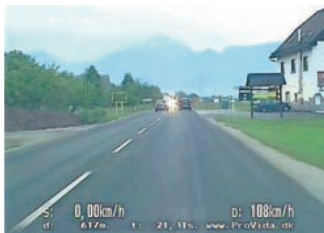
Kršitelj je skozi Bitnje vozil s povprečno hitrostjo 113 km/h, dvakrat je pri še višji hitrosti tudi prehitel.

je v naseljih seveda bistveno preveč. Prav tako v nevarnosti voznik na taki cesti pri taki hitrosti praktično ne bi imel nobene možnosti, da bi se lahko varno ustavil ali pravilno reagiral, v primeru trčenja s pešcem ali