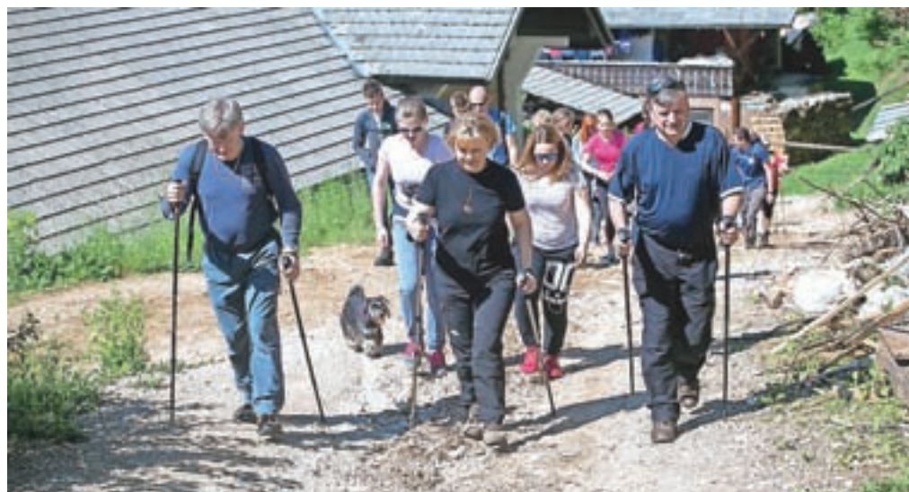
Dobrodelnega pohoda v Cerkljah se je udeležilo okoli dvesto pohodnikov.

Tekli in pomagali so v soboto tudi člani kamniškega in domžalskega Lions ter Leo kluba, ki so na dobrodelnem teku v Volčjem Potoku zbrali okoli 140 tekačev, ti pa so s svojimi startninami pomagali zbrati dva tisoč evrov, ki jih bodo organizatorji podarili socialno ogroženim, gibalno oviranim in slepim ter slabovidnim otrokom in mladini. Da bi vsaj malo razumeli, kako se slednji počutijo v svojem vsakdanu, so tudi letos na koncu druženja pripravili tek oz. hojo z zavezanimi očmi.