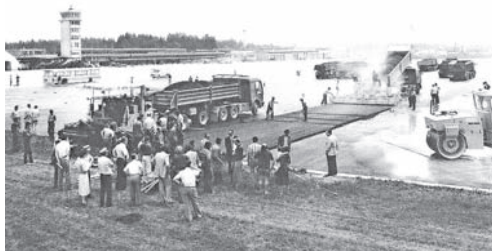
Ogled asfaltiranja vzletno-pristajalne steze, ki so jo odprli 31. avgusta 1978.

Po nesreči je ustanovil posebno komisijo, ki se je poglabila v vzroke za zadnjo in predhodno nesrečo v Adrii, kar pred tem ni bila ustaljena praksa. »Od takrat naprej se v Adrii ni zgodila nobena nesreča več. Pred tragedijo na Korziki nobena katastrofa ni bila analizirana z argumenti. Če bi jih analizirali, jih verjetno ne bi bilo sedem,« je prepričan.