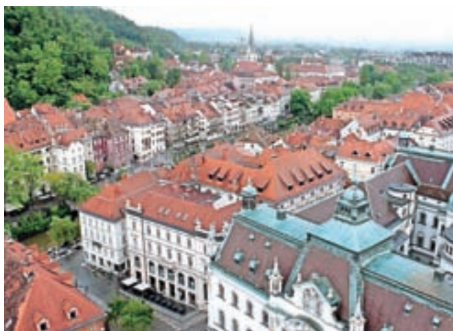
In ko se navadiš višine, se ozreš še naokoli; pogled na strehe stavb na Kongresnem trgu.