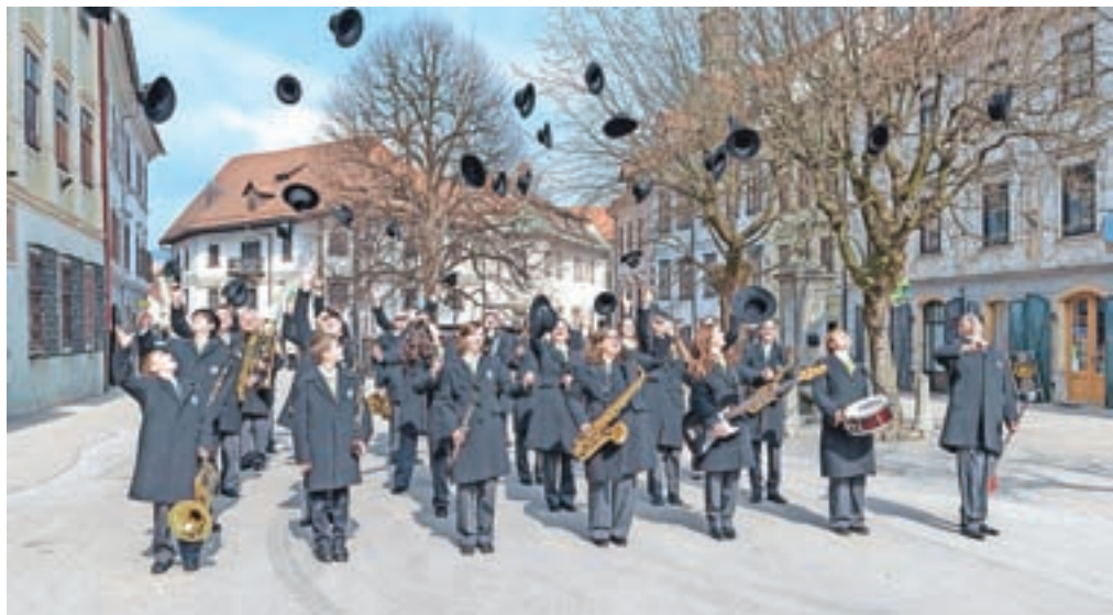
Mestni pihalni orkester Škofja Loka vabi vse ljubitelje dobre glasbe, da jo »pihnete« na jutrišnji koncert na Trato.