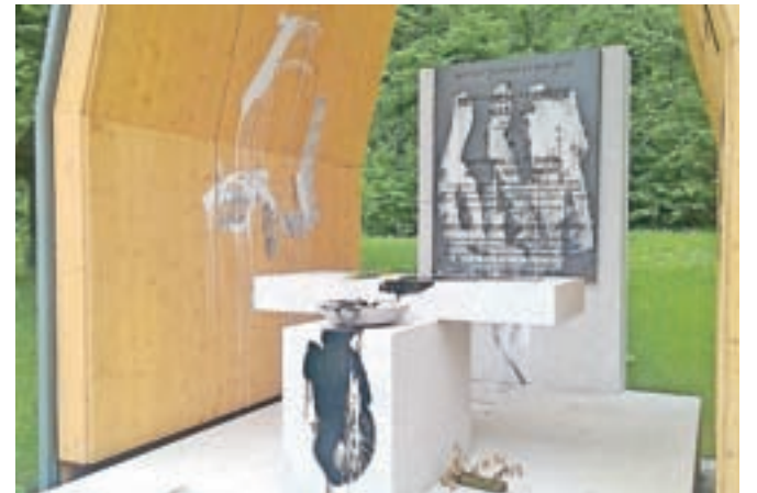
Škoda na kapelici Parka spomina in opomina na Kopiščih je tokrat precejšnja.