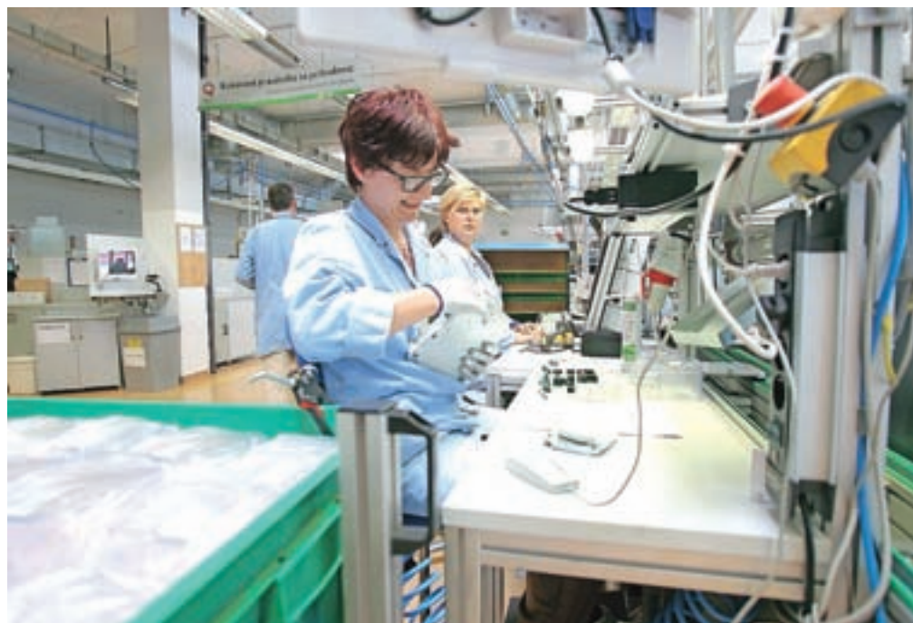
Preobrazba Iskraemeca v visokotehnološko podjetje ni zahtevala zmanjševanja števila zaposlenih, saj so vse usposobili za delo na novih linijah, hkrati pa povečali obseg proizvodnje.

Egiptovski lastnik je v Iskraemecovo proizvodnjo v zadnjih sedmih letih vložil več kot 14 milijonov evrov, vlaganja pa se bodo še nadaljevala, je napovedal Abdullah. Ob tem je poudaril, da imajo v raziskovalno-razvojnem centru, ki je eden največjih v merilni industriji v Evropi, zaposlenih skoraj 120 strokovnjakov, v razvoj pa letno vlagajo od šest do osem odstotkov prihodka. V prihodnjih petih letih