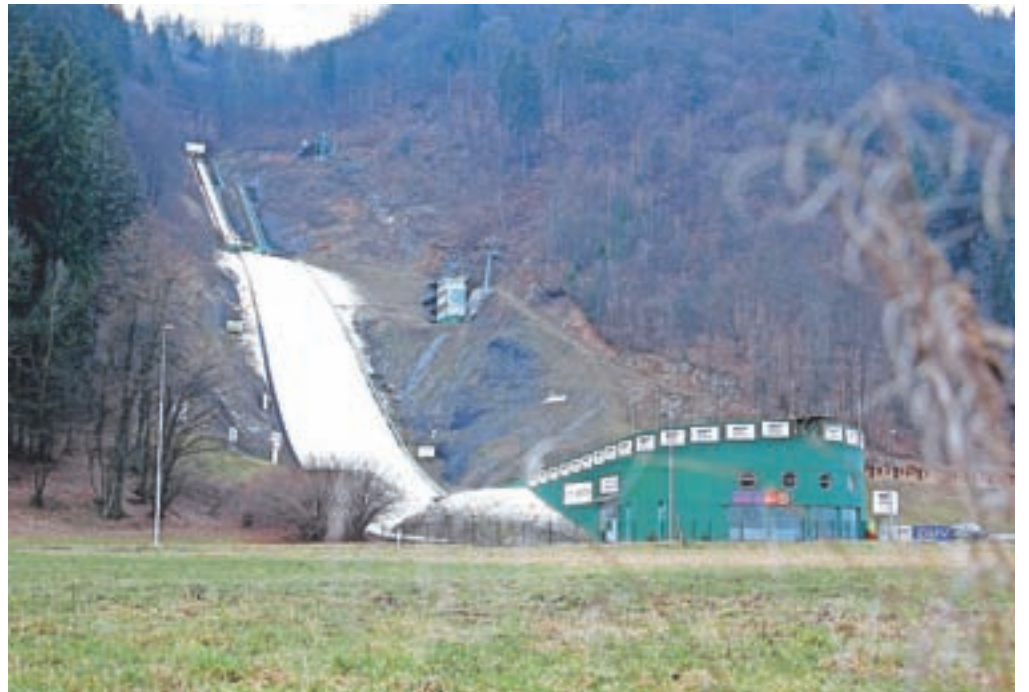
Regijski panožni nordijski center naj bi vendarle imel urejeno lastništvo.

»Lastniška razmerja niso urejena, kot lastnika sta vpisana Mestna občina Kranj do sedem desetih in SK Triglav do tri desetine. Vemo tudi, da je v skalnico in spremljajoče objekte veliko vlagala tudi Smučarska zveza Slovenije in da tudi ta delež ni razrešen. Volje, da bi se to dogovorili in uredili, do sedaj ni bilo predvsem zato, ker lastništvo pomeni tudi veliko breme in odgovornost predvsem glede vzdrževanja, upravljanja in investicij. Tako smo sedaj dosegli odličan dogovor, saj bo občina prevzela premoženje, nato bomo zaključili