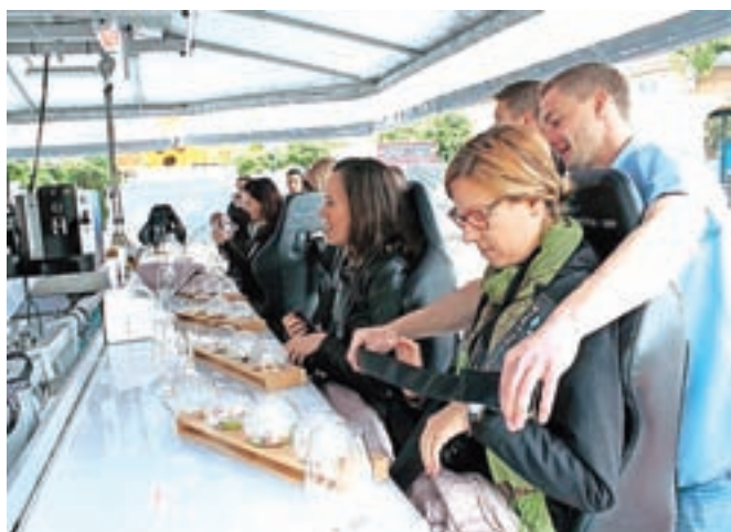
Na prvem mestu je varnost, sledi dvig in šele kot tretji prideta do izraza hrana in pijača.