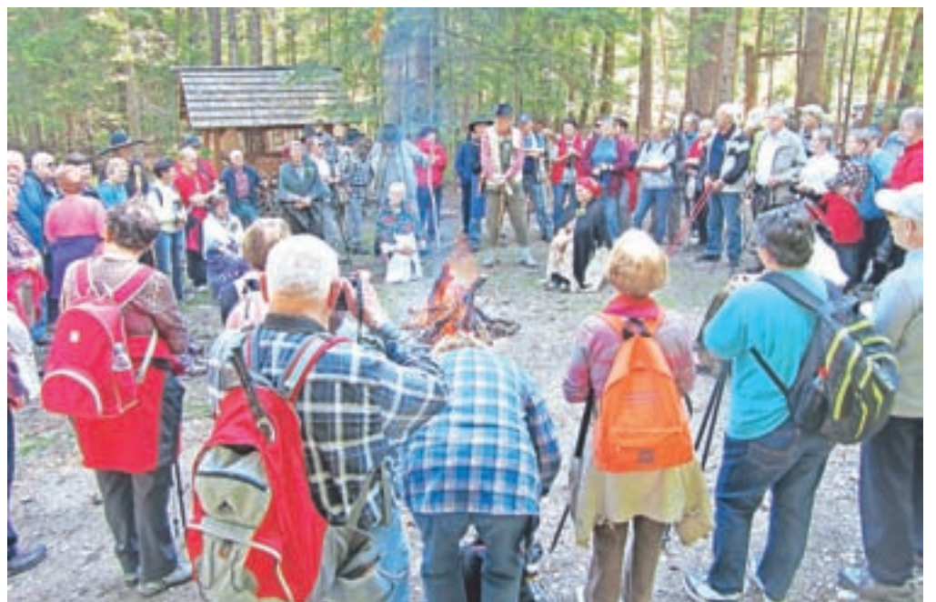
Diabetiki so ob rokovnjaškem ognju sredi Udin boršta slišali marsikaj o življenju ljudi, ki so gozd izbrali za svoje skrivališče.