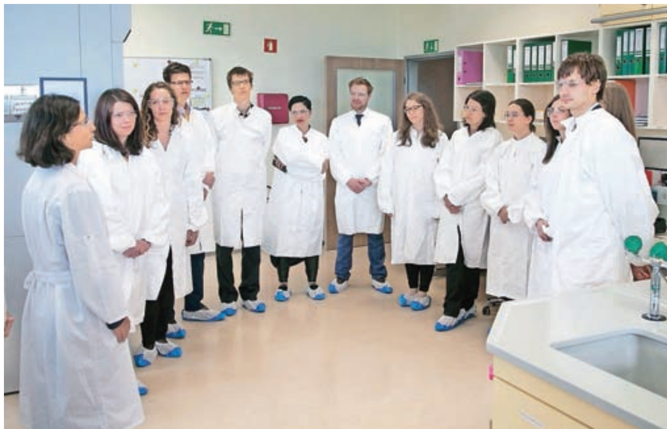
Regijskega BioCampa se je udeležilo 35 študentov iz 11 držav.

Regijski BioCamp je namenjen študentom zadnjega letnika dodiplomskega študija ter magistrskim, doktorskim in postdoktorskim študentom naravoslovnih znanosti. Letošnjega, ki je potekal od nedelje do torka, se je udeležilo 35 študentov iz enajstih držav, ki so jih izbrali med stotimi mladimi znanstveniki. Poleg predavanj vrhunskih strokovnjakov so udeleženci pripravili tudi referate na temo naprednega zdravljenja bolezni dihal za boljšo kakovost življenja bolnikov.