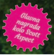
KOLESARSKILUB SAVA KRANJ, ŠKOFJELOŠKA CESTA 14, KRANJ