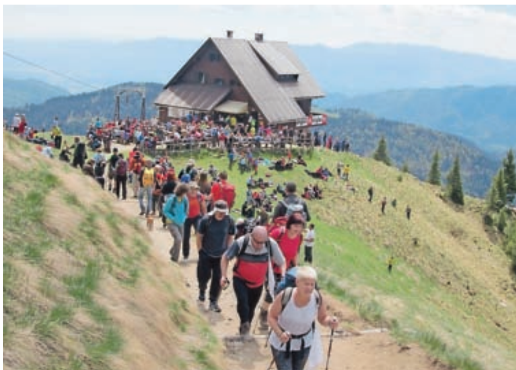
V soboto in nedeljo so se na Golico vile kolone planincev.

Veliko dela imajo v maju na pobočjih Golice tudi društveni markacisti, ki obnavljajo od zime