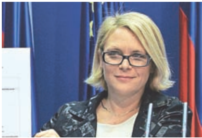
Primer velenjskih dečkov vendarle ni povsem brezmadežen, kar je za ministrico Anjo Kopač Mrak neprijetna novica pred glasovanjem o interpelaciji.