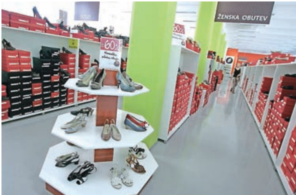
Po zaprtju prodajaln so se tudi vse zaloge iz posameznih prodajaln preselile v centralno skladišče v Trziču in tamkajšnjo prodajalno.

Trzič – Nedavno objavljeni preizkus terjatev Peka v stečaju je pokazal, da je obveznosti več, kot pa je ocenjena vrednost Pekovega premoženja, ki znaša približno 6,5 milijona evrov. Največ premoženja je v Pekovih nepremičninah, kot so poslovni prostori na več lokacijah in največji kompleks v Trziču, manj v strojih in orodjih, poslovni delež je še v hčerinskem podjetju PGP Inde v višini 681 tisoč evrov in v blagovni znamki Peko. Blagovna znamka je po likvidacijski vrednosti vredna 374 tisoč evrov, zanjo pa stečajna upraviteljica predvideva, da jo bo, glede na dolgoletno tradicijo in glede na uveljavljeni položaj predvsem v Sloveniji in na področju držav nekdanje Jugoslavije, mogoče unovčiti. Drugo Peko v hčerinsko podjetje Peko Split je po veljavni hrvaški zakonodaji v postopku prisilne poravnave in še posluje. Sicer pa stanje premoženja stečajnega dolžnika na območju nekdanje Jugoslavije še ni dokončno ugotovljeno in bo o morebitnem naknadno najdenem premoženju, ki je predmet sodnih in upravnih postopkov, zajeto v nadaljnjih poročilih, je sporočila stečajna upraviteljica Tadeja Tamše. Iz