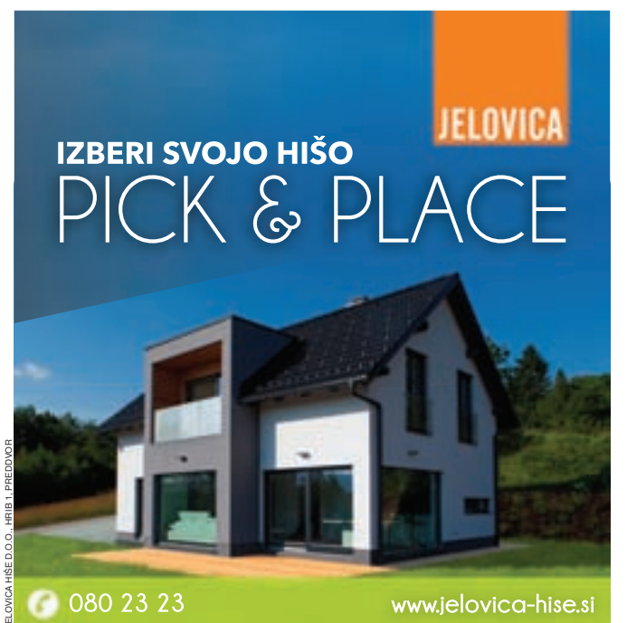
JELOVICA HIŠE D.O.O. IHRIB ILI PREDVODNIK