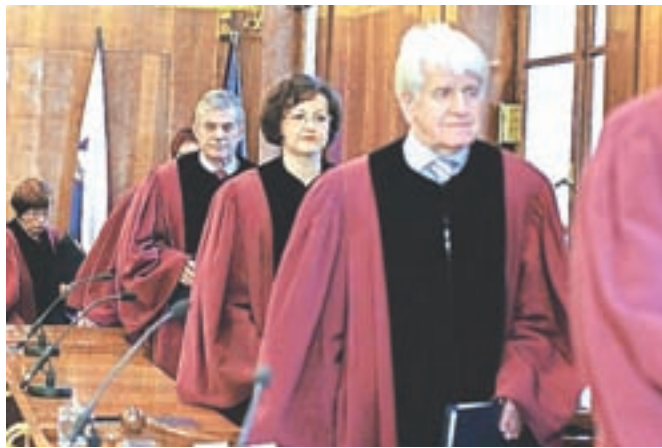
Za prosti mesti na ustavnem sodišču se poteguje devet kandidatov.