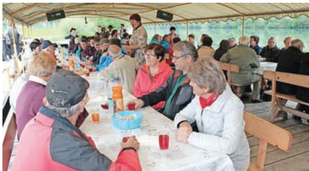
Splav je dolg dobrih 24 metrov, sprejme pa do sedemdeset ljudi.