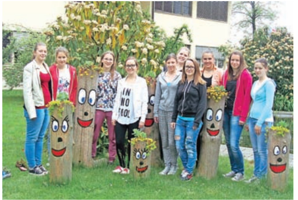
Koroške dijakinje in njihove gorenjske gostiteljice