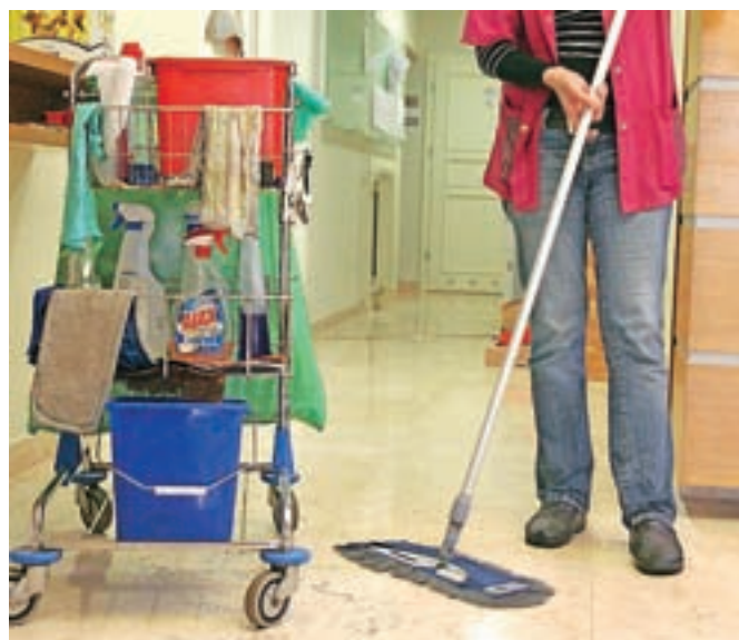
V kranjski enoti inšpektorata za delo so pred dvema letoma po naključju ugotovili, da je njihove prostore pospravljala čistilka, ki je delala na črno.