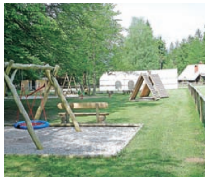
Rekreativni park Završnica: letošnja novost je šotor za prireditve.

spust ali tako imenovanega zip-line. »Dinamika razvoja in gradnje bo odvisna od dopustnosti umeščanja aktivnosti v prostor in seveda od finančnih zmožnosti,« je povedal Pogačar ter dodal, da so na svet gorenjske regije že oddali predlog za sofinanciranje v sklopu projektov Karavanke prihodnosti in Razvoj športnega in klimatsko-zdraviliškega turizma v skupni vrednosti 170 tisoč evrov.