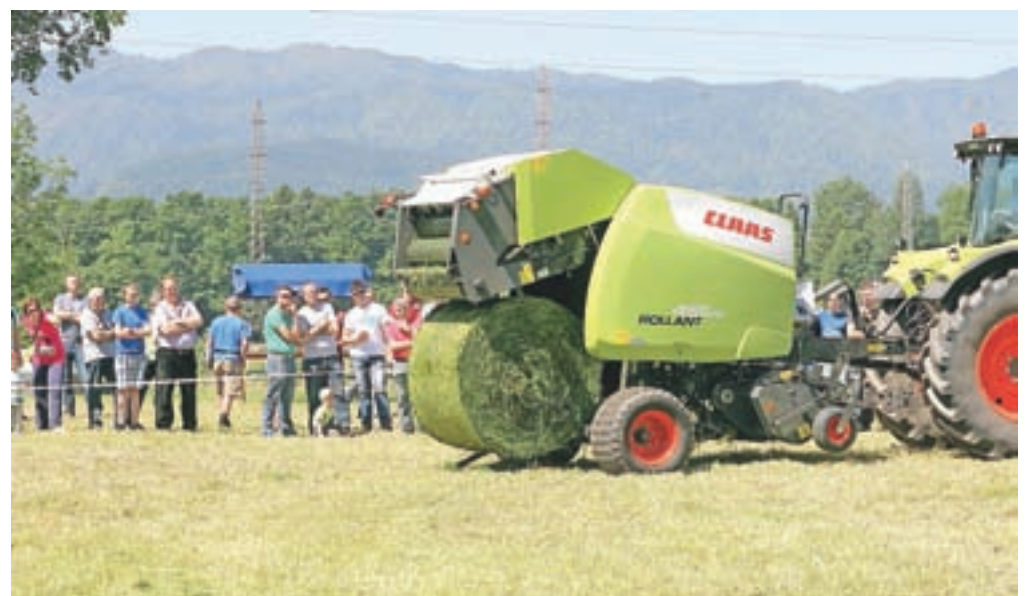
Podjetje Grapak je od marca dalje uradni zastopnik nemškega Claasa. Na sliki: predstavitev delovanja Claasove balirke

umetnega gnojila. Poleg strojev teh dveh izdelovalcev kmetijske mehanizacije so predstavili tudi nakladalke nemškega proizvajalca Kramer, sistem za ovijanje bal avstrijskega podjetja Göweil, gozdarsko tehniko – vitle in prikolice nemškega Pfanzelta in kot novost na slovenskem trgu stroj, ki ločuje zemljo od kamenja, angleškega izdelovalca George Moate. Stroj je zanimiv zlasti za pridelovalce krompirja in zelenjave, saj jim olajšuje pridelavo in spravilo pridelka.