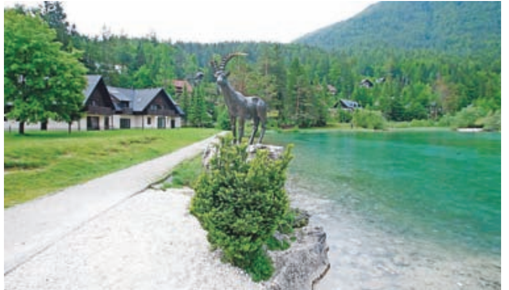
Ercel-Inženiring je tožbeni zahtevek zaradi nezmožnosti gradnje počitniškega naselja ob jezeru Jasna v Kranjski Gori vložil štiri dni prepozno.