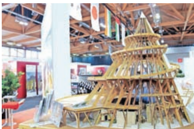
Na sejmu razstavljen lesena maketa stolpa Millennium Tower