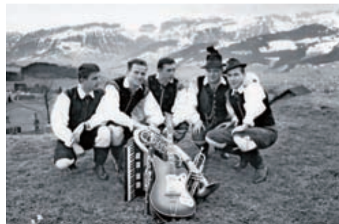
Daljnjega leta 1967 ...