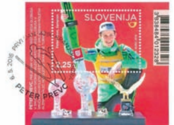
Peter Prevc ima od petka svojo pošto znamko.

Kranj – V petek je Pošta Slovenije izdala priložnostno pošto znamko, posvečeno Petru Prevcu. Motiv znamke v bloku je fotografija skakalnega šampiona z osvojenimi lovoričkami iz lanske sezone, njena nominalna vrednost pa je 2,25 evra. Na ovitku prvega dne je prikazana planiška velikanka, žig prvega dne pa je bil v uporabi na pošti v Kranjski Gori. S to znamko dobiva Peter Prevc tudi filatelistično priznanje in se je tako tudi po tej plati pridružil Gregorju Schlierenzauerju, Wolfgangu Loitzlu, Thomasu Morgensternu, Mattiju Nykänenu, Adamu Małyszku in drugim, ki že imajo svoje znamke. V prodaji je na vseh poštah.