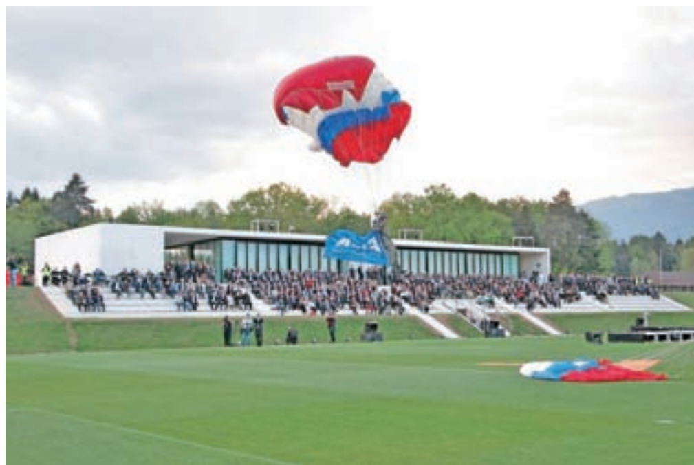
Uradno odprtje Nacionalnega nogometnega centra na Brdu so popestrili tudi športniki, umetniki in padalci Slovenske vojske.