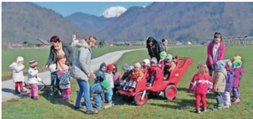
Najmlajši otroci se zdaj naokrog prevažajo z »avtobusom«.

Še posebno živahno pa je bilo v Marijinem vrtcu tretji četrtek v aprilu, ko so na