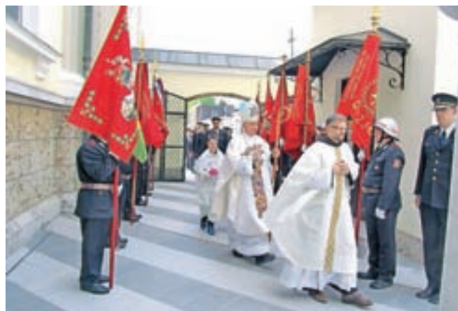
Skozi špalir gasilskih praporov pred svetimi vrati so duhovniki in gasilci vstopili v baziliko.