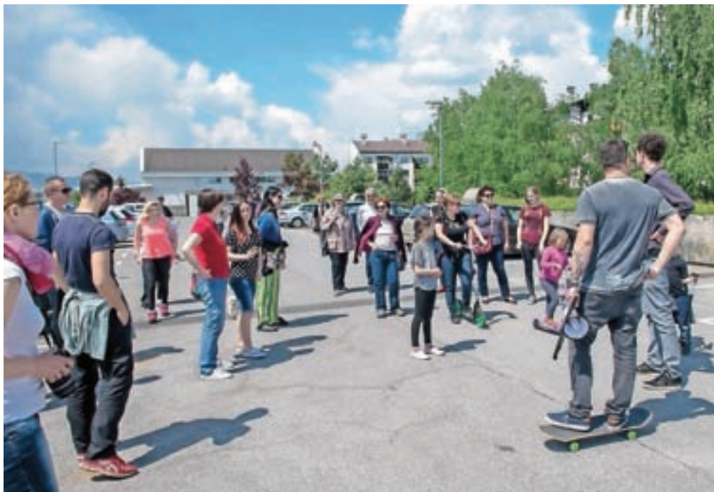
Urbani sprehajalci so na Planini izvedeli marsikaj o snemanju filma Tu pa tam ter hkrati ugotovili, da je Planina kljub blokom tudi zelena in ima prijetne sence.

Čeprav se je Planina v tem času marsikje spremenila in