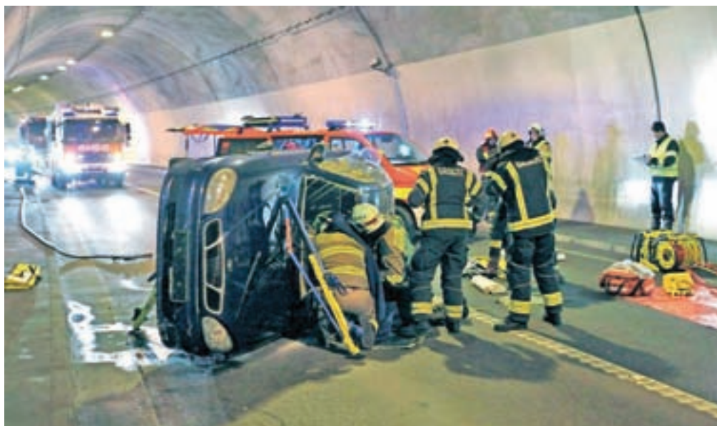
Na slovenski strani predora Ljubelj je v petek potekala reševalna vaja.

Medtem ko je tekla intervencija v predorski cevi, so zunaj izkoristili priložnost za usposabljanje enot za postavitev in delovanje mesta zdravstvene oskrbe z uporabo prikolice za množične nesreče.