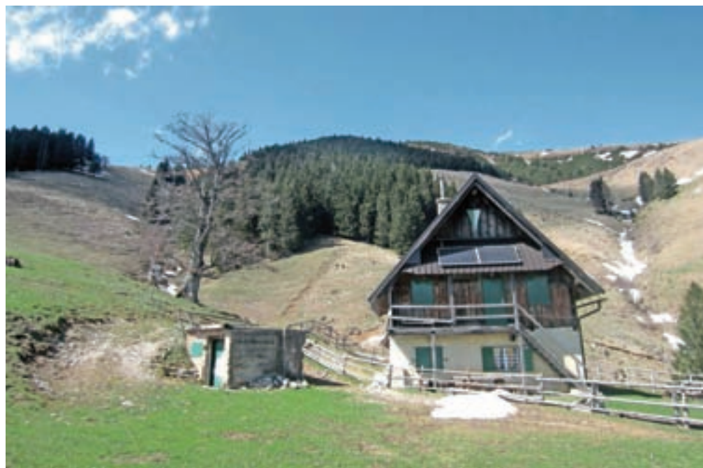
Koča na Jeseniški planini

so markacije ponekod zelo obledele in jih zlahka zgrešimo. Cesta nas pripelje do gozda, kjer se strmeje vzpne in nas višje pripelje do lovske opazovalnice Zgornje Trate. Cesta se spremeni v kolovoz, ki se strmo vzpne in nas pripelje direktno do Jeseniške planine. Ko pogledamo proti vzhodu, se nam odpre razgled na pobočja Struške, Belščice in Stola. Od koč na planini nadaljujemo po levem travniku, kar nas opozori tudi smerokaz. Držimo se nekako sredine travnika in kmalu dosežemo dobro vidno stezo, ki se strmo vzpenja čez travnik. Na vrhu travnika dosežemo vezno markirano pot Dovška Baba-Stol. Predlagam, da zavijemo desno proti Golici. Prečimo vzhodno pobočje Kleka. Globoko pod sabo vidimo Jeseniško planino. Hitro dosežemo izrazito sedlo, s katerega se usmerimo proti severu, da dosežemo greben. Pot do grebena ni markirana. Ko dosežemo grebensko pot, zavijemo levo in sledimo grebenski stezi. Pred nami se odpirajo razgledi proti Koprivnjaku, Dovški Babi in Hruškemu vrhu, ki so najlepši in najbolj izraziti z vrha Kleka. Takrat se pokaže tudi čudovito »kraljestvo Zlatoroga« s Triglavom, Rjavino, Vrbanovimi špicami, Cmirom, Steinarjem, Škrlatico, Špikom