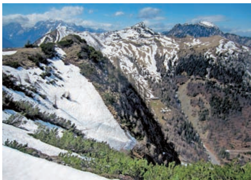
Od leve Klek, Hruški vrh, Dovška Baba, Koprivnjak, Plevelniki, Kurjeki, Kepa; v ozadju pa Juliji