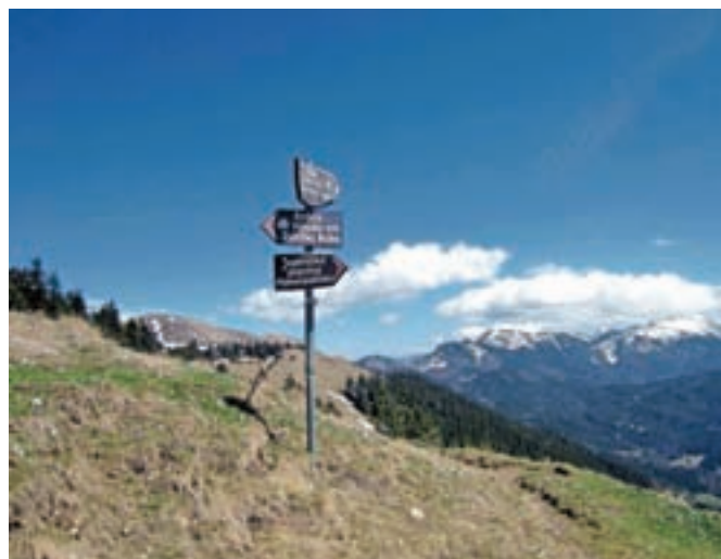
Vezna pot med Dovško Babo in Stolom. Pri smerokazu zavijemo desno.

itd. Pod Klekom na severni strani vidimo avstrijsko koč na Rožci, na južni strani pa našo koč na Rožci. Še malce naprej od sedla Rožca zagledamo koč na Hruškanski planini. S Kleka sestopimo po mejnem grebenu, na njegovo zahodno