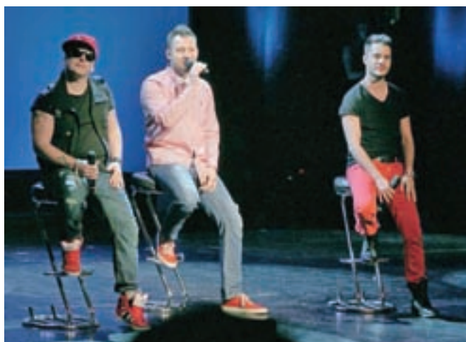
Pop skupina Game Over