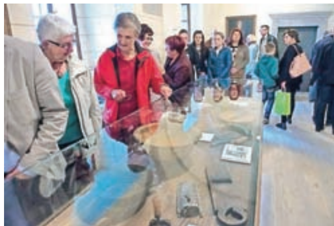
Visoški dvorec je z zadnjo prenovu in novimi stalnimi razstavami spet zasijal v polnem sijaju.

prizadevanj Občine Gorenja vas - Poljane ter strokovnjakov Loškega muzeja in Zavoda za varstvo kulturne dediščine. V veži domačije so