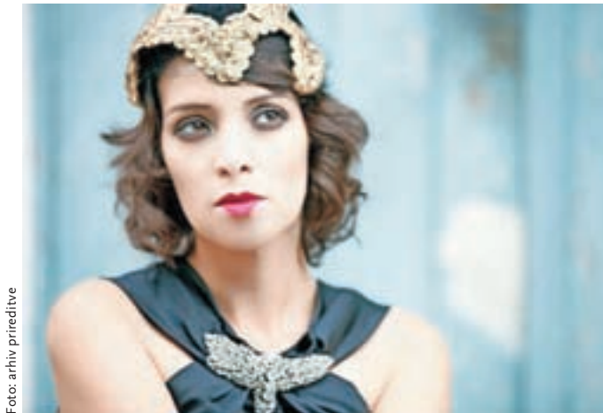
Odlična gvatemalska pevka Gaby Moreno bo na odru Letnega gledališča Khislstein nastopila v sredo, 18. maja.

V sodelovanju z lokalnimi društvi in organizacijami bo Klub študentov Kranj poskrbel za najdaljši teden v letu in organiziral številne koncerte različnih glasbenih zvrsti. Eden izmed glasbenih vrhuncev festivala bo pripadel z latinskim grammyjem nagrajeni pevki Gaby Moreno. Na TrainStation Squatu bomo poleg legendarne pank-rokove skupine Ritam Nereda slišali tudi enega najboljših latvijskih bendov, Carnival Youth. Fantje s karizmatičnim nastopom nadgrajujejo indie-glasbo, kot inovativno pa lahko opišemo tudi mešanje zvrsti in stilov zagrebške skupine ABOP. Med nastopajočimi