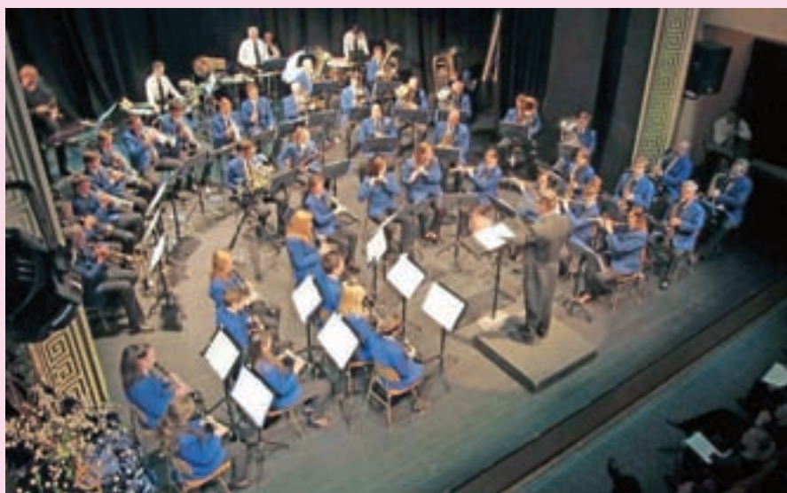
Orkester Jesenice - Kranjska Gora z dirigenti dirigentske šole