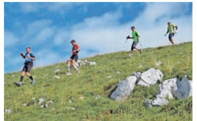
Sky run: tekači bodo obiskali večino krvavskih planin.

gnju si bomo ob tekaških filmih skupaj s priznanimi slovenskimi tekači izmenjali nasvete in taktične zamisli za pravi Sky run, ki nas bo čakal prihodnje jutro. Nedeljski Sky run z začetkom ob 10. uri bo letos na voljo v dveh različicah: težji, 21-kilometrski, s 1800 metri vzpona, in lažji, 10-kilometrski, ki bo namenjen rekreativnim tekačem in planincem. Na poti bomo obiskali večino krvavskih planin, se na daljši prog povzpeli na vrh Kalškega grebena ter