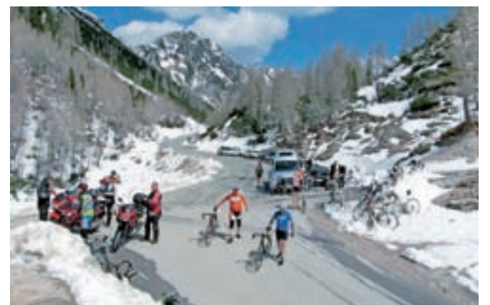
Motoristi in kolesarji so že krstili očiščeno cesto na Vršč.

Vršč – Takoj po odprtju Ruske ceste na Vršču, ki so jo po obilnih padavinah za prvomajske praznike znova očistili, so cesto zavzeli kolesarji in motoristi. Med prvimi obiskovalci najvišjega slovenskega cestnega prelaza so bili zlasti motoristi in kolesarji iz sosednjih držav, Italije, Avstrije in Nemčije, pa tudi slovenski, ki jim vzpon na Vršč vedno pomeni velik izziv, ki vrhunec doseže s poletnim tradicionalnim jurišem na Vršč. Sneg, ki sicer hitro kopni, pa še vedno predstavlja nevarnost pri turah na okoliške vrhove. Ruska cesta na Vršču bo konec julija letos z napovedanim obiskom ruskega predsednika Vladimirja Putina tudi obeležila stoletnico tragedije na Vršču, kjer je 8. marca 1916 snežni plaz pokopal okoli tristo, po nekaterih informacijah pa celo šeststo ruskih vojni ujetnikov.