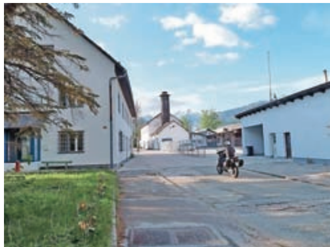
Zahodom v nekdanjo smodnišnico se razteza kar šestdeset hektarov zemljišč, ki za Občino Kamnik predstavljajo prav poseben izziv.