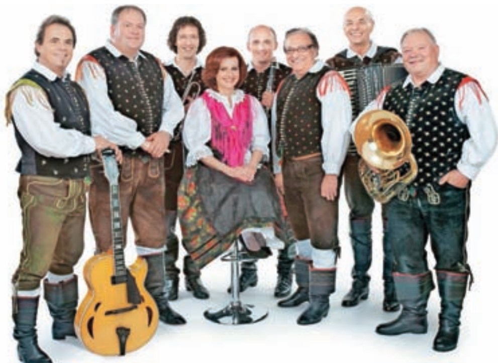
Alpski kvintet konec tedna vabi na Alpski večer, praznuje pa tudi petdesetletnico delovanja.