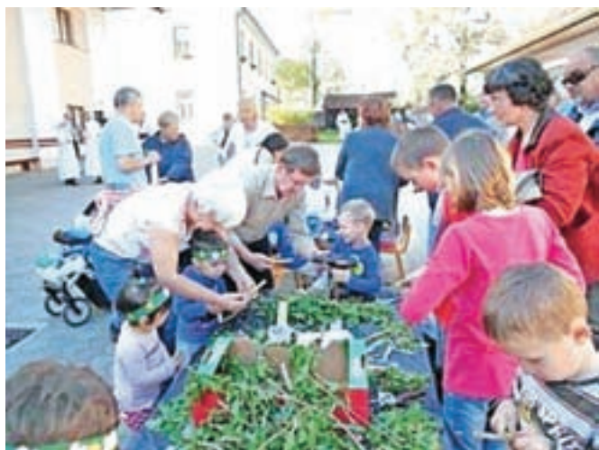
Svoje spretnosti so otroci in stari starši pokazali pri ustvarjanju z naravnimi materiali.