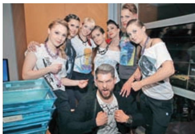
Kandidatke za miss borilnih veščin v družbi zabavnega Klemena Bunderle