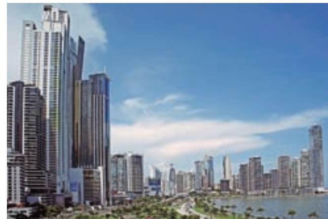
Panama City (Ciudad de Panama), leglo afere Panamski dokumenti in eno od zatočišč kapitala, ki beži pred obdavčenjem.