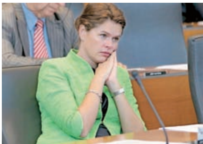
Ali poslanka Alenka Bratušek vrača udarec predsedniku protikorupcijske komisije Borisu Štefanecu?