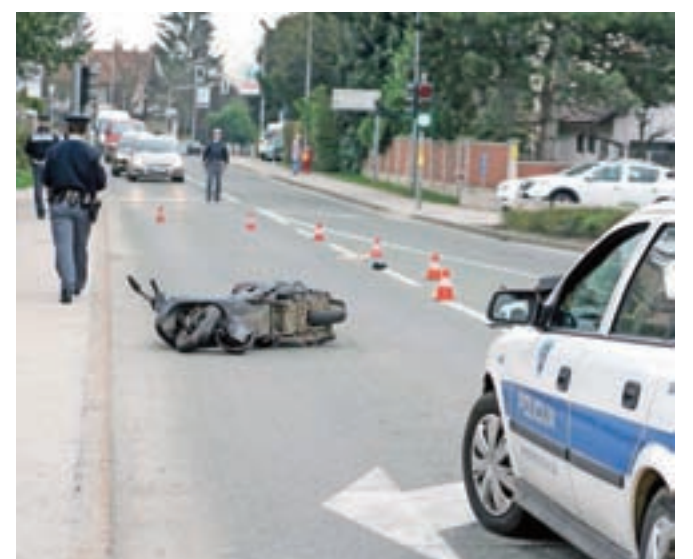
Motoristična sezona se še niti začela ni, pa so ceste terjale že šest življenj motoristov (slika je simbolična).

AVP je sicer ravnokar izvedla dvotedensko nacionalno akcijo osveščanja glede varnosti motoristov, v okviru katere je opozarjala tako motoriste na previdno vožnjo in upoštevanje vremenskih in prometnih razmer, kot tudi druge udeležence v prometu, naj bodo pozorni na motoriste. Prvič doslej se