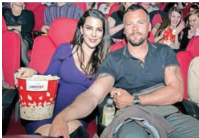
Novo komedijo so si v moški družbi ogledale manekenka Iris Mulej ...