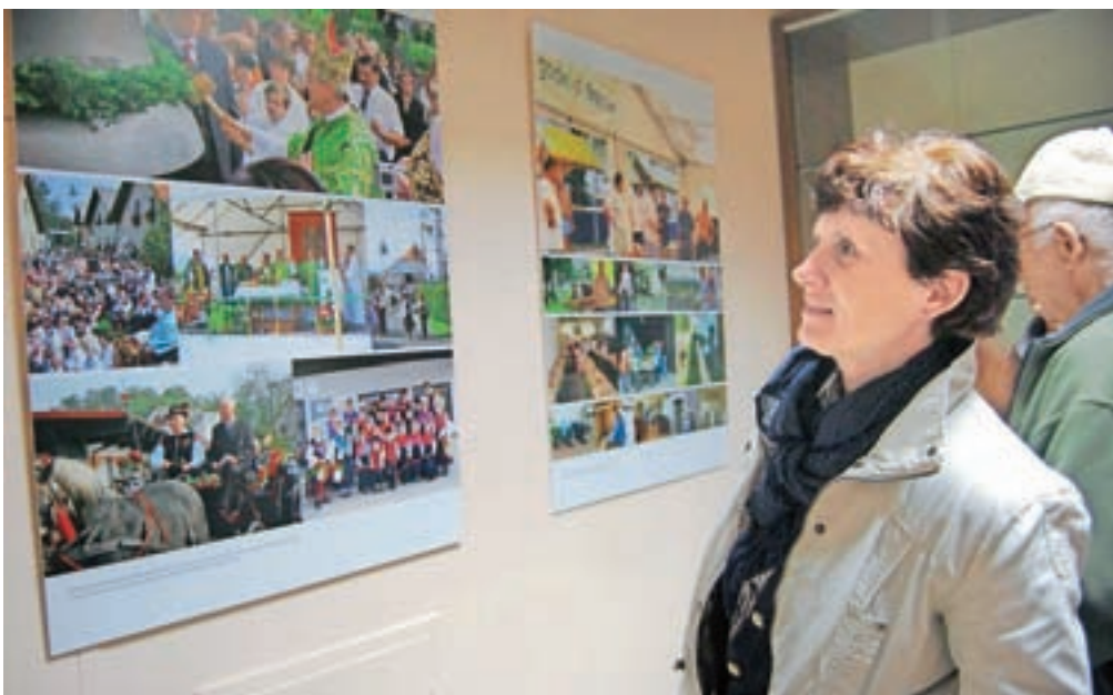
Obiskovalci doma Krajevne skupnosti bodo lahko skozi fotografsko razstavo obujali spomine na številne prireditve ob tisočletnici Godešiča.