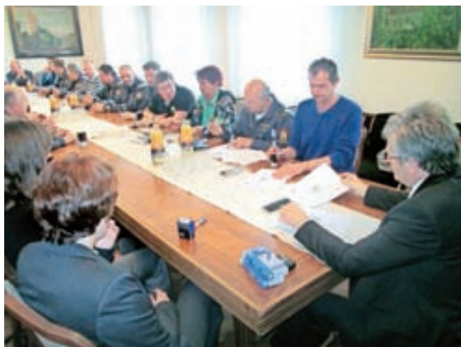
Ob podpisu dogovora

defibrilacijo v času znotraj petih minut po nenadnem srčnem zastoju kjerkoli na območju občine Radovljica. Občina Radovljica za izvedbo projekta zagotavlja ustrezno opremo za izvedbo izobraževanj (lutke, učne AED-je) ter opremo za prve posredovalce (žepne maske, dihalne balone). V proračunu je letos v ta namen zagotovljenih