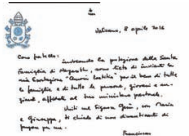
Lastnoročni kirograf papeža Frančiška, s katerim je pospremil objavo apostolske spodbude o ljubezni v družini – Amoris Laetitia.