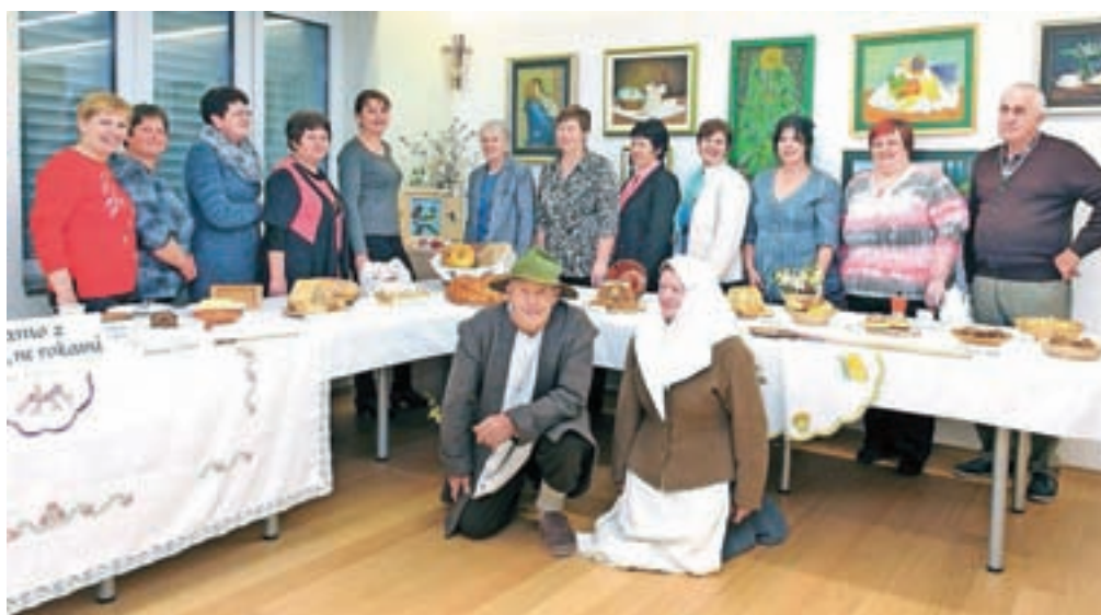
Ob jubileju so članice Društva podeželskih žena Blegoš pripravile tudi razstavo svojih izdelkov.