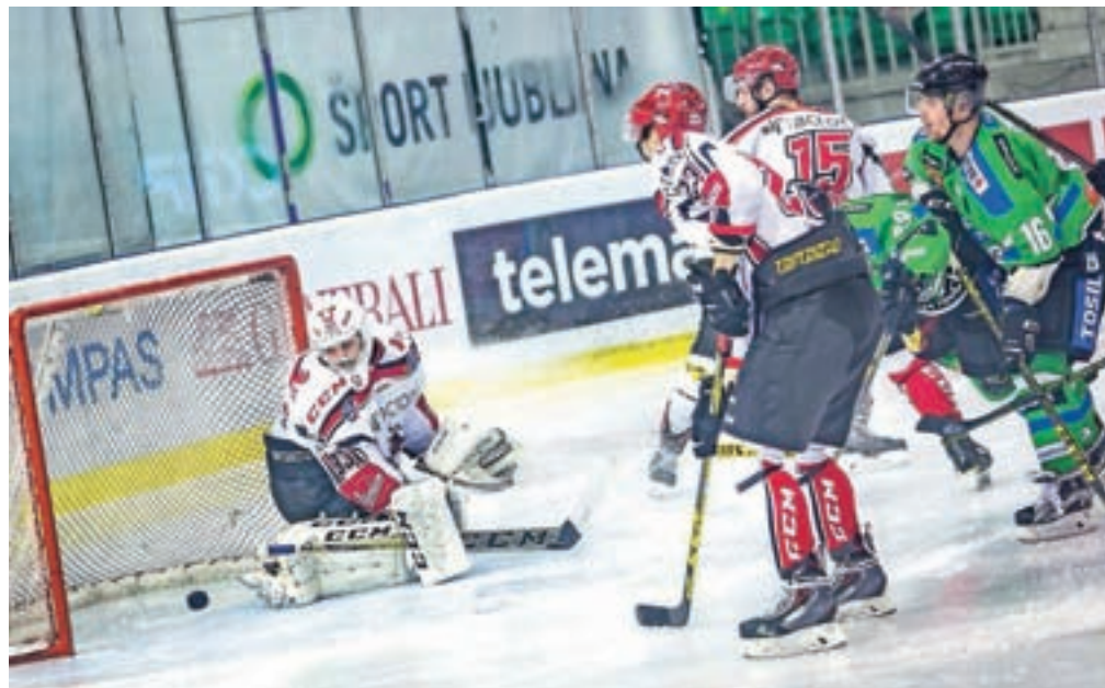
S peto finalno tekmo v Tivoliju, ki so jo dobili igralci Telemacha Olimpije, se je končala domača hokejska sezona, reprezentanco pa čaka še nastop na svetovnem prvenstvu.

Kakšna bo nova hokejska sezona v domačem prvenstvu in predvsem v ligah INL ter EBEL, trenutno še ni jasno, saj naj bi bil šele ob koncu tega meseca znan sistem tekmovanja v obeh avstrijskih mednarodnih ligah, kjer tudi še ni znano, koliko ekip