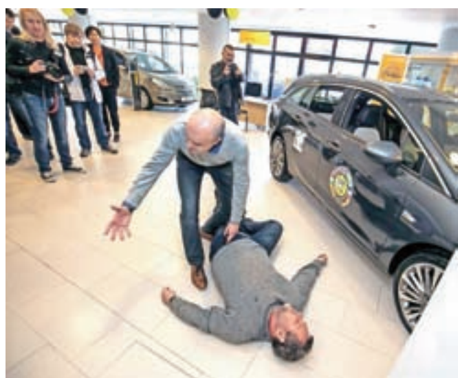
Simulacijo delovanja sistema M-SOS so nam prikazali v prostorih Avtotehne Vis.

identifikacije poškodovancev in s tem zagotavlja tudi izboljšanje učinkovitosti prve pomoči in hitrejše reševanje življenja. Reševalcu s pomočjo unikatne ID-kode in SMS-sporočila v izredno kratkem času posreduje ponesrečenčeve vitalne zdravstvene podatke. Ko najdete ponesrečenca, na njem poiščete nosilec v obliki zapestnice, nalepke na čeladi ali obeska okrog vratu. Vsak nosilec ima edinstveno ID-številko, ki jo pošljete preko SMS-sporočila na 041 301 501. Ta telefonska številka je zapisana na vseh nosilcih. V obliki povratnega SMS-sporočila prejmete v času od treh do desetih sekund podatke o ponesrečencu, ki so ključni za učinkovito in ustrezno oskrbo na kraju nezgode.