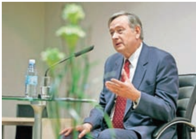
Nekdanji predsednik republike je v sredo v Združenih narodih predstavil kandidaturo za generalnega sekretarja svetovne organizacije.