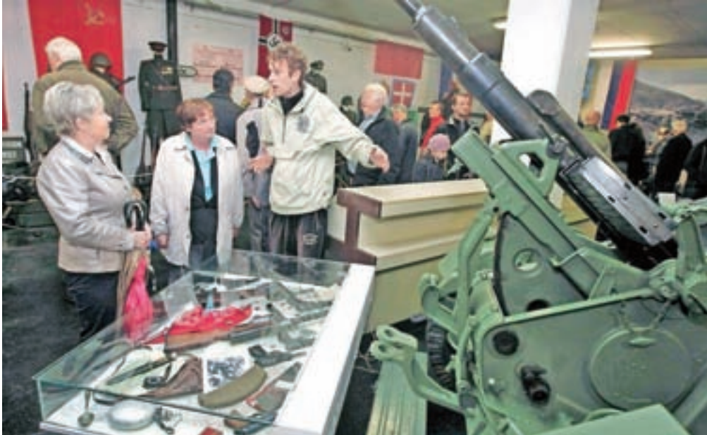
Vojni muzej v Kamniku je ob odprtju že privabil številne obiskovalce, v prihodnje pa ga bodo odprli po predhodnem dogovoru.

»V muzeju predstavljamo delček naše vojaške zgodovine, od 1. svetovne vojne do osamosvojitve. Vse te vojske so šle čez naše ozemlje, so se na teh tleh borile in pustile neki pečat, zato smo se odločili, da v spomin na te padle borce in te vrednote, ki jih goji naše društvo, odpremo muzej in se tako na skromen način poklonimo svojim prednikom, ki so se bojevali za to, da smo ohranili svoj jezik in da smo danes tukaj, kjer smo. Od Maistrovih borcev pa do osamosvojitve smo zbrali nekaj ostalin vojaške tehnike, orožja, uniform in tudi dokumentov, ki pričajo o tej zgodovini, posebno pozornost pa smo namenili tudi nekdanji kamniški smodnišnici, v kateri so izdelovali odlični