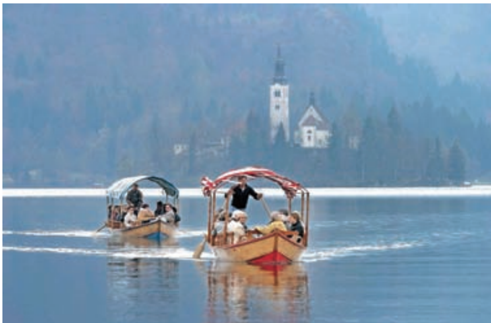
V ponedeljek zvečer so pletne vrnili na vodo.

»Na sestanku smo samo potrdili rešitve, ki smo jih v odlok vključili že prejšnji teden,« je pojasnil Berčon in