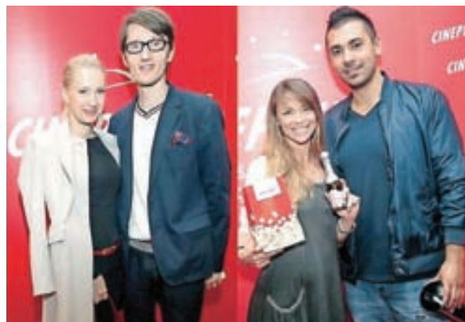
... ter modna oblikovalka Maja Ferme in plesna koreografinja Azra Selimanovič.