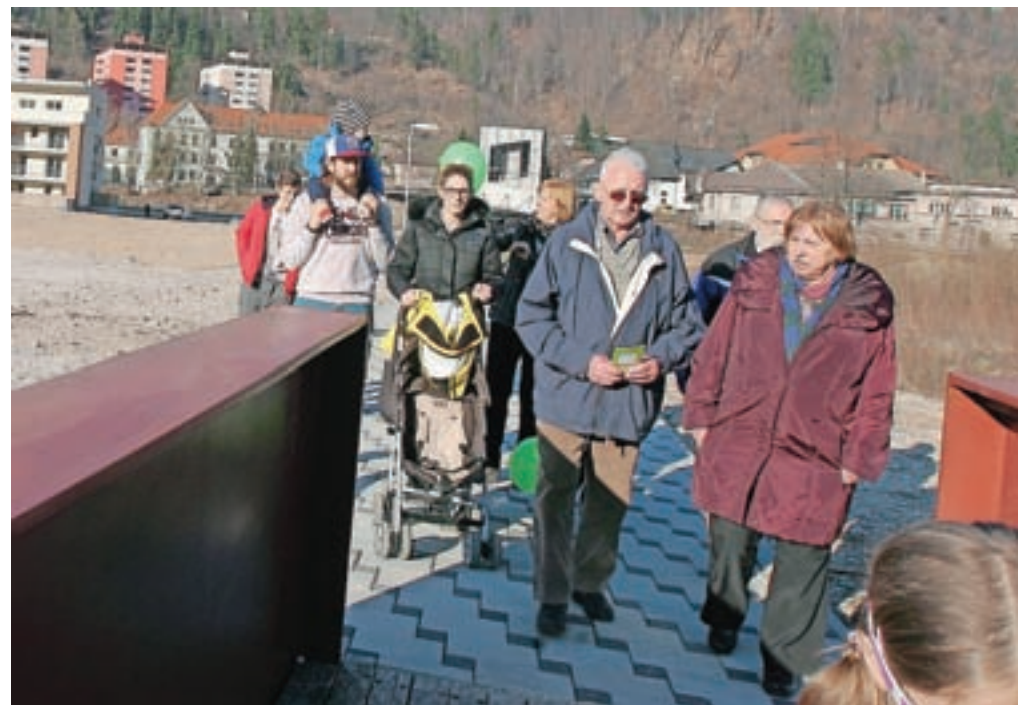
Prihodnje generacije se bodo upokojevale v starosti od 63 do 67 let.