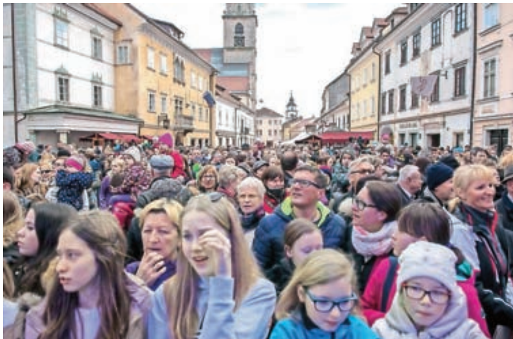
Da domačini radi pridejo v stari Kranj, so dokaz vsi dogodki, ki tam potekajo, trgovci in gostinci pa so si enotni, da bi jih moralo biti še več.

Prav tako se je okoli dvajset zbranih trgovcev in