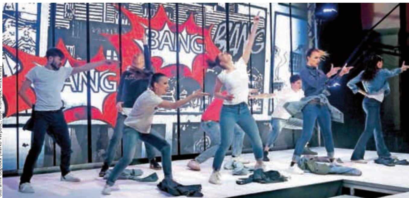
Plesalci in igralci so se prepustili igri komunikacije z ekrani, ki je na duhovit način zabavala obiskovalce.