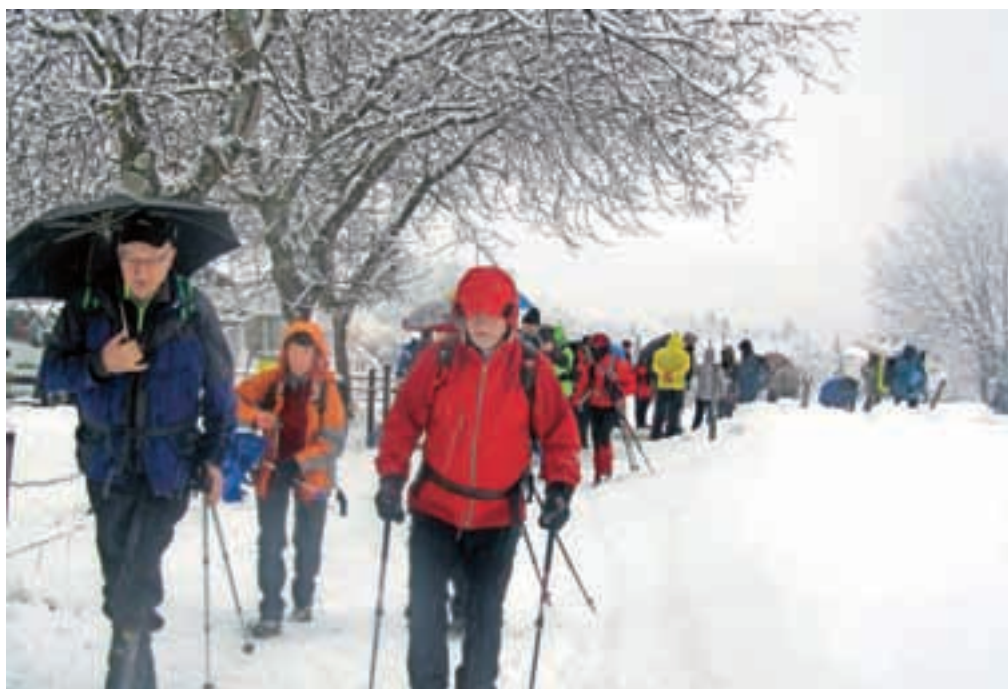
Sneg in dež sta spremljala pohodnike na skoraj štiri ure trajajoči poti do planine in nazaj.

Tudi letos je bilo precej pohodnikov z gorenjske strani. Gorenjci smo poleg Štajercev in Primorcev redni pohodniki k Arihovi peči in na Bleščečo planino. Pohod se je tudi letos začel pri kmetu Polancu na Čemernici nad Šentjakobom in se nadaljeval do Arihove peči, pod katero so februarja leta 1945 izdali in uničili partizanski bunker, in