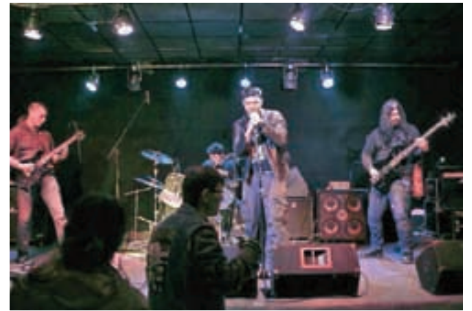
Spektakularna vrnitev na glasbeno fronto: nastop skupine Paragrab pred navdušeno množico