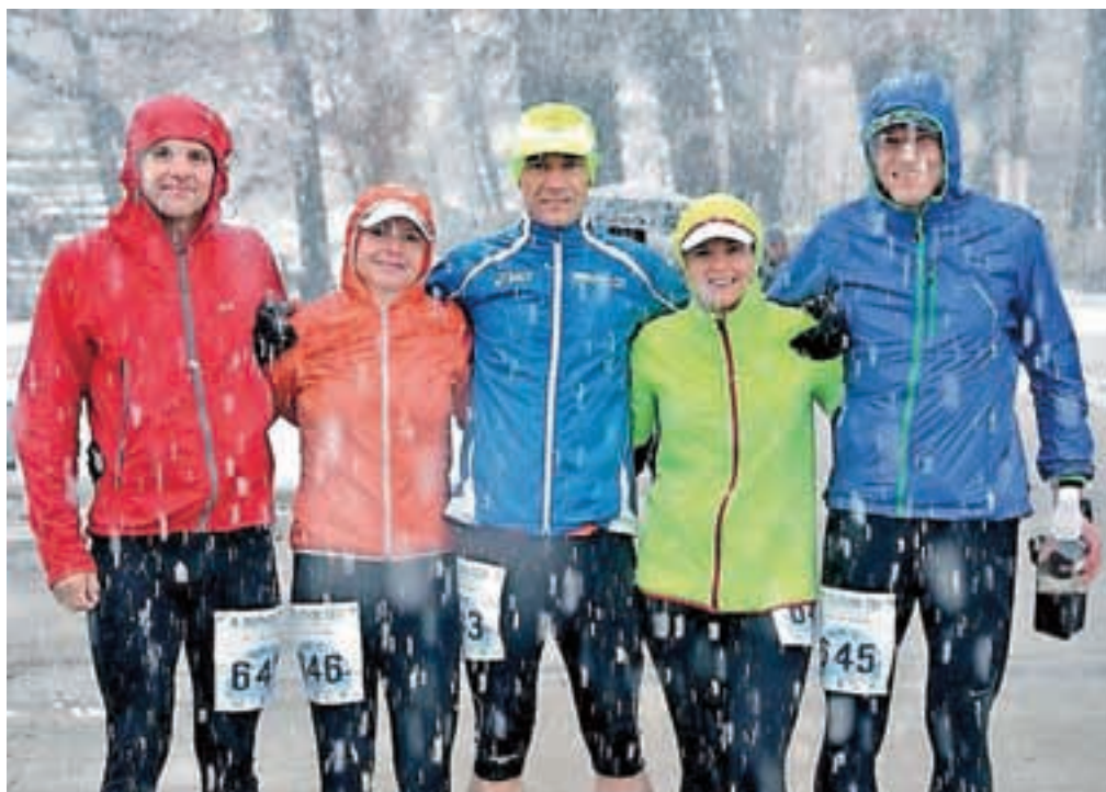
Niti dež, sneg in mraz niso bili ovira za 893 tekačev, kolikor jih je teklo okoli Blejskega jezera od petka do nedelje.