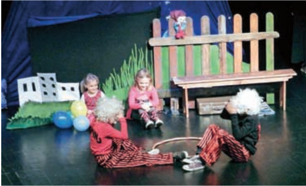
S slovensko pravljico se bodo predstavili v Avstriji, Italiji in na Hrvaškem, povabilo so dobili celo iz Argentine.