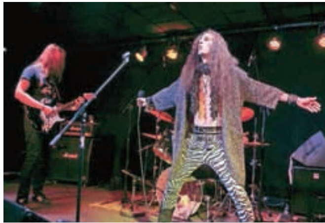
Energija sleaze rokenrola: medvoška zasedba Street Creeps na odru Trainstation Squata

"Vsem nastopajočim, obiskovalcem in drugim, ki nas tako ali drugače podpirate, se najlepše zahvaljujemo," sporočajo iz Trainstation Squata, kjer bodo že v marcu gostili uveljavljene glasbene izvajalce, kot so Ozric Tentacles, Extreme Noise Terror, Ritam Nereda, Werefox, Dubzilla, Jardier, Ponor, Iamdisese in drugi.