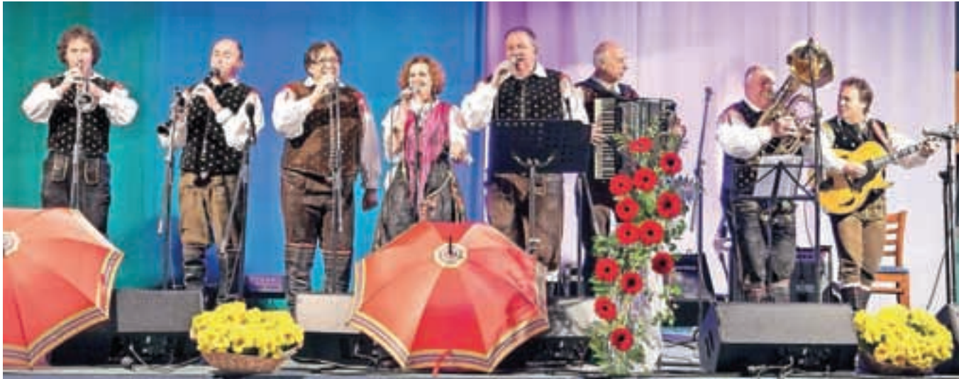
Osrednji gost letošnjega, že 6. gasilskega večera PGD Selca je bil Alpski kvintet z Otom Pestnerjem.

Konec tedna pa smo lahko začeli s spremljanjem dveh novih resničnostnih šovov, ki bosta kar nekaj časa prisotna na malih zaslonih: z Bilo je nekoč smo se prvič srečali v soboto, v hišo Velikega brata pa so se tekmovalci vselili že dan prej. Vendar je zanimivo, da tokrat med vsemi tekmujočimi nismo zasledili Gorenjcev. Mogoče ustvarjalci šovov načrtujejo kakšno kasnejšo vselitev. Bomo videli v nadaljevanju.