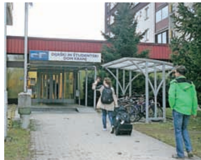
Nasprotovanje namestitvi šestih mladih prebežnikov v kranjski dijaški dom v javnosti, zlasti pa med pedagogi, še vedno močno odmeva.

Številnim kritikam sporne poteze 24 profesorjev Gimnazije Franceta Prešerna