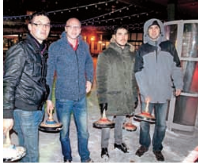
Najbolj vztrajnih ljubiteljev curlinga in druženja tudi sneg ni pregnal s simpatičnega blejskega drsališča na terasi.

odločila, da bo tokrat narosila kar dobro bero snega. Kljub temu so se najbolj vztrajni fantje vseeno spoprili z ledom in se preizkusili v curlingu. Večini je šlo met anje posebnih kegljev kar dobro od rok, sem ter tja pa se je kakšen tudi dejansko odbil od ledene ploskve. A to ni zmotilo tekmovalnega