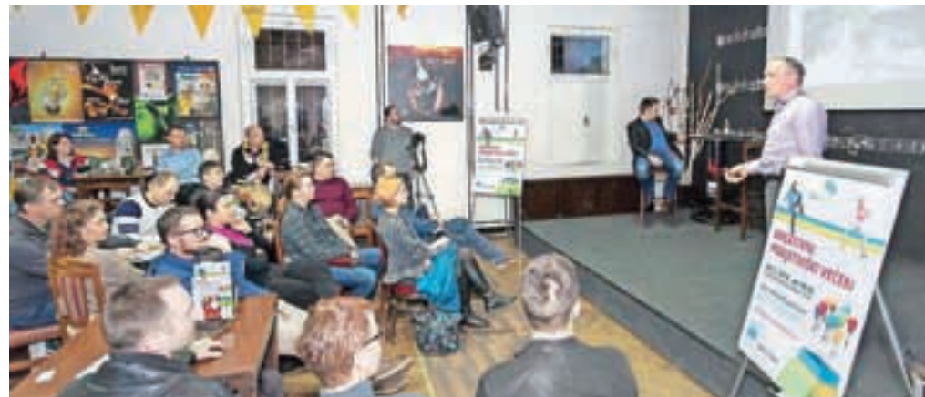
Prvi podjetniški večer v Trziču, ki je bil posvečen poslovnim priložnostim v turizmu, je bil dobro obiskan.

Drugi podjetniški večer z naslovom Kako začeti in zgraditi dober posel na internetu bodo v Trziču pripravili 24. marca, osrednja gostja bo Nastja Kramer.