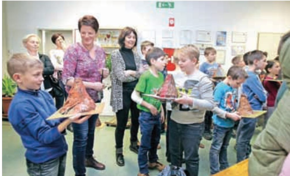
V Osnovni šoli Orehek se je v soboto odvijal Festival naše prihodnosti.

Svoje delo v delavnicah so učenci na koncu predstavili v avli šole. Tako so po šoli med drugim odmevale besede tudi v angleškem in francoskem ter celo grškem in kitajskem jeziku. Francoski jezik so spoznavali na delavnici S pesmijo po Parizu, angleškega v okviru delavnice Fun-tastic English, grške fraze so spoznali na Potovanju po Grčiji, na delavnici