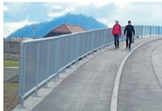
Nov pločnik in ograja na strahinjski strani nadvoza nad avtocesto v Naklem / Foto: Jože Košnjek

zgradila 120 metrov dolg in 1,6 metra širok pločnik na strahinjski strani nadvoza gledano od Nakla proti Strahinju. Urejena sta bila tudi podporni zid in ograja. Letos namerava občina zgraditi podoben pločnik tudi na nakljanski strani nadvoza. Na samem nadvozu in na cesti od nadvoza do Strahinja pa je pločnik že zgrajen.