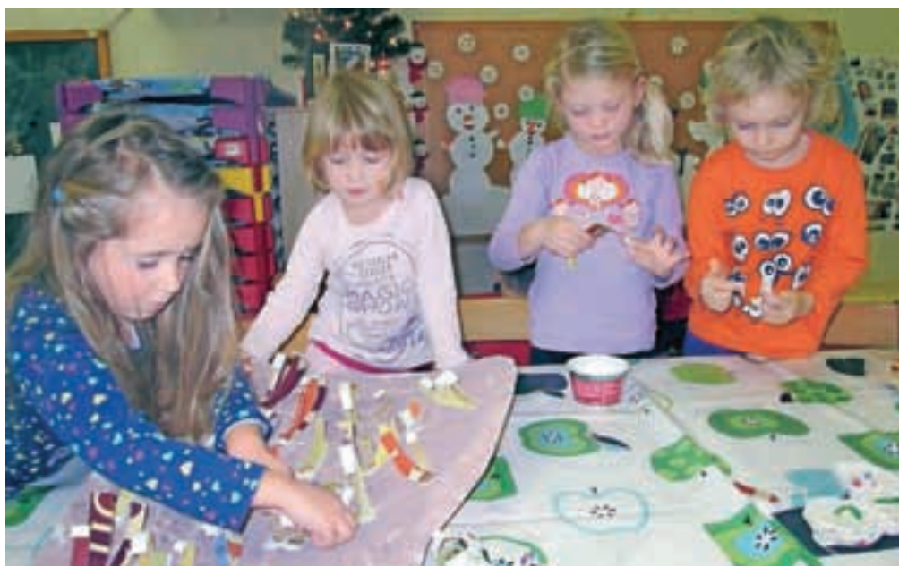
Otroci so najbolj uživali pri izdelovanju skupne maskote, Zverjasca.