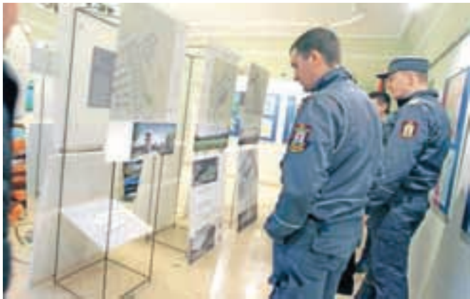
Razstava natečajnih rešitev za Regijski reševalni center Radovljica bo v prostorih Občine Radovljica na ogled do konca marca.

Projekt izgradnje Regijskega reševalnega centra je vključen v Regionalni razvojni program Gorenjske 2014–2020, kar omogoča kandidaturu na razpisih za nepovratna evropska sredstva. Ocenjena vrednost projekta je tri milijone evrov. Zaključenemu natečaju bo na podlagi izbrane rešitve sledila izdelava podrobnega prostorskega načrta in nato investicijske ter projektne dokumentacije za gradnjo objektov na tem območju, so pojasnili na Občini Radovljica.