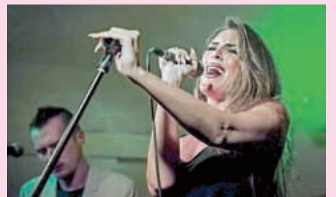
Kmalu v KluBar prihaja Muff.

Kranj – V soboto, 5. marca, bo od 21. ure naprej v Rock Baru Down Town potekala hipijada. Obeta se vrnitev v čase Woodstocka in glasbenih legend iz 60-ih in 70-ih let. Za jagodni glasbeni izbor bo poskrbel Jaka Čimžar - Indijanc.