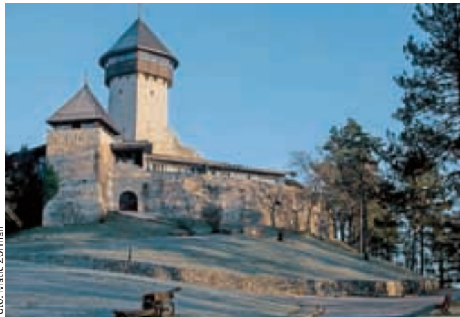
Preživeli ostanki preteklosti: Stari grad v Veliki Kladuši