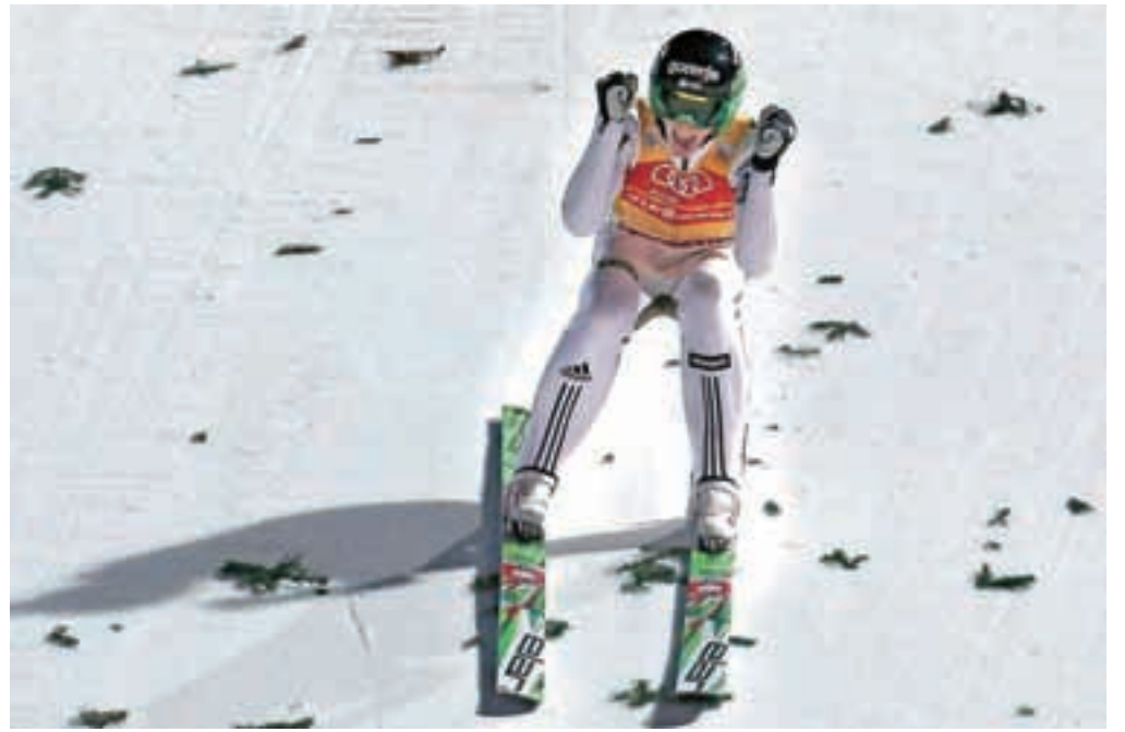
Peter Prevc je v tej sezoni zmagal na novoletni turneji, osvojil zlato odličje na svetovnem prvenstvu v poletih in si minulo nedeljo že priboril tudi veliki kristalni globus.

več razmišljati. Zdaj upam, da bo šlo nekako umirjeno naprej.« S 13. zmago v sezoni in prednostjo 619 točk pred zadnjimi šestimi posamičnimi tekmami je zdaj pred Petrom samo še en izziv. To pa je osvojitve malega kristalnega globusa za skupno zmago v poletih. A še pred Planico se svetovni pokal že ta četrtek s kvalifikacijami nadaljuje v poljski Wisli, kjer bosta tekmi v petek in soboto, sledili pa bosta še tekmi naslednji teden v Nemčiji.