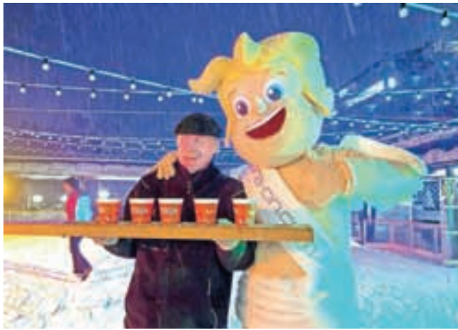
Prisotne so ogreli topli napitki, ljubezenski napoj in tudi prisotnost kupida, maskote spletnega portala on-on.com.

Žal je zabavo malce pokvarilo vreme, saj se je narava