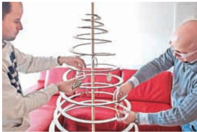
Na koncu jo še okrasimo.