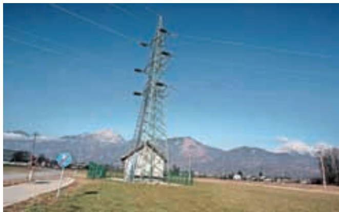
Trasa novega daljnovoda se bo pričela pri obstoječem daljnovodu na Visokem pri Kranju.

stroške predvidoma razdelila po teritorialnem ključu. »Državni prostorski načrt naj bi bil sprejet predvidoma v letu 2017, po pridobitvi gradbenega dovoljenja