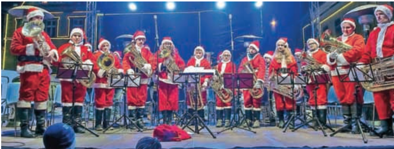
Tuba božički so letos nastopili v razširjeni zasedbi, saj so se učencem Glasbene šole Kranj pridružili tudi gostje. Na koncertu božičnih pesmi je tako moči združilo kar 30 tubistov in evfonistov.