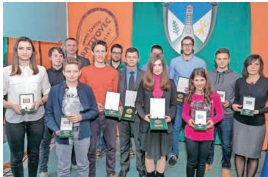
V občini Železniki so ponosni na svoje odlične športnike, športne delavce in društva, med njimi sta tudi smučarska skakalca Domen in Peter Prevc.