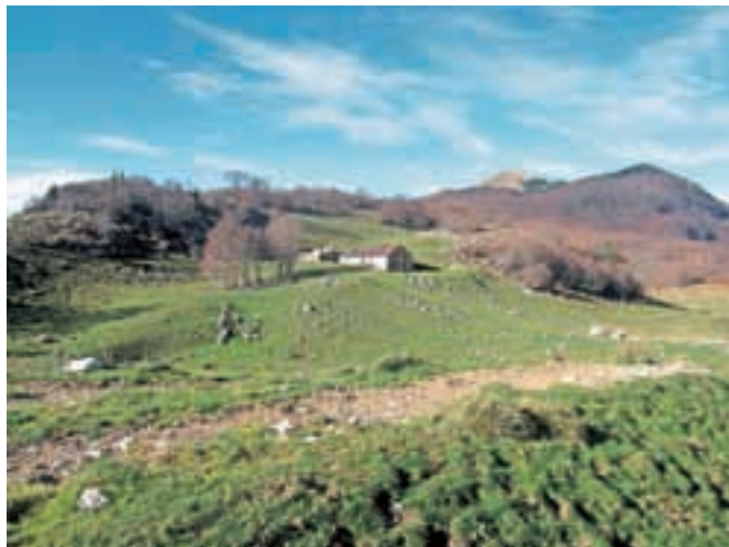
Planina Zapeč, povsem zadaj pa Krasji vrh

Nadmorska višina: 1772 m Višinska razlika: 572 m Trajanje: 3 ure in 30 minut Zahtevnost: ★★★★★