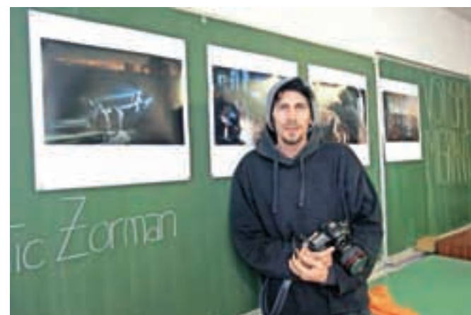
Na ogled je bilo tudi nekaj fotografij, ki jih je na različnih mejah posnel priznani fotograf Gorenjskega glasa Matic Zorman in so bile po končanem dogodku (nekaj jih je še) na voljo za odkup. Izkupiček bo namenjen za migrantske družine v stiski.