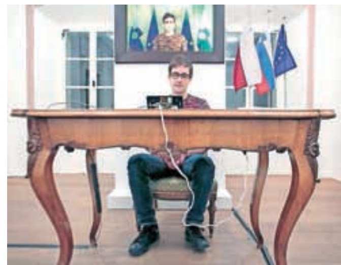
Dober dan, gospod predsednik je interaktivna instalacija, v katero vsak obiskovalec vstopa posamezno.

da bomo tudi v prihodnje še sodelovali in da bomo poleg programiranja lahko vključili tudi hardware informatiko, robotiko in podobno, kar izobražujemo v naši šoli.«