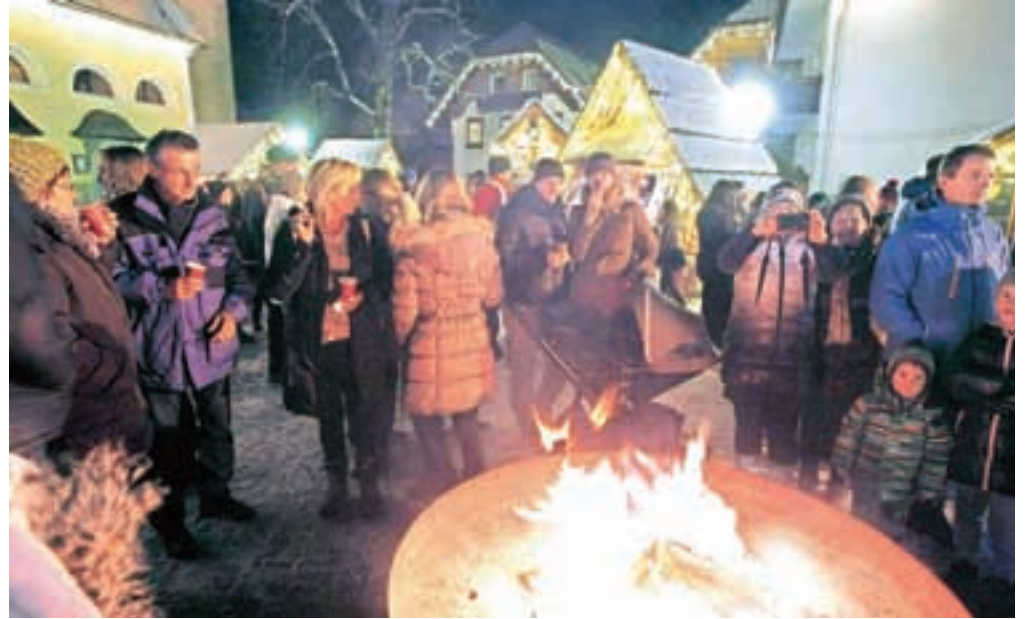
V gorenjskih turističnih krajih so za goste pripravili pestro praznično ponudbo – na fotografiji Alpska vas v Kranjski Gori.