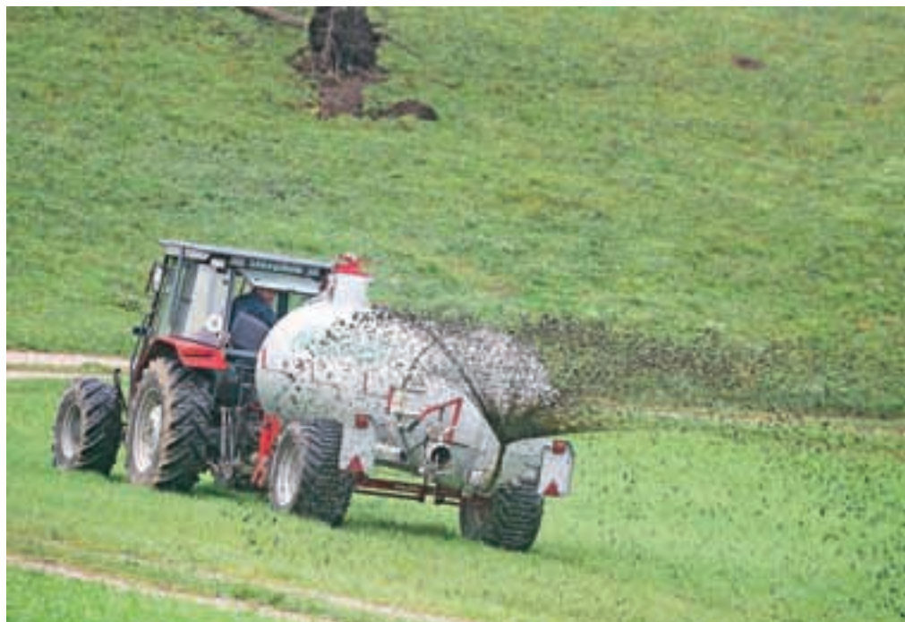
Zahteve za gnojenje z živinskimi gnojili so vse strožje.

za dva meseca (prej za štiri mesece), odložiti na kmetijskem zemljišču, pri tem pa je treba vsako leto zamenjati lokacijo. Drugačna ureditev velja za perutninski gnoj z nastiljem, ki izvira iz talne reje. Ta gnoj je pod določenimi pogoji možno skladiščiti na kmetijskem zemljišču do šest mesecev, pri tem pa ga je dovoljeno iz hleva takoj prepeljati na zemljišče, ne da bi ga bilo treba prej skladiščiti na gnojšču.