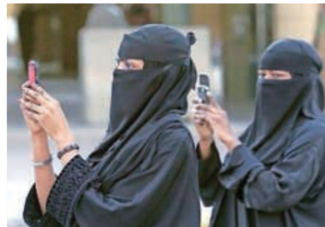
Ženske v Savdski Arabiji nosijo burke in uporabljajo mobilne telefone, nedavno so šle prvič volit.