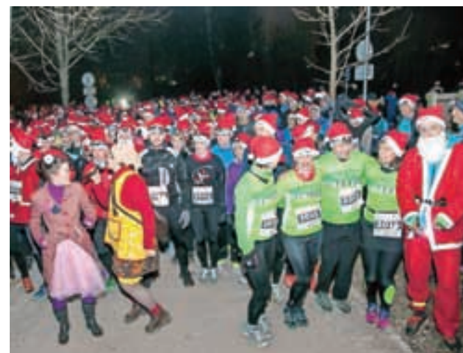
Tekalci in pohodniki so bili opremljeni z rdečimi kapami.

Ljubljana – Športni navdušenci z rdečimi kapami so se pred dnevi že dvanajstič podali po tivolski progi Dobrodelnega teka in pohoda Božičkov. Zbralo se jih je kar osemsto, vse do konca 6- ali 12-kilometerskega teka in dvokilometerskega pohoda pa so jih bodrili klovni, Božiček in drugi navijači, po prihodu v cilj pa so se še vsi okrepčali z malico. Organizatorji so skupaj s prijavitelji zbrali štiri tisoč evrov in jih po prireditvi predali veselim Rdečim noskom – klovnom zdravnikom.