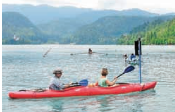
Glede plovbe po Blejskem jezeru obstajajo zelo različne želje in interesi.

Z novim odlokom pa predvidevajo tudi boljšo regulacijo oddajanja plovil oziroma njihovega vnosa za lastne, rekreacijske potrebe ter zaračunavanje pristaniške takse. »Če bodo uveljavljene določene rešitve, zlasti glede oddajanja pravic do privezov in zaračunavanja pristojbin, se prihodek občine ocenjuje na 150 tisoč evrov letno.« Ta denar bi namensko porabili za vzdrževanje plovbnega režima, nadzor nad njim in v največji meri za urejanje obalne, zlasti pristaniške infrastrukture. »Takšen pritisk na jezero oziroma njegova raba pušča vidne posledice na obali jezera,« je opozoril Berčon in dodal, da je težava tudi v tem, da se nekaj desetletij obala ni sistematično urejala. Za njeno sanacijo bi po izračunih strokovnjakov potrebovali kar 17 milijonov evrov, je še navedel Berčon.