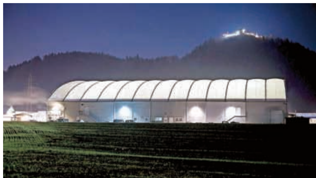
Odgovorni na kranjski občini so tudi pri postavitvi montažne večnamenske dvorane z drsališčem delali po domače, brez urejene dokumentacije in niso spoštovali načel gospodarnosti.

»Računsko sodišče je Mestni občini Kranj podalo priporočila za izboljšanje poslovanja, odzivnega poročila pa ni zahtevalo, ker so bile že med revizijskim postopkom, kjer je bilo mogoče, odpravljene razkrite nepravilnosti oziroma sprejeti ustrezni popravljalni ukrepi. Gledano v celoti, niso ugotovili velikih nepravilnosti. V večini primerov je šlo za priporočila računsko sodišča, ki pa jih žal ne moremo v celoti udeležiti, saj nam trenutno veljavni zakon ne dopušča nekaterih omejitev, ki nam jih je priporočilo računsko sodišče. To je na primer glede porabe sredstev pri svetniških skupinah. Na Mestni občini Kranj se seveda zavedamo velike pomembnosti transparentnega in pravnega poslovanja, in to je v mandatu 2014–2018 ena izmed najvišjih prioriteta delovanja kranjske občine,« pojasnjujejo na Mestni občini Kranj.