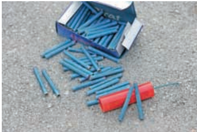
Prodaja in uporaba petard različnih oblik in moči je v Sloveniji prepovedana že vrsto let, a njihovi poki še vedno odmevajo po naseljih.

Po novi zakonodaji je uporaba pirotehničnih sredstev dovoljena samo do 1. januarja, in ne več do 2. januarja kot doslej.