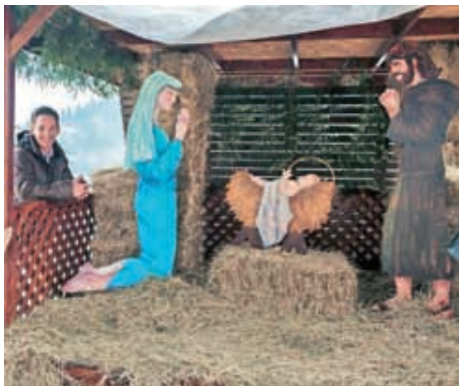
Idejni vodja postavitve jaslic ob sveti družini

Jaslice si bo mogoče ogledati do 10. januarja vsak dan med 16. in 20. uro. Praznično vzdušje bodo ob sobotah in na božični dan popestrili mladi pevci iz glasbenega centra DoReMi. Za ogled jaslic v Infrastrukturi Bled zaračunajo vstopnino, s katero bodo pokrili stroške postavitve in nadgradnjo jaslic prihodnje leto. Del sredstev, ki jih bodo zbrali z vstopnino, pa bodo namenili pevcem za nastop na festivalu v januarju.