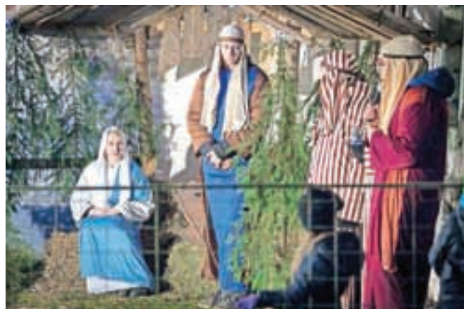
Letošnja postavitve živih jaslic je bila na novi lokaciji v Žiganji vasi – s kuliso ob cerkvi sv. Urha in v zavetju petstoletne lipe.

najmlajši člani Kulturnega društva Kruh, skupina Kajzerice, uprizorili Božično zgodbo, ki je bila letos še posebej prilagojena najmlajšim obiskovalcem. »Spoznali smo dogodke ob Jezusovem rojstvu in uživali ob petju mešanega cerkvenega pevskega zbora Župnije Križe. Nato je za najmlajše