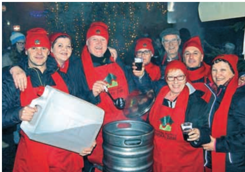
Zmagovalna ekipa Krajevne skupnosti Preska - Žlebe