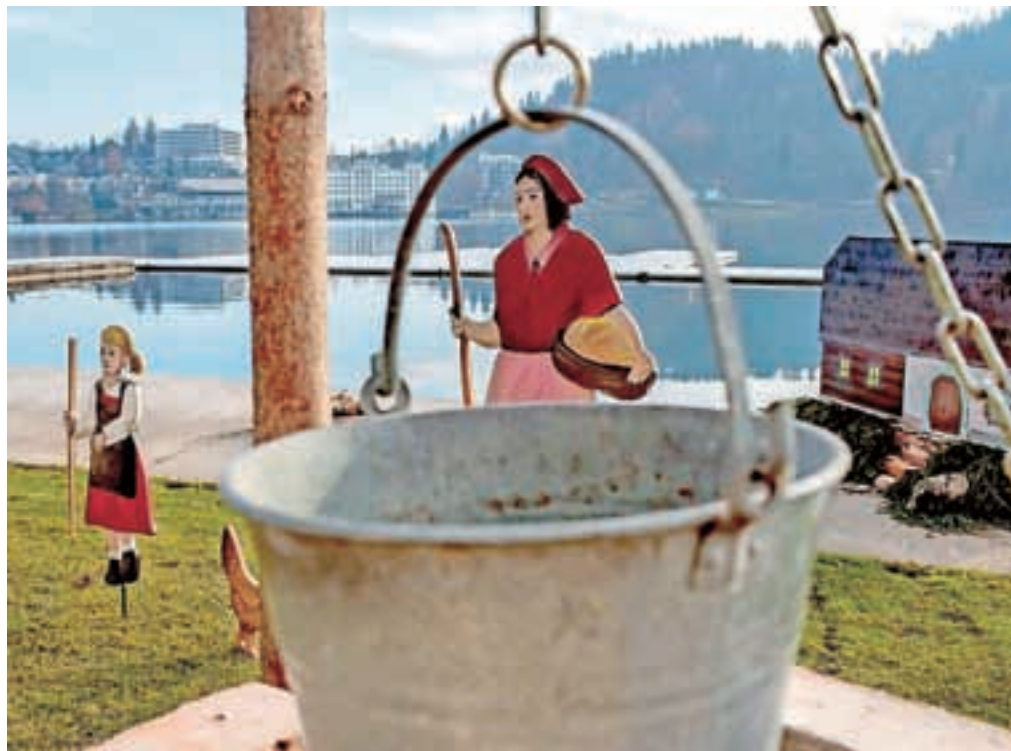
Na pomolih na Blejskem jezeru so postavili jaslice v naravni velikosti.

stiti na vrh Straže, a so se potem zaradi tehničnih in logističnih težav odločili za Grajsko kopališče. Pripravljati so jih začeli pred dvema mesecema. »Motive smo izbrali skupaj, pri tem pa smo upoštevali tradicijo.« Prvi