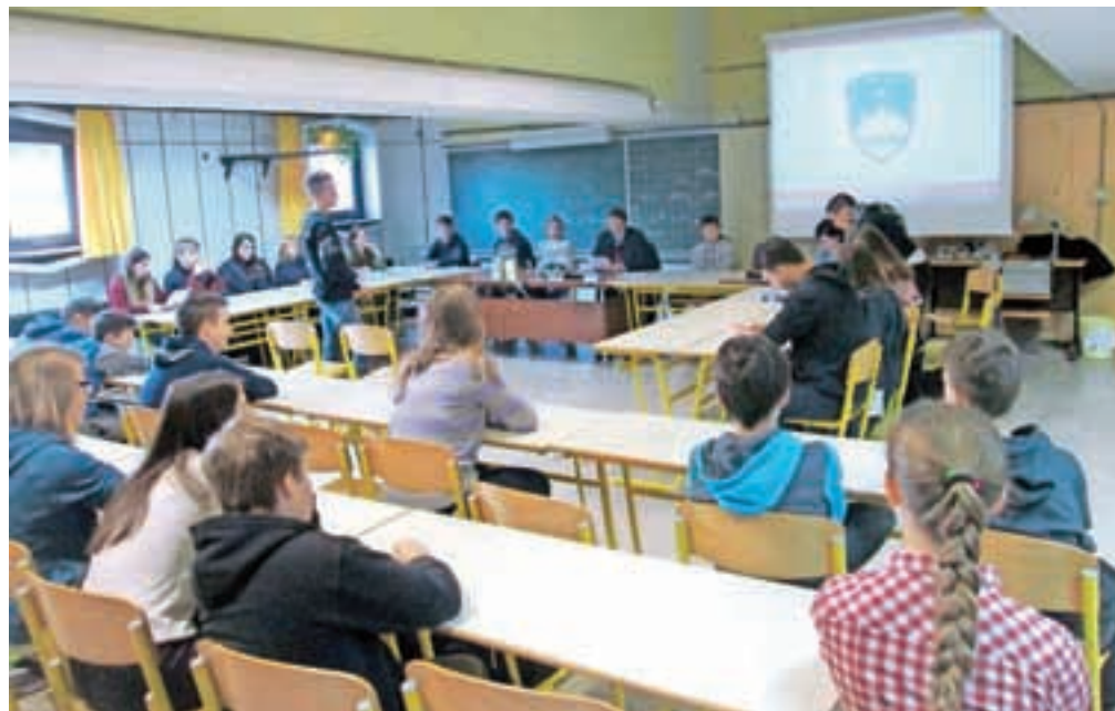
Šolska učilnica se je v ponedeljek za dobro uro spremenila v sodno dvorano.

Nastranova pa je za zaključek nagovorila zbrana devetošolce: »Res je vse skupaj morda videti kot predstava. Tudi nam pravnikom, ki smo na sodišču v različnih vlogah – odvetnikov, tožilcev, sodnikov – se pogosto zazdi, kot da smo v gledališču. A verjemite mi, da se tisti, ki je v vlogi obdolženca, pa tudi tisti, ki je oškodovanec, ne počuti dobro. Zato razmišljajte, preden se lotite nečesa, kar zakon prepoveduje. Zgodb z drogo, ki smo jo dali v današnji primer, je veliko, tudi v Radovljici. Ne vem, ali se dogajajo na železniški postaji ... morda pa tudi. Vsekakor upam, da imate toliko razuma, da boste pri praških ostali na varni strani izotoničnih napitkov. Drugega pač ne potrebujete.«