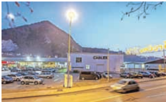
Na mestu nekdanjega Zlita je danes trgovski center.