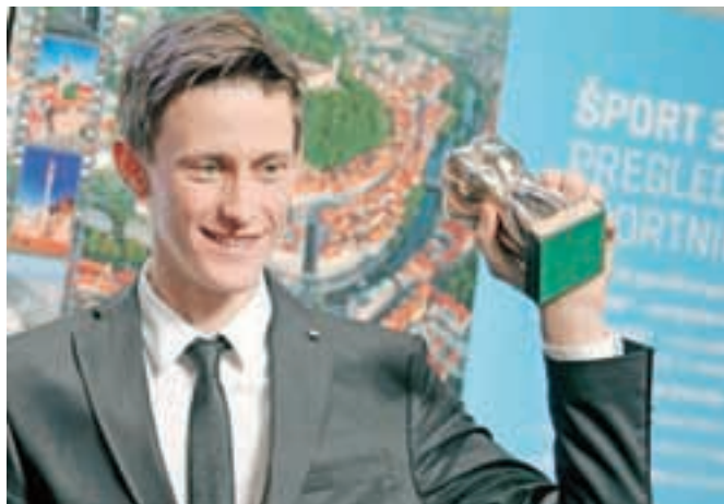
Uporabniki so v iskalnik spletne strani najdi.si med slovenskimi moškimi najpogosteje vpisali ime smučarskega skakalca Petra Prevca.