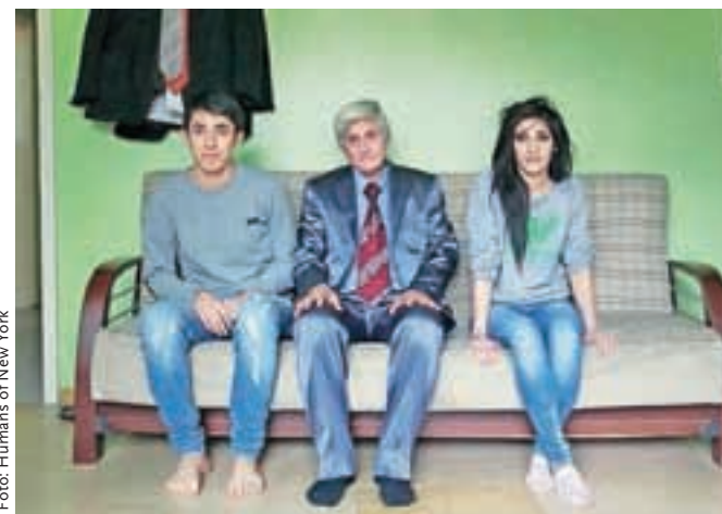
»Znanstvenik« s svojima otrokoma. Žena in hčerka sta umrli v napadu sirske vladne vojske na njihovo hišo, 2013.