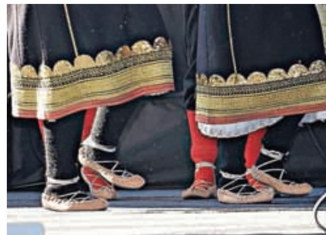
Folklorna skupina je najmočnejša sekcija, ki deluje v okviru KUD Vuk Karadžić.

Karadžića in Vidovdansko proslavo. Udeležujejo se tudi projektov, kjer sodelujejo z drugimi organizacijami in lokalnimi skupnostmi. Vsako leto tako folklorna skupina društva nastopi na regijskem srečanju folklornih skupin v Bohinjski Bistrici, regijski predstavitvi folklornih skupin manjšinskih etničnih skupnosti na Gorenjskem, Dnevi narodnih noš in oblačilne dediščine v Kamniku ter na Kulturni mavrici Jesenic.