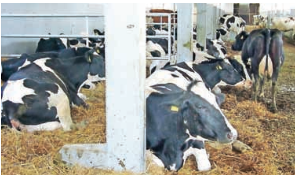
Kranjska Sloga je za hčerinsko podjetje KŽK, Kmetijstvo (na sliki farma v Cerkljah), v dogovorjenem roku prejela večino od 3,3 milijona evrov kupnine. Kupec Agro Gorenjska ji je dolžan samo še 200 tisoč evrov, ki jih sedaj zadruga zahteva po sodni poti.