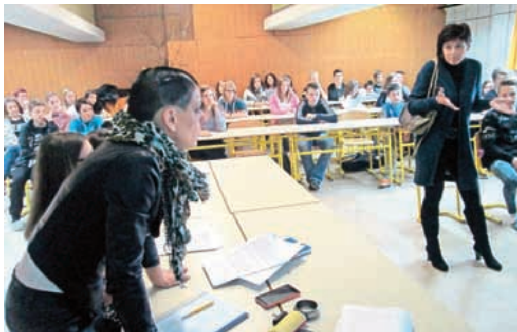
Priča: »Pri nas na postaji se ves čas kaj dogaja. Saj veste, cel kup ljudi, ki ves čas nekaj valjajo po rokah ...«