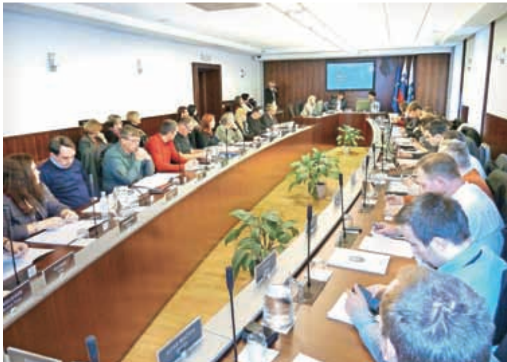
Kamniški svetniki so proračun za leto 2016 sprejeli že v začetku leta, skupaj s proračunom za 2015, a so morali nedavno obravnavati tudi večje spremembe.

Dohodnine bo predvidoma za pol milijona evrov manj. Prihodkov iz naslova davka na dediščine in darila bo na račun mekinjskega samostana precej več, kar 345 tisoč evrov, a ima hkrati občina 225 tisoč evrov za obnovo samostana po novem namenjenih tudi na odhodkovni strani. Novost je tudi koncesijska dajatev za greznice v višini pet tisoč evrov. Zaradi spremembe najemnih razmerij glede uporabe poslovnih prostorov v upravni