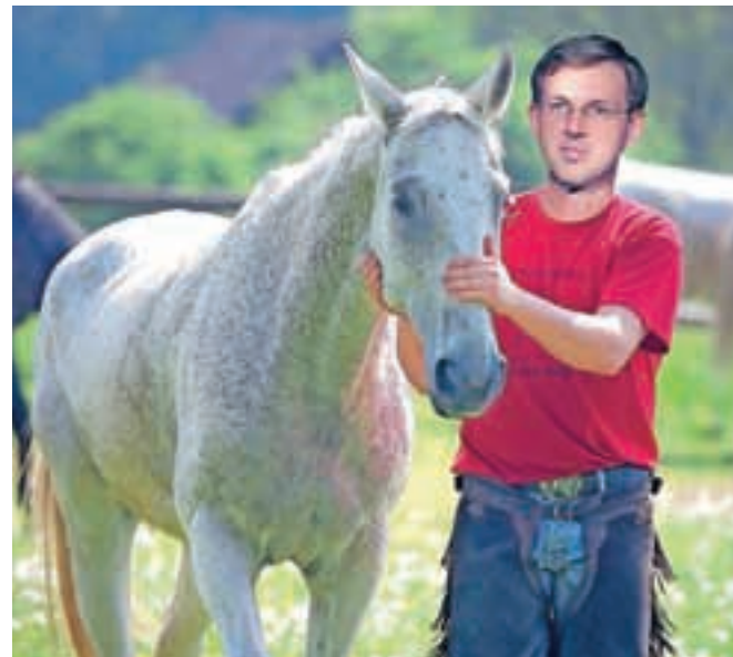
Topla greda bo naredila svoje, na štefanovo 2018 bo toplo kot še nikoli.

Kot preberemo v članku iz prihodnosti, se lastniki konj običajno že nekaj dni prej začnejo pripravljati na blagoslov. Politik Miro Cerar bo peljal svojega Cmerkota: »Moj konj je kultiviran, visokih moralnih načel in se ne boji blagoslova.« Miša Molk je v blagoslovu pripeljala novega konja Miška: »Sva si kar podobna, tudi on je rad v družbi drugih konjev.« Branko Đurič - Đuro in Tanja Ribič bosta k blagoslovu pripeljala svoja konja. »Moj žrebec Kajmak je komaj našel čas med vsemi svojimi snemanji v italijanskih vesternih, kobila Marmelada od moje Tanje