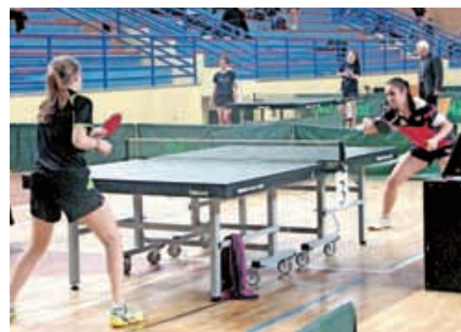
V Športni dvorani Poden so nastopili vsi najboljši mladi namiznoteniški igralci in igralki.