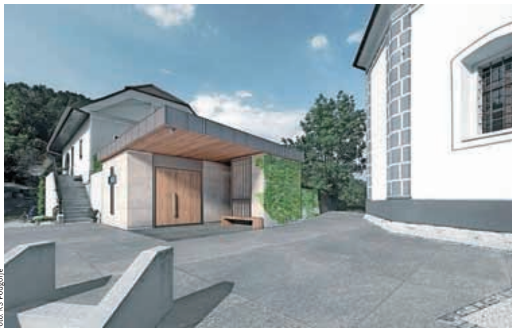
Takole bo videti mrliška vežica v Podgorju, na katero krajanje čakajo že štiri desetletja.

plezalko,« projekt opisuje vodstvo Krajevne skupnosti Podgorje, ki pa poudarja, da bo mrliška vežica financirana pretežno z donacijami krajanov in podjetnikov iz Podgorja. Nekaj denarja je že zbrana, večino pa ga je še potrebno pridobiti. V ta namen krajanje pozivajo, da lahko v Kulturnem domu Podgorje v času uradnih ur (vsak prvi ponedeljek v mesecu med 18.30 in 19.30) prevzamejo položnice za nakazilo. Če bodo pri zbiranju denarja uspešni, bi gradnjo lahko začeli že spomladi.