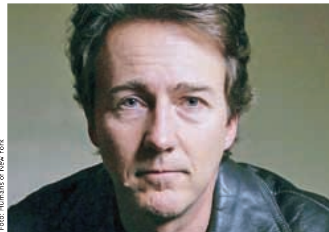
Ameriški igralec Edward Norton je spodbudil zelo uspešno akcijo zbiranja sredstev za »Znanstvenika«.