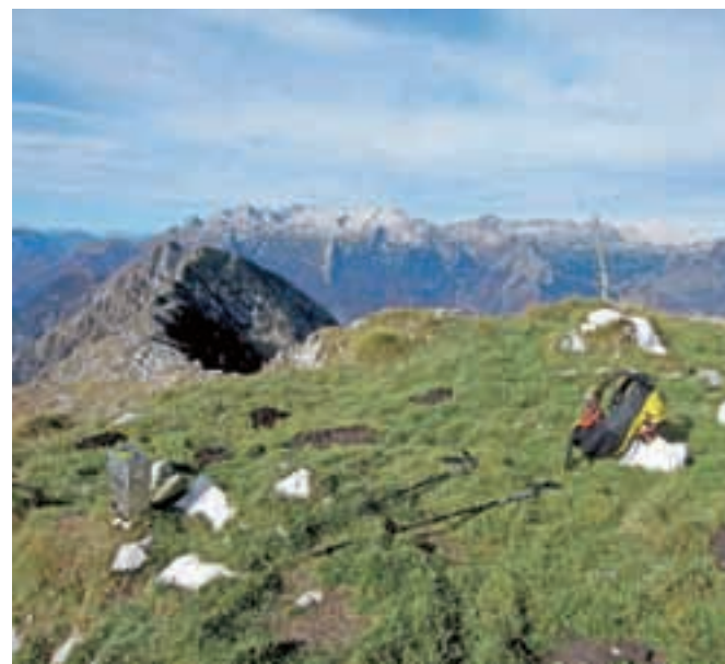
Vrh Krasjega vrha z delom grebena Polovnika in Kaninom v ozadju

kolujev. Nadaljujemo desno v smeri snežne jame. Pot še vedno poteka skozi gozd, ki višje postaja vse redkejši. Na razpotju nadaljujemo naravnost, levo je 5 minut do snežne jame. Pot se strmo vzpne; zagledamo ostaline prve svetovne vojne. Pot preide na razgledni greben in nas v nekaj minutah pripelje na vrh. Lep vzpon, nič naporen, ki kljub razmeroma nizki nadmorski višini ponudi čudovit razgled na bližnjo in daljno okolico; Matajur, Breginjski Stol, Kanin, Rombon, Mangart, Jalorec, Svinjak do Bavškega Grintavca, Triglav in na dosegu roke Krn. Razglednik prvega razreda! Gora, z ostalinami krvave morije, spodaj pod nami pa krasna hči planini, kot je Soča poimenoval