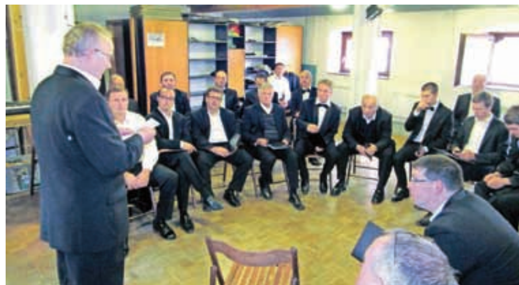
Pevci komornega zbora Davorin Jenko med pripravami za nastop.