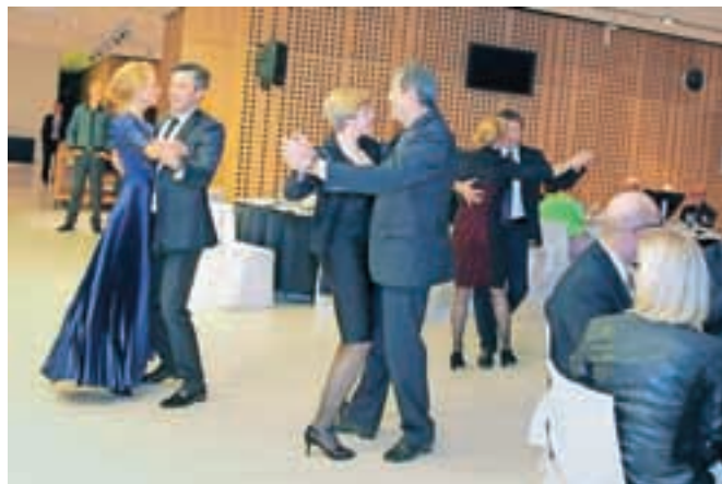
Na Brdu so zaplesali v dobrodelne namene, ves večer pa je potekala tudi dobrodelna dražba slikarskih umetnin.