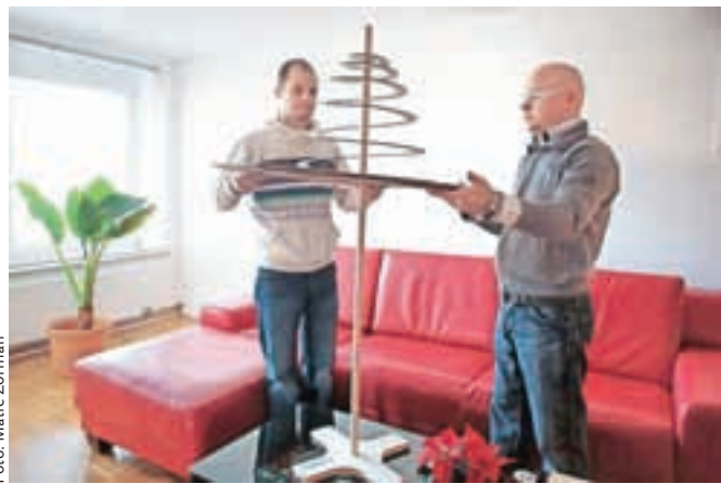
Spira smrečico postavimo (in podremo) v eni sami minuti.