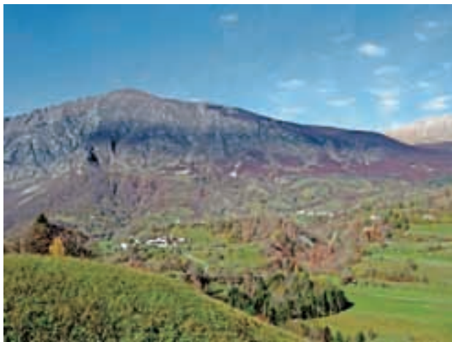
Krasji vrh s ceste, ki pelje v Drežnico.