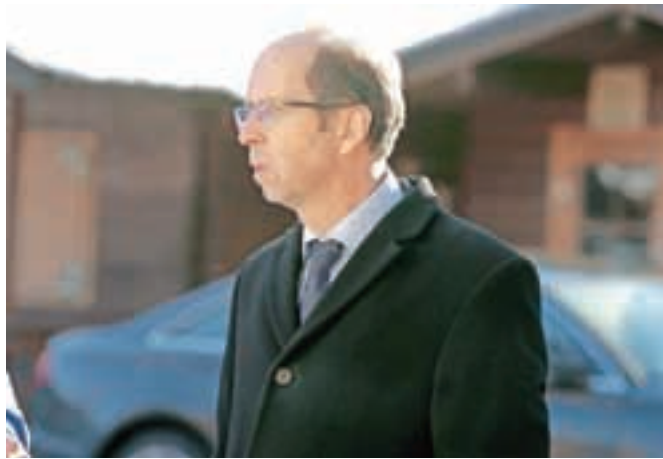
Župani so finančnega ministra Dušana Mramorja zaradi prenizke povprečnine pozvali k odstopu.