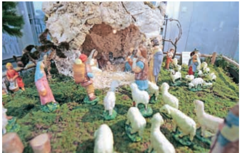
Božič zaznamujejo postavljanje jaslic, okraševanje božičnih drevesc, obdarovanje, pošiljanje voščilnic, priprava prazničnih jedi ...

Bodimo odgovorni skrbniki svoje države, za katero smo se odločili na referendumu v tem decembrskem času pred četrst stoletja. V spomin na ta dogodek praznujemo na štefanovo dan samostojnosti in enotnosti. Manjka nam veselja, samozavesti, zavedanja in morda poguma, da lahko skupaj, ne glede na razlike, pospešimo korake v prihodnost.