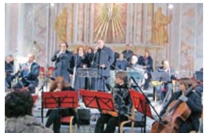
Na božičnem koncertu v samostanski cerkvi v Vernberku na Koroškem je sodeloval tudi Alpski kvintet s pevci in godalnim orkestrom.

V zamejstvu bodo do konca leta še nekatere prireditve. V kanalski dolini v Italiji bodo tri. Združenje Don Mario Cernet iz Ovčje vasi/Valbruna bo priredilo v nedeljo, 27. decembra, ob 14.30 v cerkvi svetih Filipa in Jakoba v Ukvah/Ugovizza božični koncert, na katerem bodo poleg domačih pevcev peli še gostje s Koroške in iz Doberdoba v Italiji. Slovensko kulturno središče Planika iz Kanalske doline pa bo priredilo dva koncerta. Prvi bo v soboto, 2. januarja, ob 18. uri v cerkvi v Žabnicah/Camporosso, drugi pa dan kasneje, v nedeljo, 3. januarja, opoldne v cerkvi na Višarjah.