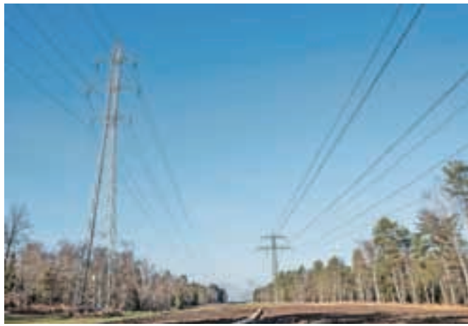
Nedobavljena elektrika iz nuklearke Hrvaški bo Slovenijo stala približno 40 milijonov evrov. Bo kdo nosil odgovornost?