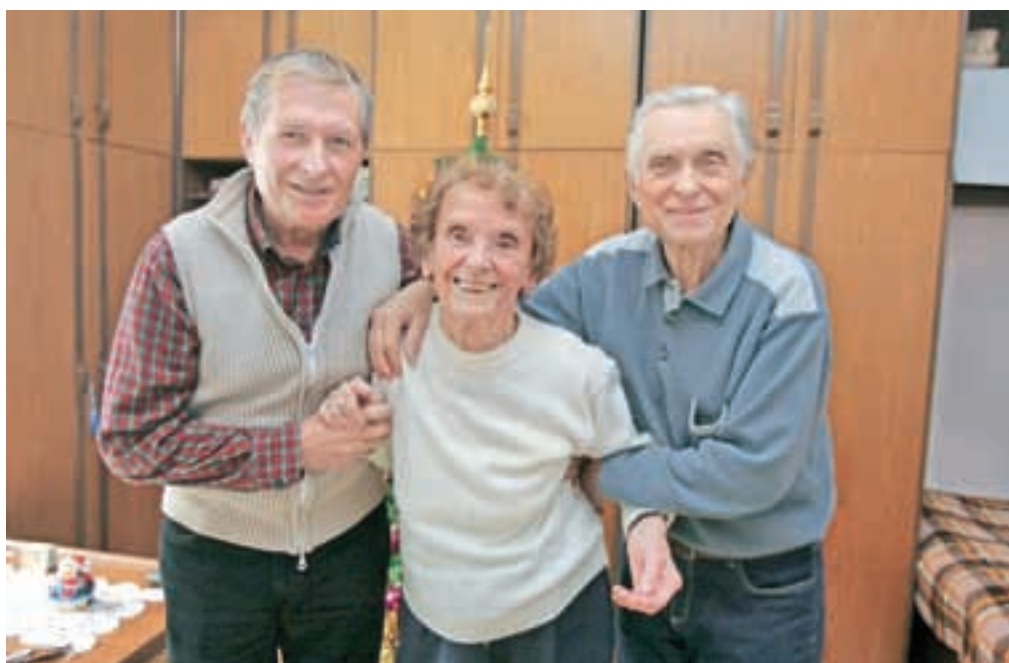
S sinovoma Bojanom in Otonom, ki ljubeče skrbita za mamo.