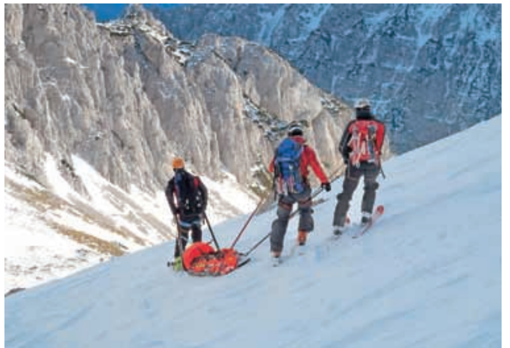
Reševanje v zimskih razmerah

doživijo kap, iščejo zablokane starostnike ... Tudi do dvajsetkrat letno sodelujejo pri takih in drugačnih reševanjih. Temu namenajo veliko svojega prostega časa: če bi preračunali v dneve, gre za vaje, akcije, reševanja okoli 40 dni letno.