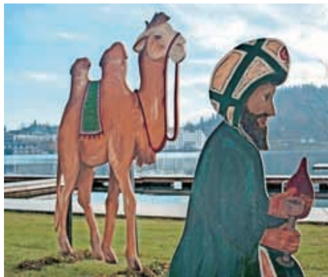
Poslikave figur so delo umetnikov iz lokalnega okolja.