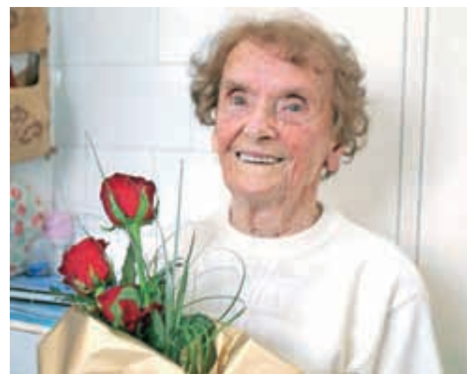
Veselje ob obiskih za rojstni dan