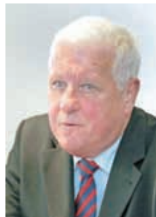
Ivo Bizjak

Ivo Bizjaku, takratnemu predsedniku zbora občin v slovenski skupščini, pozneje pa ministru, prvemu varuhu človekovih pravic in nazadnje visokemu evropskemu uradniku, pa je v spominu bolj ostal čas, ko se je politika dogovarjala za plebiscit: »Zelo težko se je bilo takrat uskladiti