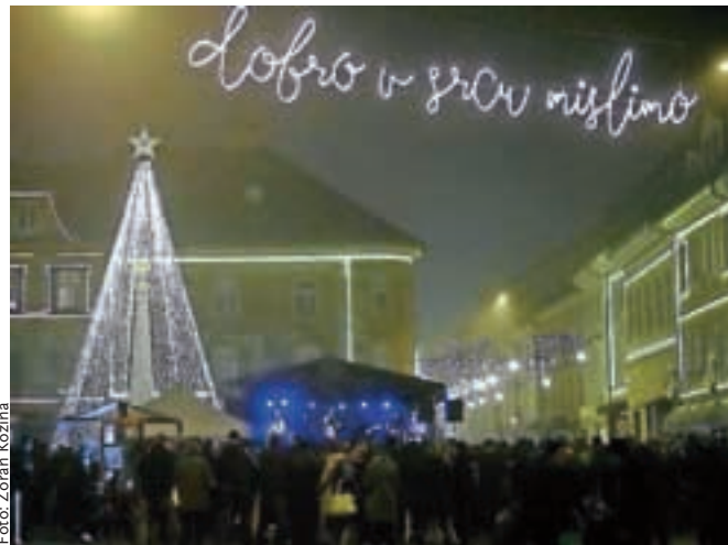
Praznično vzdušje ob odru na Glavnem trgu: Raggalution

Sobotni večer, 19. decembra, pred Down Townom bo namenjen ljubiteljem thrash-metalu. Negligenca je vodilna domača thrash metal zasedba, ki je v petnajstih letih obstoja dosegla že veliko prepoznavnost med poslušalci te zvrsti. Skupina je znana po svoji