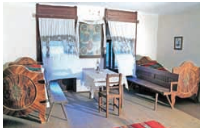
Eden izmed prostorov v rojstni hiši Mihajla Idvorskega Pupina

imenu in priimku dodal celo Idvorski ter tako pokazal pri-rzrenost rodnemu kraju. (Nadaljevanje prihodnjič)