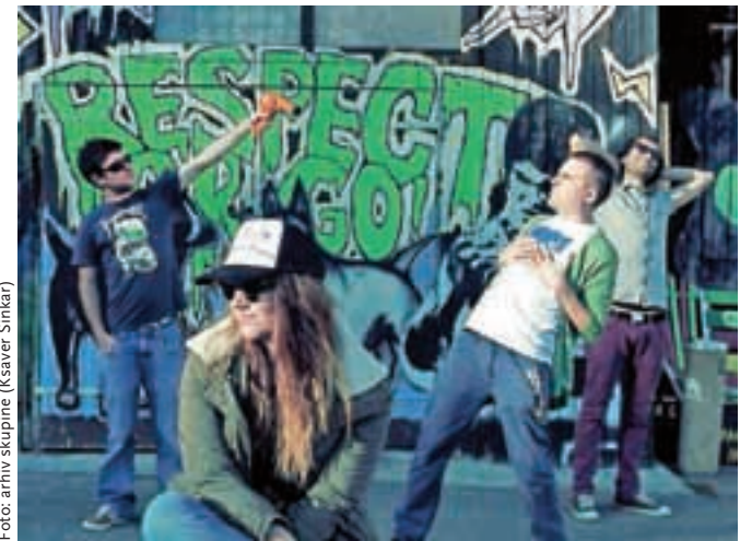
V sredo bodo glasbene vibracije sproščali Le Serpentine.