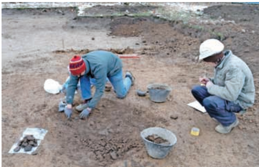
Arheološki izkop ene od odkritih odpadnih jam

Na Svetju je bila namreč leta 2007 odkrita prazgodovinska naselbina iz obdobja srednje in pozne bronaste dobe (1600–1000 pr. n. št.). Njeno veliko razsežnost so potrdile predhodne arheološke raziskave, izvedene v letih 2009 in 2010 zahodno od Zdravstvenega doma. Arheologi so bili na delu tudi tokrat. V drugi polovici novembra so pred gradbenim posegom premika treh daljnovidnih stebrov ponovno potrdili in raziskali bogat potencial tega arheološkega najdišča, ki sega 3500 let v preteklost. »S testnim pregledom celotnega območja in raziskavami z gradnjo prizadetih lokacij smo pričakovano odkrili sledove prazgodovinske poselitve, ki smo jih po primarni obdelavi odkritih najdb prisodili istemu časovnemu in prostorskemu