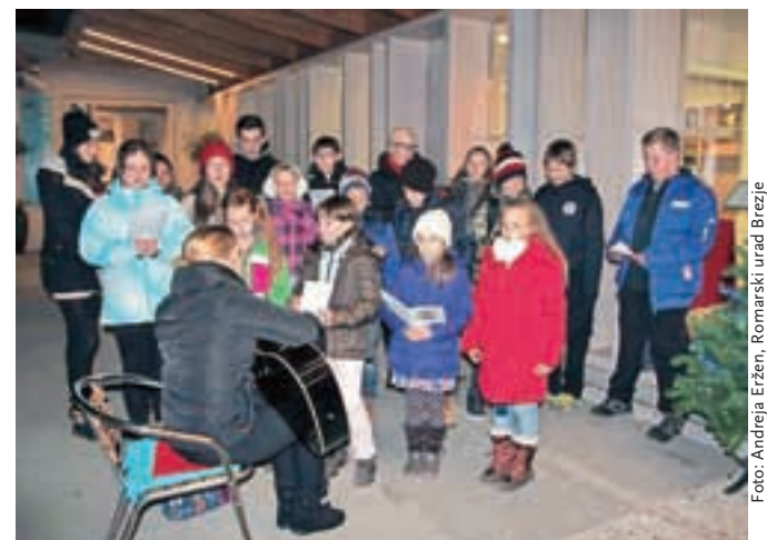
Na odprtju razstave so zapeli najmlajši brezjanski pevci.

obiskovalca med drugim pouči, da so prvo znamko z božičnim motivom leta 1935 izdale britanske enote, nastanjene v Egiptu. Med znamke pa so bile božične znamke uradno uvrščene leta 1960. Slovenija je izdala prvo božično znamko leta 1992, po tem letu pa v Sloveniji letno izideta ena ali dve znamki na temo božiča. Na ogled so tudi jaslice nekaterih slovenskih avtorjev.