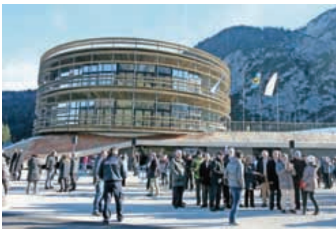
Nordijski center Planica ponuja odlične pogoje za tekmovanja in treninge smučarskim skakalcem in tekačem.