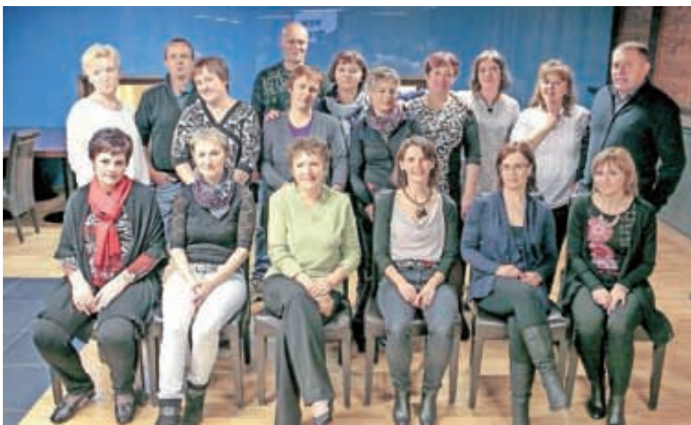
Eni so obletnico valet praznovali v Dvorjah ...

Pri Seljaku v Preddvoru pa so se kakšen teden prej ravno tako dobili še eni »bjevci«, rojeni leta 1973 (nekaj tudi leta 1974), ki so ravno tako obiskovali preddvorsko osnovno šolo. Šolsko leto so zaključili leta 1988, tako da bodo trideseto obletnico praznovali čez tri leta. Sicer se dekleta in fantje dobivajo ob obletnicah valet, vendar ne ravno ob okroglih. Tako kot sedaj, ko je od njihove valet minilo 27 let.