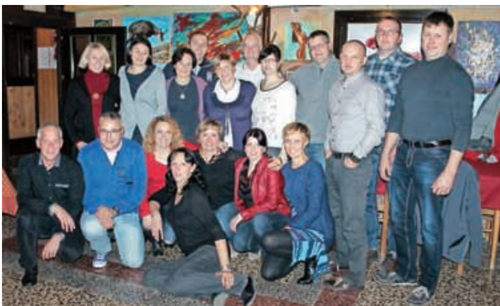
... drugi pa v Preddvoru.