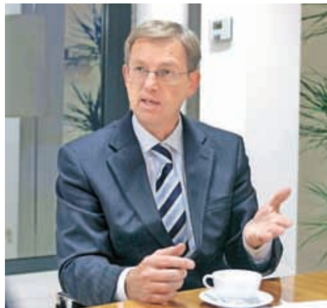
Predsednik vlade dr. Miro Cerar

»Da župani bojkotirajo vladni obisk v regiji, se mi zdi izguba priložnosti za pogovor in pomanjkanje politične kulture. Razumem, da z občinami nimamo skupnega jezika glede financiranja in da so nekateri župani zaradi tega vznemirjeni. Mislim pa, da nimajo v celoti prav. Mi smo se z občinami od začetka naše mandata velikokrat sestali, samo od konca avgusta do srede novembra devetkrat, kar kaže, da si je vlada zelo prizadevala skozi dialog in sodelovanje doseči racionalizacije. Naj povem, da so učinki racionalizacij, ki smo jih dosegli sedaj, 20,3 milijona evrov za leto 2016. Pri tem smo upoštevali tudi povečanje obveznosti občin