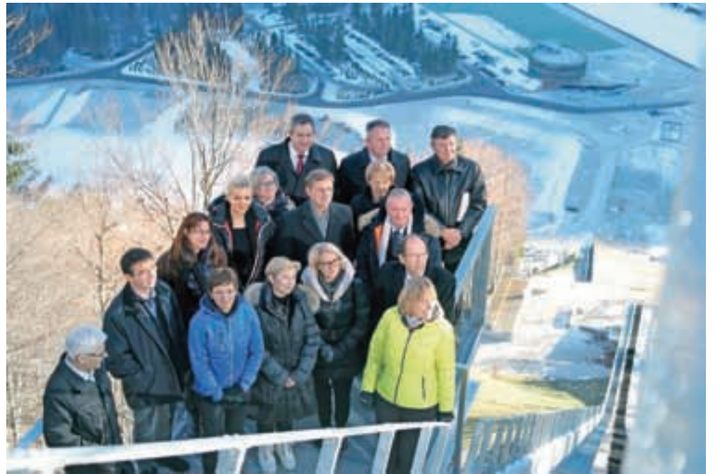
Slovenska vlada v petek na vrhu skakalnice bratov Gorišek v Planici