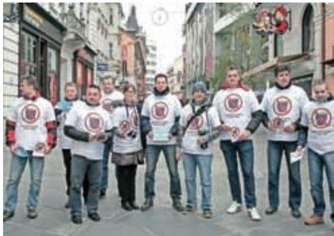
Stavkajoči policisti so začasno prekinili pogajanja z vladno pogajalsko skupino.