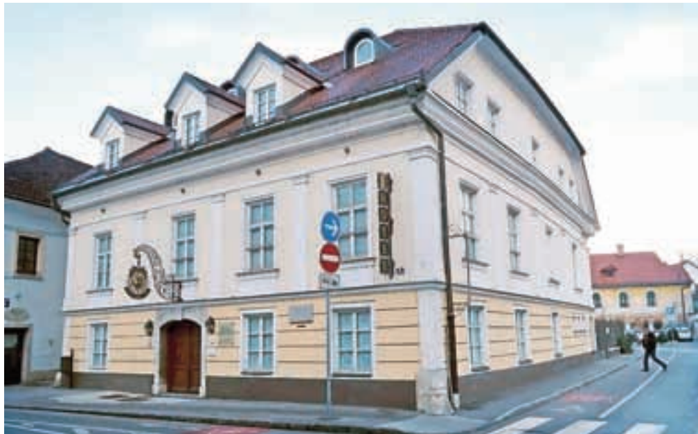
Hotel Malograjski dvor v središču Kamnika že leto in pol čaka na novega lastnika, nedavno pa je ostal tudi brez najemnika.