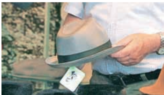
Okrožno sodišče v Kranju je izdalo sklep o potrditvi poenostavljene prisilne poravnave za škofjeloško tovarno klobukov Šešir.

podjetje ustvarilo sedemsto tisoč evrov prihodkov od prodaje, čista izguba pa je znašala več kot osemsto tisoč evrov. Družba je imela na zadnji dan koledarskega trimesečja, ki se je končalo pred uvedbo postopka