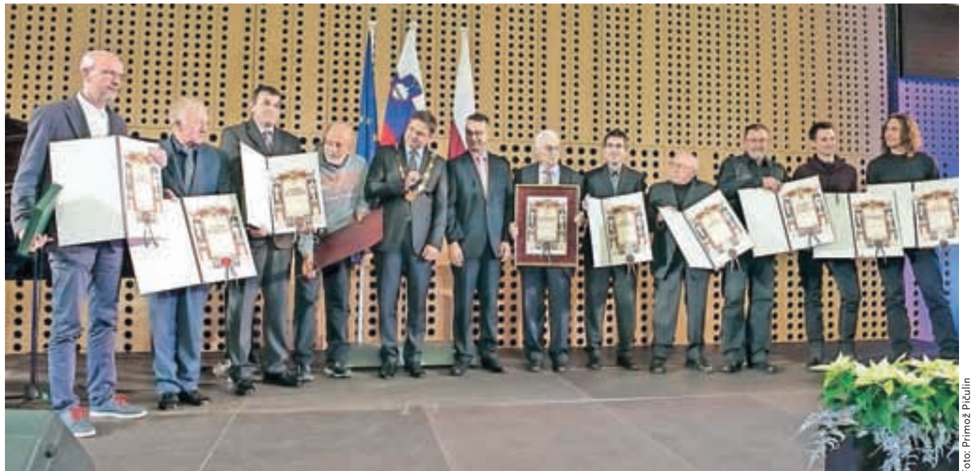
Letošnji dobitniki nagrad in priznanj Mestne občine Kranj na slovesnosti ob občinskem prazniku na Brdu pri Kranju