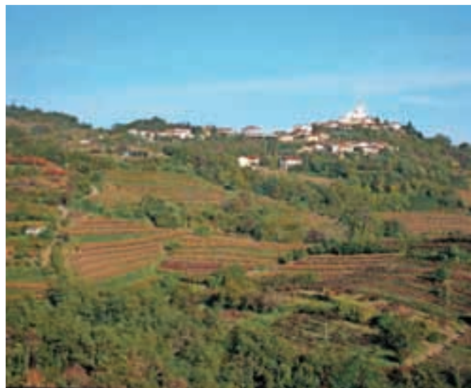
Goriška brda v jesenskih barvah