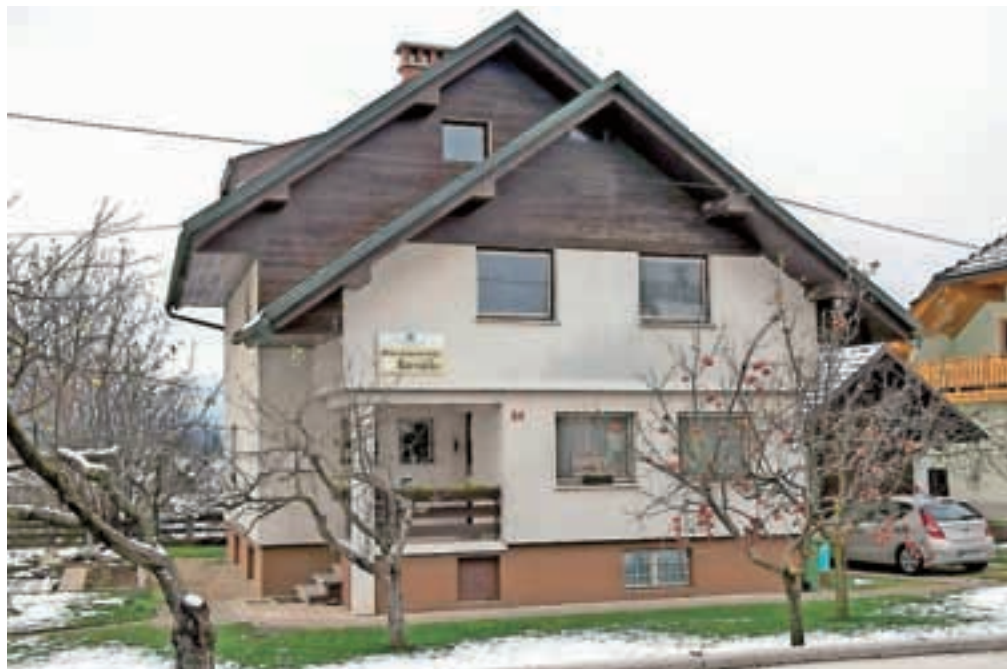
Kresnička se bo iz stavbe na obrobju Lesc morala seliti drugam.

Najpogosteje centri za socialno delo v Kresničko namestijo mlade, stare med 15 in 18 let, včasih pa zavetje centru najdejo tudi mlajše polnoletne osebe, ki v kriznih trenutkih ne najdejo drugega zavetja, zato v Kresnički razmišljajo, da bi bilo dobro tudi zanje urediti bivalno enoto po vzoru kriznega centra za mlade.