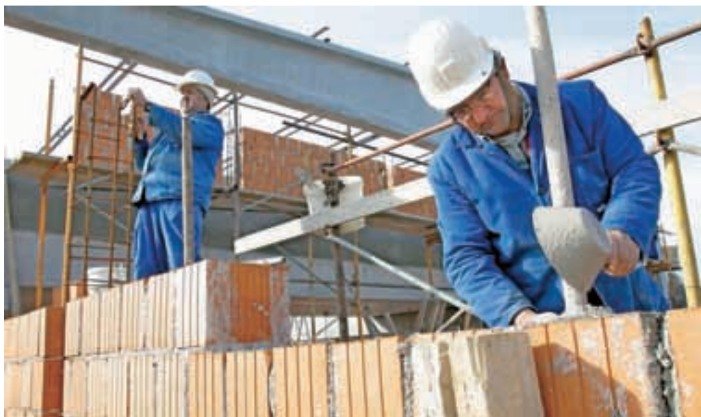
V predlaganem gradbenem zakonu je predvideno, da bo moral tudi samograditelj najeti vodjo gradnje.

V predlaganem gradbenem zakonu je med drugim predvideno, da mora investitor pri gradnji objektov najeti vodjo gradnje (po sedanjih ureditvah nadzornika). Določilo velja tudi za gradnjo v lastni režiji, pri čemer v primeru gradnje enostavnega objekta, kot je po navedbah okoljskega ministrstva npr. tudi enostanovanjska hiša v velikosti 250 kvadratnih metrov, ni zahtevana strokovna usposobljenost izvajalca gradnje. Po sedanjih ureditvah lahko samograditelji gradijo, ko pridobijo strokovne in v gradbenem dovoljenju uradno potrjene projektantske načrte, nadzor pa lahko izvaja tudi zidar s posebnim strokovnim izpitom pri pristojni poklicni zbornici in vsaj desetletnimi delovnimi izkušnjami. Po novem pa bo moral samograditelj vodjo gradnje izbrati le med pooblaščenimi arhitekti in inženirji, saj želijo po navedbah ministrstva s tem okrepiti