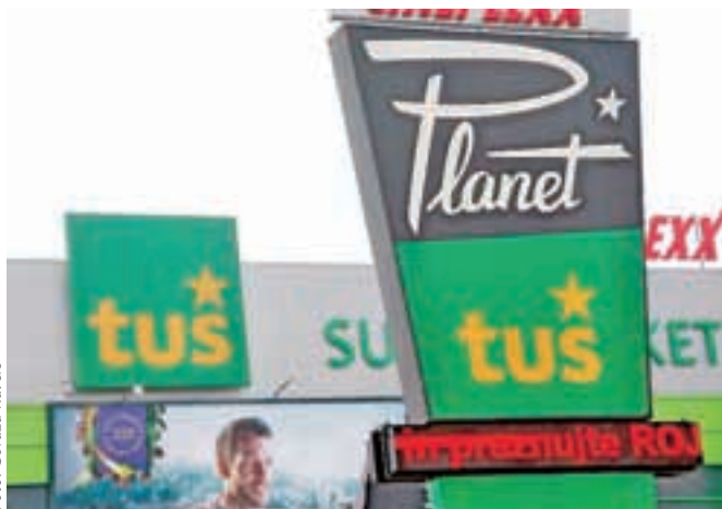
Skupna Tuš in matična družba Engrotuš kljub petletnemu trudu še vedno slabo poslujeta in se utaplja v dolgovi.