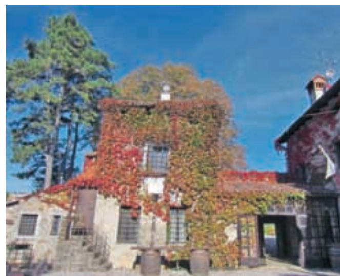
Grad Formentini v Števerjanu