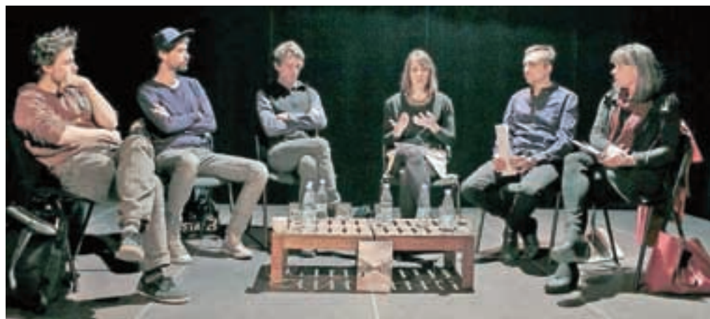
Razrezani svet: sodelujoči na okrogli mizi o problematiki rasizma

Protifašistična fronta brez meja in Časopis za kritiko znanosti, domišljijo in novo antropologijo sta v Stolpu Škrlovec pripravila okroglo mizo o rasizmu.