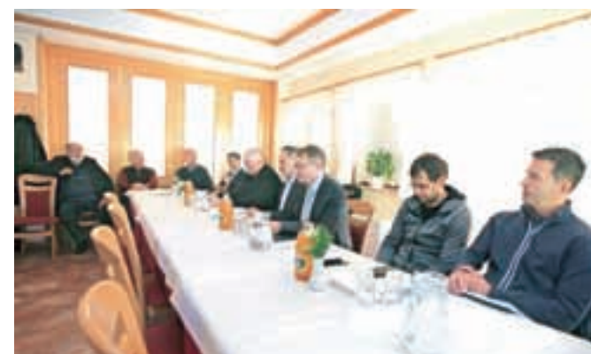
Udeleženci izobraževalnih delavnic Energetika - trajni in obnovljivi viri energije

imetniki certifikata dosegajo odlične rezultate – 19 odstotkov višje prihodke na zaposlenega od povprečja podjetij podobne velikosti, 3,7-krat višji dobiček na zaposlenega in za 13,4 odstotka višjo dodano vrednost na zaposlenega.