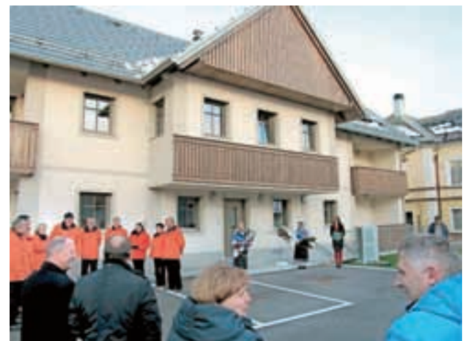
Novi večstanovanjski objekt na Selu bo postal dom za pet žirovniških družin.

večstanovanjskega objekta na Selu je Občino Žirovnica stal 535 tisoč evrov, izvajalec del pa je bilo podjetje Kovinar Gradnje ST.