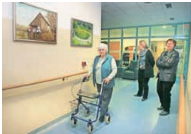
Obiskovalci razstave so bili nad tehniko slikarjev navdušeni.