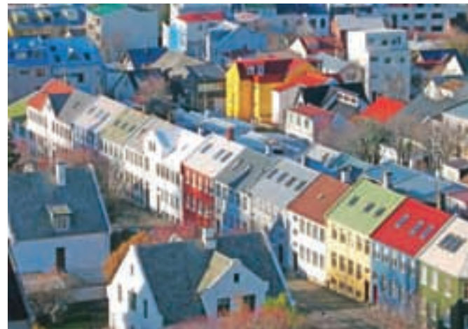
Take so hiše v Reykjaviku; v eni od njih je odrasla tudi islandska pevka in igralka Björk (1965).