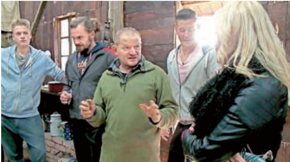
Zadnje dni je obisk starih tekmovalcev na kmetijo vnesel nemir. Bo peterici uspel načrt, ki so si ga zadali, ali se bo tik pred koncem zgodilo, da velika zmagovalca ne bosta pričakovana Faki ali Franc?

Je to res odkrito prijateljstvo ali le taktika, se je spraševal povratnik Sebastijan.