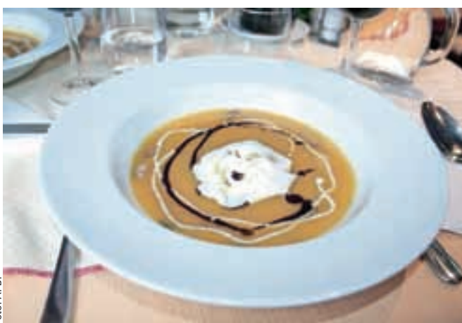
Bučna juha s kostanjem, bučnimi semeni in mlečno peno