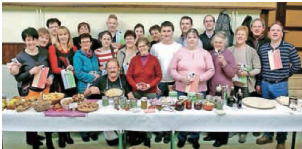
Gospodinjje so postavile na ogled dobrote iz špajze, moški pa so pripravili palačinke.

Adergas – Člani KUD Pod lipo iz Adergasa in gospodinjje iz vasi pod Krvavcem so namreč zelo uspešno pripravili v dvorani v Adergasu drugo prireditev Poku kajmo v špajzo, na kateri se je z dobrotami predstavilo 22 gospodinj iz vasi pod Krvavcem. Predstavile so ozimnico, okusne marmelade iz najrazličnejšega sadja, tudi iz kivija, kutine in kaki-jev, sadne sokove, posušeno sadje, domače žganje, likerje, med, jabolčni kis, zdravilna zelišča, kruh, pečen v krušni peči, ocvirke, domače salame, piškote, potice, krofe in najrazličnejše pastete. Številnih pohval so bili deležni tudi sladki in kisli pripravki za zimske dni pa tudi kulturni program,