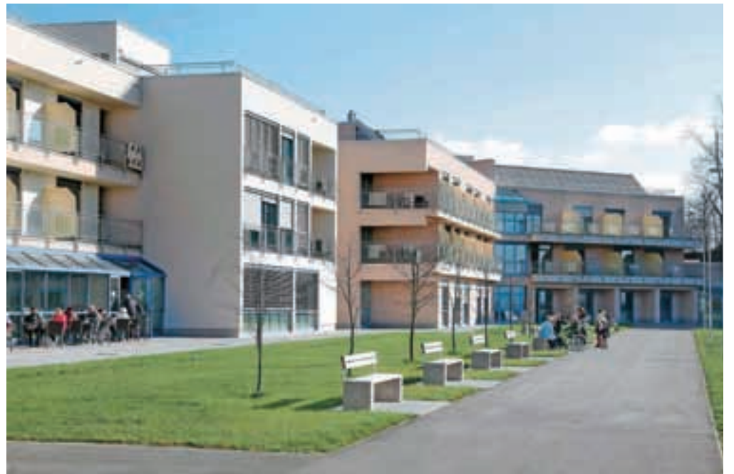
V Domu Taber so od konca septembra sprejeli že 102 stanovalca, polno zaseden pa bo predvidoma do konca januarja.

Taber, investitor gradnje pa je bil Socialno varstveni zavod Taber v 100-odstotni lasti občine. Zgradili in opremili so ga v dobrih dveh letih, v njem pa je prostora za 150 stanovalcev, med drugim sta urejena tudi varovana oddelka za 33 oskrbovancev. V domu bo zaposlitev našlo vsaj 72 ljudi. Po besedah župana Franca Čebulja je celoten projekt skupaj z zemljišči, infrastrukturo in opremo stal 14,6 milijona evrov, od tega gradnja doma z opremo 11,6 milijona evrov. Občini je uspelo pridobiti 5,7 milijona evrov sofinanciranja EU in države.