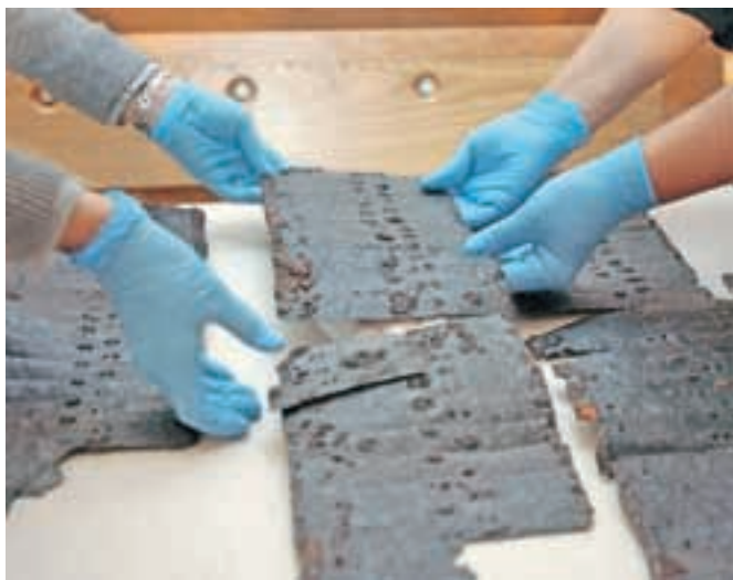
Oklepa bosta shranjena v posebnih mikroklimatskih vitrinah.