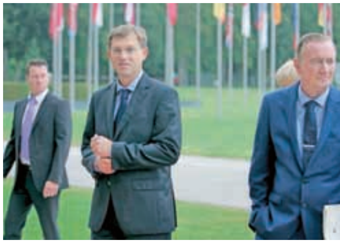
Predsednik vlade se je ta teden odpravil na delovni obisk v ZDA. / Foto: Tina Dokl