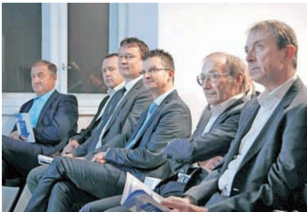
Kamniški podjetniki so po Klubu managerjev občine Kamnik nedavno ustanovili še Podjetniški klub Kamnik.

»Po svojih najboljših močeh se bom še naprej zagnano trudil doprinesti svoj delež za povezovanje in sodelovanje kamniških močnih in zdravih podjetij s skupnim ciljem – ponovno vzpostaviti in izboljšati pogoje za razcvet gospodarstva in turizma v naši občini. Motivacijo in zagon sem dobil, ker smo se v iskanju poti za skupen