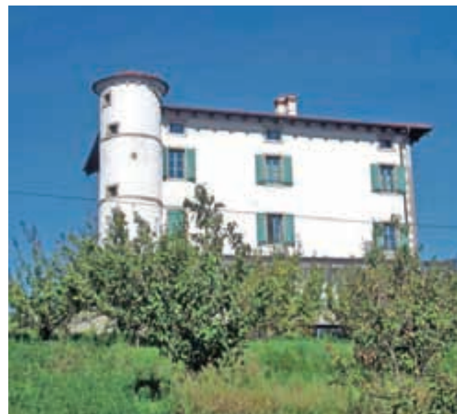
Berta in njegovih pup ni bilo doma; Gredič.

Nadmorska višina: 290 m Višinska razlika: ok. 200 m Kilometri: 65 km Zahtevnost: ★★★★★