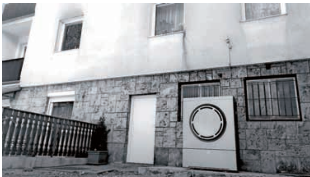
Toplotna črpalka je nameščena na zunanji strani bloka.

Investicija je stala 14.503 evra, skoraj celotno investicijo pa so financirali iz rezervnega sklada (pridobili so tudi subvencijo EKO sklada). Stanovalci tako financiranja skoraj niso občutili, v dobrih dveh letih do danes pa se je investicija že povrnila. V tem obdobju so prihranili za 14.475 evra