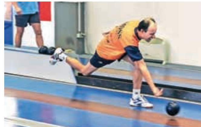
Na mednarodnem turnirju slepih in slabovidnih je nastopilo 88 tekmovalcev iz petih držav.