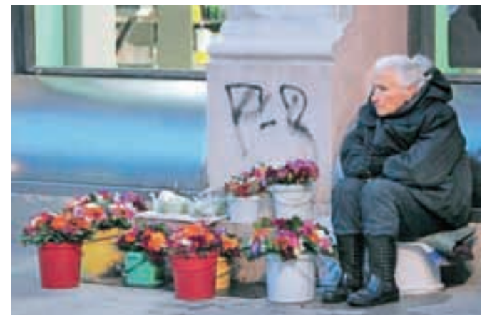
Ostarela prodajalka cvetja na ulicah Novega Sada