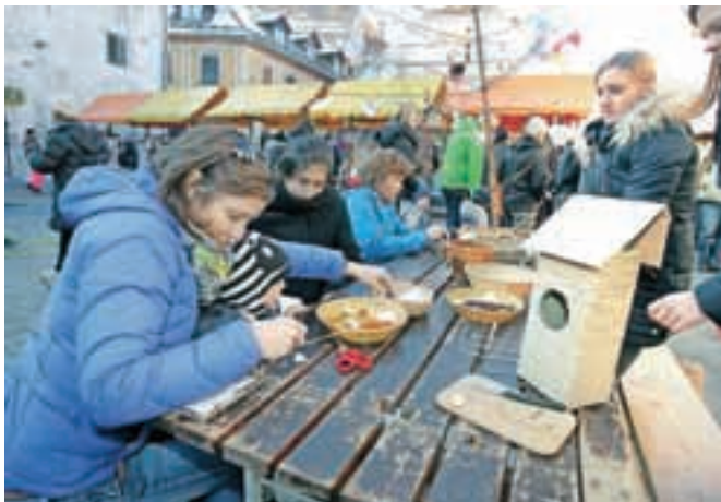
Na Miklavževem LUFTu so se udeleženci, med njimi pretežno otroci, tokrat ukvarjali s ptički in njihovim zimskim jedilnikom.