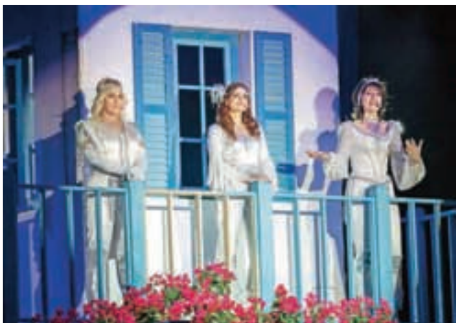
Prizor iz muzikala Mamma Mia!