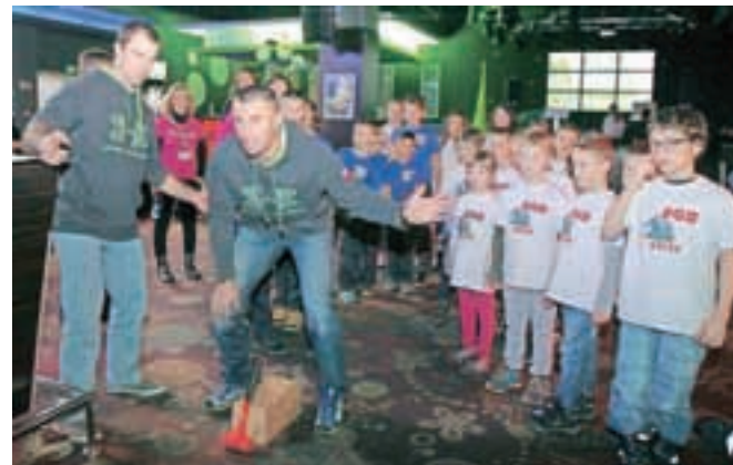
Gorenjski gasilski podmladek je v družbi starejših kolegov užival v različnih dejavnostih. Spoznali so marsikaj novega – tako skozi druženje kot igro.