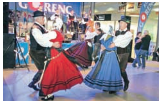
Glasbeni program se je prepletal tudi s plesom.