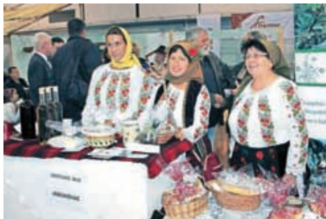
Takšnih prizorov je bilo na sejmu veliko.

In ker je Novi Sad eno tistih mest, kjer zvečer na cesti še vedno srečujemo ostarele prodajalke cvetja in je kajenje dovoljeno praktično povsod, nas tudi rahlo strašljiva pojava starejšega moškega na sejmu ni presenetila. Se je pač odločil, da bo odšel domov bogatejši za nagačeno lisico pod pazduho in fazanom v nahrbtniku, ali pa je razmišljal, da bo morda kaj prodal, saj se je v sosednji hali vzporedno s sejmom turizma odvijal še sejem lova, ribolova in športa. (Nadaljevanje prihodnjič)