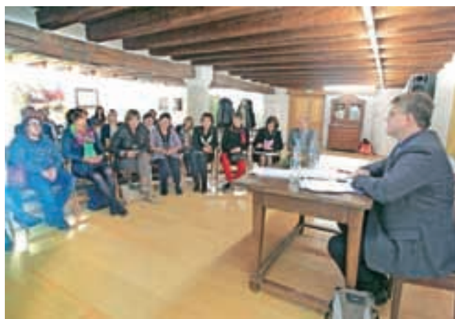
Na okrogli mizi v Kašči so spregovorili o zaposlovanju oseb s posebnimi potrebami.

Že uvodoma so ugotavljali, da prehod mladih oseb s posebnimi potrebami po končanem šolanju na trg dela ni urejen in tako ostajajo doma. Zato bi bilo treba odpraviti ovire, da bi zmanjšali veliko brezposelnost med temi mladimi, so poudarili. Mladim sami so ob tem povedali, da