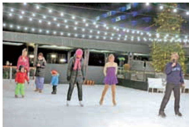
Na Bledu so odprli drsališče z razgledom.

sobotne in nedeljske večere pa bodo popestrili z DJ-glasbo. Drsališče bo že ta konec tedna obiskal Miklavž,