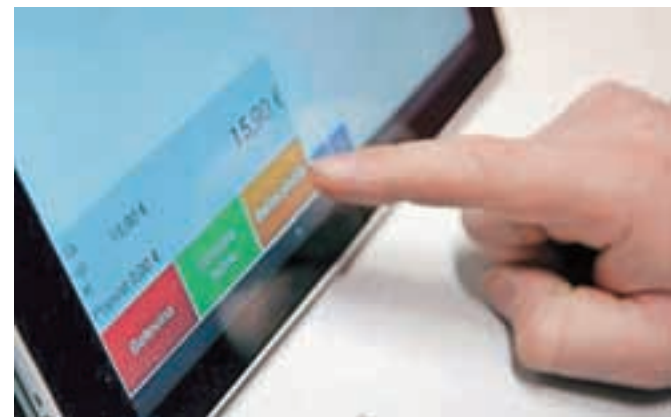
Uvedba davčnih blagajn bo prinesla spremembe za zavezance in potrošnike.

Davčno potrjevanje računov bo obvezno od 2. januarja 2016, za tiste, ki so se odločili za prehodno obdobje, od 1. januarja 2018 dalje, a tudi v tem obdobju bodo podatke o računih morali po elektronski poti pošiljati na finančno upravo.