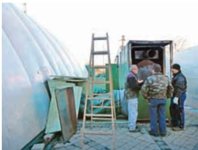
Delavci ob uničenem razpihivalniku zraka pri radovljiškem bazenu

Radovljica – V četrtek malo pred pol sedmo zvečer je zagorelo na kopališču v Radovljici. Do požara je prišlo na razpihivalniku toplega zraka pred balonom, ki deluje na plin. Požar so opazili zaposleni in obiskovalci picerije Matiček, ki so takoj poklicali na pomoč gasilce in o dogajanju nemudoma obvestili tudi trenerje, ki so iz bazena v garderobe takoj evakuirali 40 otrok. Gasilci PGD Begunje, Radovljica in Lesce so požar pogasili, mladi plavalci in trenerji pa zaradi požara, ki ga niso niti opazili, ker se je zgodil zunaj balona na prostem, niso bili ogroženi. Dejavnosti na bazenu so že naslednji dan potekale normalno, saj je eden od obeh razpihivalnikov nemoteno deloval, delavci pa so se že lotili popravila uničenega razpihivalca zraka. Zakaj je zagorel, še ni znano, je pa takoj po izbruhu ognja prenehal delovati, tako da z dimom onesnaženega zraka ni dovajal v balon, pod katerim je bazen.