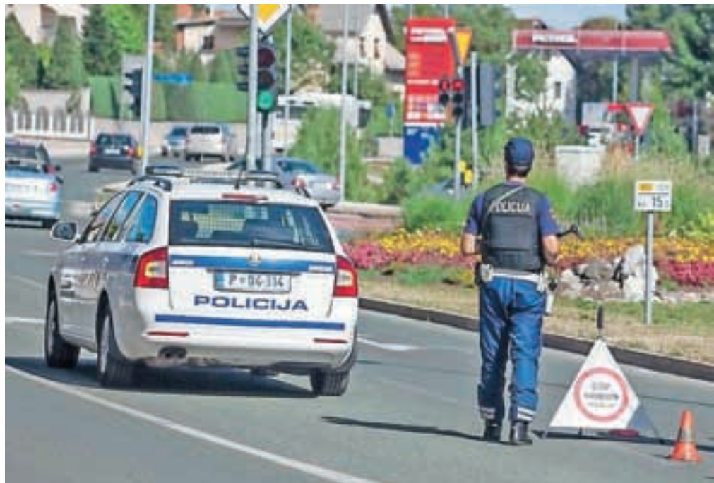
Za službena policijska vozila niso primerne ravno vsake gume, opozarjajo policisti.

Z Generalne policijske uprave so odgovorili, da je že test, ki ga je v letu 2013