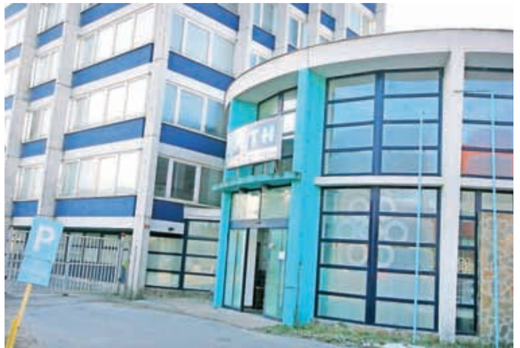
Nepremičnine LTH v stečaju je kupilo podjetje Domel iz Železnikov.