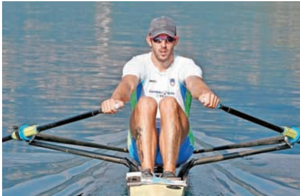
Luka Špik je v svoji karieri dosegel številne uspehe in je eden največjih slovenskih veslačev in športnikov vseh časov.