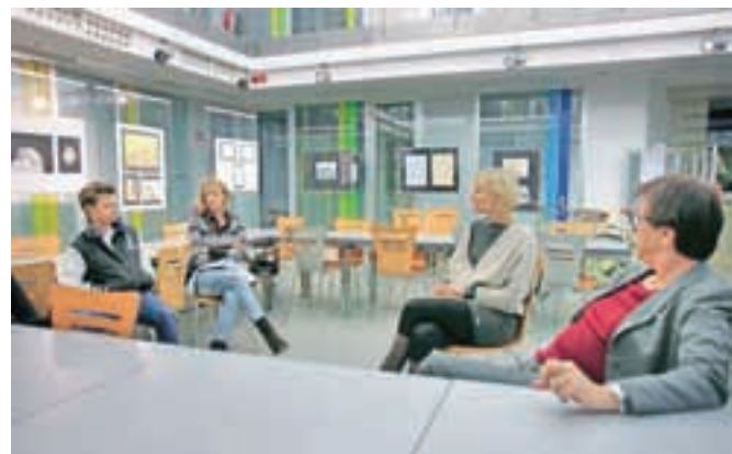
Ob dnevu odprtih vrat slovenskega gospodarstva so imeli devetošolci na Gorenjskem glasu možnost spoznati tudi novinarski poklic.