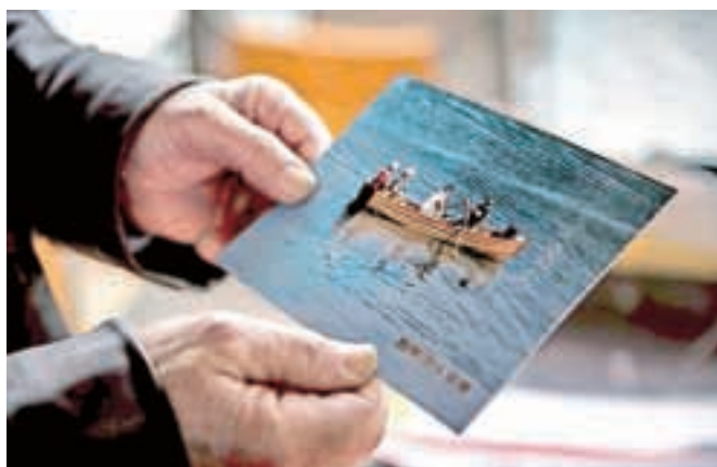
Eva je njegova najlepša »ladja«.