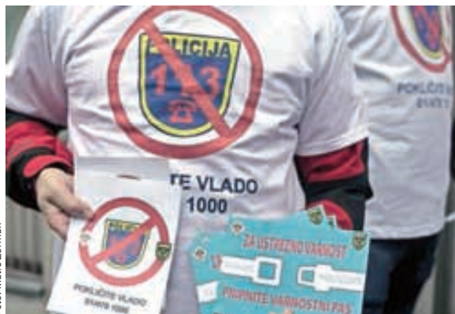
Policijski sindikalisti so v sredo simbolično pozivali državljane, naj namesto policije odslej pokličejo vlado.

Raziskava Spletni trgovec leta, ki jo je izvedla raziskovalna hiša Valicon, je pokazala, da je delež spletnih kupcev, ki mesečno opravijo vsaj en nakup, v zadnjih dveh letih narasel za 58 odstotkov. Nakupe preko spleta tako opravlja že 85 odstotkov slovenskih uporabnikov interneta, več kot polovica jih opravlja pogosto ali intenzivno. Le še 16 odstotkov uporabnikov spleta spletno nakupovanje zavrača.