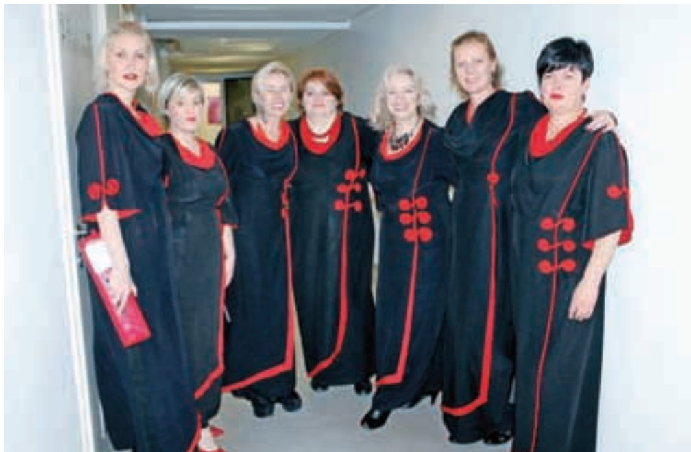
Na enajstem srečanju klap v Kamniku je nastopila tudi ženska klapa Žurnada.

»V zadnjem letu je bilo najodmevnejše gostovanje oziroma turneja na jugu Italije pri manjšini moliških Hrvatov; bili smo gosti srečanj klap v Grobniku in