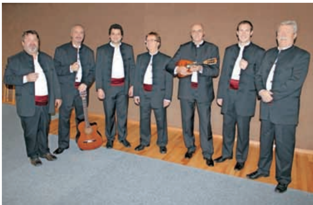
Klapa Mali grad

Voloskem pri Opatiji, nekaterim nastopom na Hrvaškem pa smo se žal zaradi