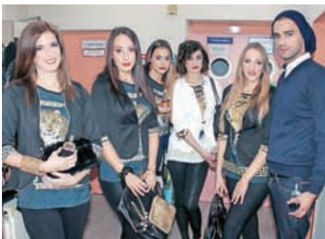
Jesenske in zimske modne smernice so predstavila dekleta in en fant v kar petih izhodih.