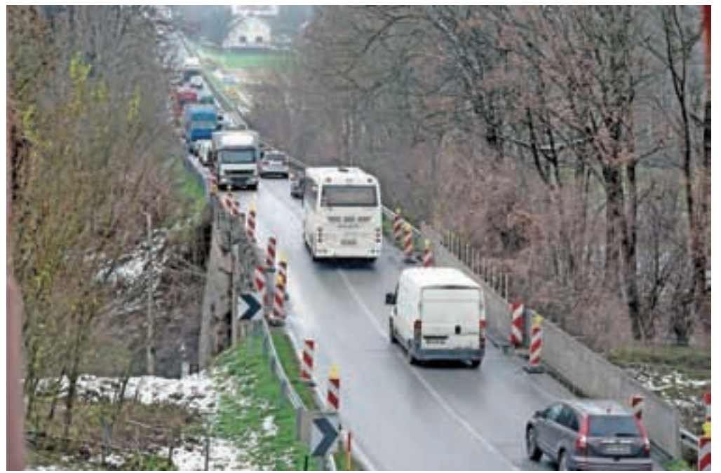
Most v Mednem bodo rekonstruirali, ob njem pa postavili dva začasna, po katerih bo v času del potekal promet.

Kot so še sporočili z direkcije, je pogodbeni rok za dokončanje del 180 dni po uvedbi v posel, kar pomeni, da naj bi bila dela končana najkasneje poleti.