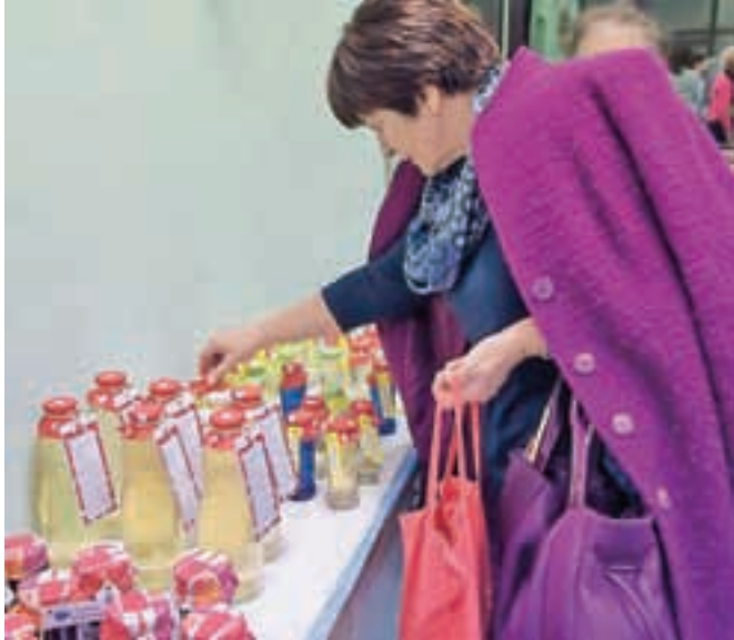
V prostorih delovne terapije Doma dr. Janka Benedika je do nedelje na ogled prodajna razstava ličnih in uporabnih izdelkov stanovalcev doma.

Radovljica – V Domu dr. Janka Benedika so tudi letos pripravili prodajno razstavo izdelkov stanovalcev doma. Na ogled so tako številne umetno izdelane pisane pletenine, okraski, prti, sokovi, marmelade in še marsikaj drugega, kar so med letom izdelale spretne roke stanovalcev doma. Razstava je na ogled do nedelje, 29. novembra, od 10. do 18. ure v prostorih delovne terapije.