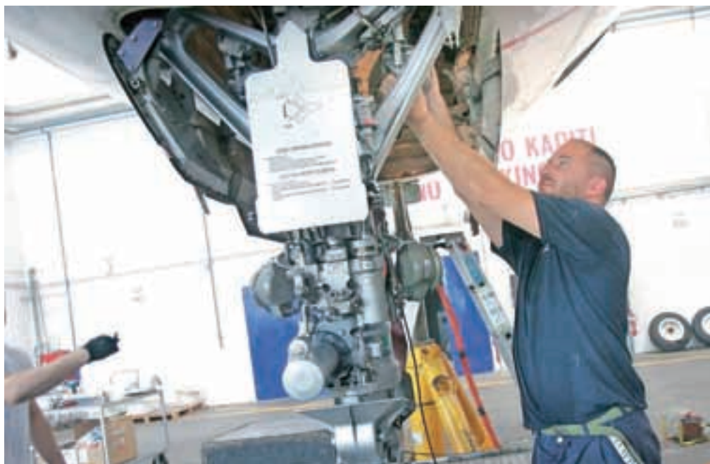
V tekmo za nakup Adria Airways Tehnike so se neuspešno vključili tudi zaposleni.

V SDH in Aerodromu Ljubljana pojasnjujejo, da so poljskega kupca izbrali na podlagi konkurenčnega in transparentnega dvofaznega prodajnega postopka, v katerem je Linetech Holding na koncu dal najboljšo ponudbo. Prodajalca sta si tudi prizadevala, da Adria Airways Tehnika dobi lastnika, ki bo podpiral in omogočil rast in razvoj ter ohranil njene ključne funkcije v Sloveniji in v svetu. Za nakup podjetja so se sicer potegovali tudi zaposleni, združeni v podjetju AAT Holding Projekt.