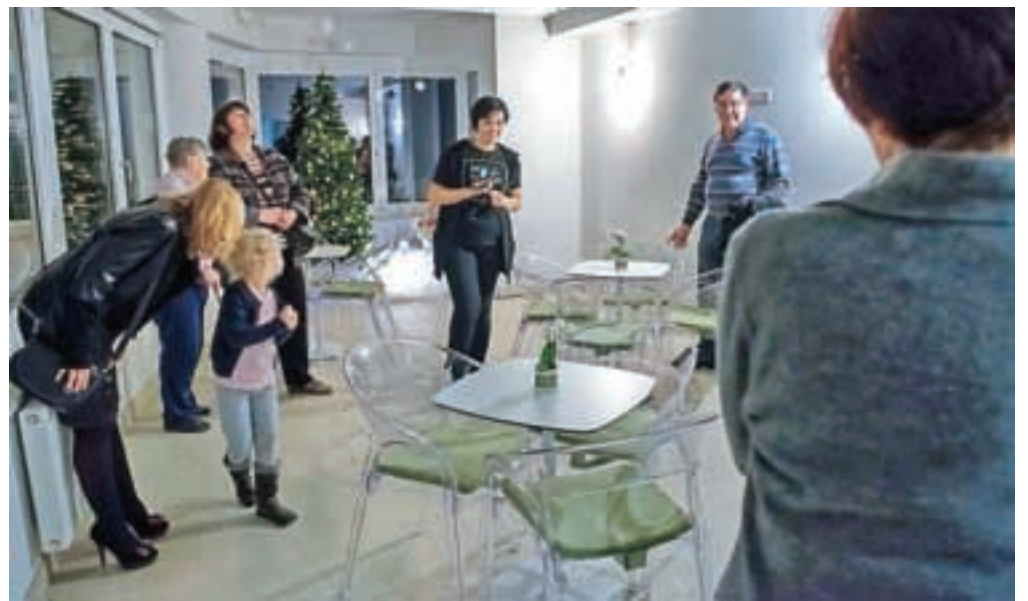
Na polzaprtih terasah, ki so jih uredili v novem prizidku, bodo imeli dostop na svež zrak tudi tisti stanovalci, ki se težje odpravijo na dvorišče.

Že lani so tako prostore negovalnega oddelka v četrtem nadstropju prenovili in jih spremenili v oddelke gospodinjske skupnosti, ki predstavljajo naj sodobnejšo obliko varstva starejših. Nato so se lotili še gradnje prizidka na severovzhodnem delu hiše, kjer so v tretjem in četrtem nadstropju uredili polzaprte in zaprte terase, ki tistim stanovalcem, ki ne morejo na dvorišče, omogoča odstop na prosto. V prvem in drugem nadstropju prizidka so nadstandardna stanovanja – po en dvoposteljni apartma in ena enoposteljna garsonjera. Dom ima tako skupaj že