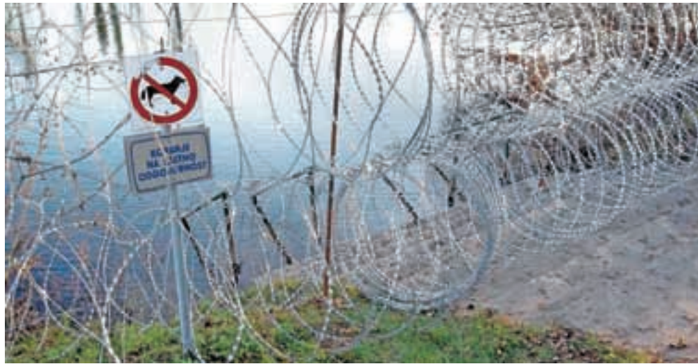
Napis Kopanje na lastno odgovornost bodo spremenili v Dostop do vode na lastno odgovornost. / Foto: Ko(l)palci

Nova žična ograda, po značilnih italijanskih testeninah imenovana fusilli ali po nase fušlno, od sredine meseca listopada naprej obrežje ločuje od reke (glej fotografijo) in na ta način kopalcu onemogoča običajen vstop v vodo. Ta je za goste kampov, kot sta Katar in Kolpa, možen le s skokom čez ograjo ali na kakšen drug poljuben način. Kot so nam sporočili organizatorji Listopada v Kolpo, bodo skoki na tradicionalnem prvem tekmovanju potekali v petih kategorijah, ki so določene glede