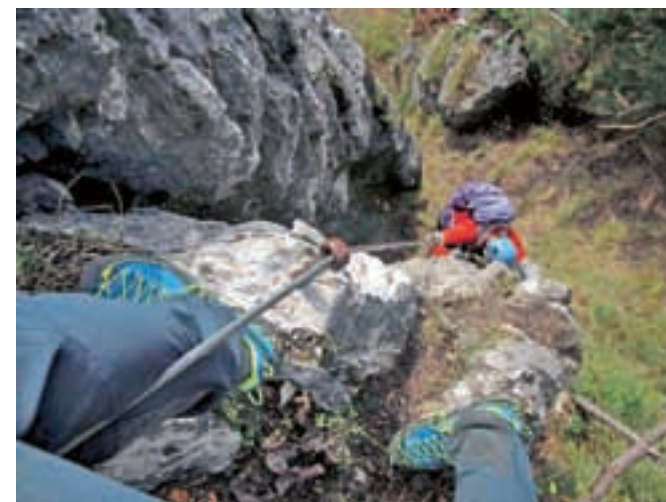
Na vrhu kamina