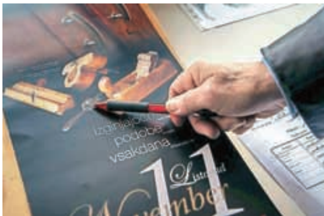
Nekateri kosi orodja, ki jih uporablja pri svojem delu, so stari tudi sto let.

O svojih naslednikih, ki bi nadaljevali tradicijo izdelave lesenih čolnov na Bledu, ne razmišlja. »Vsaj 12 let bom še sam delal,« prepričano zatrdi in pojasni, zakaj ravno 12 let. »Obljubljeni so namreč, da tistim obrtnikom, ki bodo delali še po devetdesetem letu, ne bo treba plačevati davkov. No, to bi rad dočakal,« hudo mušno pribije Polak.