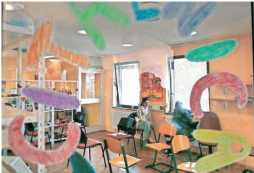
Polurni pogovori v »čitalnici«.

»Šent sem spoznal, ko sem tu delal po kazni, ki mi jo je naložilo sodišče. Šeststo ur so mi dali, kasneje pogojno znižali na dvesto. Delal sem vse tisto kot drugi, dobro sem se počutil, ker so me kljub kazni in kljub temu da sem Sint, sprejeli kot sebi enakega. Nato mi je Anže