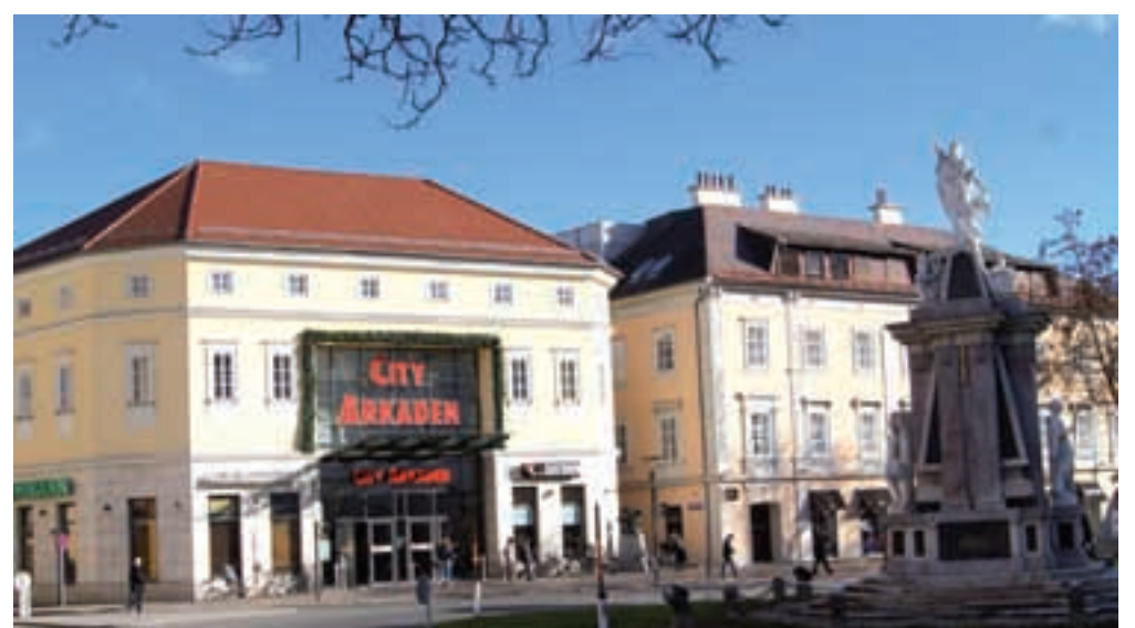
neposredno ob starem mestnem jedru avstrijsko koroške prestolnice leži zelo priljubljen nakupovalni center CityArkaden.

Obiščite naprimer tudi Benediktinski trg/Benediktinerplatz s Kamnitim ribičem, ki je bil postavljen leta 1606 in od tedaj naprej spremlja vrvež na prijetni celovski tržnici. Knežji kamen pa je na ogled v preddverju Deželnega muzeja. Pa še mnogo drugega se najde, od starih znamenj, vzorno urejenih arkad in hodnikov do izjemno zanimivih razstav.