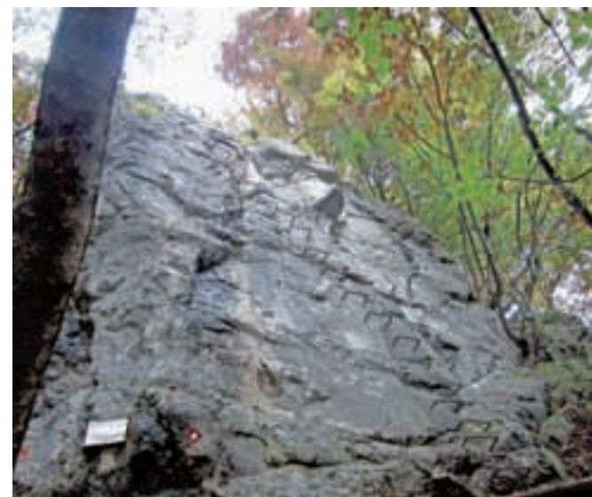
Vstop v ferato na Lisici

Nadmorska višina: 948 m Višinska razlika 310 m Trajanje: 1 ura in 30 minut Zahtevnost: ★★★★★