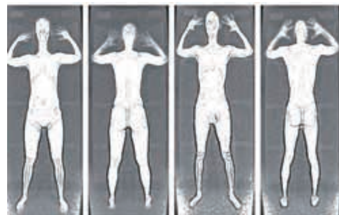
Takole nas na ekranih vidijo varnostniki, ko nas pregledujejo. Posneta oseba je bila očitno b. p.