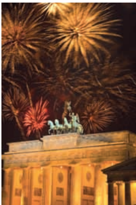
Fotografije: zgoraj Berlin - Brandenburška vrata, levo spodaj božična tržnica Gendarmenmarkt, desno spodaj božična tržnica v Hamburgu

BERLIN vsako leto zasije v praznični osvetlitvi. Tudi letos se bodo obiskovalci kar težko odločili, katero od kar 60 božičnih tržnic obiskati. Zaradi zelo posrečene kombinacije tradicije in sodobnosti so berlinske božične tržnice vse bolj priljubljene. Tudi ponudba izdelkov, ki jih lahko kupijo, je izjemno