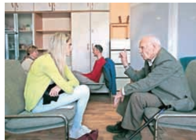
Nekdanji interniranec v taborišču Dachau