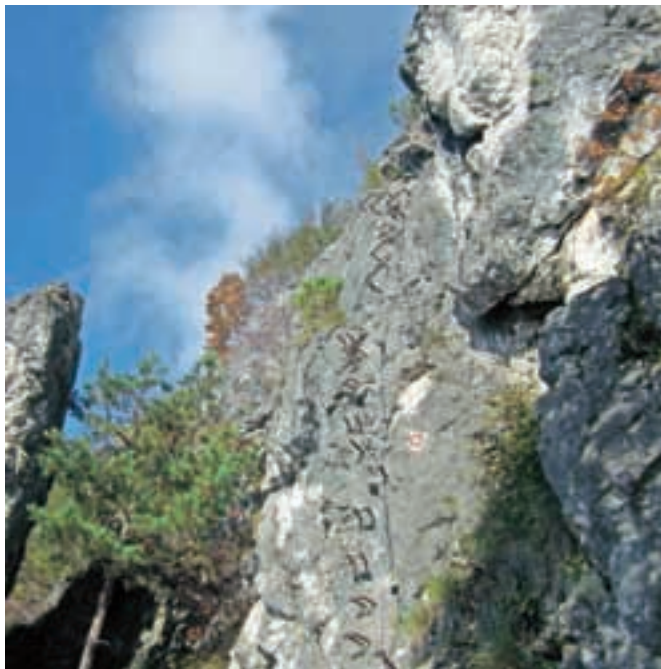
Lestev v nebo