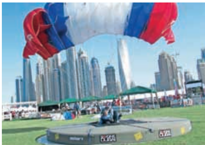
Senad Salkič se zaveda močne konkurence.

Lesce – Odlična infrastruktura in vrhunska organizacijska ekipa, na čelu katere je princ Mohammed bin Rashid Al Maktoum, je lani prepričala vodilne v mednarodni letalski zvezi in Dubaju zaupala organizacijo največjega tekmovanja v zračnih športnih. Nastopili bodo modelarji, balonarji, piloti akrobatskih letal ter nam precej bolj znani klasični in jadralni padalci. Na jugu perzijskega zaliva se bo zbralo okrog 1500 športnikov iz petdesetih držav, za razliko od klasičnih olimpijskih iger, kjer morajo športniki za uvrstitev doseči normo, pa se letalske