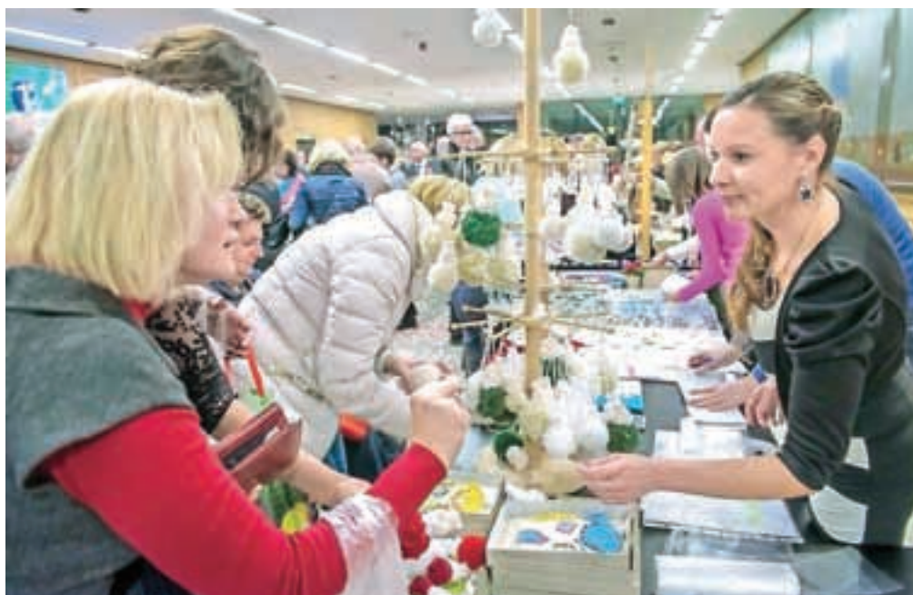
Dobrodelni bazar je bil tudi letos zelo dobro obiskan.

»Tudi če nas doleti nekaj hudega, je pomembno, da se imamo s kom objeti, da je nekdo ob nas, da nas razume in pomaga. Zato naj čestitam organizatorjem dogodka, ki je pomemben zlasti za tiste, ki so v nekem trenutku postali drugačni. A to se lahko vsak trenutek zgodi vsakomur. In najpomembnejše je, da takrat ne ostaneš sam. Da