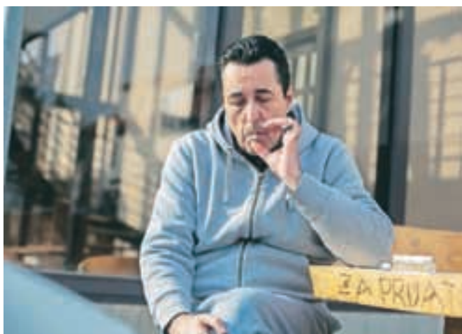
Darko, Sint

Živo knjižnico, s katero so v Šentu želeli ljudi ozaveščati in učiti o vrednotah, človekovih pravicah ter spodbujati razpravo o predsodkih in stereotipih v družbi, je v Radovljici obiskalo več kot petdeset ljudi, ki so si za polurne pogovore izbrali skupaj 80 živih knjig. Največ zanimanja je bilo za duhovnika, ki je sodeloval v kar šestih polurnih pogovorih, po štirikrat so bili »izposojeni« nekdanji odvisnik, rejnica deklice z Downovim sindromom, gej, zaposlena v hospicu, mama, ki ji je umrl otrok in Indijec. Projekt Živa knjižnica je sicer pred petnajstimi leti razvila danska mladinska nevladna organizacija Ustavi nasilje, v Sloveniji pa so jo prvič organizirali leta 2007.