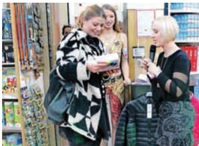
Žreb je tokrat s simpatičnimi in uporabnimi nagradami razveselil tri srečnice.