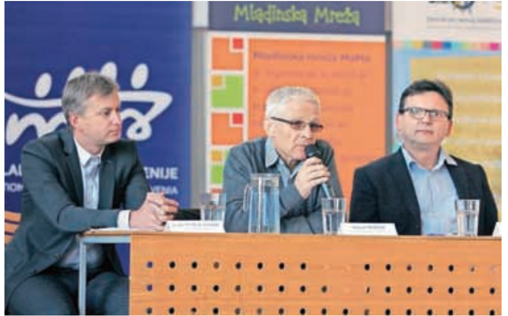
V Škofji Loki so mladi spregovorili o problemu pomanjkanja neodvisne mladinske infrastrukture.