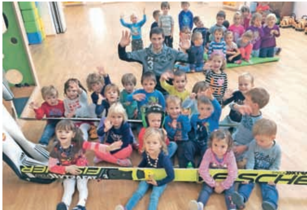
Obiskal jih je Robert Kranjec.