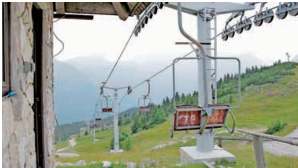
Največja letošnja investicija na gorenjskih smučiščih je bila prenova sedežnice Šimnovec na Veliki planini.

Na Krvavcu nadaljujejo z izpopolnjevanjem tehničnega zasneževanja, ki je ob trenutnih zimah, ko je snežnih padavin malo, najbolj nujno za normalno obratovanje,