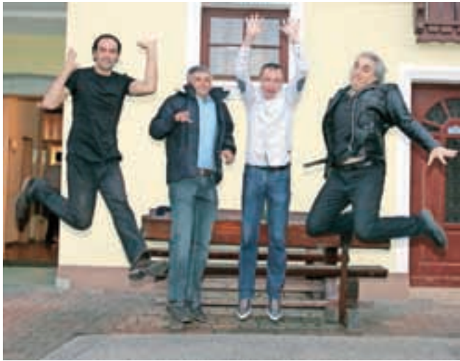
Tudi v resnih letih, a še vedno za hece in na poskok / Foto: Tina Dokl

nama bo zdravje služilo, imam dva sinova – kako bo z njunima službama in zdravjem. Videti je, da ostajate na delavnem mestu, na katerem trenutno ste, in tam boste tudi uspešno dočakali upokojitev. Mož redno zaposlen ne bo več, tako kot je bil, vendar se kljub temu kaže stalen dotok denarja. To pomeni, da bo še vedno delal, vendar honorarno oziroma na drugačen način. Ker je iznajdljiv in varčen, ne bosta nikoli v pomanjkanju. Delo ga drži pokonci in ne počuti se dobro, če je primoran posedati. Eden izmed sinov se bo zaposlil kmalu za tem, ko bo dokončal šolanje. Drugi ima veliko željo po tujini. Dobil bo dve priložnosti. Svetujem, da dobro premisli in se še ne odloči takoj. Srečno.