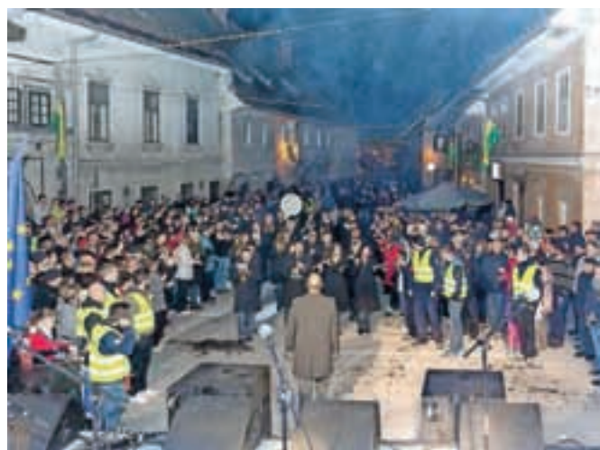
Na Spodnjem trgu v Škofji Loki je potekala velika zabava ob pridobitvi obvoznice