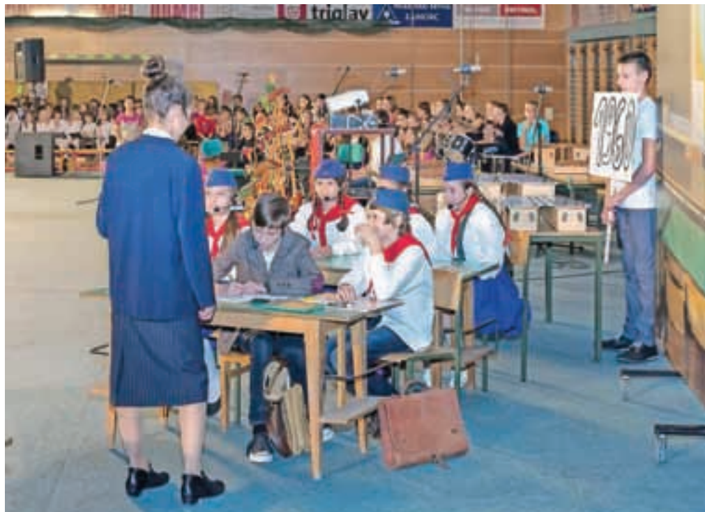
Na poti skozi dvestoletno zgodovino šole so se učenci ustavili tudi v času pionirjev.