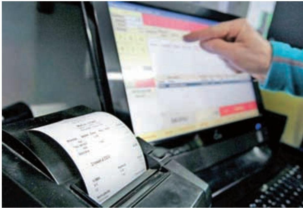
V finančni upravi in pri davčnih zavezancih vse od sprejetja zakona o davčnem potrjevanju računov potekajo priprave na uvedbo davčnih blagajn.

Zavezanec bo moral ob vsaki dobavi blaga in storitev