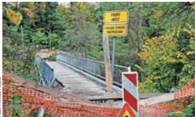
Most na Hujah je še vedno poškodovan in zaprt.