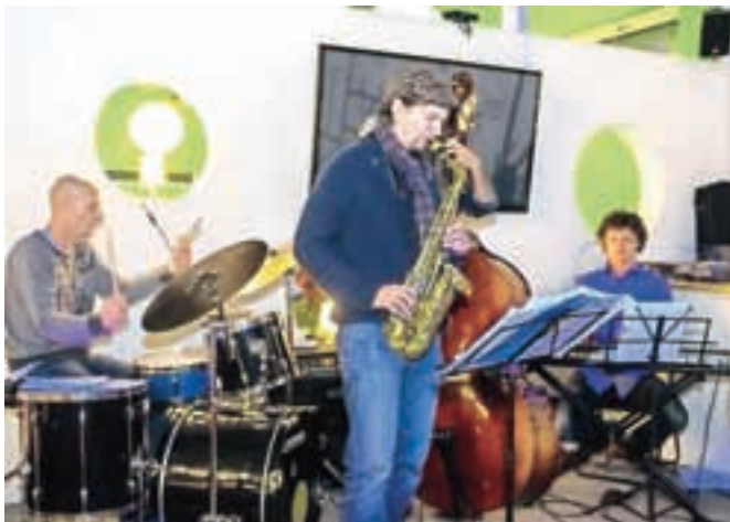
Prenovljeno biljardnico Break je odprl nastop zasedbe Hot 4 Jazz Quartet.