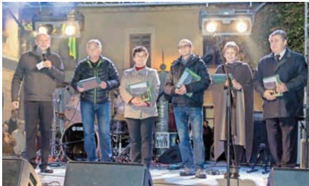
Najbolj zaslužni za obvoznico so prejeli priznanja.

Ločane, ki so na obvoznico mimo njihovega mesta čakali štiri desetletja, posebej pa za prebivalce Spodnjega trga in Poljanske doline, ki so najtežje prenašali prometne razmere ob regionalni cesti. Dobili so obvoznico,