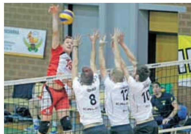
Kamničani (v belih dresih) so tokrat uspešno ustavili triglavane in jim zadali drugi poraz v sezoni.

prave energije. Kamničani so na drugi strani s taktično zrelo igro prišli do novih točk, s čimer je bil zadovoljen tudi trener Marko Brumen. Posebnost tekme je bila tudi ta, da so Kranjčani s pomočjo Odbojgarske zveze Slovenije pripravili posebno presenečenje, saj so v Kranj pripeljali oba pokala, ki jih je osvojila reprezentanca Slovenije: pokal za drugo mesto na evropskem prvenstvu in za prvo mesto v evropski ligi. Tretji gorenjski predstavnik v prvi ligi, National Žirovnica, je doma gostil vodilno ekipo na lestvici ACH Volley in izgubil z 0 : 3 (-23, -19, -18). Kamničani so na lestvici na drugem mestu, Triglavani