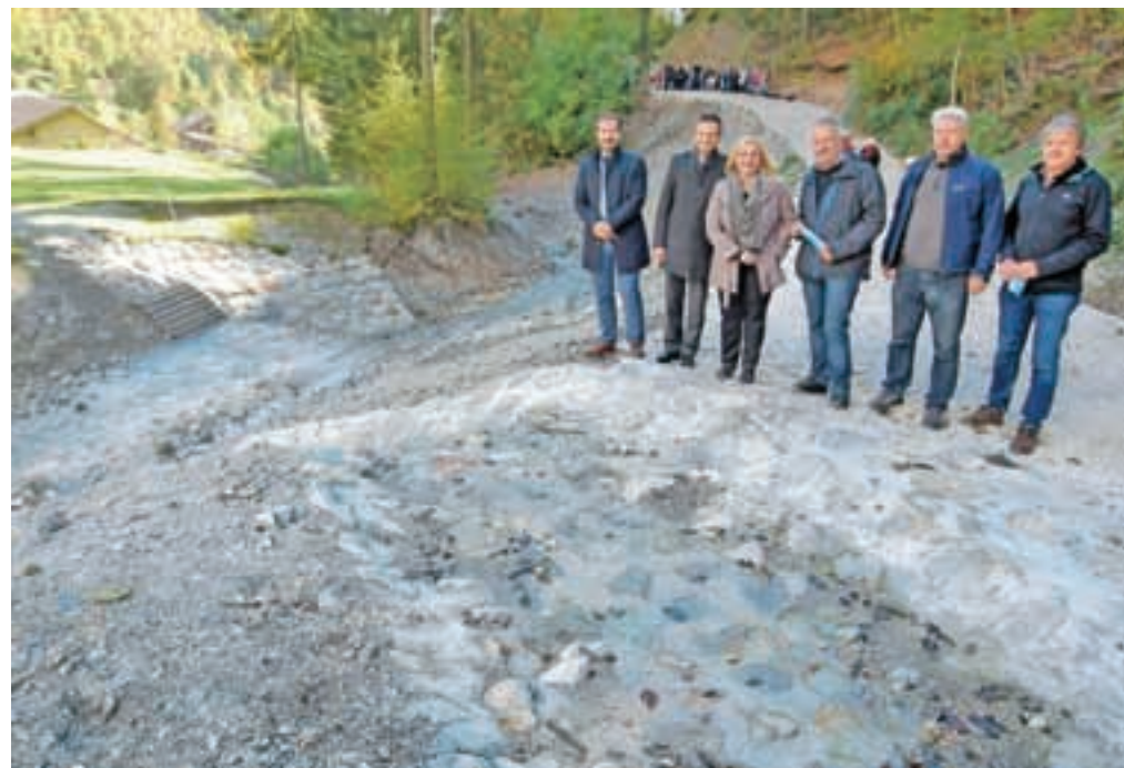
Partnerji pri projektu – predstavniki Občine Kamnik in Sklada Si.voda ter izvajalca Hidrotehnika – ob novi pridobitvi, ki močno zmanjšuje hudourniško ogroženost prebivalcev doline Bistričice.