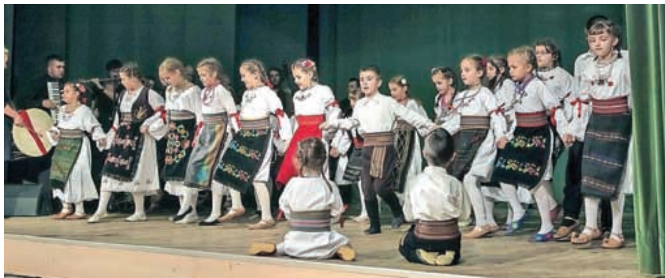
Na prireditvi Razigrana mladost so navdušili tudi najmlajši.