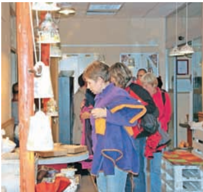
Zavzetost ustvarjalcev glinenih svetil in drugih izdelkov ter navdušenje obiskovalcev sta lepo zaokrožila praznovanje.