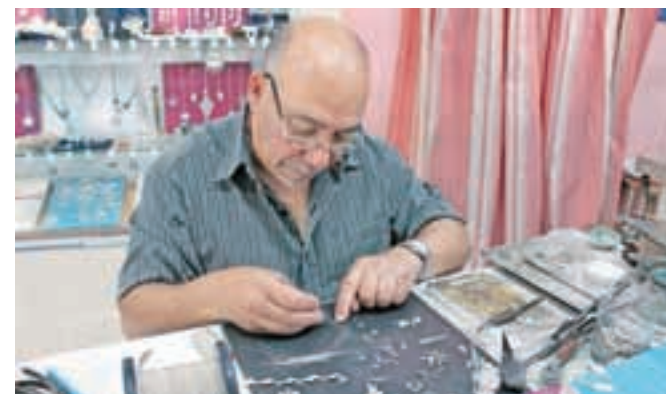
... kot mojstre uporabe srebrne nitke, iz katere 'stkejo' krasen nakit.