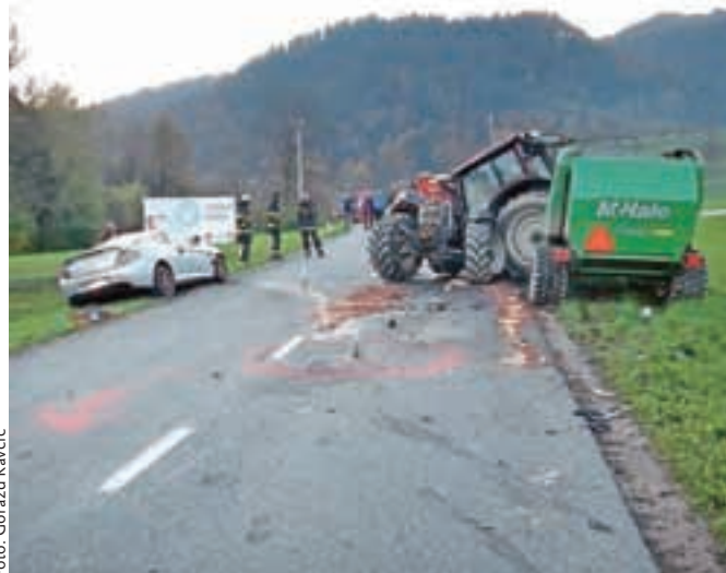
Na regionalni cesti med Gorenjo vasjo in Hotavljami sta v soboto trčila voznika osebnega vozila in traktorja.

Gorenja vas – Škofjeloški policisti so v soboto okoli 16.20 na cesti Gorenja vas–Hotavlje obravnavali prometno nesrečo s telesnimi poškodbami, v kateri sta trčila voznika osebnega avtomobila Hyundai Coupe in traktorja. Traktorist je vozil proti Hotavljam, voznik avtomobila pa mu je pripeljal nasproti. Zaradi preverjanja informacij, da je voznik udeleženega avtomobila Hyundai pred nesrečo v smeri svoje vožnje prehiteval drugo vozilo, policisti prosijo voznika prehitevanega vozila, šlo naj bi za večje vozilo ali celo kombi, in druge priče, naj podatke sporočijo na številko 113 ali Policijsko postajo Škofja Loka na telefon (04) 502 37 00.