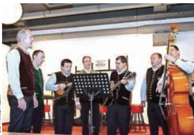
Za pester večer je poskrbela tudi klapa Kostanarji.