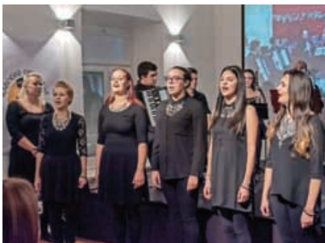
Dneve srbske kulture v Kranju je v gradu Khislstein odprl nastop skupine Brđanke.

račun prišli v soboto ob veličastni sklepni prireditvi Razigrana mladost, ki je potekala v Domu krajanov na Primskovem. Pestri in atraktivni folklorni nastopi osmih skupin iz Srbije, Italije in Slovenije niso nikogar pustili ravnodušnega. »Kulturno društvo Brdo uspešno predstavlja srbsko kulturo in ljudsko izročilo skozi folkloro, ljudske