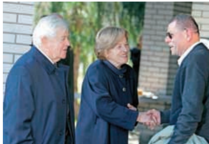
Milan in Štefka Kučan. Oba sta, vsak na svojem področju, sodelovala s pokojnim Bučarjem.

Dr. Francetu Bučarju v slovo je najprej spregovoril njegov študent in prijatelj dr. Jože Mencinger, ki je dejal, da bo v naši zgodovini trajno zapisan kot državnik