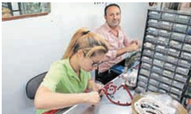
Pri delu smo si lahko ogledali tako mojstre izdelovanja ogrlic ...