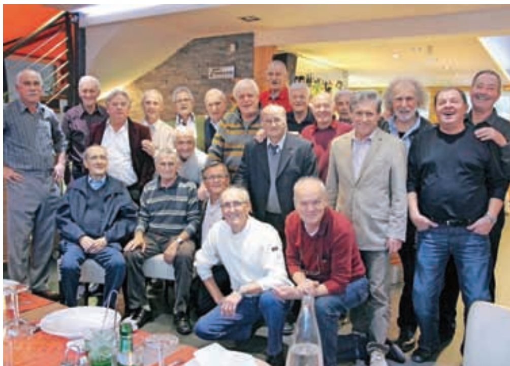
Sošolci iz 3. a so zaključili poklicno šolo leta 1965.