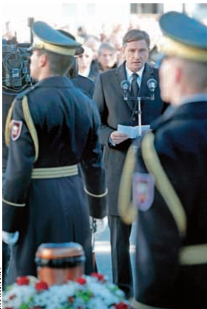
Od pokojnega državnika dr. Franceta Bučarja se je v imenu države Slovenije poslovil njen predsednik Borut Pahor.