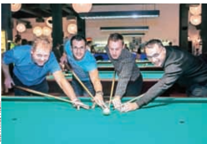
Na zeleni mizi so se pomerili tudi predstavniki občin.