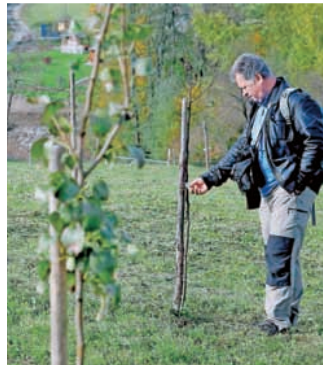
Sadovnjak Sadjarsko vrtnarskega društva Tunjice je prava zakladnica starih sadnih sort.

Načrtov imajo namreč še veliko. V zaključni fazi je že spletni katalog stare-sorte.si, v katerem bodo