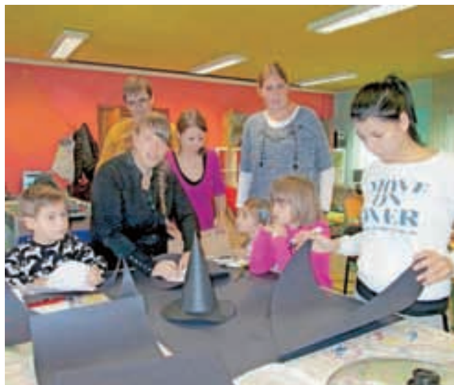
Ves teden bodo ustvarjali čarovniške pripomočke, v četrtek pa bodo pripravili pravo čarovniško zabavo.