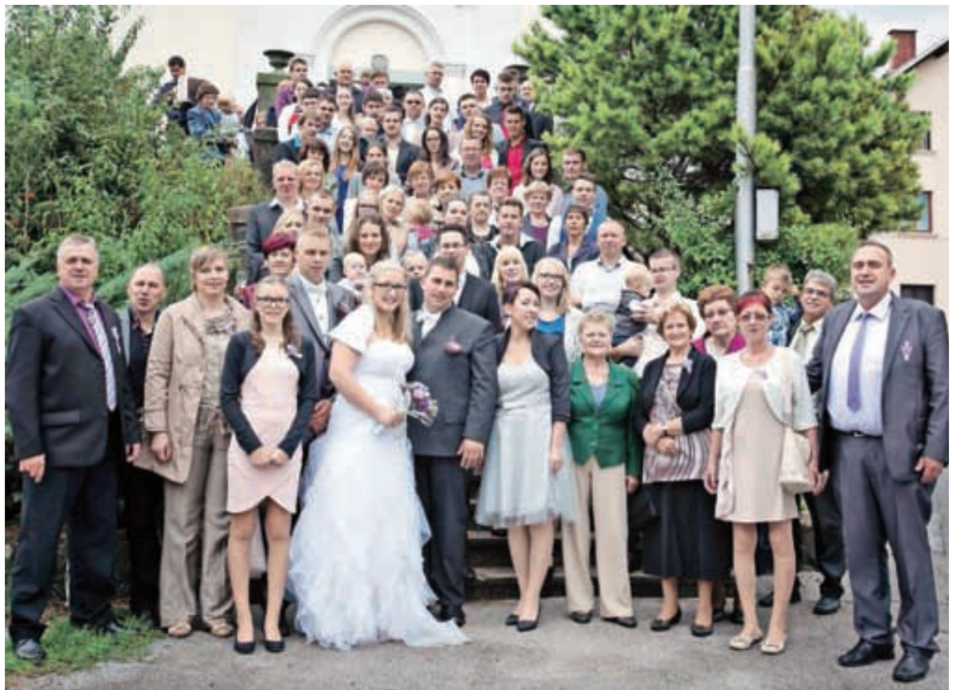
Skupinska za večno