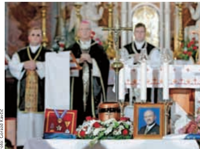
Maša zadušnica v domači cerkvi svetega Miklavža

V imenu državljanov in državljank Slovenije in v svojem osebnem imenu se je od dr. Bučarja poslovil predsednik republike Borut Pahor. »Dr. France Bučar je bil eden od ustanovnih očetov lastne države. To je bila velika zgodba slovenskega naroda in dr. Bučar je hotel videti in delati veliko zgodbo. Zgodbo o svobodnejši in boljši družbi. Zgodbo o Slovencih kot suverenem narodu. Zgodbo o povezani Evropi svobodnih narodov. In premočrtno, skoraj trmasto jo je vodil do srečnega konca,« je dejal predsednik Pahor. Zanj je bil narodni voditelj in buditelj in usodi smo lahko hvaležni, da ga je postavila v prelomni čas