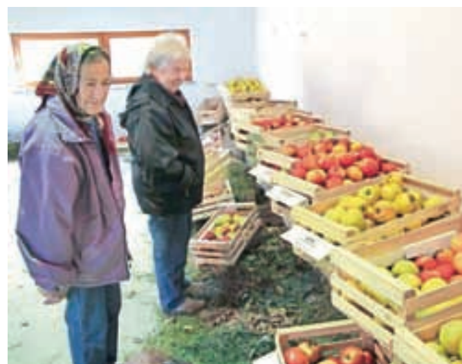
Med ogledom razstave odpornih sort na Blaževčevi domačiji v Izgorjah

Na razstavi je na ogled petinsedemdeset različnih odpornih sort jabolk, od tega je petnajst novejših sort, ostale so stare sorte, nekatere med njimi tudi še neprepoznane in brez imena. Razstava je zasnovana po t. i. De Lukasovi klasifikaciji, ki deli sorte na kalvile, škrobotovke, renete. Okrog dvajset sort je za razstavo prispeval inštitut, deset jih je z domačije Pr Blaževc, preostale pa so prispevale druge gorenjske