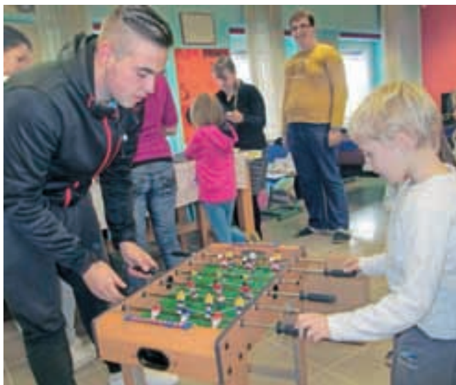
V novem radovljiškem mladinskem centru KamRa lahko počitniške dopoldneve preživljajo mladi vseh starosti.

od ponedeljka do četrta, vsak dan med 9. in 15. uro, že naslednji teden pa začnemo z rednim programom mladinskega dnevnega centra.« Odprt bo od ponedeljka do četrta od 13. do 19. ure, v njem pa so organizatorji za mlade pripravili program delavnic za aktivno preživljanje prostega časa, brezplačno učno pomoč pa tudi zg olj prostor za druženje, ki ga mladi, sodobnim elektronskim komunikacijam navkljub še vedno potrebujejo.