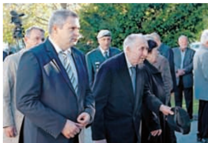
Minister Dejan Židan in Franc Oman. Za njima Marjan Podobnik.