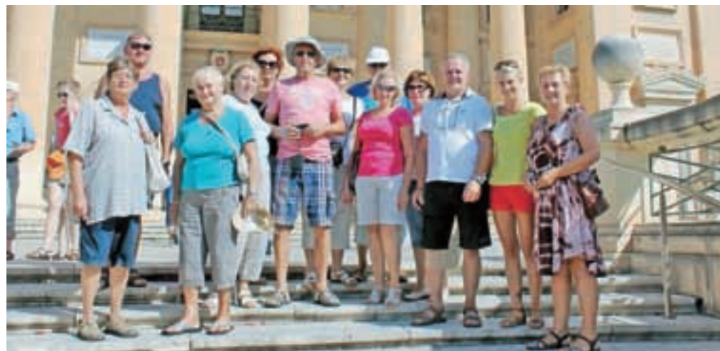
Glasovi popotniki v Mosti / Foto: A. B.

Zanimivo je, da se Slovenci ne odločamo zelo pogosto za obisk tega otoka. Zadnje čase je sicer pri mladini priljubljen St. Julians, ker naj bi zanj veljalo, da se v njem najbolje žu ra, starejša generacija pa se še vedno precej odloča za hotelsko nastanitev v Bugibbi ali Sliemi. Med turisti se najdejo tudi taki, ki se odločijo za nastanitev na Gozu ali celo Cominu. Iz marine v Sliemi se lahko do glavnega mesta Valletta zapeljete tudi s trajektom ali pa si iz kakšne druge turistične ladjice ogledate mesto z morske strani. Sicer pa se odločite za avtobus, ki