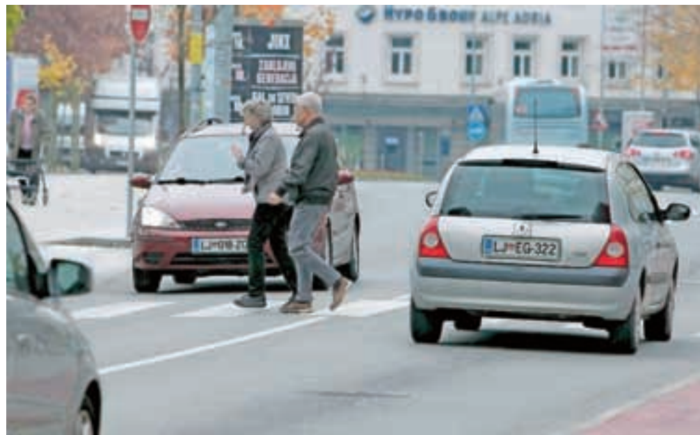
Pešči niso vedno varni niti na posebej označenih prehodih.

Omenjeni nesreči sta bili samo dve med približno štiridesetimi letošnjimi prometnimi nesrečami z udeležbo pešcev na Gorenjskem. V skoraj vsaki četrti je