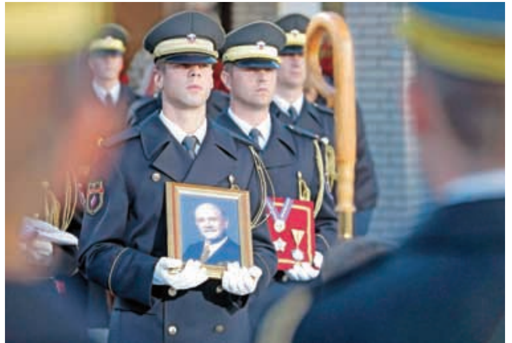
Dr. Franceta Bučarja so pokopali z državnimi častmi.