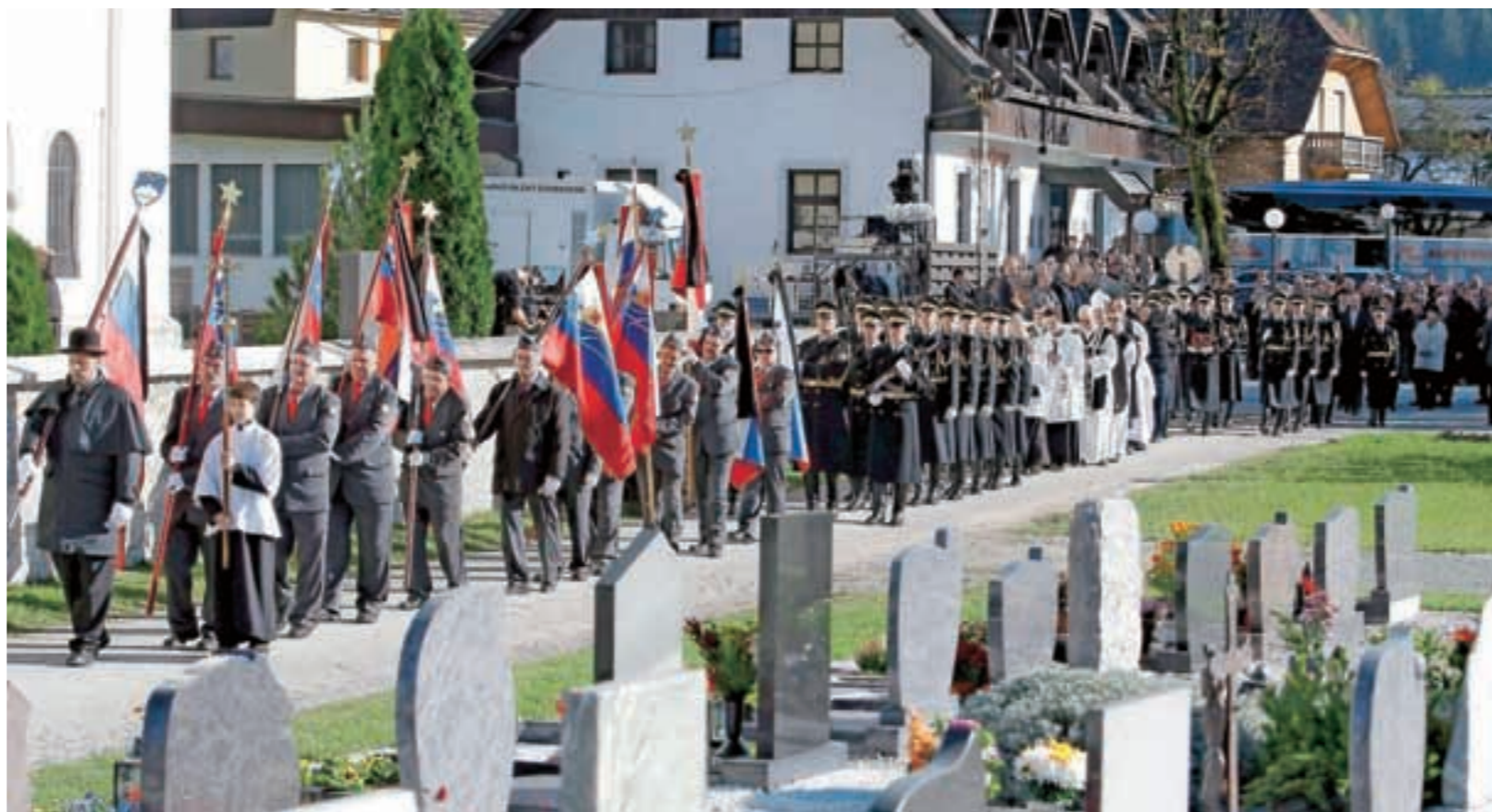
Pokojnikova zadnja pot

mislila večina. Bil je zasvojen s politiko, vendar za njo povsem neprimeren. Pravzaprav je zmeraj nasprotoval vsemu, kar je bilo večini samoumevno. Takšnih ljudi je malo, zato so v družbi toliko bolj potrebni. Najbolje se je počutil kot upornik z razlogom ali brez njega, kot človek, ki je zase mnogokrat povedal, da ga niso marali ne levi in ne desni,« je dejal dr. Mencinger. Spomnil se je na njuno prijateljstvo, na redne mesečne pogovore, na skupne vzpone v gore. Zadnji je bil