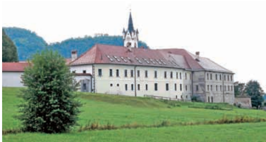
O mekinjskem samostanu bodo kamniški svetniki razpravljali na jutrišnji seji.

pestre, uravnatežene in čim manj predelane hrane za zdravje in dobro počutje tako vrhunskih kot rekreativnih športnikov, mleko in mlečne izdelke pa posebej omenili kot živila, ki zadošijo številnim potrebam po zdravi hrani. Sploh če gre za izdelke, ki so pridelani v lokalnem okolju ter na človeku in naravi prijazen način. Nekaj svojih novih produktov, ob mleku tudi skuto, sir in jogurte različnih okusov, so v soboto Dolenčevi predstavili širši javnosti. Naprodaj so na kmetiji, nekateri tudi v tamkajšnjem mlekomatu – na voljo 24 ur na dan.