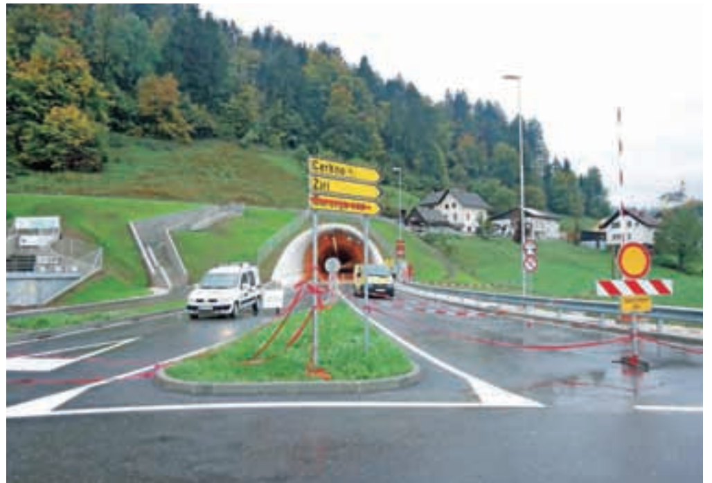
▶ 2. stran Jutri bo končno stekel promet po škofjeloški obvoznici v Poljansko dolino.

V Poljanski dolini so se odprtja obvoznice ob točilnem pultu, dolgem 712 metrov, kot je dolg predor pod Stenom, veselili že pred dobrim tednom. Škofja Loka pa praznuje danes. Najprej si bo med 13. in 17. uro moč ogledati predor in priložnostno razstavo v niši predora ter celotno traso obvoznice prehoditi peš, preteči, prekolesariti ali prevoziti z rolerji. Ob 17.30 bo uradno odprtje s slovesnostjo pred vstopom v predor Sten na Suhi. Še bolj veselo pa bo v Škofji Loki v petek, 23. oktobra.