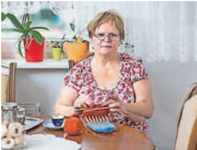
Sodobno oblikovane balkanske copate ročno izdelujejo Jeseničanke, ki so se v mesto priselile iz bivših jugoslovanskih republik.

ki jih priseljene ženske nosijo v spominu svojih rok in so se jih naučile izdelovati kot deklice od svojih ženskih prednic,« pravijo v zavodu Oloop, kjer so tradicionalni balkanski copat posodobili in mu v stiku z islandsko dediščino pridali tudi islandske prvine. Na razstavi v Ljubljani bodo predstavili kolekcijo copat ter sam proces njihovega ustvarjanja. Projekt financira Finančni mehanizem EGP in Norveške, poleg zavoda Oloop pa v njem sodeluje društvo UP z Jesenic.