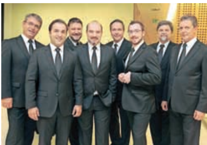
Slovenski oktet