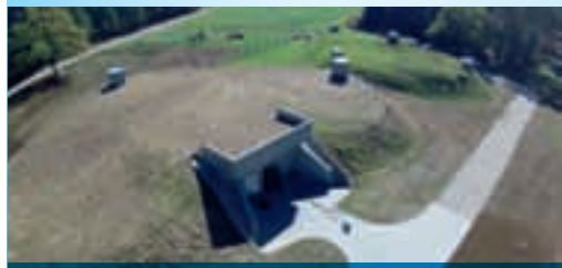
Vodohran Zeleni hrib bo zagotavljal kakovostno pokrivanje nihanja največje dnevne potrošnje vode

Z izvedbo projektnih aktivnosti so bili izpolnjeni zastavljeni cilji, ki segajo od povečane zanesljivosti in varnosti oskrbe s pitno vodo, učinkovitejšega upravljanja z vodovodnimi sistemi do zagotavljanja nemotene oskrbe s pitno vodo ne glede na stanje posameznega vodnega vira.