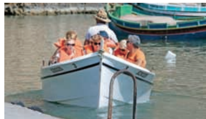
Na Gozu za ogled določenih obalnih znamenitosti z morske strani uporabljajo posebne ribiške čolne.

Z Goza do Comina je sicer le nekaj minut vožnje po