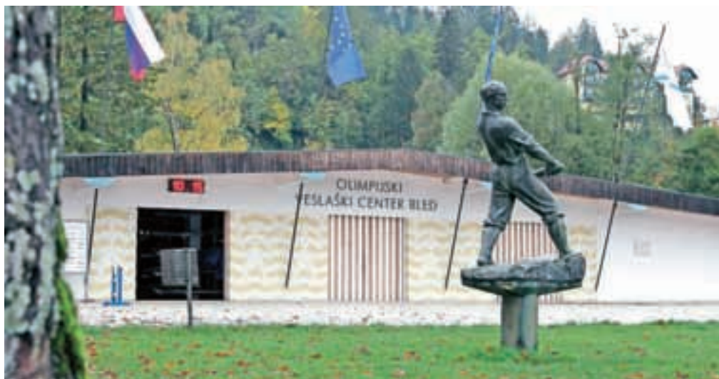
Gradbenim podjetjem naj bi za dela pri projektu gradnje veslaškega centra prek aneksov nepravilno plačali šeststo tisoč evrov preveč občinskega denarja.

Bled – Iz dokumentov, ki so jih od ministrstva za izobraževanje, znanost in šport na portalu podcrto.si pridobili z zahtevo po dostopu do informacije javnega značaja, izhaja, da je občina gradbenim podjetjem za dela pri projektu gradnje veslaškega centra prek aneksov nepravilno plačala šeststo tisoč evrov preveč občinskega denarja. Ministrstvo za izobraževanje naj bi tako občino v skladu z evropskimi pravili kaznovalo z odvzemom 25 odstotkov denarja, ki so jim ga dodelili prek evropskih in državnih razpisov, kar pomeni, da bi občina morala v državni proračun vrniti 151 tisoč evrov. Direktor občinske uprave Matjaž Berčon je ostro zavrnil, da bi občina sklepala nepravilne anekse, in zatrdil, da občina ni dolžna vrniti ničesar. »Zato se pustimo tožiti in naj se v pravnem postopku izkaže,