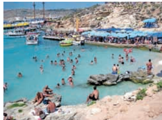
Modra laguna