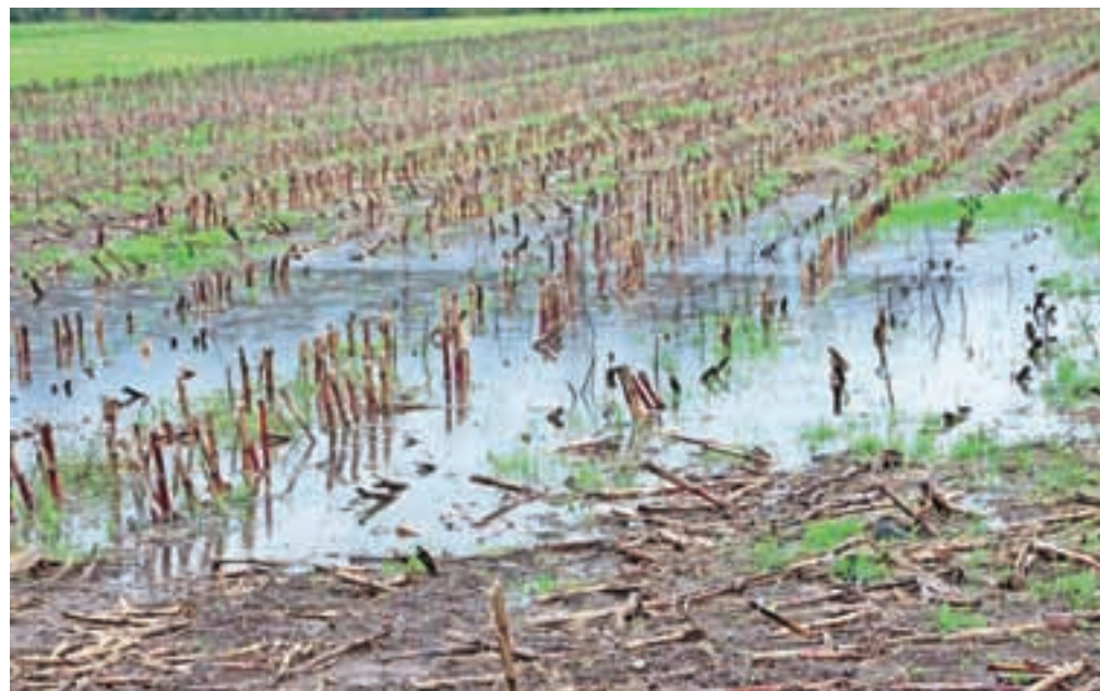
Setev ozimnih žit bo letos zaradi razmočenih tal kasnila.