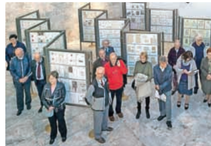
Filatelistični razstavi o zgodovini pošte v Škofji Loki in o prometu, slednja je posvečena odprtju obvoznice v Poljansko dolino.