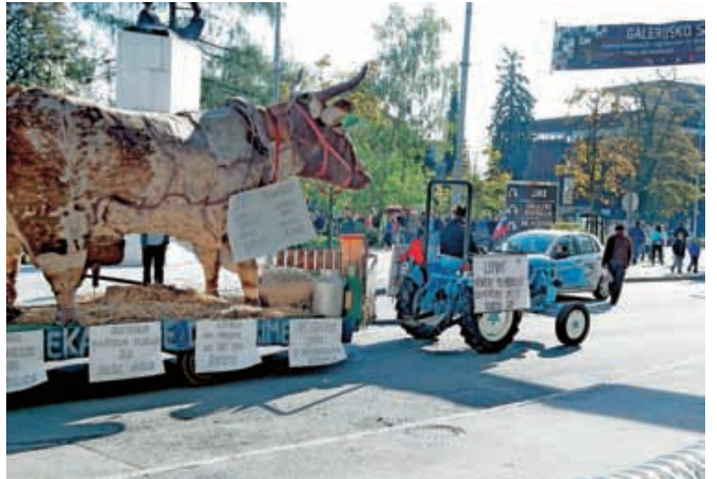
Kmetje so na shod pripeljali maskoto krave, ki je z različnimi napisi in slikami sporočala isto, kar so govorili kmetje in kmečki funkcionarji.

»Je pravično, da kmet od maloprodajne cene mleka dobi le četrtino, pri mesu sedmino, pri kruhu samo dvajsetino? Poskusite pridelati krompir po ceni deset centov za kilogram, če pa je lastna cena dvajset centov,«