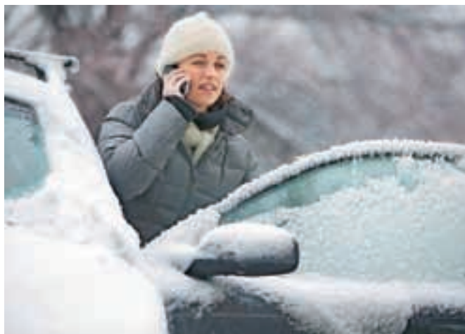
Da bi ne bil telefon edina rešitev iz zagate na cesti ...

Serviserji ob prihodu nižjih temperatur najpogosteje opažajo težave, kot so zamrznitev tekočine za čiščenje vetrobranskega stekla, odpo-