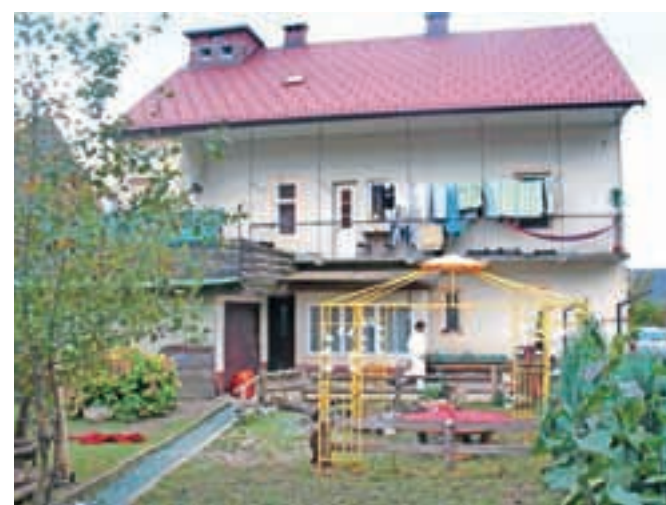
Kaj se je dogajalo za stenami nekdanjega samostana v Križah, bo pokazala policijska preiskava.

Med domačini so hitro zakrožila ugibanja in podrobnosti dogajanja, saj je bila lastnica hiše, ki naj bi bila storilka kaznivega dejanja, tudi poznana kot problematična. Okoli hiše je tako imela večje število živali, od konja, psa, ovac, gosi in kokoši ter številnih mačk, z živalmi pa naj ne bi najbolje ravnala, zato so sovaščani o dogajanju večkrat obvestili inšpekcijo. Tudi sicer se je zapletala v spore z bližnjimi sosedji, ki so nam pokazali posnetke groženj in grozilna SMS-sporočila, ki naj bi jih pošiljala. Vrsto prijav pa so sosedje navedli tudi