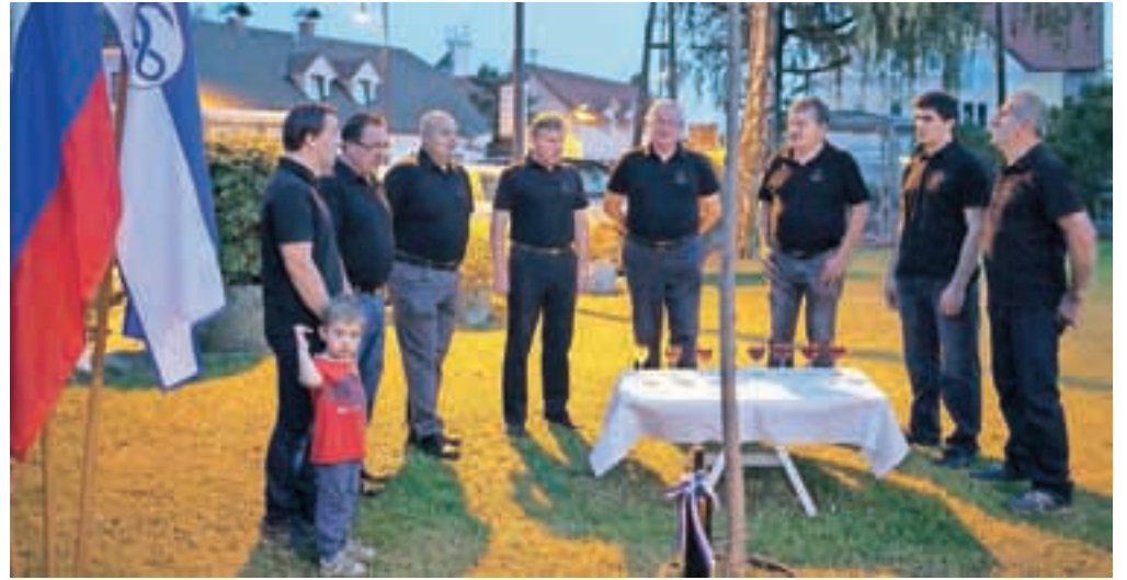
Člani zbora Mengeški zvon so zapeli ob novo zasajeni lipi pred mengeškim Domom kulture.