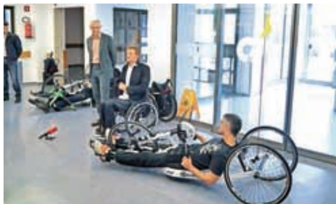
Predaja ročnega kolesa v avli URI Soča

odvijala med 24. in 29. avgustom letos in s katero so organizatorji po različnih krajih po Sloveniji, med drugim tudi v Kranju, predstavljali ročno kolesarstvo, vse bolj priljubljeno obliko športnega udejstvovanja invalidov, se je uresničil. Organizatorjem je s pomočjo sponzorjev in prispevkov posameznikov uspelo zbrati dovolj sredstev za nakup ročnega kolesa za invalide, ki bo poškodovancem na voljo v URI Soča.