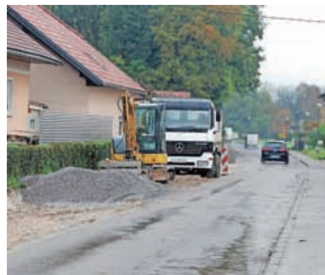
Na cesti Moste-Žeje pri Komendi te dni poteka gradnja vodovoda in kanalizacije.

Pred obnovo ceste še gradnja infrastrukture