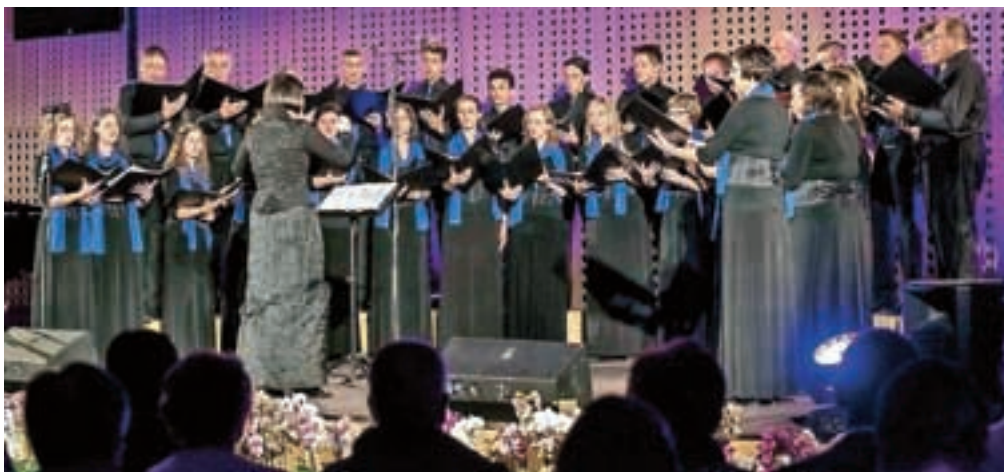
KPZ Mysterium je pred polno Kongresno dvorano na Brdu zapel raznolik program skladb na temo ljubezni.

zadovoljna po koncertu pove Štampetova, k številnim pohvalam ob raznolikosti programa pa doda: »Naša vizija je zmeraj bila izvajati raznolik program. Sicer vedno bolj stremimo k večjim klasičnim, predvsem vokalno-instrumentalnim delom, seveda pa hkrati puščamo odprta vrata presenečenjem iz drugih glasbenih zvrsti, od džez, priredb The Beatles ali pa španske glasbe iz Latinske Amerike.« Kljub temu da je deset let starejši, je KPZ Mysterium še vedno mlad, kar je dokazal tudi na tokratnem jubilejnim koncertu.