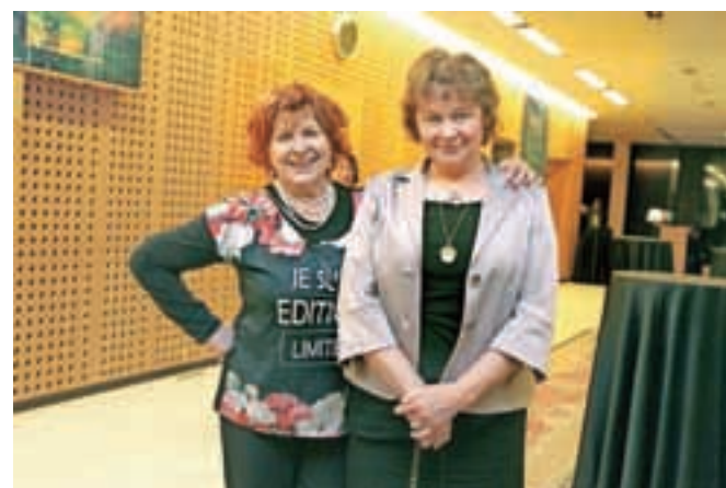
Dve Jožici, Svete in Kališnik