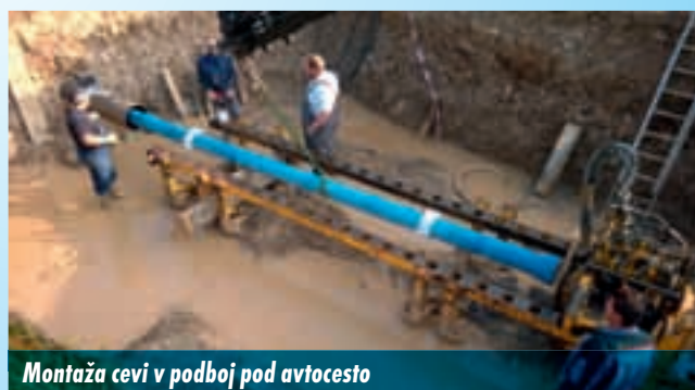
Montaža cevi v podboj pod avtocesto