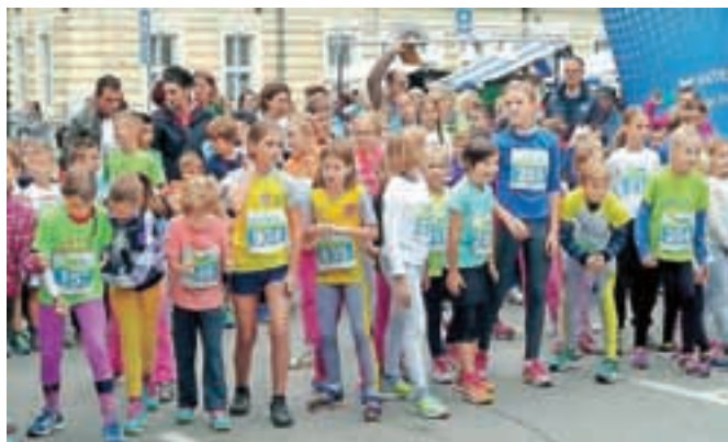
Na Veronikinem teku so tekli tudi otroci.

Zadnja prireditev v sklopu letošnje premierne povezave Gorenjska, moj planet bo 5. decembra 15. Miklavžev tek. Prijave so že odprte.