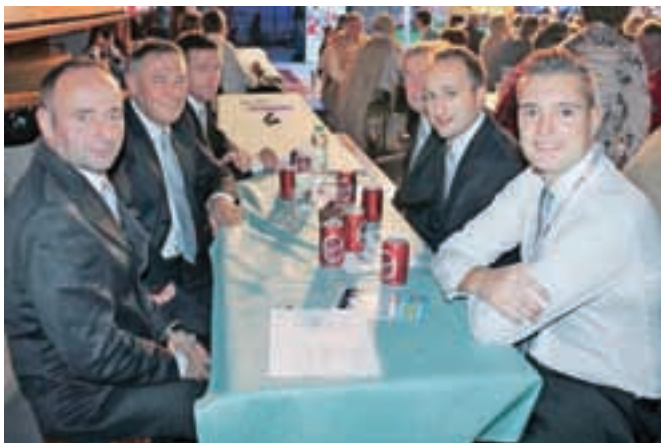
Večina Šenturškega okteta