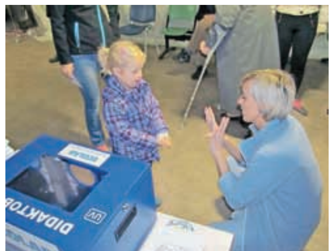
Na stojnicah so spodbujali umivanje rok, tudi med najmlajšimi, obiskovalci in zaposleni pa so lahko preverili, kako uspešno si znajo razkužiti roke.