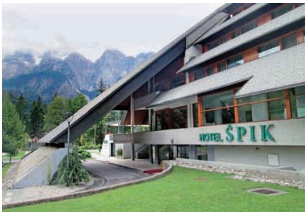
Za hotel Špik iščejo novega lastnika.

In medtem ko so spomladi predčasno prekinili pogodbo s švicarskim upravljavcem, dva izmed njihovih hotelov še vedno ostajata del hotelske verige Ramada. »S hotelsko verigo Ramada imamo podpisano dolgotrajno pogodbo, število hotelov, ki se ji pridružujejo, pa hitro narašča, sploh v Nemčiji, Turčiji in Veliki Britaniji. Vključenost vanjo nam po eni strani omogoča večjo prepoznavnost v svetu, po drugi pa nam nudijo velike možnosti izobraževanja zaposlenih. Zlasti pomembno se mi zdi, da imajo izjemno podrobno razvite standarde poslovanja, tako glede opreme kot glede storitev. Tem standardom smo zavezani slediti tudi mi, zaradi česa se nedvomno viša kakovost naših storitev in posledično zadovoljstvo gostov.«