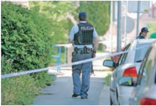
Zaradi sumljive smrdljive pisemske pošiljke so policisti v torek zavarovali širše območje vladne palače (slika je simbolična).