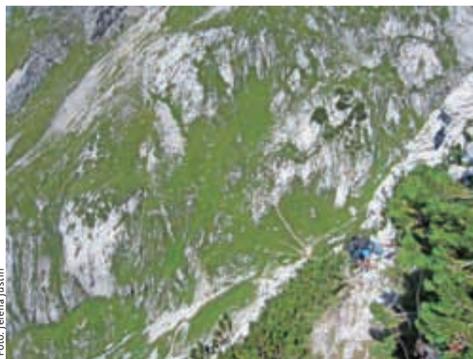
Izpostavljenost je ponekod izjemna. Spodaj je sedlo Luknja.

Nadmorska višina: 2500 m Višinska razlika: skupna 1300 m Trajanje: 8 ur Zahtevnost: ★★★★★