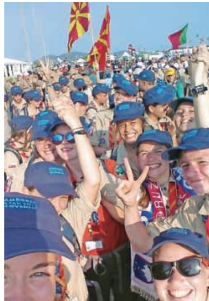
Slovenski taborniki letošnjega jamboreea ne bodo pozabili.

Na vsakega posameznika močan vtis naredi to, da lahko spozna ljudi z vseh celin sveta, nove kulture, nove načine sporazumevanja. Tako doma kot na svetovnih skavtskih srečanjih poskušamo taborniki mlademu človeku pomagati pri celostnem razvoju. Vse aktivnosti namreč temeljijo na delu v skupinah, kjer mladi razvijajo svoje komunikacijske spretnosti, konstruktivno rešujejo konflikte in razvijajo pozitiven odnos do novega, tujega in drugačnega. Čeprav nas država finančno zelo slabo podpira, se je jamboreea vredno udeležiti, saj je to življenjska izkušnja, ki je ne pozabiš do konca dni.«