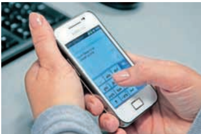
V Sloveniji je bilo lani poslanih kar 2,39 milijarde sporočil SMS.