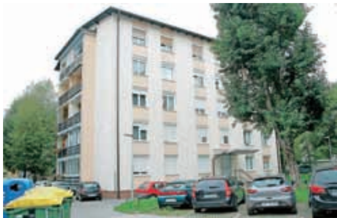
Hišno preiskavo so opravili tudi v stanovanju na Gosposvetski ulici 15 v Kranju.

Več o včerajšnjem izpletnu kriminalistov in njihovih ugotovitvah naj bi bilo znano v prihodnjih dneh.