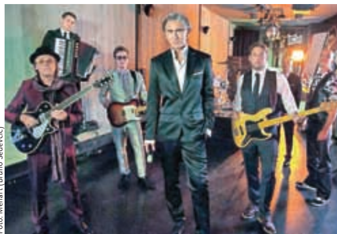
Novembra bo na prodajne police prišel nov Janov album.