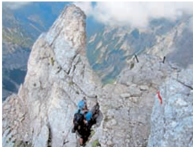
Tik pod vrhom Plemenic