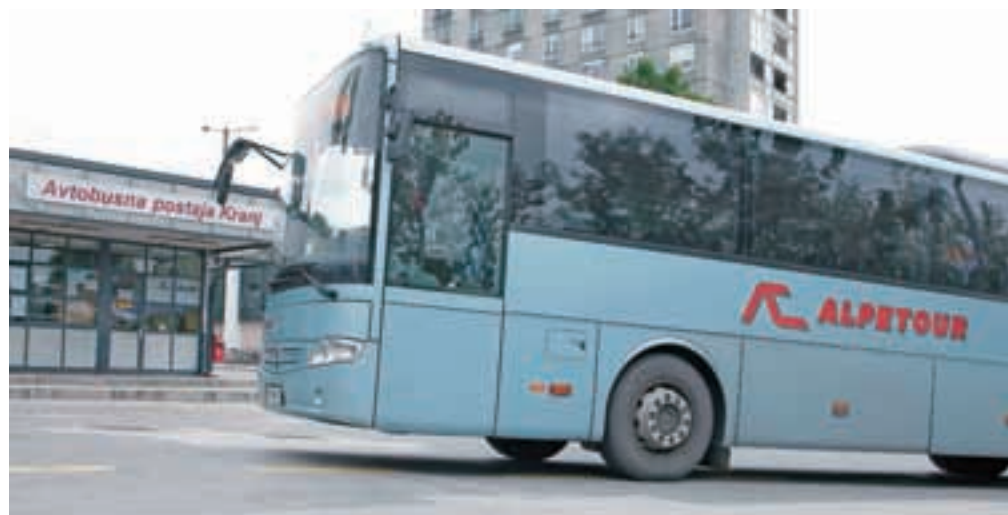
Prevzemna ponudba Arrive se nanaša na vseh 449.428 delnic Alpetourja.

dvema tednoma. Pred tem je morala prevzemnica izpolniti odložna pogoja iz dogovora o prodaji Alpetourja, torej pridobiti dovoljenje slovenskega varuha konkurence in soglasje nemškega zveznega ministrstva za promet in digitalno infrastrukturo. Dogovor o prodaji 266.081 delnic oziroma 59,21-odstotnega deleža Alpetourja je Arriva Dolenjska in Primorska s konzorcijem prodajalcev, v katerem so Modra Linija Holding, Banka Celje in Alpen Invest, podpisala že 7. aprila.