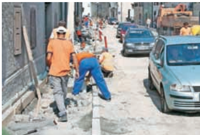
Med dejavnosti, v katerih je finančna uprava ugotovila največ kršitev, sodi tudi gradbeništvo.

Finančna uprava je največ postopkov izvedla v dejavnostih promet in skladiščenje, gostinstvo, gradbeništvo, cvetličarstvo in vrtnarstvo, vulkanizerstvo, trgovina, vzdrževanje in popravilo motornih vozil, pekarstvo, kmetijska dejavnost, svečarstvo in predelovalna dejavnost, največ kršitev pa je odkrila v dejavnostih promet in skladiščenje, gostinstvo in gradbeništvo.