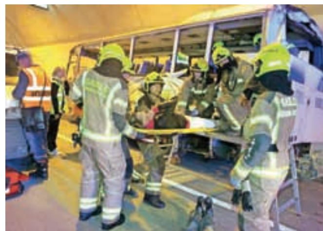
Za predorske in portalske gasilce so v Škofji Loki zaradi predora Sten usposobili 68 gasilcev.

Gorenjski gasilci so sicer v Sloveniji med najbolj izkušenimi za posredovanje v predorih, saj je tu pet najdaljših predorov v državi – dva železniška (Bohinjska Bistrica,