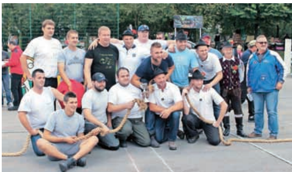
Fantje so bili premočni in vrv se je strgala. Zmagovalci so bili tako tokrat vsi.

V sklopu festivala veteranskih godb pa so se predstavile godbe iz Velenja, Ljutomer, Laškega, Žalca, veterani Štajerske, ljubljanski in tudi jubilarji – veterani Mengeške godbe. Festival je