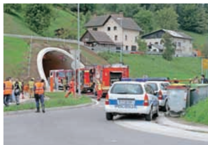
Predor Sten sodi med najsodobnejše predore pri nas in v okolici, zagotavljajo na direkciji za infrastrukturo.