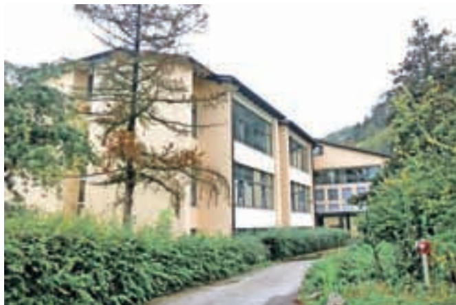
Po energetska sanaciji bo na Osnovni šoli Mengeš treba zagotoviti dodatne prostore.

OŠ Mengeš je sicer največja šola v Sloveniji glede na število otrok ene občine na šolo. Letos jo obiskuje 736 učencev, v nadaljevanju pa jih bo še več, zato občina čaka reševanje prostor-