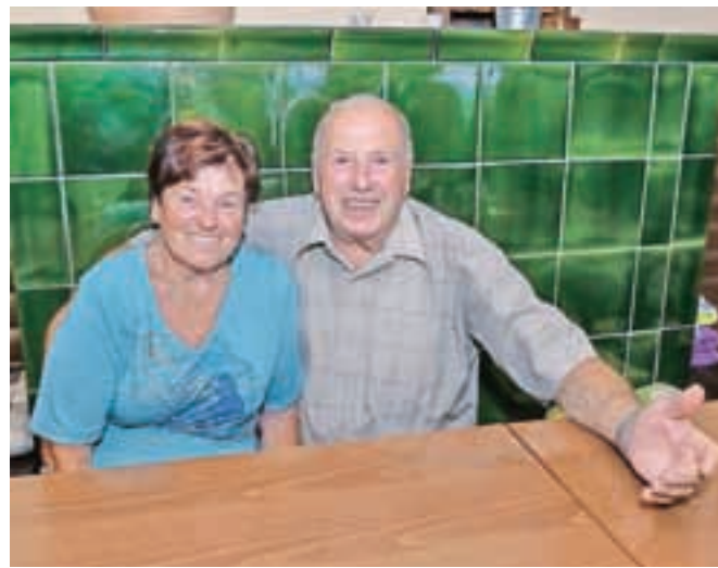
... in diamantna poročenca danes.

so obujali spomine, obenem pa se družabno povesečili. Vsa leta zakona ju je povezovala ljubezen in medsebojno spoštovanje, vrednoti, ki sta ju prenesla tudi na svoje potomce. Družina se jima je zato ob diamantni poroki iskreno zahvalila ter jima zaželela še mnogo sreče, zdravja in veselja: "Vrednote, ki sta jih prenesla na mlajši rod, so moralno in etično še več vredne kot vse materialne dobrine, ki sta jih razdajala in jih razdajata še danes. Za vse nas sta nenadomestljiva. Naj vama diamantno srce še dolgo bije!"