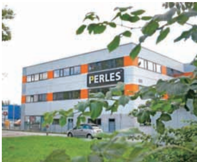
Podjetje Perles je končalo v stečaju.

bo ohranil oziroma povečal proizvodnjo v Kranju, zagotovil kontinuiteto delovnih mest in nadaljnji razvoj programa. Podjetje, ki je gradilo na ugledu znamke Perles z osemdesetletno tradicijo, se je v zadnjem obdobju osredotočilo na tržno nišo razvoja in izdelave električnih orodij za profesionalce. Pred stečajem je bilo v podjetju okrog štirideset zaposlenih. Lani so ustvarili skoraj tri milijone evrov prihodkov, za letos pa so načrtovali, da bodo prihodki od prodaje narasli na 4,5 milijona evrov. Proizvodnja v Perlesu zdaj že nekaj časa stoji, zaposleni pa so na čakanju.