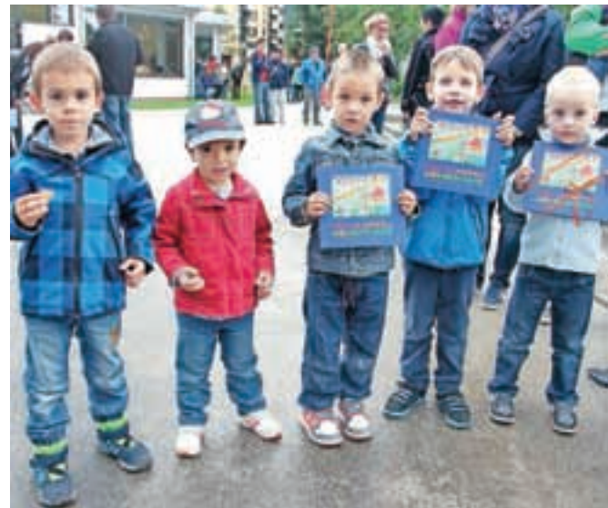
Nekaj mladih avtorjev ilustracij s knjigo Kako je nastalo naše mesto Tržič