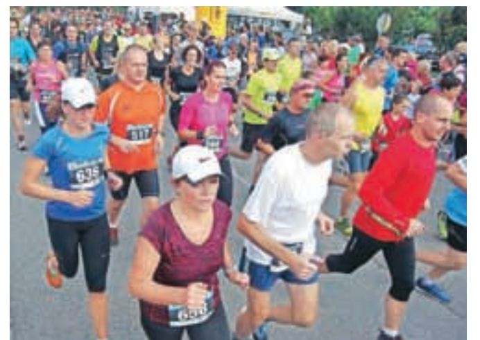
Na Medvoškem teku so tekli na 5, 10 in 20 kilometrov.