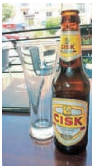
Priljubljeno domače pivo