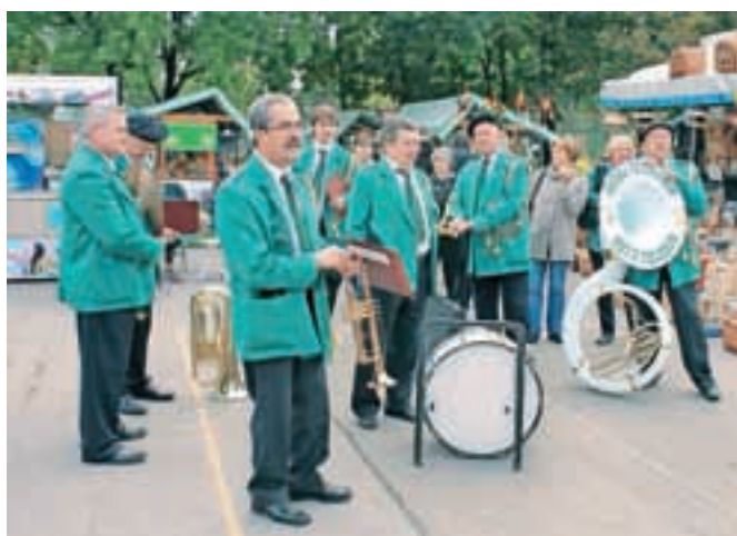
Festivala veteranskih godb so se udeležili tudi Velenjčani.

Sobota se je nadaljevala z nastopom folklornih skupin, pevcev in tamburašev, zvečer pa so za vzdušje skrbeli Slovenski muzikanti in Mladi Dolenjci. Nedeljski zaključek sejma pa so že pozno popoldne zaupali ansamblu Sicer, triu Šubic, Sejmarmjem in Kerlcem.