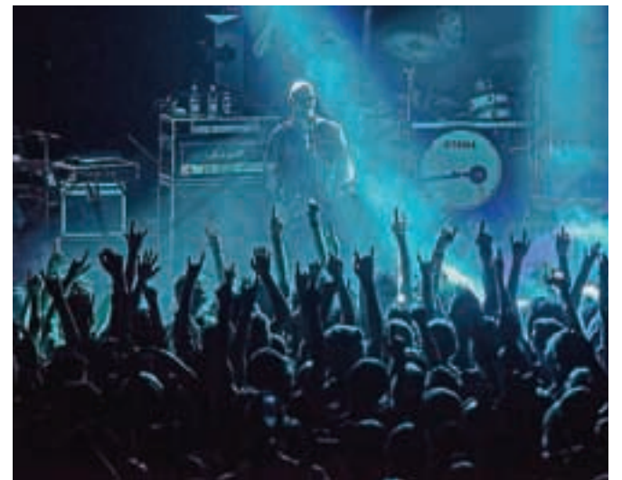
Ledena v modrem: Siddharta je ponovno napolnila kranjski Bazen. / Foto: Primož Pičulin

Vročje pa ni bilo le na Bazenu, temveč tudi v KluBaru, kjer je na Rockeria nastopila ženska rokowska zasedba Hellcats , ki –