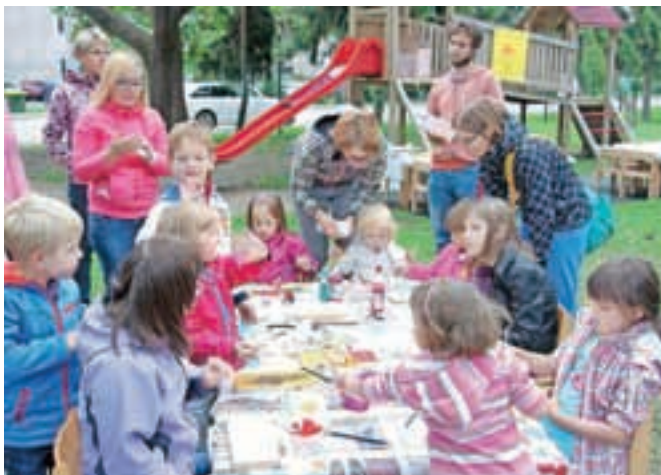
Ustvarjalnice so bile dobro obiskane.

Petkovega popoldneva pa še ni bilo konec, saj so v nadaljevanju pripravili ustvarjalnice na temo kulturne dediščine Tržiča. Otroci in njihovi starši, dedki in babice so lahko preizkusili, kako se naredi čevlji, lahko so izdelovali gregorčke, poslikali panjske končnice ali pa si izbrali lesni kotiček ali kotiček z glino.