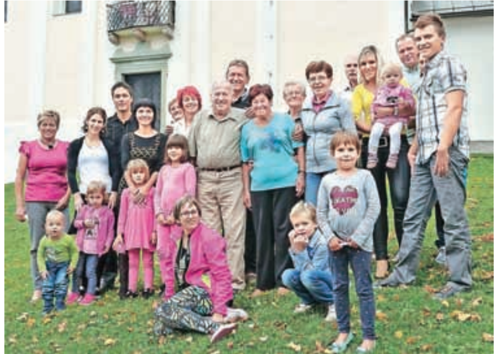
Ob častiljivem jubileju se je številna družina zbrala na Joštu.

Zelo sta navezana na družinske člane, tako še danes z ljubeznijo vzgajata pravnukinje in pravnuke, skupaj praznujejo osebne praznike, čas pa preživljata tudi na sprehodih v naravi, z nabiranjem gob, predvsem pa na domačem vrtu, ki jima prinaša veliko miru in veselja. V družinskem krogu so tudi praznovali njun visok jubilej skupnega življenja, in sicer doma ter tudi na Joštu, kjer