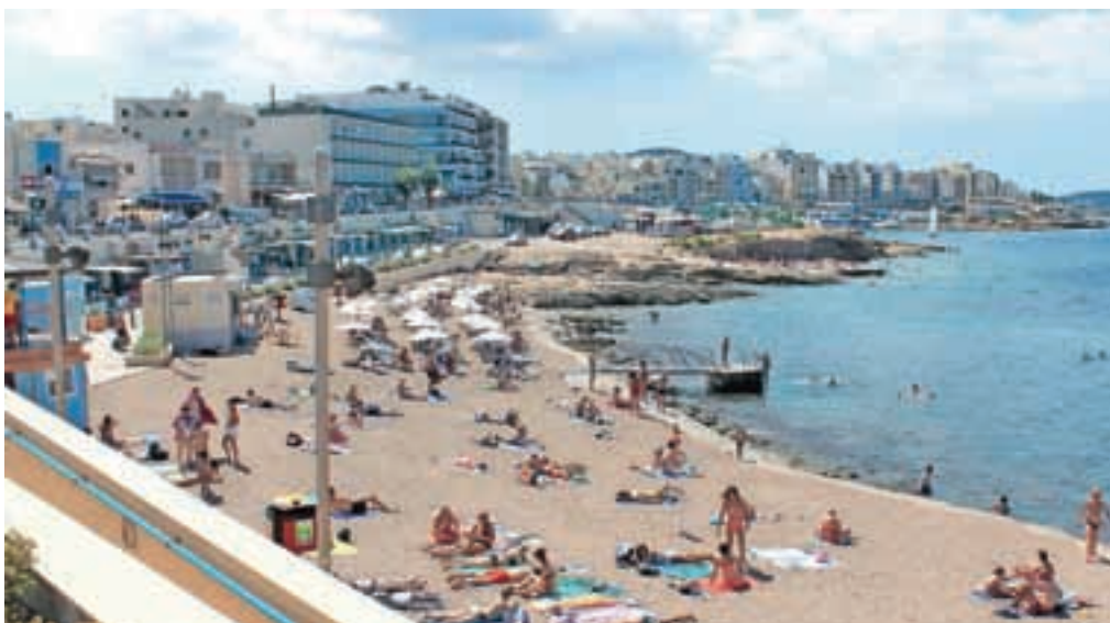
Bugibba / Foto: A.B.

seveda lokale z dobro kavo, domačim pivom in kakšnim koktajlom, ki se je ob vročini še kako prilegel. Temperature na Malti so se namreč sredi septembra gibale med 32 in 36 stopinj Celzija. (Nadaljevanje prihodnjič)