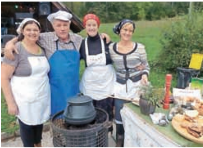
Najboljši Firštov golaž je na prvem tekmovanju skuhal ekipa Rokovnjači iz Kamniške Bistrice.

Dogajanje se je začelo v petek s tržnico znanja in petkovim večerom v raperskih ritmih s Klemnom Klemnom, La bagro in prijatelji ter nastopom akrobatske skupine Dunkin devils. Vrhunec FeSteelvala je bil v soboto s tržnico piva in družtev, večer pa so začinili še ajdovski zvezdniki Elvis Jackson. Zaključek FeSteelvala pa je bil zanimiv za ljubitelje Andreja Šifrerja, saj se je po 25 letih vrnil na Jesenice. Organizatorji so bili izredno razočarani nad udeležbo na dogodkih, zato niso prepričani, kakšna prihodnost čaka edini jeseniški glasbeni festival.