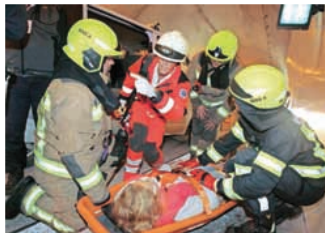
Usklajeno delovanje gasilcev, reševalcev nujne medicinske pomoči in drugih enot je v množičnih nesrečah ključnega pomena.