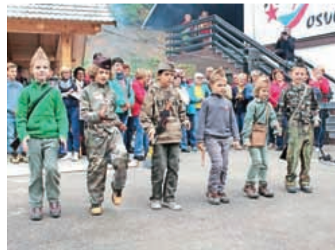
Fantje iz Osnovne šole Naklo med korakanjem

poudaril pomembnost boja za vrednote NOB, ob opisovanju spominov na vojno pa je naštel visoke številke ljudi, ki so umrli, bili talci, so se morali izseliti ali pa so bili naseljeni v taborišča. Vojna je pri nas tako prizadela več kot 130.000 ljudi. Poudaril pa je tudi, da Slovenci letos ne praznujemo le 70. obletnice osvoboditve, pač pa se spominjamo tudi 500-letnice kmečkih uporov, ki so dokaz, da smo se