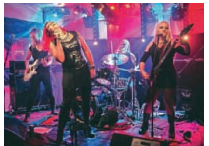
Vročekrvna ženska rokowska energija: Hellcats so navdušile občinstvo v KluBaru.