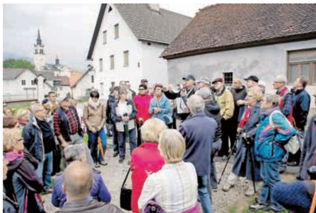
Udeleženci sprehoda skozi Staro Loko so spoznavali kulturno dediščino svojega kraja.