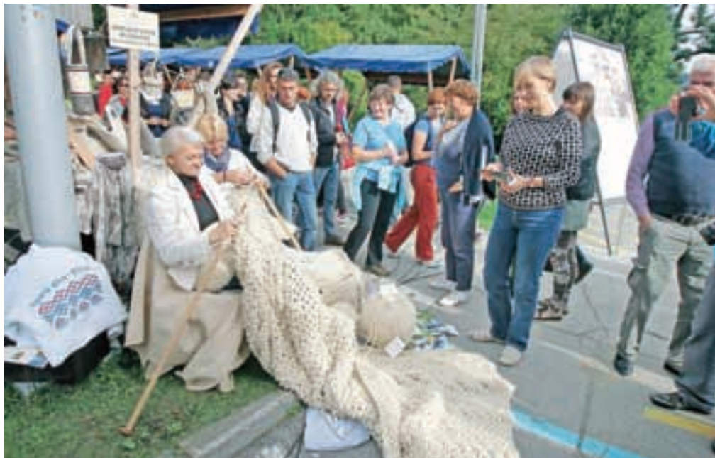
Festival ročnih del je na Bled privabil množico ustvarjalcev in obiskovalcev. / Tina Dokl

In če se je včasih zdelo, da se z ročnimi deli ukvarjajo