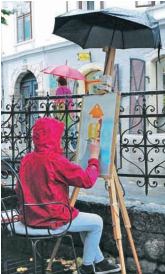
Dežnik je bil ob kislem vremenu v petek nepogrešljiv del opreme vsakega mladega ustvarjalca.