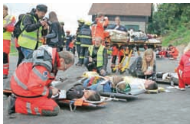
Triaža oziroma prva zdravniška oskrba ponesrečencev je potekala na portalu pred vhodom v predor Sten.