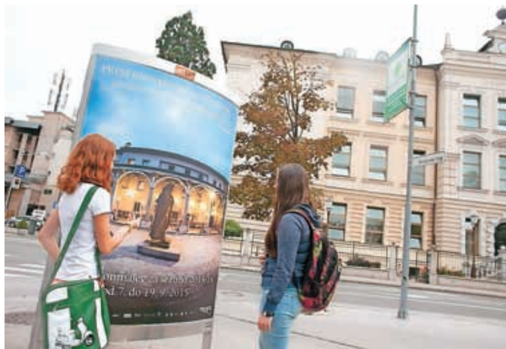
Zadnje tri sezone v Prešernovem gledališču z abonmajem Špica posebno pozornost posvečajo mladim.