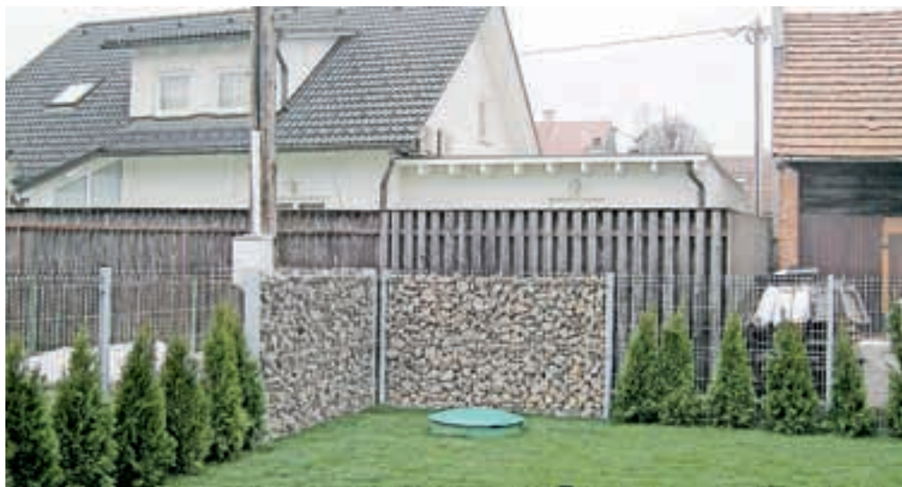
Ograje so lahko tudi zelo izvirne.

kamnita ograja je lahko sestavljena iz širšega stebra (12 cm), na katerega z obeh strani pritrdimo panela, vmes pa napolnimo kamene. Takšna vrtna ograja je cenovno sprejemljiva, pogosto jo kombiniramo z navadnimi paneli. Ograja deluje zelo razgibano, zanimivo, z različnimi barvami kamene pa tudi zelo unikatno. Gabioni ali kamnite košare so širše ograje, široke so lahko 20, 40 ali 60 cm. Širše kamnite ograje lahko pod posebnimi pogoji nadomeščajo škarpo, v kombinaciji