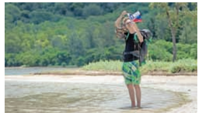
Ponosni na Slovenijo