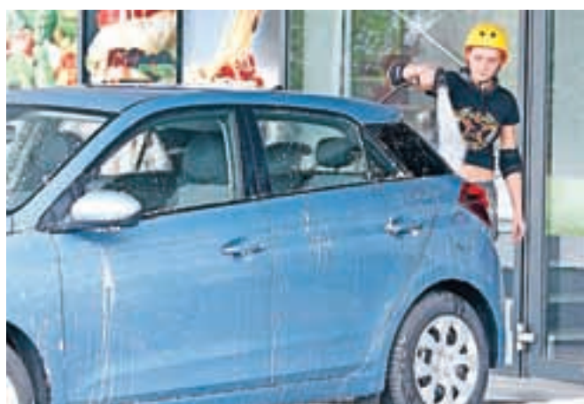
... pranje avtomobila potekalo nemoteno in ravno v času, ko ni deževalo.