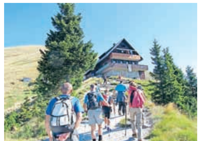
Spomin na Slavka Avsenika in njegovo polko Na Golici bi jeseniški planinci počastili v Koči na Golici.