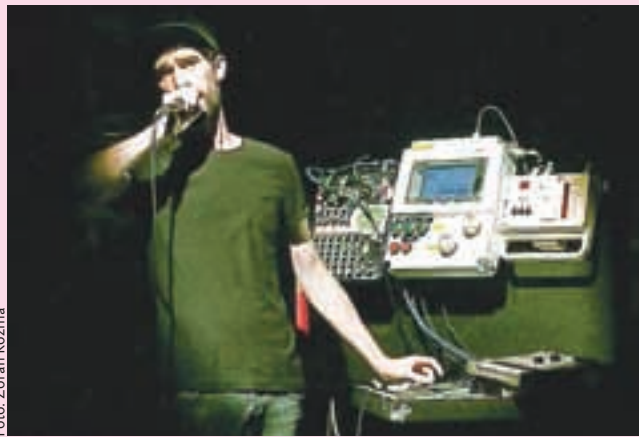
»N toko ne obstaja ...« – razen na odru Stolpa Škrlovec

Kranj – Layerjeva hiša in Društvo Moonlee Kreatura predstavljata novo sezono t. i. dvociklaških koncertov. Pod budnim ušesom in taktirko izkušenih glasbenih producentov bodo glasbeniki v Stolpu Škrlovec premetavali, eksperimentalni,