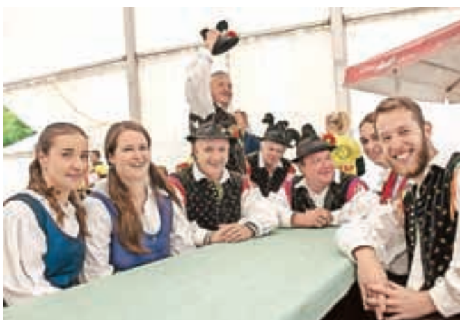
Razpoloženi člani gorjanske godbe