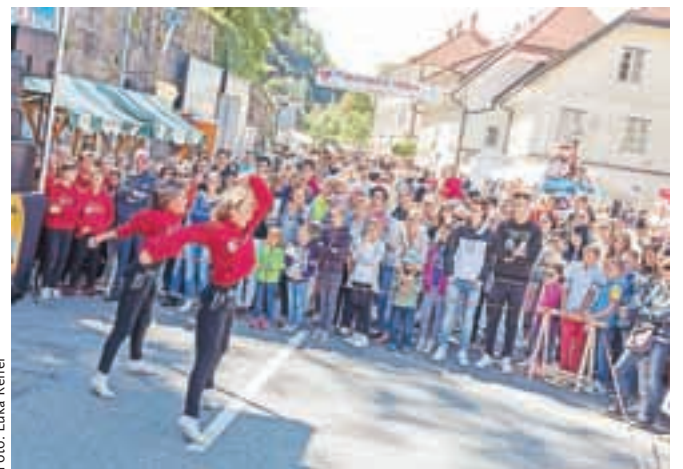
Bogat spremljevalni program na Šušarski nedelji

»Šušarska nedelja je in ostaja eden od naših praznikov. Če se nek dogodek zgodovinsko ponovi in obstane 48 let, potem je to prava zgodba, ki pa mora iti v korak in v duhu s časom. Šušarije je v Trziču še vedno veliko, številni podjetniki in obrtniki še vedno dobro in kvalitetno delajo, želimo si, da se najdejo ustrezne rešitve tudi za