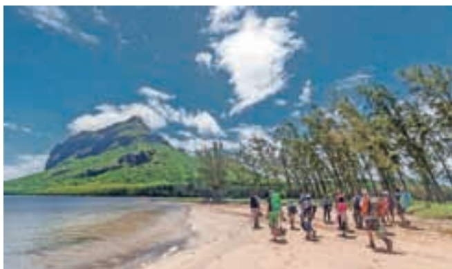
Hoja po peščeni obali je predstavljala najlepši del poti.