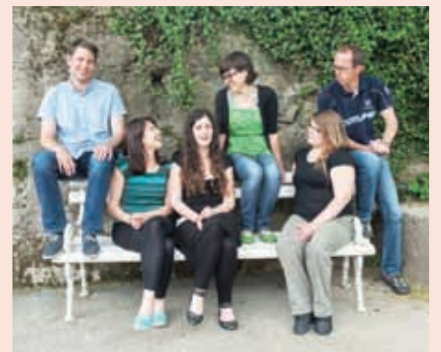
Ekipa Grozda