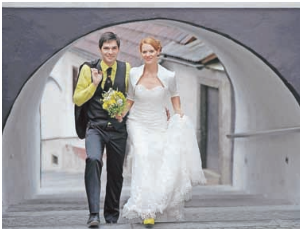
Mladoporočenca sta doma v tisočletni Škofji Loki, po kateri sta se sprehodila tudi na poročni dan.

Slovenski express seveda trajala, dokler se v nedeljo ni začelo daniti, mladoporočenca pa sedaj načrtujeta še poročno potovanje.