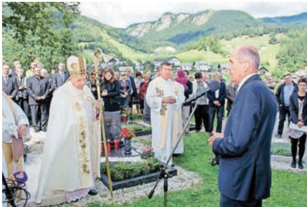
Po blagoslovu spominske plošče, ki ga je opravil kardinal Franc Rode, je zbrane nagovoril tudi predsednik SDS Janez Janša.