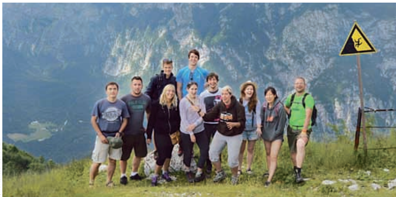
Udeleženci mednarodnega prostovoljskega tabora v Bohinju

»Na taboru sem neizmerno uživala, saj nisem pričakovala tako dobre razporeditve dela in prostega časa. Pravzaprav me je presenetilo, kako lepo so poskrbeli za prostovoljce tudi v prostem času in nam organizirali fantastično doživetje Bohinja in okolice. Z delom sem zadovoljna, saj sem kot novinarka dobila priložnost delati v medijskem timu in ne samo sodelovati pri tehnični pripravi prvenstva. Ob prihodu na tabor smo imeli delavnice, ki so pripomogle, da smo se hitro počutili kot ekipa in razvili prijateljstva. Šest prostovoljcev je po koncu tabora celo prišlo k meni na obisk v Ljubljano!«