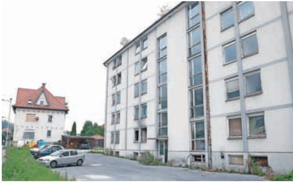
Propadajoči samski dom je nezavarovan, poln razbitin, smeti, odvrženih igel ...

Resnosti problema se zavedajo tudi v svetu Krajevne skupnosti Stražišče, je povedal njegov predsednik