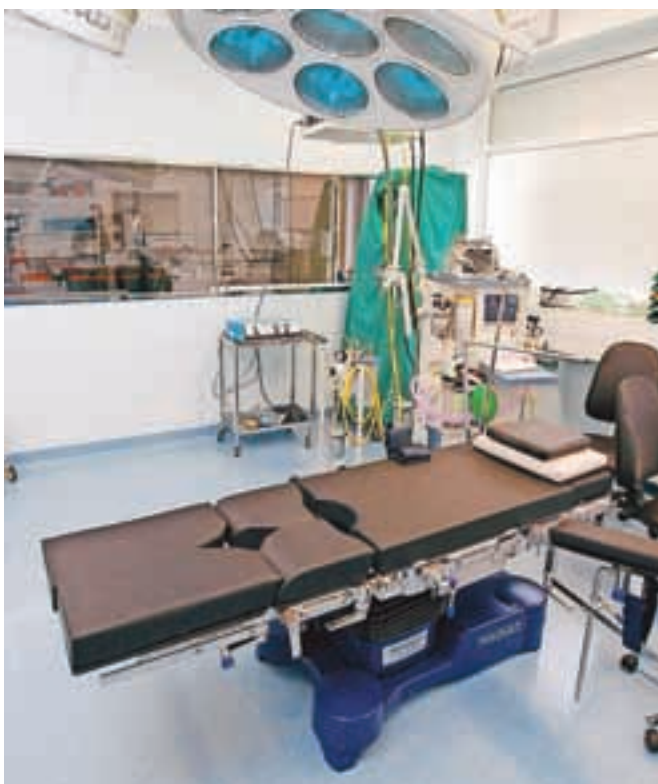
Kdo bo od konca meseca naprej skrbel za čiščenje bolnišnice, še ne vedo.

Ob tem pa so bolnišnico že lani obiskali kriminalisti, ki so ugotovili, da naj bi tedanje vodstvo leta 2010 priredilo javni razpis, da bi favoriziranemu storitvenemu podjetju pridobili protipravno korist. Šlo naj bi prav za podjetje ISS, ki naj bi po ugotovitvah kriminalistov bolnišnici zaračunavalo tudi neizvedene storitve, s čimer je bil zavod oškodovan za približno 1,4 milijona evrov. Med ovadenimi so takratni vodilni