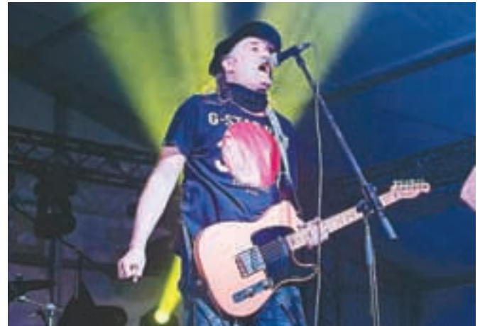
Goodbye, Teens! – Nastop skupine Plavi orkestar je bil vrhunec letošnje Škofjeloške noči.

in lokalni mladeniči, ki slišijo na ime Attic Mist. Kombinacija prekaljenih glasbenih mačkov in zagrizenih novincev, ki si še utirajo pot na glasbeno sceno, je bila zagotovilo za pester glasbeni program, obogaten tudi s kulinaricnimi dobrotami. Mnogi so v prešernem razpoloženju