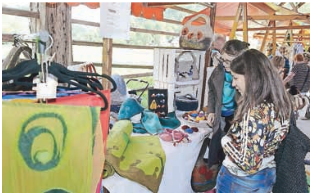
Visoko je bilo minulo nedeljo v znamenju volne.

Rokodelci, ki ustvarjajo z volno, so se predstavili na 35 stojnicah. Obiskovalci so lahko opazovali mojstrice rokodelke pri delu in kupili unikatne volnene izdelke. Prikazali so česanje in predenje volne na kolovrat, barvanje volne z rastlinskimi barvami, kvačkanje, pletenje in tkanje na statve in druge tkalske pripomočke ter mokro in suho polstenje. Zaživela je kavarna Štrikeraj, v kateri si je bilo mogoče ob kvačkanju, pletenju in vezenju na družaben,