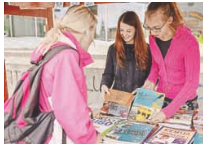
Zanimanja za rabljene knjige ni bilo veliko, vseeno so se redki ustavili in pogledali ponudbo.

ustavili in si ogledali knjige, za nakup pa se potem niso odločili. Vidno razočarani so bili tudi organizatorji, ki se jim zdi nenavadno, da ljudje ne pokažejo zanimanja za povsem ohranjene učbenike, ki so na sejmju naprodaj po znatno nižjih cenah, kot jih lahko kupijo sicer. Eden izmed pomislekov, zakaj je bil tako slab odziv, je bil v tem, da se šolske knjige pošolah naročajo ob koncu šolskega leta in ne ob začetku, zato bi bilo smiselno, da bi sejem prestavili na junij. Cene za knjige so zelo nizke; denimo učbenik, ki v redni prodaji v knjigarni stane dvajset evrov, je bil na sejmju na voljo za pet evrov; je enak, vendar rabljen, a vsekaror dobro ohranjen in priročen za ponovno uporabo.