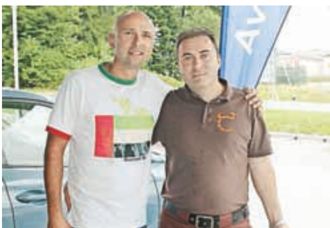
Sebastjan Guček je skrbel za vezni tekst, Edin Halačević pa, da je v nadaljevanju ...