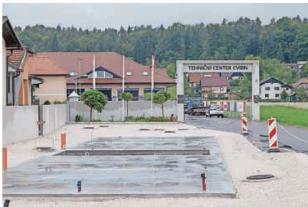
Temelji za avtopralnico v Podgorju so že pripravljeni, in čeprav gradnji nekateri sosede odločno nasprotujejo, v podjetju CI & CA pravijo, da bodo naložbo dokončali.

povpraševanje strank pa je veliko. »Ker smo ekološko ozaveščeno podjetje, bo tudi ročna avtopralnica zgrajena in bo delovala v skladu z najnovejšimi ekološkimi standardi. Pridobitev gradbenega dovoljenja je v sklepnih fazi, saj smo vlogo na zahtevo upravne enote že dopolnili z 42 točkami. Gradbeno dovoljenje zato pričakujemo v najkrajšem času, nato pa bomo pristopili k dokončni izgradnji. Doslej so bila opravljena zgolj pripravljala dela. Ročna avtopralnica bo postavljena na zazidljivi parceli, ki je v naši lasti, in v skladu z določili gradbenega dovoljenja ter vsemi drugimi veljavni zakoni in pravili,« odgovarjajo na očitke, da delujejo mimo pravil, poudarjajo pa tudi, da gradnja ne bo poslabšala kakovosti življenja sosedov. »Če bi delovanje ročne avtopralnice pomenilo poslabšanje življenjskega okolja, bi ji zagotovo nasprotovali tudi drugi sosede. Kot potrditev kakovosti sosedskega življenja, smo pred leti na lastne stroške uredili občinsko cesto ter naredili asfaltno oblogo. Očitke, ki jih navaja