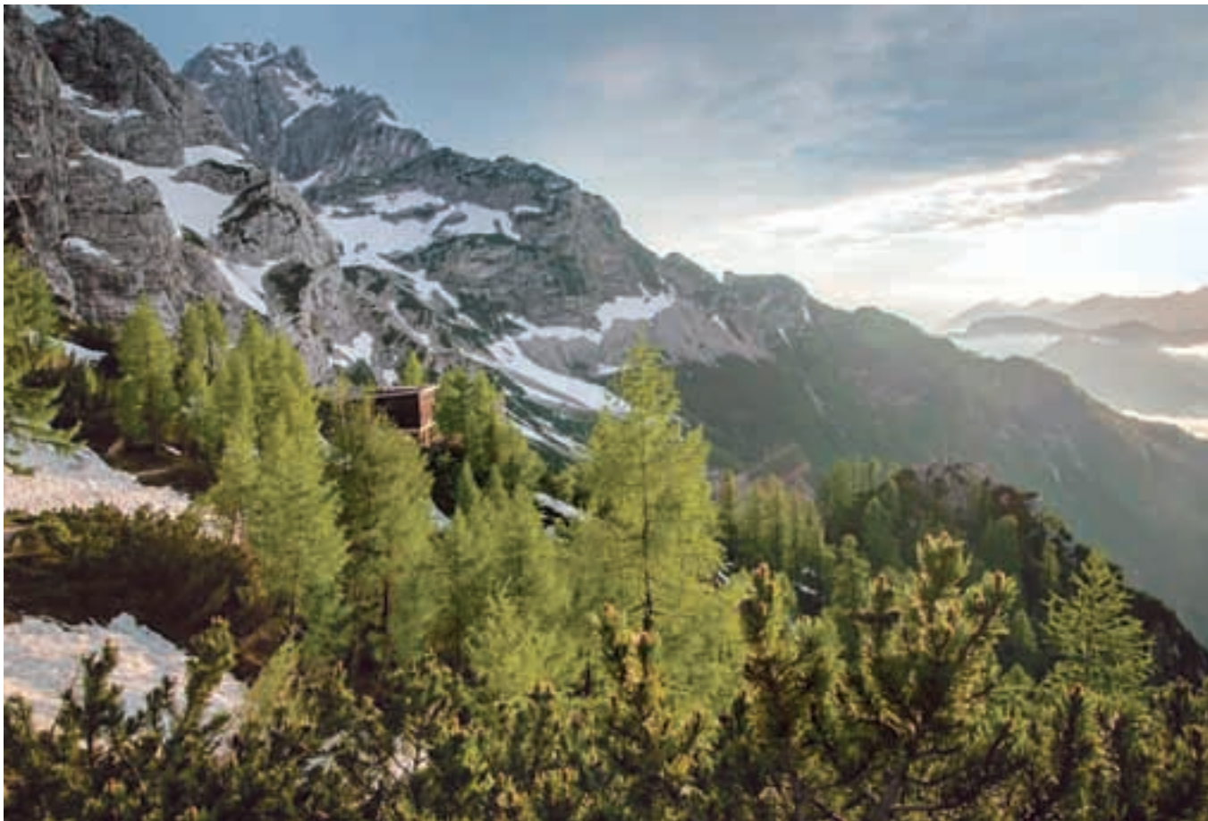
Koča na Ledinah

Če ste predstavnik/-ca podjetja in bi želeli, da skupaj organiziramo družbeno odgovoren teambuilding , ali če ste društvo in menite, da lahko skupaj oblikujemo ponudbo za teambuilding za podjetja , nas kontaktirajte na info@grozd.si .