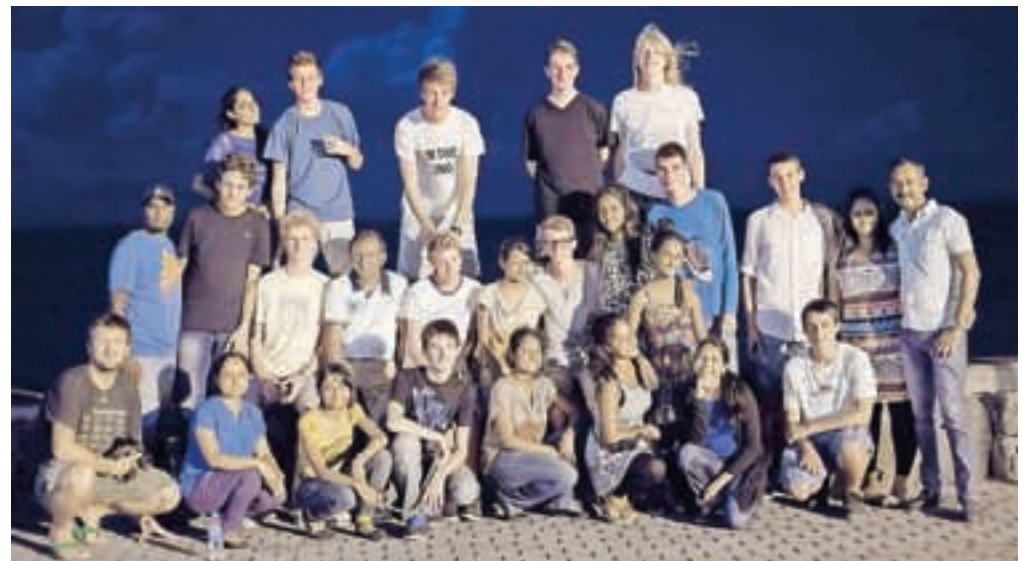
Skupaj z dekleti na zadnji večer pred odhodom domov

D an pred odhodom v Slovenijo smo imeli še zadnje snidenje z dekleti in drugimi udeleženci. Za pogostitev smo jim skuhalih nekaj slovenskega, in sicer žgance s piščančjo obaro. Proti koncu večera pa smo si ogledali še slike z odprave in sklenili misli ter se poslovili od svojih mauricijskih prijateljev in prijateljcev. Kar smo mogoče malo obžalovali, je to, da si nismo ogledali glavnega mesta Port Louis, kar pa na koncu ni igralo velike vloge, saj smo videli veliko različnih mest in krajev. Mauritius in ljudje mi bodo za vedno ostali v spominu, ker je bila to zame edinstvena izkušnja. Spoznal sem