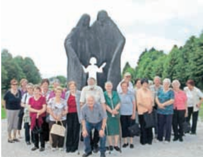
Izletniki na Brezjah