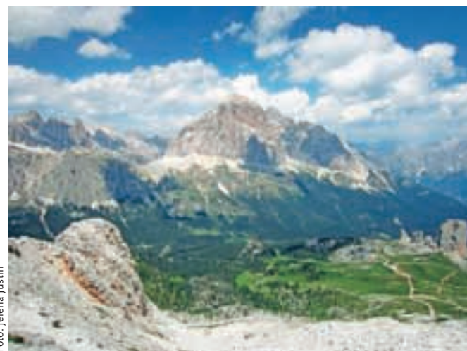
Razgled z vrha na Tofano di Roses in pet stolpov