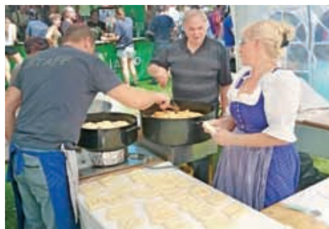
Flancati so zadnja leta reden sladki spremljevalec dogajanj na prostem s tradicionalno noto.