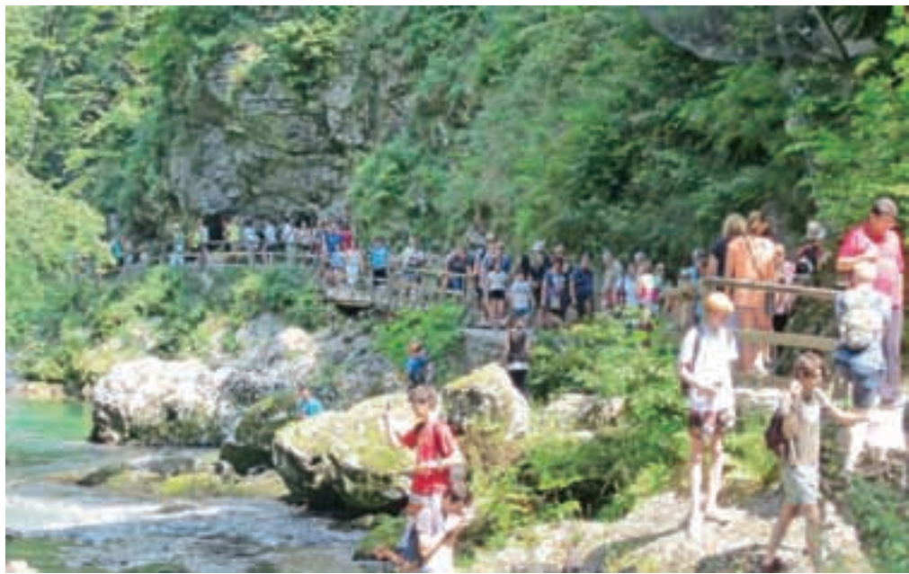
Soteska vsako leto privabi veliko turistov.

Od gostov dobivajo veliko pohval, nekaj pa tudi pritožb. Obiskovalci radi pohvalijo urejenost soteske, pritožbe pa so večinoma glede dostopnosti in stanja cest, ki vodijo do Vintgarja.