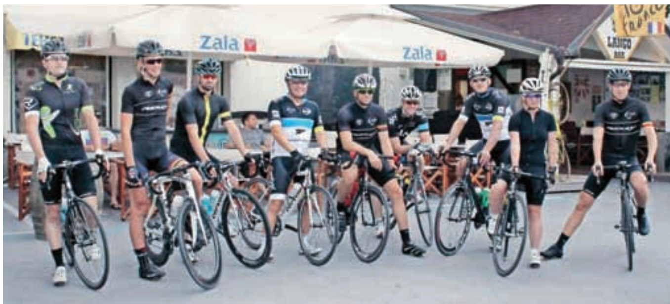
Skupina zagnanih ljubiteljev kolesarjenja se je odločila, da brez prave kolesarske ture sobotni kolesarski dan v Šenčurju ne bi imel prave vrednosti. Pa so se pred večerno zabavo podali na Jezersko. Seveda je privlačila tudi rumena majica.