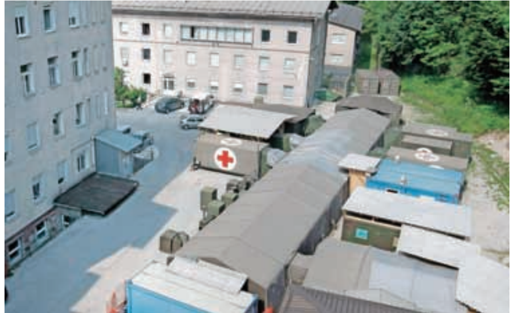
Urgenca bo do odprtja novega urgentnega centra delovala v vojaški bolnišnici Role LM2. Gre za nacionalni projekt uporabe vojaške bolnišnice v civilne namene.

Svet bolnišnice Jesenice se je seznanil tudi s potekom velikih investicij, ki jih financira ministrstvo za zdravje oziroma Evropska