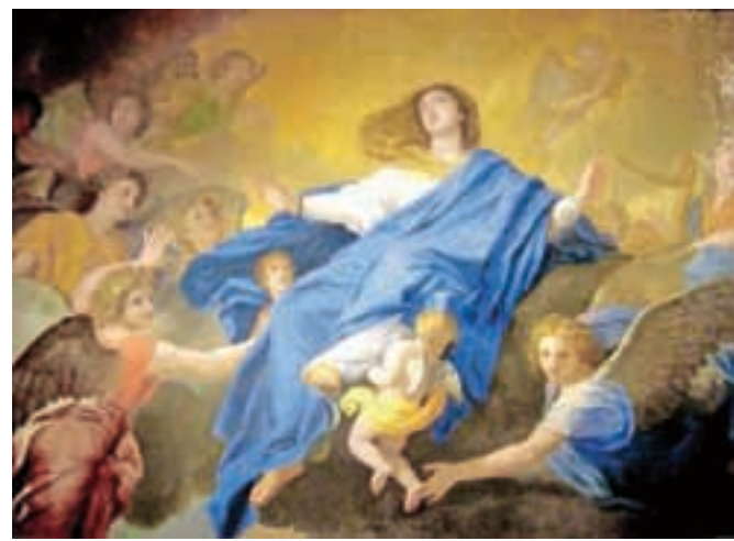
Ena od mnogih upodobitev Marijinega vnebovzetja: Charles Le Brun, 1835 / Foto: Wikipedija

»Ta država je trenutno zadolžena za 19 bilijonov dolarjev. Potrebuje neko- ga, kot sem jaz, da uredi ta nered.« Tako samozavesten je bogataš Donald Trump, eden od kandidatov za repu- blikansko predsedniško nominacijo. Njegova aktual- na žena je slovenskega rodu: Melanija Trump (roj. Knavs, v Sevnici, 1970). Lahko pos- tane prva dama ZDA?