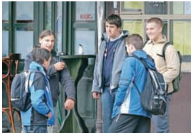
V sredo, 12. avgusta, smo praznovali mednarodni dan mladih.