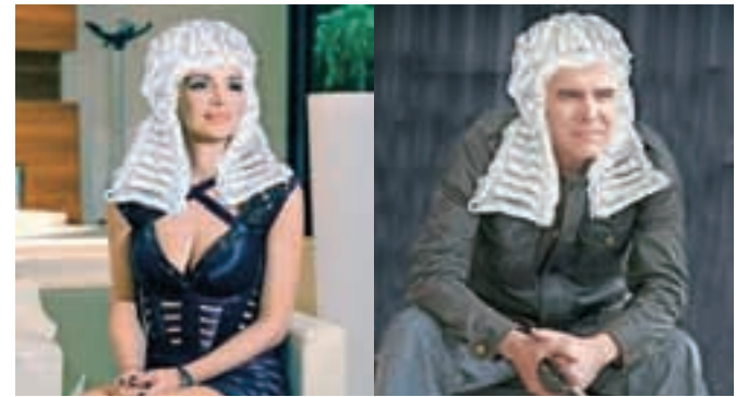
Severino in Zorana Predina smo včeraj že srečali pri pomerjanju sodniških lasulj.

Ko smo vprašali Slovence, koga bi oni želeli za arbitra, so ti v 80 odstotkih izbrali pevko Severino Vučković. Če so Hrvati izbrali Slovenca, bomo pa mi Hrvatice, so prepričani. S tem se bomo izognili pomislekom o pristranskosti. Vemo, da ima Seva rada Slovence, ker jo pogosto vabimo na koncerte, ona je djevojka sa sela, torej bo razumela tudi nas