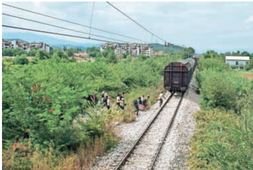
Pot od grške meje do postaje Gevgelija v Makedoniji je dolga približno dva kilometra. Begunci sledijo železniškim tirim, dokler ne pridejo dehidrirani do postaje.