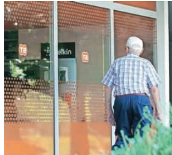
Družba T-2 je lani ustvarila 58,5 milijona evrov prihodkov, ob tem pa je dosegla tudi pozitivni finančni rezultat.

septembra lani tudi uvedlo, a je višje sodišče razveljavilo sklep in zadevo vrnilo v ponovni postopek. V ponovljenem postopku je okrožno sodišče zavrnilo predlog za uvedbo stečaja, višje sodišče pa je ugodilo pritožbi upnic Družbe za upravljanje terjatev bank (DUTB), TCK Družbe za upravljanje in Banke Celje in začelo stečajni postopek. Višje sodišče je pri tem ugotovljalo, da je namen prisilne poravnave z različnimi ukrepi zagotoviti, da bo dolžnik postal kratkoročno in dolgoročno plačilno sposoben in da bo lahko poravnal vse zapadle obveznosti. V konkretnem primeru se to ni zgodilo. Sodišče je ugotovilo, da