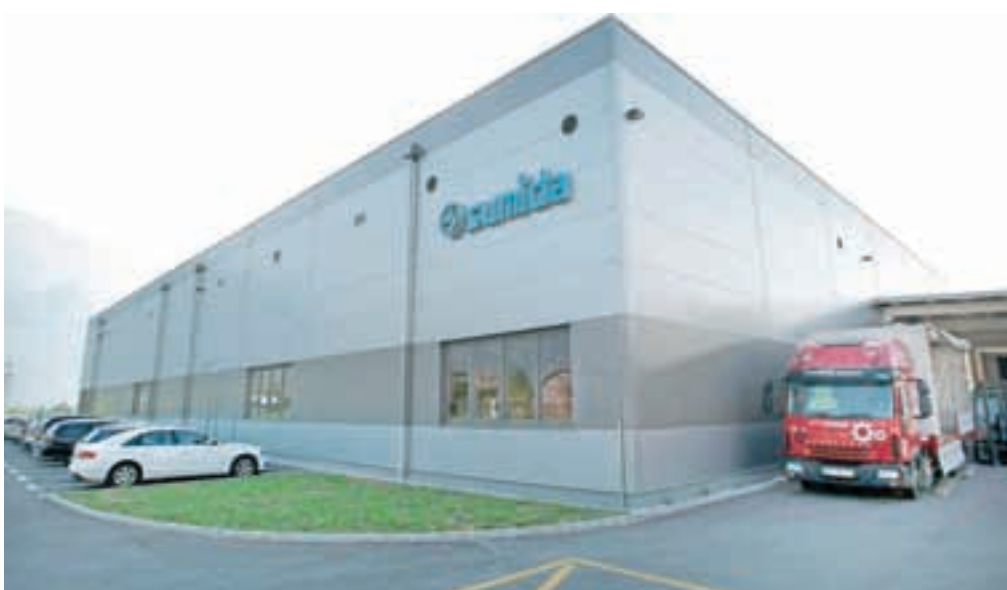
Novi poslovno-proizvodni objekt na Blejski Dobravi

japonskega koncerna Sumida, ki je kupil njihovo matersko družbo Vogt iz Nemčije. Kupci njihovih izdelkov so vsi pomembnejši proizvajalci avtomobilov z vsega sveta. Kot je dejal direktor Ločniškar, so si novi objekt na Blejski Dobravi ogledali tako predstavniki nemške materske družbe kot predstavniki koncerna iz Japonske in oboji so bili zelo zadovoljni s tem, kako so prostori videti, kako so urejeni ter kako poteka proizvodnja.