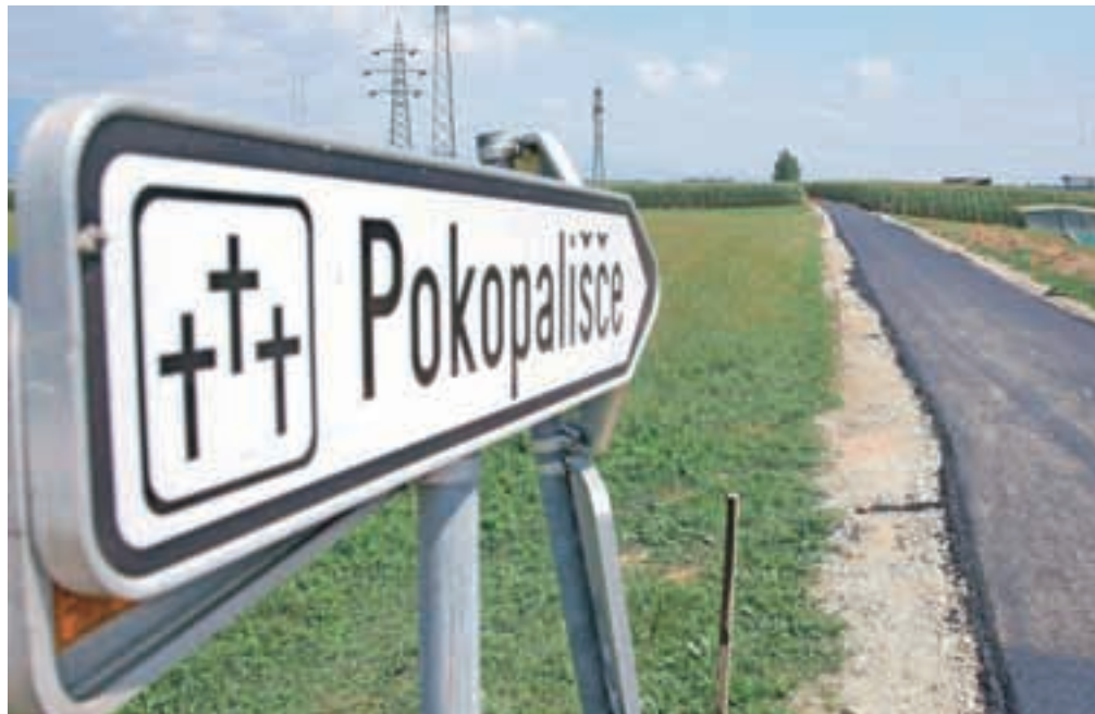
Ta teden so položili asfalt in cesta do pokopališča je spet odprta.

Kot tudi pojasnjujejo na Občini, se je hkrati z