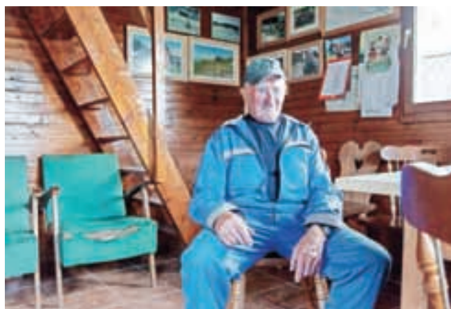
Pastir, ki mu pravijo Stričko, na Menini planini pase že petnajst let.