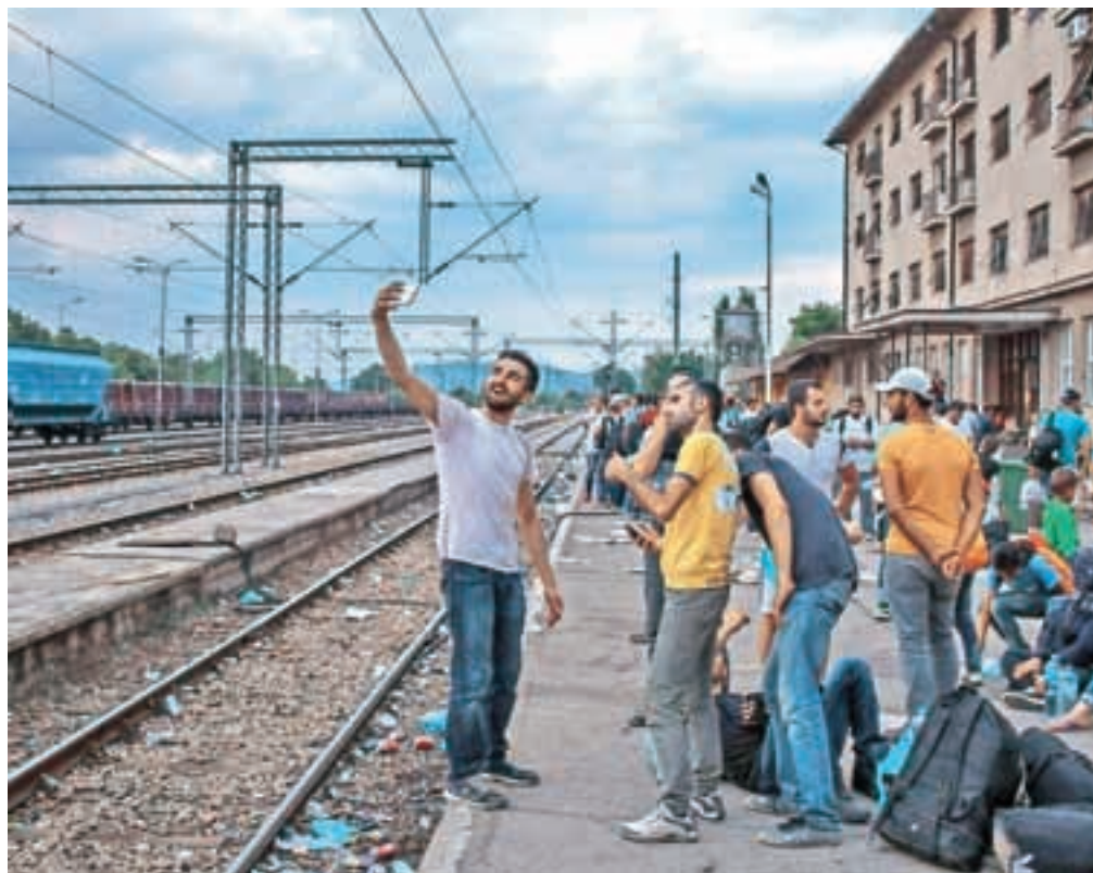
Manjša skupina beguncev se fotografira ob prihodu na postajo Gevgelije, saj je tisti najtežji in najnevarnejši del poti za njimi. S svojimi družinami migranti komunicirajo prek brezžične povezave na telefonu.

da so begunci namenjeni v iluzorično svobodo namesto v koncentracijsko taborišče. Roke in noge visijo ven skozi okna vagonov, sprejemajo nahrbtnike prijateljev, ki jim zunaj vagona podajajo prtljago, nekateri izmed beguncev v vagon vstopijo kar skozi okno. Vse, da le ne bi ostali na postaji Gevgelija. Tisti, ki se jim ne uspe vkrcati v zadnji vagon v dnevu, si na betonska tla pogrnejo spalne vreče ali kartonaste škatle, na katerih prenočijo. Ponoči se iz mobilnih telefonov sliši posnetke kurdskih pesmi ali pogovorov z družinami beguncev. Zjutraj jih zbudi nova skupina beguncev s pozdravom »Asalamu alejkum«, s katerimi si bodo delili pot do Madžarske, še preden ta do konca zgradi železno ograjo, ki spominja na propadlo lekcijo samorefleksije evropske politike.