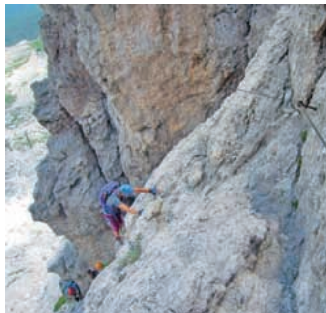
Začetek zavarovane poti na Averau

Nadmorska višina: 2649 m Višinska razlika: 545 m Trajanje: 5 ur Zahtevnost: ★★★★★