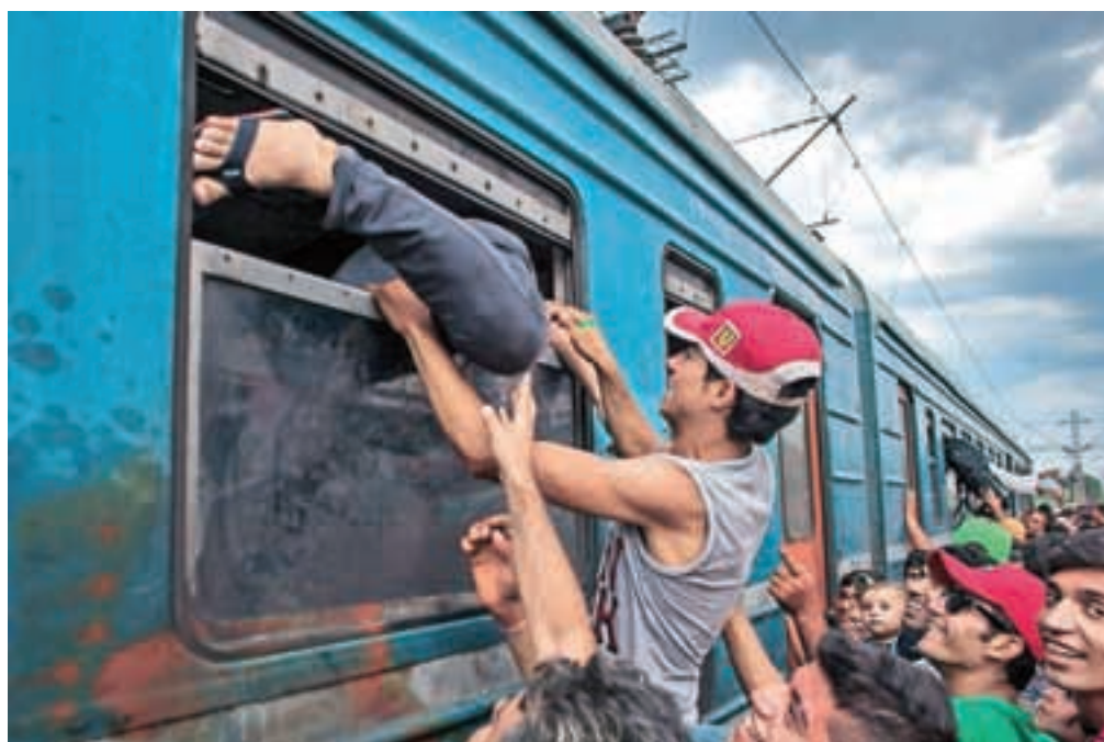
Kaotičen stampedo se začne, ko se odprejo vrata vagona. V obupu nekateri begunci v vagon splezajo skozi okno, a za to tvegajo udarce policijskih gumijevk.