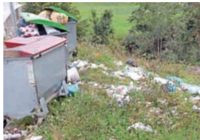
Krajani so obupani pošiljali slike o stanju na ekološkem otoku, dokler ga ni prejšnji teden Loška komunala dokončno pospravila in ukinila.

je bila mreža, v katero bi imetniki odpadkov po navodilih morali odlagati samo odpadke v tipiziranih vrečah na dan rednega odvoza zjutraj ali največ en dan pred odvozom. Nekateri se niso držali reda in so vreče pripeljali kadarkoli, ne glede na dan odvoza. Poleg tega se je začelo pojavljati vedno več odpadkov v razsutem stanju, kosovnih odpadkov in različnih vrečk. Odpadkov je bilo večkrat toliko, da so bili odloženi tudi izven mreže. Nazadnje so bile tipizirane vreče z oznako izvajalca javne službe že bolj izjemna kot pravilo. Ker imajo odpadki pogosto vonj po mesu, so se živali navadile, da so vreče raztrgale, odpadke pa raznosile po okolici. Domačini so ugotovili, da večje količine odpadkov na to mesto redno odlaga tudi eden od sokrajčanov, ki ima gostinsko dejavnost. To smo sporočili na občino, ki je pristojna za nadzor in ukrepanje, vendar ga komunalnemu redarju ni uspelo zalotiti pri dejavnosti. Dejstvo je, da komunalni redar v Škofji Loki po veljavnih predpisih nima pristojnosti s tega področja, glede komunalnega inšpektorja v občini, ki pa je bil pristojen za izvajanje teh ukrepov, pa so dejstva znana. Skratka, stvar je postala nezdružna in lastnik zemljišča je zahteval odstranitev mreže oziroma ukinitve skupnega zbirnega mesta na tej lokaciji, zato smo vse pospravili,« pravi Janez Štalec in dodaja, da relacija rednega odvoza odpadkov poteka naprej