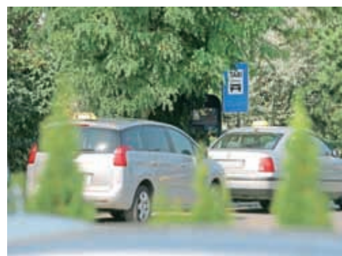
Finančna uprava od lanskega aprila dalje poostreno nadzira taksiste.

uprave so zaradi številnih kršitev zakonodaje julija letos prepovedali opravljati dejavnost, pri tem pa so mu do odprave nepravilnosti zapečatili in zasegli dve vozili skupaj z dokumentacijo in opremo (taksimetri). Poostren nadzor in kaznovanje kršiteljev sta očitno vplivala tudi na druge taksiste. Povečalo se je prostovoljno plačevanje dav-