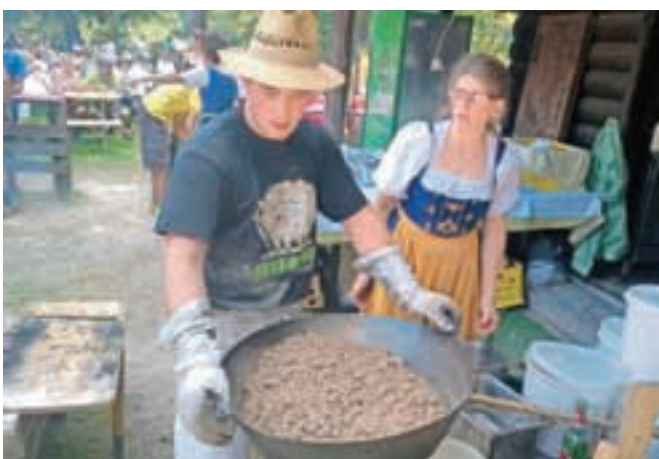
Ajdovi žganci s kislim zeljem ali kislim mlekom ... Na Jezerškem so šli zelo v slast starim in mladim.