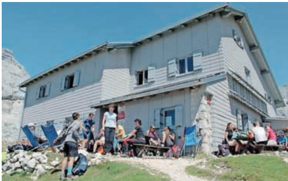
Pogačnikov dom na Kriških podih se lahko pohvali z nadpovprečno sezono.

Po trenutni oceni je letošnja poletna sezona v planinskih kočah od zdaj približno enaka oziroma malenkost boljša glede na povprečje zadnjih petih let, saj oskrbniki poročajo o malo večjem obisku in višjem skupnem prometu. »Veseli smo, da je letošnja sezona veliko boljše od lanske oziroma primerljiva s petletnim povprečjem. To je dobra spodbuda oskrbnikom in društvom pri nadaljnjem vzdrževanju koč in obnovah, da bodo uspeli tudi iz sezone pridobiti nekaj sredstev za gradnjo čistilnih naprav,« poudarja načelnik Gospodarske komisije PZS Janko Rabič in dodaja, da komisija neposrednega vpliva na delovanje koč nima, spodbujajo pa