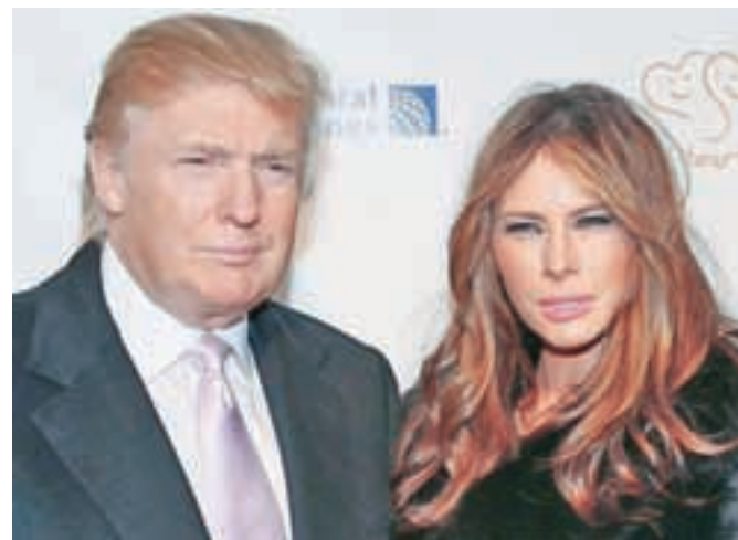
Donald in Melanija Trump imata za zdaj še vse možnosti, da postaneta predsedniški par ZDA.