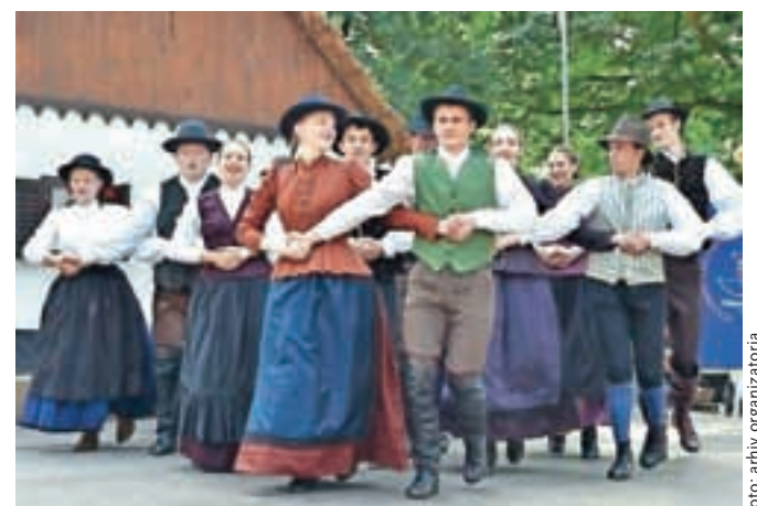
V Beltincih so nastopili tudi člani FS Ozara Kranj.