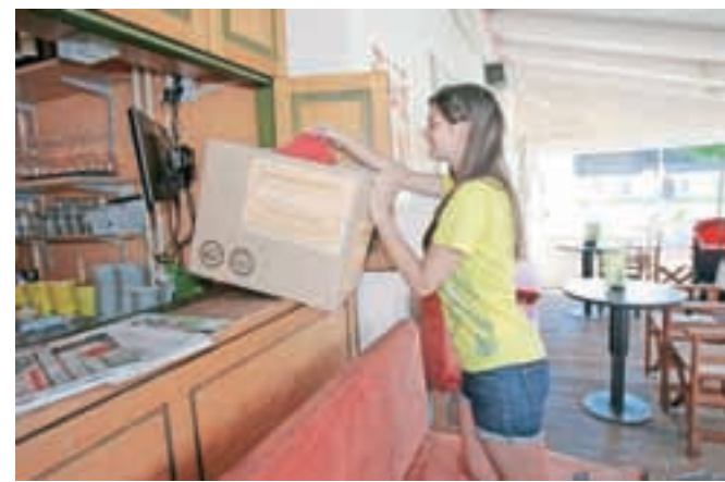
Šolske potrebščine zbirajo tudi v Lango baru.

Zvezke, mape, peresnice, pisala, barvice, škarje lahko oddate v trgovinah v Voklem, Vogljah, Srednji vasi, Šenčurju in v kranjski Qlandii ter v Antik baru, Lango baru, Lager baru in v Medenem vrtu. Do konca akcije, to je do prvega tedna v septembru, ko bodo zbrano predali, se bo navedenim pridružilo še nekaj mest, kamor boste lahko oddali šolske potrebščine.