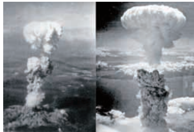
Atomski »gobi« nad Hirošimo (levo) in Nagasakijem, posneti 6. in 9. avgusta 1945