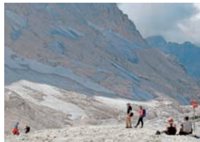
Ostanki ledenika