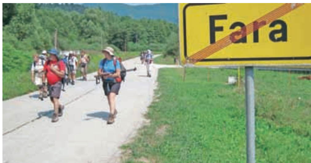
Cilj romarjev je bila Fara pri Kočevju.