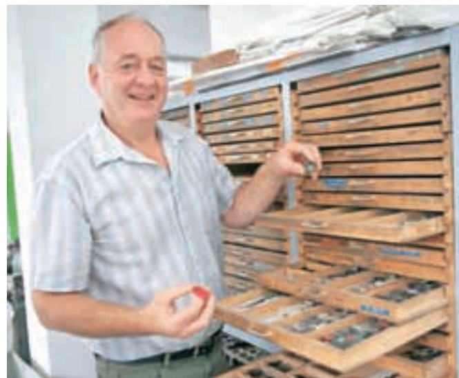
Bogatstvo podjetja je pestra baza gumbov in unikatnih orodij za njihovo izdelavo.

»Kljub temu da imamo velike kapacitete, tega nimamo komu prodati. Ne le propad tekstilne industrije in huda konkurenca z Vzhoda, težava, s katero se soočamo, je tudi ta, da ljudje preprosto nosimo čedalje manj gumbov. Vse več je zadrž in vse stremi k večjemu udobju, gumbi pa tu izgubljajo, čeprav bodo verjetno tudi v prihodnje imeli vsaj dekorativno funkcijo. Je pa škoda, ker z gumbi izginja tudi znanje njihove izdelave,« še pravi Lipovšek in dodaja, da imajo v svojih poslovnih prostorih urejeno tudi maloprodajo, uredili pa bodo tudi spletno trgovino.