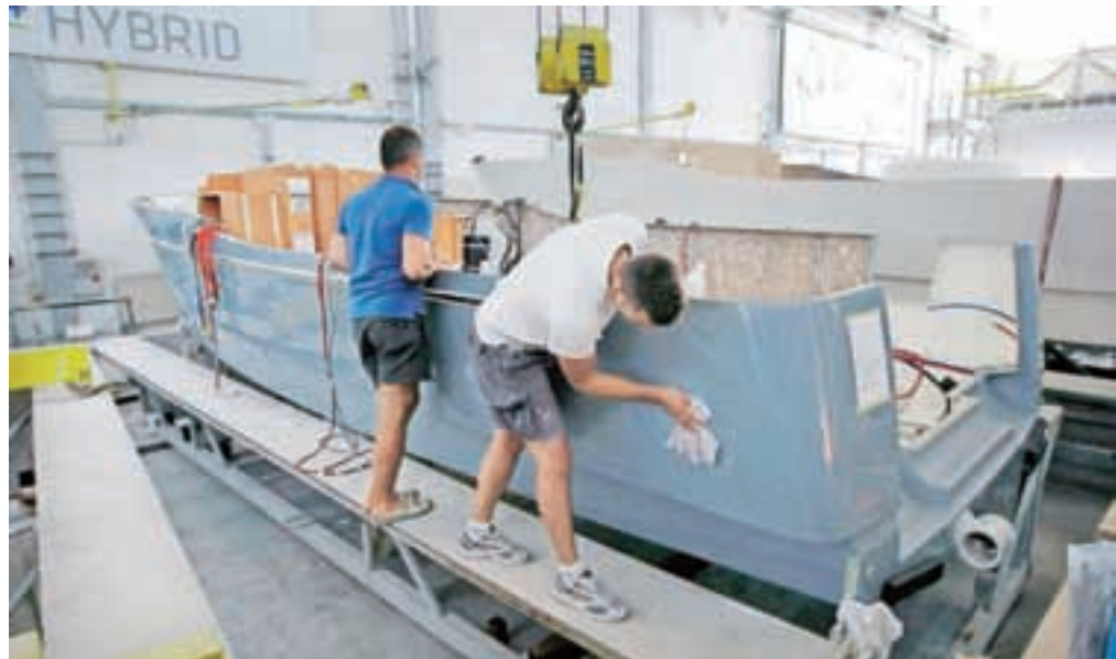
Ta teden so na Zgoši po ponovnem zagonu proizvodnje dokončali že drugo barko znamke Greenline, po načrtih naj bi jih v prihodnje do 70 letno.