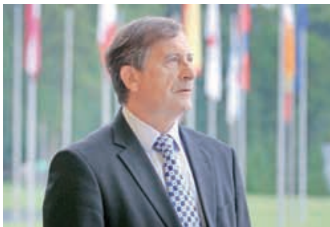
Odbor DZ za zunanjo politiko podpira nadaljevanje arbitražnega postopka, je včeraj povedal zunanji minister Karl Erjavec.