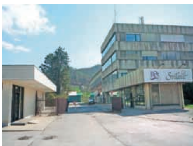
Potrebe za postopek likvidacije Svilanita ni več.

ustavil, koliko upnikov je prijavilo svoje terjatve, kako poslujejo zdaj in kakšni so učinki selitve proizvodnje v tujino, Šubičeva ni bila dosegljiva; iz podjetja so nam sporočili, da je na dopustu. Kot je znano kljub selitvi proizvodnje v tujino (menda v Turčijo) v Kamniku še vedno ostajata oddelka razvoja in vzorčne proizvodnje, prav tako naj bi združili družbo Svilanit s hčerinskim, sicer invalidskim podjetjem, Svilanit Svila, ki imata zdaj 35 zaposlenih.