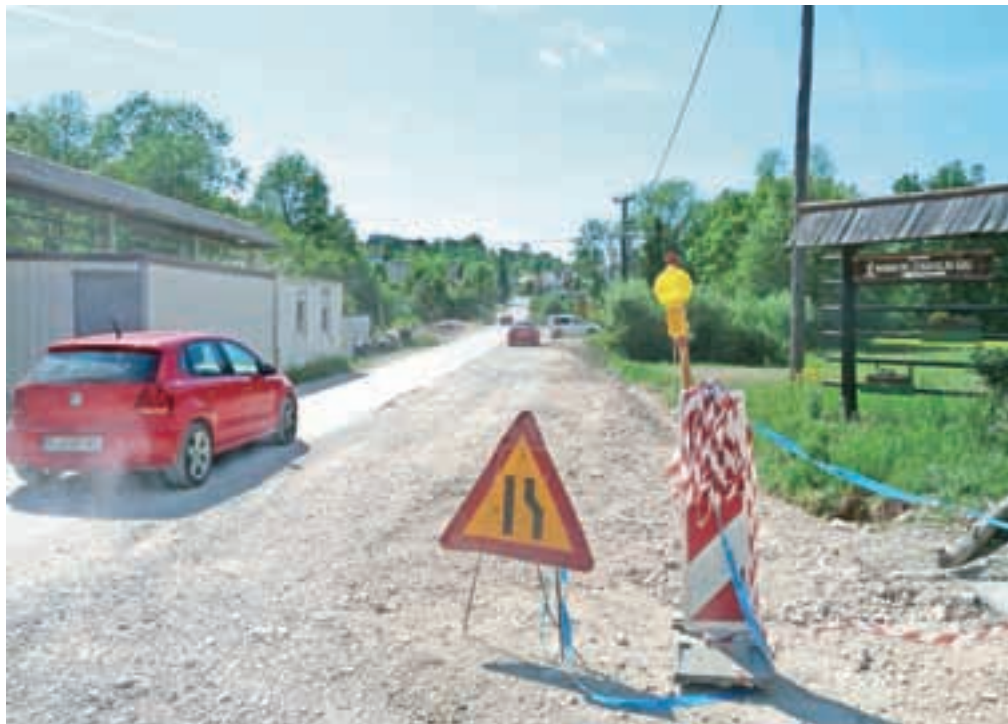
V sklopu kohezijskega projekta Občina Kamnik gradi tudi kanalizacijo v Tunjicah.

Projekta Odvajanje in čiščenje odpadne vode na območju Domžale-Kamnik ter Oskrba s pitno vodo na območju Domžale - Kamnik sta ocenjena na dobrih petdeset milijonov evrov. Kohezijski sklad EU pa bo prispeval slabih 31 milijonov evrov. Kot sporočajo z ministrstva za okolje in prostor, bo v okviru prvega projekta zgrajena kanalizacija v skupni dolžini dobrih 47 km in enainvajset črpališč, nadgrajena bo tudi centralna čistilna naprava do zmogljivosti 149 tisoč populacijskih