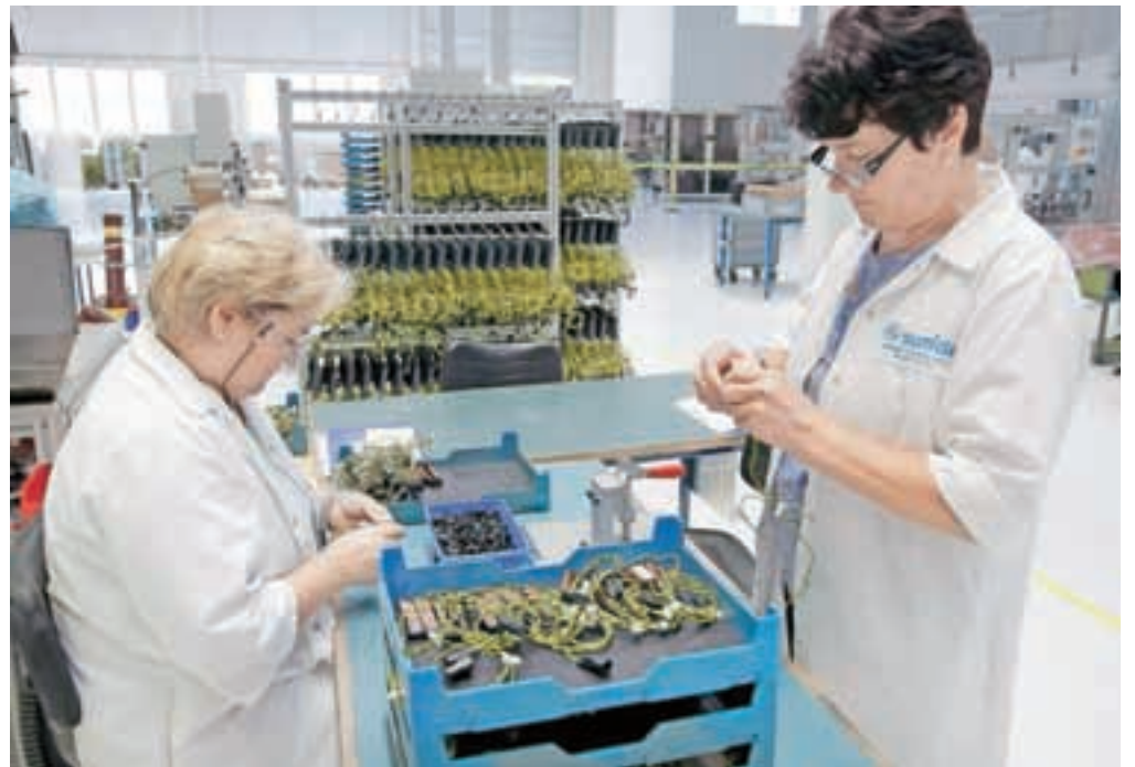
V novo halo se je preselilo šestdeset od skupaj 280 delavcev.