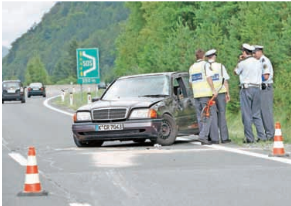
V poletnem času, ko je na naših cestah še več tujih vozil in ko se tudi sami odpravljamo v tujino, je dobro vedeti, kako je treba ravnati v primeru nesreče.

»Vsekakor si morate s soudeleženci v prometni nesreči ali z oškodovanimi izmenjati potrebne podatke za uveljavljanje povračila škoda na zavarovalnici, izpolniti evropsko poročilo in pridobiti kopijo zelene karte o zavarovanju vozila, če ste trčili z vozilom, ki je registrirano v tujini,« svetujejo policisti in dodajajo, da kraj prometne nesreče lahko zapustite samo v nujnih primerih, kot je na primer takojšen prevoz poškodovanca v bolnišnico. Na kraj prometne nesreče se morate vseeno čim prej vrniti, pri čemer v nobenem primeru do zaključka ogleda ne smete uživati alkohola, mamil, psihoaktivnih zdravil ali drugih psihoaktivnih snovi. Predvsem v hujših nesrečah morajo na kraju nesreče