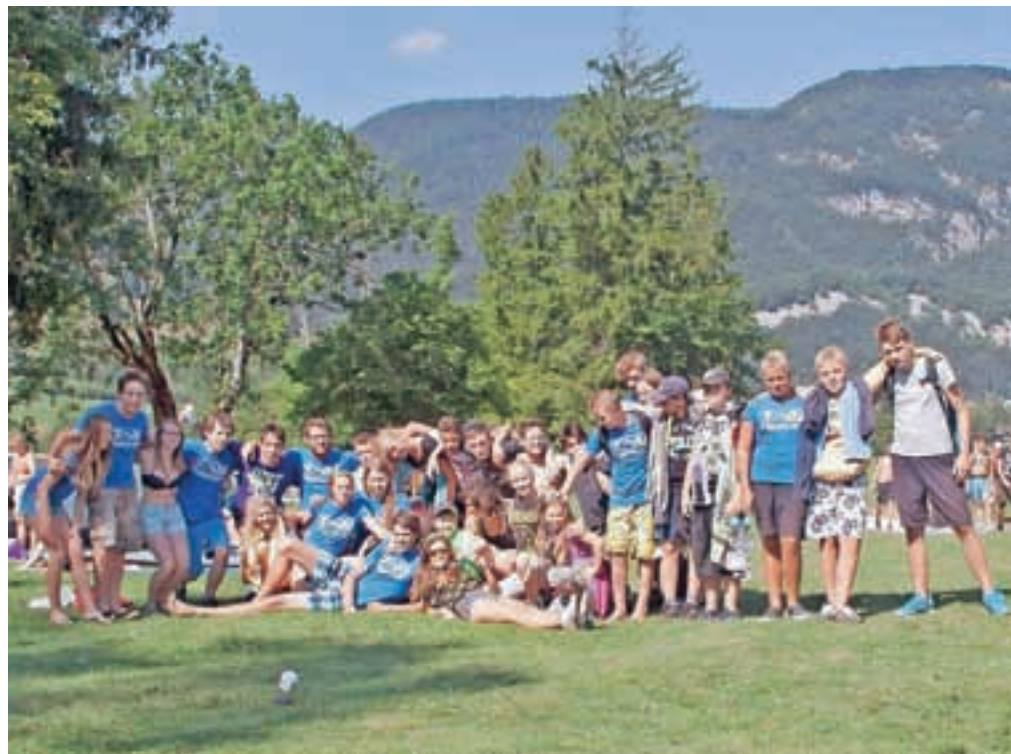
Udeleženci Gahavega tabora na Bohinjski Beli... / Foto: arhiv društva GAHA

pripravili delavnice orientacije, prve pomoči, prižiganja ognja s pomočjo kresila, postavljanje bivaka, vse pridobljeno znanje pa so nato preverili na orientacijskem pohodu. Vsakdo se je preizkusil tudi v plezanju na naravnem plezališču Igljica, spuščali so se po vrvi žičnici in priredili piratski večer z iskanjem zaklada. Četrty dan in noč so preživeli v naravi. Odpravili so se namreč na bivakiranje, po poti pa so z raznimi igrkami zbirali točke, ki so jih zvečer na t. i. taborni tržnici zamenjali za hrano. Tudi na sladico niso pozabili, pripravili