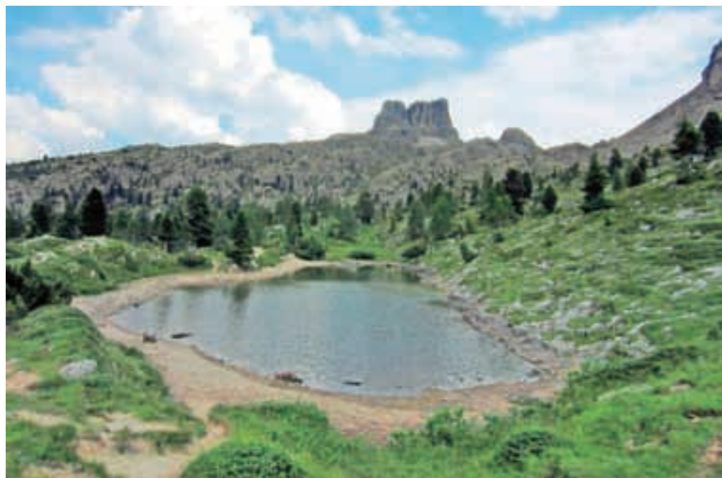
Averau in jezero Limesdes