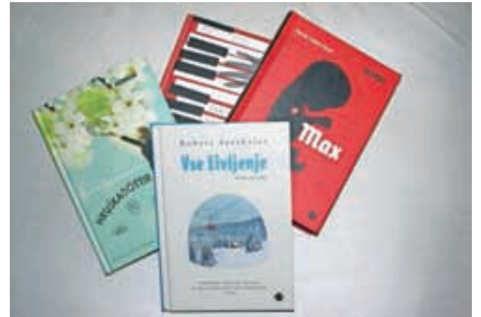
Pri Cankarjevi založbi so izšli štirje novi prevodi romanov evropskih avtorjev.