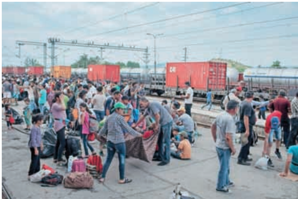
Po prihodu na postajo v Gevgeliji si večina beguncev pripravi improvizirano počivališče, saj so tisti, ki jim ne uspe priti na vlak, namenjen proti Srbiji, primorani prespati na postaji.