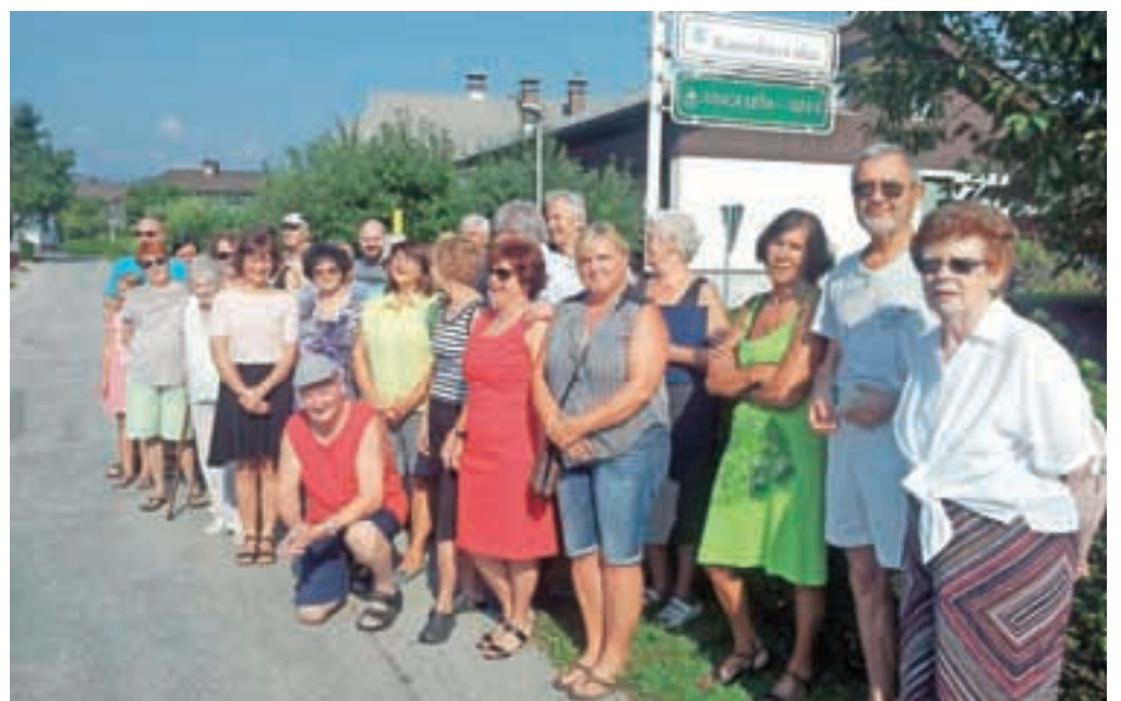
Prebivalci Kumerdejeve ulice, najlepše na Bledu

Kumerdejeva ulica ni edina v naselju Dobe, ki ji je pripadel naziv najlepše. V preteklosti je priznanje že prejela tudi Rožna ulica.