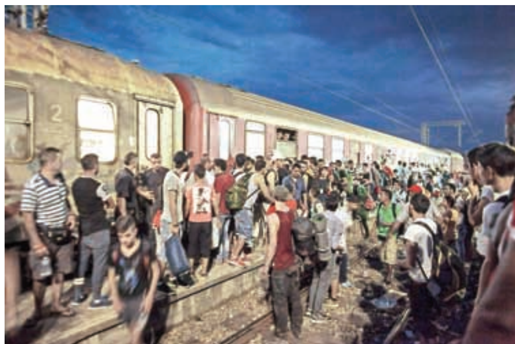
Največji kaos nastane ob prihodu zadnjega vlaka dneva ob 22. uri, saj to pomeni, da bodo morali tisti najbolj nesrečni prespati na betonskih tleh postaje, tako kot že marsikatero noč.