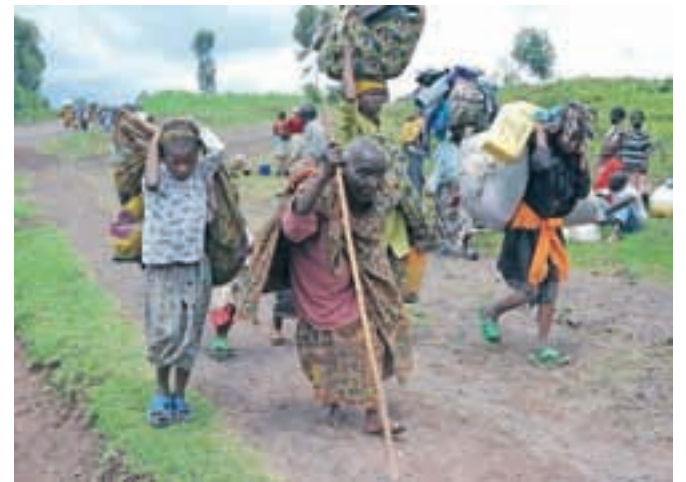
Begunci iz vasi Kibati v Demokratični republiki Kongo, leta 2008, bežeči pred lokalno vojno

»Priča smo najhujši begunski krizi našega časa, ko se na milijone žensk, moških in otrok bojuje, da bi prežive-li sredi brutalnih vojn, mrež trgovcev z ljudmi in vlad, ki zasledujejo sebične politične interese, namesto da bi pokazale osnovno človeško sočutje.« Tako pa je begunsko stvar komentiral Salil Shetty, generalni sekretar človekoljubne organizacije Amnesty International, ob objavi poročila pred svetovnim dnevom beguncev .20. junija).