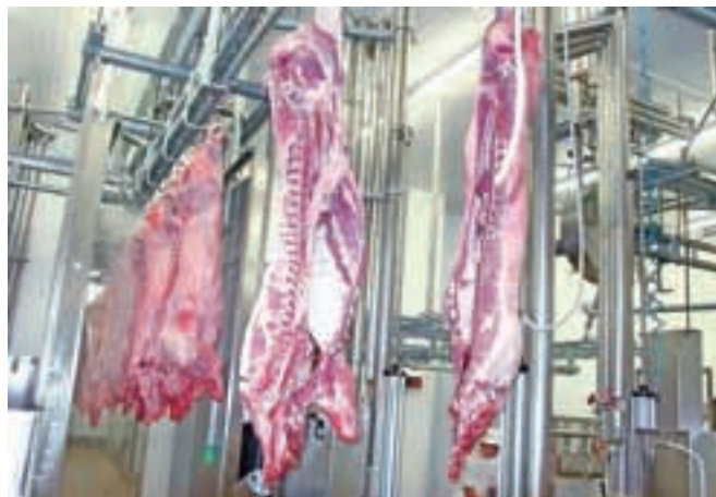
Inšpektorji so preverjali sledljivost in označevanje mesa.

Kranj – Republiška uprava za varno hrano, veterinarstvo in varstvo rastlin je aprila in maja opravila poseben nadzor označevanja in sledljivosti prašičjega in perutninskega mesa v obratih za razsek mesa in v mesnicah. Preverjala je predvsem »sistem« zagotavljanja sledljivosti mesa, pregledovala dokumente, ki spremljajo pošiljke mesa, in ugotavljala, ali je možno dokumente dejansko povezati s pošiljko glede na količino prejetega in izdanega (predelane) mesa, pa tudi to, ali je označevanje mesa skladno s predpisi. Nadzor je opravila v 113 obratih – v štiridesetih razsekovalnicah prašičjega mesa, v štirih razsekovalnicah perutninskega mesa in