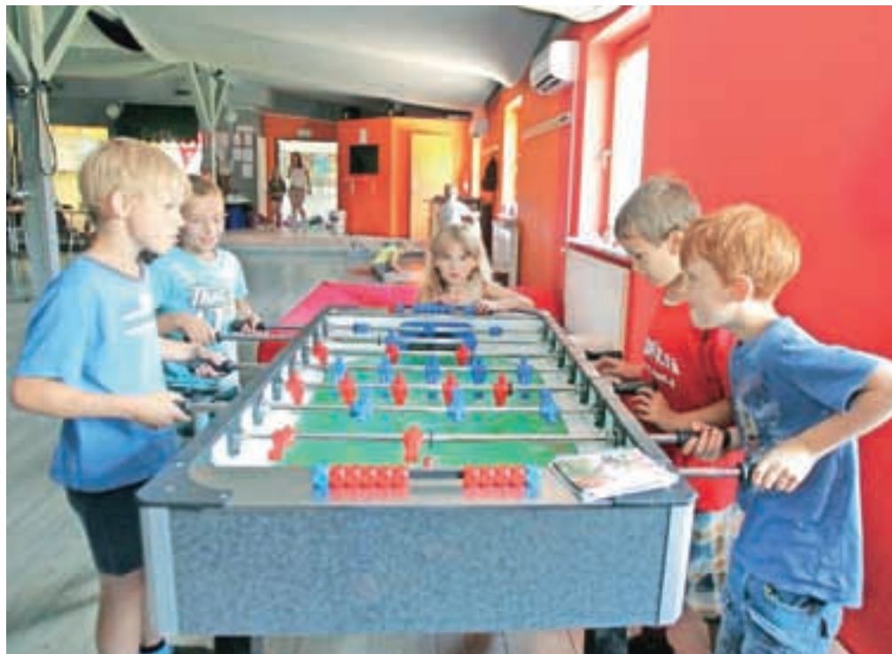
Medtem ko v nekaterih občinah povpraševanja po počitniškem varstvu ne zaznavajo, pa je v Medvodah zanj veliko zanimanja.

Korak naprej so letos naredili v Škofji Loki, kjer je Društvo prijateljev mladine tradicionalne triurne počitniške aktivnosti Dobimo se ob pol desetih na OŠ Ivana Groharja razširilo z jutranjim in popoldanskim varstvom, tako da program izvajajo šest ur dnevno – od 7.30 do 13.30. A obisk jutranjega varstva je bil vsaj ta teden, ko so z njim začeli, slabši od pričakovanj, zato se bodo v nadaljevanju na podlagi števila prijav sproti odločali, ali ga bodo organizirali. V torek zjutraj so na primer varovali le tri prvošolčke, prijavljenih je bilo sicer nekaj več. »Gre za novost in morda nekateri starši o tej možnosti niti niso obveščeni. Ta teden jutranje varstvo izvajamo poskusno, potem bomo pa videli, kako se bo obneslo. Za izvedbo pa je treba imeti vsaj okoli deset udeležencev. Je pa ponovno na dober odziv naletel program Dobimo se ob pol