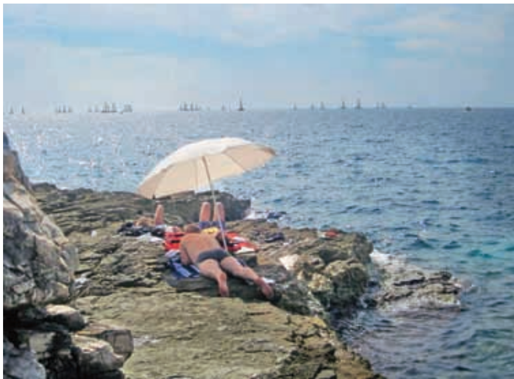
Pred odhodom na počitnice je pametno urediti zdravstveno zavarovanje. / Foto: Tina Dokl

Pri uveljavljanju pravic iz zdravstvenega zavarovanja namreč velja zakonodaja države, v kateri jo zavarovavec uveljavlja. »Če se na primer odločite za počitnice v Franciji, ste pri pravicah iz zdravstvenega zavarovanja izenačeni z njihovimi državljani. Če vam torej v Franciji zaračunajo pavšalno doplačilo za vsak zdravstveni poseg, tega ne povrnemo, ker bi šlo v tem primeru za neenako obravnavo državljanov,« je opozoril Peter Rutar iz sektorja