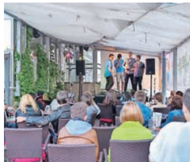
Impro zabava se je začela in zaključila z obilico humorja.

tolmačiti, pa je bilo policijsko vozilo, notredamski zvonar in pikado. Medtem ko je pet fantov skakalo na odru in si izmišljal, kar jim je glava v tistem trenutku dala, so se mladi in stari smejali in uživali v zadnjih sončnih žarkih, kljub temu da so morali biti zbrani in pripravljeni na sodelovanje, saj improvizirane predstave to nujno zahtevajo.