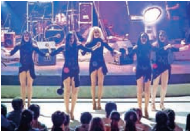
Poleg glasbenih 'jagod in čokolade' so na Gorenjski plaži navdušile tudi brhke plesalke.