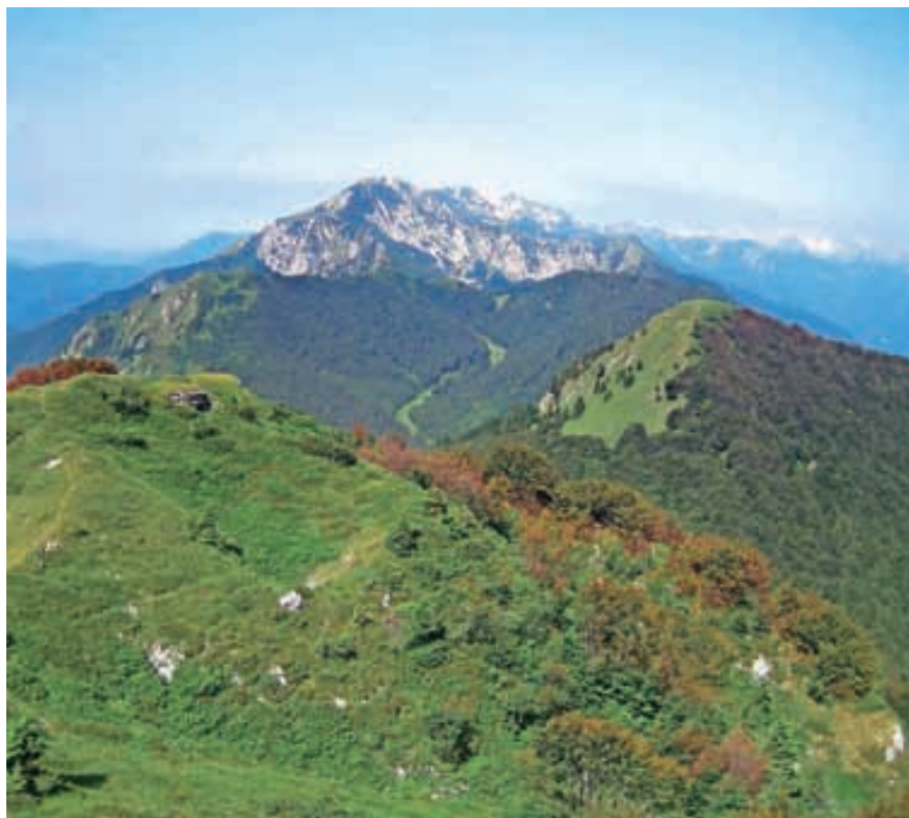
Pogled na Šavnik kot ga vidimo z Možica.

Travnat vrh, ki je pozimi priljubljen turnosmučarski cilj, nagradi z lepim razgledom: greben Soriške planine z Možicem in Slatnikom, greben Vrha Bače, Koble do Črne prsti, Porezen in severni Črne prsti in Šavnika. Na začetku zložna pot, začne