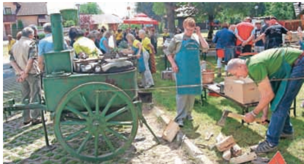
Ena izmed prireditev v sklopu praznovanja občinskega praznika je bil tradicionalni Slovenski dan v Dragočajni, na katerem obiskovalci lahko pokusijo za te konce tipično hrano in pijačo. Letos je dišalo tudi iz poljske kuhinje, ki so jo uporabljali v prvi svetovni vojni.