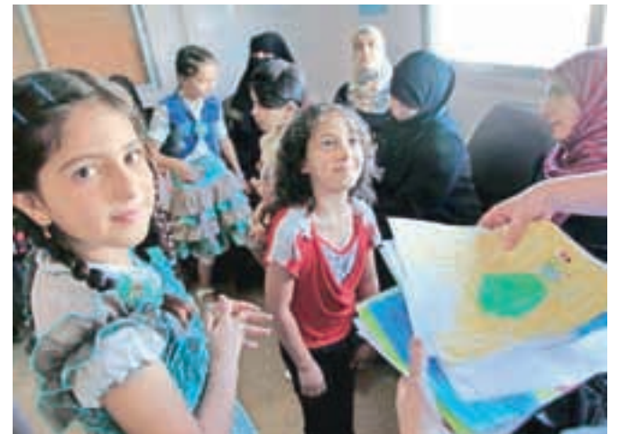
Privoščimo jim vsaj nasmeh: otroci beguncev iz Sirije na kliniki v Jordaniji, avgusta 2013