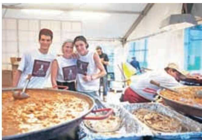
Festival je poskrbel tudi za vse gurmanske navdušence: začinjena indijska hrana, presne pite, energijski smutiji, kalorična domača hrana z dodatki ...