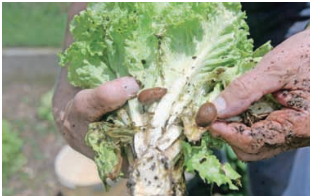
Rdeči polži objedajo tudi liste solate.

Marija Kalan, specialistka za rastlinsko pridelavo v Kmetijsko-gozdarskem zavodu Kranj, ugotavlja, da se ponudba učinkovitih fitofarmaceutskih sredstev za zatiranje rdečih polžev krči in da vrtničarji tudi z rednim zalivanjem vrtov in zelenih površin ustvarjajo dobre pogoje za pretirano razmnožitev polžev.