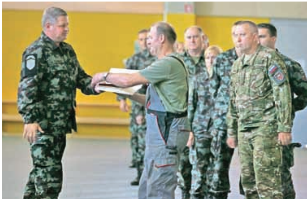
Podelili so tudi bronaste medalje in pohvale pripadnikom Logistične brigade.