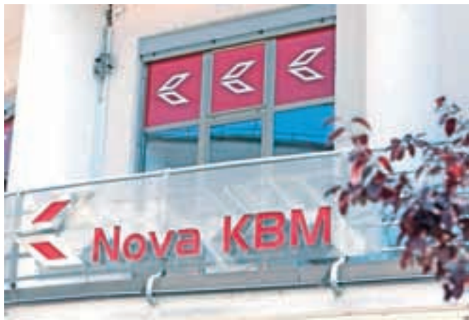
Apollo bo postal lastnik 80-odstotnega, EBRD pa 20-odstotnega deleža NKBM.