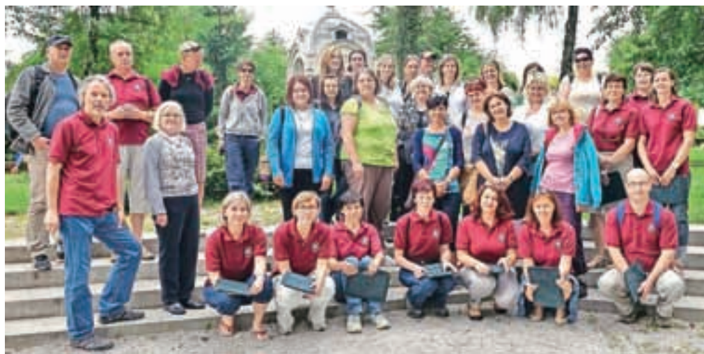
V Kranju so se srečali zaposleni s petih šol, ki nosijo ime po pesniku Francetu Prešernu.