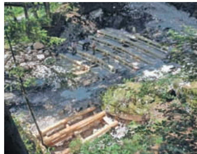
Na zemljišču nasproti občine urejajo naravni amfiteater za poletne prireditve.