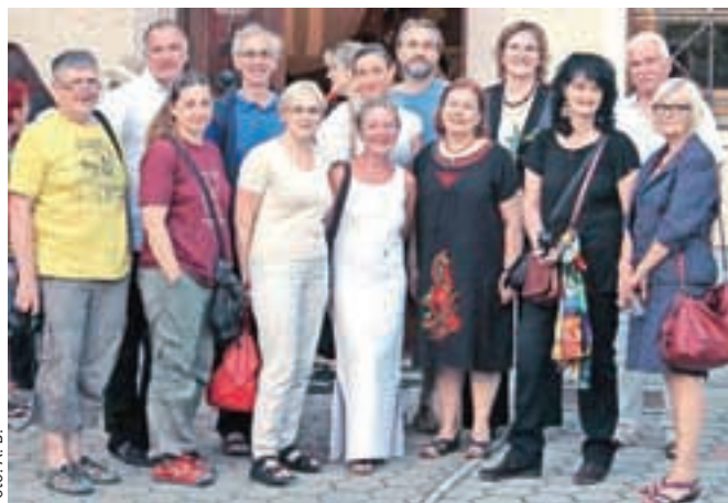
Udeležba na simpoziju umetniške keramike je mednarodna.