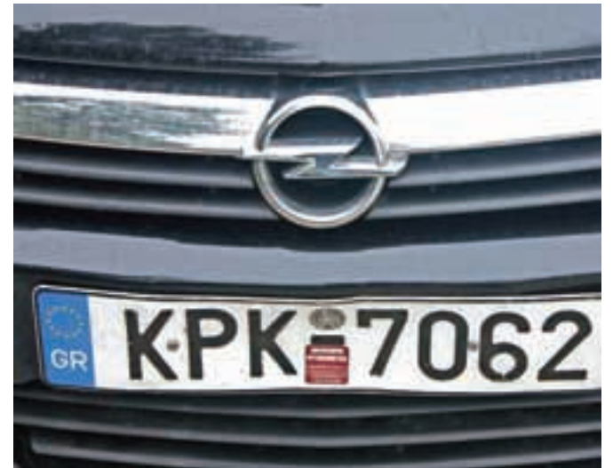
V Grčijo bomo poslali tudi štiri inšpektorje, ki bodo v Oplovih vozilih šli na teren po celi državi in poizvedovali o korupciji.

Avstrijci bodo Grkom za spodbudo in v poduk s Tirolske poslali nekaj primerkov upokojencev, ki kljub visoki starosti še vedno izdelujejo spominke za Grossglockner, šivajo miniaturne irharice, tisti z glasbenim znanjem pa pišejo partiture za