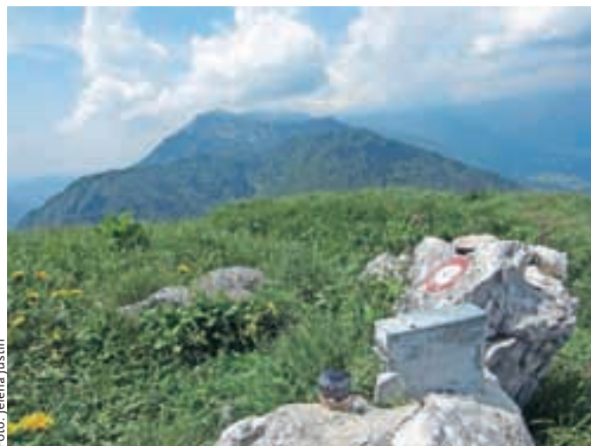
Vrh Šavnika; v ozadju greben proti Koblji in Črni prsti.

Nadmorska višina: 1574 m Višinska razlika: 300 m Trajanje: 3 ure Zahtevnost: ★★★★★