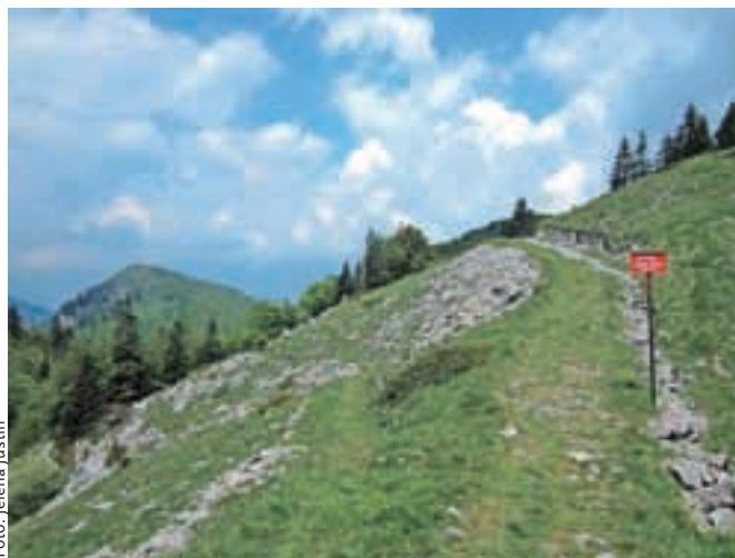
Odcep proti Črni prsti in Šavniku s poti na Možic.