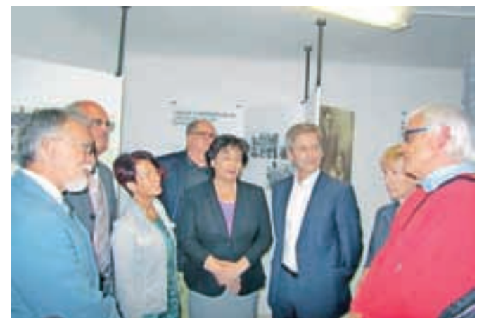
Slovenska ministrica za kulturo Julijana Bizjak Mlakar in avstrijski minister za umetnost, kulturo in izobraževanje dr. Josef Ostermayer (v sredini) sta si skupaj ogledala Peršmanov muzej.

V Bekštajnu/Finkenstein blizu Baškega jezera na Koroškem je bila včeraj zvečer predstavitev evropskega projekta FLU-LED za občino Bekštajn, katerega rezultat je dvojezični zemljevid z ledinskimi in hišnimi imeni.