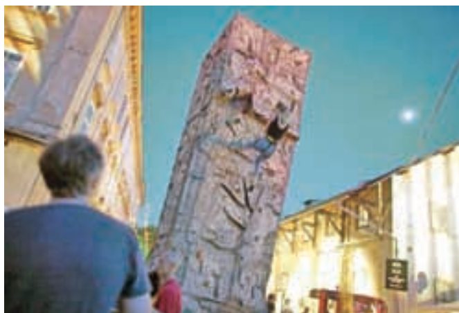
Vzpon do zvezd: raznovrstna festivalska ponudba obeta ponovno vrnitev.

prevzel pred slabim letom dni. Da se je letošnje poletje začelo še bolj sproščeno, so poskrbeli člani ekipe Kam(p)asutra, sicer aktualni prvaki šolske impro lige (ŠILE). Impro zabava se je začela z igro, kjer so gledalci zahtevali, da dva odigrata prizor, kjer bodo vsebovane besede senik (prostor), krovec (poklic) in zobotrebek (morilsko orožje). Zadnji, ki je v tujem in neznanem jeziku poskušal izluščiti, kaj mu predhodnik poskuša raz-