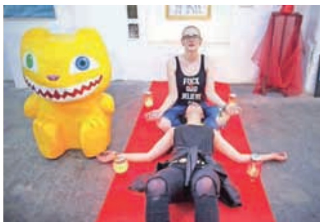
Festivalska galerija je na ogled ponudila vrhunsko poulično umetnost, navdušila je tudi instalacija Maje Poljanc, ki preizkuša meje okultizma.