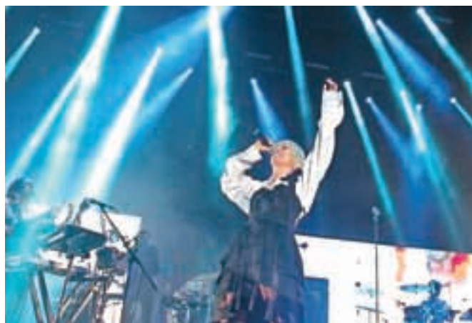
Zaključni koncert na glavnem odru je pripadel irski kultni pevki Roisin Murphy.