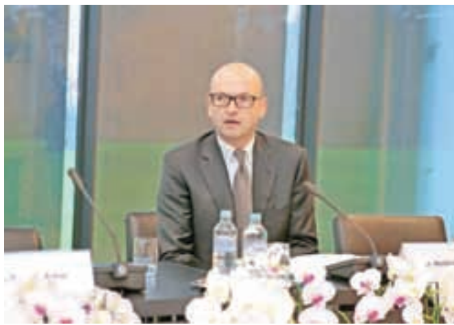
Guverner Banke Slovenije Boštjan Jazbec pravi, da grški dogodki ne bodo neposredno vplivali na slovenske banke.