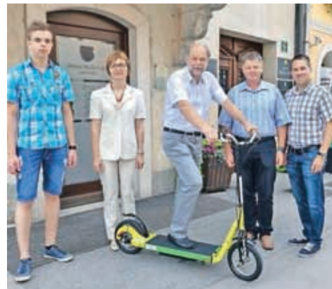
Občina je od MIC-a odkupila električni skiro.

bo električni skiro odkupila, s čimer želimo spodbuditi mlade izumitelje iz MIC-a. Prvi uradni komercialni primerek so izdelali v občinskih barvah, na občini pa ga bomo uporabljali za vožnje po mestu in okolici,« je povedal župan in oznanil, da ga bomo na električnem skiroju videli že danes ob odprtju čistilne naprave na Suhi.