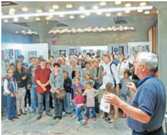
Likovne šole Puhart so vsako leto zelo dobro obiskane.