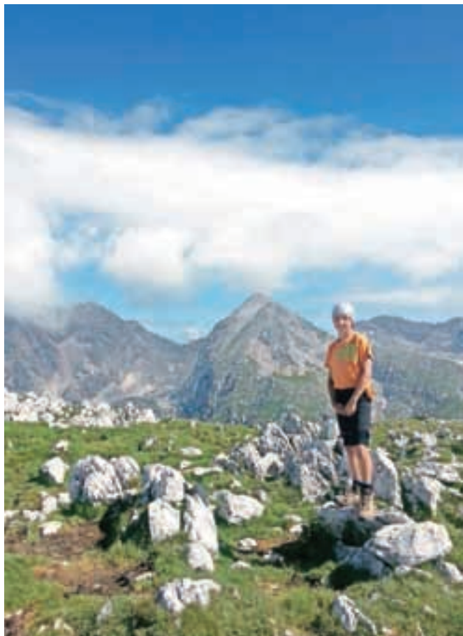
K urejenosti planinskih poti gre velika zahvala tudi markacistom prostovoljcem. Posnetek pa je nastal na Kalškem grabenu.

Ljubljana - Lanskega februarja so društva, skrbniki planinskih poti zaradi posledic žledoloma in snegoloma za uporabnike zaprla 376 planinskih poti od skupaj 1661, kolikor je bilo skupno število registriranih planinskih poti. »Danes jih je zaradi posledic žledoloma zaprtih le še pet, ki pa jih markacisti prostovoljci obnavljajo. Pot Janeza Govekarja na Ermanovec je zaprta zaradi sprava lesa, ki še vedno poteka na tem območju. Le za planinsko pot s Košane na Osojnico skrbniki še razmišljajo, ali bi bilo treba potek poti prestaviti. Na poteh, kjer ni več drevja, se je razrasla trava in podrast, ki po nekaterih predelih Notranjske in Posočja markacistom in društvom dela veliko preglavic s košnjo poti vsaj dvakrat letno, ponekod tudi do trikrat. Prav tako na strmih pobočjih še stojijo panji dreves, ki se bodo z erozijo in odmiranjem korenin premaknili in zasuli ali odnesli steze, vendar tega procesa ne moremo v popolnosti nadzorovati ali vnaprej predvideti vseh posledic.«