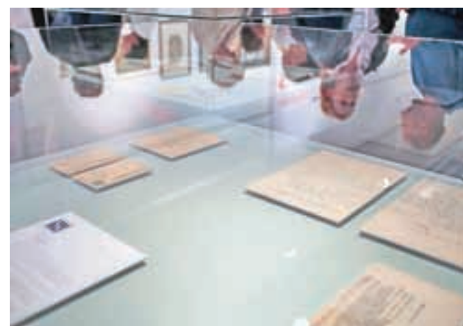
Zrcalni odsev konstruktivizma: razstava o Avgustu Černigoju na Loškem gradu