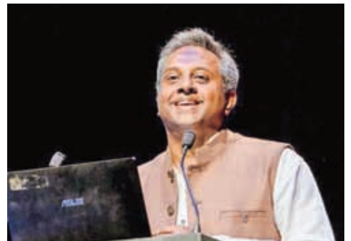
Indijec Salil Shetty, generalni sekretar človekoljubne organizacije Amnesty International