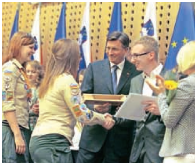
Najprostovoljci s predsednikom države Borutom Pahorjem

Ključno priznanje za kolektivno delo in naziv najprostovoljski projekt je prejel projekt Obnovimo slovenske gozdove Zveze tabornikov Slovenije. Projekt je nastal kot odziv na katastrofalen žledolom lani februarja, poteka v