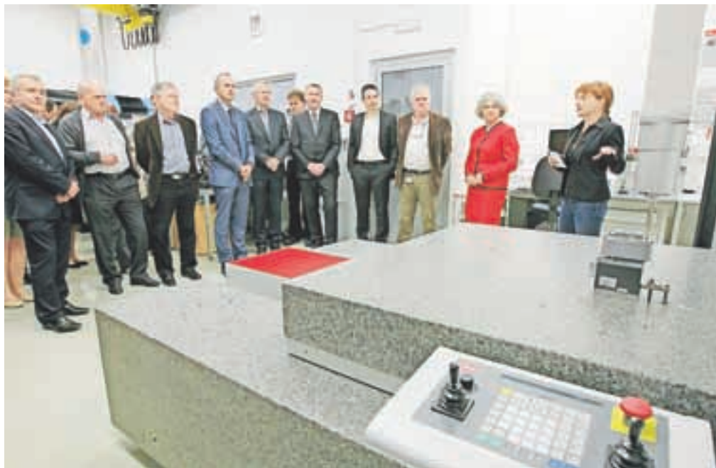
Nov mehanski laboratorij so opremili z zmogljivejšimi merilnimi stroji.