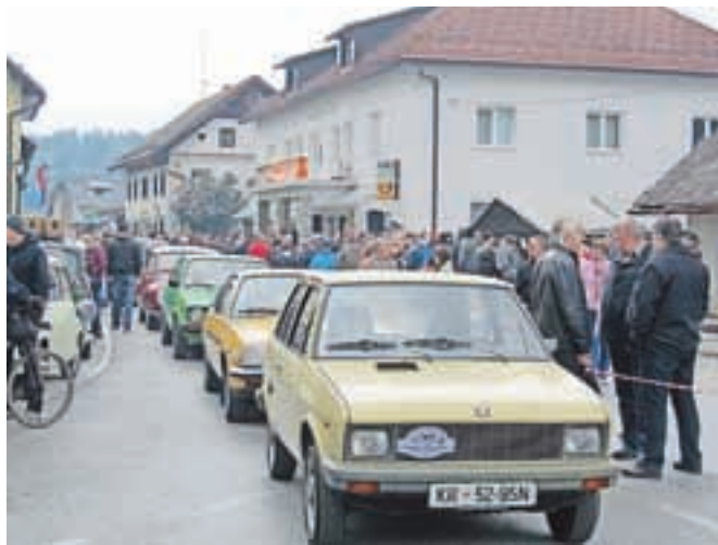
Na paradi starodobnikov v Naklem

Tradicija parade starodobnikov se je razvila iz prvomajske budnice pred dvajsetimi leti, takrat se je zbralo 22 motorjev in dva avtomobila. Letos je bila številka precej drugačna, zbralo se je veliko starodobnih avtomobilov in le nekaj motoristov, slednji svojih lepotecev niso želeli izpostavljati dežju. Najstarejši v paradi je bil avtomobil, ki je bil narejen leta 1936, torej že pred drugo svetovno vojno, večina avtomobilov pa je bila izdelana po vojni.