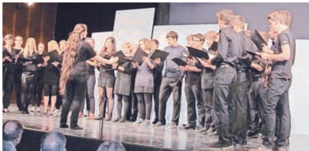
Mladi so imeli glavno vlogo na nedeljski slovesnosti v Celovcu s pomenljivim naslovom Osvobojeni/Befreit.