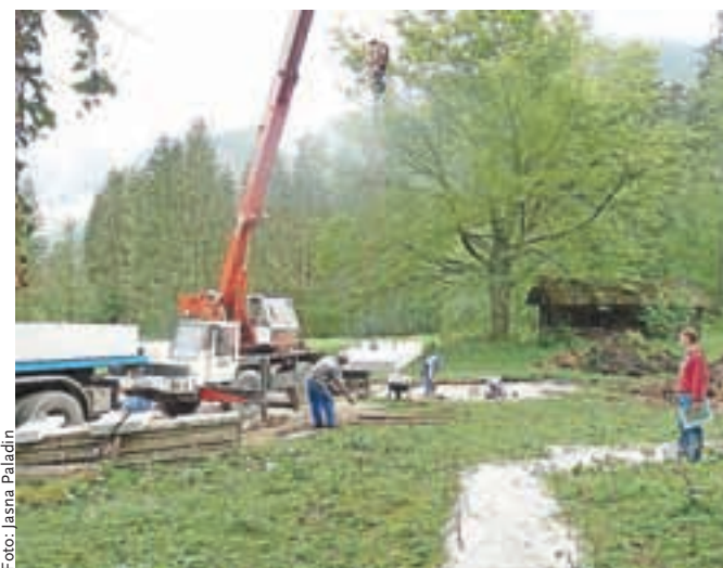
Včeraj so delavci Žurbi Teama takole polagali gradbene odlitke, ki jih bodo v kratkem zmontirali v celoto.