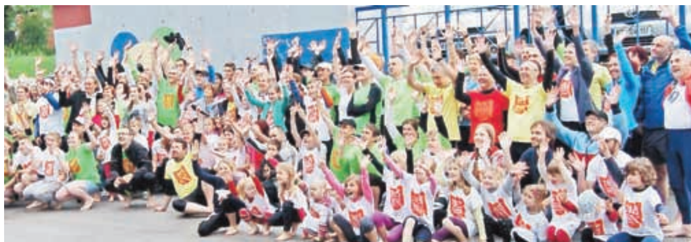
Del bosonoge družine; organizatorji vsako leto privabijo nove nogice.

sezona bosega teka traja nekje od maja do avgusta, za tiste bolj utrjene pa kar celo leto,« pravi Roblek, zadovoljen, da je vse več bosih tekačev: »Ljudje vidijo druge in si upajo poskusiti tudi sami. Tako je tudi na Slovenskem bosome teku. Veliko je novih obrazov.«