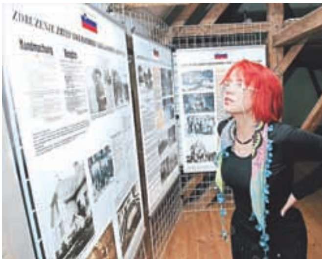
Razstava Da se ne pozabi bo v podstrešni galeriji gradu Khislstein gostovala do konca septembra.

Razstavo so začeli snovati že pred več kot desetimi leti, prvič je bila na ogled v nemškem Nürnbergu, z njo so med drugim gostovali tudi v Kölnu in Hamburgu,