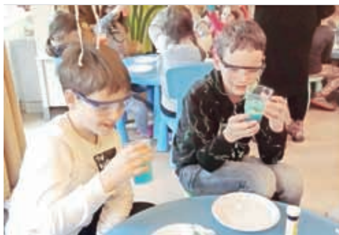
Otroke so razveseljevali uspešno izpeljani eksperimenti.