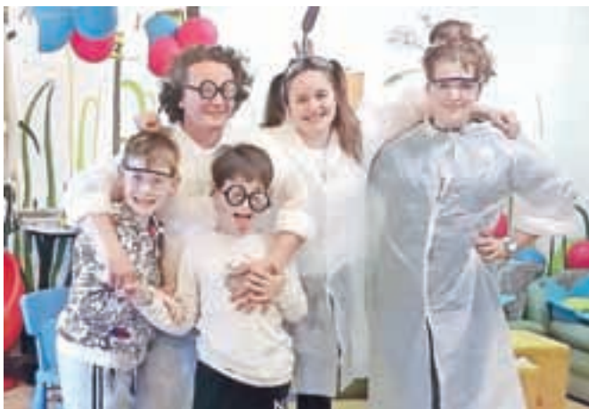
Ekipa zmešanih doktorjev, profesorjev in asistentov