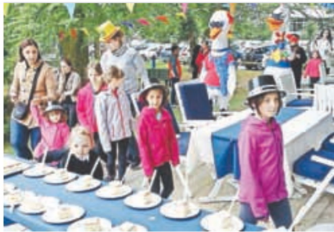
Razigrana četica na poti do sladkih nebes – blejske kremšnite