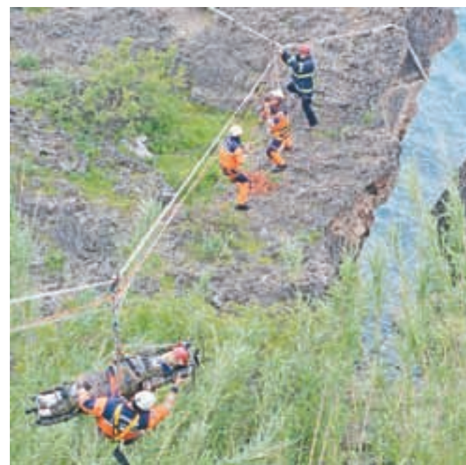
Zaključno usposabljanje na antalijski obali

Tokratni projekt, ki se bo uradno končal ta mesec, poteka v okviru evropskega