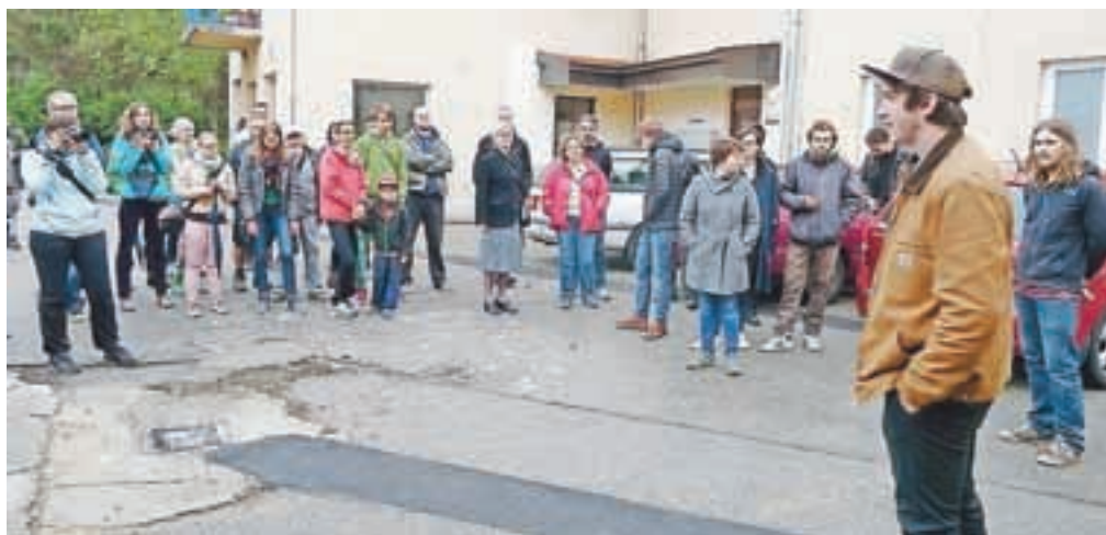
Udeleženci urbanega sprehoda so se seznanili tudi z zgodbo in načrti nekdanjega Alprema.

»Jane Jacobs se je borila proti temu, da bi v mestih prevladale velike gradnje, ki temeljijo izključno na ekonomskih podlagah, želela si je mesta vrniti ljudem in gradnje povezati s civilnimi iniciativami meščanov. Voden urbani sprehodi, ki izhajajo iz teh pobud, so namenjeni povezovanju prebivalcev z mestnim središčem in spodbujanju pripadnosti območju bivanja, obenem pa boste danes vsi imeli priložnost za pogovor o težavah, s katerimi se kot stanovalci dnevno srečujete, ter oblikovanje pobud, kako mesto narediti privlačnejše in prijetnejše za življenje.« je zbrane na 2. urbanem sprehodu Jane's Walk v Kamniku, ki ga je tudi letos z lokalnimi partnerji organiziral Inštitut za