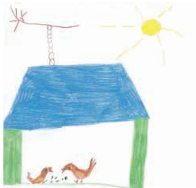
Ptički v ptičji hišici najdejo zavetje in hrano.

nam boste poslali kakšno svojo lepo risbico. Ne odlajajte, ampak zgrabite papir in barvice ter hitro na delo, starše ali stare starše pa prosite, naj nam risbico pošljejo po elektronski ali navadni pošti.