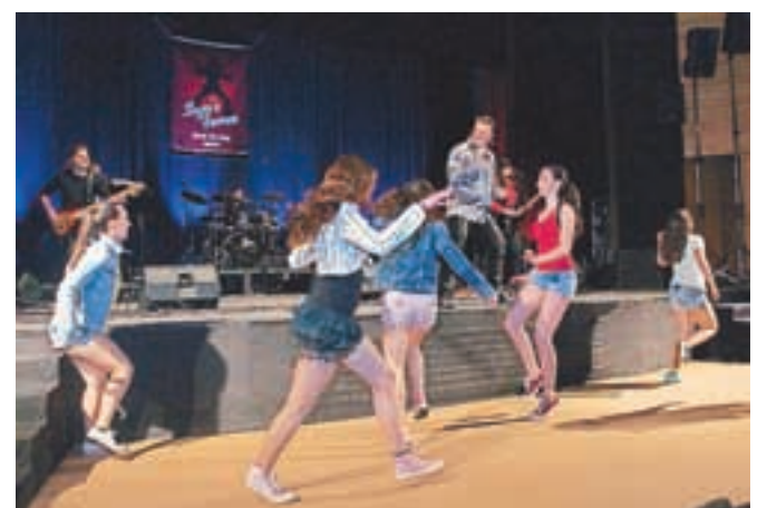
Sam's Fever so se pridružile plesalke Plesalnice Bohinj.