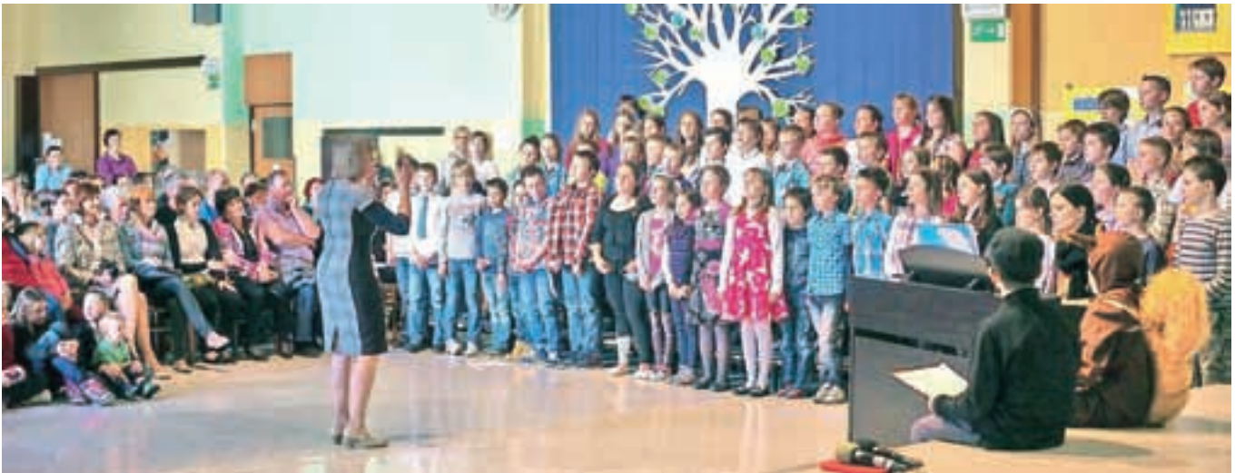
V polni dvorani je zadonela vesela pesem mladih...