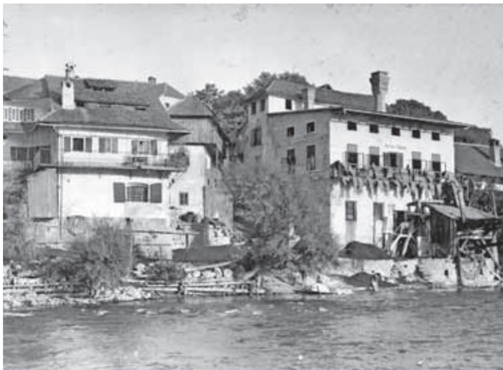
Zupanova usnjarna v Kranju, v kateri so od decembra 1943 do začetka maja 1945 delali žirovski čevljarji.

»Domobranci v Vetrinju so že precej dobro vedeli, kam gredo, pa so šli z besedami: Kamor so šli drugi, gremo še mi. Nekaj voditeljev se je poskrilo, vojakom pa so pustili, da so se dali odpeljati – v mučenje in smrt.«