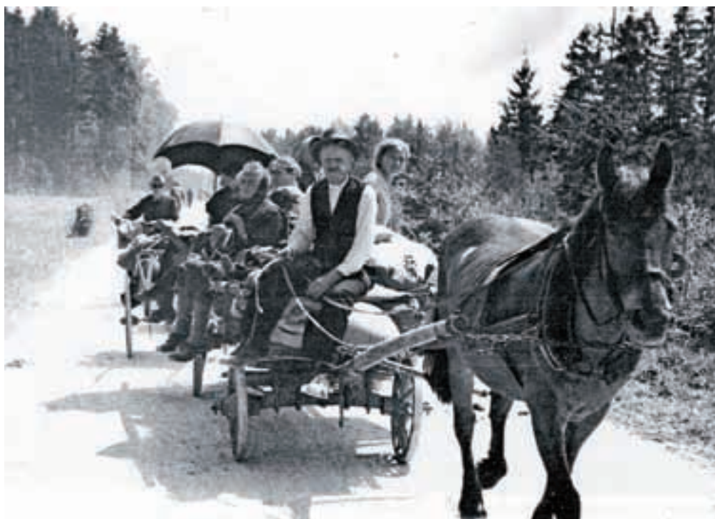
V začetku maja 1945 so se mnogi podali na pot v neznano kar z vprežnim vozom. A niso imeli vsi para konj – kot junaka naše zgodbe

»Crknjeni konj ob cesti je že močno zaudarjal. Tudi mrtvih vojakov še niso bili povsod pokopali. Ležali so ob cesti čudno sploščeni in zaudarjali daleč naokrog. Vznemirjena konja sta živčno hrzala in vlekla v stran, kot da se jim hočeta ogniti.«