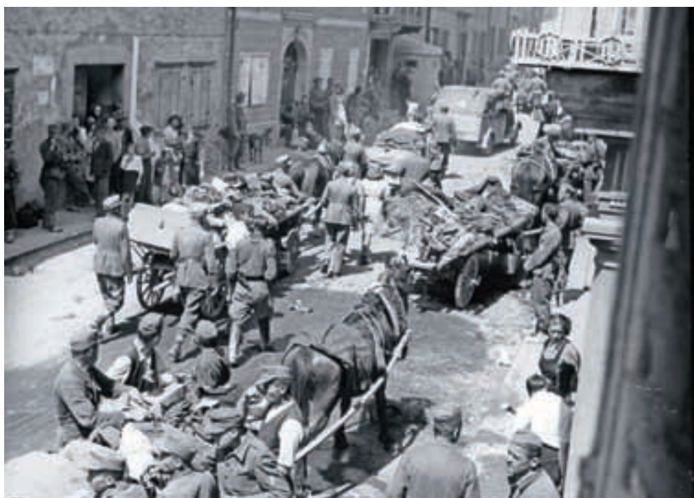
Reka beguncev na poti skozi Tržič, maja 1945