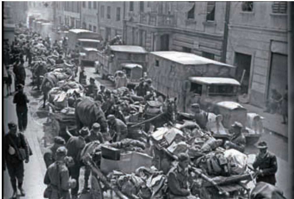
Nemci in domobranci na poti skozi Tržič, maja 1945