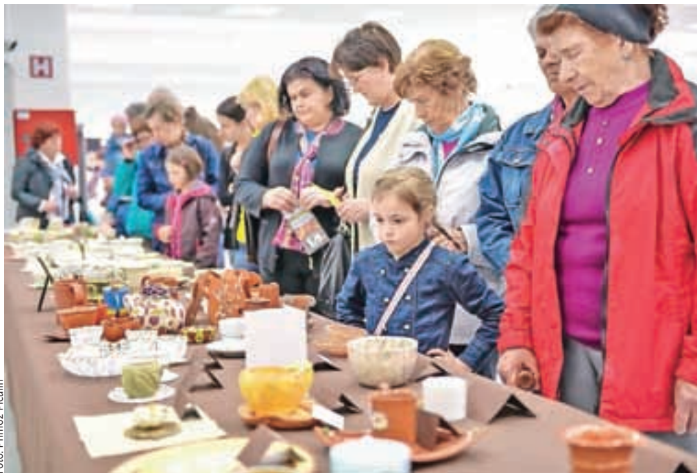
Ta konec tedna se je v Žireh odvijal osrednji program v okviru 9. Slovenskih klekljarskih dni.