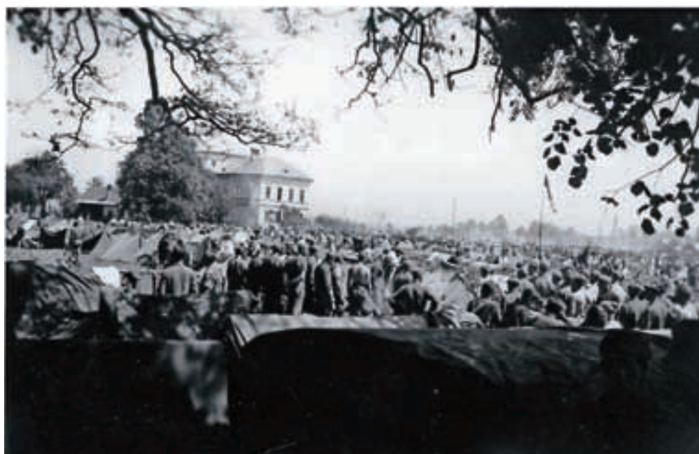
Vetrinj, maja 1945. Fotografija iz knjige Monike Kokalj Kočevar, Gorenjski domobranec, 2000. / Foto: Janez Gorenc

Spoštovana poznavalka druge svetovne vojne, najlepša hvala za te bogate in dragocene odgovore na vprašanja, ki se nam postavljajo še 70 let po koncu te največje vojne vseh časov.