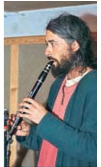
Poezija v akciji: zasedba Kovesolje je navdušila z ambientalno medzvezdno interpretacijo Srečka Kosove- la.

Prav tovrsten prehod in sodelovanje preko meja pa predstavlja organizacija tokratnega koncerta v Železnikih, ko je na premišljeno izbranim prizorišču DKC Bajta v domala intimni atmosferi najprej nastopila sežanska zasedba Kovesolje, sestavljena iz prekaljenih borcev kraške podzemne scene s samosvojo interpretacijo pesmi Srečka Kosove- la, sledil pa je udaren nastop odlične hrvaške indie/