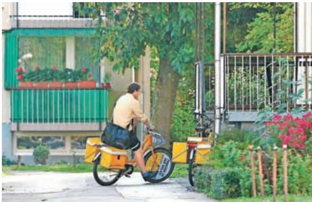
Gorenjske poštarje bodo po novem vodili iz Ljubljane.

Pošti Slovenija grozi tudi opozorilna stavka, ki pa ni povezana z omenjeno reorganizacijo. Sindikat poštних delavcev KS 90 je namreč sredi aprila vse zaposlene, teh je skoraj 6000, obvestil, da bodo 1. junija opozorilno