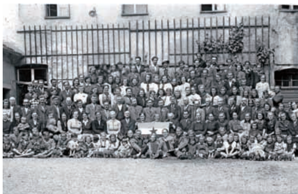
Člani gorenjskih družin v taborišču Burghausen na Zgornjem Bavarskem ob osvoboditvi, 1945