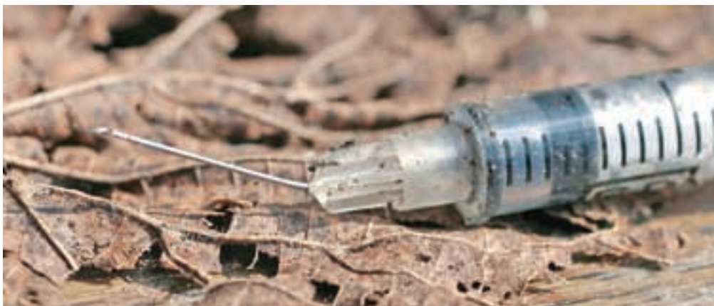
Namesto igel se pojavlja vse več sintetičnih drog in različnih zdravil.

Zaskrbljujoč je namreč podatek Nacionalnega inštituta za zdravje, da je delež mladoletnih oziroma starih med petnajst in šestnajst let na Gorenjskem, ki so v že pili alkoholne pijače, kar 94 odstotkov. Zato so v minulem letu veliko aktivnosti usmerili v področje alko-