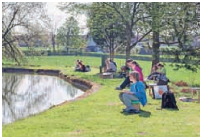
Bajer kot navdih pri risanju

Okoli 130 mladih ustvarjalcev si je ogledalo grad Strmol, nato pa so se razporedili po parku okoli gradu in začeli ustvarjati slike. Njihove izdelke je ocenjevala strokovna komisija, ki so jo sestavljali slikar in likovni pedagog Lojze Kalinšek, slikarka Irena Gayatri Horvat in upokojena likovna pedagoginja