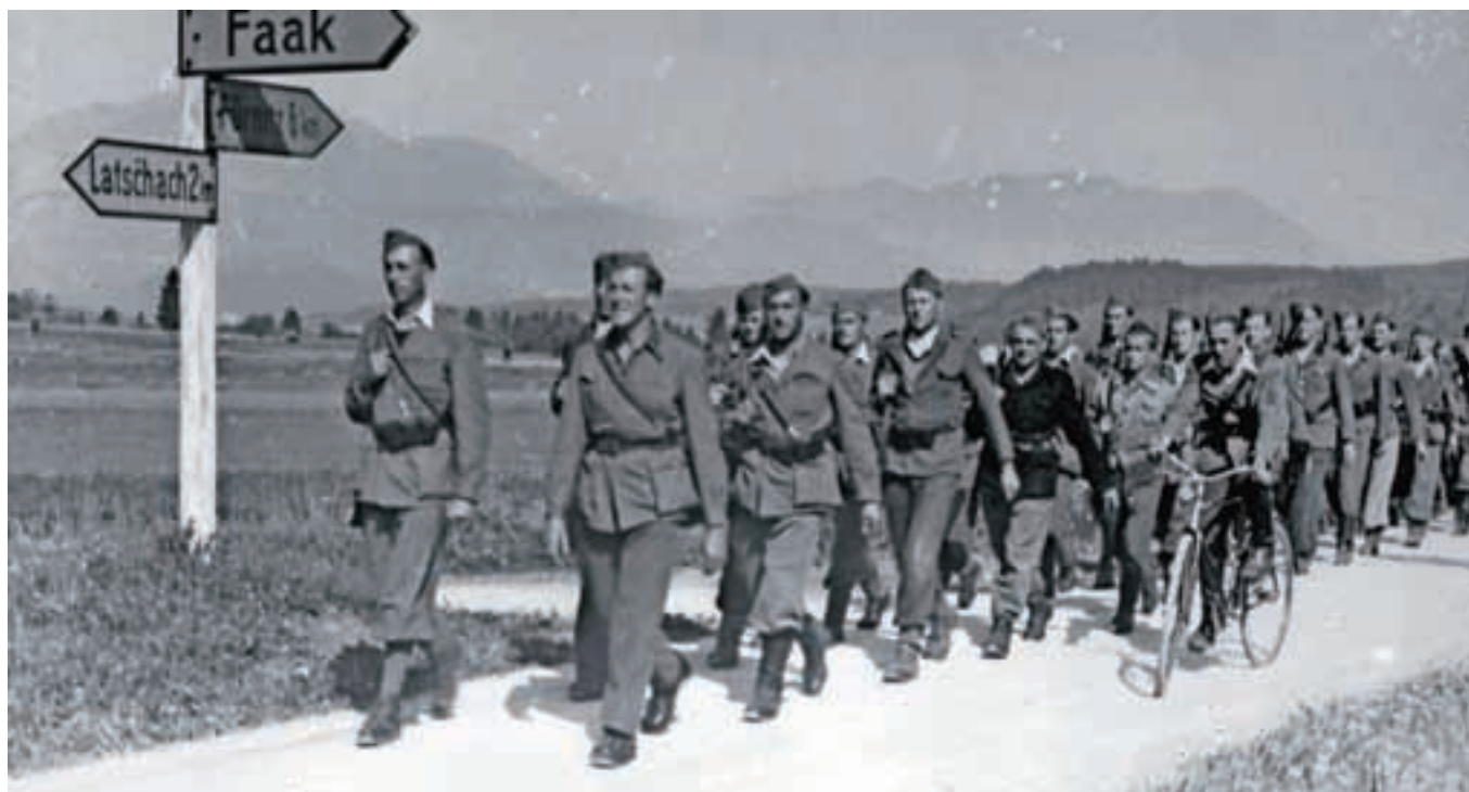
Zmagovalci: Jeseniško-bohinjski odred na Koroškem, maja 1945

Zgodbe iz maja 1945 so res različne. Smo jih 70 let po njihovem nastanku že zmožni kot različne tudi doživljati in sprejemati? Da niso več »naše« in »vaše«, temveč v vsej svoji različnosti pravzaprav vse naše, del naše skupne dediščine.