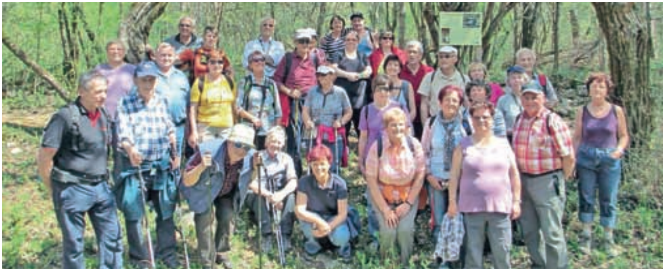
Veronikina skupina se je podala na sprehod po Pliskini poti.