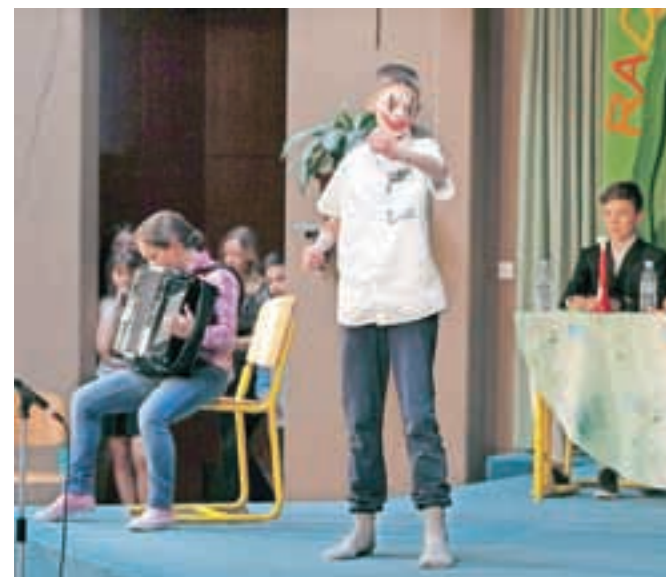
S prireditvijo Radovljica ima talent so na Osnovni šoli A. T. Linharta zbirali sredstva za šolski sklad.

akcijami zbiranja starega papirja in zamaškov zberajo v šolskem skladu, je v osnovi namenjen za pomoč učencem iz socialno šibkejših družin. Sklad sredstva namenja tudi za nakup nadstandardne opreme ter sofinanciranje članarin za različne dejavnosti za otroke iz družin, ki jim tega sicer finančno ne bi mogle omogočiti. Lani se je tako v skladu nabralo okoli trinajst tisoč evrov; z delom sredstev so lahko kupili opremo za tek na smučeh, ki so jo