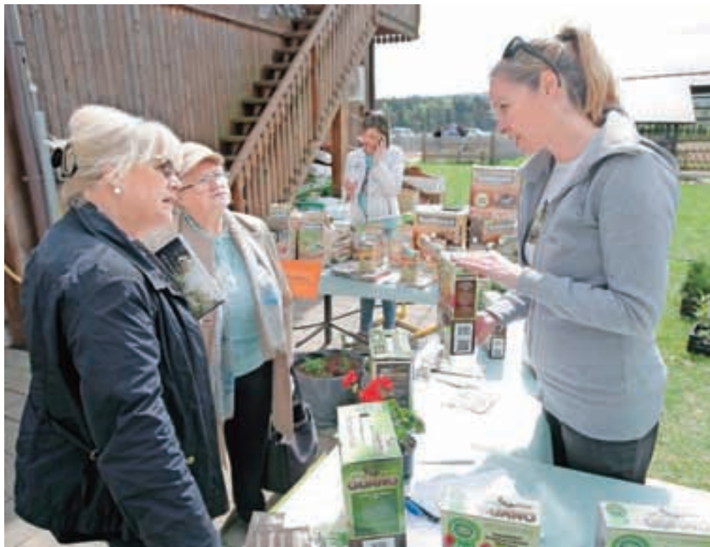
Na dnevu odprtih vrat v Biotehniškem centru Naklo

Strahinj – V Biotehniškem centru Naklo so zopet pripravili dan odprtih vrat, kjer so bodočim dijakom in študentom pa tudi krajanom želeli pokazati, s čim se ukvarjajo. Pripravili so različne stojnice, na katerih so svetovali o zasaditvi, predstavljali svoje izdelke in jih ponujali v pokušino, možnost predstavitve pa so imela tudi različna podjetja, ki s centrom sodelujejo. Obiskovalci so se lahko udeležili tudi vodenega ogleda posestva in cvetlične delavnice in si ogledali razstave o projektih, ki so jih učenci pripravili kot zaključne naloge pri poklicni maturi. Dva učenca sta prodajala čebelje izdelke, izkupiček od prodaje je šel v šolski sklad, en dijak pa je predstavil napravo za ožičenje pašnikov. Osrednji del so bila brezplačna predavanja, na katerih so strokovnjaki s področja kmetijstva, vrtnarstva in živinoreje predavali o različnih temah, zanimivih za dijake in študente ter za obiskovalce, ki so lahko izvedeli marsikaj koristnega o vplivu gnojenja na okolje, o ekološkem in organskem vrtnarjenju, gradnji sodobnih hlevov, negi