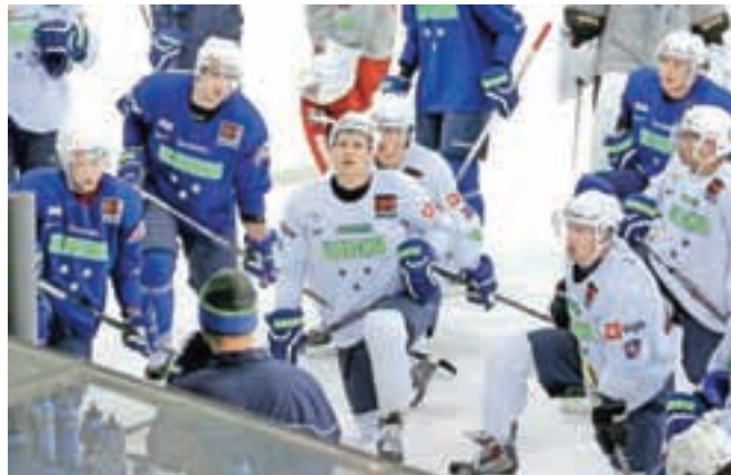
Po zadnjih treningih v Tivoliju so naši hokejisti včeraj odpotovali v Nemčijo.

Po petkovem popoldanskem treningu je strokovni štab reprezentance prečrtal še zadnje ime in določil končni seznam potnikov na