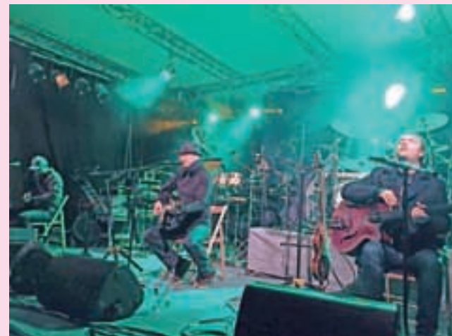
Ker ne verjamem v telo ... : Siddharta na odru Loškega puba

Škofja Loka, Kranj – V Loški pub se je v petek po petnajstih letih vrnila skupina Siddharta, ki prav letos praznuje dvajset let od svojega prvega koncerta – tudi zato je bil koncertni večer poln emocij. Svoje zimele uspešnice v izštekani izvedbi so nadgradili z novejšimi skladbami, občinstvo, ki je do zadnjega kotička napolnilo atrij Loškega puba, pa je