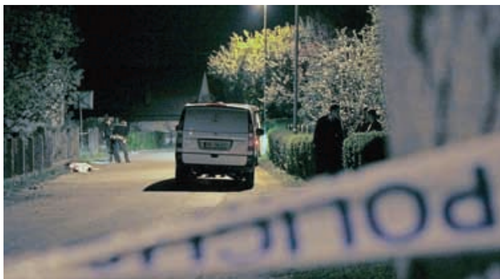
Mladi motorist se je smrtno ponesrečil v vasi Breg ob Savi.

Breg ob Savi – V nedeljo ponoči zvečer se je na Bregu ob Savi zgodila huda prometna nesreča, v kateri je življenje izgubil sedemnajstletni motorist iz okolice Škofje Loke. Na Policijski upravi Kranj so včeraj pojasnili, da je mladi motorist med vožnjo skozi vas iz smeri Jame proti Drulovki zaradi nepriklagovane hitrosti izgubil oblast nad motorjem. Pri tem je padel po tleh in tam obležal, njegovo motorno kolo pa je silovito priletelo v obcestno betonsko ograjo. Sedemnajstletnik, ki je med vožnjo uporabljal zaščitno čelado, je za posledicami hudih poškodb umrl na kraju nesreče. Morebitno prisotnost alkohola bodo ugotavljali v nadaljnji analizi, je