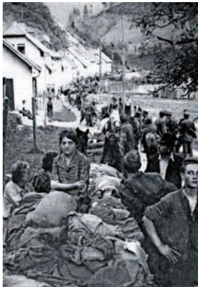
Reka beguncev na cesti od Tržiča proti Ljubelju. Posnetek iz Nove zaveze.