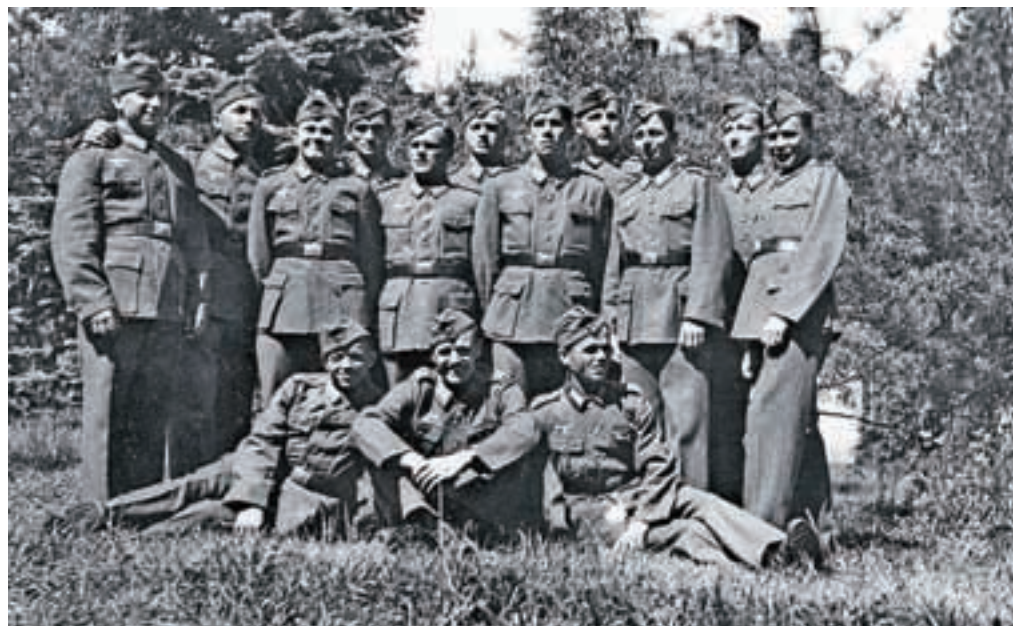
Slovenski mobiliziranci v nemško vojsko.

»Doma so mnoge povratnike iz nemške vojske čakala zasliševanja in zaničevalni izraz švabski vojak in status drugorazrednega državljana. Najhujšo usodo so doživeli tisti, ki so bili dodeljeni enotam SS.«