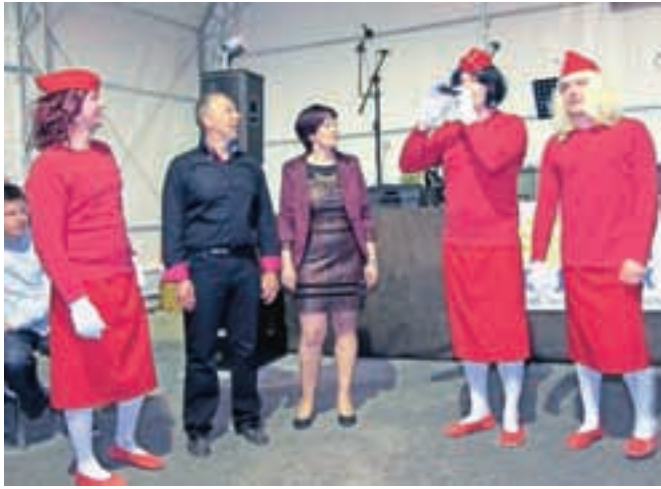
Čestitale so jima tudi »Sestre«.