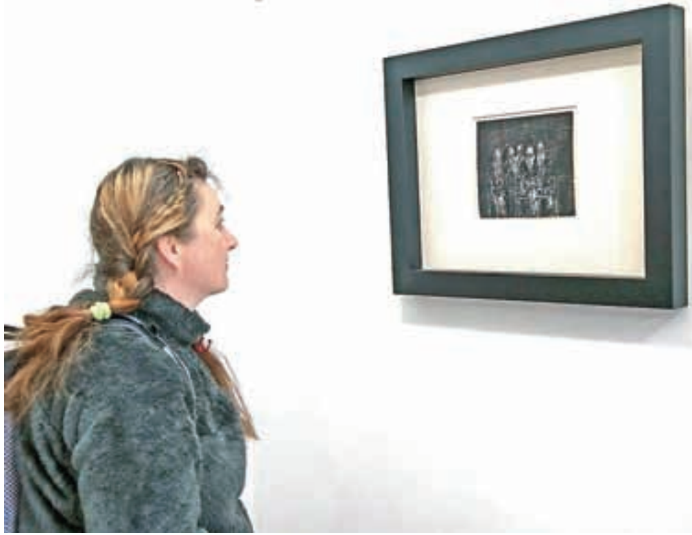
V Galeriji Layerjeve hiše je na ogled dvanajst gvašev Gabrijela Stupice.

Gabrijel Stupica se je rodil v Dražgošah, študiral na akademiji v Zagrebu, leta 1946 se je vrnil v Ljubljano in deloval na novoustanovljeni akademiji, kjer je bil do svoje upokojitve dvakrat tudi rektor. Velja za enega najbolj uveljavljenih umetnikov v