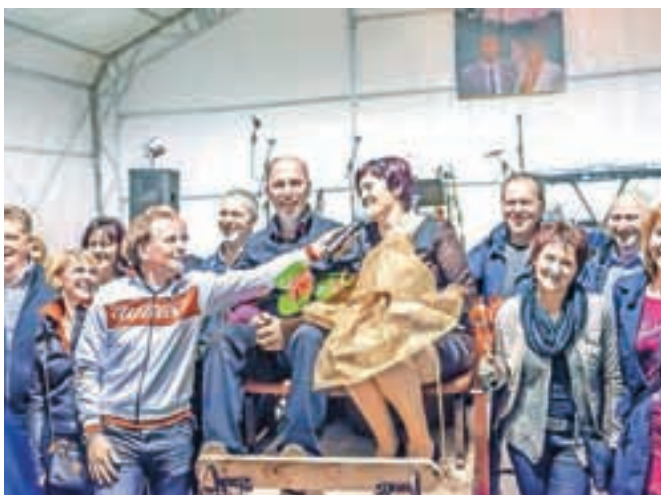
Slavljenca z darilom cerkljanskih obrtnikov