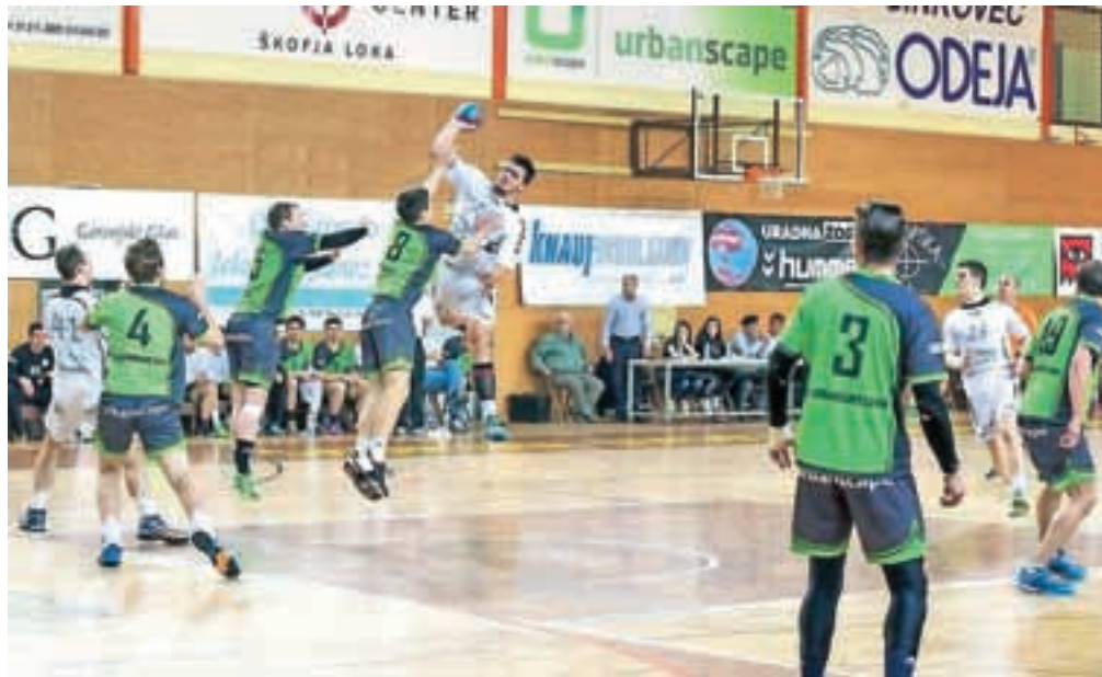
Škofjeloški rokometarji so se na zadnji domači tekmi izkazali tako v napadu kot obrambi.

»Fantje so na tekmi proti ekipi Trima pokazali tisto, kar so se v tej sezoni naučili. Igrali so zrelo, izkazali so se kot moštvo, ki si zasluži igranje med prvoligaši. Kot trener lahko rečem, da so ogromno napredovali, in to je bilo tokrat res videti. Moštvo Trima Trebnje, ki se bori za igranje v končnici štirih najboljših ekip, je bilo favorit, nam pa je uspelo, da smo se res