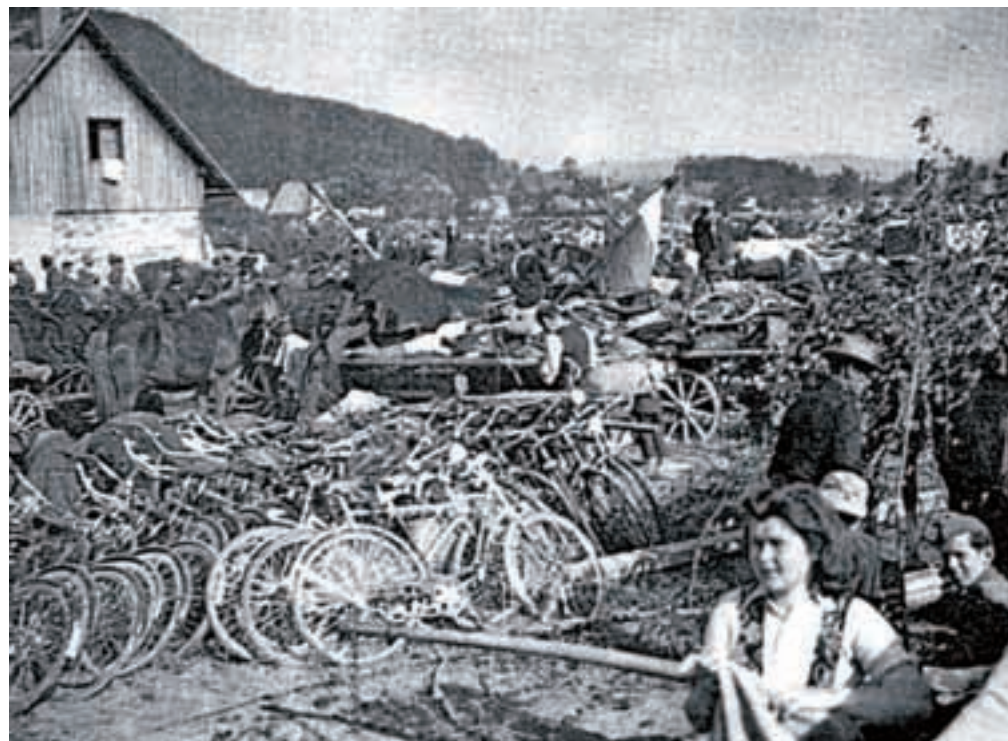
Vetrinjsko polje pri Celovcu, domobrantsko begunsko taborišče. Posnetek iz Nove zaveze.