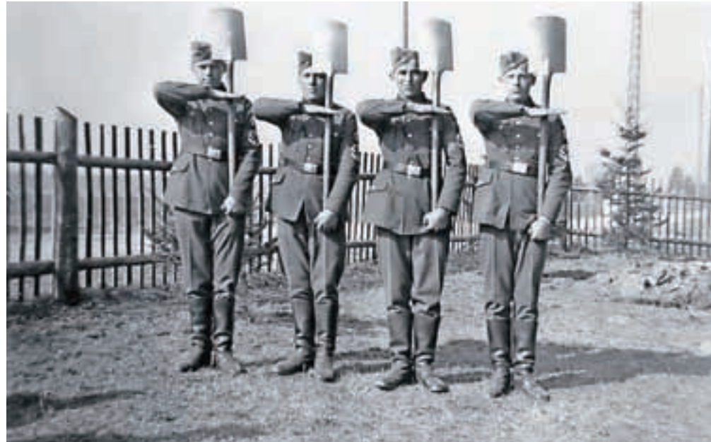
Slovenski mobiliziranci v RAD – Reichsarbeitsdienst