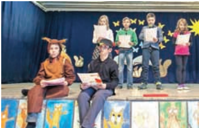
Učenke in učenci so tudi sami predstavili zgodbe oseb s posebnimi potrebami.