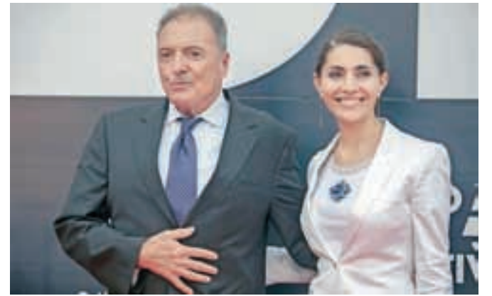
Posebni častni gost lanskega blejskega filmskega festivala je bil tudi igralec Armand Assante – v družbi prelestne italijanske igralka Caterine Murino.

Bled bo med 16. in 20. junijem gostil že drugi filmski festival. Tudi tokrat bo posvečen vodi, in sicer skrbi, upravljanju, ohranjanju ter čiščenju le-te.