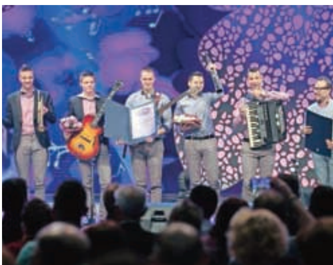
Nagrado za najboljšo polko festivala je prejela skladba Našel te bom v izvedbi Ognjenih muzikantov.

Festival Slovenska polka in valček, ki ga že 20 let prireja Razvedrilni program Televizije Slovenija, sta povezovala Darja Gajšek in Blaž Švab.