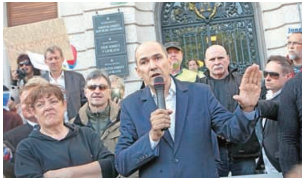
Janez Janša je v petek pred ljubljansko sodno palačo nagovoril približno 1500 zbranih vztrajnikov.