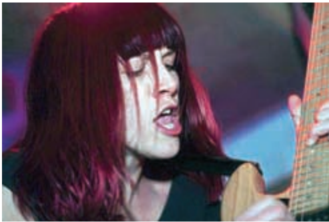
Prvinsko koncertno doživetje: skupina Punčke

rock/post-punk zasedbe Punčke, ki so prej že delile oder s Queens Of The Stone Age, si ustvarile prepoznan kulturni status, tudi tokrat pa poskrbele za neponovljivo koncertno doživetje. Naslednji dogodek organizatorji obljublajo v juniju.