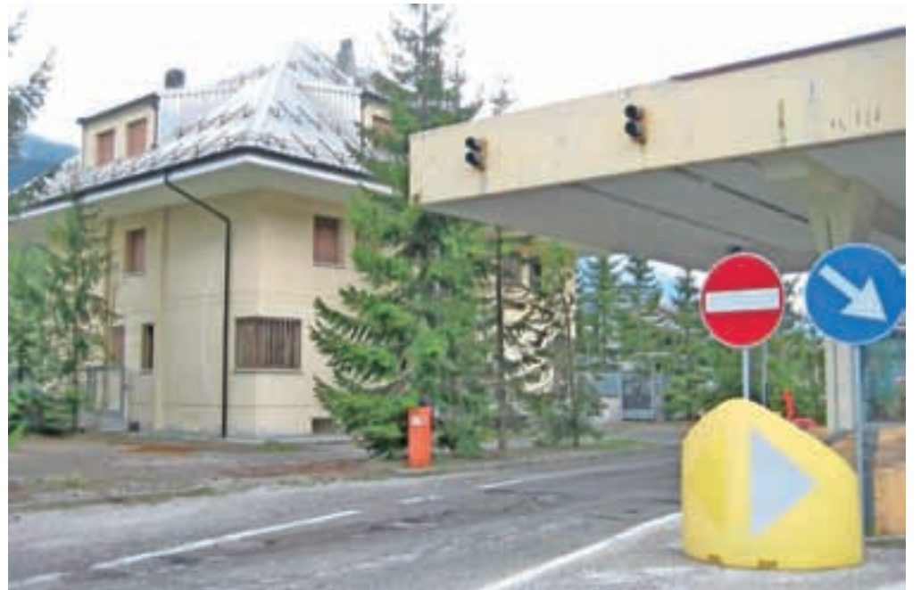
Italija namerava v stavbi nekdanje stražarnice na meji s Slovenijo urediti center, v katerega bi namestili okoli štirideset beguncev.