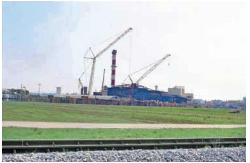
Na severozahodni strani proizvodnega kompleksa podjetja Knauf Insulation bodo zgradili kisikarno.