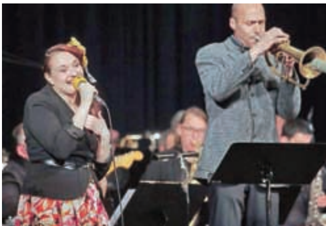
Na odru kulturnega doma pri Svetem Duhu je navdušila tudi priljubljena Bilbi.