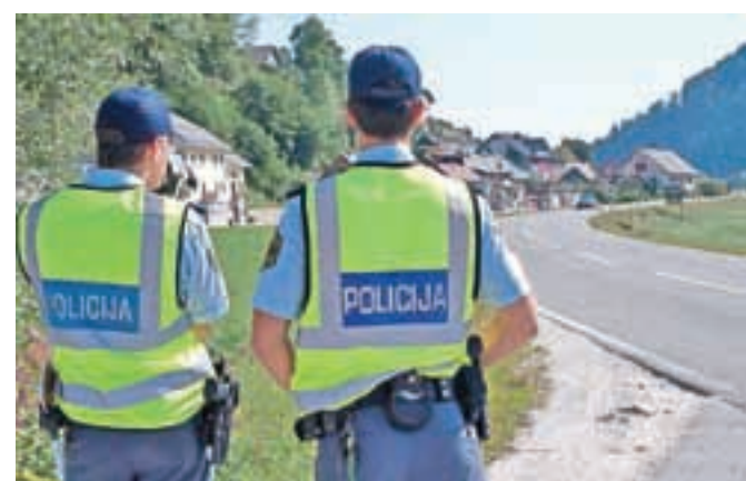
V četrtek bodo policisti na prehitre voznike prežali na okoli sedemsto nadzornih točkah po državi.

Nekatere evropske države so doslej tovrstne maratone izvajale na nacionalni ravni, v večini primerov pa naj bi takšne aktivnosti tudi izboljšale prometno varnost. Po podatkih nemške policije je bilo v dneh, ko so njihovi policisti izvajali takšne nadzore, zelo malo prekoračitev hitrosti,