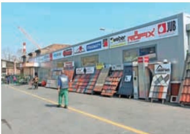
Z naložbo so pridobili nove skladiščne in prodajne prostore.

cvetličarno, poslovalnico je prenovila še Deželna banka Slovenije. V trgovini ponujajo izdelke vseh svojih blagovnih znamk: mleko in mlečne izdelke iz Loške mlekarne, izdelke Loških mesnin, ki so se ob klanju živine za lastne potrebe in za kmete specializirale za prodajo sveže slovenske govedine, izdelke iz dopolnilnih dejavnosti kmetij, ki sodijo v Domači kotiček, ter izdelke iz Mesnin Bohinj, to je iz bohinjskega obrata, kjer so v zadnjih letih obnovili objekt in posodobili proizvodnjo. V zadrugi so še posebej ponosni na Domači kotiček. »Če je bilo še pred leti nekaj dvomov, ali bo prodaja uspešna, zdaj dileme ni več: s prodajo smo zelo zadovoljni. Nekatere kmetije v