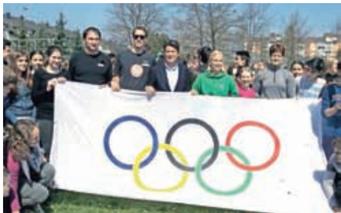
Ob slovenskih atletih je kranjske šolarje v petek obiskal tudi slaviti Sebastian Coe.