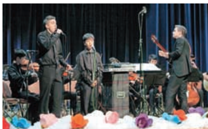
Pihalni orkester Šenčur je gostil glasbenike z Nove Zelandije.