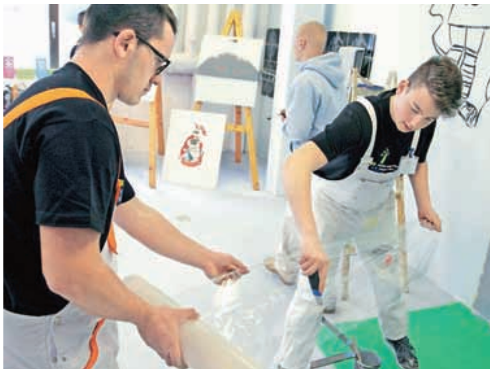
Za poklic slikopleskarja med mladimi ni veliko zanimanja.