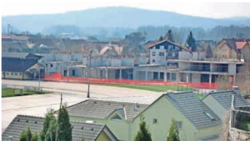
Nedokončan poslovno-stanovanjski objekt Center Komenda je od petka naprodaj po izhodiščni ceni 2,8 milijona evrov.

Okrožno sodišče v Ljubljani je sicer ravno minuli petek objavilo sklep o prodaji nedokončanega objekta