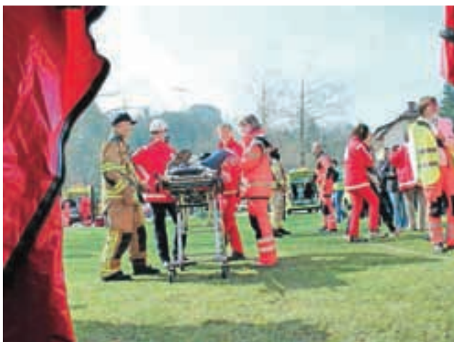
Poškodovance so z reševalnimi vozili prevažali v triažni center v športnem parku na Bledu.

tega prispevka, tako da smo lahko neposredno izkusili potek reševanja in nadaljnje obravnave. Dragocena izkušnja nas ni pustila ravnodušnih, saj smo na lastni koži, sicer brez strahu, ki bi bil prisoten v resnični situaciji, lahko izkusili reševalne postopke, pristop reševalcev, njihovo prijaznost in pripravljenost ter težavnost njihovega dela. Kljub izvrstnemu vzmetenju in dobremu oblaženju transportnega vozila pa so luknjaste ceste vsem ostale najbolj v spominu, še posebej ob misli na tiste, ki jih izkušajo resnično bolni ali poškodovani.