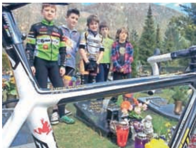
Na Juretovem grobu v Kranjski Gori

Jesenice – Ekstremni kolesar Jure Robič, ki je pred petimi leti tragično preminil v prometni nesreči nad Jesenicami, bi v teh dneh dopolnil petdeset let. Že vse od njegove prezgodnje smrti njegovi prijatelji vsako leto pripravijo kolesarjenje, s katerim se spominjajo tega izjemnega športnika in prijatelja. Letos so se zbrali minulo nedeljo, in sicer na petem kolesarskem izletu Za Jureta 2015, ki je potekal v organizaciji Zavoda za šport Jesenice. Kolesarili so od dvorane Podmežakla na Jesenicah do pokopališča v Kranjski Gori, kjer je Jure pokopan. Vmes so se ustavili tudi v Gozdu - Martuljku pri obeležju, ki ga je postavila Občina Kranjska Gora in označuje kolesarsko stezo Jureta Robiča. Namesto startnine so zbirali prostovoljne prispevke za Fundacijo Jure Robič, namenili pa jih bodo akciji Juhuhu, kolo je tu, v kateri podarjajo kolesa otrokom iz socialno šibkih družin, ki so si kolesa zaslužili s svojo pridnostjo v šoli.