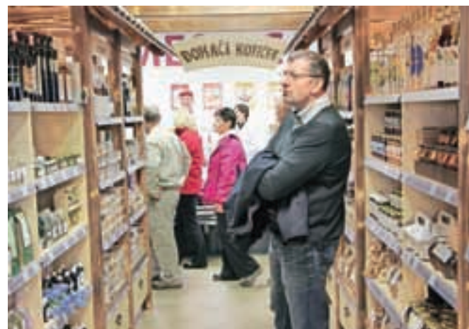
V Centru Trata ima pomembno mesto tudi Domači kotiček.

enega od glavnih ciljev, to je, da čim več kmetovih pridelkov predela in jih ponudi potrošnikom. Tudi novozgrajeno skladišče reprodukcijskega materiala dobiva vse bolj kmetijsko gozdarski