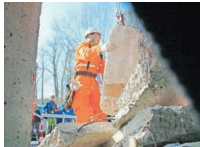
Reševanje iz ruševine skozi oči in fotoobjektiv ujetega ponesrečenca