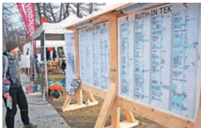
Tabla, na katero so udeleženci teka beležili število krogov, ki so jih pretekli ali prehodili okoli Blejskega jezera, je bila polna na obeh straneh.

Organizatorji pravijo, da je tek tradicionalen in bo znova potekal prihodnje leto.