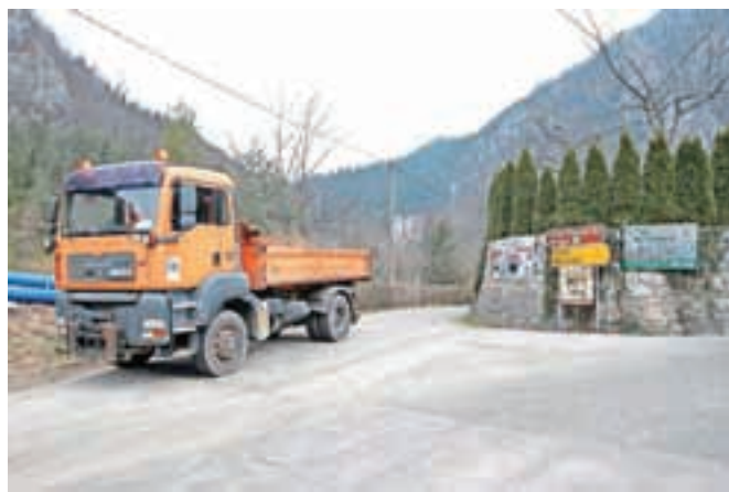
Od jutri naprej bo državna cesta skozi Begunje na več odsekih popolnoma zaprta.

Begunje – Od jutri dalje pa vse do konca aprila bo državna cesta skozi Begunje zaradi nadaljevanja gradnje kanalizacije na več različnih odsekih popolnoma zaprta. Cesta od hišne številke 115 do hišne številke 126 bo zaprta v celotnem obdobju dveh mesecev; stanovalce bodo o možnostih dostopa sproti obveščali izvajalci. Odsek ceste v križišču za dolino Drage bo zaprt od jutri do 1. aprila. Dostop z osebnimi vozili bo v dolino Drage možen vsak dan od 17. ure dalje do 7.30 zjutraj. Po ureditvi križišča za dolino Drage bo cesta v tem delu prevozna do Trziča, zaprta pa bo cesta v dolino Drage; dostop v dolino bo mogoč le posamezne dni v marcu, tako med tednom kot ob koncih tedna. Dostop do objektov med obema zaporoma bo urejen po krajevni cesti za Tiskarno Žbogar. Obračališče bo v priključku krajevne na državno cesto na Trati. Za stanovalce iz Drage bodo ob državni cesti uredili začasno parkirišče.