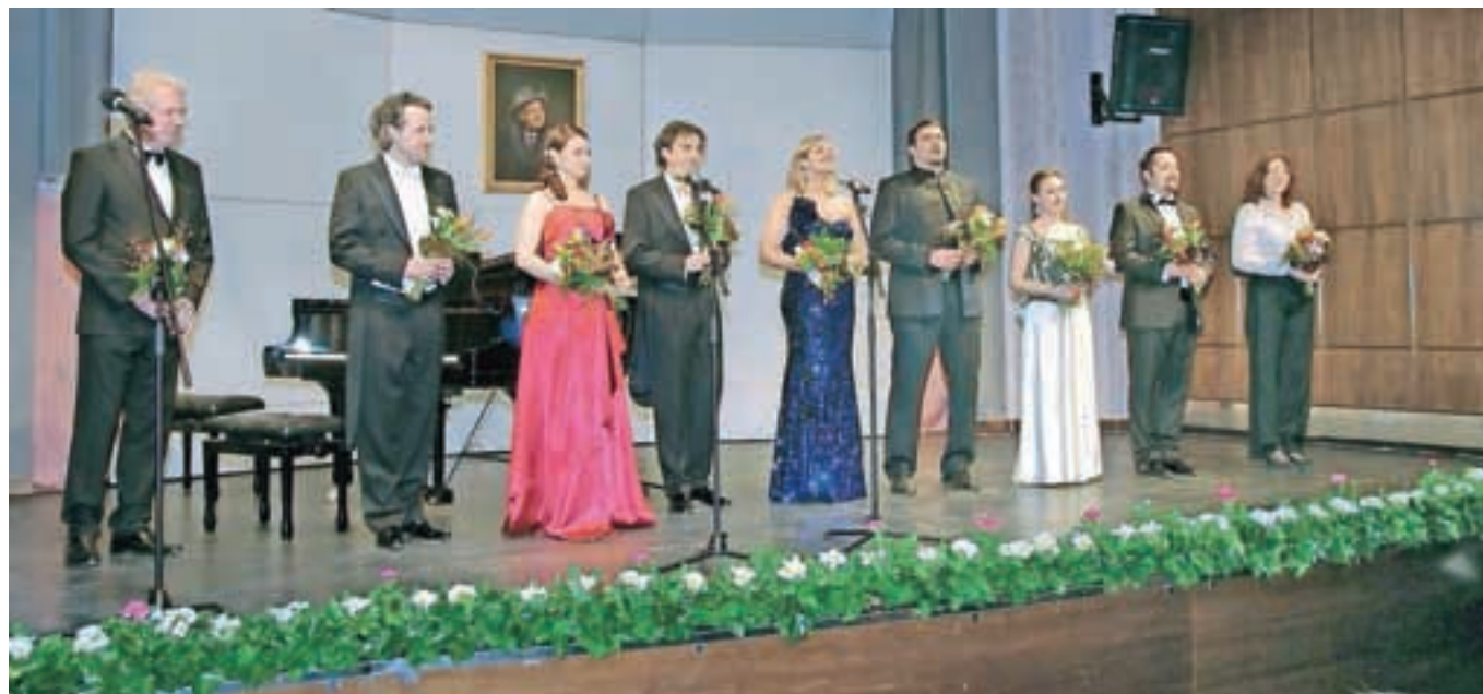
Na koncertih, ki spremljajo Gostičeve dneve, vsako leto sodelujejo vrhunski slovenski in hrvaški umetniki vseh generacij. Fotografija je z lanskoletnega slavnostnega koncerta.