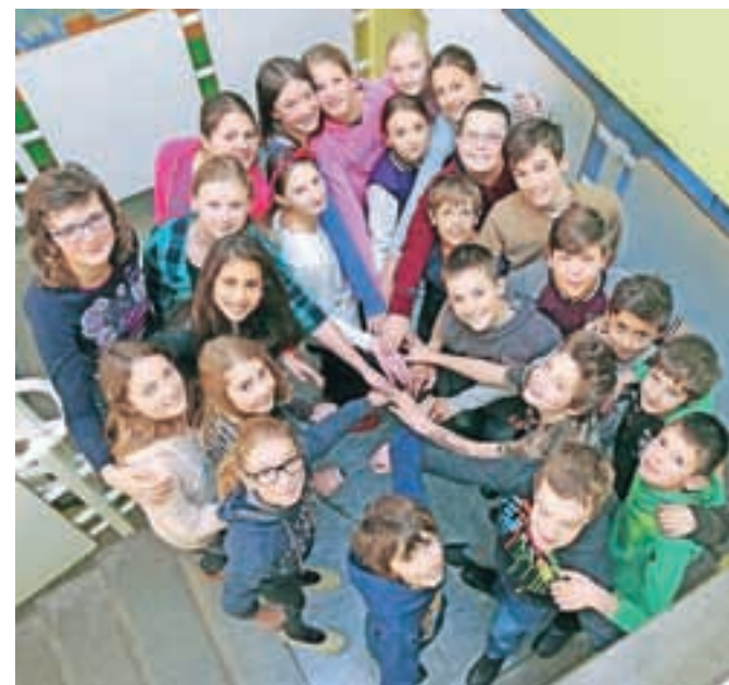
Učenci 6. č so povedali, da žal beseda najbolj boli. Ne z nasiljem, s prijaznostjo in pomočjo dobiš prijatelja, so še dodali.

Vsi v 6. č pa so se strinjali, da pa žal beseda najbolj boli. OŠ Simona Jenka Kranja je sicer partnerica v enoletnem projektu Sistemski pristop k medvrstniškemu nasilju v vzgojno-izobraževalnih zavodih, s katerim so uspešno kandidirali za sredstva Norveškega finančnega mehanizma. V projektu niso zato, ker bi bila šola 'problematična', ampak zato, ker so vodstvo in učitelji OŠ Simona Jenka Kranj pokazali veliko pripravljenosti za ukvarjanje s tem širšim družbenim problemom.