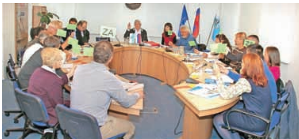
Občinski svet v Bohinju je soglasno odredil podporo načrtu upravljanja Triglavskega narodnega parka in zahteva ne le spremembo upravljavskega načrta, temveč tudi spremembo Zakona o TNP.