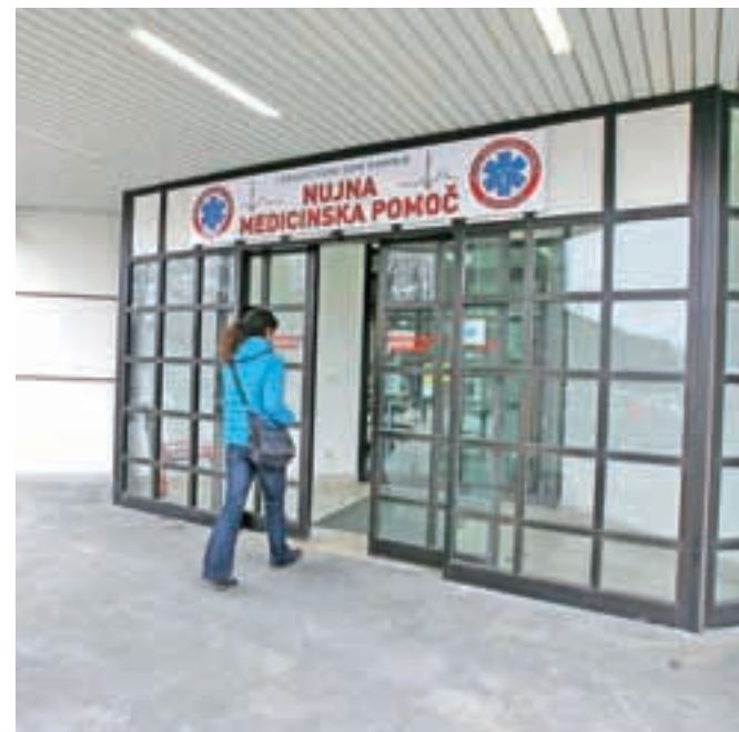
Služba nujne medicinske pomoči v Zdravstvenem domu dr. Julija Polca v Kamniku za zdaj ostaja.

V občinah Kamnik in Komenda so občani prispevali okoli sedem tisoč podpisov proti ukinitvi službe nujne medicinske pomoči v Kamniku. Kot kaže, jih bodo na ministrstvu uslišali.