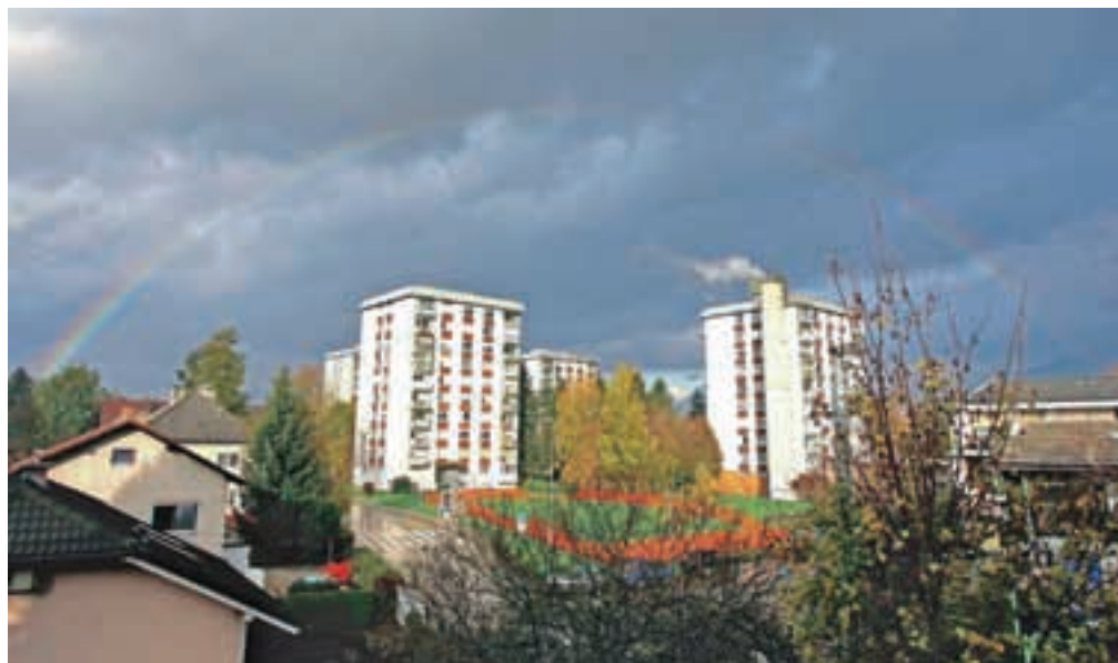
Z uvedbo energetskih izkaznic so zadovoljni predvsem lastniki varčnih nepremičnin, saj le-te zdaj lažje prodajo.

Kot rečeno, pa so energetske izkaznice že od novega leta obvezne pri oglaševanju nepremičnin. Zaradi zagrožene globe v višini 250 evrov so nekateri lastniki oglase raje umaknili. Število oglasov na največjem spletnem