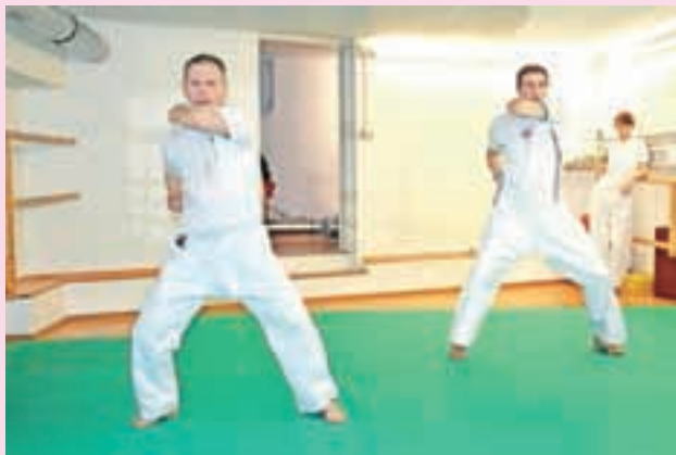
Kot karateist na vsakem treningu da vse od sebe.