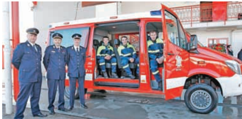
Gasilci PGD Britof so z novim vozilom bolje opremljeni.