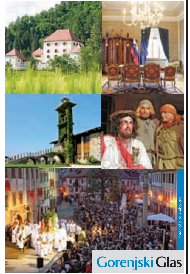
Fotografije so simbolične

Za odjave, ki prispejo kasneje od četrtka, 2. aprila 2015, do 10. ure, zaračunamo potne stroške.