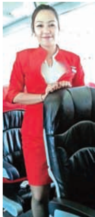
Ljubka stevardesa z Air Asia

Tu sem se prvič srečala s filipinskim bankomatom,