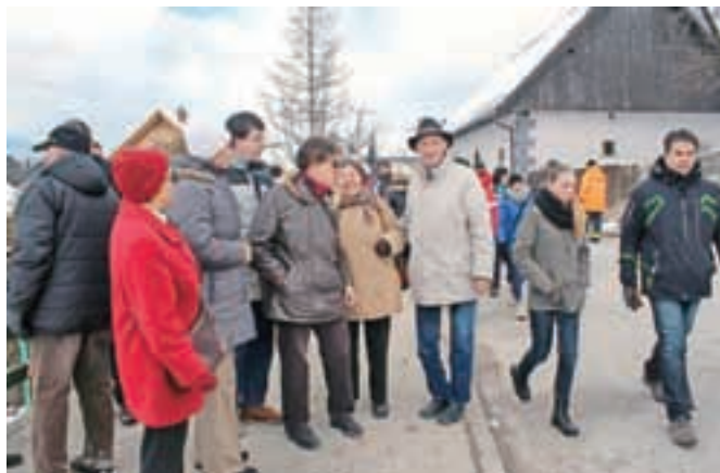
Člani krožka Medobčinskega društva slepih in slabovidnih Kranj na poti kulturne dediščine