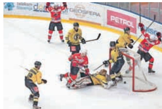
Jeseničani so oba zadetka za zmago dosegli v zadnji tretjini.

Kranj – V soboto so odigrali štiri tekme v razigravanju v Internacionalni hokejski ligi INL. V ledeni dvorani Podmežakla sta se pomerila domači Sij Acroni Jesenice in zaloška Playboy Slavija. V izenačenem boju so na koncu slavili domači hokejisti, ki so zmagali z 2 : 1 (0 : 0, 0 : 1, 2 : 0). Jeseničani so težje prišli do zmage kot na dosedanjih dveh srečanjih v rednem delu lige INL in državnega prvenstva, saj so si zmago zagotovili šele v zadnji tretjini, ki so jo dobili z 2 : 0, zadela pa sta Nejc Berlisk in Aleš Remar. Drugo tekmo, igra se na štiri zmage, bodo odigrali že jutri v Zalogu z začetkom ob 19.30. Zanimivi obračuni so se odigrali v Avstriji. Eishockeyclub Zell am See je s 6:4 premagal Die Adler Kitzbuhel, Lorenz Lift VEU Feldkirch z 5:3 Steelers Kapfenberg, srečanje med Alge Elastic Lustenau in Bregenzerwaldom pa se je končalo z zmago domačinov s 3:0.