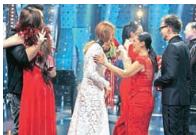
Zmagovalcema so med prvimi čestitali gostitelji izbora.