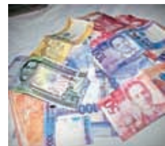
Pisana 'papirnata' družina

Panay je eden izmed številnih filipinskih otokov. Večina popotnikov pozna mesto Iloilo. Če se odpravljajo na znameniti Boracay – majhen sosednji otočni turistični zaklad – pa največkrat pristanejo na severu Panaya v Kalibu, od koder potem pot nadaljujejo do pristanišča v Caticlanu in se z vodnim taksijem odpeljejo do dva kilometra oddaljenega Boracaya