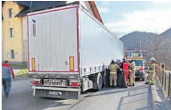
V nesreči je umrl 49-letni domačin.

Na Koroški Beli se je v četrtek popoldne zgodila huda prometna nesreča, v kateri je umrl 49-letni pešec, ki ga je povozil tovornjak.