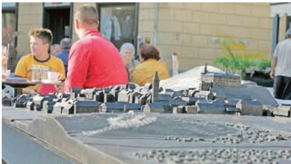
Relief ob vstopu v staro mestno jedro zgodovinske Škofje Loke

V programu združenja so predvideli srečanja s slovenskimi poslanci v evropskem parlamentu, s čimer imajo že dobre izkušnje. Skupaj z Zavodom za varstvo kulturne dediščine in Fakulteto za arhitekturo bodo izvajali delavnice šole prenovalcev. Skupno nameravajo nastopiti na evropskih razpisih, pri tem pa se bodo osredotočili na teme, kot so energetska varčnost, kulturni programi, socialno podjetništvo, varovanje okolja ... Ker je pri tem dobro imeti partnerje iz drugih držav, se bo združenje povezovalo s sorodnimi asociacijami v tujini. Posodobili bodo strategijo trženja zgodovinskih mest, načrtujejo promocijo na tujih turističnih