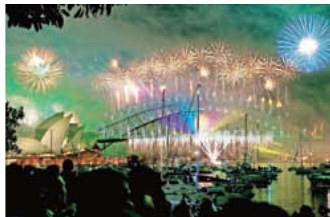
Sydney je zaradi časovnih razlik prvo od svetovnih velemest, ki pričaka novo leto.

»Božiček je tako dobre volje predvsem zato, ker ve, kje živi vsa poredna dekleta.« To je izjavil ameriški »stand up« komik George Carlin (1937–2008). Victor Borge (1909–2000), pri nas neznan danški humorist, skladatelj in dirigent, pa je menil: »Božiček je imel pravo idejo. Ljudi obišči po enkrat na leto.« Po vseh obiskovanjih v prazničnih dneh se zdi, da je imel kar prav