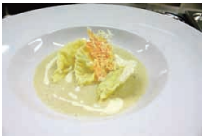
Simpatični testeninski krožnik s prav zanimivo omako iz artičok / Foto: AB