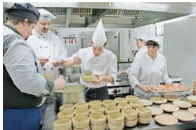
Danes se zmagovalec kulinaričnega šova dobro znajde tako v vlogi kuharja kot šefa kuhinje. Timsko delo mu leži.