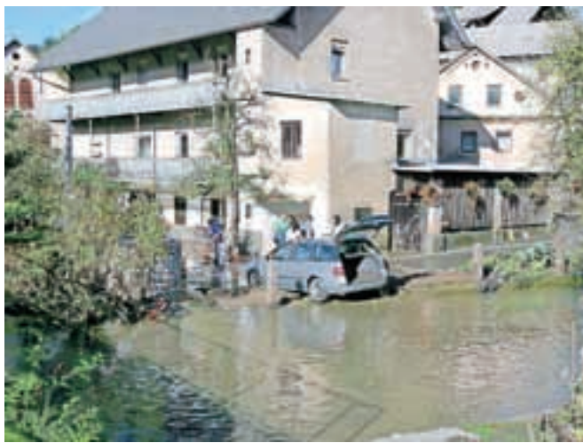
Največ klicev na pomoč je bilo ob snegolomu in poplavah.

Skrinjar zaključuje, da občutki, da se je v zadnjih letih občutno povečalo število naravnih nesreč, niso varljivi: »Ne le da je takšnih dogodkov vse več, temveč se občutno povečuje predvsem intenziteta nesreč ter škoda, ki jo povzročajo, na primer toča ali poplave. S spremembami vremena se bo treba naučiti živeti, redno skrbeti za vodotoke, ter s tem preprečevati ali omejevati poplave in drugo.«