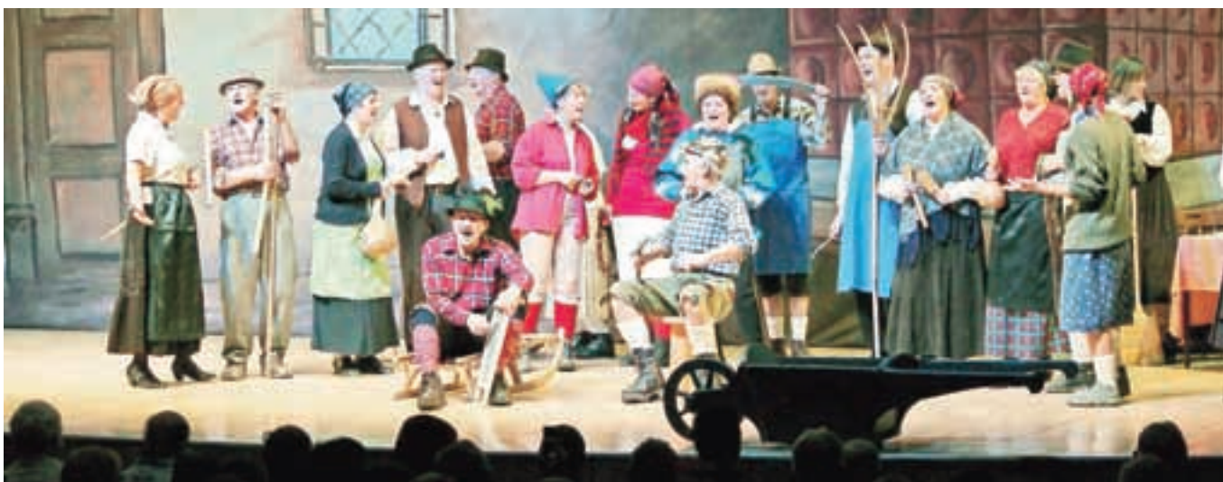
Drugi del prireditve Veselo po domače se je začel z zanimivo, humorno, plesno-igrano točko. Po starem ...