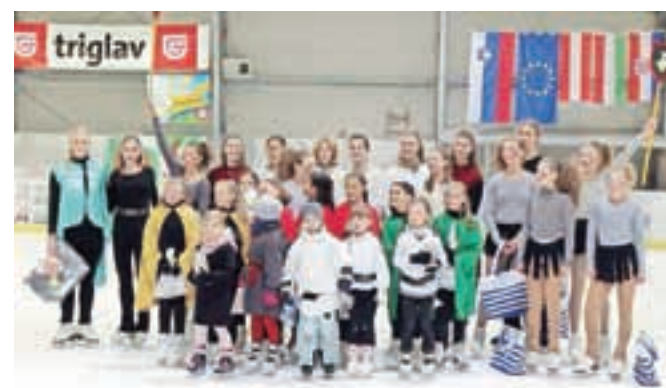
Mladi drsalci in drsalke so na ledu pokazali veliko znanja in spretnosti in si vsi skupaj zaslužili glasen aplavz.

tribune, v svojem nastopu pa so se oprli na velike književne in filmske uspešnice, kot so Gospodar prstanov, Hobit, Kralj Artur in vitezi okrogle mize ter z njimi povezane zgodbe o Keltih, Vikingih in skorajda pozabljenih bitjih. Predstavile so se skupine različnih starosti, vsi skupaj pa so na koncu poželi navdušen aplavz.