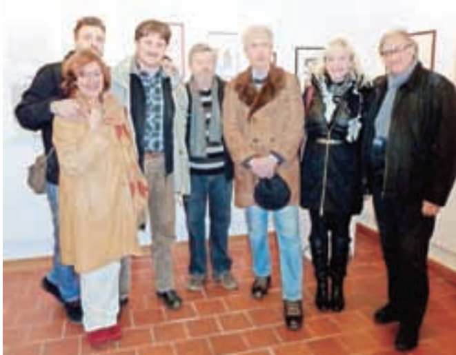
Nekateri od članov društva na odprtju razstave v Mali galeriji

Člani Likovnega društva Kranj se predstavljajo na tradicionalni novoletni razstavi.