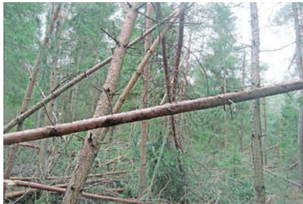
Lastniki so pri spravilu poškodovanega drevja dali prednost iglavcem.

predstavitve varnega dela v poškodovanih gozdovih in še dva dvodnevna tečaja za varno delo z motorno žago, v kranjski enoti pa tri tečaje za varno delo v poškodovanih gozdovih ter tri tridnevne začetne in en dvodnevni nadaljevalni tečaj. V obeh enotah se je tečajev udeležilo skupno 363 ljudi.