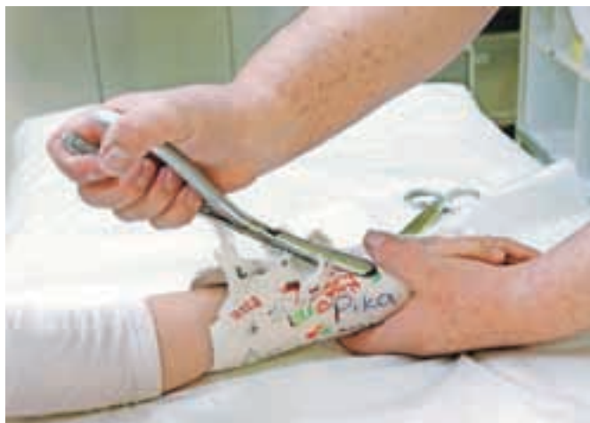
V ledeno mrzlih zimskih dneh zdravniki oskrbijo tudi po trikrat več poškodovanih kot običajno.

mirna, je v četrtek dopoldan povedal Robert Carotta. »Med deseto zvečer in šesto zjutraj smo imeli deset obravnav, med njimi, kako značilno, en zlom kolka, en zlomljen gleženj in eno zlomljeno zapestje.«