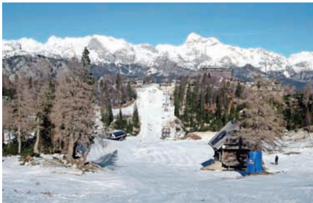
Idilični razgled, ki je bil pred nekaj dnevi bolj klavrn snežen.

verigo več kot le balzam za dušo; srce ti preprosto zai-gra in navda z energijo, srečo in veseljem. Od zgornje postaje Orlove glave sem se sprehodila še malce naprej, kjer je zgornja postaja sedežnice Zadnji Vogel. Tam sem s smučiči snela pse in odsmučala do planine Zadnji Vogel. Kamenja skorajda ni bilo, sneg pa precej trd, tako da je bilo kasneje vzpenjanje po taistem smučišču precej naporno. S sretniči bi šlo precej lažje. Nadaljevala sem pot do Šije in ves čas občudovala verigo Spodnjih bohinjskih gora. Rodica na levi strani je vabila, ravno tako je vabil Vogel, a ta dan ne eden niti drugi nista bila v planu. V planu je bilo le tapkanje po Voglu, srkanje vitamina D in uživanje na polno. Na vrh Šije sem se podala peš; mi duša ni dala miru,