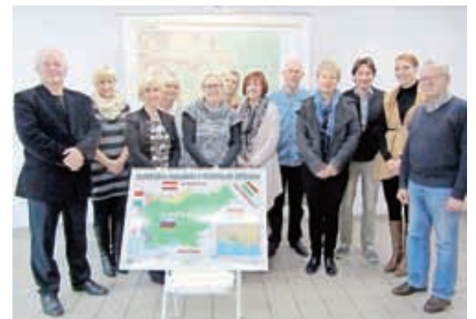
Udeleženci ljubeljskega seminarja o Slovencih v zamejstvu

in Labotske doline, ki leži na vzhodu. Skupna misel govorcev je bila, da je treba Koroško obiskati, brez strahu in manjvrednostnega občutka, in predvsem govoriti slovensko. Če bomo Slovenci iz Slovenije na Koroškem in tudi v drugih sosednjih državah govorili slovensko, bomo dali svojemu jeziku večji pomen in dokazovali, da sta tamkajšnja stvarnost dva enakopravna deželna jezika in da Slovenci niso posamezniki, ki so v tem delu Evrope tujci, ki so se od nekoč preselili. Naše zanimanje za zamejstvo bo povzročilo tudi nasprotni učinek, so povedali na seminarju. Povečalo se bo tudi zanimanje Italijanov, Avstrijcev in Madžarov in Hrvatov za Slovenijo. Skoraj neverjetno, vendar resnično je, da številni Korošci ne vedo (ali nočejo) vedeti