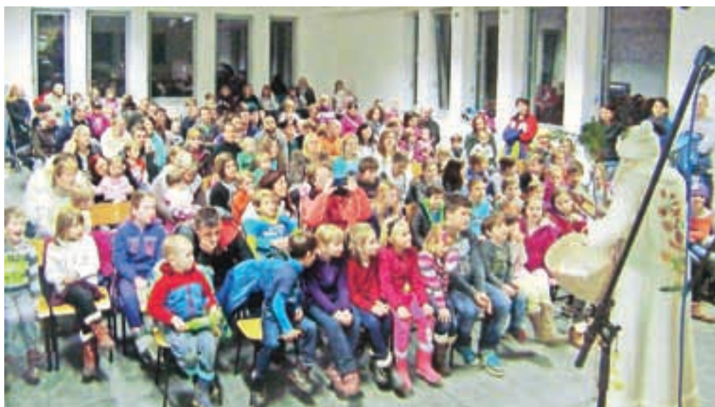
Dedek Mraz prvič v novi večnamenski dvorani v Kovorju