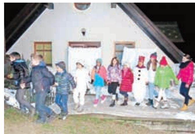
Zaključni prizor s Sveto nočjo in odhodom v cerkev