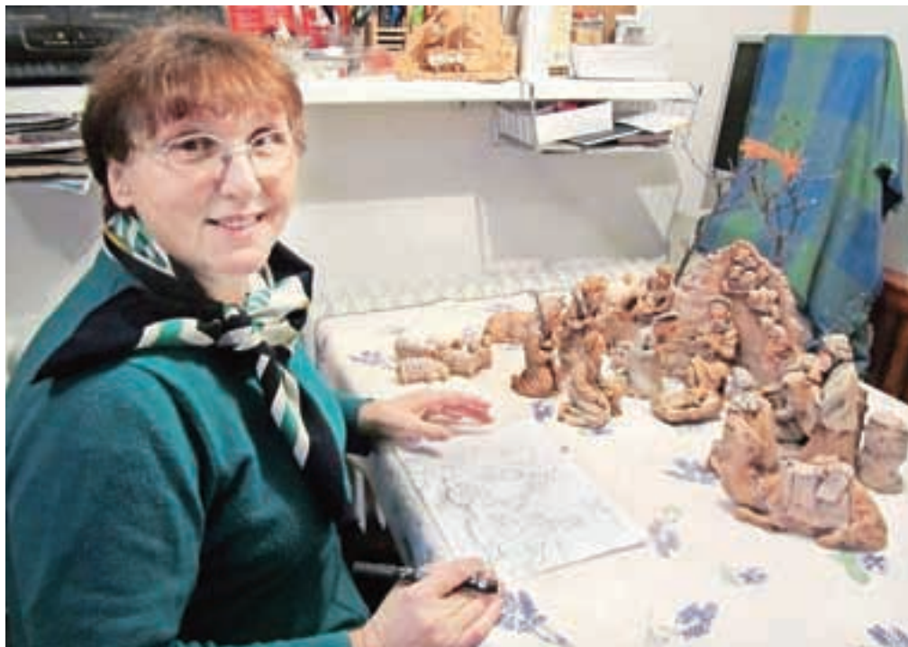
Anine jasllice najprej zaživijo na papirju, potem pa v glini.

Obiskovalcu njenega doma je pripravljena doživeto pripovedovati o svojem