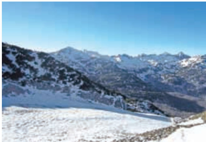
Greben od Vogla proti Tolminskemu Kuku

Nadmorska višina: 1880 m Višinska razlika: cca 800 m Trajanje: 4 ure Zahtevnost: ★★★★★