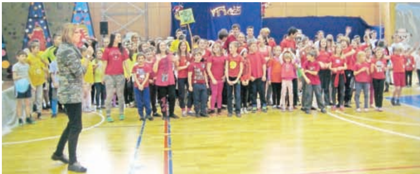
Nastopajoči Skale, Petelini in Zmaji