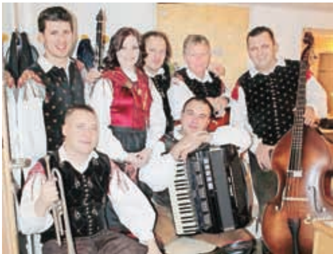
Ansambel Gorenjski kvintet / Foto: AB

Televizijsko oddajo Gostilna pr Francet pa lahko gledate na različnih regionalnih televizijskih kanalih. Tokrat jo lahko spremljate tudi v živo: snemali jo bodo jutri popoldne v kulturnem domu v Sori pri Medvodah. Poleg številnih glasbenih in plesnih nastopov boste izvedeli tudi, kaj se zanimivega dogaja in se bo dogajalo v Medvodah in njihovi bližnji ter daljni okolici.