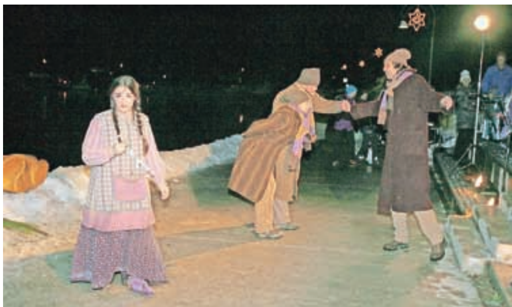
Za konec je ekipa gledališča Ane Monro pod tribunami v Veliki Zaki uprizorila Deklico z vžigalicami.

nas tudi dobro vzdušje,« se je še zasmejala.