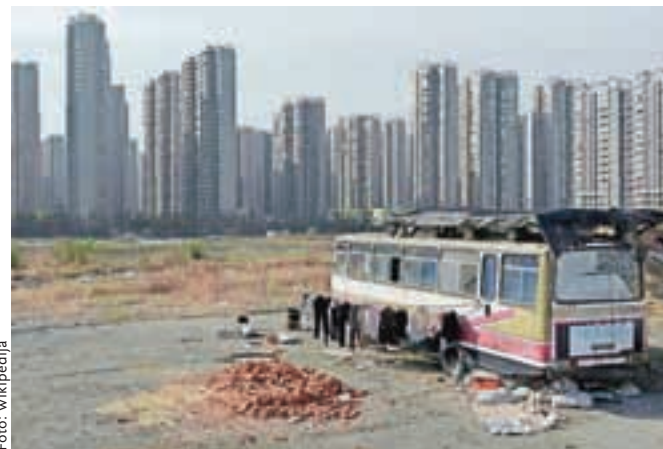
Kitajska se razvija tako hitro, da takih prizorov ne manjka.