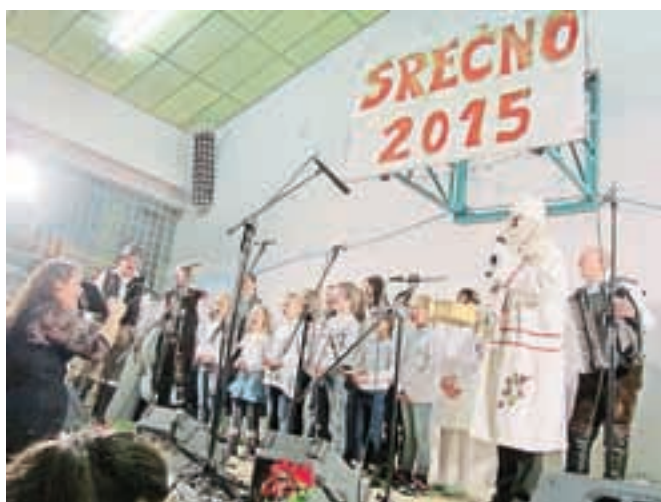
Trsteniški otroški pevki zbor z Dedkom Mrazom in glasbeniki Avsenikovega hišnega ansambla