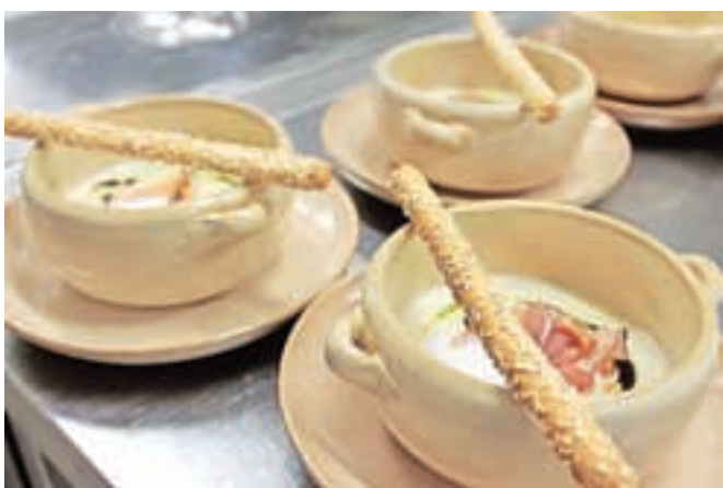
Okusna kremna juha iz polente z bučnimi semeni, skutnim žličnikom, peno iz kislega mleka in grisinom