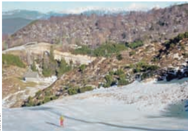
Se je dalo vijugati ... v tem delu resda bolj med kamenčki.