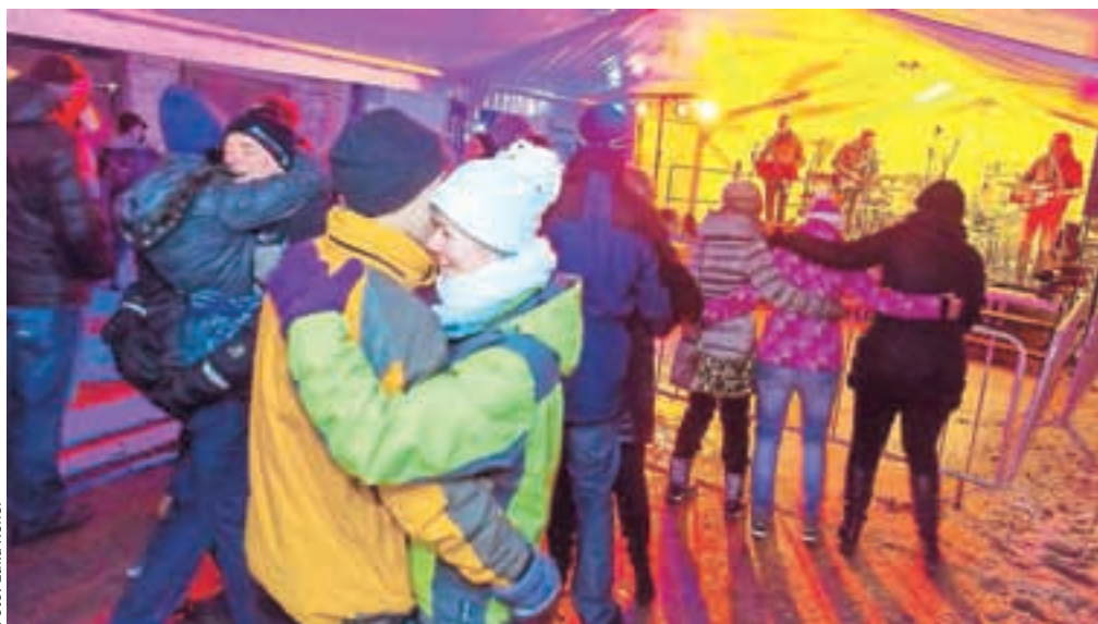
Na silvestrovo je bilo živahno po večini krajev, dobre volje pa so zaplesali tudi v Trzinu.

župan Trilar ter dodal, da je na silvestrovo čas za dobro voljo, lepe želje in tudi upanje.