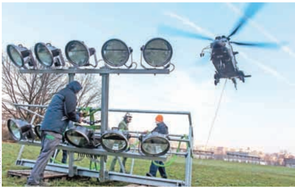
Dolgo pričakovane žaromete so še pred prazniki vendarle pripeljali na Gorenjo Savo.

Lani so lastniki – Smučarska zveza Slovenije, Mestna občina Kranj in SSK Triglav Kranj, vendarle dosegli dogovor in pri Smučarski zvezi Slovenije, ki je upravljevalec skakalnice, so se se znova lotili investicije, tako da naj bi skakalnico v naslednjih dneh že osvetlili žarometi.