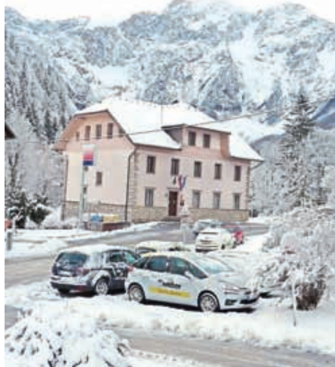
Za rekonstrukcijo stavbe Storžič so pripravljene dokumenti.