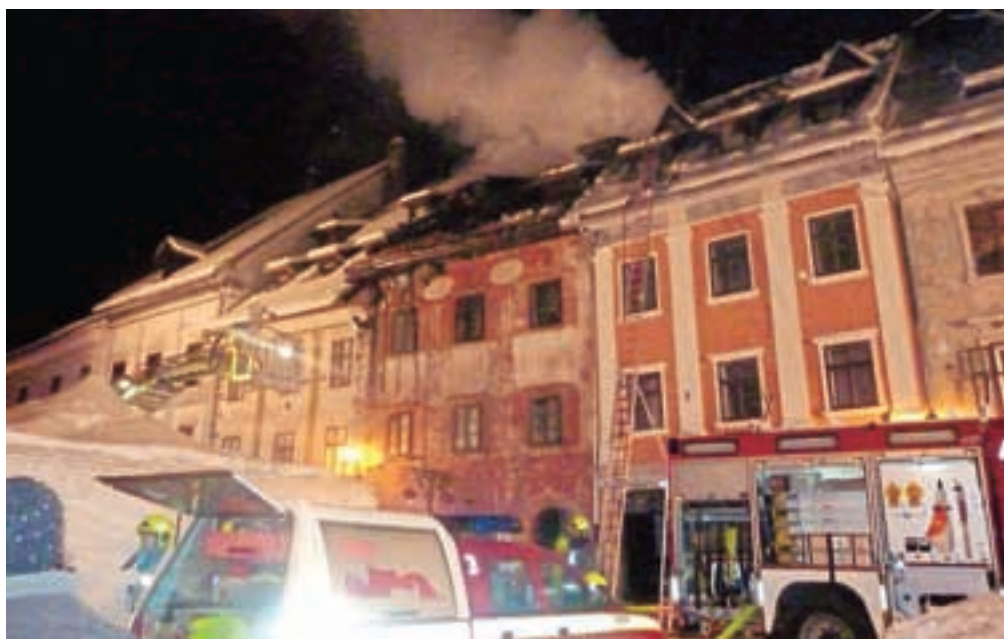
Na Mestnem trgu je v mansardnem stanovanju okoli pol enajste ure zvečer močno počilo, ob hitri intervenciji gasilcev pa se je požar razširil zgolj na sosednji stanovanji.

Škofja Loka – »Tako močno je počilo, da sem bila prepričana, da se podira hiša. Vsi smo stekli po stopnicah. Otroci so jokali, drugi smo čakali, kaj se bo zgodilo,« je pripovedovala prva sosedica stanovanja na škofjeloškem Placu, ki je še nekaj ur po grozljivi eksploziji opazovala, kako se gasilci trudijo, da bi umirili ogenj na stavbi sredi Škofje Loke. »Stanovanje imamo uničeno, k sreči lahko gremo k mami,« je še dodala, ko je zgolj v domačih natikačih opazovala grozljivi prizor.