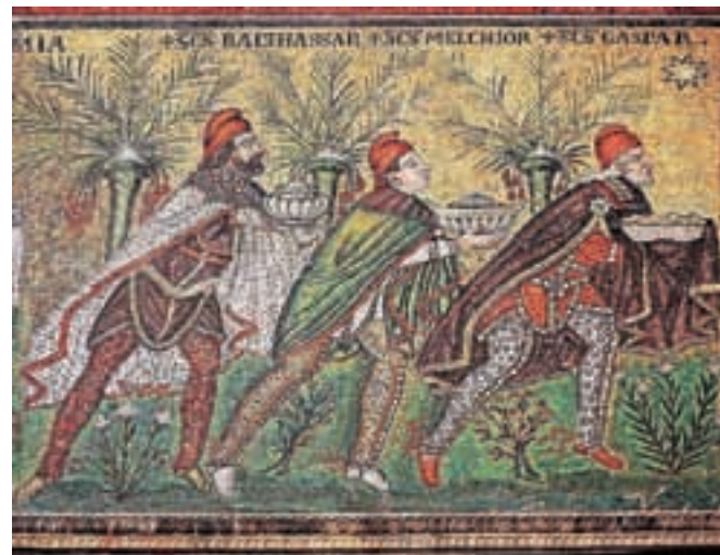
Sveti trije kralji so prišli na obisk samo enkrat; ta upodobitev v baziliki sv. Apolinarija v Raveni je iz zgodnjega 6. stoletja.