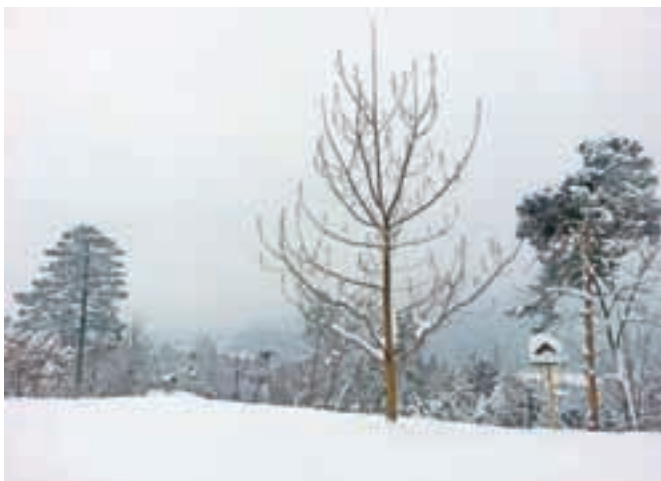
Zimska idila na silvestrovo

Srečno, zdravo in zadovoljno leto 2015 vam želimo!