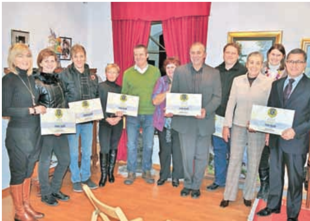
Prejemniki donacij Lions kluba Škofja Loka na slovesnosti v galeriji Krvina v Gorenji vasi