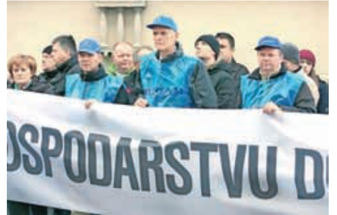
Z roko ob roki delavci in delodajalci