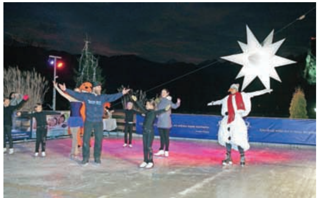
Ob hotelu Park so v ponedeljek odprli drsališče z razgledom.

Na božični dan bodo blejski potapljači tudi letos oživilo Legendo o potopljenem