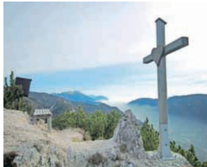
Razgledni balkonček – Borovje. V dolini pa megla.