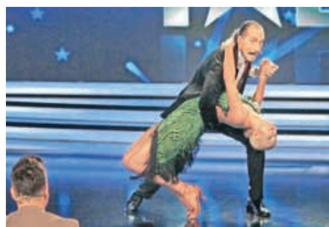
Vidov plesni lik tokrat ne potrebuje komentarja.