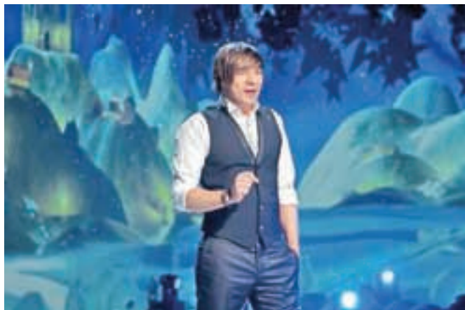
Na silvestrski večer nas bo na prvem programu TV Slovenija zabaval Lado Bizovičar.