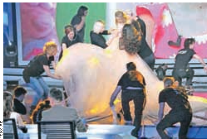
Alenka je za svoj končni videz potrebovala precej pomoči.