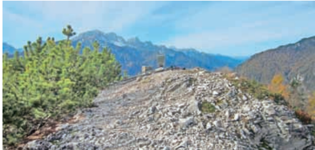
Vrh Planice z martuljskimi gorami v ozadju