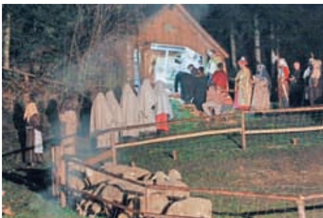
Vrhunec predstave na prostem se je odvil v hlevčku, za navdušenje gledalcev pa je poskrbel tudi prihod angela.

Da je bil večer res pravo predbožično doživetje, so organizatorji poskrbeli tudi z živimi živalmi, v predstavi pa je sicer sodelovalo več kot osemdeset članov turističnega, kulturnega in kongresnega društva ter ljubiteljev Tuhinjske doline.