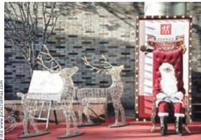
Božiček »made in China« čaka kupce iz Nemčije.