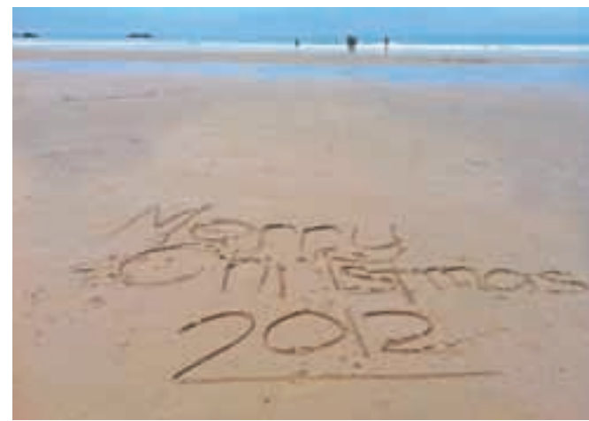
Božično voščilo na eni od plaž pod ekvatorjem – Port Stephens, Novi Južni Wales (NSW), Avstralija, 24. decembra 2012

Pa še en praznični citat: »Nikoli ni prepozno – nikoli ni prepozno za nov začetek, nikoli ni prepozno za srečo.« To so besede ameriške filmske igralka Jane Fonda (1937), ki je 21. decembra dopolnila 77 let. Velja ji prisluhniti.