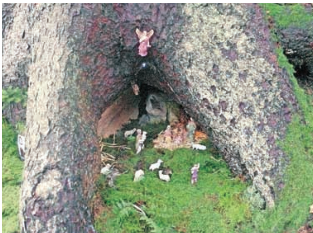
Jasllice v najbolj naravnem okolju