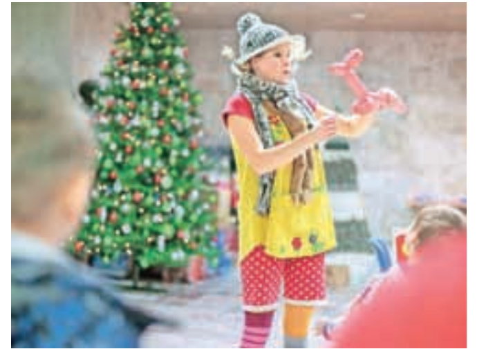
Tudi na tokratni prireditvi je vse otroke razveselila Pika Nogavička.

Center za socialno delo Kranj je tudi letos organiziral prireditev, na kateri je Božiček obdaril otroke in mladostnike iz rejniških družin.