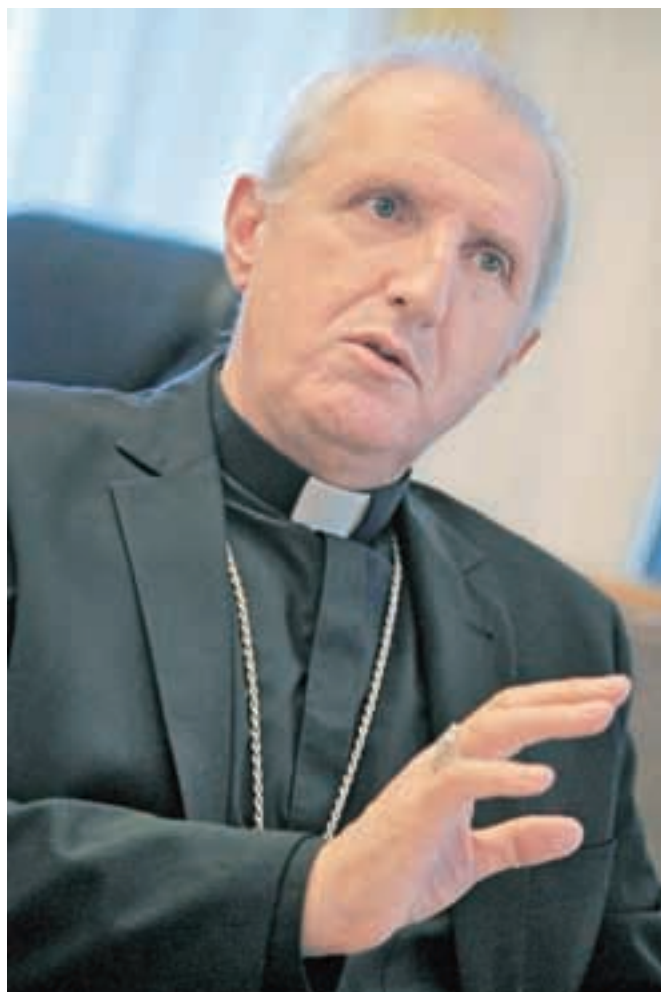
V svoji rojstni župniji Sela v Tuhinjski dolini bo kot nadškof prvič maševal v nedeljo, 21. januarja prihodnje leto, prvo nedeljo po godu svete Neže.

Spoštovani nadškof, hvala za pogovor in vesele praznike v imenu časopisa Gorenjski glas in njegovih bralk in bralcev!