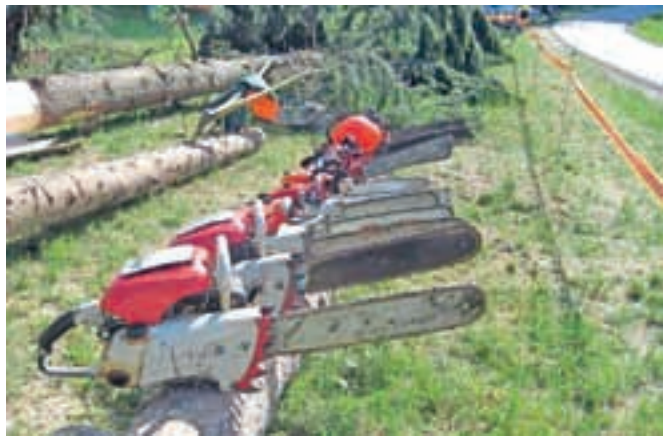
Letos je pri spravlilu lesa v gozdovih umrlo 21 ljudi.

Od leta 1998 je zaradi nesreč v gozdovih umrlo najmanj 184 ljudi, dolgoletno povprečje števila žrtev znaša enajst na leto, v zadnjih štirih letih pa petnajst žrtev.