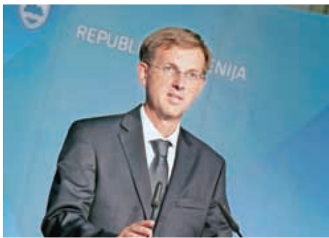
Premier Miro Cerar te dni sliši več kritik kot pa pohval na račun dela njegove vlade v prvih stotih dneh po imenovanju.