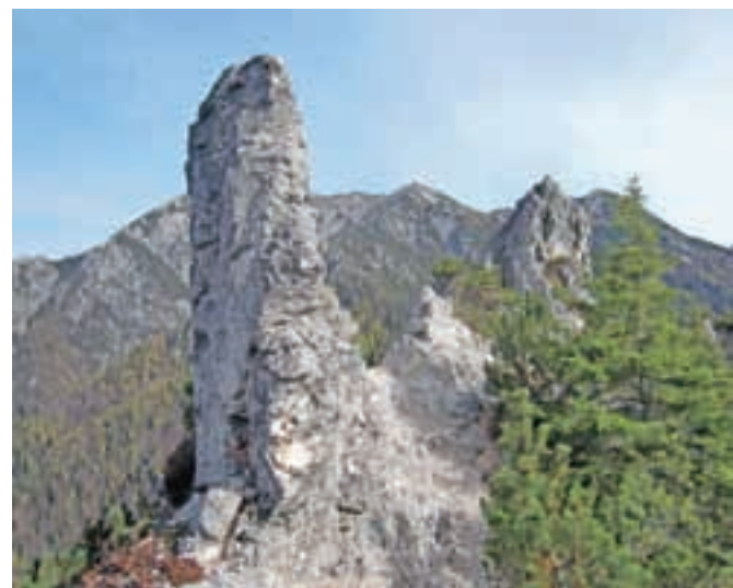
Apnenčasti turni na izpostavljenem grebenu Planice

Nadmorska višina: maks. 1508 m Višinska razlika: 400 m Trajanje: 3 ure Zahtevnost: ★★★★★