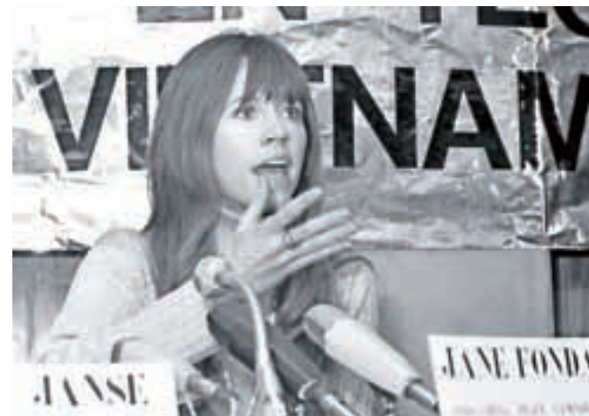
Igralka Jane Fonda v svojih najboljših letih, kot aktivistka proti vietnamski vojni, Haag, 1975