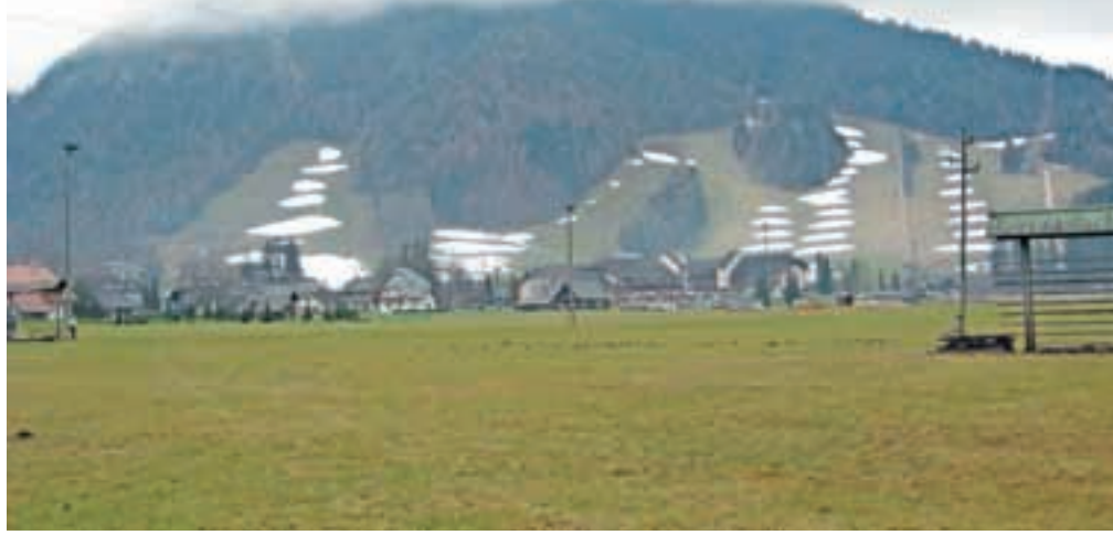
V Kranjski Gori, ki je eno naših najnižje ležečih smučišč, nestrno pričakujejo naravni sneg, saj zaradi visokih temperatur umetnega ne morejo izdelovati tako, kot bi si želeli.

Na Krvavcu v teh dneh obratuje otroški poligon na Gospincu (ob zgornji postaji kabinske žičnice), otroška vlečnica Luža, 4-sedežnica Tiha dolina, 2-sedežnici Njivice in/ali 6-sedežnica