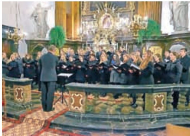
Zbor je navdušil številne poslušalce v župnijski cerkvi v Adergasu.