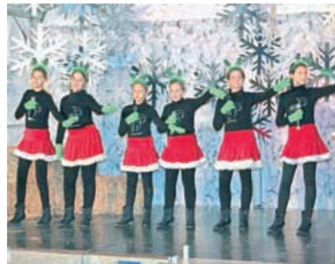
Tako najmlajše kot starejše pevke Glasbenega studia Osminka so nastopile s simpatično koreografijo.