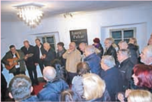
Puharjeve vrnitve v Ljubno se je udeležila množica ljudi.

Ljubno – V petek je bila v župnišču v Ljubnem zaključna prireditev Puharjevega leta. V spomin na kraj, kjer je Janez Puhar izumil svoj način izdelave fotografije na steklo in ga imenoval svetlopis, je odbor za Puharjevo leto razstavo o Janezu Puharju podaril v Ljubno, kjer bo ta odslej stalno na ogled v tamkajšnjem župnišču. Uvodoma je dogodek s koncertom počastil dubrovniški oktet Klapa Subrenum, v nadaljevanju pa so odprli predstavitev Janeza Puharja prav v domovanju, kjer je živel in deloval v letih 1842–1844.