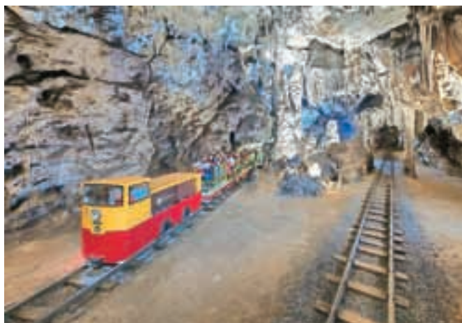
Postojnsko jamo naj bi letos obiskalo 620 tisoč obiskovalcev, kar je rekorden obisk po letu 1990.