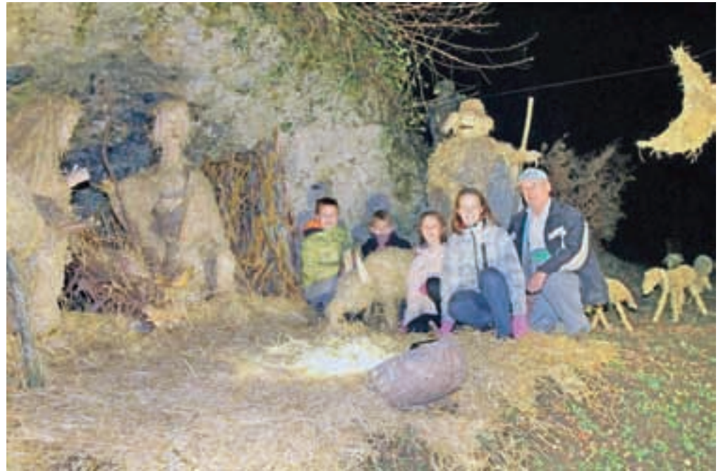
Jaslice zaznamujejo božični čas. Postavljajo jih v cerkvah, po domovih, na prostem ... Na sliki: jaslice v Struževem / Foto: Tina Dokl

so ga enotno, solidarno darovale generacije njenih ljudi. In kaj smo v dobrih dvajsetih letih storili s tem darilom? Elite, gospodarske in politične, so požrešno planile nanj, ga razgrabile, začele upravljati državo po svoji meri in okusu, veliko ljudi pa pahnilo na obrobje in jim vzele veselje do življenja in tudi spoštovanje do svoje države. Tega spoštovanja in zaupanja v državo, prepričanja, da je med nami lahko še poštenje, in veselja do življenja v njej nam najbolj manjka. Skupaj se potrudimo za njihovo vrnitev!