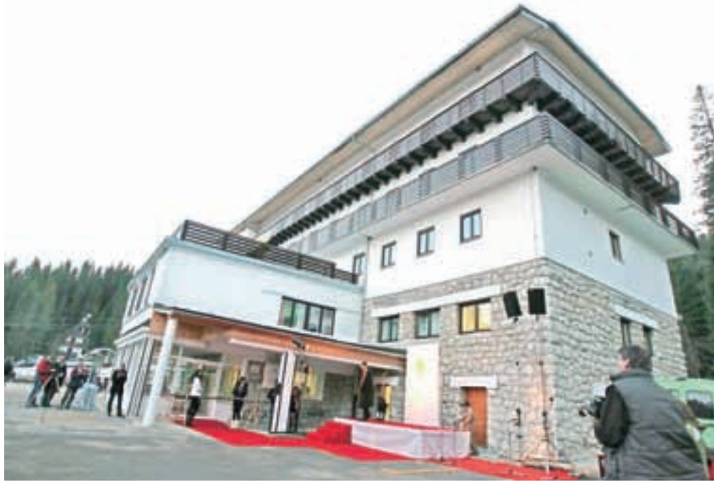
Šport hotel Pokljuka je v stečaju.

Družba Šport hotel Pokljuka se je že nekaj let spopadala z izgubo. Lani je znašala skoraj pol milijona evrov, prenesena izguba je skupaj s tekočo izgubo na zadnji lanski dan znašala nekaj manj kot tri milijone evrov. Za Šport hotel so sicer po besedah Grega Tekavca uspeli najti investitorja, ki pa je postavil zahtevo, da se z upnikoma dogovorijo za delni odpis terjatev, in sicer v višini pol milijona evrov in skoraj 150 tisoč evrov, na kar upnika