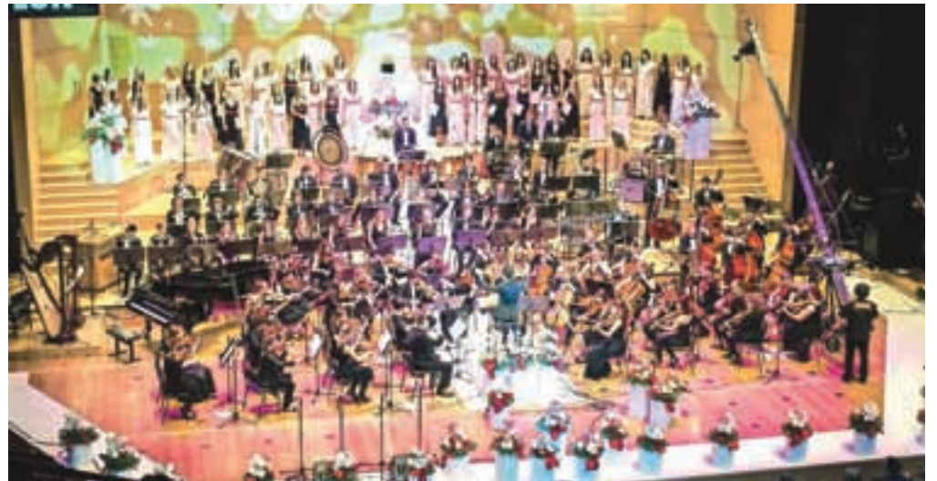
Eifflov stolp Velikega božičnega koncerta sta zgradila Veliki simfonični orkester in Združeni zbori Gimnazije Kranj.