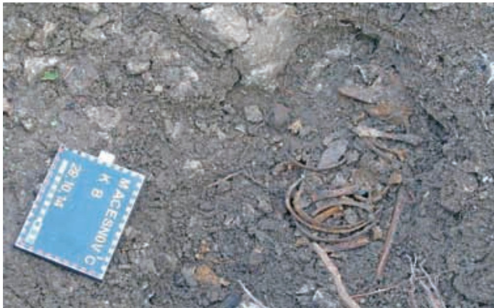
Uradno potrjeno o obstoju grobišča Macesnovec

V dolini Kamniške Bistrice je bilo spomladi leta 1945 pobitih več tisoč vojakov in civilistov različnih narodnosti in veroizpovedi: Hrvatje, Srbi, Črnogorci, Nemci, Avstrijci in Slovenci. Evidentiranih grobišč je več, a vsa še niso potrjena. S soglasjem lastnika (Sklada kmetijskih zemljišč in gozdov RS) in ministrstva za delo so pobudniki projekta v torek, 28. oktobra, izvedli sondažne izkope na območju Macesnovca v bližini spodnje postaje gondole na Veliko planino. »Na tem območju so