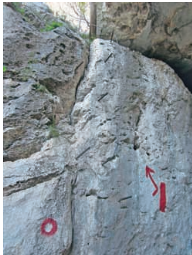
Vstop v zavarovano plezalno pot

Od križa sestopimo čez skale do lažje markirane poti, ki se višje razcepi na dva dela. Nadaljujemo desno proti planinskemu domu Pusti duh, levo oz. naravnost gre pot proti Filičevemu domu. Strm vzpon se položi pred Pustim duhom. Od doma nadaljujemo po cesti, sprva rahlo navzdol, nato pa se pot povzpne do cerkve Pusti duh. Do razglednega stolpa na vrhu je le še par minutk hoda.