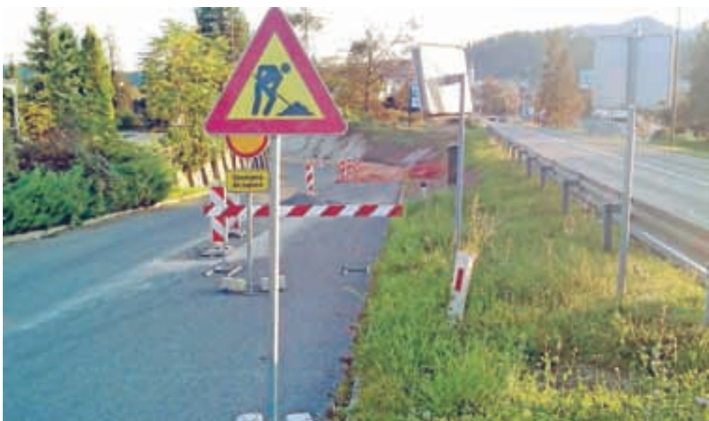
Pri Donitu so začeli graditi krožišče.