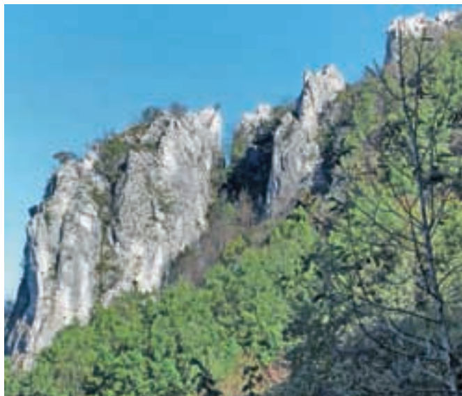
Velike pečine na Ravni gori

Nadmorska višina: 660 m Višinska razlika: 430 m Trajanje: 2 uri in pol Zahtevnost: ★★★★★