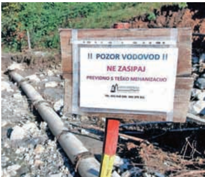
V Hotovljah je na več mestih odkrilo vodovodne cevi, ki zdaj kot okostja štrlijo iz zemlje.