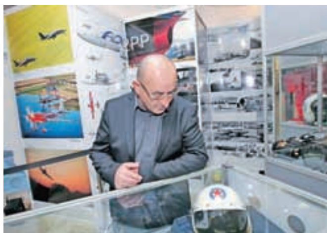
Potniški terminal na Letališču Jožeta Pučnika Ljubljana je bogatejši za stalno interaktivno letalsko razstavo.

Vstop v razstavni prostor je brezplačen, plačljiva je le uporaba simulatorja, razstava pa je za obiskovalce odprta vse dni v letu.