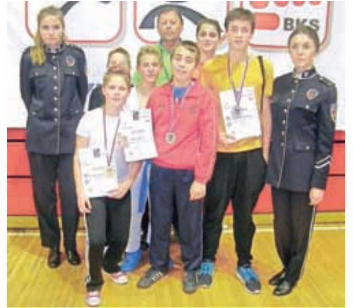
Gorenjski karateisti so s svojimi nastopi v srbski prestolnici zadovoljni.