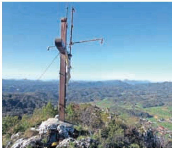
Križ na vrhu