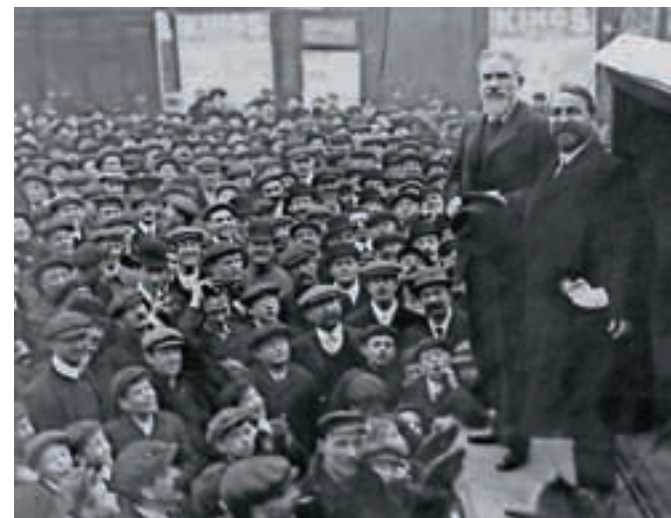
Bernard Shaw (levi) med govorom množici v Londonu, 8. januarja 1910