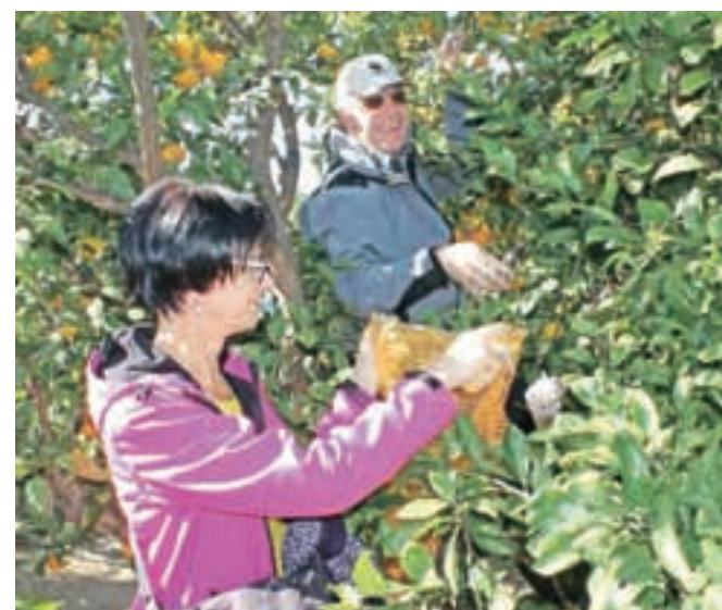
Obiranje mandarin je ob lepem vremenu pravi užitek.