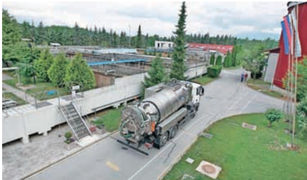
Nadgradnja CČN Domžale-Kamnik mora biti končana do poletja 2016, zato so se občine odločile, da potrebni denar v višini 15,5 milijonov evrov založijo same.

Projekt oskrbe s pitno vodo na območju Domžale-Kamnik bo najverjetneje v celoti dokončan že do pomladi, težave pa se bodo pojavile s kanalizacijo. Medtem ko sta glavna voda v Stranjah in Tunjicah v glavnem že zgrajena, kanalizacije v Tuhinjski dolini ne bodo mogli začeti graditi. »Z ultimatom, ki smo ga postavili