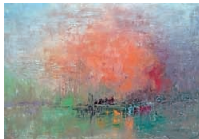
Kačarjeva slika Jesen ob Sori že nakazuje spremembe v njegovem slikarskem slogu.