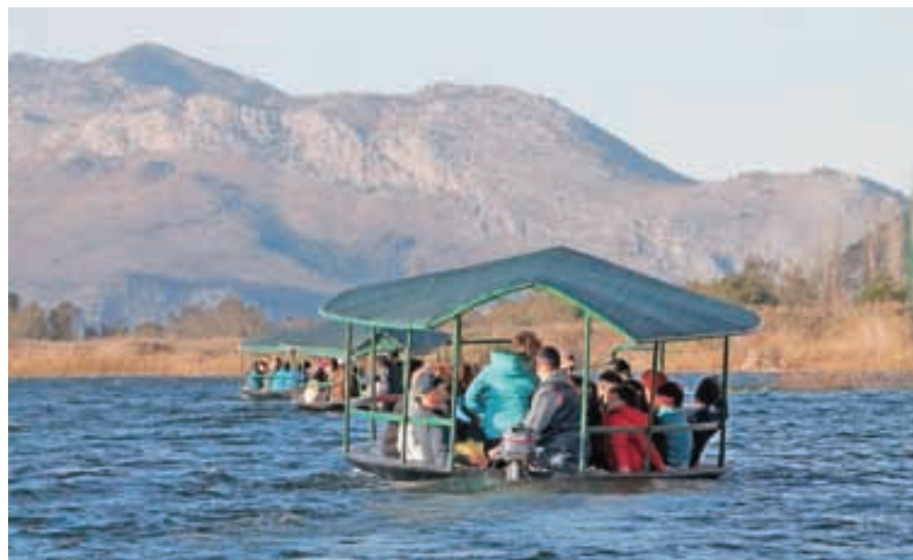
Vožnja s trupicami po jezeru Kuti