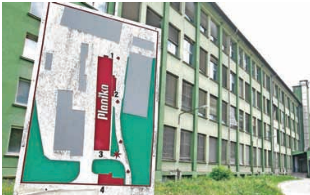
Na lokaciji Planike v Kranju so prodajo nepremičnin končali šele lani.

»Primer Planike je bil za slovenske razmere zelo velik in kompleksen insolvenčni postopek. Njeno premoženje se je nahajalo v domala vseh možnih pojavnih oblikah,« ob zaključku postopka ugotavlja Andrej Marinc in dodaja, da jim je večino premoženja uspelo unovčiti do konca leta 2008, izjema je