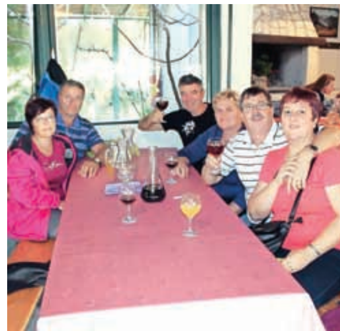
Vesela družba iz okolice Škofje Loke v Izletišču Kuti