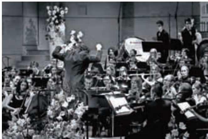
Simfonični orkester Gimnazije Kranj med igranjem osrednje teme iz filma Boter