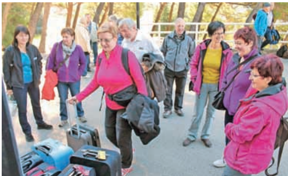
Jutranje razpoloženi gorenjski obiralci mandarin