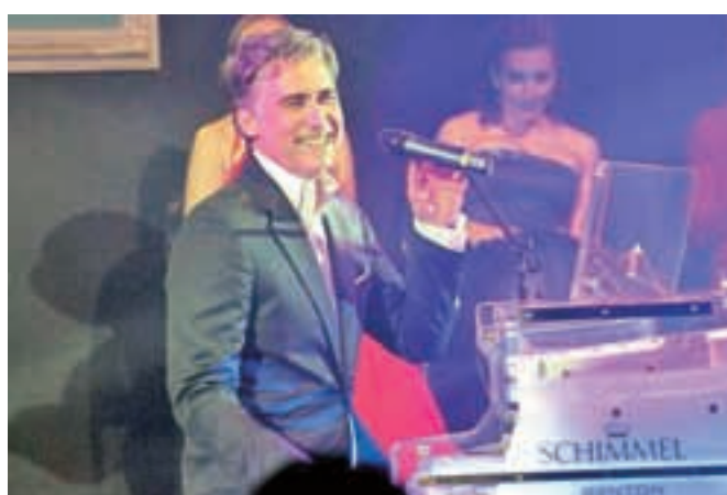
Najbolj je izbranke na odru in prisotni ženski spol v dvorani s čutno izvedbo Ona sanja o Ljubljani razveselil priljubljeni pevec Jan Plestenjak.