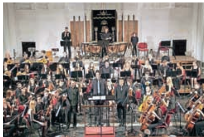
Orkester 100 mladih na nastopu v Beogradu / Foto: arhiv DoReMi

V projektu poleg učencev Glasbenega centra DoReMi