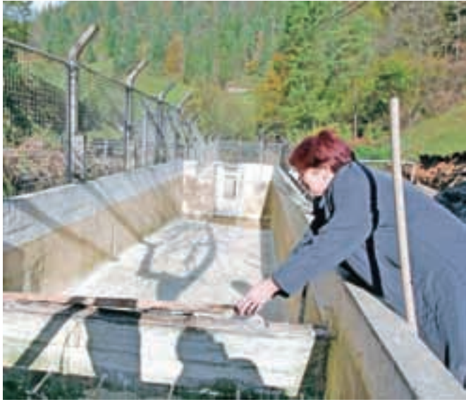
Poplave so povsem uničile tudi ribogojnico Šifrarjevih v Hotovljah.