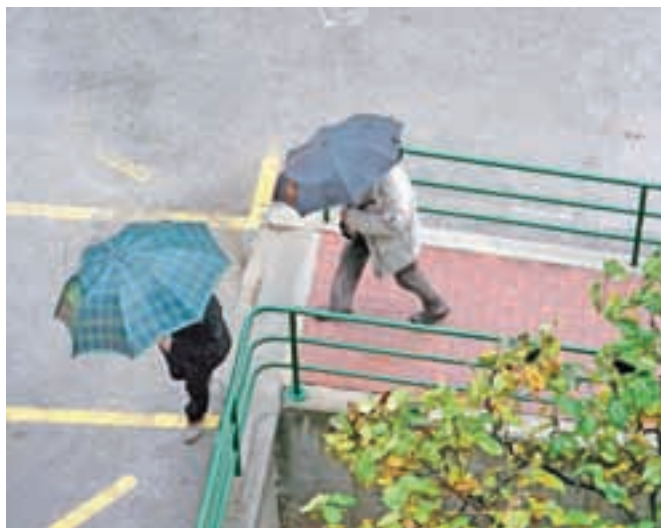
Tokratno deževje bo dolgotrajno, zato je priporočljivo redno spremljati lokalno vremensko dogajanje.