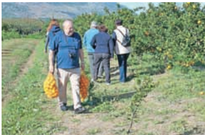
Moški so poskrbeli, da so vreče našle prostor na prikolici.

Nazaj grede smo se ustavili še ob obcestnih prodajalcih