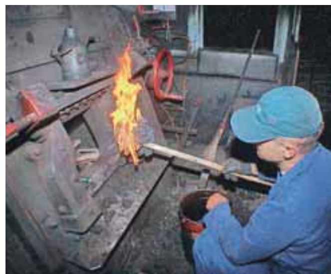
S prižigom ognja se delo kurjača šele začne.