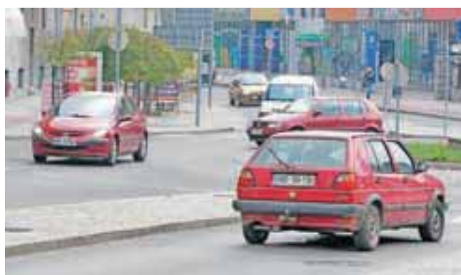
Jeseni se vozne razmere hitreje spreminjajo kot poleti, ob nižjih temperaturah ceste postanejo spolzke, dodatno nevarnost povzroča tudi odpadlo listje.

da zato vozite s prilagojeno hitrostjo in imejte ustrezno varnostno razdaljo, ki omogoča varno ustavljanje. Policisti hkrati voznike znova