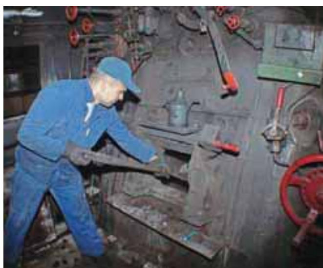
Pred prižigom pripravijo podlago iz premoga in lesa.