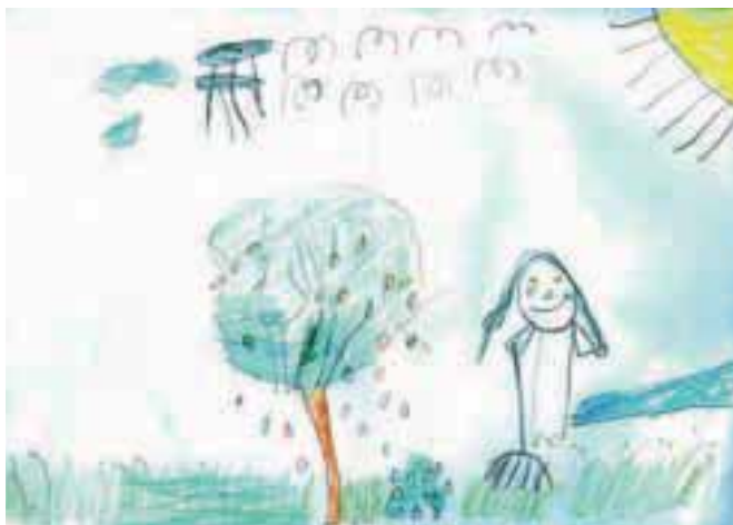
Eva Belovič, 4 leta, Listje pada