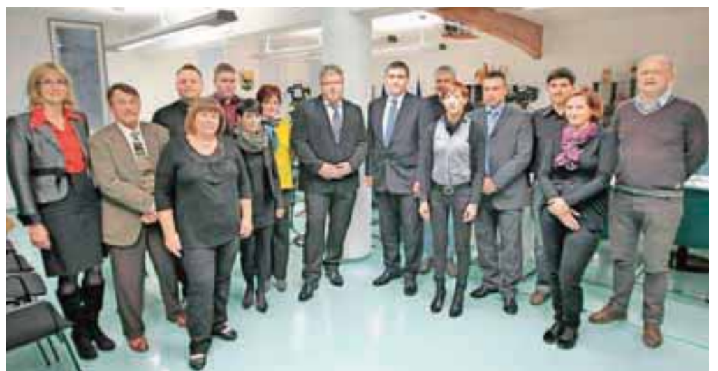
Kranjskogorski občinski svetniki z novim županom