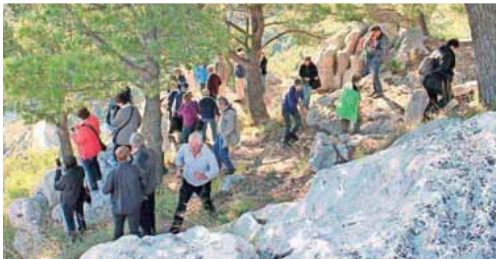
Razgledna točka, kjer je vsak poiskal svoj prostor za pogled na Omiš.