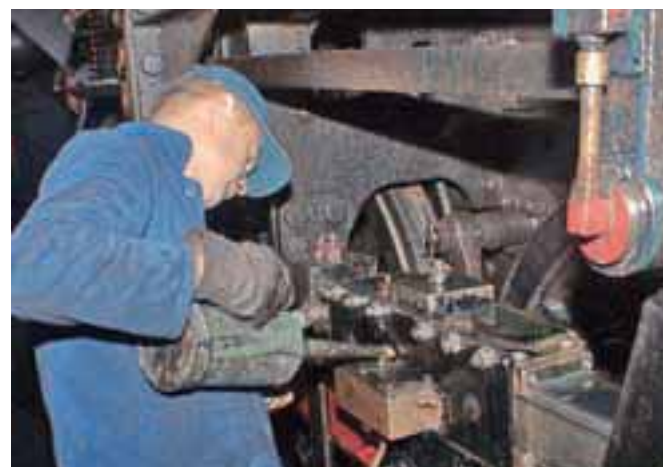
Lokomotiva ima več kot 80 mazalnih mest, ki jih je treba pregledati in napolniti, da ne pride do pregrevanja.