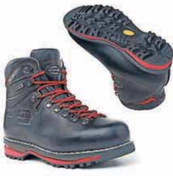
Usnjen čevlji je pravi čevlji.

In v enem samem kilometru sem se počutil tako svobodnega, da sem kolesaril še nadaljnje štiri ure. Kdaj nazadnje sem kolesaril pet ur, ne da bi bil dosegljiv? Blažen nasmešek je pomagal poganjati pedala. Prikolesaril sem do doma. Nikjer nikogar, ki bi ga skrbelo, kdaj pridem. Na omarici pogledam pozabljenega na njem ni neodgovorjenega klice ne malega pisemca zgoraj levo. Nihče me ni potreboval, nihče me ni iskal Kako trapast sem, sem pomislil. Nisem si oddahnil, ko sem ugotovil, da nisem bil pogrešan. Še enkrat sem se spomnil, kako so nas telefoni privezali, kako odvisni smo postali od njih. Še enkrat sem se lahko prepričal, da je mogoče pa le res, da smo že toliko obsevani zaradi uporabe teh tesnih prijateljčkov, da postanemo nervozni, živčne razvaline, nagi in goli, če jih nimamo tesno ob sebi.