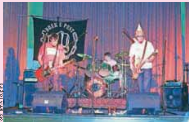
Brezkompromisni uničevalci sluha: Paraziti P. 13 bodo v petek nastopili v Mengšu, v soboto pa v kranjskem Squatu.