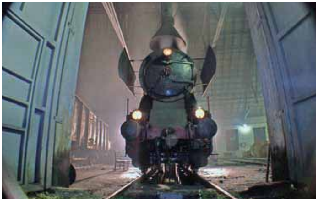
Pri desetih barih zagorijo luči, saj oživi parni dinamo.

Z naraščanjem tlaka se lokomotiva prebujala, prvi znaki naraščanja temperature v kotlu je raztezanje kotla, ki se s cviljenjem in pokanjem prilagaja višanju tlaka in temperature. Obenem se sistemi lokomotive pričnejo polniti s tlakom, lokomotiva pa začne spuščati kot cedilo, saj iz nje kaplja na vsakem koraku. Pri desetih barih, ki jih lokomotiva doseže okoli šestih zjutraj, se ob cviljenju parnega generatorja počasi prižgejo luči na lokomotivi in s tlakom napolnijo rezervoarji, ki omogočajo delovanje pnevmatskih zavor. Med vožnjo je treba v kotel vseskozi dovajati svežo vodo iz tenderja ter tako vzdrževati parni tlak, pri tem pa v kotel ne sme priti mrzla voda. Za premikanje lokomotive skrbita