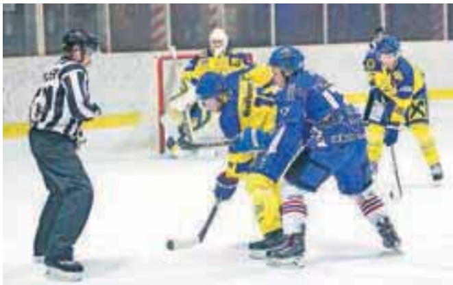
Hokejisti MK Bled so v soboto premagali moštvo Zell am See.

Kranj – V hokejski INL so minuli konec tedna odigral dvojni spored. Kranjčani so obakrat gostovali, v soboto pri ekipi Lustenau, v nedeljo pa pri Bregenzeraldu. Obakrat so bili poraženi, v soboto z 8:4, v nedeljo pa s 7:2. Presenečenje je na domačem ledu pripravila ekipa MK Bled, ko je s 4:2 premagala vodilni Zell am See. V nedeljo so Blejce nato s 4:5 premagali hokejisti Celja. Jeseničani so bili v soboto prosti, v nedeljo pa zadeli Zell am Seeju še en poraz, saj so Avstrijce premagali s 4:3.