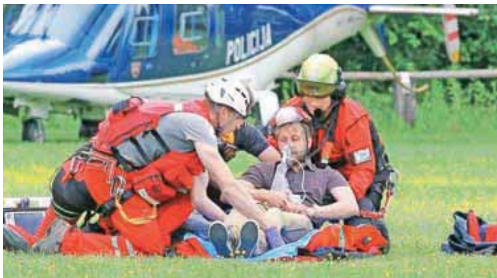
Novi pravilnik zagotavlja, da lahko policija in vojska opravljata helikopterske prevoze za helikoptersko nujno medicinsko pomoč vsaj do konca leta 2015.

Po novem pravilniku o plovnosti in letalskih operacijah državnih zrakoplovov in s tem povezanim letalskim osebjem ter pravili letenja je torej še naprej dovoljeno izvajanje NHMP tudi v obliki javne državne službe, vendar pa lahko že sedaj za izvajanje NHMP v Sloveniji zaprosi oziroma kandidira tudi katera koli zasebna družba s sedežem v Evropski uniji,