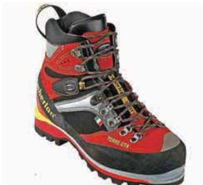
Najboljši niso več podobni »gojzarjem«.

Dober čevlji mora biti usnjen, pravijo tisti, ki ne spremljajo razvoja tehnologije na tem področju. Na trgu je usnjenih čevljev vse manj, a so zato vse bolj kakovostni. Najboljši je tisti, ki je narejen iz mešanice usnja in umetnega materiala, kot je na primer poliamid. Ker voda najde pot med šivi, ki združujejo dva materiala, so najboljši proizvajalci vmes vključili še dihalo, nepremočljivo membrano. Največkrat se omenja Gore-Tex, vendar je ta znamka danes dočkala tako ogromno konkurenco, kot nekoč nepogrešljiva Vibramova rumena značka na podplatu, ki je dolga leta veljala za sinonim dobrega oziroma najboljšega podplata.