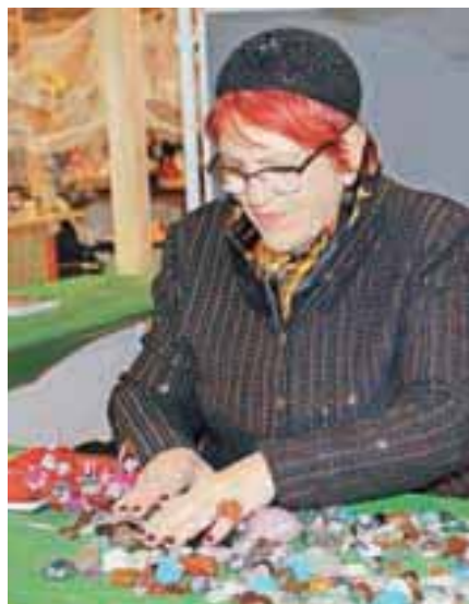
Maruča / Foto: AB