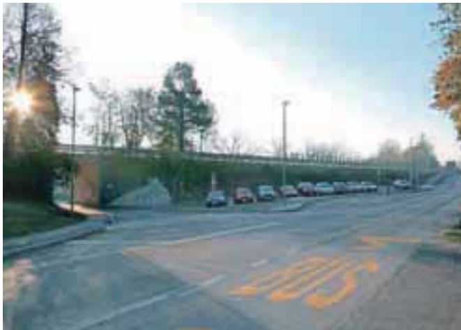
Temeljita prenova križišča s cesto in pločnikom za naselje Loka

razsvetlavo. Z novo ureditvijo se je, razen v podvozu, zaradi dodatne izvedbe pločnika razširilo tudi vozišče lokalne ceste. Na celotnem odseku je izvedeno odvodnjavanje in postavljena ustrezna prometna signalizacija,« je glavni del povzela Jasna Kavčič, vodja Urada za urejanje prostora pri Občini Trzič. Pogodbeno vrednost izvedenih del je dobrih 194 tisoč evrov, izvajalec del je bilo Vodnogospodarsko podjetje Kranj.