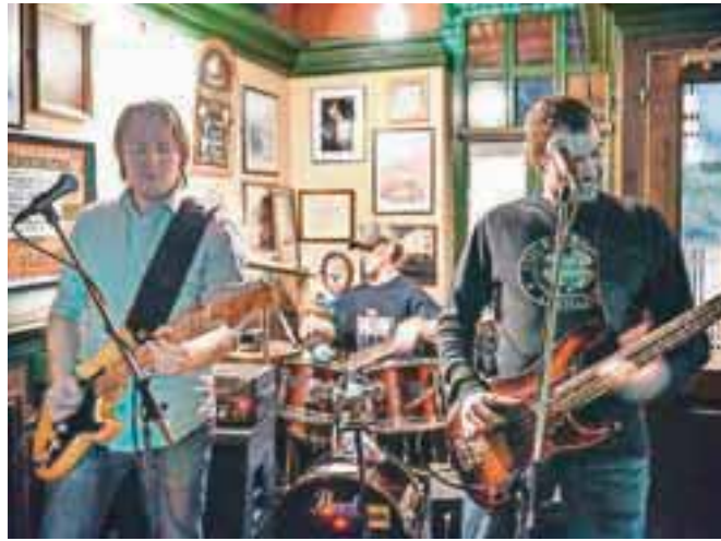
Polni glasbene energije: K.O.S.E.