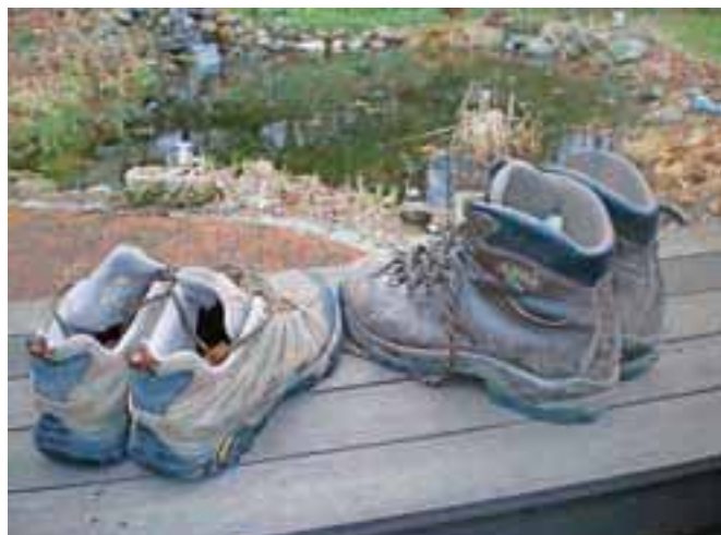
Visoki ali nizki pohodniški čevlji?

Čevlje moramo obvezno pomeriti s pohodniškimi nogavicami. Ne z navadnimi in ne z najlonkami, ampak s tistimi, s katerimi gremo na pohod. Pravilo dvojnih nogavic je precej zastarelo pravilo, ker na trgu že dolga leta obstajajo moderne pohodniške nogavice, narejene tako, da so na pravih mestih ojačene, zračne, ne drseče. Dobre nogavice so danes enako pomembne kot dober čevlji ali drugače povedano, tudi najboljši čevlji ne bo dobro