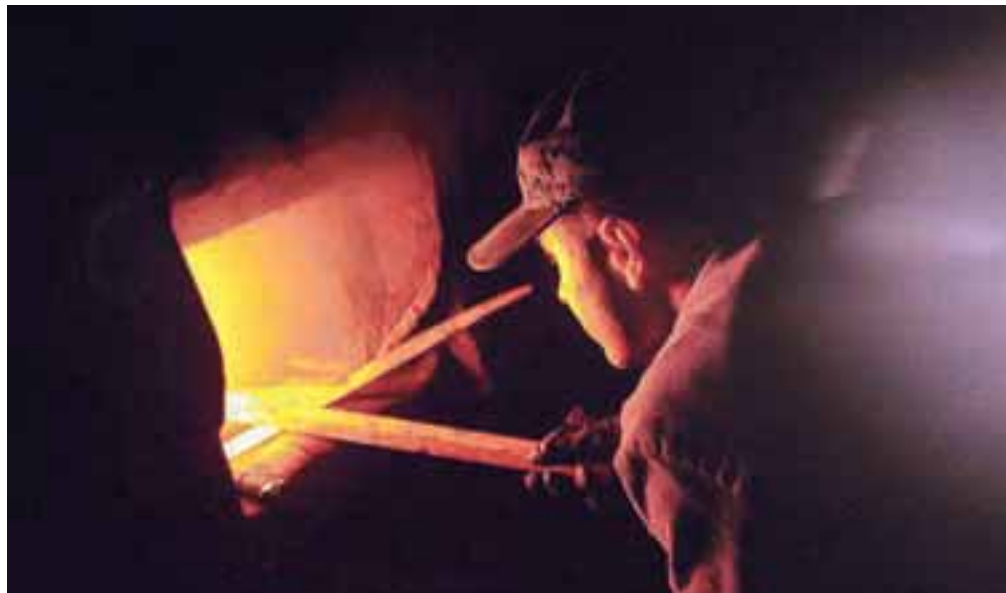
Ogenj mora biti vseskozi pod nadzorom, premog pa je treba dodajati, dokler lokomotiva ne doseže tlaka 10 barov.

dva šestdeset centimetrov široka parna cilindra, ki silo pare pretvarjata v gibanje, vendar tudi tu stvar ni tako preprosta. »V cilinder lahko pride le para in ne voda, zato imata cilindra dva varnostna ventila. Če pa lokomotiva