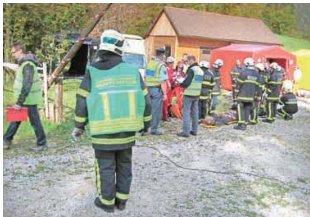
Častnika za varnost ostali reševalci prepoznajo po zelenem jopiču – brezrokavniku.

Kljub prisotnosti častnika za varnost, ki bo sodeloval le ob srednje velikih in velikih intervencijah, se bodo gasilci pred odhodom na intervencijo še vedno med seboj pregledali, ali so primerno oblečeni in opremljeni, in bodo še vedno na intervenciji pazili drug na drugega, pravi Kejžar. Častnik