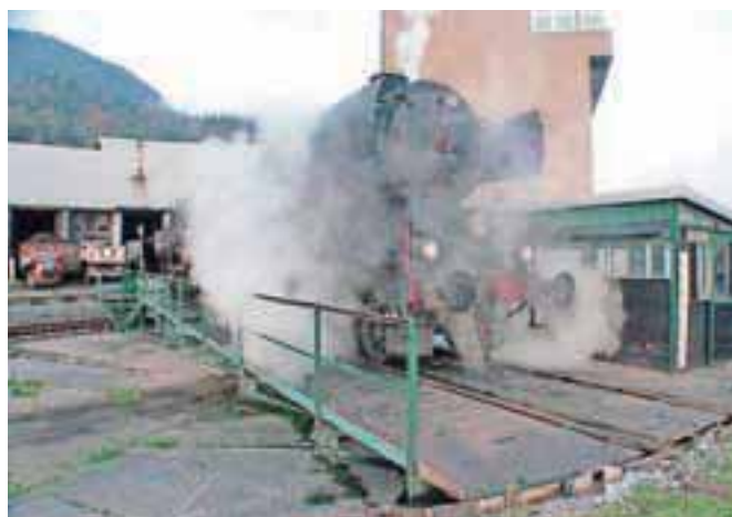
Po osmih urah je 177 ton težka in več kot 22 metrov dolga lokomotiva pripravljena na odhod.