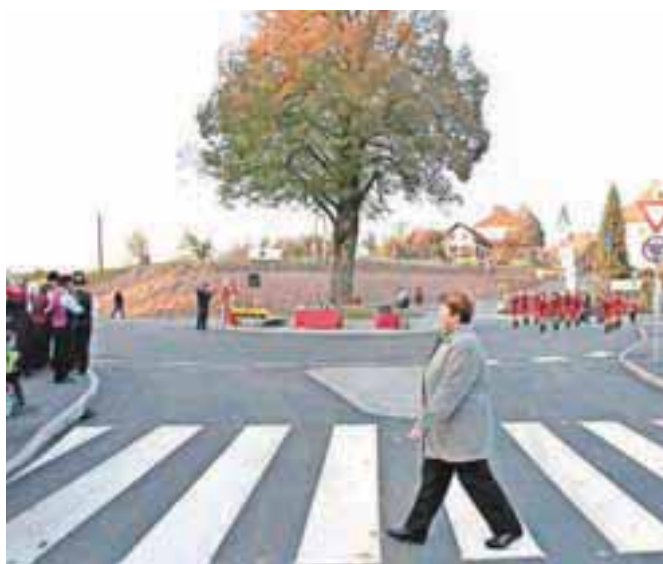
Sredi krožišča so ohranili staro lipo.

Občina je ves čas vztrajala pri pravdi, ki se je pred tremi meseci končala s pobotom in jim z obrestmi navrgla skoraj 800 tisočakov. Poleg krožišča bodo nove cestne odseke iz tega denarja dobili še na Gmajnici, Mlaki in v Suhadolah, je obljubil dosedanji župan Drolec. Zanj dograditev krožišča predstavlja velik uspeh in ker je to zadnja naložba ob koncu njegovega četrtega mandata, je odprtje krožišča pomenilo tudi nekakšno slovo. Dejal je, da je bil s svojim