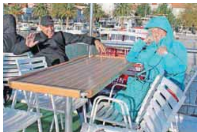
Milka in Jože Švegelj