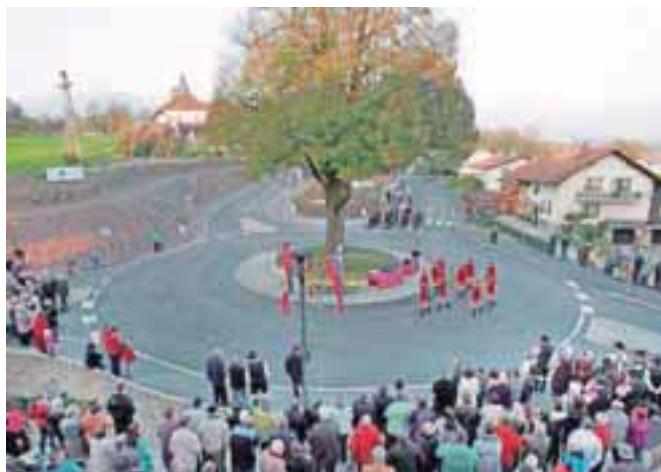
Krožišče v Komendi je bilo zgrajeno v rekordnih dveh mesecih.