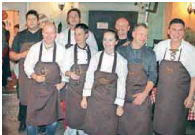
Kuharski del ustvarjalne ekipe uvodne večerje v novembrske Okuse Radol ce