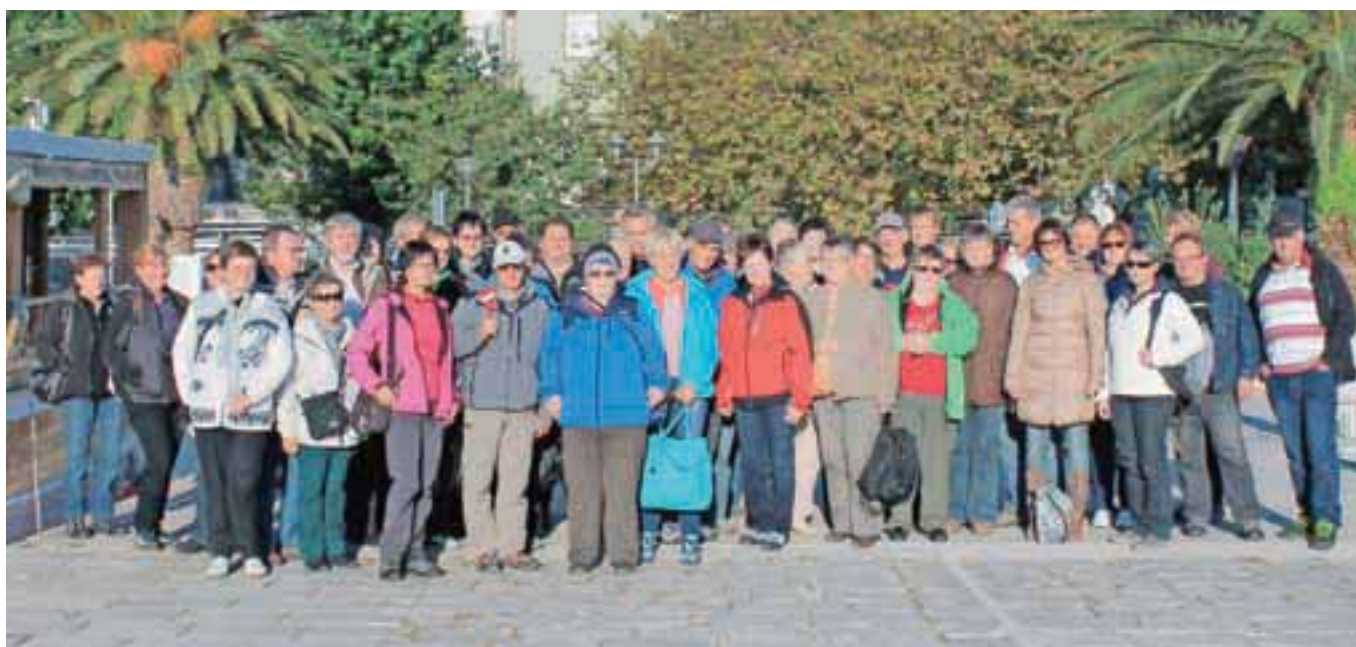
Baška Voda: tik pred vkrcanjem na turistično ladjico