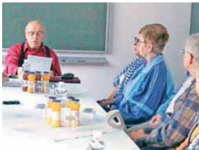
Srečanje članov Klubov za bolnike s cerebrovaskularno boleznijo Tržič, Kranj in Bled