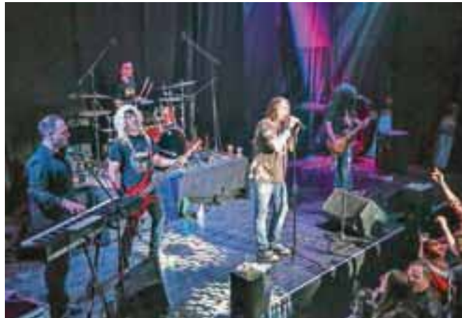
November Rain: skladbe skupine Guns n Roses ostajajo večne.

'magičnimi' skladbami skrbeli za pospešen gorenjski nočni utrip, prvi november pa je na kranjskem Bazenu potekal v znamenju nostalgije in dobrega starega roka, ki so ga v živo predstavili eni izmed najboljših posnemovalcev Billyja Idola in zasedbe Guns'n'Roses. Navdušili so z največjimi uspešnicami sicer še delujočih zasedb – Billy Idol je imel poleti izvrsten koncert v Hali Tivoli, v zvezi z Guns'i pa se več kot o njihovi glasbi piše in govori o problemih pevca Axla Rosa. Ne gre pa pozabiti tudi na izvrstnega kitarista Steva Stevensa, ki je virtuozno zaključil 'čarovniški' glasbeni vikend.