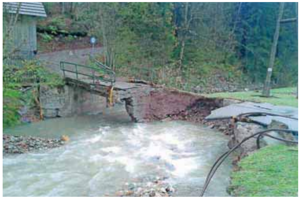
Nov most bodo morali zgraditi tudi v Brebovnici, saj je sedanji preveč poškodovan, da bi ga bilo smiselno obnavljati.