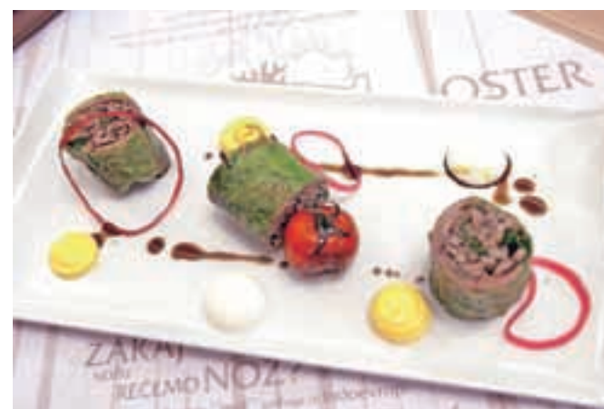
Jesih flajš