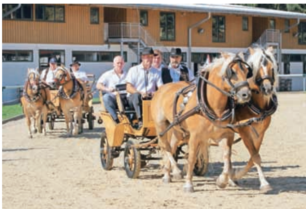
Predstavitve haflingerjev na nedavni državni razstavi v Celju

»Haflinger se je obdržal, po številu je to danes tretja najbolj zastopana pasma konj v Sloveniji. Na Gorenjskem jih je bilo največ v začetnih, pionirskih letih, kasneje se je njihovo število zmanjšalo, hkrati pa so se razširili po vsej Sloveniji. Kot konj za delo na polju in v gozdu je izgubljal na pomenu, vse bolj pa se je krepila njegova športna in ljubiteljska vloga. Zmanjševalo se je število kmetij s po eno kobilo in poraslo število kmetij z več konji, nekatere so se celo usmerile v konjerejo. V zadnjem času je na Gorenjskem ponovno čutiti zanimanje za haflingerja. Tako je tudi prav, saj je to pasma, ki dobesedno »paše« na gorenjske kmetije in planine, pred kulise gora v ozadju. Želeli pa bi si, da bi podobno kot na številnih turističnih kmetijah srednjeevropskih alpskih držav tudi na Gorenjskem videvali haflingerja kot del turistične ponudbe.«