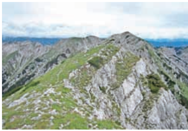
Z Žabiškega Kuka pogled na prehojeno pot z Vogla