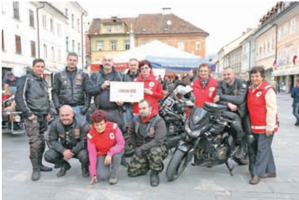
Člani Kluba ljubiteljev motorjev MC Freising riders Gorenjska so OZ RK Kranj donirali tisoč evrov za šolska kosila socialno ogroženih učencev.

S prostovoljnimi prispevki, donacijami je OZ RK Kranj v obdobju od 2002 do 2013 zbral 23.395,80 evra. S tem so plačali kosila za 64 učencev za čas šolskega leta.