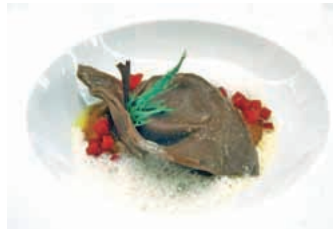
Črni Ištrijan

Splošen vtis: dober, za kar je v veliki meri odgovorno tudi strežno osebje šova oziroma gostilne.