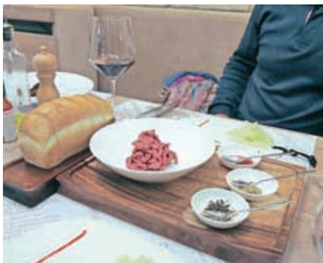
Divji tartar

Med sladicami smo izbrali kokosovo rižoto s tapiokinimi kroglicami, sorbetom iz kivija in pasijonke ter z bananinimi meringami; pa gospo hruško, kjer je prevladoval