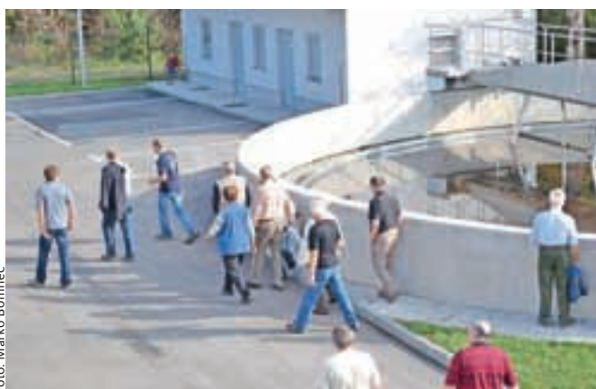
Veliko zanimanja za novo čistilno napravo v Tupaličah

Komunalen prispevek je v občini Preddvor določen s posebnim odlokom in bo znašal od 800 do okoli 1800 evrov. Gradnja čistilne naprave je stala 1,3 milijona evrov, nanjo pa se bodo priključevala gospodinjstva iz Preddvara, Nove vasi in Hriba.