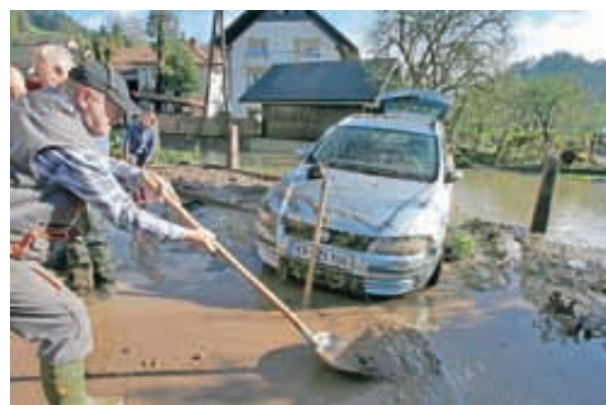
Odpravljanje posledic poplav v Poljanah, kjer je zelo narasel potok Močilnica, ki je segal do strehe avtomobila.