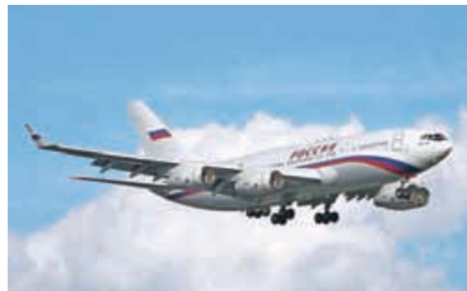
Putinovo uradno predsedniško letalo Ilijuhin Il-96-300PU – s takim je priletel tudi v Beograd.