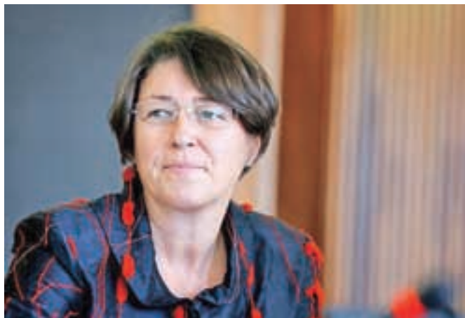
Violeta Bulc je nova evropska komisarka za promet.