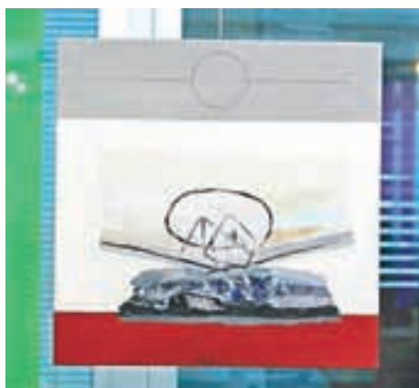
Kolaž Klementine Golije

Tretji Mednarodni festival likovnih umetnosti Kranj 2014