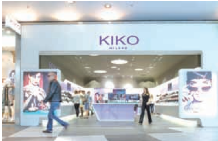
KIKO – italijanska trgovina s kozmetiko. Profesionalna kozmetika vrhunske kakovosti.

Nakupovalno središče Atrio ima izjemno lego. Njegov obisk je tudi priložnost za obisk Beljaka, ki s svojo lego ob Dravi spada med najbolj prijetna in najlepše urejena koroška mesta. Ljubitelji uživanja v vodni zabavi pa imajo le pet minut vožnje do beljaških term Kärtner Therme Warmbad Villach, ki so znane zaradi številnih atrakcij na vodi, spektakularnih toboganov in oddelka za wellness. Nemogoče je, da bi bilo ob taki ponudbi komu dolgčas.