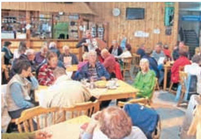
Na Voglu so se Glasovci zabavali tudi ob harmoniki.