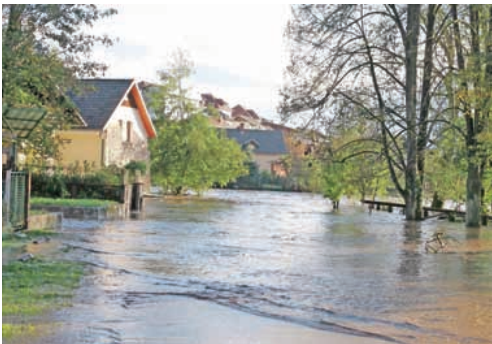
Sredino jutro na Studencu v Škofji Loki