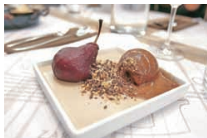
Gospa hruška