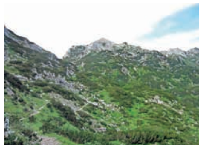
S poti proti Komni – takole se pokaže Vogel.

dobro vidni stezici, ki vztrajno sledi grebenu. Na naši levi strani se kaže vzhodna, divja stena Žabiškega Kuka, a njegova zahodna stran je bolj prijazna. Mestoma so nam v pomoč tudi možici, kar je zelo priročno, saj se v povsem kraškem, s travo porasčenem svetu lahko kaj hitro spustimo nižje, kot bi bilo treba. Na vrhu Žabiškega Kuka je ogromen možic in lep razgled na naš prvi vrh, na Vogel. Daleč pod seboj vidimo Planino Razor. Sestopimo po poti vzpona ter se ponovno vzpnemo na Vogel. Tudi z njega sestopimo po poti vzpona, a le do škrbine, kjer se usmerimo proti planini Zadnji Vogel. Od škrbine dalje se pot ves čas spuščča, mestoma precej strmo, tik pred planino pa zopet zagrizemo v breg in že smo pri sirarni.