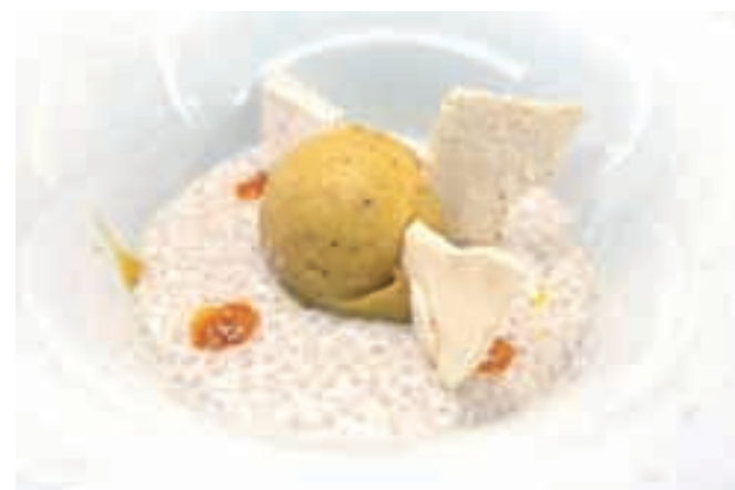
Kokosova 'rižota'