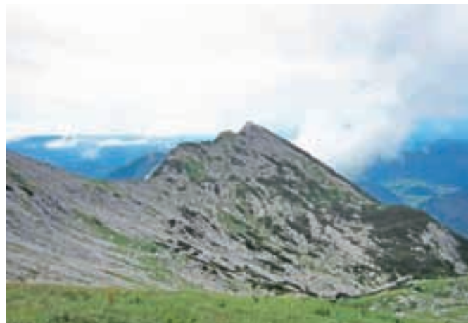
Žabiški Kuk izpod vrha Vogla

Nadmorska višina: 1922 m Višinska razlika: skupna 600 m Trajanje: 5 ur Zahtevnost: ★★★★★