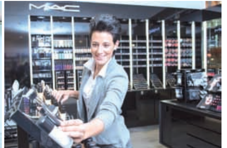
MÄC – kozmetika nekoliko drugače. Številne znane osebnosti zaupajo tej blagovni znamki. (Foto Marco Riebler)

BLUE-TOMATO – prva tovrstna trgovina na avstrijskem Koroškem. Posebnost trgovine Blue Tomato je tudi, da je prodajni program bistveno odvisen od sezone. Tako bodo v zimski sezoni ponujeni izdelki, kot npr. snowboardi, ustrezna oblačila in seveda tudi oprema. Vrhunsko svetovanje pa je samoumevno. (Foto Marco Riebler)