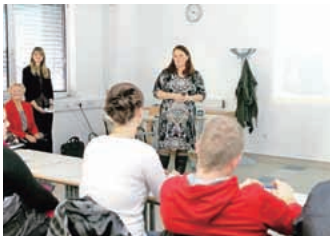
Predstavniki podjetja Knauf Insulation so brezposelnim predstavili, kaj vse pričakujejo od iskalcev zaposlitve in kaj vse je na razgovoru pomembno.

Kranj – »Z dnevom odprtih vrat želimo širši javnosti predstaviti, s čim se naš zavod sploh ukvarja, da ne gre le za tisto, kar ljudje najbolj pogosto vidijo, torej našo evidenco brezposelnih in posredovanje delavcev za zaposlitev, ampak opravljamo tudi številne druge dejavnosti, ki jih na tak način želimo predstaviti vsem zainteresiranim – brezposelnim, delodajalcem, našim partnerjem. Zavod za zaposlovanje se namreč ukvarja tudi s socialno varnostjo za tiste, ki so izgubili zaposlitev, z izdajo delovnih dovoljenj za delodajalce, ki ne dobijo naših kadrov, s posredovanjem delovne sile v Evropsko unijo in z zaposlovanjem oseb iz Evropske unije, opravljamo tudi aktivno