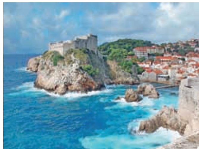
Dubrovnik, mešanica beneškega in balkanskega; pogled na srednjeveški utrdbi Lovrijenac in Bokar