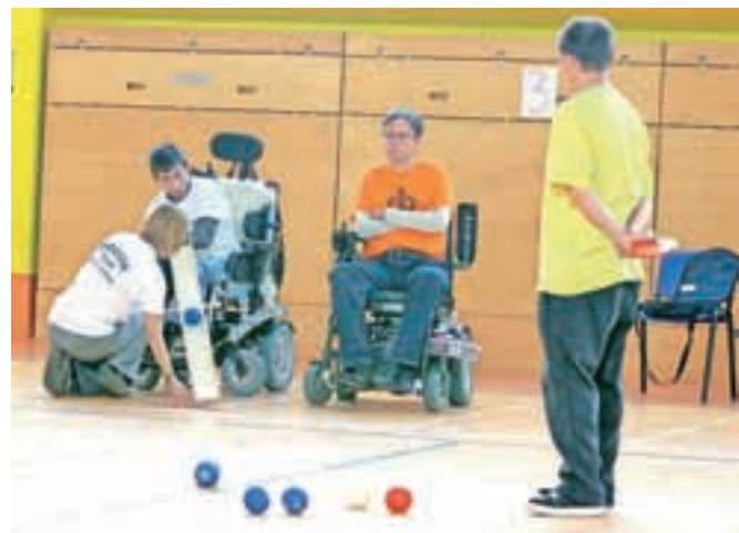
Boccia je vse bolj razširjeno dvoransko balinanje za osebe z invalidnostjo.

kika Villach/Beljak , Kärntner Straße 7, tel.: 0043 (04242) 32111. kika Klagenfurt/Celovec , Völkermarkter Straße 165, tel.: 0043 (0463) 3840. kika Graz/Gradec , Kärntner Straße 287, tel.: 0043 (0316) 282556. kika Feldbach , Mühlendorf 437, tel.: 0043 (03152) 61 61, Leiner Graz/Gradec , Annenstraße 63, tel.: 0043 (0316) 72 50-0.