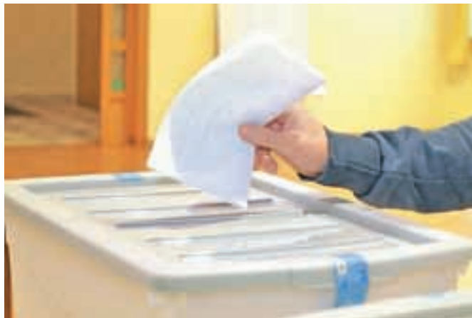
V Postojni je na županskih volitvah odločal dobesedno prav vsak oddani glas.