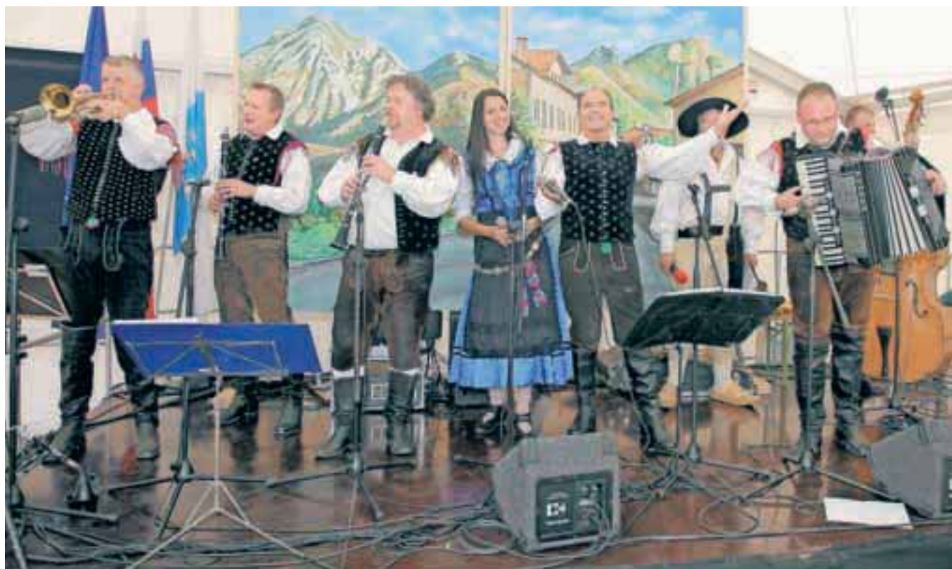
Gašperji so v Preddvoru poskrbeli za dobro razpoloženje.