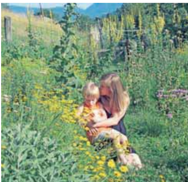
Mir in spokojnost med zeliščnimi prijateljicami