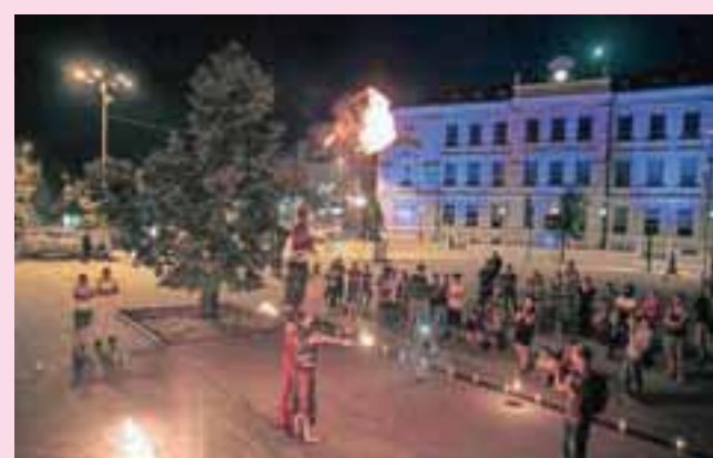
Ognjena piramida: vroč začetek festivala SubArt na Slovenskem trgu

Kranjski festival Subart v naslednjih dneh ponuja naslednje dobrote: v Layerjevi hiši bo danes nastop etno zasedbe Aritmija, jutri koncert Vasko Atanasovski Tria, v četrtek pa instrumental jazz/blues rock skupine Feedback. V atriju Down Towna bodo danes nastopili elektrorockerji Kotradikshn, jutri bo metal večer s skupinami Lintver, Era Of Hate in Release The Ectoplasm!, v četrtek pa bodo nastopili francoski hip hoperji Joke. Na Trainstation Squatu bo v petek noč DJ-jev, v soboto pa reggae dub koncert zagrebške zasedbe Bamwise. Squaterji bodo jutri od 12. ure na Slovenskem in Glavnem trgu zbirali prostovoljne prispevke za nadaljnjo ureditev prostorov na Kolodvorski, saj Mestna občina Kranj v proračunu nima zagotovljenih zadosti sredstev za potrebe in razvoj mladinske kulture v Kranju. Dogodku se