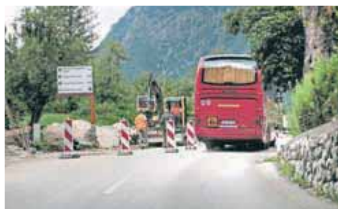
Na cesti Bohinjska Bistrica–Ribčev Laz lahko v poletni sezoni zaradi gradnje kanalizacijskega omrežja pride do daljših zastojev.

poskusno obratovanje. Trudil se bom, da bo zaradi del kar najmanj ovir in zapor, vendar se je treba zavedati, da te bodo, zato bo letos