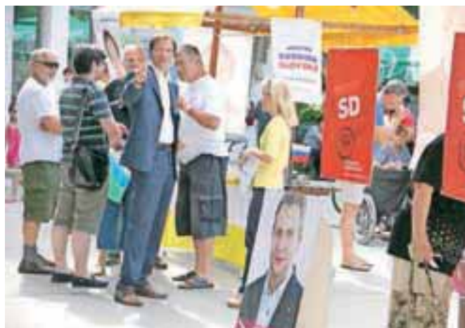
V Škofji Loki sta prav na vhodu v staro mestno jedro stali druga ob drugi stojnici SDS in SD. Uravnotežena predstavitev, ni kaj.