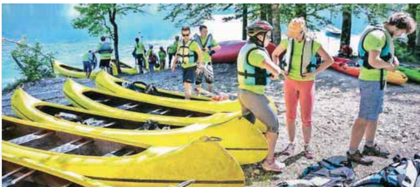
Eko avantura je odlična priložnost za druženje s prijatelji in hkrati športno-zabaven dogodek, primeren za vso družino.