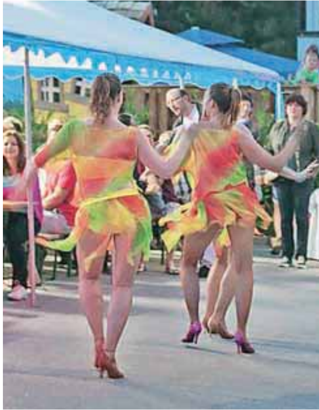
Poletni Medeni vrt je tretjo obletnico praznoval – kot se v času nogometnega svetovnega prvenstva spodobi – v brazilskem vzdušju, za katerega so poskrbele tudi mične pesalke.