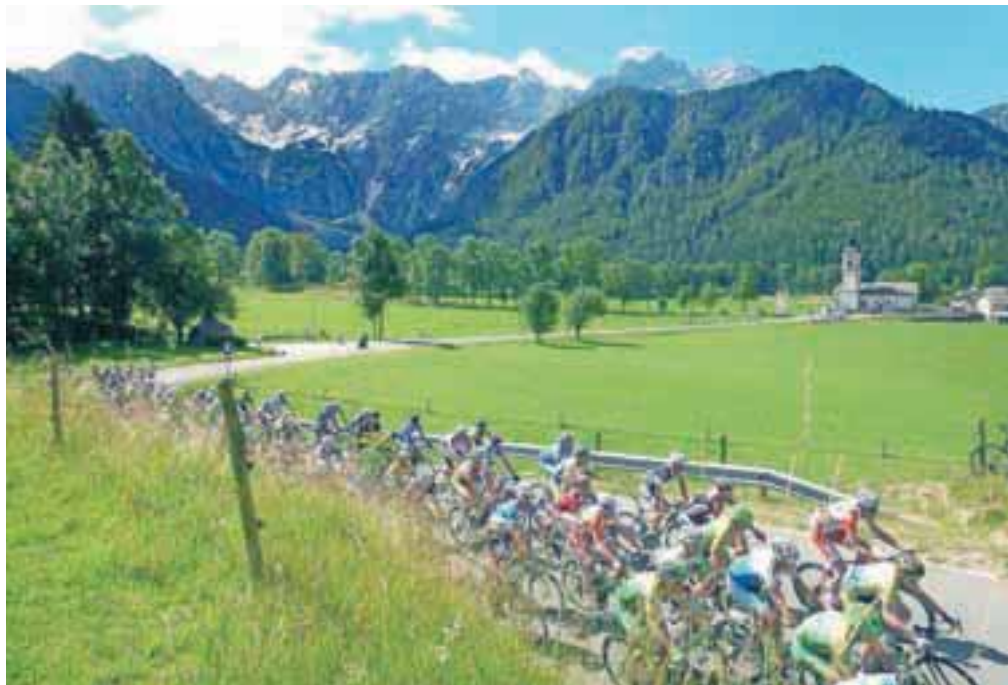
Alpe Scott imajo radi tudi fotografi.

Maraton Alpe Scot vzbujata strah in spoštovanje med kolesarji zato, ker je treba prekolesariti 130 kilometrov in vmes premagati kar dva tisoč metrov višinske razlike. To je enako, kot če bi šli dvainpolkrat čez Vršič.