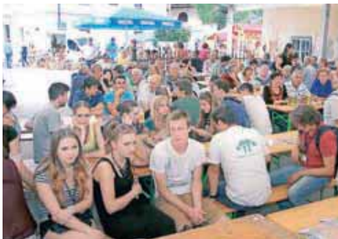
Tudi mlajša generacija se z veseljem udeležuje koncertov in veselic, kjer nastopajo Gašperji.