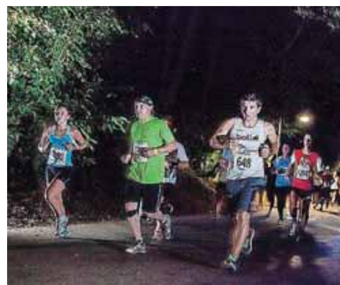
Nočni tek okoli idiličnega jezera je poseben izziv.