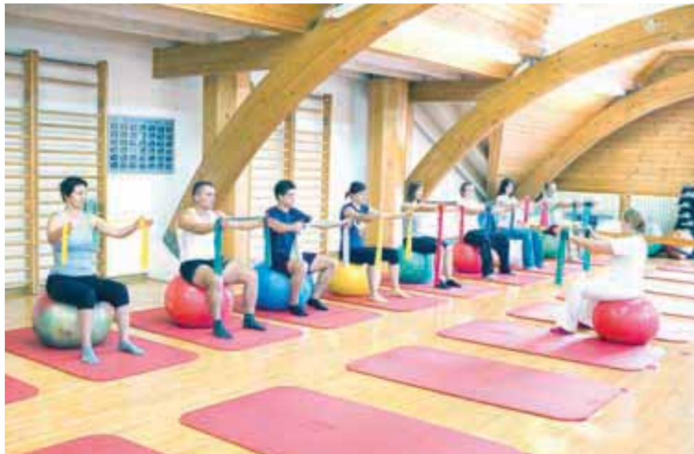
Skupinske vaje

Z a programe zdravljenja in rehabilitacije v Termah Zreče skrbi strokovno usposobljeno zdravstveno osebje, zdravniki z dvanajstih strokovnih področjih ortopedije, kardiologije, internistike, nevrologije, fizioterapije, diplomirani fizioterapevti in drugo zdravstveno osebje, ki poleg sodobne zdravstvene opreme in zdravilnih učinkov naravnih dejavnikov, kot so zdravilna voda, srednjegorska klima in uporaba naravnega zdravilnega faktorja šote, zagotavljajo pospešeno okrevanje in pripravo na ponovno vključitev v vsakdanje življenje in športne aktivnosti po končani rehabilitaciji. Z Zavodom za zdravstveno zavarovanje Slovenije imajo tudi sklenjeno pogodbo o izvajanju programa zdravstvenih storitev. Gre za medicinsko rehabilitacijo pacientov, ki imajo vnetne revmatske bolezni, degenerativen izvzsklepni revmatizem, stanje po poškodbah in operacijah