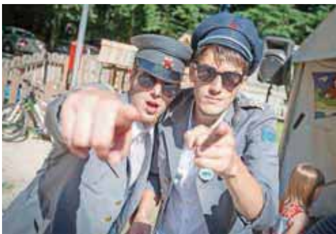
Miličnika sta vse popolne neutrudno lovila Piko Nogavičko.