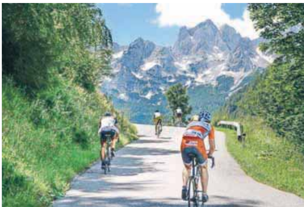
Strma pot v Alpe