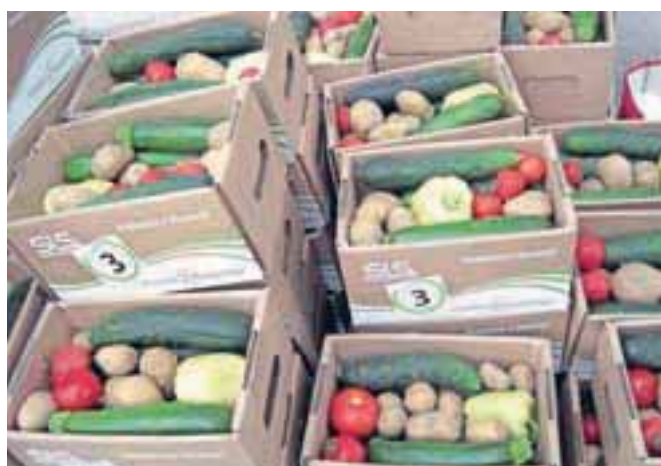
Pri SLS stavijo na lokalno pridelano hrano. Zabožke zelenjave so seveda razdelili med ljudi, za pokušino pa razrezali domačo klobaso in kruh.