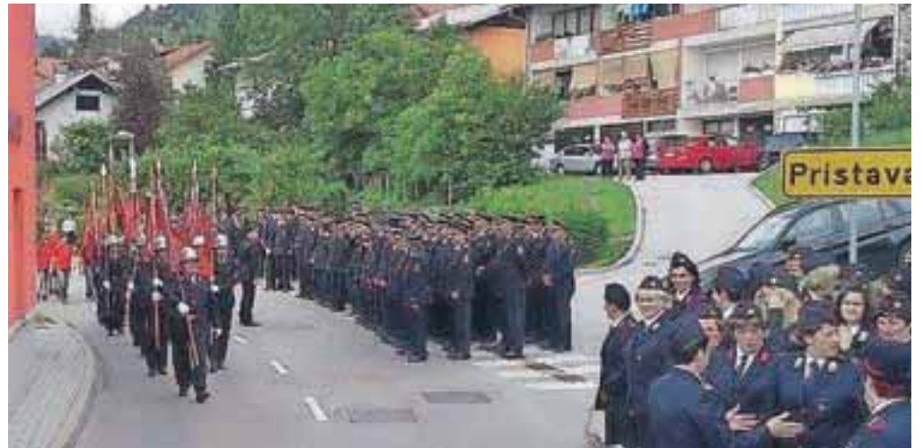
Na gasilski paradi so sodelovale narodne noše, člani Pihalnega orkestra Tržič, preko 130 gasilk in gasilcev ter več gasilskih vozil.