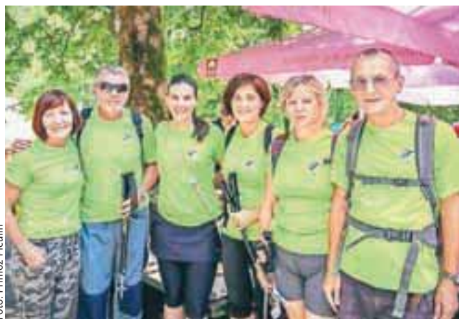
Na avanturo so se v Bohinj podali tud Škofjeločani.