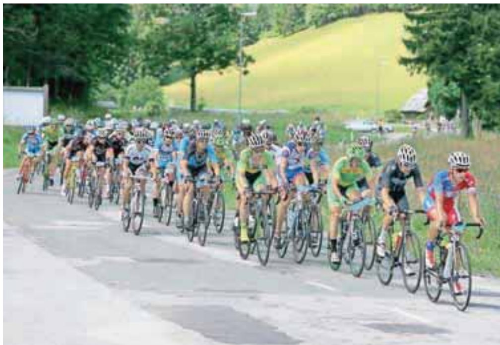
Pisani peloton najlepšega in najtežjega kolesarskega maratona v Sloveniji