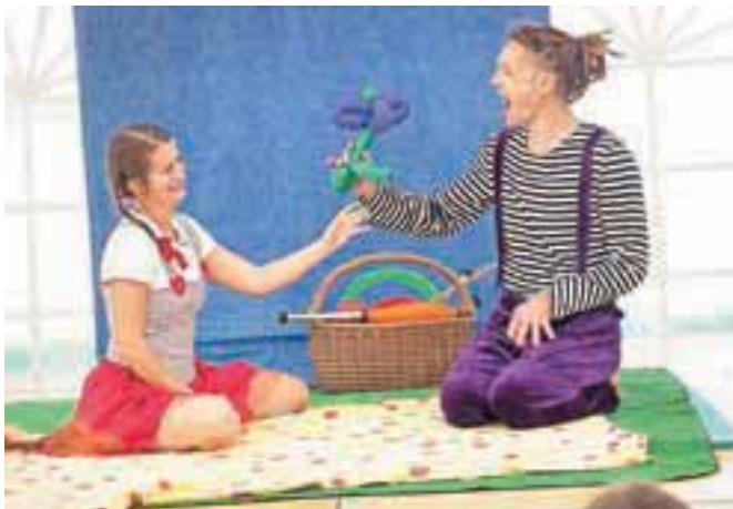
Mednarodna cirkuška predstava Cirkusa La Bulle, Cirkuški piknik / Foto: Luka Renar

Konec tedna v Bohinj prihaja še en festival, glasbeni Festival Kanal. Trajal bo do konca avgusta, za uvod pa bodo v petek poskrbeli izbranci občinstva. Torej: da ne zamudite ponovnega nastopa trubačev.