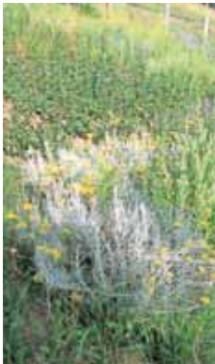
Z laškim smiljem okusimo Sredozemlje tudi doma.

Laški smilj ( Helichrysum italicum ) me je tako očaral ob Sredozemlju in na Krasi, da sem si ga omislila tudi na domačem vrtu. Rastlina ima močno koncentracijo hlapljivih olj, zato ob poletni vročini že na daleč začutimo vonj po Sredozemlju. Grmiček zraste od trideset