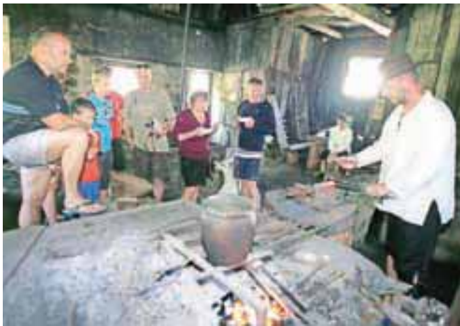
V vigenjcu Vice so prikazali ročno kovanje žebeljev.

Kropa – Ves dan so si obiskovalci lahko ogledovali, kako je bilo videti nekdanje kovaško življenje v Kropi. V vigenjcu Vice so prikazali, kako so nekoč ročno kovali žebelje. V kovanju so se pre-