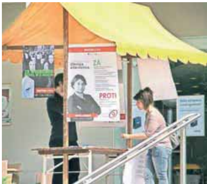
Konec tedna so kandidati še izkoristili za predstavitev na stojnicah.

Glasujemo pa lahko, še preden se bo v nedeljo ob sedmi uri zjutraj odprlo okoli tri tisoč volišč po vsej državi. Od danes do četrta, torej od 8. do 10. julija, lahko predčasno glasujemo na sedežih okrajnih volilnih komisij, ki so praviloma na upravnih enotah ali njihovih