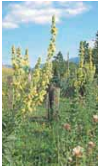
Brez lučnika ni spodobnega zeliščnega vrta.

Ne vem, kako je na vaših vrtovih, moj pa je zadnje dni tako bujen, da je veselje pohajati po njem. No, nekateri bi rekli, da je že podivjan, ampak takšen je zame najlepši. V njem se veselo bohotijo lučnik, sivka, žajbelj, laški smilj, plavice, veliki oman, melisa, mete, pegasti badelj, ajda, ameriški slamnik, ognjič, muškata kadulja, škrlatna in limonska monarda, če omenim le nekatere poletne vrtnice kraljice in kralje.