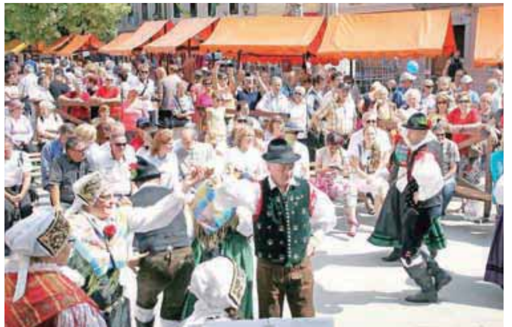
Na srečanju Dobrodošli doma so se predstavile folklorne in pevske skupine iz zamejstva in izseljenstva, na sliki folklorna skupina Slovenskega društva Lipa München.