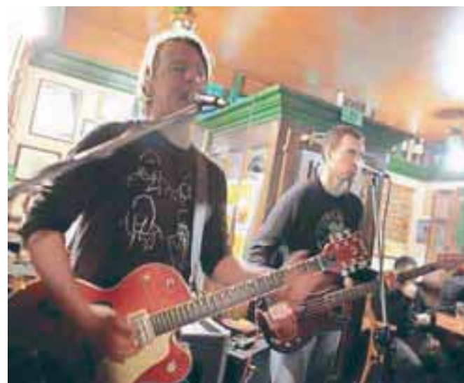
Skupina K.O.S.E. je še vedno v polni formi.