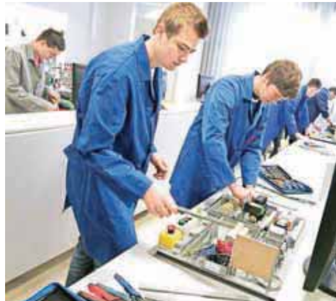
V Šolskem centru Kranj se je v četrtek odvijalo 22. državno tekmovanje elektro šol in 4. državno tekmovanje računalniških šol.

»Danes se je v Kranju zbrala s metana slovenskih dijakov s področja računalništva in elektrotehnike. Prihodnost polagamo v vaše roke,« je tekmovalce pred začetkom nagovoril direktor Šolskega centra Kranj