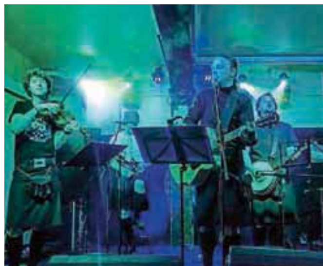
Energija irske glasbe: skupina Beer Belly

V KluBaru pa se bo niz razigranih marčevskih koncertov nadaljeval v soboto, 22. marca, in to s trojno močjo: nastopile bodo skupine Sausages, Hamo & Tribute 2 Love ter Billysi.