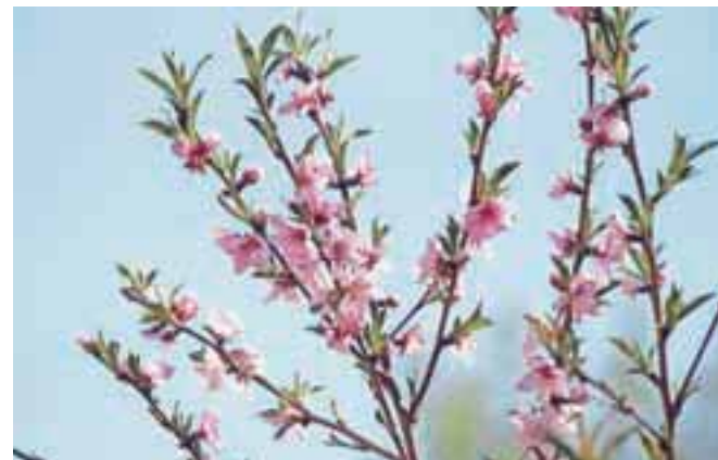
Japonska češnja parku doda pomladno živahnost.

V popoldanskem času je izletnike čakalo še kopanje v hotelskem bazenu z ogrevano in prečiščeno morskovo vodo, tako da so se ob pogledu na velikanski bazen njihova usta le še bolj razlezla v nasmehe.