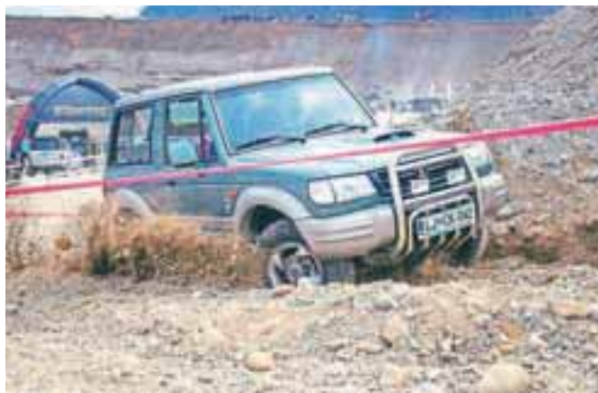
Tudi registrirani, »običajni« terenci so pokazali svoje zmogljivosti.

Tekmovalni del je bil razdeljen na dve stopnji: hitrostno in težavnostno. Najprej so se pomerili spretnostni vozniki v kategorijah: bencinski motor do 2000 kubičnih centimetrov in nad 2000 ter dizelski motorji. Na petstometrski trasi, speljani čez ovire, drn in strn gramozne jame, so morali vozniki prikazati vse svoje vozne sposobnosti in lastnosti avtomobila. Tekmovali so tudi običajni, registrirani terenci, kakršne