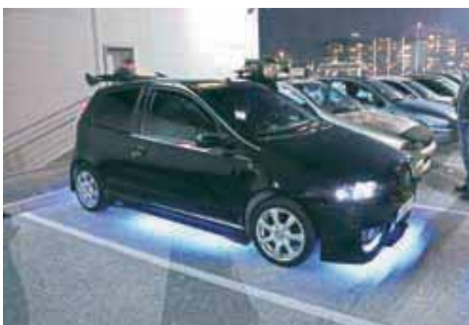
In ko je prišla noč, so se prižgale luči ...