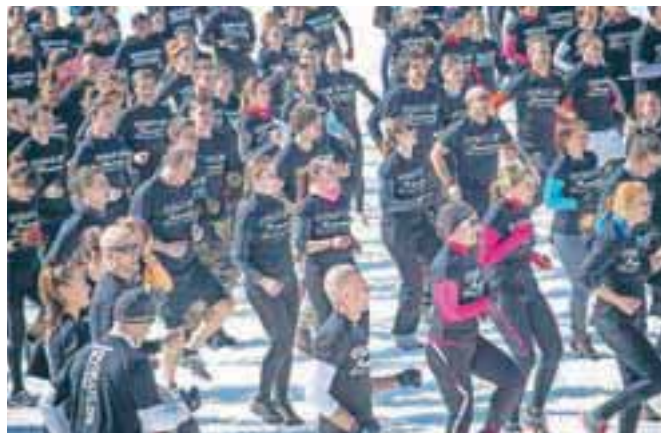
Samo trening je zbral tristo udeležencev!

Fenomenalno! Nepozabno! Noro! Komaj čakam poletni oviratlon! To je le nekaj najbolj pogostih vtisov, ki jih je bilo slišati iz ust udeležencev po končani preizkušnji. Zadovoljni pa so bili tudi organizatorji. »Oviratlonci so znova dokazali, kako pomemben element športnega udejstvovanja sta druženje in dobra volja, saj je bilo ob premagovanju ovir najlepše videti, da na Pokljuko niso prišli le zato, da bi trenirali za junijski oviratlon, temveč tudi ali predvsem zato, da se zabavajo. Naj bo sneg ali blato, dež ali sonce, ovire bolj ali manj zahtevne, oviratlonci navdušujejo s svojo pozitivno energijo, zato ni čudno,