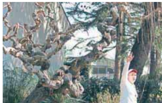
Vrba žalujka