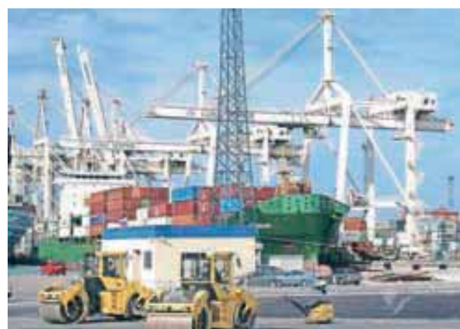
Glasovci smo se po Luko Koper zapeljali z avtobusom.