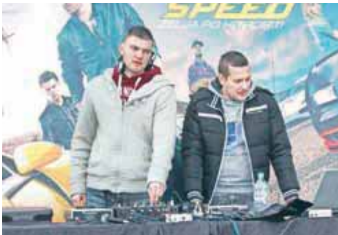
Brez glasbene spremljave na tovrstnih dogodkih ne gre.