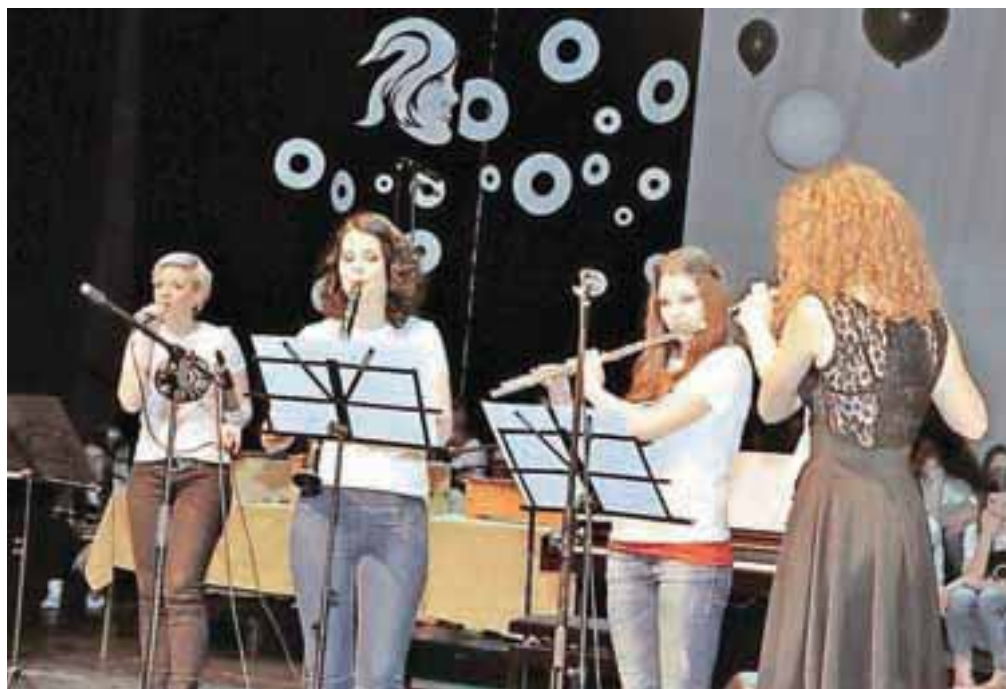
Dijakinje in dijaki Srednje šole Jesenice so letošnji nastop na velikem odru jeseniškega gledališča posvetili slovenski popevki.