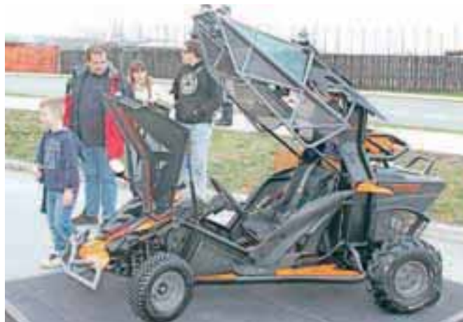
Razstavljeno vozilo, ki je bilo deležno velike pozornosti.