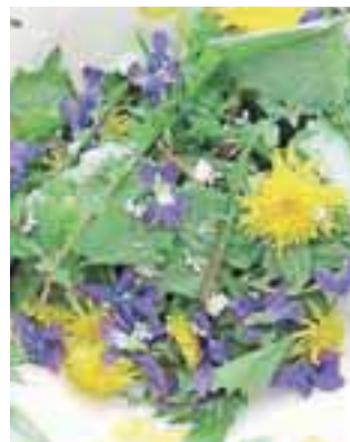
Naj pomladne divje solate kraljujejo na vašem krožniku.

Ti so bogati z železom, prav tako kot regrat. Regrat je kralj spomladanskih solat in čajev za razstrupljanje, zato o njem že vse vemo. Ker regrat velja za grobo solato, ga lahko omeščamo s toplim kuhanim krompirjem ali jajcem. Regratu se odlično poda kvalitetno bučno olje. V ljudskem zdravilstvu uporabljajo koreniko in zelišče za čiščenje krvi. Zelišče regrata deluje predvsem diuretično, olajšuje prebavo in pospešuje krvni obtok. Regrat odpravlja vse zastoje, razstruplja telo in vrača moč. Spomladi pogosto uživamo špinačo iz kopriv in pijemo čaj iz svežih poganjkov, ki jim po želji dodajmo še druga spomladanska zelišča. Zaradi obilice železa mlade koprive prispevajo k obnavljanju rdečih krvničk, krepijo, pomirjajo, zmanjšujejo sečno kislino