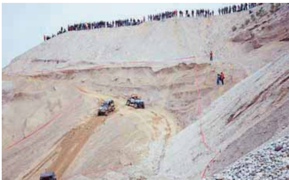
Neverjetne voznje so navdušile gledalce.

srečujemo vsakodnevno na cestah. Ta kategorija je bila zanima predvsem zato, da so se gledalci lahko v živo prepričali o zmogljivosti teh vozil. Vozniki so točke nabirali tudi za skupni seštevek državnega prvenstva v off-roadu. Poslastica dneva pa je bila tako imenovana »hard« preizkušnja. Med seboj so se pomerili najbolj zmogljivi terenci, ki so s svojimi vozniki jemali dih tisočglavi množici, zbrani nad gramoznico Bistra in v njej.