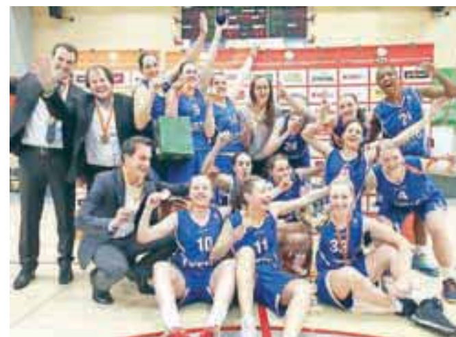
Košarkarice Triglava so osvojile naslov pokalnih prvakinj.