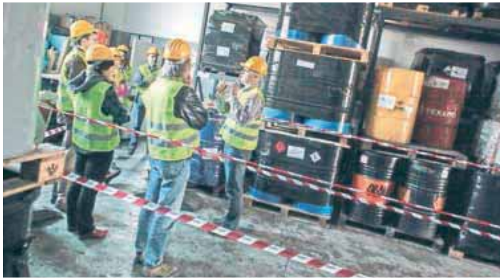
Povabilo na ogled prostorov družb Ekol in Ekorel je prišlo malce prepozno.