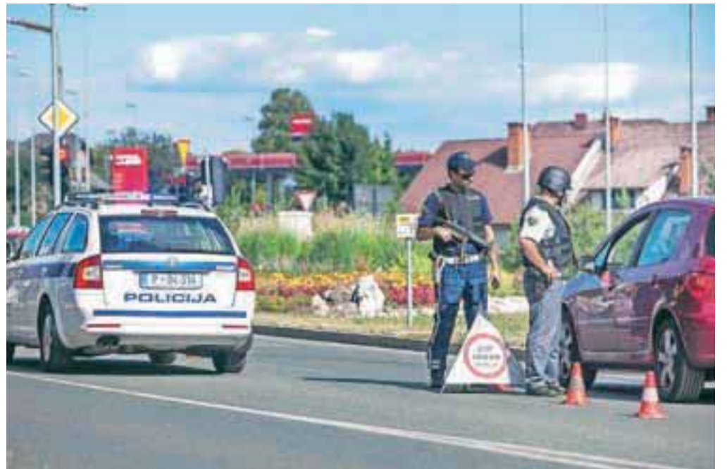
Na Gorenjskem in drugod po državi so kriminalisti včeraj opravili šestdeset hišnih preiskav stanovanj in vozil (slika je simbolična).