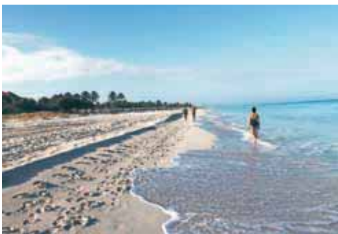
Plaže so za mladoporočence ena lepših dogodivščin.

Osebnost me v Varaderu navdušile plaže, morje in tudi rum, vendar tamkajšnjega najbolj prepoznavnega lahko kupite v vsakem boljše založenem slovenskem supermarketu. Če pa se že odločite za obisk Kube v paketu all inclusive, potem vedite, da so hoteli stari najmanj dvajset let, ne pričakujte evropskega servisa, dolar v teh časih tam nima vrednosti, računov v trgovinah skorajda ne poznajo, po pravi, Kastrovi Kubi pa je v zraku mogoče ostal le še vonj Spomin, ki vse bolj blede In cigare – ne boste verjeli – so najcenejše na letališču. So ali niso originalne Hm, kdo bi vedel.