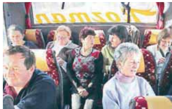
Z nam so bile spet Glasove Muce copatarice, ki so pridno vso pot do Primorske v večini preklepetale in 'preštrikale'.