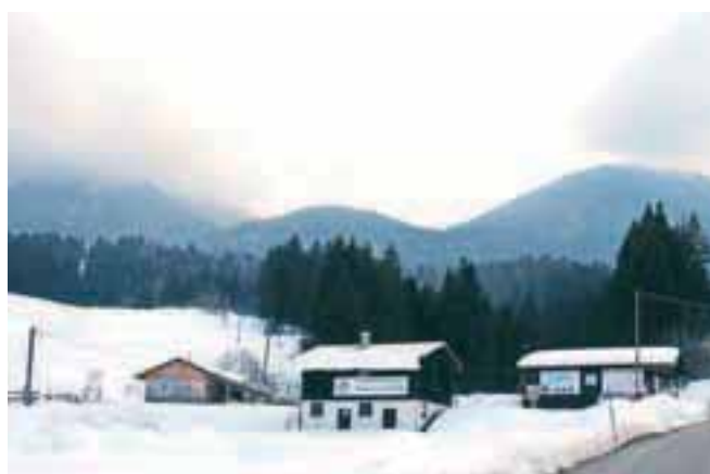
Smučišče Kobra ne glede na snežne razmere že nekaj let ne obratuje, podjetje Kobra ŽTG je bila tudi že odvzeta koncesija.

»Kobra ŽTG bi morala biti že dve leti v stečaju, saj je insolventna in bi