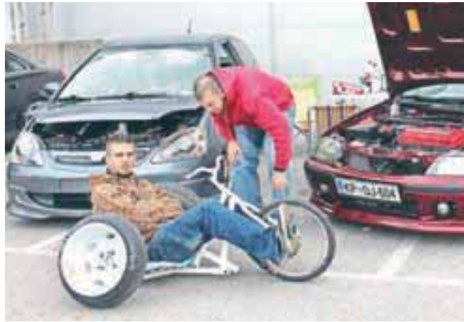
Poleg razstavljenih avtomobilov in dogajanja je pritegnila tudi človeška domiselnost.