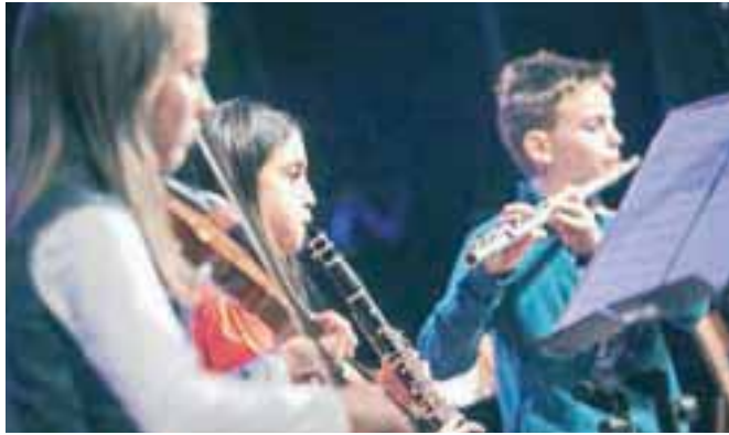
Klarinet je nepogrešljiv instrument v džezu in narodno-zabavni glasbi pa tudi popularne lepše zvenijo.

RUBRIKO MULARIJA ureja Dina Kavčič. Pišite ji na dina. kavcic@g-glas.si ali na koticcek@g-glas.si.