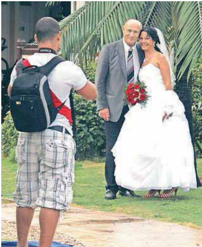
Kubansko-nemška poroka

Seveda me je zanimalo, kako je s klasično predstavo o tem, da lahko na Kubi vidiš mlade Kubanke s starejšimi belci. Havanna ponuja več tovrstnih prizorov, vendar tam nisi pozoren. Ljudje se zabavajo, turisti naročajo jastoge, uživajo v rumu, priljubljenem Hemingwayjevem daiquiriju, glasbi, plešejo Uličnega rajanja, o katerem sem precej slišala v