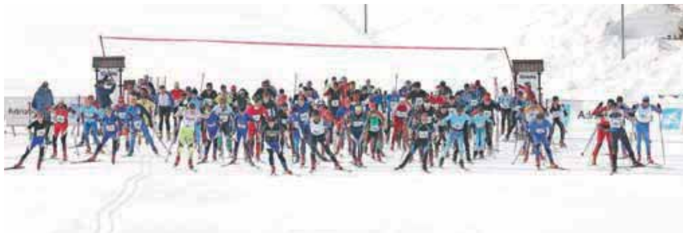
Poključski maraton Adriatic Slovenica spada med najbolj priljubljene v državi.