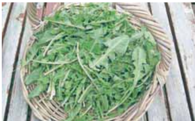
Regrat, kralj pomladanskih travnikov in solat

Za regrat ( Taraxacum officinale ) je znano, da je uporabna cela rastlina, koprive ( Urtica dioica ) pa so najboljše zdaj, ko nabiramo mlade vršičke za sezonske jedi.