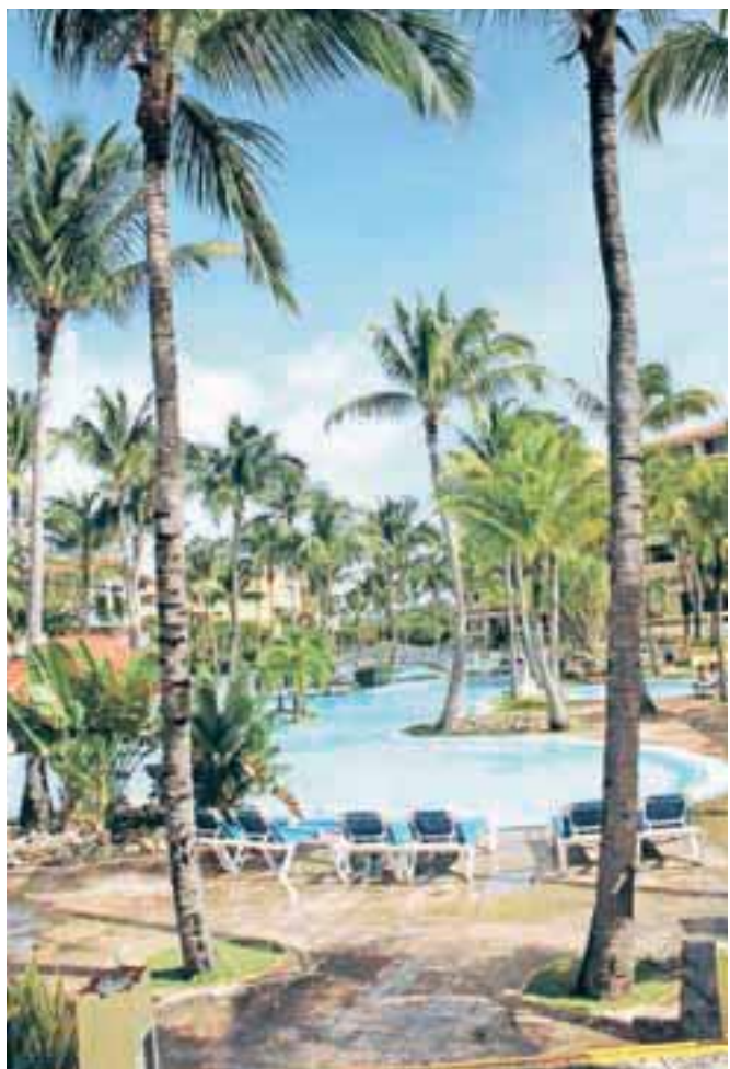
Palme dajo pogledu na bazen piko na i. In senco, seveda.

Upam, da najdete moj odgovor, ker ste pozabili na geslo. Druga polovica marca, april in maj bo za vas zelo dobro obdobje. Dobili boste občutek, da se končno vse postavlja na svoje mesto, in prekipevali boste od energije. To se bo seveda poznalo povsod, zato lahko pričakujete res dobre spremembe. Ljubezen ima prihodnost in kmalu dobite potrditev. Res je, kot pravite sami, vse vaše tegobe so psihološkega izvora. Vaša ranjena duša je utrujena, ampak sonce že sije čez okno, odprite ga na stežaj, z njim pa vse te težave odhajajo. Preveč se ukvarjate z mislimi na druge, čeprav je to vaša družina. Sebe morate postaviti na prvo mesto, počasi se boste naučili. Pri nekom vidim zdravstvene težave, sestra pa ima pred seboj obdobje velikih odločitev, ki ji na koncu prinesejo vse pozitivno. Imejte se radi in srečno.