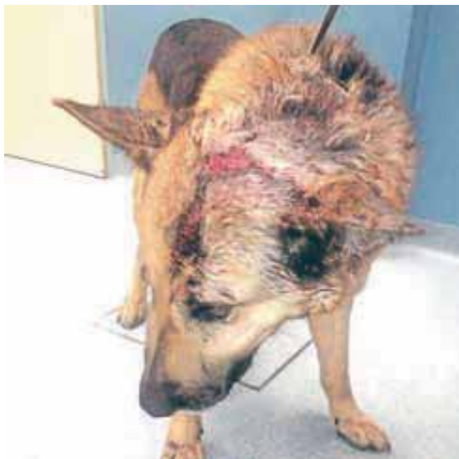
Poškodbe, ki jih je neznan storilec povzročil nemškemu ovčarju Pinu. Če bi kdo psa prepoznal ali ima informacije o povzročitelju poškodb, naj to sporoči policistom.

Kot smo izvedeli na Policijski upravi Kranj, so policisti v tem času na podlagi anonimne ovadbe obravnavali sum mučenja živali po kazenskem zakoniku pri fizični osebi v Žirovnici.