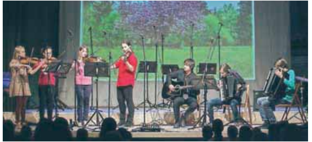
Štiri violine, dve harmoniki, kitara in boben, zanimiva kombinacija za nekaj popularnih countryjskih viž

Mentorji so primerno temu, kar že nekaj dni