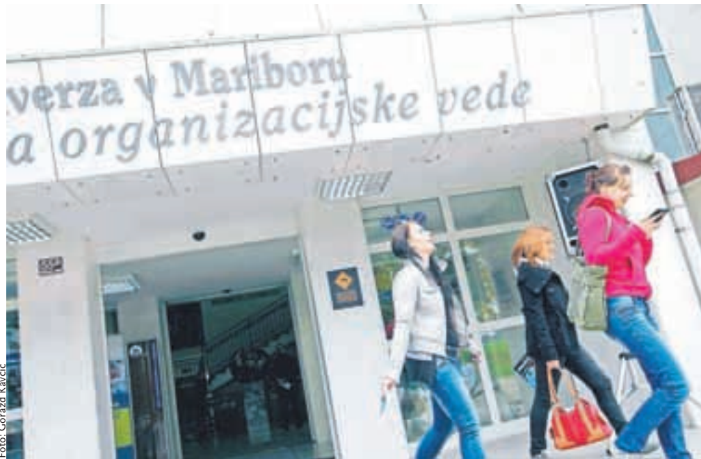
Na Fakulteti za organizacijske vede Kranj na osnovi svojih analiz in pogovorov z vodstvi sorodnih fakultet ocenjujejo, da je zlasti na visokošolskih strokovnih programih skoraj tretjina študentov, ki že ob samem vpisu nima namena študirati (fotografija je simbolična).

Podobno ugotavljajo tudi na Fakulteti za organizacijske vede Kranj, kjer na osnovi svojih analiz in pogovorov z vodstvi sorodnih fakultet ocenjujejo, da je zlasti na visokošolskih strokovnih programih skoraj tretjina študentov, ki že ob samem vpisu nimajo namena študirati. »Študenti posameznih študijskih obveznosti ne opravljajo iz različnih razlogov; eden od teh razlogov je zagotovo tudi fiktivnost vpisa, poudarjamo pa, da to ni edini razlog, da študenti ne opravljajo študijskih obveznosti. Nekateri študenti recimo ugotovijo, da študiju niso kos,« je razložil vodja službe za odnose z javnostjo in promocijo pri omenjeni fakulteti Peter Volf. Tovrstne razloge za prenehanje študija navaja tudi glavna tajnica Visoke šole za