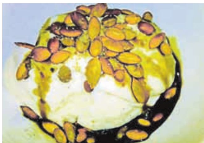
Bučno olje popelje do nebeških užtikov: vaniljin sladoled z bučnimi semeni in bučnim oljem

živce, mišičje in vezivno tkivo. Bučno olje sodi med hranilno najbogatejša olja in deluje spodbudno na ves organizem. Še posebej se priporoča ljudem, ki jim preglavice povzročajo povišan krvni tlak, ateroskleroza, motnje pri uriniranju pri povečani prostati, sladkorna bolezen, očesna obolenja, osteoporoza in različne kožne bolezni. Bučno olje se uporablja tudi za masažo pri glavobolih,