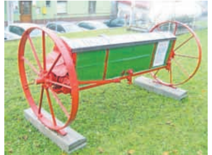
Sto deset let stari vprežni trosilec umetnega gnojila, ki so ga v Slovenijo pripeljali 1946. leta kot vojno pomoč.