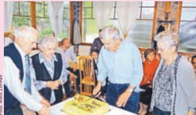
France je s sestrama in bratom razrezal čebelarstvo torto.