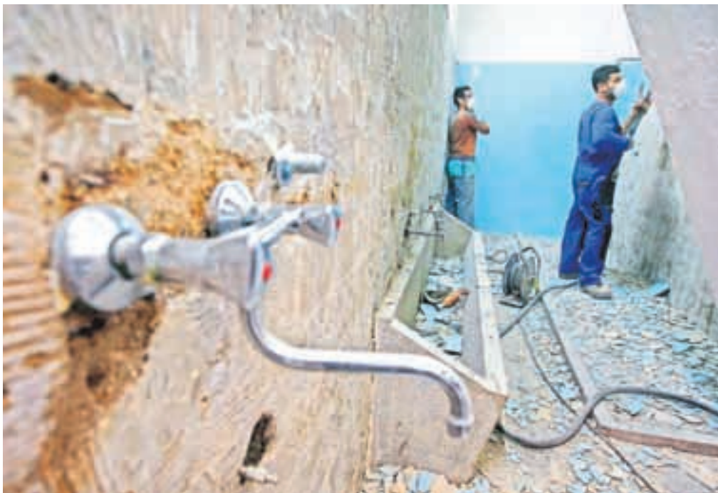
Pred dnevi se je pod staro tribuno v športnem centru Kranja vendarle začela vsaj prenova kopalnic in garderob, gradbena dela pa naj bi bila končana do 20. novembra.

»Najprej se je razmišljalo zgolj o obnovi dveh