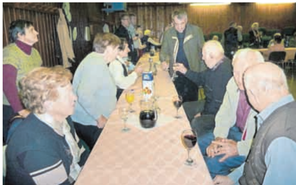
Na zdravje na srečanju najpomembnejših Poljancev

da občina že vrsto let zapravlja davkoplačevalski denar za Veliko planino, za katero še vedno nima jasne strategije, sprejeli sklep, da občinska uprava in družba Velika planina do januarja seje občinskega sveta pripravita investicijski načrt, iz katerega bo razvidno: kapacitete žičniškega sistema, izbor vrste sedežnice glede na kapaciteto, pridobitev treh ponudb za izbrano vrsto sedežnice, finančna konstrukcija in roki izvedbe.