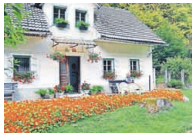
V občini Preddvor je veliko hiš z lepo urejeno okolico, ne le tistih, ki so jih nagradili na oktobrski prireditvi turističnega društva.