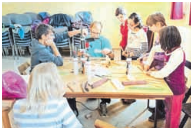
Pri izdelovanju miniaturnega kozolca

Sekcija 55 pri KUD-u Smednik je tako kot vsako jesen organizirala Circus Maximus. Nekateri verjetno mislite, da je to čisto pravi cirkus, toda motite se. To so delavnice za osnovnošolce. Tam se vedno najde za vsakega vsaj ena zabavna delavnica. Letos so bile: izdelovanje majhnih kozolcev iz ostankov lesa, izdelovanje različnih stvari iz modelirne mase, izdelovanje posebnih voščilnic in travkov, to so figurice iz žaganja, najlonskih nogavic, travnih semen in dodatkov. Tukaj se otroci družimo med seboj, spoznavamo nove prijatelje in se zelo zabavamo. Meni je bila najbolj všeč delavnica, pri kateri smo izdelovali tablice iz modelirne mase. To delavnico je vodila moja sestra Valerija. Izdelovali smo podlage in nato nanje napisali svoja, lahko pa tudi druga imena, recimo sester, bratov, očetov, mam Ana Žebovec, 7. razred