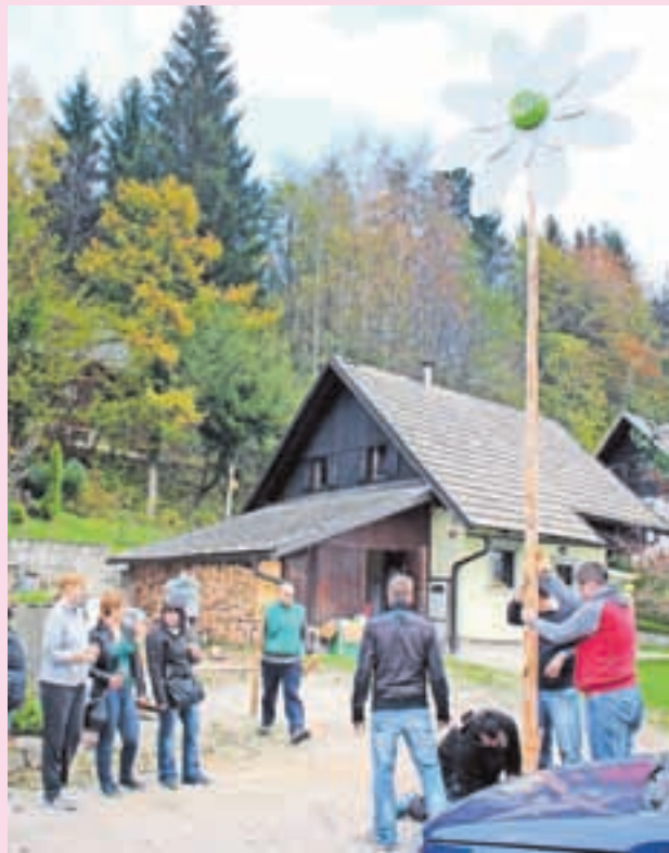
Postavljanje velikanske marjetice ni bil mačji kašelj.