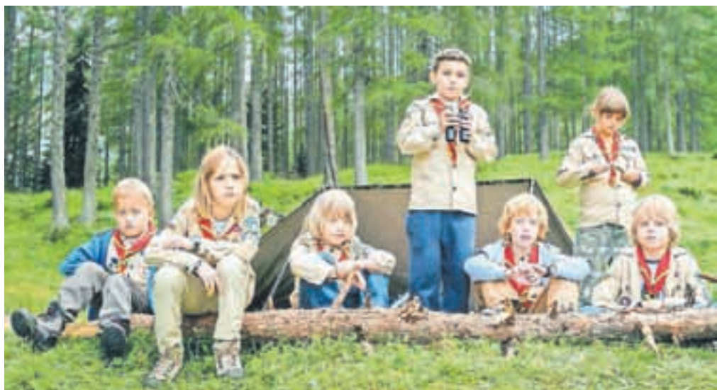
Nadebudni malčki poskrbijo za še dodatno 'veselje' v taboru.