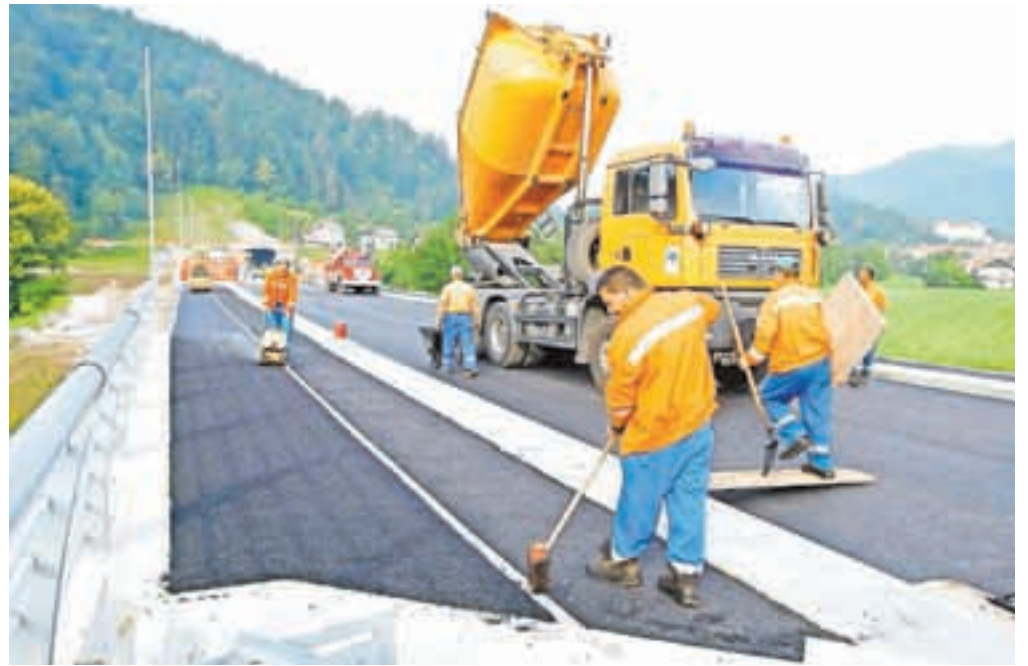
Gorenjska gradbena družba je pred meseci zaključila gradnjo prve faze škofjeloške obvoznice. Bo obveljala odločitev, da bo lahko gradila tudi preostali fazi obvoznice?