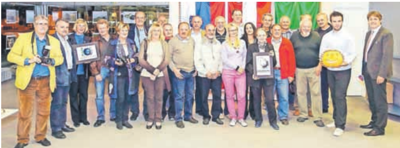
Razstava, ki povezuje: člani treh fotoklubov (Trzič, Feldkirchn, Trbiž) na odprtju v Bistrici pri Trziču