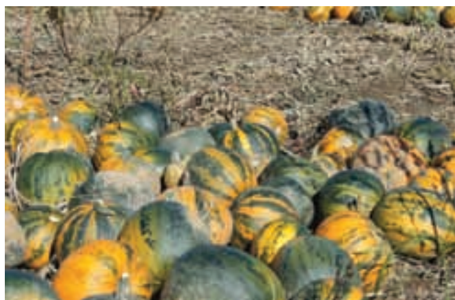
Velike zaobljene štajerske golice za veliko zdravja

Bučno olje sodi med redka olja z maščobnimi kislinami omega-3, ki jih človeško telo nujno potrebuje za normalno delovanje. Omejene kisline krepijo imunski sistem, ščitijo organizem pred vnetji, varujejo srce in ožilje, znižujejo raven trigliceridov in povečujejo raven dobrega holesterola. Bučno olje je tudi bogat vir delta-7-sterolov, ki delujejo proti povečanju prostate. Poleg tega je pravcata shramba vitaminov in mineralov, ki so v pomoč pri odvajanju vode, krepijo