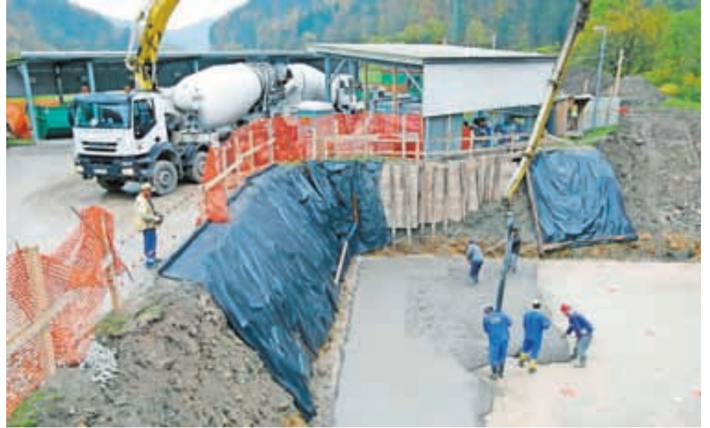
Na Studenem so stekla gradbena dela na čistilni napravi.

»Ugotavljamo, da smo obrobne občine glede