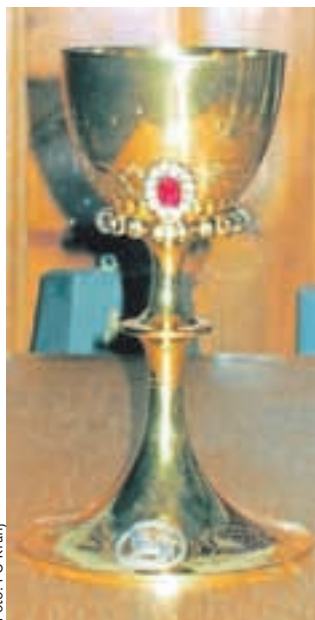
Ukraden Vovkov kelih

Tržič – V petek ponoči je neznan storilec vlomil v župnišče v Tržiču ter ukradel kelih in podstavek za hostije, so sporočili s Policijske uprave Kranj. Iz župniških prostorov je izginil t. i. Vovkov kelih (na sliki), ki so ga leta 1938 verniki iz Tržiča podarili tedanjemu tržiškemu župniku Antonu Vovku ob 10. obletnici njegovega mašniškega posvečenja. Ukradeni kelih, ki je v lasti župnije Tržič, je bil del priložnostne razstave ob 50. obletnici smrti svetniškega ljubljanskega škofa Antona Vovka, ki letos potuje po Sloveniji. V Jožefovi dvorani v tržiški župniji so razstavo odprli 28. oktobra, na ogled pa naj bi bila do 10. novembra. Pred