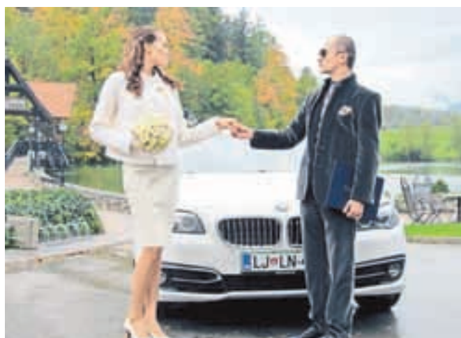
Za usodni 'da' je par izbral Preddvor.