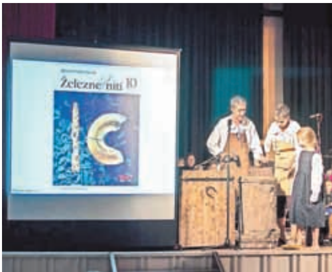
Na prireditvi ob izidu desete številke Železnih niti so prikazali, kako so včasih kovali železo.