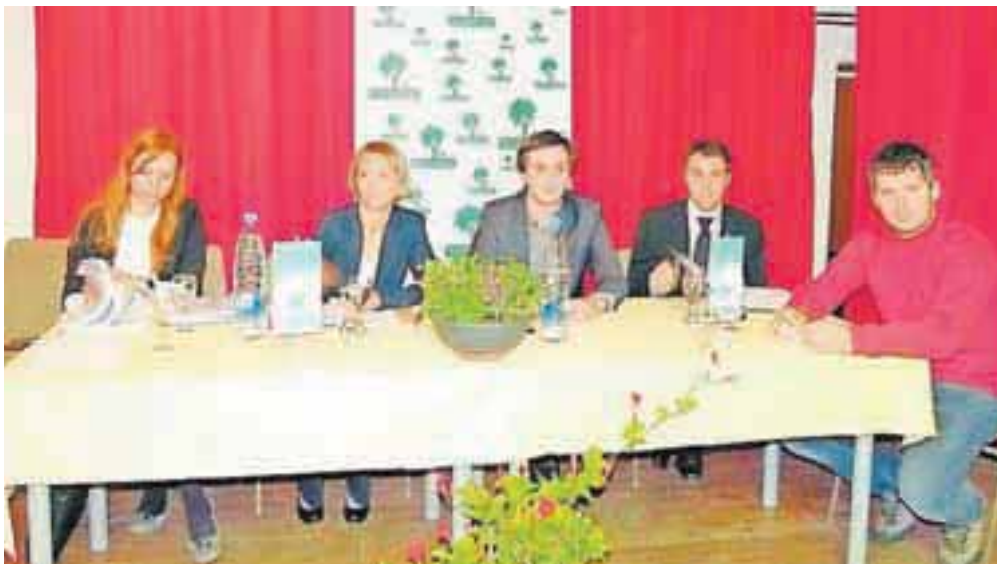
Na predstavitvi zakona v Ratečah

skupne lastnine je bilo potrebno soglasje vseh članov, kar je bilo težko doseči zlasti v agrarnih skupnostih z velikim številom članov. S spremembo zakona pred dvema letoma so za določene posle (npr. za najem) uveljavili tričetrtinsko soglasje, vsi drugi problemi pa so ostali nerešeni. »Novi zakon naj bi agrarnim skupnostim omogočil, da bodo svoje premoženje lahko normalno upravljale in da bodo od tega premoženja tudi čim več imele,« je dejala Strniševa in dodala, da se bodo o glavnih zakonskih rešitvah poskušali najprej uskladiti z agrarnimi skupnostmi. Če jim bo to uspelo, bodo zakon novembra dali v