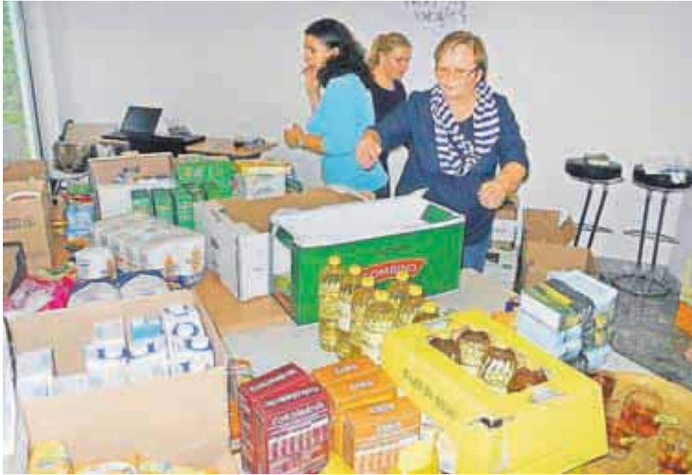
Prostovoljci – darovalo je okoli petdeset družin in posameznikov – so doslej zbrali že okrog dve toni hrane.

jeseniskim družinam, zlasti tistim, ki niso na nobenem seznamu drugih organizacij. Do podatkov smo prišli s pomočjo občanov in s terenskimi delom. Nekateri pridejo po paket na sedež društva UP, kjer zbiramo hrano, nekaterim pa smo pakete prinesli na dom. Pomoč je prejelo tudi nekaj družin v Žirovnici in Mojstrani,« je povedal Pašić. Doslej so tako s paketi razveselili že prek petdeset družin. »Glavni namen je pomagati ogroženim družinam na Jesenicah in jim poslati sporočilo, da niso same in da jim bomo skušali pomagati. Stiska je velika, predvsem zato, ker ni služb,« je dodal Pašić. Hrano je še vedno mogoče darovati, zbirajo jo na sedežu društva UP na Spodnjem Plavžu na Jesenicah. In še zahvala ene od mamic, ki je prejela paket: »Hvala vam za hrano, vsake stvari, ki jo dobim, sem zelo vesela in sem vam iz srca hvaležna. Mi je pa nerodno, ko moram prositi ... Hvala ...«