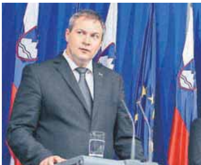
Minister za kmetijstvo in okolje Dejan Židan je napovedal sprostitve trga dimnikarskih storitev.