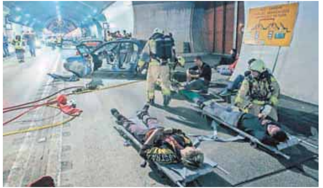
Delo govori svoj jezik. Če se bo v tunelu kdaj kaj zgodilo, bomo šli noter, zato smo tu, pravijo jeseniški poklicni gasilci Gars Jesenice. / Foto: Matic Zorman

Gasilci ocenjujejo, da se bo varnost v tunelu dokončno izboljšala šele z dograditvijo druge cevi, ki naj bi bila zaključena 2019, vendar je po dograditvi druge cevi predvidena prenova prve, tako da bo karavanški predor