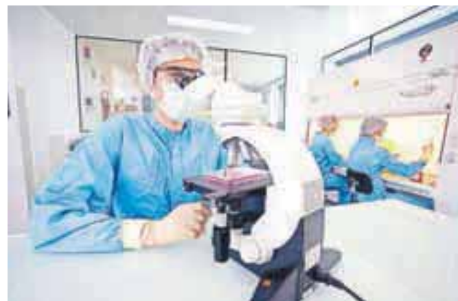
Najbolj inovativne so družbe, ki veliko vlagajo v raziskave in razvoj.