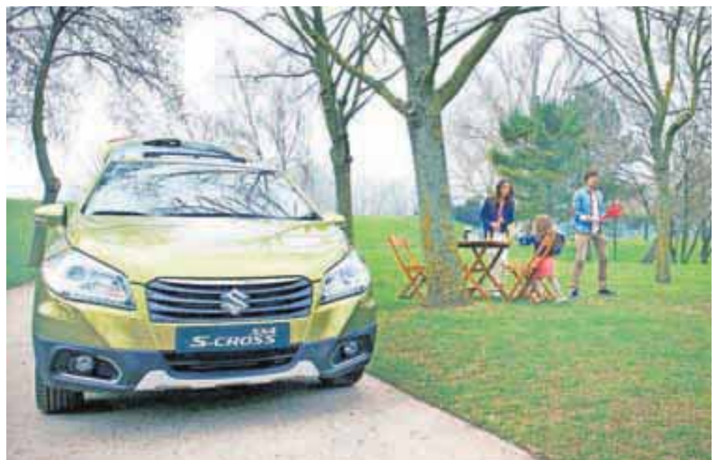
Avto s tisočeri lastnostmi

Na koncu še letošnja prodajna novost. Suzuki s prejšnjim zastopnikom za slovenski trg ni imel ravno najboljšega partnerja, zato je prišlo do menjave, ki obljublja korenite spremembe. Madžarski Suzuki je prišel v Slovenijo in bo s slovensko podružnico in že uveljavljenimi prodajalci po skoraj vsej državi začel novo zgodbo, s katero bi spisali napredek, v katerem bi v dveh ali treh letih iz 0,4 odstotka tržnega deleža prišli do dobrega enega odstotka celotnega trga.