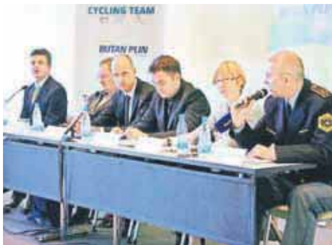
Pobudniki in pravi sogovorniki na prvem predstavitvenem srečanju

trud otrok bosta ob zaključku razpisa nagrajena z denarnimi in praktičnimi nagradami, njihove izdelke pa bo po vsakem končanem sklopu ovrednotila strokovna komisija v sedemčlanski sestavi. Aktualne informacije v zvezi z razpisom in drugimi dogodki v sklopu iniciative bodo organizatorji v času trajanja dogodka objavljali na spletni strani projekta www.varnonakolesu.si .