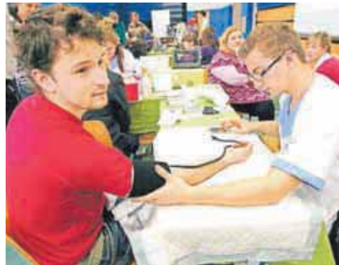
Na Vrtljaku poklicev v Srednji gostinski in turistični šoli Radovljica so imeli učenci možnost spoznati različne poklice.

»Povabili smo učence vseh gorenjskih osnovnih šol. Odzvalo se je 16 šol, tako da smo danes gostili okrog 850 devetošolcev. Poklice so jim predstavili kar dijaki sami,