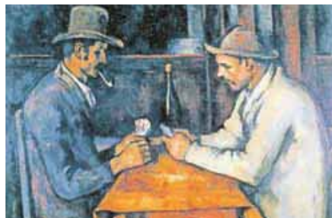
Paul Cézanne, Kvartopirci, 1892. Zanju je katarska šejka odštela 185 milijonov evrov.