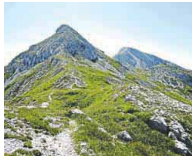
Izravnava pri vzponu na Bogatin; vršni del je krušljiv in nevaren za zdrs.

strmina položi, a le za nekaj korakov, saj sledi še bolj strm in zelo krušljiv vzpon do vrha. Vrh nas nagradi z lepim razgledom na Krnsko pogorje, na Veliko Babo, na dolino Triglavskih jezer, pred nami je greben čez Tolminski Kuk do Vogla in naprej proti Rodici. Z Bogatina sestopimo po strmem in krušljivem grebenu do sedla, kjer sledi vzpon na Mahavšček. Sestop in vzpon nam bosta vzela 30 minut. Z Mahavščka sestopimo po grebenski poti na drugo stran, proti Vrh Škrli, kjer nas smerokaz usmeri levo navzdol proti Planini Govnjač. Pot vijuga med skalami in širnimi travniki Spodnje Komne. Pot, kjer vlada ta mir in tišina. Idila, daleč