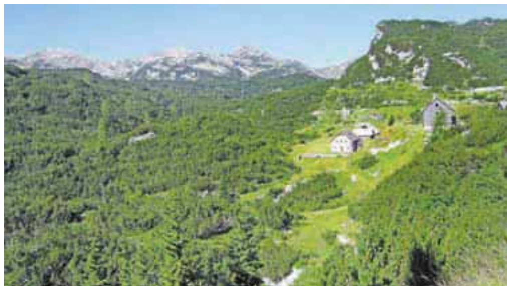
Planina Na Kraju s Kočo pod Bogatinom, zadaj greben Bogatin–Mahavšček–Vrh Škrli

Nadmorska višina: maks. 2008 m Višinska razlika: ok. 1500 m Trajanje: 9 ur Zahtevnost: ★★★★★