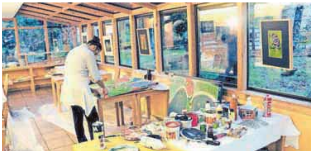
Hotel Kristal v Bohinju prekipeva od umetniških del.