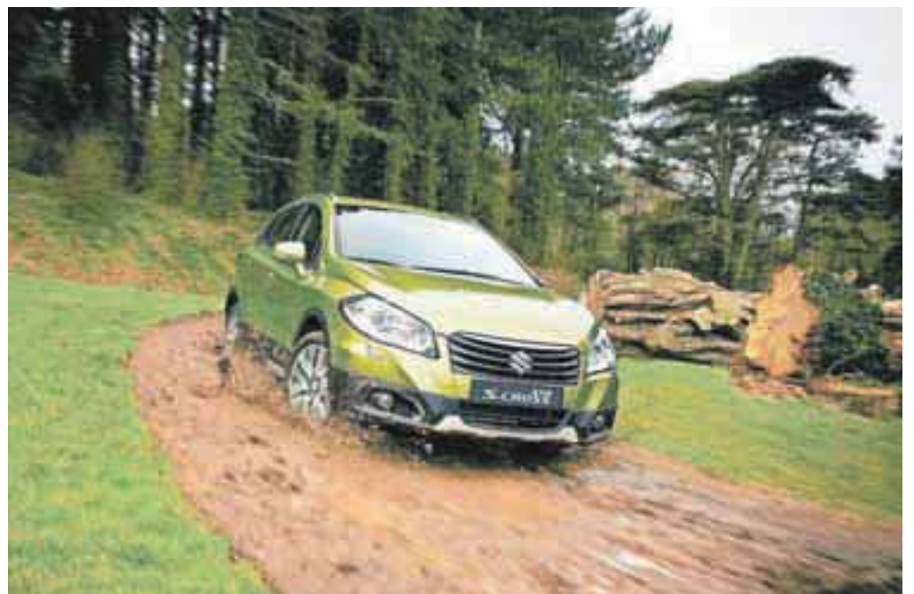
SX4 C Cross

ŽE 20 LET VAŠ PRODAJALEC IN SERVISER ZA VOZILA SUZUKI