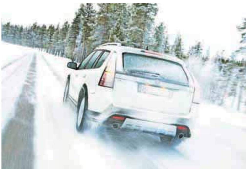
Zima bo tudi letos prišla, naj nas ne preseneti.

in vozila morajo biti pripravljena za zimo. Kaj to pomeni, moramo vedeti prav vsi vozniki brez izjem. Primerne pnevmatike niso edini predmet obvezne zimske opreme, čeprav jih najbolj poudarjamo. In kot smo že vajeni, pridejo okoli 15. novembra polemike, če še ni snega, oziroma lahko se zgodi, da so temperature še čisto jesenske, torej precej nad lediščem. Mar moramo takrat tudi voziti z zimskimi gumami? Ni nam treba, če imamo na letnih gumah zadovoljivo višino profila in če imamo v prtljažniku pripravljene primerne verige. Trgovci v tem obdobju seveda prodajo največ pnevmatik, zato so se tudi primerno pripravili za morebitno »jesensko« različico, torej za primer, da petnajsteja novembra še ni ne duha ne sluha o snegu in so v javnost lansirali podatek, da so zimske gume nujno potrebne že pri zračni temperaturi sedem in manj stopinj Celzija! Gre za marketinški trik, ki nikakor ni škodljiv, vendar če vprašate strokovnjaka, ki nima prodajnih nagnjenj, vam bo povedal, da so letne gume boljše v vseh temperaturnih različicah, razen če gre za klasične zimske razmere, torej sneg in led. Da se pripravite na zimo še pred petnajstim novembrom, pa tudi ni treba več ponavljati, saj smo se zamudniki že dobro navadili stati in čakati v neskončnih vrstah pred vulkanizerskimi delavnicami, kajne?