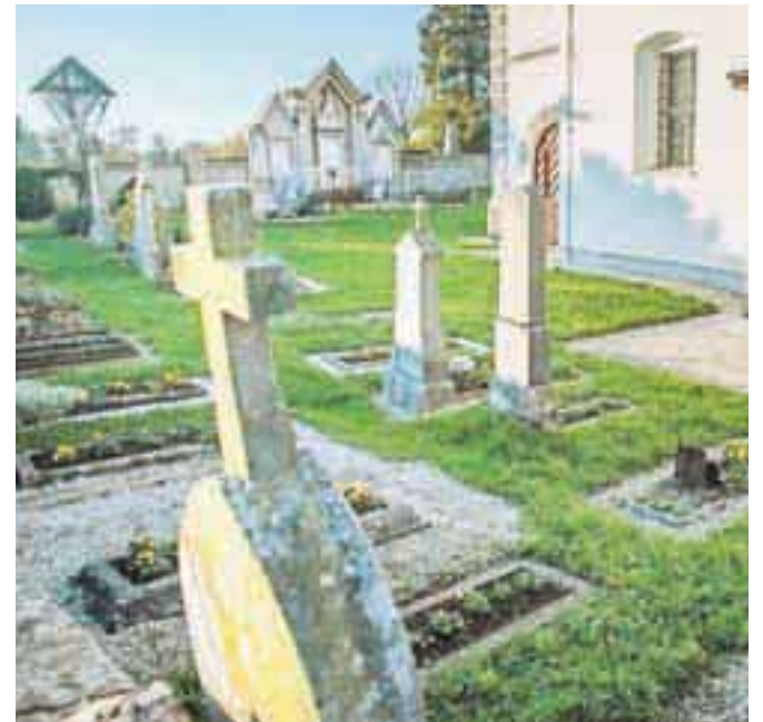
V srednjem veku je bilo tudi zunaj cerkve pomembno biti pokopan čim bližje oltarju.

Prostor ob cerkvi je posvečen in fizično od okolice zamejen na primer z zidom, kar označuje mejo med svetim in profanim. »Na pokopališčih v srednjem veku je vladala nekakšna hierarhična topografija. Pomembna je bila bližina oltarja, prek katerega vodi pot v večno življenje. Odrešenik vas bo teže spregledal, če ste bližje oltarju. Pojavljati se