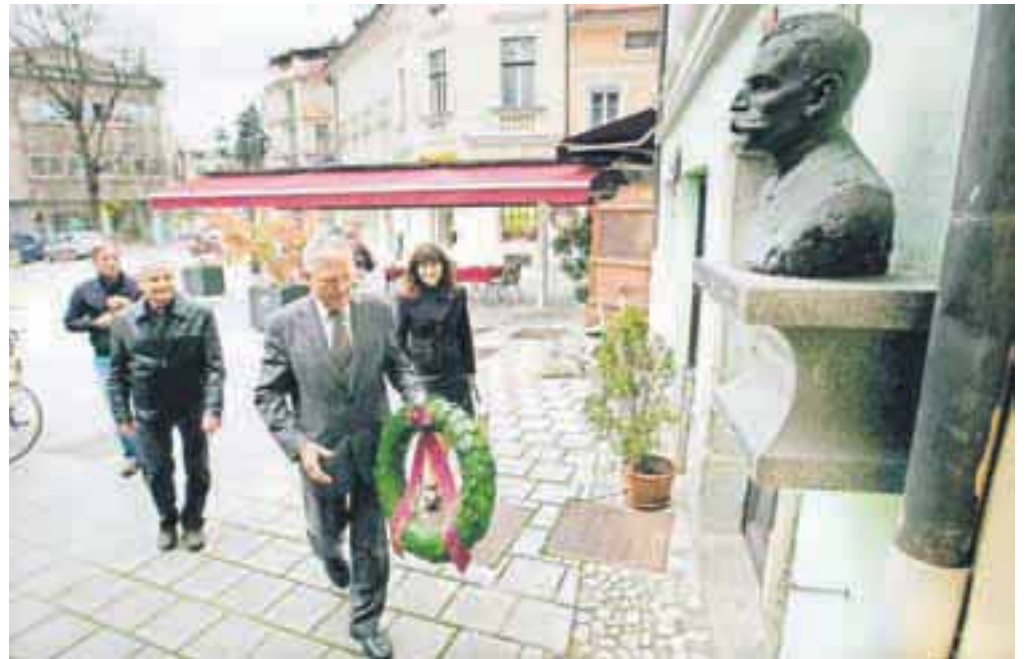
Ob dnevu spomina na mrtve so v Kranju položili cvetje k spomenikom pomembnih mož. Na sliki: polaganje venca k doprsnemu kipu Rudolfa Maistra.

Omenjeni praznični dnevi zaradi ljudi, ki smo jih izgubili, veljajo za žalostne in turobne. Vendar ni treba, da je tako: kljub temu se lahko veselimo življenja in si naredimo prijetne proste dni. Kakor si jih otroci, ki že od začetka tedna uživajo prve počitnice v tem šolskem letu in si zadnji oktobrski dan poživijo z dnevom čarovnic.