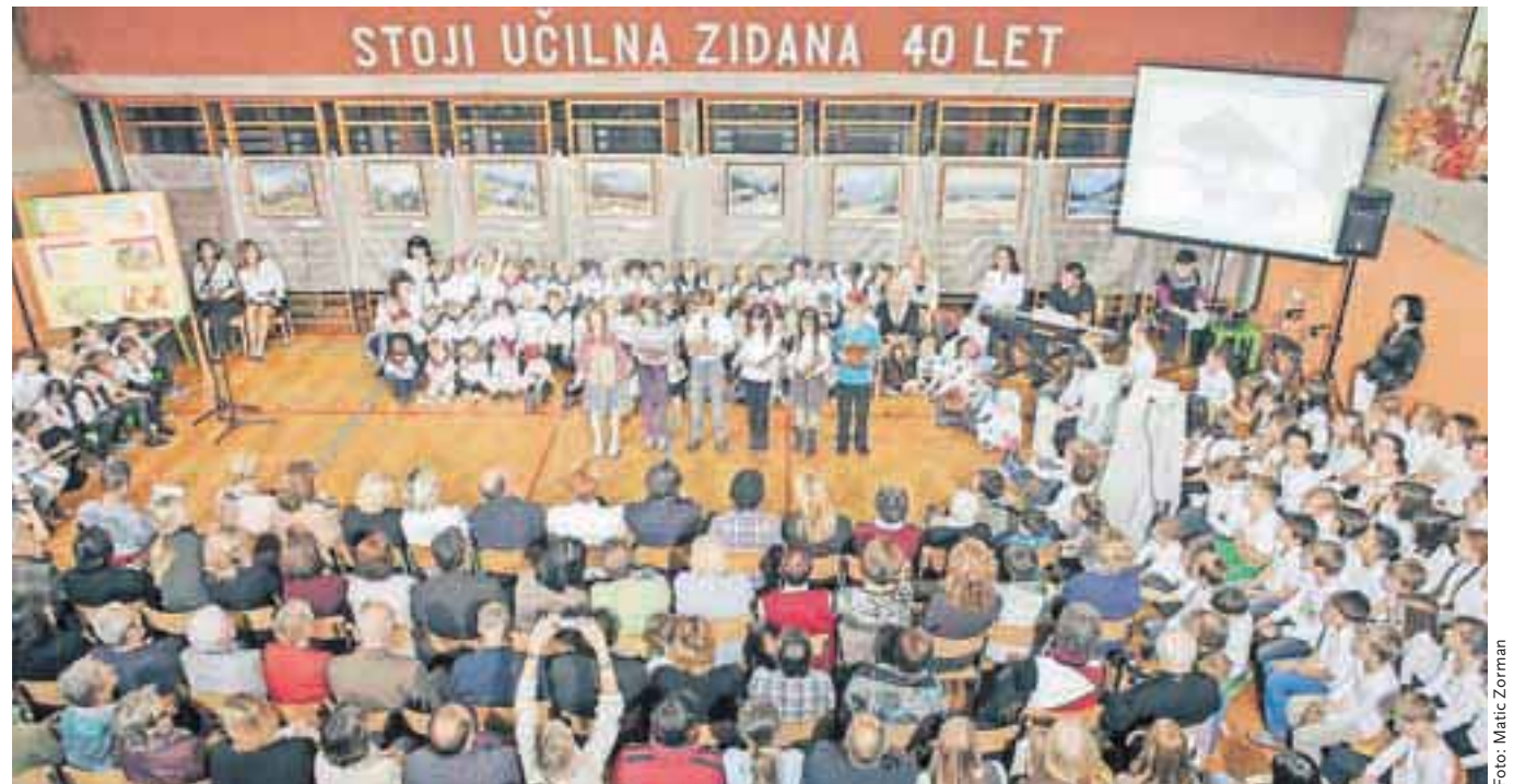
Za lepo prireditev so ob 40-letnici podružnične šole Kokrica minuli četrtek poskrbeli tako najmlajši iz vrtca kot šolarji.