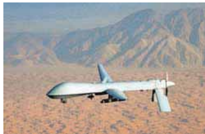
Brepilotno vojaško letalo MQ-1 Predator, »plenilec« visoke učinkovitosti

To naj bi bila šejka Al Majaša bint Hamad bin Kalifa Al Tani, sestra katarskega emirja, 30-letna mati treh otrok, prva dama katarskega odbora za muzeje, njen letni proračun znaša več kot milijardo evrov. S serijo odmevnih nakupov umetnin in financiranjem več razstav se je uvrstila na vrh seznama Power 100, nabora najplivnejših ljudi v svetu umetnosti, ki ga vsako leto sestavi uredništvo revije ArtReview. Pred nedavnim je dosegla nov rekord: odštela je dobrih 185 milijonov evrov za Cezannovo platno Kvartopirci, ta slika je najdražja umetnina, kar jih je kdaj zamenjalo lastnika na dražbi. Umetniki, ki jih ta katarska dama najbolj ceni, naj bi bili Mark Rothko, Richard Serra, Roy Lichtenstein, Francis Bacon, Andy Warhol in Jeff Koons.