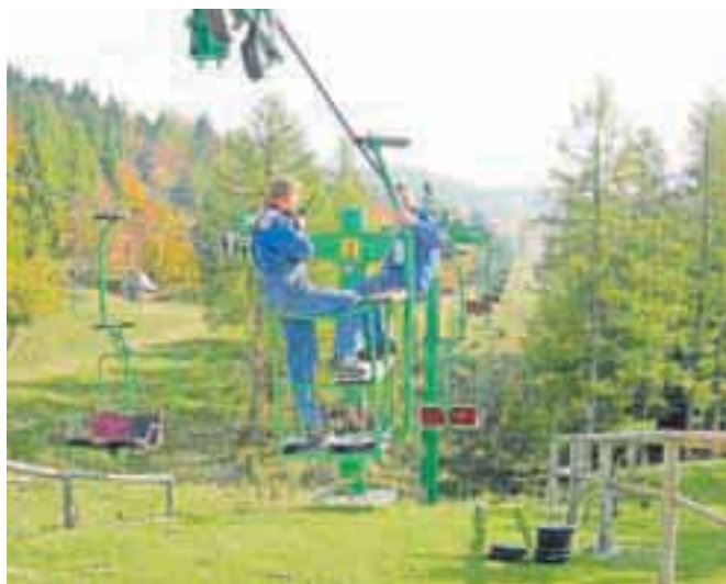
Dvosedežnica Šimnovec je bila zgrajena leta 1986 in je sestavljena iz komponent različnih proizvajalcev, zato sta servisiranje in menjava delov po standardih skoraj nemogoči, opozarjajo v vodstvu družbe Velika planina.

Kamnik – Dvosedežnica Šimnovec na Veliki planini, ki jo upravlja družba Velika planina, je varna in ima obratovalno dovoljenje, ki velja do 21. januarja 2015, a le, če bo naprava prestala vse predpisane tehnične preglede. Nov pravilnik o tehničnih pregledih žičniških naprav je rok za izvedbo izrednega pregleda na dvosedežnici določil za konec novembra letos. »Pregled obsega popoln pregled naprave, še posebej natančno se pregledujejo nosilni in trajno dinamično obremenjeni deli. Na dvosedežnici Šimnovec tak pregled predstavlja demontažo vseh nosilnih prečnih elementov na stebrih, demontažo in pregled vseh nosilnih baterij in kolesnih sklopov, demontažo obračalnega in pogonskega kolesa ter razstavitev pogonskega sklopa, še posebej