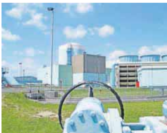
Med letošnjim rednim remontom v krški nuklearni so odkrili tri poškodovane gorivne palice.