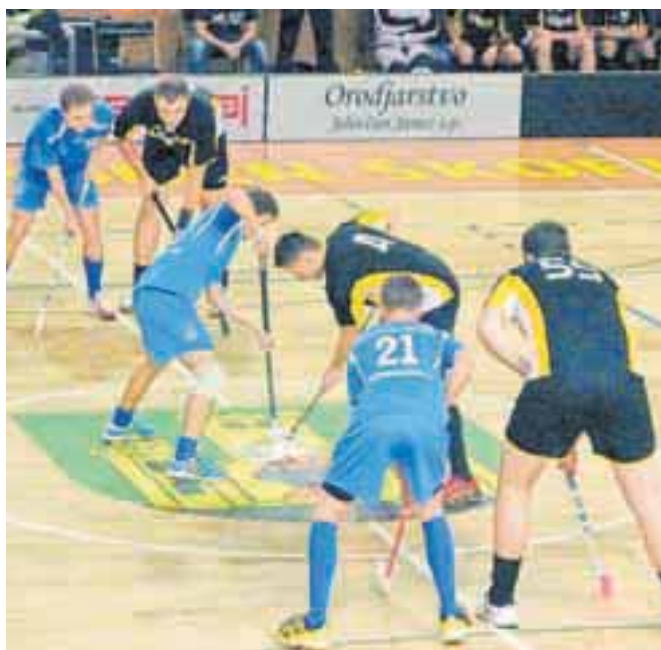
V sobotnem srečanju na Podnu je ekipa domačega InSPORTa (v temnejših dresih) premagala Polansko bando.

Zanimiv je tudi derbi na Vrhniki, kjer je imela ekipa aktualnih prvakov iz Borovnice precej dela z razpoložnimi Žirovci, rezultat pa je