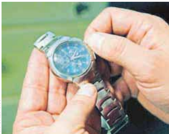
V Sloveniji ure na poletni čas premikamo že trideset let.