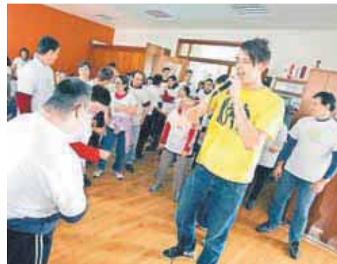
Na vsakoletnem sprejemu v Emmi je tokrat za zabavo poskrbel raper Rok Trkaj.