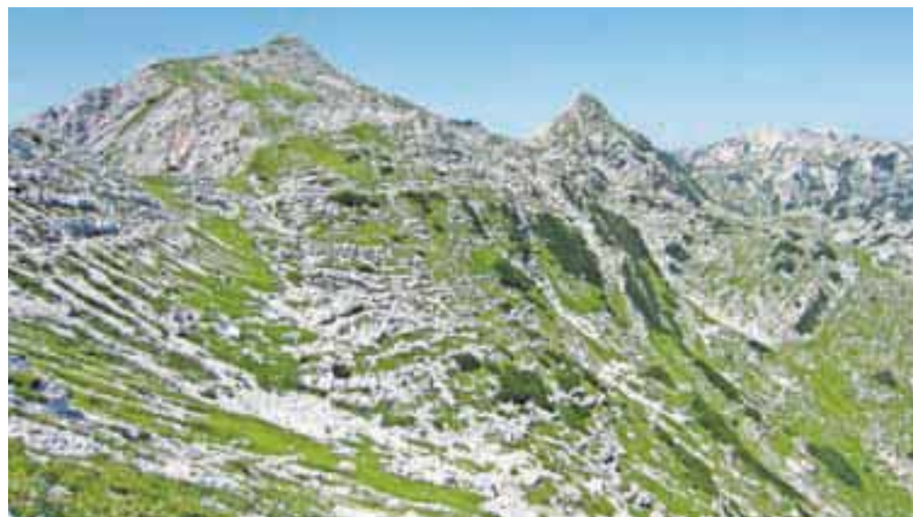
Pogled na Mahavšček in Bogatin s poti mimo Vrha Škrli