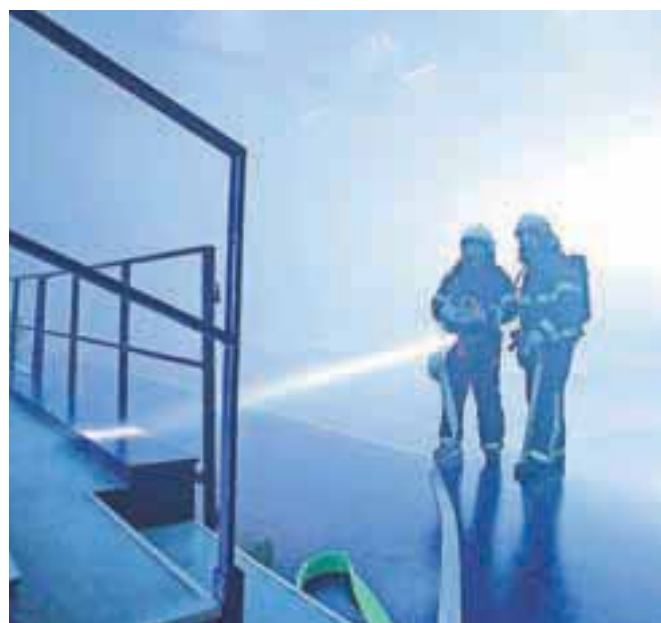
Domžalski gasilci pri preverjanju svojega znanja v Hali Komunalnega centra

Domžale – Scenarij vaje je predvideval hud požar v Hali komunalnega centra, kjer je potekala košarkarska tekma, požar pa so z navijaškimi baklami zanetili razgreti navijači. Teh naj bi bilo v dvorani kar 2500, požar pa naj bi se razširil po vsej športni dvorani in na celoten trgovski kompleks. Kljub obsežni evakuaciji naj bi v prostoru ostalo ujetih trideset ranjenih oseb. Pri reševanju so pomagali gasilci Centra požarne varnosti Domžale in vseh PGD Gasilske zveze Domžale, domžalski policisti, reševalci iz Zdravstvenega doma Domžale,