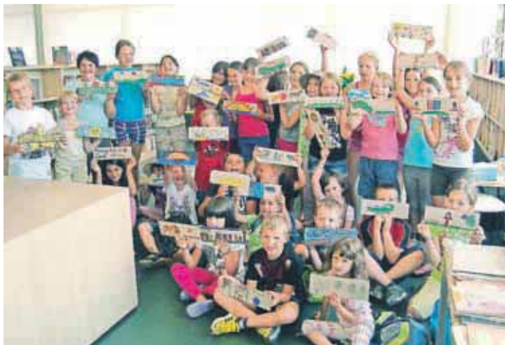
Z ustvarjalnih delavnic v knjižnici

Program so izvajali v sodelovanju s Knjižnico Ivana Tavčarja, Loškimi muzejem, rokodelskim centrom Duo ter