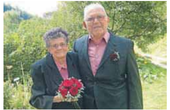
Zlatoporočenca na domačem vrtu v vasi Knape