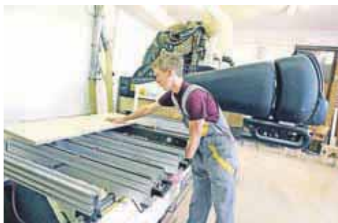
V Srednji šoli za lesarstvo dijaki uporabljajo najsodobnejše CNC-stroje.