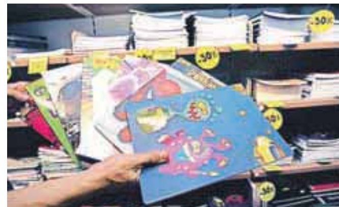
Številni starši si ne morejo privoščiti nakupa novih šolskih zvezkov.