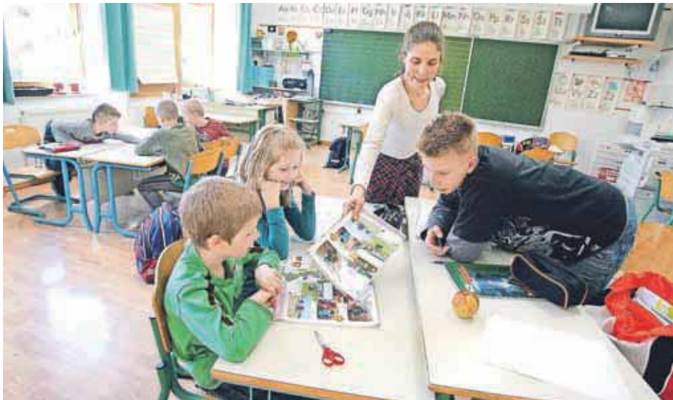
Prihodnji ponedeljek bodo učenci in dijaki spet sedli v šolske klopi.

saj bodo v tem šolskem letu nacionalno preverjanje znanja opravljali prostovoljno. Posamezni obvezni predmeti pa bodo v prihodnjem šolskem letu dobili nova imena. Športna vzgoja se bo po novem imenovala šport, likovna vzgoja in glasbena vzgoja pa se bosta preimenovali v likovno in glasbeno umetnost. Na novo so poimenovali tudi predmet domovinska in državljanska kultura in etika, doslej državljanska in domovinska vzgoja ter etika. Z drugačnim poimenovanjem, so pojasnili pri ministrstvu, se presega delitev na tako imenovane vzgojne in izobraževalne predmete v osnovni šoli.