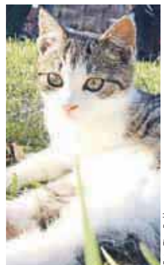
Velik problem so neželena, predvsem mačja legla.

ravnanje z živalmi v taki vročini še vedno prisotno, a ljudje znajo reagirati, če so mu priča, in prijaviti neprimerno ravnanje pristojnim organom. Bolj se soočamo s perečim problemom