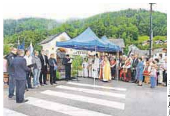
Vsi krajanji Sestranske vasi so po svojih močeh in znanju prispevali k obnovi kapelice sv. Janeza Krstnika.

Ta je svetoval tudi pri obnovi in nadzoroval dela. Poleg zavetnika kapelice so na freskah upodobljeni Marija