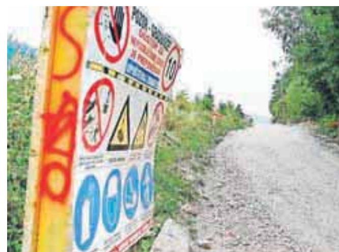
V teh dneh gradijo odsek kolesarske povezave od platoja Karavanke proti Jesenicam.

Del kolesarske povezave skozi občino Jesenice bo