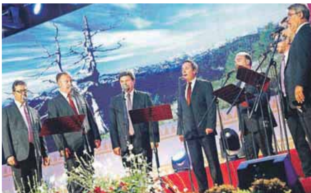
Slovenski okteti, izvrsten izvajalec Avsenikove glasbe v zborovski izvedbi