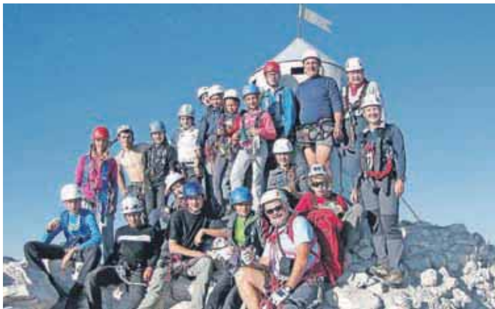
Člani planinskega krožka so skupaj z izkušenimi vodniki osvojili Triglav.