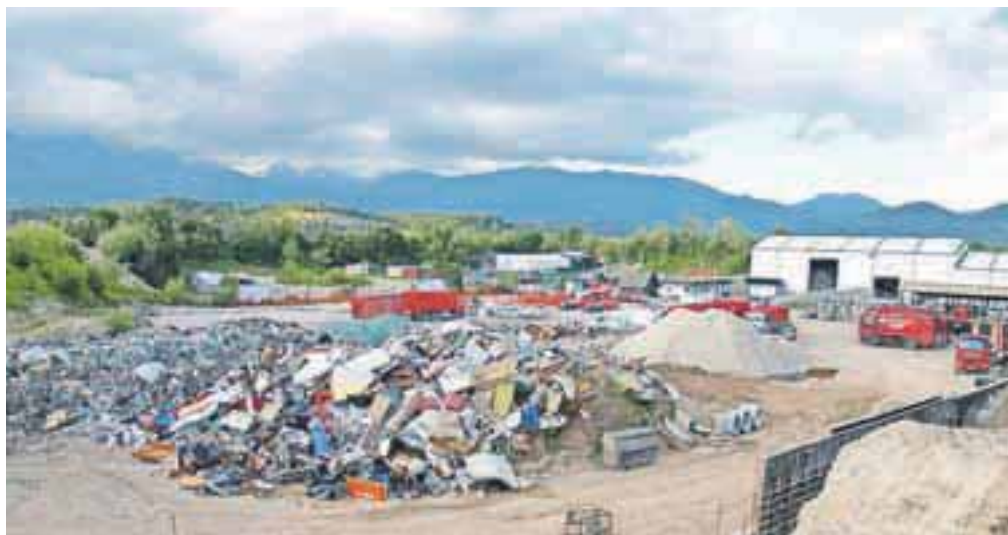
Suhadolska jama leži na prodnatem vodozbornem območju, zato je nadzor različnih dejavnosti tu še toliko bolj pomemben.

V jami danes deluje nekaj podjetij, ki se že dlje časa trudijo dobiti gradbeno dovoljenje za svoje delo, ta pa morajo biti izdana v skladu z občinskim podrobnejšim načrtom, ki ureja to območje. A zakaj teh dovoljenj še ni? »V gramoznici je bila prava zmeda z lastništvom stavbnih zemljišč, saj so bila nekatera v denacionalizacijskih postopkih po naši oceni napačno vrnjena upravičencem, za nameček še cesta do gramoznice uradno sploh ni bila cesta, pač pa njiva. Tako je bilo treba do konca speljati denacionalizacijske postopke, rešiti probleme z novimi lastniki, dobiti služnosti za cesto. Po naših informacijah naj bi prvo podjetje v kratkem končno dobilo gradbeno dovoljenje, potem pa upam, da se bo tudi stanje