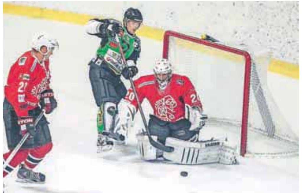
Jeseniški hokejisti so prikazali nekaj lepih akcij, vendar so bili pred golom uspešnejši aktualni prvaki s Tivolija.