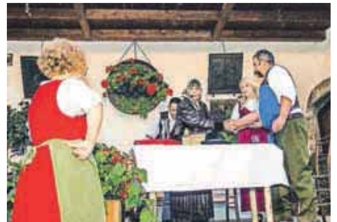
Široka igralna zasedba je na generalki napovedala čudovite septembrske vikende na Mruščevi domačiji.

V treh dejanjih z igro, petjem in plesom nastopa okrog sedemdeset ljudi od igralcev, kar nekaj se jih je v gledaliških vlogah poskusilo prvič, statistikov, kopice bosonogih otrok do konjenikov, folklornikov, pevcev. Prijeten občutek, da je k projektu pristopilo toliko ljudi iz starološke fare pa tudi od drugod, in tematika predstave ter hkrati obujanje spomina na kmečko preteklost nas vodijo skozi skoraj tri ure dolgo predstavo. Premiera veseloigre Dve nevesti bo na sporedu ta petek, 31. avgusta, ob 18. uri, ponovitev bo sta sledili v soboto in nedeljo, prav tako pa se bo šest ponovitev zvrstilo še naslednja dva vikenda. Več o predstavi preberite v petkovi izdaji Gorenjskega glasa.