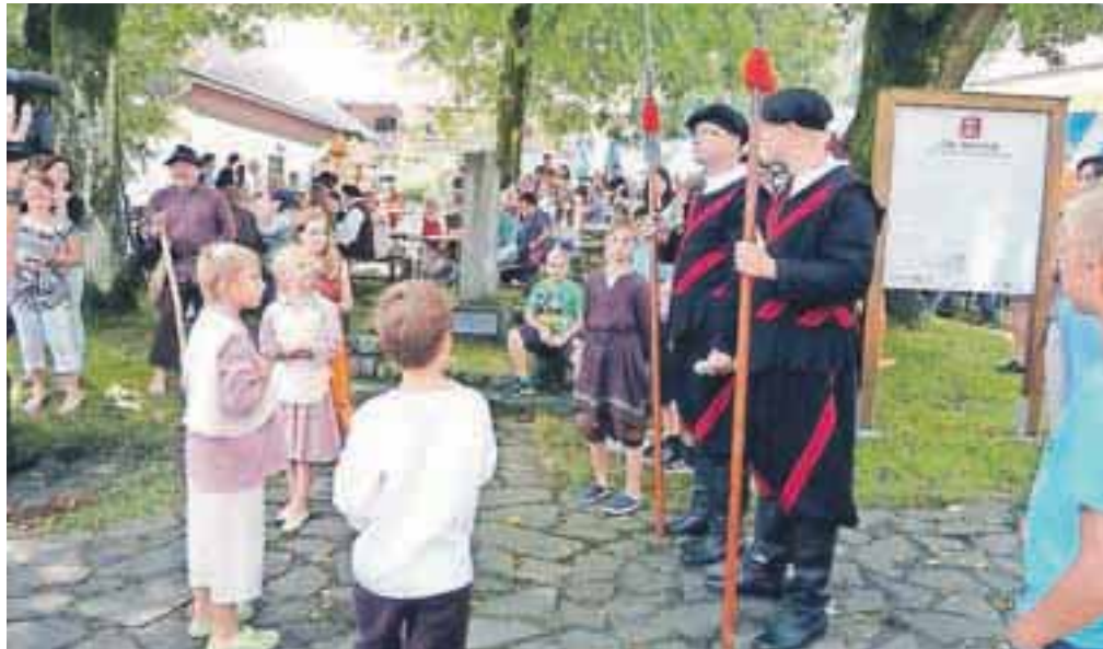
Motniški pranger, ki nosi letnico 1793, je bil v soboto spet v središču pestrega dogajanja.

Na pranger so v Motniku že vseskozi zelo ponosni. Ne le zato, ker so ga med redkimi slovenskimi kraji ohranili do danes, pač pa zato, ker pranger dokazuje, da so v Motniku nekdanje imeli tudi svoje sodstvo. To jim je s podelitvijo tržnih in sejmskih pravic leta 1423 omogočil avstrijski nadvojvoda Ernest Železni. V počastitev 590. obletnice podelitve teh pravic so Motničani v soboto predstavili tudi posebni poštni žig. Letošnje Prangerjato se je sicer udeležilo dvanajst slovenskih mest, Gorenjsko so poleg gostiteljev iz Motnika zastopali še predstavniki iz Radovljice. Prangerji danes sicer ne služijo več svojemu namenu, a pred