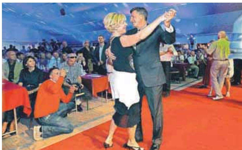
Predsednik republike Borut Pahor se je zavrtil s soplesalko Ireno Svetina z Bleda.