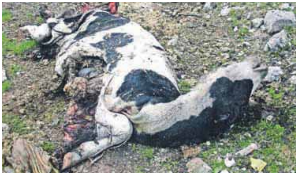
Ostanki trupla telice, ki jo je na planini Suha pokončal in deloma pojedel medved.

Bohinjska Bistrica – Občina Bohinj je v petek na republiko poslala predlog oz. zahtevo za izredni odstrel problematičnega medveda, ob tem pa je tudi predlagala, da bi odločba veljala neomejen čas, to je do odstrela medveda, in da bi medveda lovili na območju lovišč Stara Fužina, Bohinjska Bistrica, Nomenj, Gorjuše in Triglavski narodni park. »Škoda, ki jo je povzročil medved, je bistveno večja od vrednosti telice,« ugotavljajo v bohinjski občini in dodajajo, da so živali, ki jih medved preganja po planini, prestrašene, vznemirjene, bežijo v dolino, se ne pasejo, to pa se posledično odraža na upadu teže in mlečnosti. Čeprav naj bi planinska paša razbremenila kmete dela za živino, je zaradi medveda zdaj ravno obratno. »Lastniki živali izgubljajo dragoceni čas z iskanjem in vračanjem živali na planino. Doslej so za to porabili že več kot sto ur,« so v pismu, naslovljeno agenciji, zapisali v občini in poudarili, da je Bohinjce strah, da se njihovim živalim in