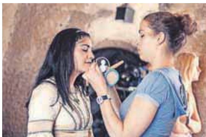
Za masko in kostumografijo je pri snemanju promocijskega videospota poskrbela Aleksandra Vojnović.