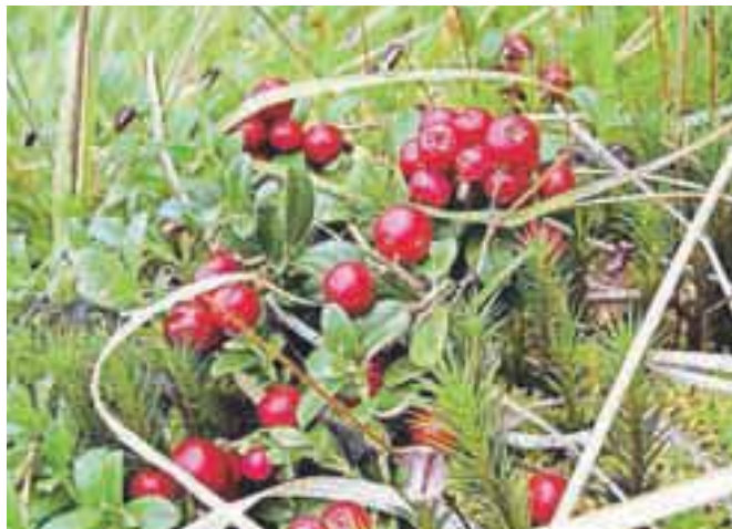
Rdeče zlato za zdravo telo

Ker že omenjamo vrhunskega poznavalca vsega