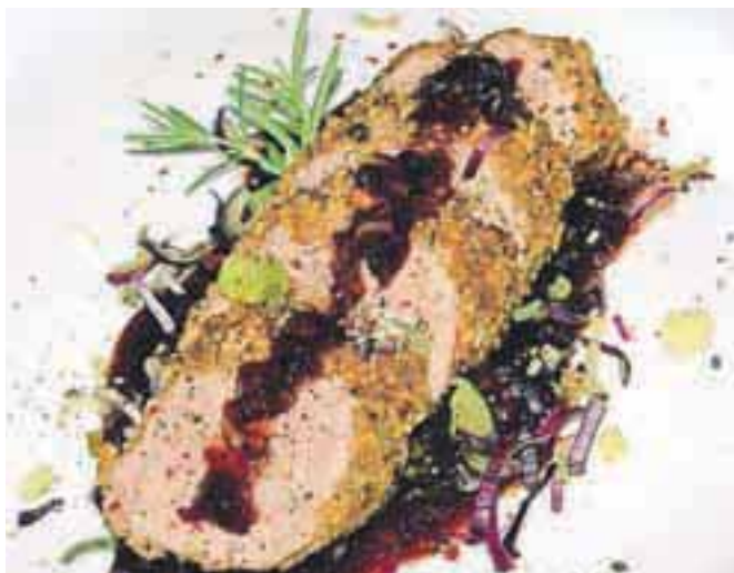
Marmelada iz rdečega zlata za vrhunske gurmanske užitke

»divjega«, upam, da nam ne bo zameril, če si izposodimo še njegov recept za »en-dva-tri« pripravljeno fantastično presno brusnično marmelado: »Skodelico zmečkanih brusnic ali obdelanih s paličnim mešalnikom dobro zmešamo z dvema ali tremi žlicami medu.« Božanska marmelada, ki ji lahko rečemo tudi brusnična krema, je gotova. Pripravljamo jo sproti in shranimo v majhnih kozarcih. »Če