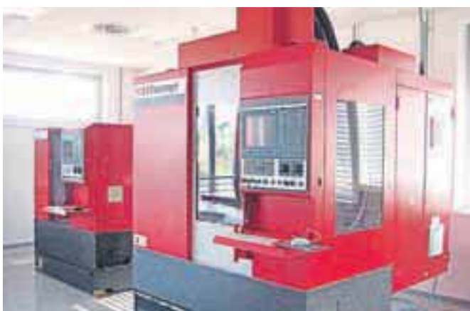
Medpodjetniško izobraževalni center Škofja Loka je zgrajen in sodobno opremljen z najnovejšimi stroji.

In uspehe. Če naštejemo le najbolj izstopajoče iz minulega šolskega leta: skupina dijakov je za maturitetni izpit predelala običajno vozilo v električno gnano vozilo, dijak tretjega letnika je v sklopu zaključne naloge izdelal snežni top. Takšnih uspehov brez odličnega šolskega procesa s še boljšim spoznavanjem praktičnega znanja zagotovo ne bi bilo.