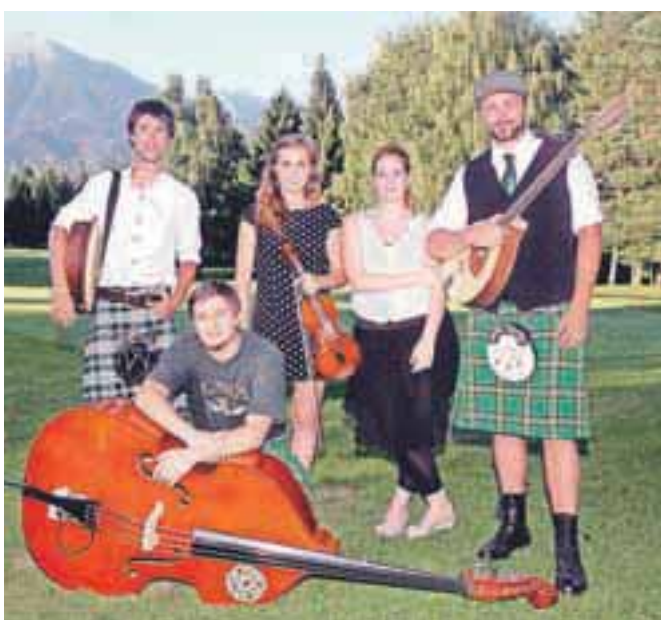
Domžalski Bog Bardsi