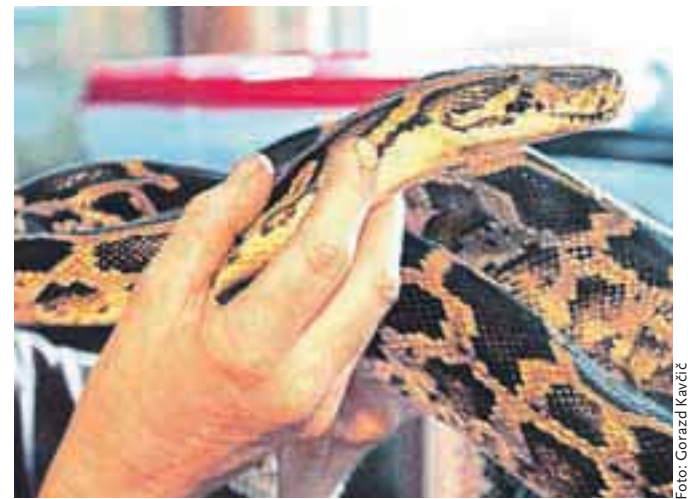
Največja Nikina kača je trimetrski indijski piton.

S ptičjimi pajki torej nima slabih izkušenj, kako pa je z drugimi živalmi? Kot pravi, jo je tudi veliki piton že ugriznil, a po lastni neumnosti: »Z roko, s katero sem prej držala podgano, sem mu šla čistit pred nos. Pri kačah pa je glavno čutilo voh, zato je treba med hranjenjem zelo paziti. Še posebej sem previdna pri strupenjači. Sicer