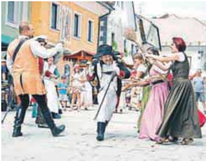
Vso nedeljo je bilo staro mestno jedro Radovljice srednjeveško obarvano.