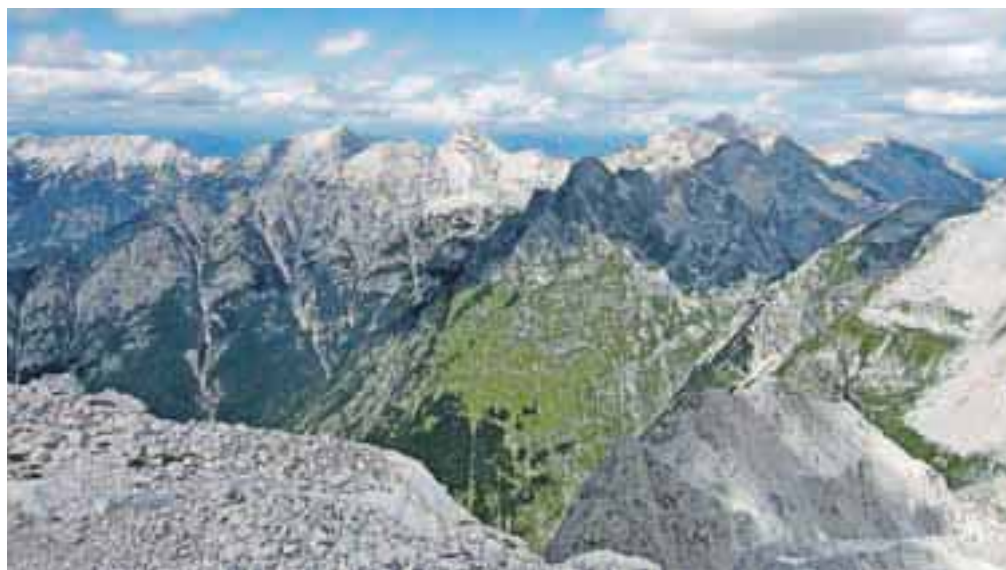
Razgled z vrha Kanjavca proti Prisanke, Razorju, Škrlatici, Pihavcu ...

stran. S Prehodavcev se začnemo vzpenjati proti Hribaricam. Ob sončnem vremenu je v tem delu pot neznošno vroča, zato imejmo s seboj dovolj tekočine za hidracijo. Med vzpenjanjem so na naši desni strani Vršaki. Ko dosežemo vzporedno točko z zadnjim od njih, nas markacija na skali usmeri proti našemu cilju, Kanjavcu. Trenutno je na tej poti še nekaj snega, ki pa je mehak in lahko prehodan, pravzaprav blagodejen, saj se čuti hlad. Pozorni moramo biti na markacije, sicer nas lahko skalno pečevje kaj hitro zavede in se znajdemo v še bolj krušljivem svetu. Od odcepa do vrha Kanjavca je dobre pol ure; z izhodišča do vrha pa smo potrebovali 6