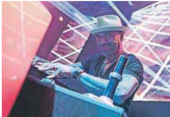
David Morales, eden izmed najbolj znanih house dj-jev, za svojo mešalko