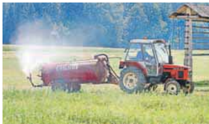
Na nekaterih gorenjskih kmetijah v sušnih razmerah za namakanje zemljišč uporabljajo cisterne, s katerimi sicer razvažajo gnojnico in gnojevko.

V razmerah, ko so suše vse pogostejše, je najboljši ukrep namakanje kmetijskih zemljišč. Po podatkih ministrstva za kmetijstvo in okolje se v Sloveniji namaka le 1,62 odstotka vseh kmetijskih zemljišč v uporabi, to je 7.511 hektarjev, od tega 6.448 hektarjev na območju velikih in 1.063 hektarjev na območju malih namakalnih sistemov. V namakanje je vključenih 1.380 hektarjev trajnih nasadov (predvsem hmeljišč), 573 hektarjev sadovnjakov, 322 hektarjev vrtnin in 13 hektarjev nasadov oljnic, preostalo pa poljščine in travinje. V okviru programa razvoja podeželja za obdobje 2007–2013 so bili štiri javni razpisi, prek katerih sta država in Evropska unija podprli izgradnjo dveh novih velikih namakalnih sistemov na 526 hektarjev velikem območju in dve posodobitvi sistemov na 200 hektarjih površine, v obravnavi na agenciji za kmetijske trge in razvoj podeželja pa je še pet vlog, ki so prispele na zadnji javni razpis. Za velike namakalne sisteme je bilo v sedanjem programskem obdobju doslej odobrenih 4,5 milijona evrov, še nekaj manj kot en milijon evrov pa je bilo v okviru razpisa za naložbe na kmetijah izplačanih za male namakalne sisteme, predvsem za ureditev črpališč in vodov ter za nakup opreme. V programu razvoja podeželja za obdobje 2014–2020 je za komasacije, agromelioracije in za namakanje predvidenih 24 milijonov evrov. C. Z.