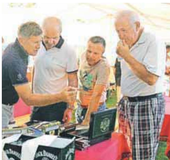
Cigare vedno pritegnejo pozornost ...