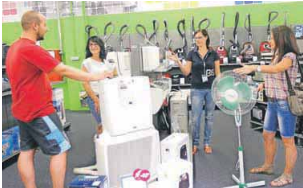
V nekaterih tehničnih trgovinah se je v vročih poletnih dneh prodaja ventilatorjev in klimatskih naprav povečala kar za štiri do petkrat.

Kot pravi Nedičeva, je v njihovi trgovini za klimatske naprave precej večje zanimanje kot za ventilatorje. »Ti niso tako učinkoviti pri hlajenju prostorov kot klimatske naprave. Nekatere stranke se odločajo za prenosne klimatske naprave, precej pa tudi za klasične. Pri tem je pomembno, kakšno površino želijo ohlajati, saj je od tega odvisna moč naprave, aktualni so inverter motorji s tišjim delovanjem,