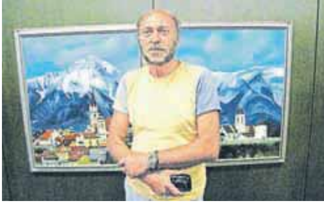
Kranjska veduta umetnika Štefana Remica / Foto: Samo Lesjak

V prostorih kranjskega Domplana je do konca meseca avgusta na ogled slikarska razstava umetnika in literata Štefana Remica, sicer prejemnika zlate plakete občine Šenčur, ki se na tem razstavnem mestu predstavlja drugač. Razstava zajema olja na platnu v realistični tehniki, kompozicijsko in barvno usklajeno upodobljene krajinske motive, figure ter tihožitja. Kot ga je predstavil umetnostni kritik Damir Globočnik: »Štefan Remic je dojemljiv opazovalec, ki v vsakokratnem izboru motiva išče možnosti za preverjanje lastne likovne govornice.« S. L.