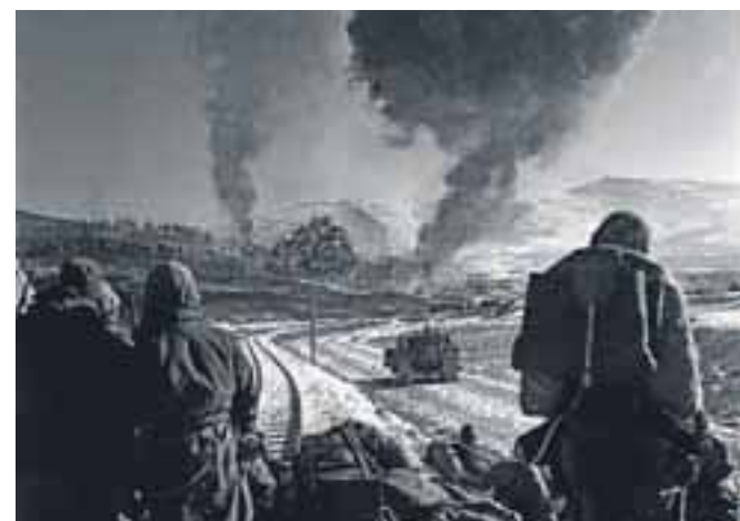
Slika boja med ameriški in kitajski vojniki v korejski vojni, 26. decembra 1950