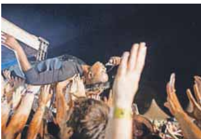
In na rokah oboževalcev.