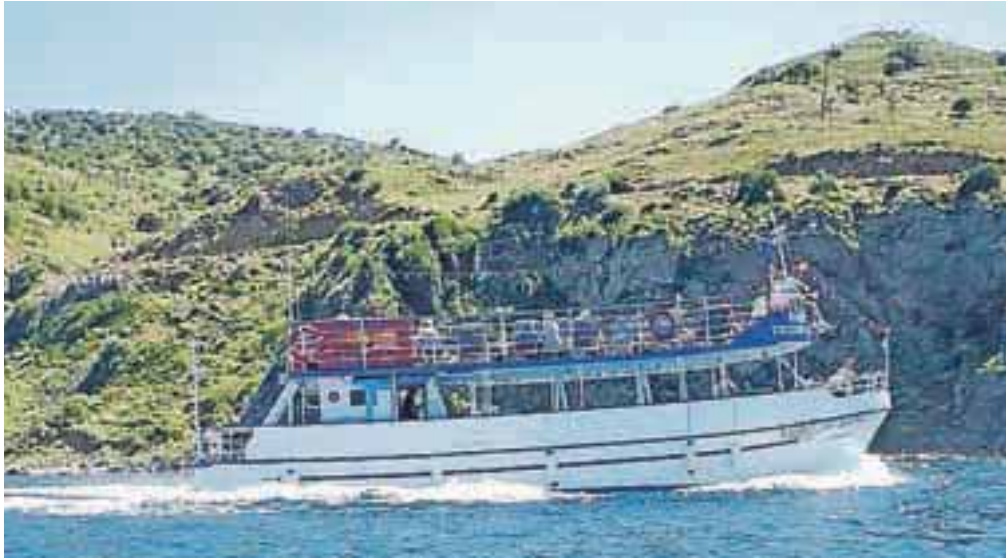
Pogled iz morske perspektive na sosednjo ladjico in kopno