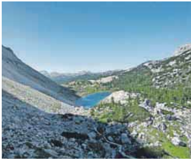
Dolina Triglavskih jezer; jezero Ledvička

Nadmorska višina: 2568 m Višinska razlika: ok. 1500 m Trajanje: 10 ur Zahtevnost: ★★★★★