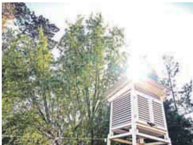
Številne vremenske hišice so v teh dneh izmerile rekordne temperature, ki pa jih ljudje nad osončenim asfaltom in betonom občutimo kot še veliko višje.

standardih. »Meritve opravljamo po standardih Svetovne meteorološke organizacije, kar zagotavlja primerljivost podatkov. Temperatura merimo v leseni, belo