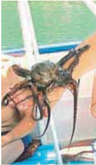
Dobra hrana, plovba, morje in sonce, pa še kakšna morska posebnost ...

P redstavniki Intelekte so predstavili zanimive fakultativne izlete, med katerimi so se Glasovski popotniki odločili za raziskovanje zahodne strani otoka, ki mu pravijo Divji zahod, privlačen pa je bil tudi izlet z ladjico.