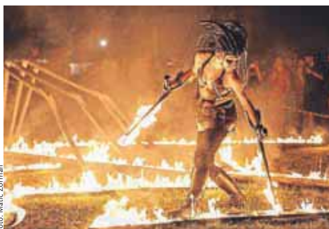
V večernih urah je potekal očesu prijeten 'fire-show'.