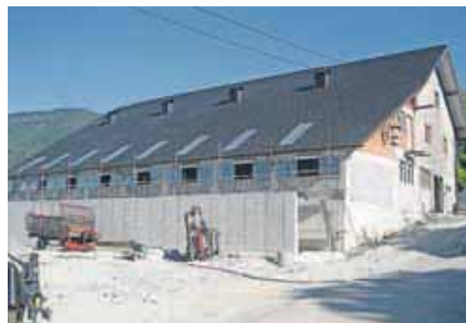
V novi hlev so živino že preselili, zdaj urejajo še uvoz v hlev in fasado.