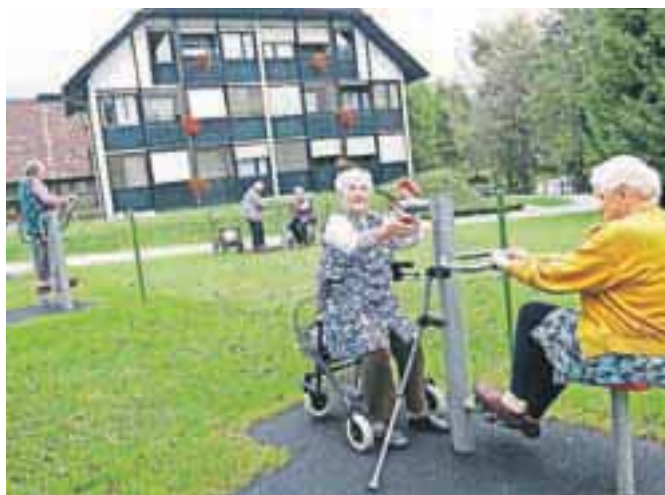
Lani se je iz domov za starejše zaradi nezmožnosti plačila oskrbe izpisalo 240 starostnikov.