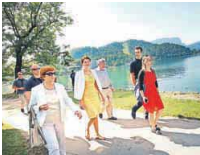
Predsednica vlade Alenka Bratušek je ta teden obiskala Bled.