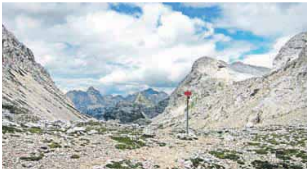
Sedlo Vrata. Zadaj, desno Kanjavec.