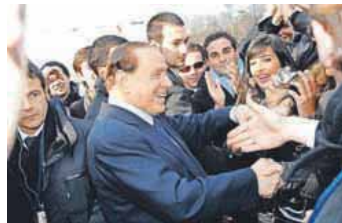
Berlusconi, ko je bil še oboževan, na vrhu Evropske ljudske stranke, 11. decembra 2008.