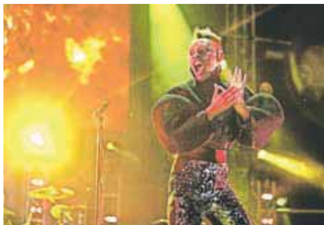
Skin, pevka zasedbe Skunk Anansie