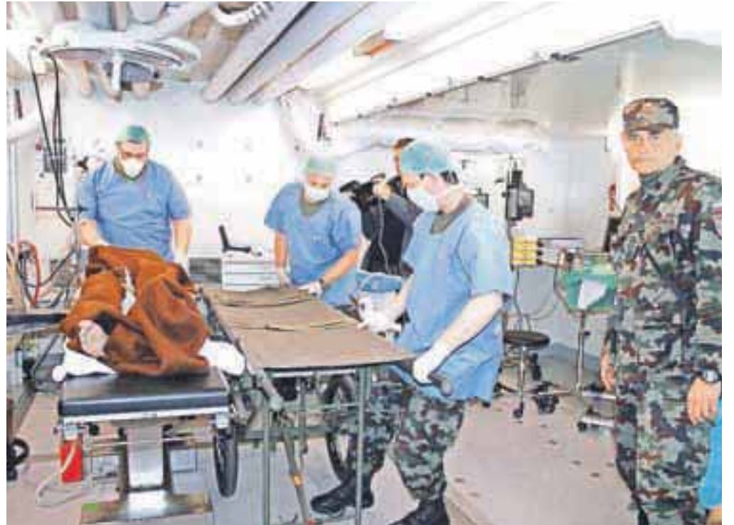
Lahka mobilna vojaška bolnišnica Role 2LM je bila na Jesenicah že postavljena, in sicer oktobra lani v sklopu vojaške vaje. Takrat smo zapisali, da se ponaša z opremo, ki ji jo zavida marsikatera civilna bolnišnica.