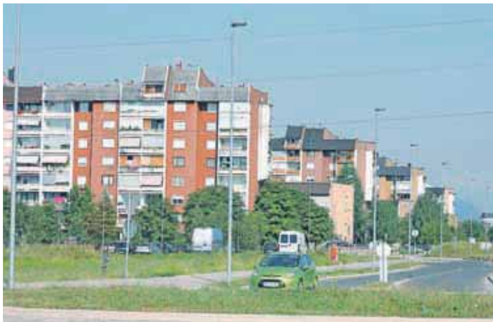
Številni stanovalci starejših kranjskih blokov so zaskrbljeni, saj nedovoljeni posegi v pritličju stavb lahko ovirajo dostop gasilcev.

Na Mestno občino Kranj smo zato naslovili nekaj vprašanj – koliko soglasij za posege na zemljišča okoli blokov,