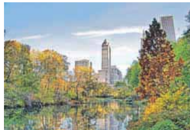
Jugozahodni kot Central parka v New Yorku, pogled proti vzhodu.

Minilo je že 60 let od 27. julija 1953, ko so podpisali premirje v triletni korejski vojni. Za boljše razumevanje sedanjega položaja na korejskem polotoku je treba vedeti, da so takrat podpisali le premirje, pravega miru še ne. Državi sta tako v bistvu še vedno v latentnem vojnem stanju. Vojna je bila strašna (1,2 milijona mrtvih), iz obdobja, ki je sledilo, pa je očitna predvsem razlika, ki je nastala v korejskem narodu v šestih desetletjih življenja v različnih družbenih ureditvah. Severni del naroda živi v totalitarnem komunizmu, v najhujši še obstoječi obliki tega režima. Ta drži narod v permanentnem stanju priprave na vojno in si ga tako podreja, vse drugo je drugotnega pomena, ljudstvo ni le revno, je tudi lačno. Južni del naroda živi v kapitalizmu, vse moči je usmeril v proizvodnjo in postal svetovna industrijska velesila. Da to dejansko je, povedo že imena globalnih blagovnih znamk, ki jih je ustvaril (Daewoo – ladjedelništvo, Hyundai, KIA, Samsung). Korejska izkušnja priča, da je trdi kapitalizem kljub vsemu boljši od trdega komunizma. Je to zdaj sploh še isti narod ali pa sta ob 38. vzporedniku nastali dve različni naciji?