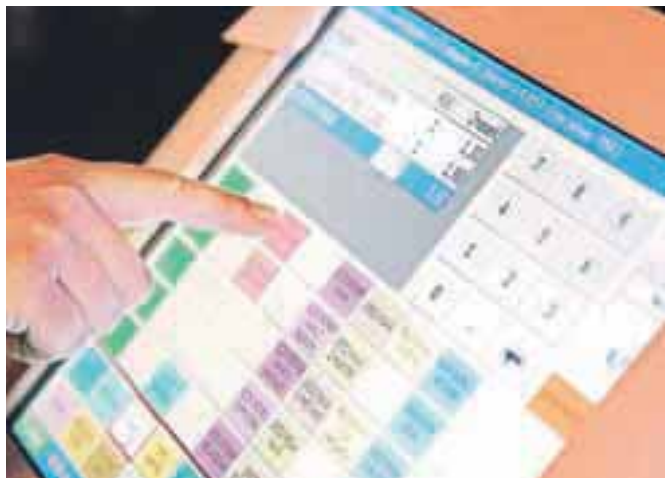
Davčna uprava nadaljuje poostren nadzor nad izdajanjem računov, predvsem pri gostincih.