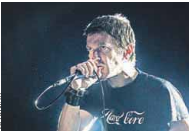
Niet so po nastopu leta 2011 letos znova obiskali Schengen.