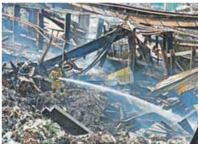
S požarom v podjetju Gorenje Surovina se je v treh dneh trudilo okoli 400 gasilcev.