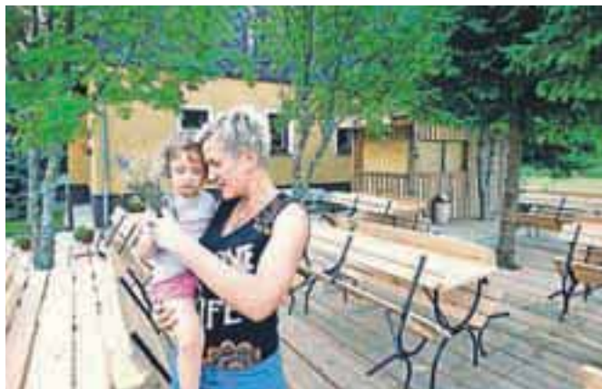
Terasa, dodana vrednost hostlu in kampu

»Finančno je projekt velik zalogaj, v katerega sva šla s precejšnjim tveganjem. Veliko sva razmišljala o njem in izdelala poslovni načrt, ki je naposled prepričal tudi bankirje in poslovni sklad.