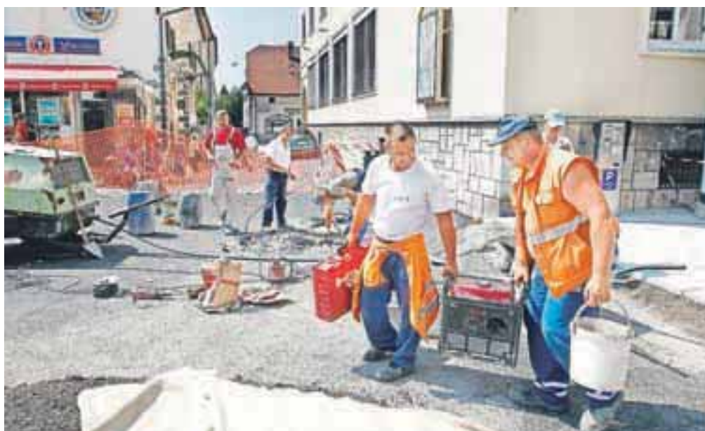
Gradbeniki so v zadnjih dneh hiteli z zaključnimi deli na ulicah starega Kranja, saj se danes začne tudi tradicionalni Kranfest.

Kranj – V okviru projekta prenove so v Kranju najprej, v tako imenovani prvi fazi, ki je bila vredna 1,5 milijona in s 85 odstotki sofinanciranja z evropskimi sredstvi, obnovili Tavčarjevo ulico na delu med Poštno in Cankarjevo ulico ter Tomšičevo ulico na delu med Gasilskim trgom in Cankarjevo ulico. V sklopu obnove so uredili tudi podzemna ekološka otoka, na Gasilskem trgu in na Tavčarjevi ulici za tržnico. Okoli 7 milijonov evrov pa je vredna druga faza prenove.