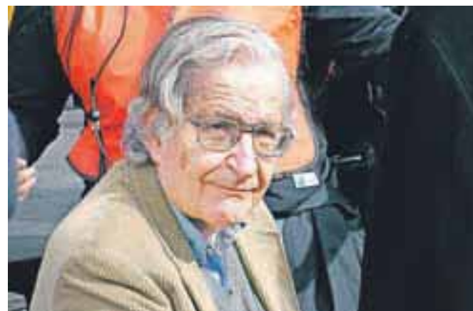
Noam Chomsky (na sliki) in Slavoj Žižek sta najvidnejša intelektualca na levi svetovni sceni.