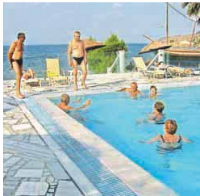
Med šestimi bazeni so se Glasovci odločili, da enega kar 'posvojijo'.

Že v starem veku je otok slovel kot vir posebne, čudežne energije. Da je bil to kraj razcveta lirske poezije, filozofskega razmišljanja in upodablajoče umetnosti, pričajo številne antične najdbe. Tukaj so častili bogove veselja in sonca, prav tukaj so nastajale rime čudovitih pesmi antične pesnice Sapfo. (se nadaljuje)