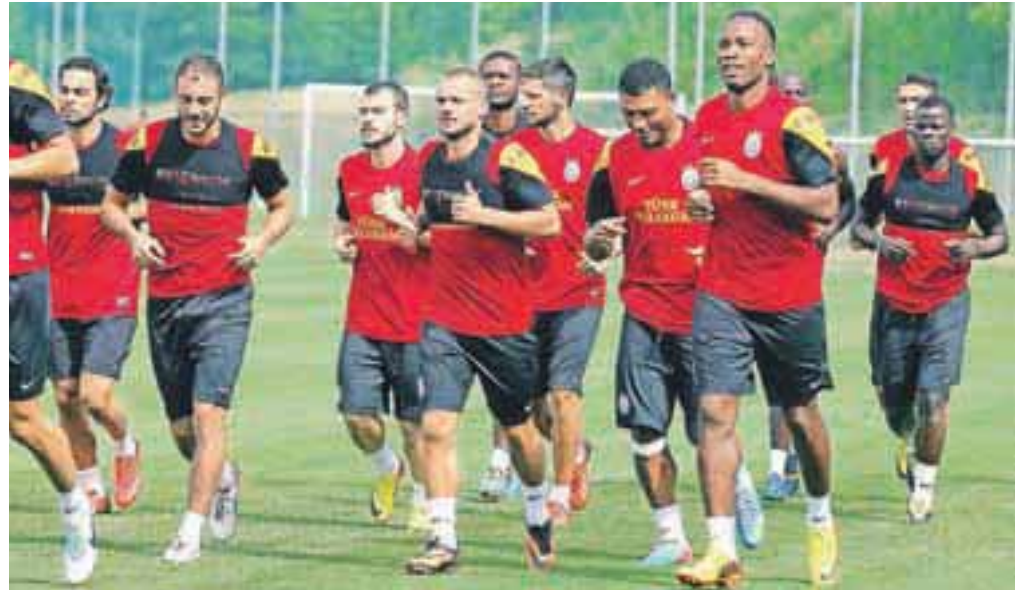
Ekipe Galatasarayja v Lescah trenira dvakrat na dan, dopoldne in popoldne.