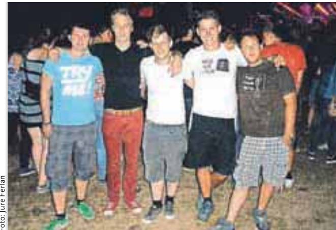
V množici so uživali tudi člani kluba jeseniških študentov.