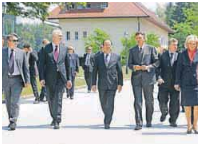
Francoski predsednik Francois Hollande se je včeraj udeležil tudi srečanja predsednikov osmih držav zahodnega Balkana na Brdu pri Kranju.