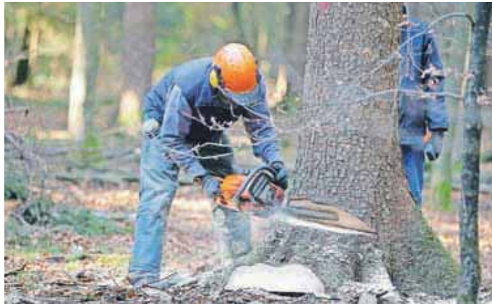
Nevladne organizacije zahtevajo, da se lastnikom gozdov omogoči poleg pridobivanja dohodka od lesa tudi izkoriščanje drugih gozdnih dobrin – nabiranje gozdnih sadežev, lov in turizem.

Različne omejitve, ki vplivajo na razpolaganje z gozdom kot lastnino in na