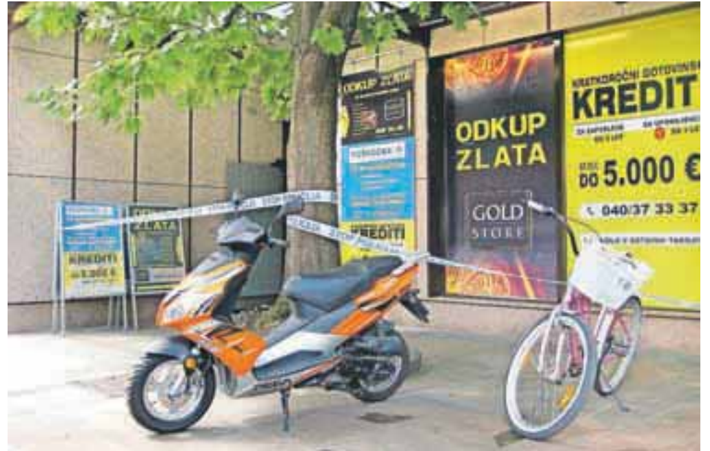
Roparka je ob odhodu še zaklenila vrata poslovalnice za odkup zlata.

V sredo so gorenjski policisti obravnavali tudi tatvino in poskus tatvine v dveh trgovinah. V enem primeru so trije neznanci, dva moška in ženska, vsi tuje narodnosti, okoli 18. ure vstopili v trgovino s prehranskimi izdelki v Kranju. Dva sta ogovorila