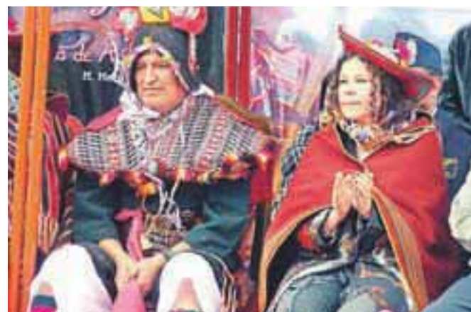
Predsednik Evo Morales in njegova ministrica za kulturo v indijanski opravi, aprila 2011