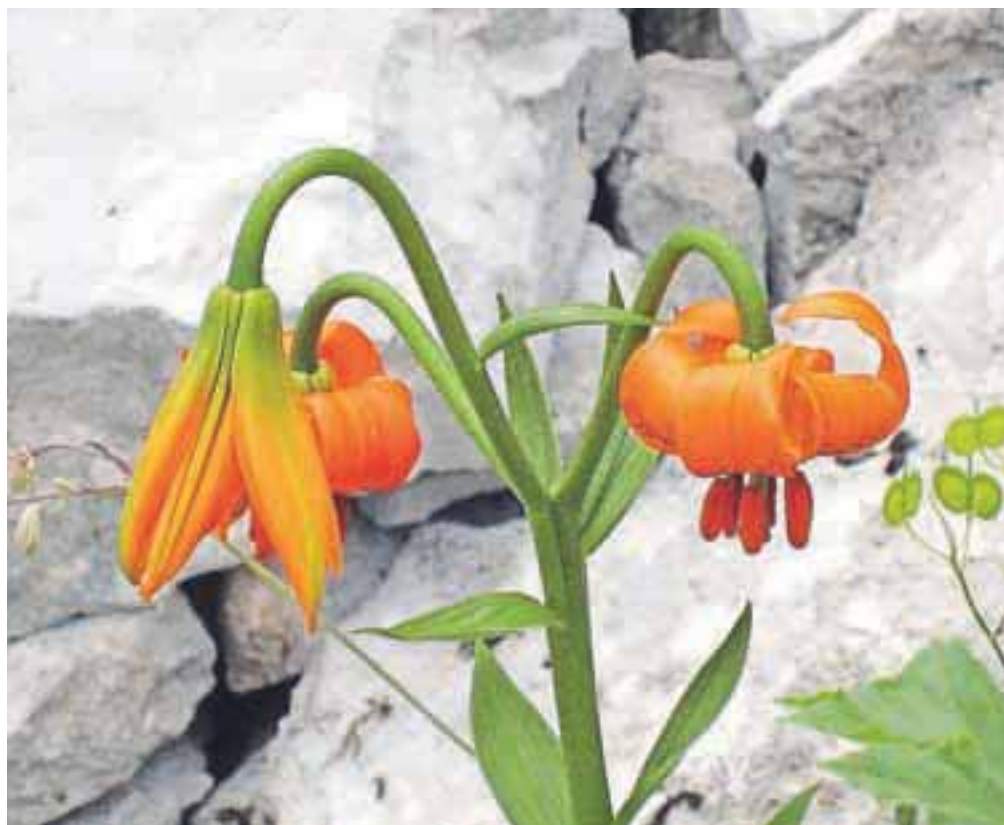
Kranjska lilija

sledimo kolovozu, ki občasno vodi čez strma pobočja. Širok kolovoz se vzpenja po pobočju Kalarskega brda in nas pripelje na Kalarsko sedlo, kjer je razpotje poti; Kal, Kacencpoh in Črna prst. Nadaljujemo desno proti Črni prsti, še malce po kolovozu, nato pa pot spet preide v gozd in se strmo vzpenja. Sledijo okljuki, kar olajša strmi vzpon. V tem delu poti gremo mimo nekaj fenomenalnih ogromnih možic in dosežemo razgledno klop, ki ponuja počitek. Višje je še ena klopca, rahlo stran s poti, s čudovitim razgledom na Koblo in greben Soriške planine. Iz gozda nas pot pripelje na vse bolj razgledno travnato pobočje,