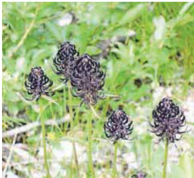
Jajčasti repuš