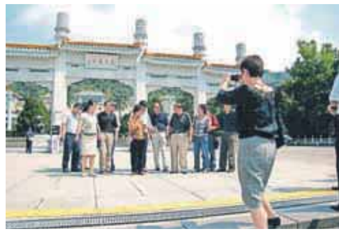
Kitajski turisti iz matice pred muzejem v mestu Tajpej na otoku Tajvan

V ponedeljek se je papež Frančišek podal na svoje prvo veliko potovanje, v domačo Južno Ameriko, na srečanje mladih katoličanov v Riu. Tu želim spomniti še na eno nedavno potovanje iz Evrope v isto smer. Na incident, ki se je zgodil, ko sta Francija in Portugalska prepovedali prelet letalu, s katerim se je iz Moskve v Bolivijo vračal njen predsednik Evo Morales, prvi Indijanec na tem položaju. (Tisti, ki je na svojo inavguracijo leta 2006 povabil tudi Janeza Drnovška. Se ga še spominjate na fotografiji v indijanski opravi?) Morales je moral prisilno pristati v Madridu in na Dunaju, preden je lahko nadaljeval polet. Posumili so, da je v njegovem letalu tudi Edward Snowden, informacijski Robin Hood Res, dolga je roka ZDA, a Latinska Amerika se ji ne poda!