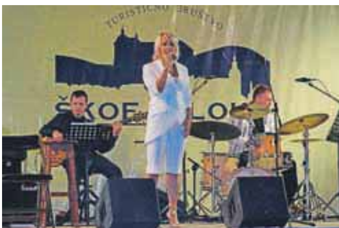
V nedeljo, 11. avgusta, bo Alenka Godec nastopila na Mestnem trgu.

Organizatorji prireditve in koncertov imajo poleti polne roke dela in tako je tudi v Škofji Loki, kjer že nekaj let zapored pripravljajo obsežen festival Pisana Loka, ki bo v staro mestno jedro in na dvorišče Škofjeloškega gradu pripeljal številne znane glasbenike. V treh avgustovskih koncih tedna se boste lahko udeležili koncertov: 10. avgusta Joe Cocker Tribute, 11. avgusta Alenka Godec, 17. avgusta II. Loka blues fest, 18. avgusta Hamo & Tribute 2 love, 22. avgusta bo na sporedu gledališka predstava Zlata jesen, 23. avgusta Dan D »Tiho«, 24. avgusta Jan Plestenjak in za zaključek festivala 25. avgusta Klapa Kambi iz Splita. Trem naročnikom Gorenjskega glasa bomo podelili po dve vstopnici za gledališko predstavo Zlata jesen, ki bo v četrtek, 22. avgusta, ob 20.30 na dvorišču Škofjeloškega gradu. Nagradno vprašanje je: kateri po vrsti je letošnji festival Pisana Loka? Odgovore s svojimi podatki najkasneje do srede, 7. avgusta, pošljite na naslov Gorenjski glas, Bleiweisova cesta 4, Kranj ali na kotiček@g-glas.si. Za več informacij pa obiščite spletno stran www.pisanaloka.si, kjer boste našli koristne informacije o predprodaji vstopnic in celo ugodni paketni prodaji vstopnic.