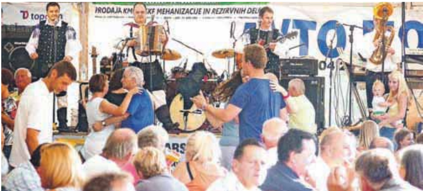
Ansambel Modrijani vedno poskrbi za dobro vzdušje in polno plesišče.