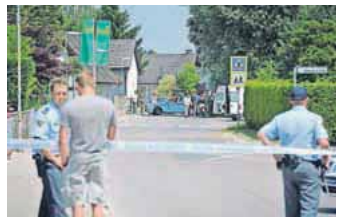
Umora in samomora pred vrtcem Rodica v Domžalah se ni dalo preprečiti, so pa policisti pomanjkljivo obravnavali pretekle prijave družinskega nasilja.