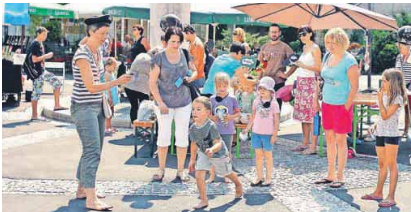
Gusarsko dopoldne je v Kamniku lepo dopolnilo prvi sejem unikatnih izdelkov.