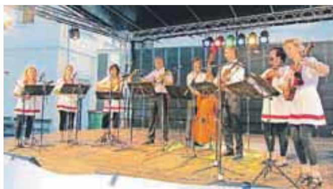
Na tamburaškem festivalu so nastopili tudi domačini, tamburaši iz Šentjanža.

Slovenska prosvetna zveza je tudi letos vabila mlade v Nerezine na jadranskem otoku Lošinju na desetdnevne ustvarjalne počitnice. Kar 42 deklet in fantov je pililo znanje slovensščine v jezikovnih delavnicah in uživalo v drugih kulturnih in tudi zabavnih dejavnostih. Za uk slovensščine sta