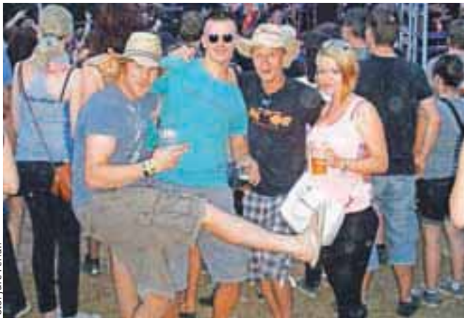
Že enajsti festival ŠVIC so obiskali številni Gorejci.

In če kje na mestnih ulicah naletite na dekleta s posebnimi pokrivali, potem kaj preveč ne razmišljajte o tem, gre za novi modni hit, ker je morda krivo kakšno poulično gledališče, vseeno pa je najboljša reakcija nasmeš.