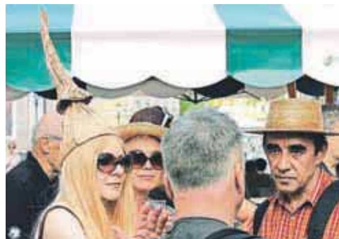
Posebna pokrivala, posebno vzdušje ali zgolj le rezultat kakšne gledališke predstave?