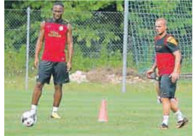
Največja zvezdnika Drogba in Sneijder na treningu na leški nogometni zelenici / Foto: Tina Dokl