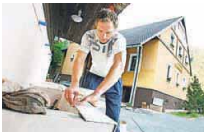
Še zadnja dela pri zunanjih sanitarijah