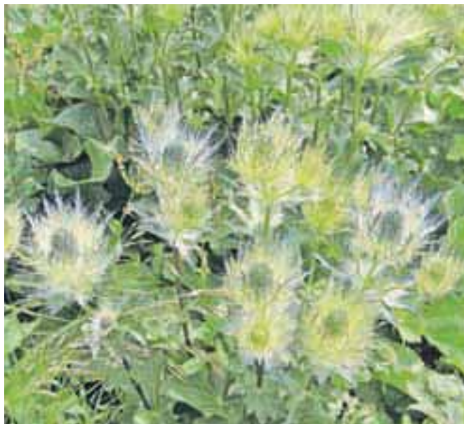
Alpska možina

Nadmorska višina: 1844 m Višinska razlika: Trajanje: 6 ur Zahtevnost: ★★★★★