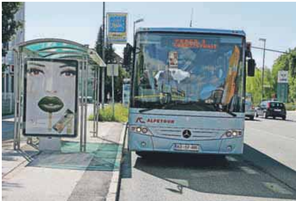
Mestni potniški promet naj bi v prihodnjih mesecih približali uporabnikom.

Zato so se lani, ko je po desetih letih potekla koncesijska pogodba z Alpetourom – potovalno agencijo in so jo podaljšali za eno leto, na kranjski občini sklenili, da temeljito proučijo, kaj storiti, da bo mestni promet bolj zanimiv za občane. To pa pomeni, da bi avtobusi vozili bolj polni in bi bili stroški