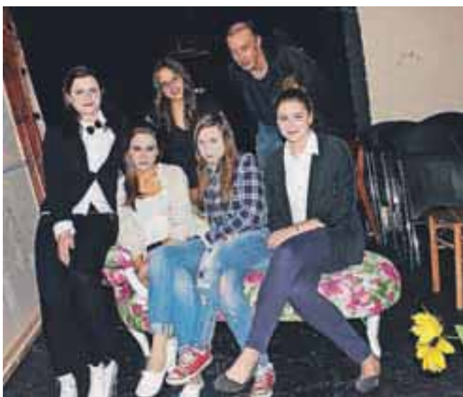
Srednješolke v skupini Persone so v igri Otroci včerajnjega sonca pokazale številne svoje talente.

Za njimi so na oder stopile najstnice z že izdelanimi osebnostmi, kot bi lahko sklepali iz imena, ki so si ga nadele, Persone namreč. V predstavi Otroci včerajnjega sonca so publiko v štirih dejanjih popeljale v štiri različna obdobja zadnjih štiridesetih let. V avtorskem besedilu Domija Vrezca so na odru najprej podoživle sedemdeseta leta in čas otrok cvetja, nato punk generacijo sredi osemdesetih, slovensko osamosvojitve s hip hopom in gruneom in nenazadnje današnji čas računalniške