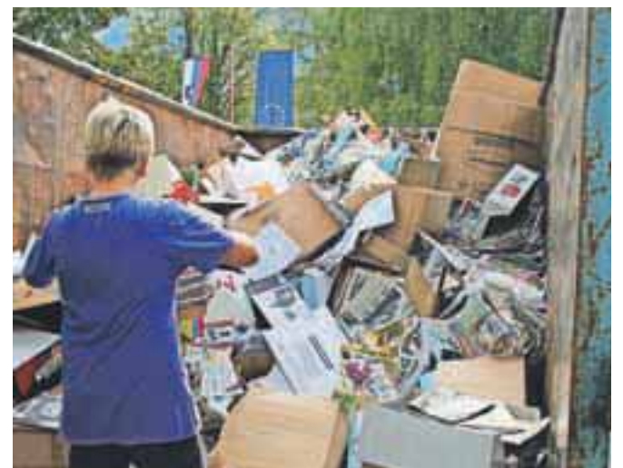
Na šoli so pravi rekorderji v zbiranju starega papirja in zagnani učenci ga vsako šolsko leto zberejo skoraj 40 ton.