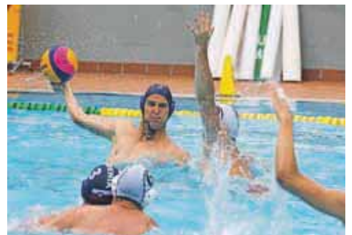
Na letnem bazenu v Kranju so si naši vaterpolisti pred nadaljevanjem kvalifikacij konec tedna priborili drugo mesto.

»Na splošno sem zadovoljen z igro. Pokazali smo, da lahko na trenutke zaigramo zelo dobro in kvalitetno, včasih pa tudi nekoliko slabše. Sedaj nas čaka zaključek letošnjega prvenstva oziroma sezone 2012–2013, potem pa sledi drugi kvalifikacijski turnir. V tem trenutku se še ne ve, kje točno bo. Pristop bo moral biti enak kot sedaj ali pa celo boljši, saj so fantje tega sposobni. Prav tako moramo dvigniti raven naše igre. Da smo izgubili