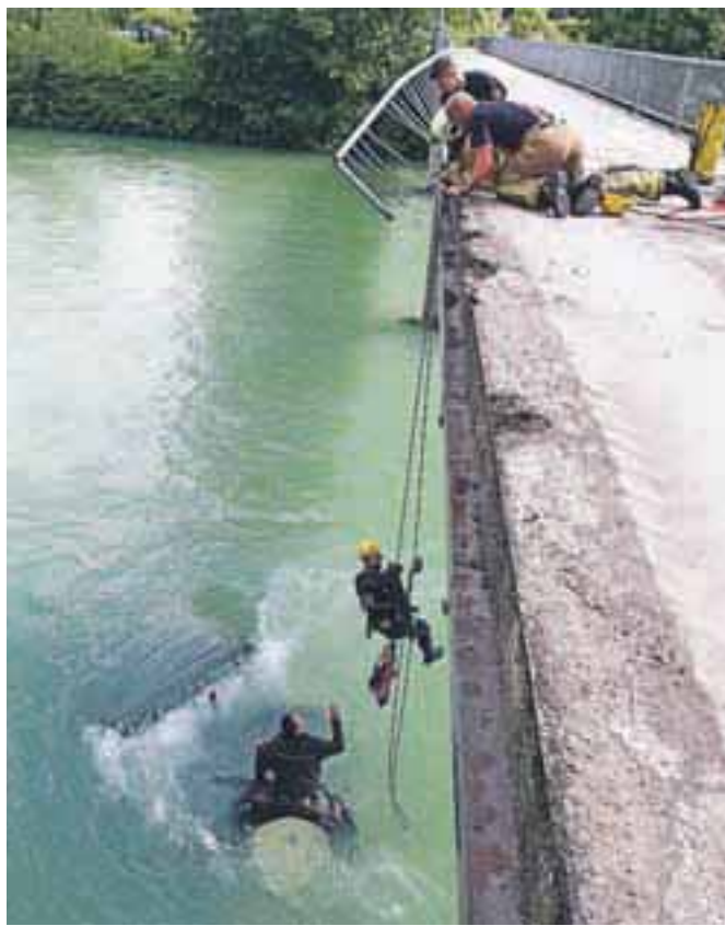
Kranjski poklicni gasilci so voznika traktorja rešili iz deroč Save, kasneje tudi traktor, s katerim je prebil ograjo mostu ob Planiki v Kranju in zgrmel v reko.

Voznik je imel v izdihalnem zraku 0,21 miligramna na liter alkohola, a je izpolnjeval pogoje za udeležbo v prometu. Žal se je lažje telesno poškodoval, nastala je materialna škoda na vozilu in mostu. Policisti so ga oglobili z 280 evri. Most bo do nadaljnjega zaprt.