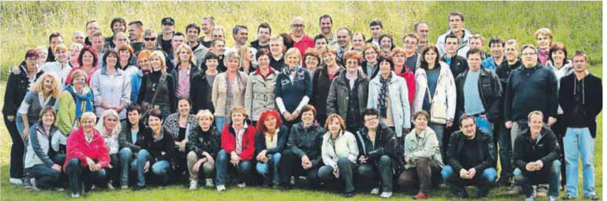
Konec tedna se je v besniškem rekreacijskem centru Vogu zbralo šest razredov, ki so šolanje v OŠ Simon Jenko zaključili leta 1982/83. Tako je okoli sto sicer povabljenih – srečanja se je udeležilo nekaj manj nekdanjih sošolcev – obelodanilo spomin na valetu, na čase, ko so se njihove poti po končani osnovni šoli v večini razšle.