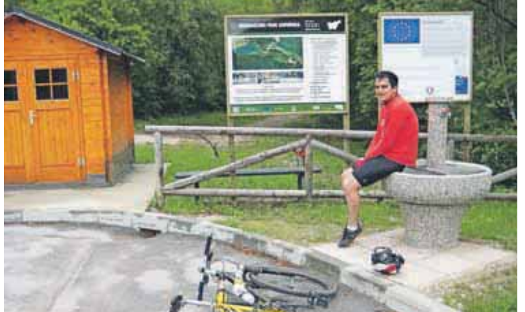
V soboto bodo tudi uradno odprli rekreacijski park v dolini Završnice, ki je že dolgo priljubljena rekreacijska točka za domačine in okoliške prebivalce.

V okviru projekta so tako uredili dobra dva kilometra dolgo trimsko stezo ob potoku Završnica z 12 postajališči, tri prostore za piknike s kapaciteto do 20 oseb, večji prireditveni prostor za 300 do 400 oseb, otroško igrišče, dve odbojarski igrišči na mivki in sanitarije. V rekreacijskem parku bo deloval še gostinski lokal, v prihodnje pa naj bi uredili tudi že obstoječe nogometno igrišče. Park upravlja domače športno društvo TVD Partizan Žirovnica. Da zagotovijo dokončno ureditev območja, bo občina Žirovnica še letos