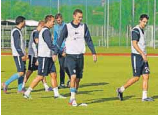
Po petkovi tekmi s Turčijo naša nogometna reprezentanca spet vadi v Kranju.

Minuli petek se je naša nogometna reprezentanca v Bielefeldu pomerila z reprezentanco Turčije in jo premagala z 2 : 0. Čeprav varovanci selektorja Srečka Katanca na prijateljski tekmi niso dobili točk za uvrstitev na svetovno prvenstvo, pa je bila zmaga pomembna za potrebno samozavest, ki jo ekipa potrebuje pred novo kvalifikacijsko tekmo, ki jo ta petek čaka na Islandiji. Prav tako so za novo tekmo potrebne temeljite priprave, ki jih te dni nadaljujejo tudi na kranjski nogometni zelenici. V. S.