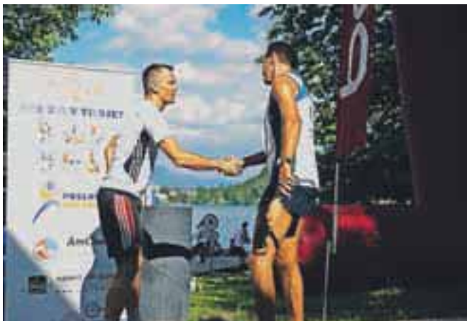
Tek poslovnih trojk so tudi srečanja med poslovnimi partnerji.

Pogostitev so zgledno in okusno pripravili Sava hoteli Bled, zato je vsak tekač prejel v slast originalno blejsko kremno rezino in tople obroke ter darilno vrečko z dobrotami vseh pokroviteljev prireditve.