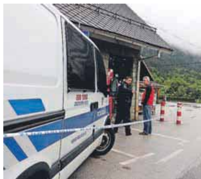
Malce pred 17. uro je v petek neznani storilec oropal trgovino Mercator na Breznici pri Žirovnici.

Ali med obema ropoma obstaja povezava, policisti še raziskujejo, zato prosijo vse, ki imajo kakršnekoli informacije, naj jih sporočijo na najbližjo policijsko postajo, na številko 113 ali anonimni telefon 080 1200, ki klicatelju zagotavlja popolno anonimnost. V dveh mesecih