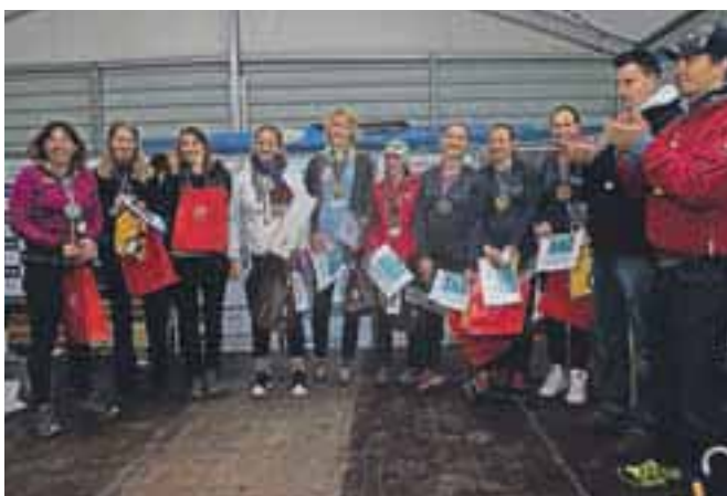
Nič kaj premražene zmagovalke