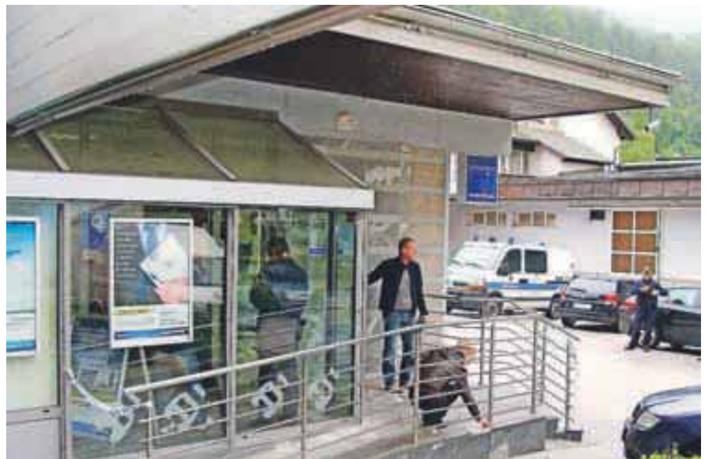
Ropar naj bi iz poslovalnice Gorenjske banke na Plavžu na Jesenicah odnesel več tisoč evrov. Policisti so takoj začeli preiskavo, ki še ni zaključena, roparja še niso prijeli.

V petek opoldne je ropar iz poslovalnice Gorenjske banke na Jesenicah odnesel več tisoč evrov, malo pred 17. uro pa iz trgovine na Breznici pri Žirovnici še nekaj sto evrov. Več na 10. strani.