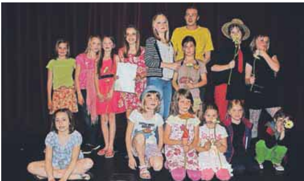
Simpatičen roj Kranjskih čebelic se je predstavil s komedijo 1+1=4, priredbo znane knjige Ericha Kästnerja Dvojna Loti.