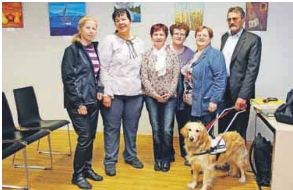
Glavnina skupine slabovidnih slikarjev ob svojih slikah, razstavljenih v dvorani Mestne knjižnice Kranj