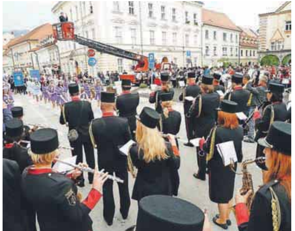
V nedeljo so v središču Kamnika odmevale koračnice, za kar je v čast jubileja Mestne godbe Kamnik poskrbelo okoli štiristo godbenikov.