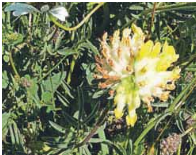
Nabiramo samo socvetja, ki še niso odcvetela in v njih ni veliko oranžno rjavih, že odcvetelih cvetov.

Že po imenu je sklepati, da so ranjak v ljudskem zdravilstvu uporabljali predvsem za celjenje ran. Na rane so položili zmečkane rastlinice ali obkladke iz ranjakovega čaja. Za spiranje ran se je močno obnesel tudi poparek iz ranjaka in trpotčevih listov. Naše babice, še bolj pa prababice, vedo povedati, da so ranjak zaradi čistilnega učinka uživali zlasti ob spomladanskem postu. Z grgranjem poparka so lajšali vnetja v žrelu in ustni votlini. Notranje so z njem krepili želodec in odpravljali zaprtje. Dekleta so z njegovo pomočjo ohranjala lepo, sijočo polt in odpravljala prve znake staranja. Tudi ljudje, ki so imeli težave s kožo, so se radi obračali k ranjaku po pomoč. Ranjak deluje tako, da kožo balansira in jo pripravi, da zopet začne opravljati svoje prvotne funkcije. Zaradi slednjega ga vse bolj uporabljajo v naravni kozmetiki.