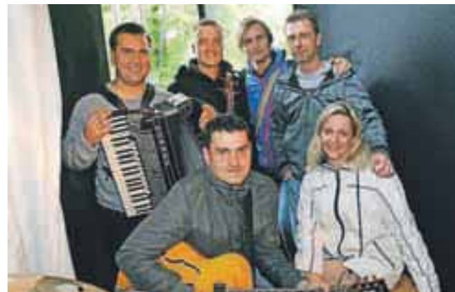
V zaodrju: Preški kvintet

»Ker gre za tedensko oddajo, to pomeni garanje, bi si pa vzel malo pavze, da bi se posvetil glasbi, kar je moja prvotna naloga. Da pa sem se lotil tega projekta, pa je bila predvsem želja, da dokažemo, da se slovenska glasba posluša, gleda in da se z lahkoto postavi ob bok drugim glasbenim zvrstem. In mislim, da so se razmere v tej smeri v zadnjih letih spremenile, da smo naredili veliki korak naprej, k temu pa je pripomogla tudi naša oddaja.«