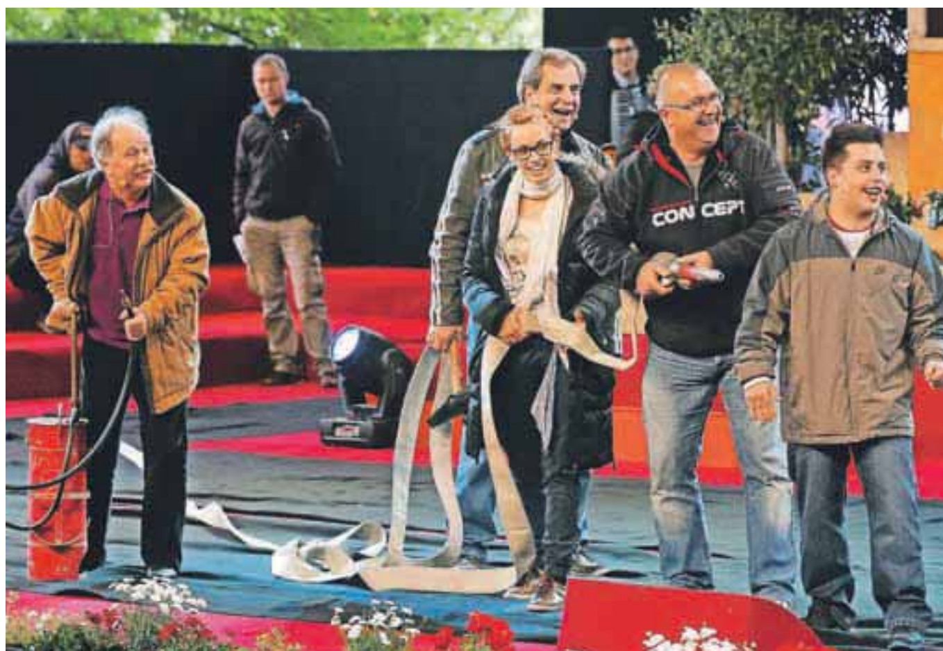
Strašna Jožeta, Peška, Sašo in Majči v svoji 'gasilski' vlogi na generalki, kjer so bila zimska oblačila nujen del opreme nastopajočih.