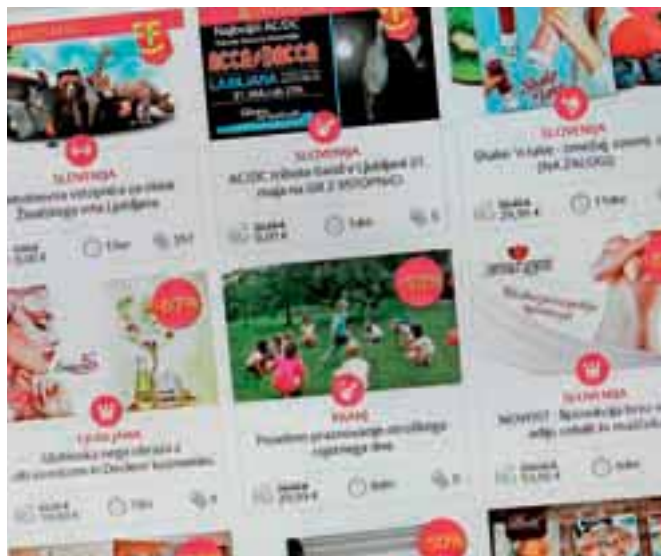
Med kupci spletnih kuponov so najbolj priljubljena potovanja in počitnice, za med pa gre tudi ponudba restavracij.

Pred bližnjo poletno sezono so ponudbo kuponov za turistične aranžmaje pod drobnogled vzeli tudi v Zvezi potrošnikov Slovenije (ZPS) in ugotovili, so cene turističnih aranžmajev na teh portalih praviloma res nižje kot pri klasičnih agencijah, vendar pa številne vključujejo le namestitve. Pri tem