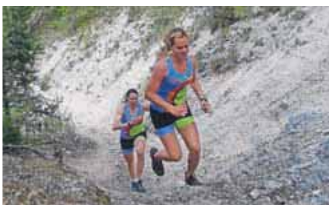
Tekaški del trase je speljan po Rudni poti na Valvasorja.