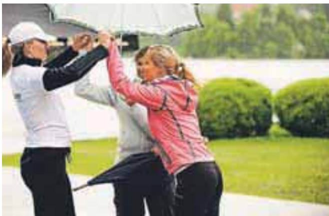
Poslovna dekleta so rekla, da mraz sploh ni ovira.