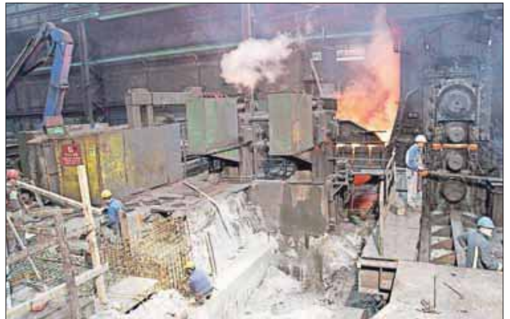
V menjavo valjavskega ogrodja v vroči valjarni bodo v Acroniju povečali proizvodnjo za deset odstotkov.