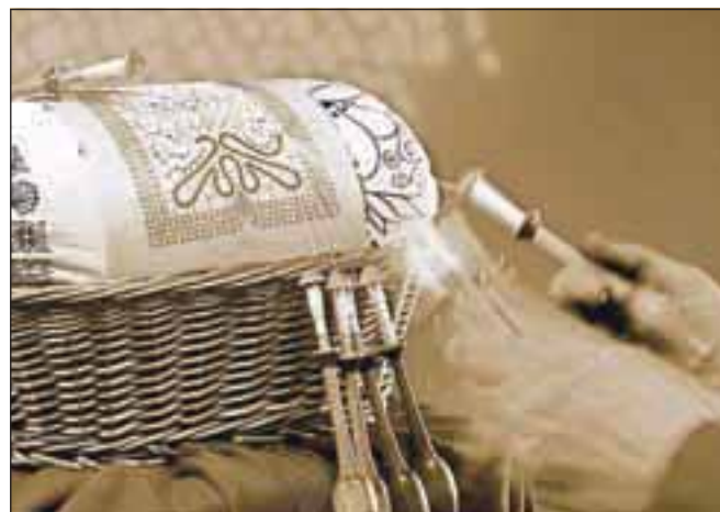
Idrijska čipka

Na vprašanje, kaj novega prinaša ta knjiga (tudi v primerjavi s prejšnjimi), je odgovor urednic sestavljen iz šestih točk. Prinaša: 1. prvi celostni pregled o zgodovini, tehnološkem in oblikovnem razvoju idrijske čipke, trgovini s čipkami, izobraževanju na tem področju ter kratek pregled zgodovine čipkarstva na Slovenskem;