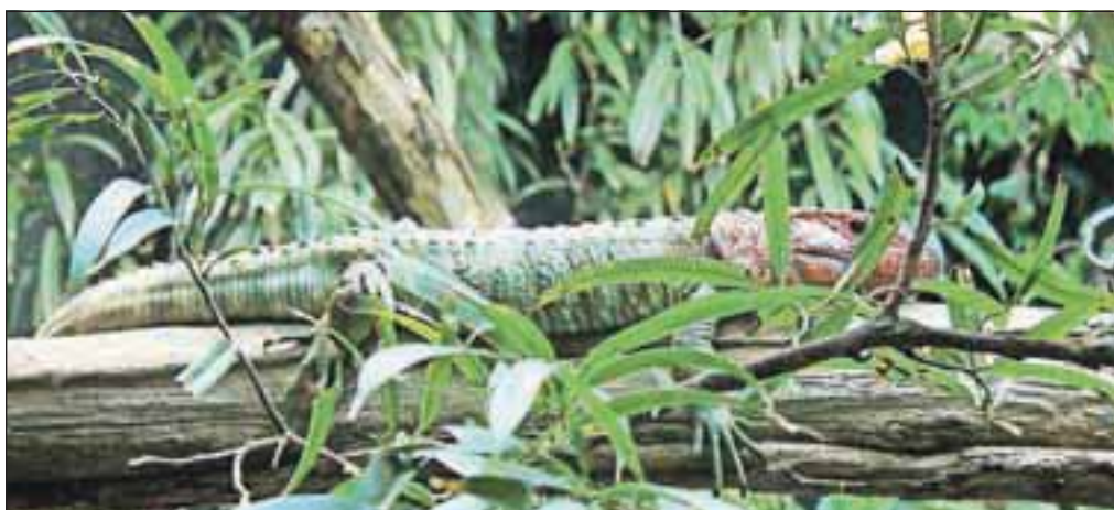
Kuščar krokodil Teju