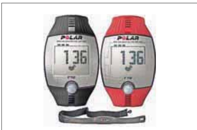
Merilci srčnega utripa so sestavni del opreme vsakega športnega rekreativca.

vsaj dve kljukici: imeli se boste enkratno, poleg tega pa boste imeli eno osebno zmago več na svojem seznamu. Zato si le zabeležite 29. junij v svoje koledarčke in se na oviratlon čim prej prijavite.