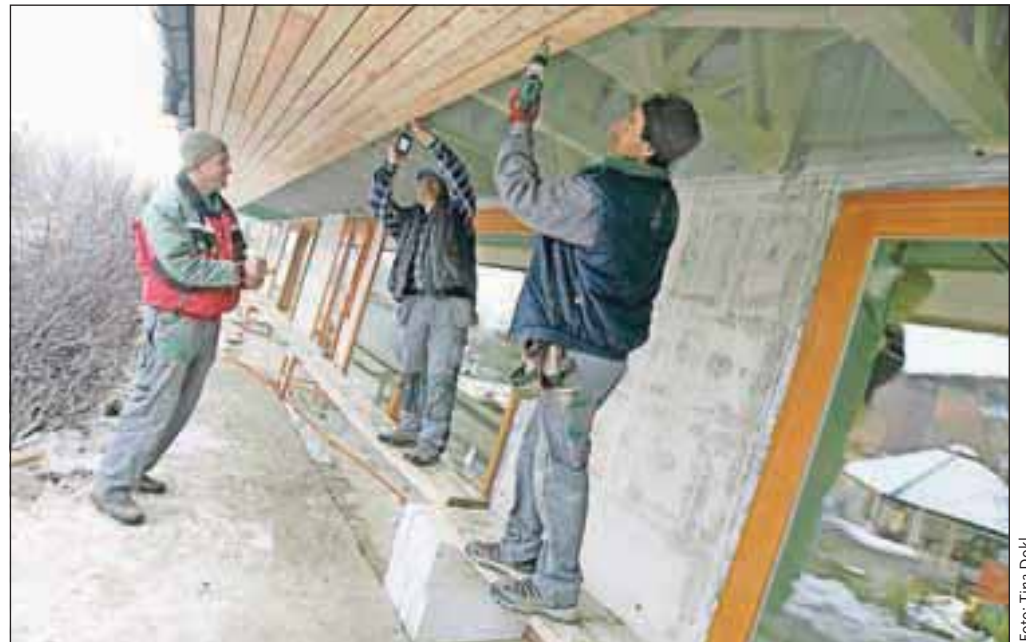
Od lanskega poletja poteka obnova objekta B preddvorskega doma starejših občanov.

V domu bo tako narejena popolna sanacija fasade, zamenjano stavbno pohištvo