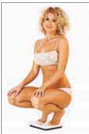
Letos pa res začnem hujšati!

bo za začetek precej ohlapen, ker bo kmalu tudi ta postal »zategnjen«. Držite se urnika, tako kot se držite točnega jutranjega vstajanja ali delovnika. Točnost in izpolnjevanje načrta in urnika je prva zmaga. Ko boste delali načrt, razmišljajte le o napredku, ki ga boste z izpolnjevanjem doživeli. Pomislite na obresti, ki jih bo prinesel načrt, in pomislite, kaj boste storili prvič, ko boste naleteli na oviro. Smisel ovire je v tem, da jo premagajo, pravijo modreci. Torej, ovir v naših zaobljubah ne bi smelo biti. Formula je torej enostavna: za najuspešnejši začetek si naredite zelo ohlapen načrt. Ohlapen zato, ker ga boste lažje izpolnili, in zato, ker boste težje imeli izgovore, če se ga ne boste držali. Preprosto in učinkovito, kajne? Priznate? Če ste prikimali, se torej lotite zaobljube ali zaobljub, ki jih boste končno izpolnili.