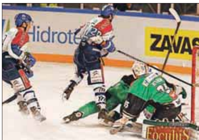
Po tekmi med Telemachom Olimpijo in Medveščakom se bo spektakel na Plečnikovem stadionu zaključil danes, ko bo ekipa naših prvakov ob 19.15 gostila še moštvo celovškega KAC-a.

Ljubljana – V ligi EBEL, kjer letos Slovenijo zastopa zgolj ekipa Telemacha Olimpije, se je delček dogajanja minuli konec tedna preselil na zadnja leta opuščeni nogometni stadion za Bežigradom. Ker je igranje hokeja na prostem zadnja leta postalo bolj izjema kot pravilo, je tako imenovani Icefest nekaj posebnega tako za igralce kot navijače, ki so na prvih dveh tekmah napolnili tribune in uživali v spektaklu. Res je bilo nekaj pomanjkljivosti (slaba vidljivost, nespretnost varnostnikov, slabi pogoji za novinarje), toda spektakel je že v prvih dveh dneh dosegel namen.