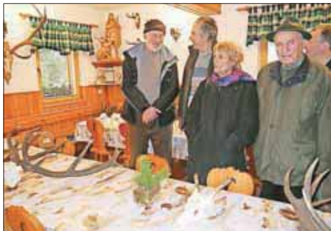
Razstavo so si ogledali lovci, posestniki, »vikendaši« in drugi.

Lovska družina šteje 58 članov in tri članice, ki so povprečno stari okrog 52 let. Najstarejši član ima 85 let in najmlajši nekaj manj kot 22 let. Šestintrideset članov je z Jezerskega, deset iz Kokre, osem iz Kranja in sedem od drugod. Člani so lani ob prizadevanjih za izpolnitev letnega načrta odzema divjadi iz lovišča opravili tudi blizu 1.500 ur prostovoljnega dela za pripravo pašnih površin za divjad, ročno in strojno košnjo, spravilo krme, zimsko krmljenje jelenjadi, vzdrževanje prež, solnic, steza ter drugih lovskih naprav in objektov.