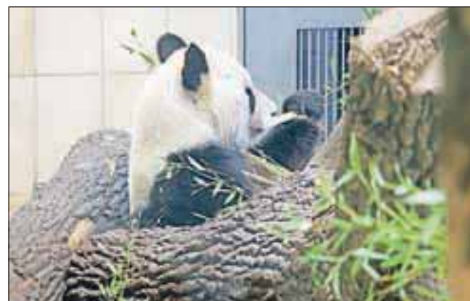
Velika panda se z obiskovalci ni obremenjevala.