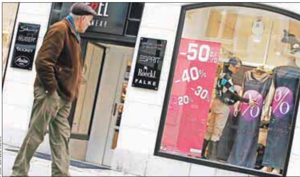
Razprodaje so še vedno priložnost za dober nakup. Zadnja leta tudi veliko bolj premišljen.

V preteklih letih so akcije brez prevalega reda preplavile trg, potrošniki so se srečali z akcijami ne glede na sezono. »Še vedno velja, da bolj ugodnega nakupa, kot je v času razprodaj, ni in tako razprodaje še vedno pritegnejo kupce. Decembrski popusti so že nekaj let stalnica, uraden začetek razprodaj pa dejansko pomeni konec sezone in trgovci želimo blago razprodati, da naredimo prostor za