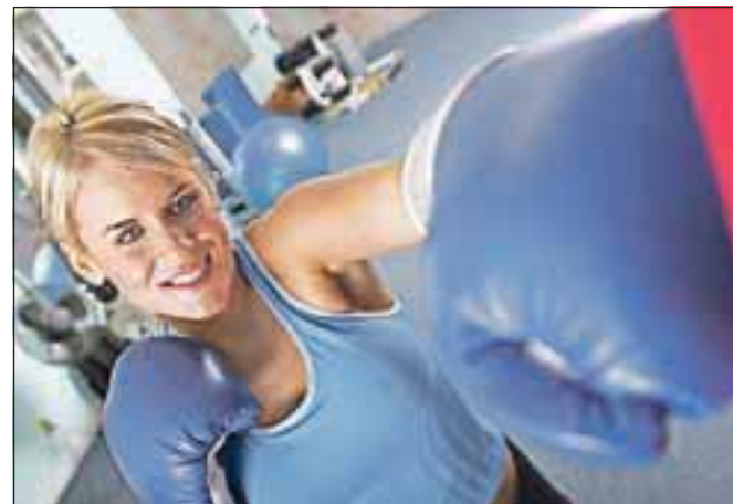
Zadosti imam sedenja in poležavanja!

Več se bom gibal, športal bom in tako tudi izgubil odvečne kilograme ter prenehal s kajenjem in žrtjem nezdrave hrane. Dobra odločitev. Šport je tisti, ki vam lahko »ubije tri ali štiri muhe« z enim zamahom. Če ne verjamete, pomislite, kaj boste storili, če se boste samo zaobljubili, da boste nehali kaditi. Če ne bom kadil, bom začel zganjati kak šport, da odvrnem misli, da bom tako prijetno nadihan, da mi