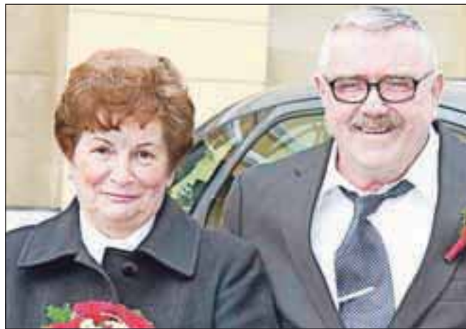
... in zlatoporočena danes. / Foto: Alenka Brun