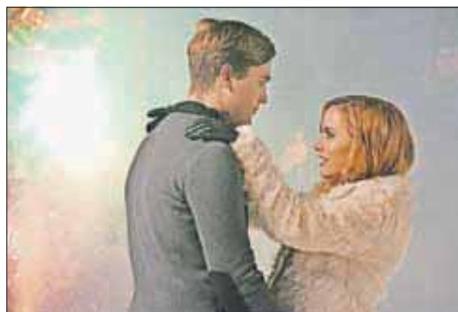
Za pesem so posneli tudi že videospot.