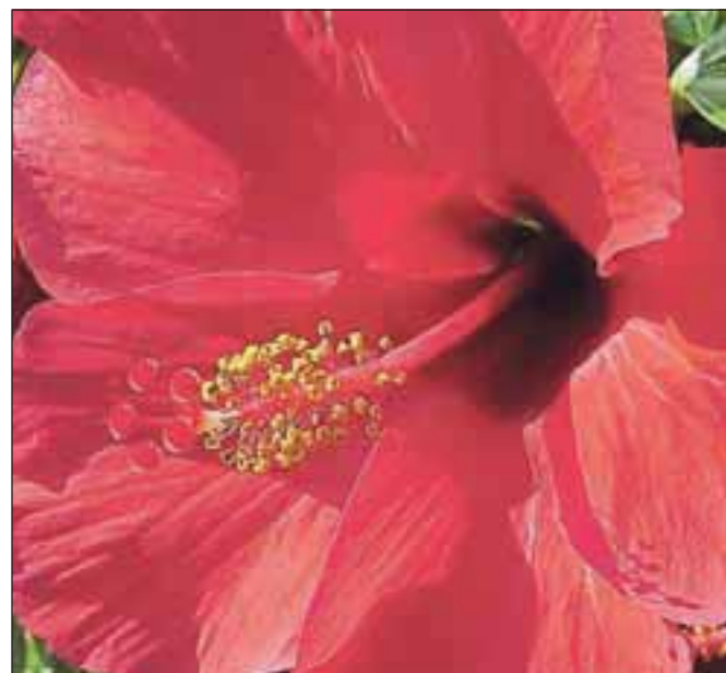
Rdeči drhteči hibiskusov cvet razvname ljubezen, kjerkoli se pojavi.

Čaj pripravimo v obliki poparka: čez pol žličke posušenih hibiskusovih cvetov prelijemo skodelico vrele vode in po 5 do 10 minutah precedimo. No, komur ni do kiselkastega okusa, ki je značilen za hibiskus, naj ga po želji osladi in obogati z jabolčnimi krljji, šipkom, plavico, gozdnim slezenovcem, cimetom, sladkim korencom, pomarančnimi ali limoninimi olupki, koščki ingverja, poprovo meto, janežem, komarčkom. Otroci obožujejo čajno mešanico iz hibiskusa, šipka, koščkov jabolka in pomarančnih olupkov – seveda, ekoloških. Sploh, če vanj vmešamo še vaniljo in žličko medu.