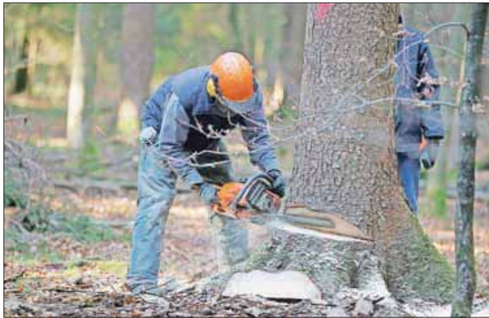
Kmetje pričakujejo letos tudi nov izračun višine katastrskega dohodka, pri katerem bosta upoštevana dejanska raba in boniteta zemljišč.

Kmečka gospodinjstva, ki so v letu 2011 presegla 7.500 evrov dohodka iz osnovne kmetijske in osnovne gozdarske dejavnosti, so po starem zakonu o davčnem postopku morala do konca lanskega oktobra priglasiti način ugotavljanja davčne osnove in določiti zavezanca. Spremenjeni zakon v prehodnih določbah tem zavezancem (vseh naj