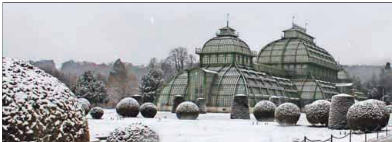
Velika steklena hiša je ob dunajskem vremenu dobila prav vesoljski videz.