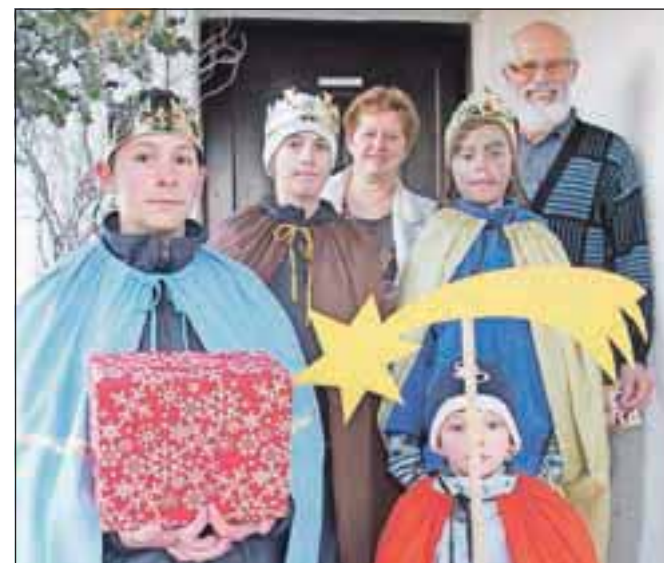
Koledniki so obiskali družine tudi na Zgornjem Brniku.