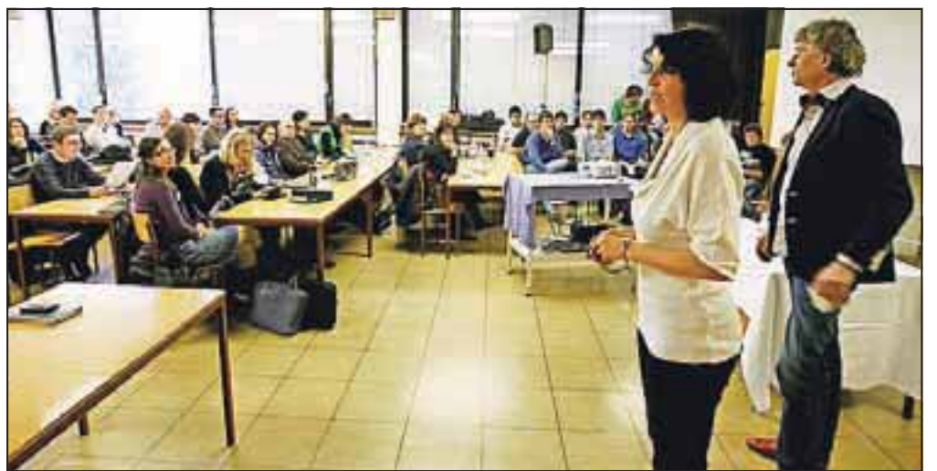
V srednji ekonomsko storitveni in gradbeni šoli so minuli konec tedna gostili usposabljanje učiteljev v okviru Slovenskega učnega kroga.