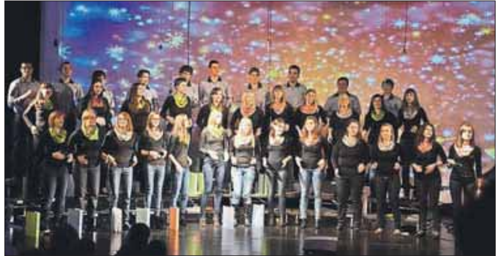
Zbor animatorjev Cerklje že dobro leto navdušuje občinstvo.

Poleg zbora sodelujejo tudi številni instrumentalisti: