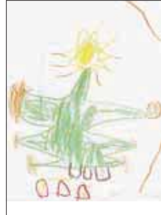
Tadej, 5 let

Sicer pa, dragi otroci, ne odlašajte in nam na naslov: Gorenjski glas, Bleiweisova cesta 4, Kranj, pošljite svoje risbice, pesmiče ali besedila, veseli jih bomo!