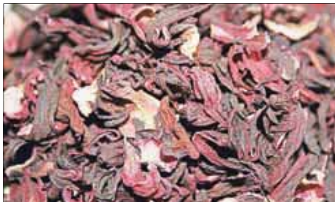
Ekstotična in čutna dišava hibiskusa ogreje srce in telo.

Uporabni del hibiskusa je pravzaprav samo cvet. V njem je veliko organskih kislin, denimo citronska, jabolčna, vinska, sluzi in pektinov. Zelo bogat je z antioksidanti – s flavonoidi in z vitamini C. Vsebuje tudi veliko železa in drugih rudnin, npr. kalija in magnezija, zaradi česar naj bi pripomogel k odpravljanju utrujenosti in slabokrvnosti.