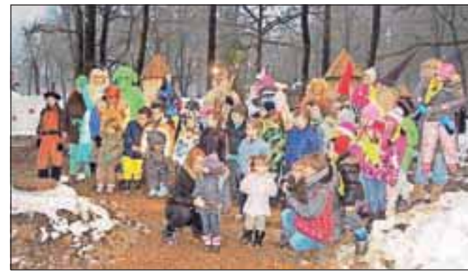
Dedek Mraz z otroki v Pravljični deželi Gorajte