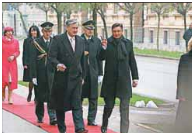
Predsedniški položaj je od Danila Türka prevzel Borut Pahor.