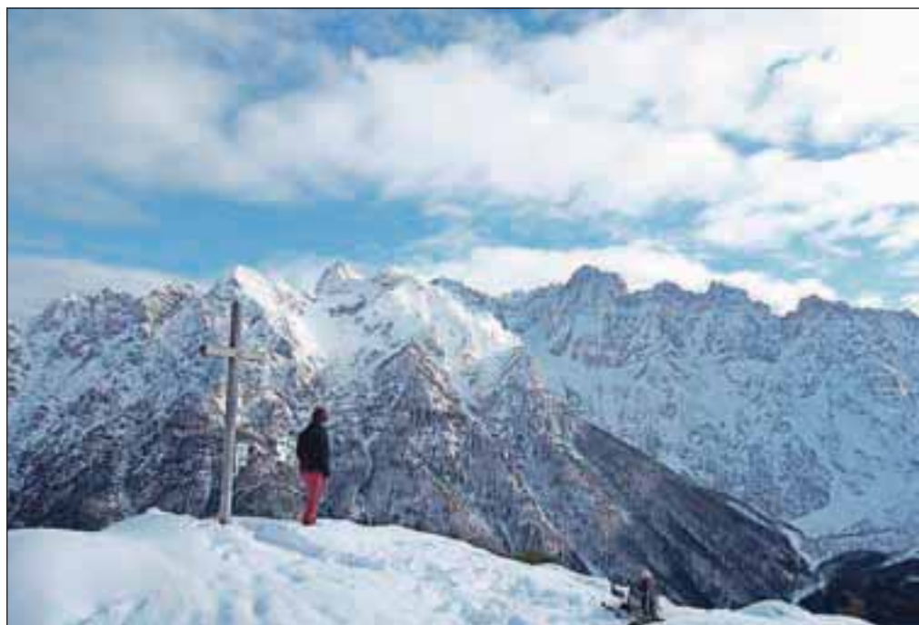
Vrh Visokega Mavrince z razgledom na Krnico, Škrlatico, Špik

Poraščena špička, z golim temenom, povsem nepomembna, ki nekako štrli