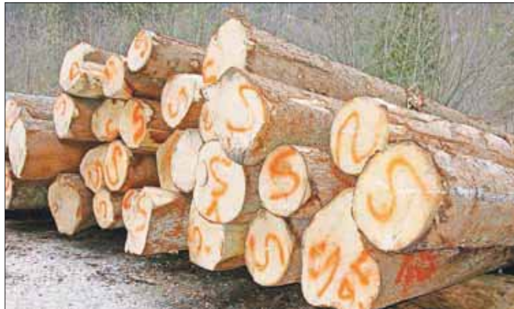
Davčna in carinska uprava sta pri prometu z lesom ugotovili številne nepravilnosti.

Davčna inšpekcija je v obdobju od 1. januarja 2009 do 31. oktobra 2012 opravila 993 nadzorov na področju posredništva in trgovine na debelo, kamor sodi tudi trgovina na debelo z lesom. V postopkih pri družbah, samostojnih podjetnikih in kmetih je ugotovila za 21,9 milijona evrov dodatnih davčnih obveznosti, to je povprečno 22.058 evrov na nadzor, pri kmetih povprečno kar 51.248 evrov. Inšpekcija je tako ugotovila, da zavezanci v poslovnih knjigah niso evidentirali prodaje lesa (hlodov, desk in drv) in da niso ravnali pravilno pri odhodkih med povezanimi osebami, pri plačevanju davkov in prispevkov od plač zaposlenih, pri odbitku do vstopnega davka na dodano vrednost