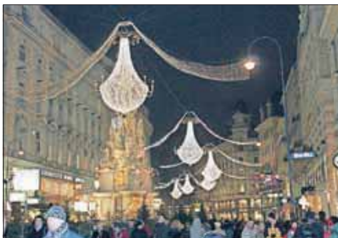
Nekatere ulice so okrašene enako kot lani.