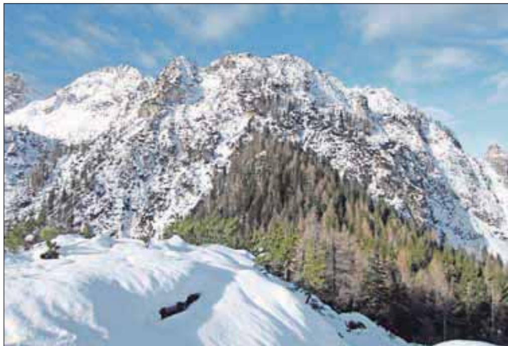
Soseda Visokega Mavrince je Kumlehovala glava.

Nadmorska višina: 1561 m Višinska razlika: 450 m Trajanje: 2 uri Zahtevnost: ★★★★★