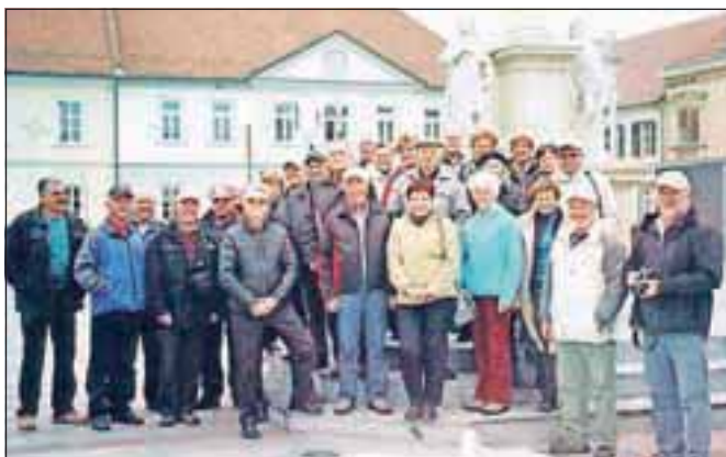
Fotografija za spomin iz središča Ljutomera

Člani Društva upokojencev Elektro Gorenjska so bili v jesenskem času na dveh izletih. Na oktobrskem izletu so si ogledali Kočevsko jezero, grobišče pod Krenom, zaprto območje Kočevske Reke in spominski park, kraje v Kostelu in polnilnico vode Costella. Cilj novembrskega izleta »v neznanu« je bil Ljutomer v Prekiji. Ogledali so si mesto, konje kasače, Čebelarški muzej Tigeli na Krapju pri Veržeju in vasico Jeruzalem, izlet pa so sklenili na kmečkem turizmu Stari hrast v vasi Radomerje, kjer smo imeli Martinovo kosilo in pokušnjo vin. C. Z.