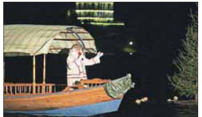
Otroke je nagovoril tudi dedek Mraz.