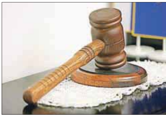
Kladivce je padlo: referendumov o slabi banki in državnem holdingu ne bo. / Foto: Tina Dokl