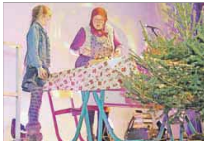
Na Jerbasu domačih v polni telovadnici OŠ Poljane na odru poleg dobre glasbe tudi smeha ni manjkalo.