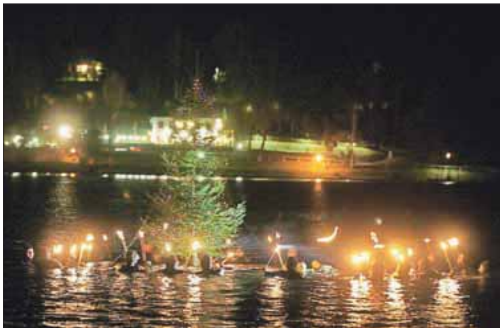
Božičnega potopa se je letos udeležilo okrog 40 potapljačev.