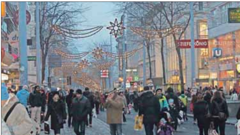
Znamenita nakupovalna ulica Mariahilfer