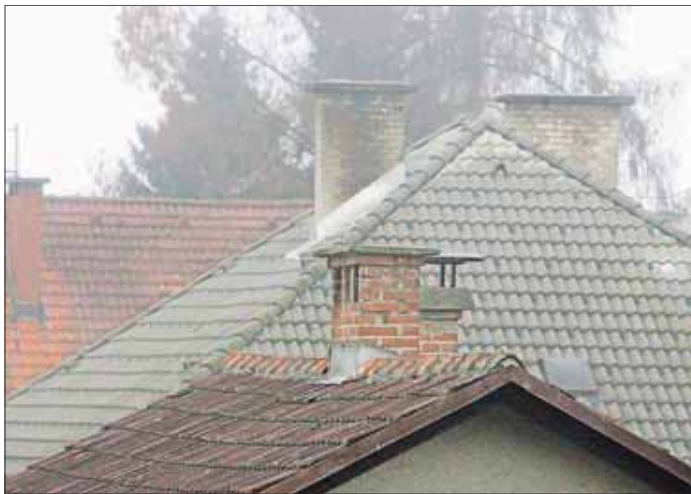
Število dimniških požarov v Sloveniji zadnja leta upada. Leta 2009 jih je bilo denimo 570, lani pa 377.

Redno čiščenje in vzdrževanje kurilnih in prezračevalnih naprav ter dimnikov ne pomeni le požarne varnosti, ampak tudi prihranek energije in manjše izpuste škodljivih emisij v ozračje, opozarjajo v dimnikarskih sekcijah: »Očiščene kurilne naprave porabijo tudi do deset odstotkov manj goriva. Pri sodobnih napravah na plin je ta prihranek nižji, pri neustreznih kurilnih napravah na trdna goriva pa je lahko celo višji. Vsak milimeter oblog v kurilni napravi zniža njen izkoristek za štiri do šest odstotkov.«