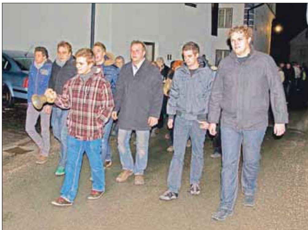
Hoje za zvoncem se je letos udeležilo okoli 50 domačinov. Na čelu procesije zvonijo samski fantje.

»Železniki so bili v 17. stoletju še podružnica selške fare. Leta 1622 se je Jurij Plavec na pobudo Železnikarjev odpravil k patriarhu v Oglej, da bi izposloval ustanovitev samostojne župnije v Železnikih. Bil je uspešen, tako da je iz Ogleja prinesel listino, s katero je bila ustanovitev nove župnije v Selški dolini potrjena. Vendar pa je Plavec po ustanovitvi župnije prvo leto zaspal k polnočnici, saj so se zvonovi iz zvonika farne cerkve v zgornji konec Železnikov slabo slišali. Da se to ne bi več zgodilo, je mladim fantom kupil poseben zvon, da so na sveti