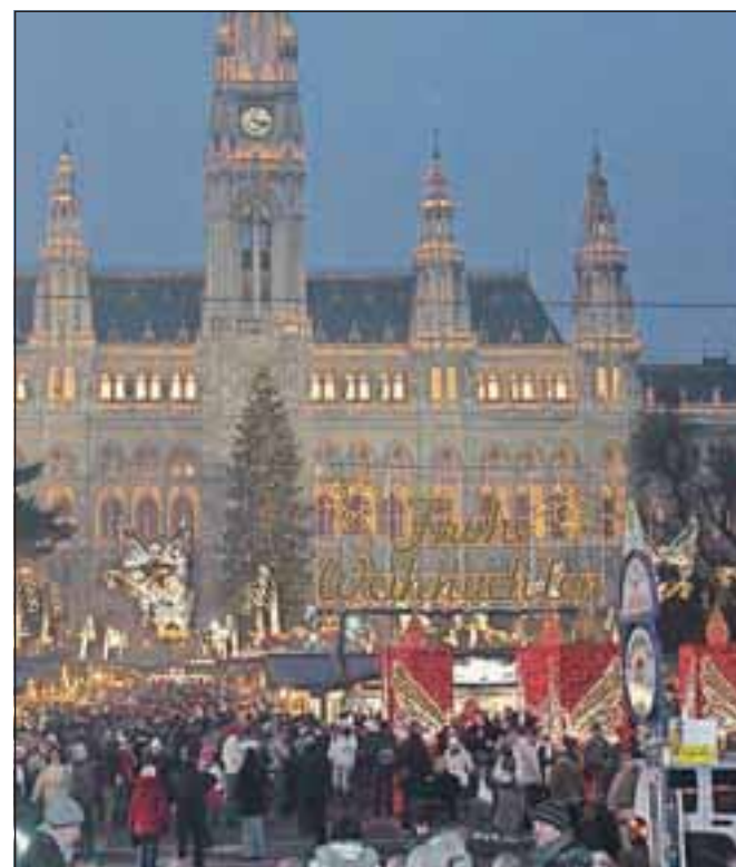
Najbolj priljubljen je na Dunaju – in tudi najbolj znan – božični sejem pred mestno hišo. Ko pride noč, čarobnost še bolj pride do izraza.