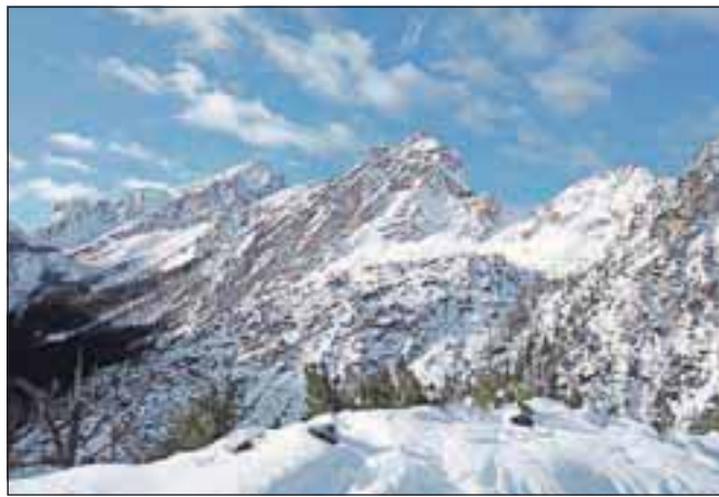
Mojstrovka, Nad šitom glava in Robičje z Visokega Mavrince

Od Koče na gozdu se odpravimo približno 200 metrov nazaj navzdol, kjer je na drevesu markacija za Erjavčevo kočjo, oz. dosežemo manjšo gozdno grapo, po kateri začnemo vzpon. Na prvem razcepju, ko če pogledamo nazaj, še dobro vidimo cesto, se pot usmeri levo proti Vršiču, mi pa proti Mavrincu krenemo desno. Zložno speljana lovska pot nas v okljukih vodi po gozdu. Mestoma je malce strmejša, sicer pa se pot zložno vzpenja. Dokaj hitro dosežemo klop, ki je na