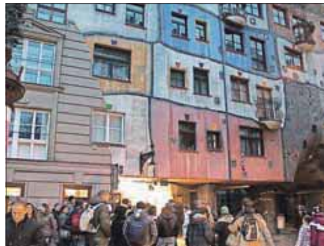
Umetniška hiša Hundertwasser v mrazu