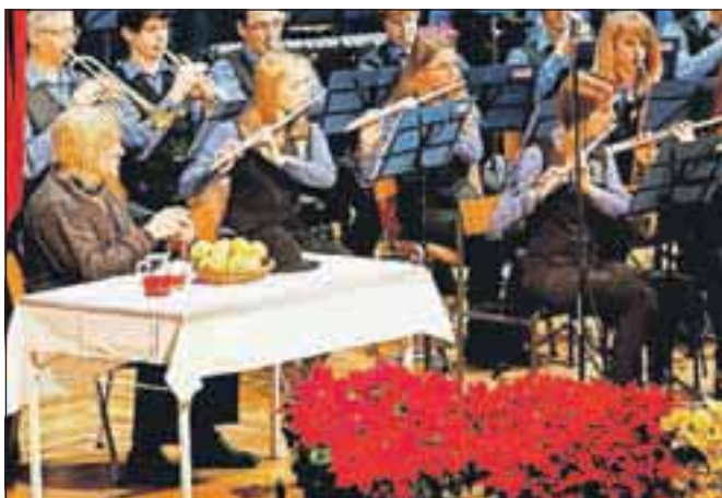
Pihalni orkester občine Šenčur je tokrat koncertiral v Košnikovi gostilni.