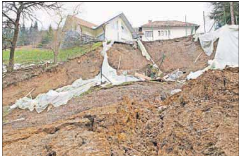
Plaz na Sovodnju se je sprožil neposredno pod šolo in vrtcem in se postopoma trga že skoraj dva meseca.