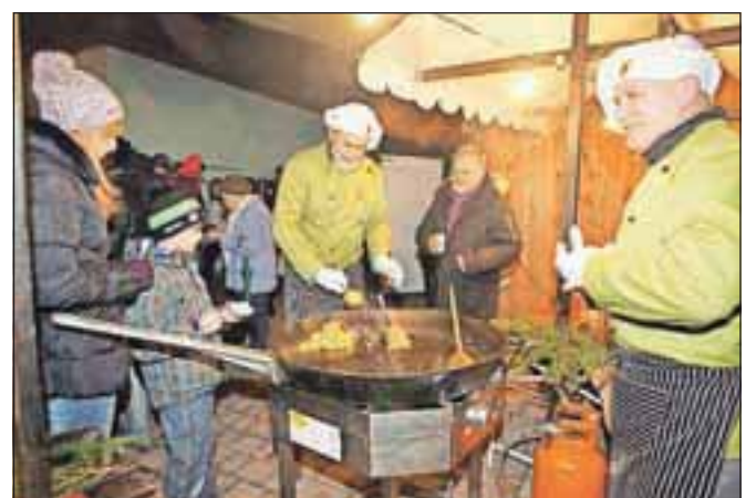
Po prizorišču se je širil omamen vonj s stojnice društva ljubiteljev praženega krompirja.