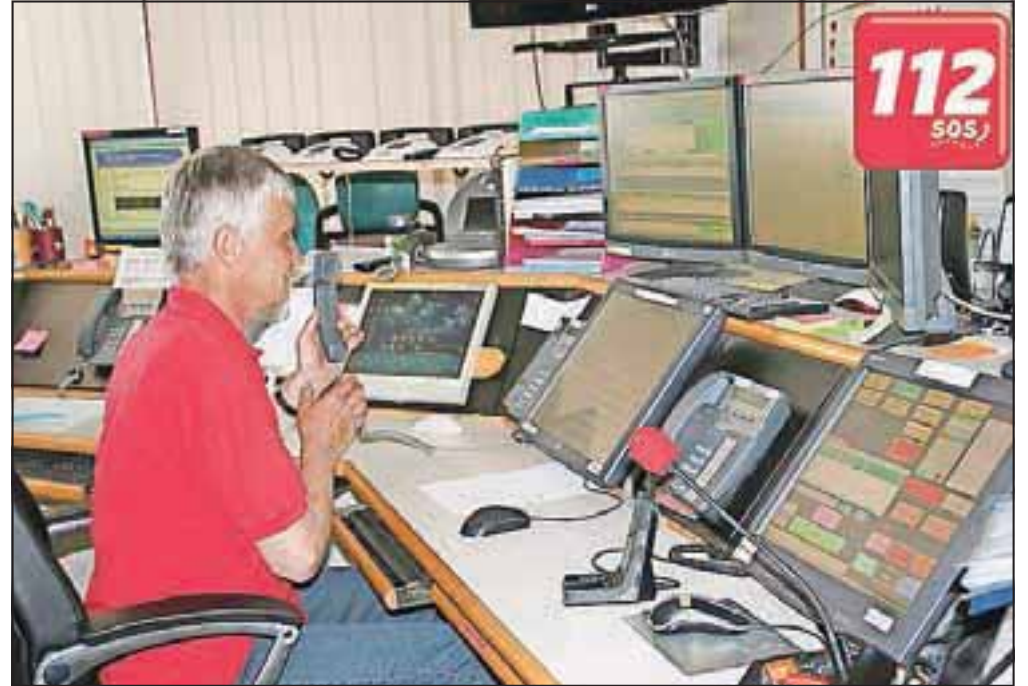
Operater na delu