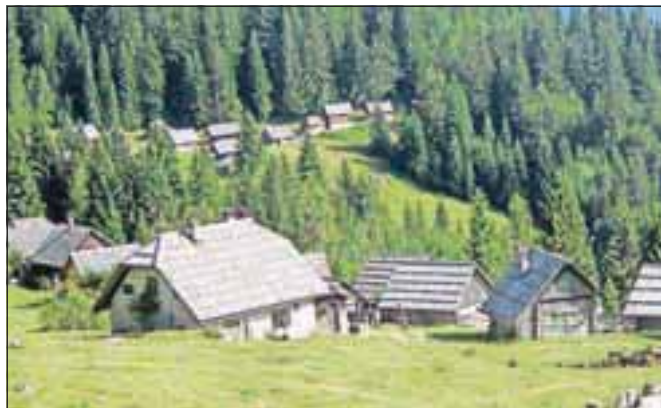
Ustavno sodišče je zavrnilo predlog za presojo ustavnosti uredbe, po kateri v Bohinju rušijo objekte, ki so jih gradili brez dovoljenj (fotografija je simbolična).

na območju Bohinja tako tečejo naprej, je razložil župan. »Vendar v Bohinju ne bomo dopustili, da bi rušili štirideset in več let stare objekte. Če bo treba, se bom tudi sam ulegel pred buldožer,« je poudaril in dodal: »Zrušiti bi bilo treba tistega, ki je pisal prijave, to je javni zavod Triglavski narodni park.« To je zdaj po njegovih besedah še dodaten razlog, da si bodo prizadevali za izstop iz parka. Odločbe o rušenju so ta čas izdali za 23 objektov, med katerimi so tudi hiše in gospodarska poslopja domačinov. V Triglavskem narodnem parku naj bi bilo sicer okrog petsto nedovoljeno zgrajenih objektov.