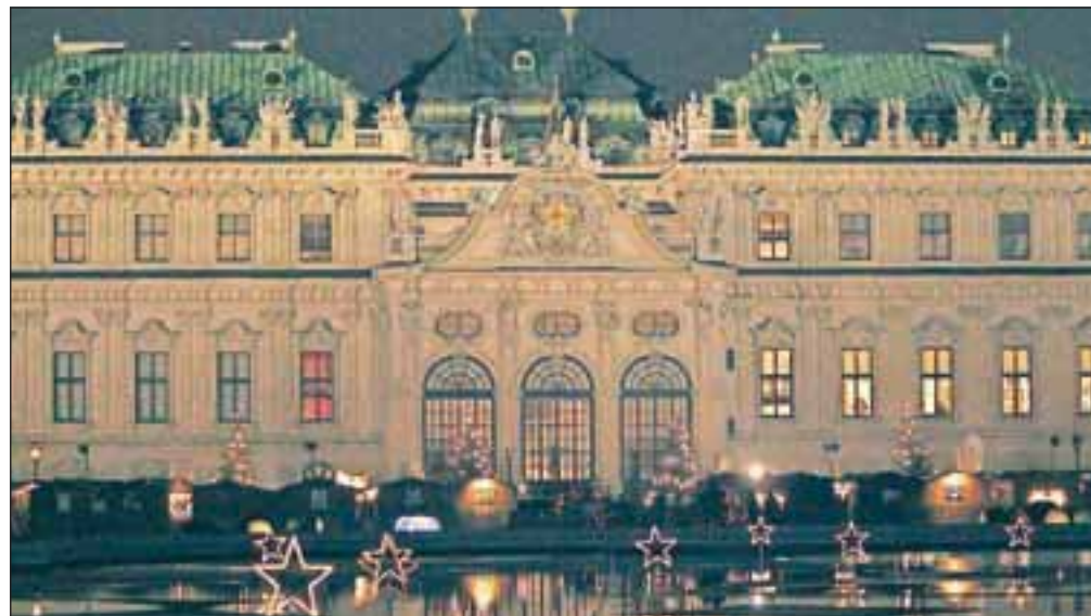
Nočni Belveder