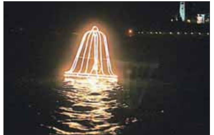
Na božični dan so na Bledu že 13. leto obudili legendo o potopljenem zvonu.

Dogodek, je pojasnila Eva Štravs Podlogar, poleg domačinov privablja tudi številne tuje goste. Hoteli ta čas sicer niso polno zasedeni, je razložila, lahko pa se pohvalijo z zanimivo strukturo gostov. »Poleg veliko Nemcev, Angležev in celo Maltežanov na Bledu gostimo skupino 70 Avstralcev, ki se je na enomesečni poti po Evropi prav med prazniki za štiri dni ustavila na Bledu in so imeli v svoj program vključen tudi ta dogodek.« Obiskovalci so se ob stojnicah lahko pogreli z brezplačnim čajem, dišalo pa je tudi po praženem krompirju, saj zadnjih nekaj let na prireditvi sodeluje tudi društvo ljubiteljev praženega krompirja. Tokrat so med obiskovalce brezplačno razdelili dvesto porcij te domače dobrote, za kar so sprazili kar štirideset kilogramov krompirja. Prireditev so kot vsako leto zaokrožili z ognjemetom, obiskovalci pa so se nato lahko v cerkvi sv. Martina udeležili še tradicionalnega božičnega koncerta mešanega pevskega zbora Blejski odmev.