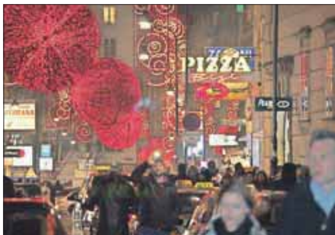
Ređe okrašena ulica, kamor zaide precej turistov.