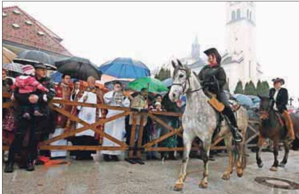
Nekaj dežnih kapelj ni zmotilo slovesnega blagoslova štiridesetih živali.

Na tradicionalni blagoslovitvi v Naklem in v Podbrezjah se je zaradi slabega