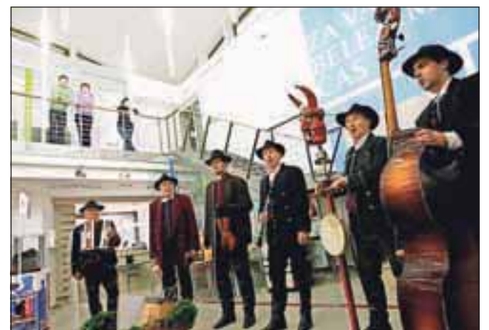
Kranjski furmani v božičnem in novoletnem času s koledniškimi pesmimi prinašajo veselje in voščilo srečo, včeraj pa so zapeli tudi v prostorih Gorenjskega glasa.

Kranjski furmani, ki delujejo pod okriljem akademske folklorne skupine Ozara Kranj (letos so dobili tudi občinsko priznanje), tako iz domov preganjajo zle duhove, s koledniškimi pesmimi pa prinašajo veselje in voščilo srečo v novem letu. Igrajo na različne inštrumente od diatonične harmonike, klarineta, violine, nekaj posebnega pa je hudičev boben, ki je ostanek janičarske godbe in povsod vzbuja še posebno pozornost.