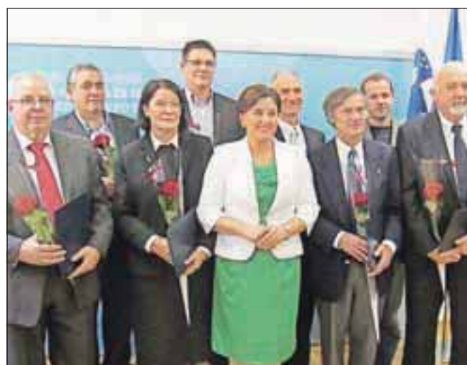
Prejemniki priznanj z ministrico Ljudmilo Novak

Slovenska prosvetna zveza iz Celovca vabi v petek, 4. januarja, na tradicionalni, že 61. Slovenski ples, ki bo v dvorani Casineuma v Vrbi/Velden ob Vrbskem jezeru. Rezervacije miz in vstopnic sprejemajo po telefonu 0043/463 51 4300 22 in na e-naslov spz@slo.at.