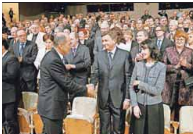
Novemu predsedniku države Borutu Pahorju je čestital predsednik vlade Janez Janša.