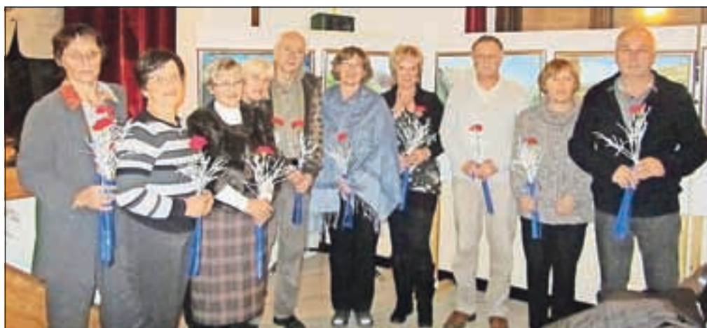
Likovniki, ki so »naslikali« dvanajst narodnih pesmi.