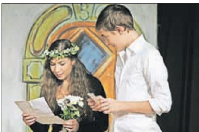
Ženin in nevesta sta bila glavna lika odrske igre mladimi Preddvorčanov.