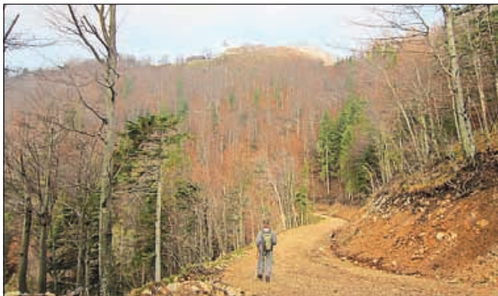
Pogled proti našemu današnjemu vrhu / Foto: Jelena Justin

Nadmorska višina: 961 m Višinska razlika: 440 m Trajanje: 2 uri Zahtevnost: ★★★★★