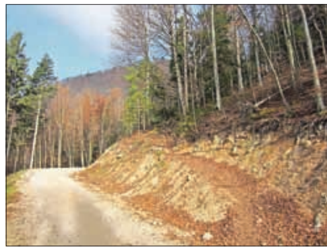
Eno od prečenj ceste, ki vodi proti vrhu.

Po zgornji poti dosežemo razcep za Potoško goro, a mi nadaljujemo naprej mimo