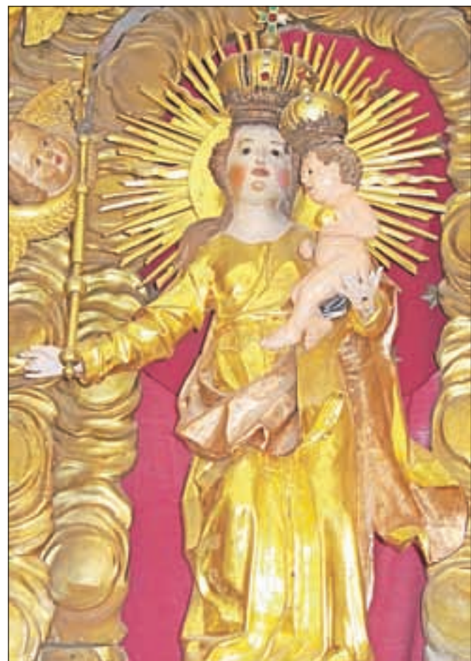
Kip udarjene Marije z rano na levem sencu