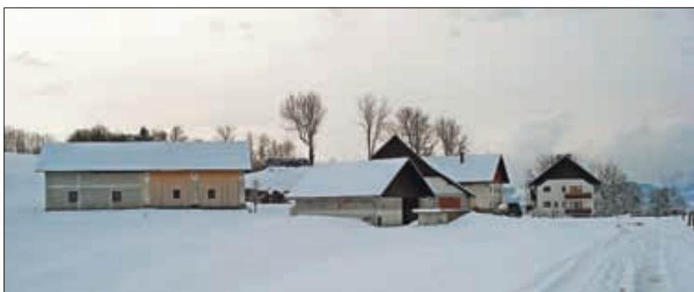
Domačija Pr' Izgorc v Čabračah