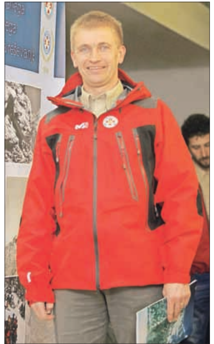
Drejc Karničar

»Luka, prav tako pedagog po poklicu, mi je vzornik na več področjih, tako v organizacijskem smislu, pri vodenju GRS, glede splošnega družbenega angazmaja, družbene aktivnosti, sodelovanja v skupnosti (bil je tudi pobudnik samostojne občine Jezersko), na kulturnem in političnem področju. Tudi on je bil zelo prodooren na vseh področjih. Tako s ponosom nadaljujem njegovo tradicijo in sledim njegovim vrednotam.«