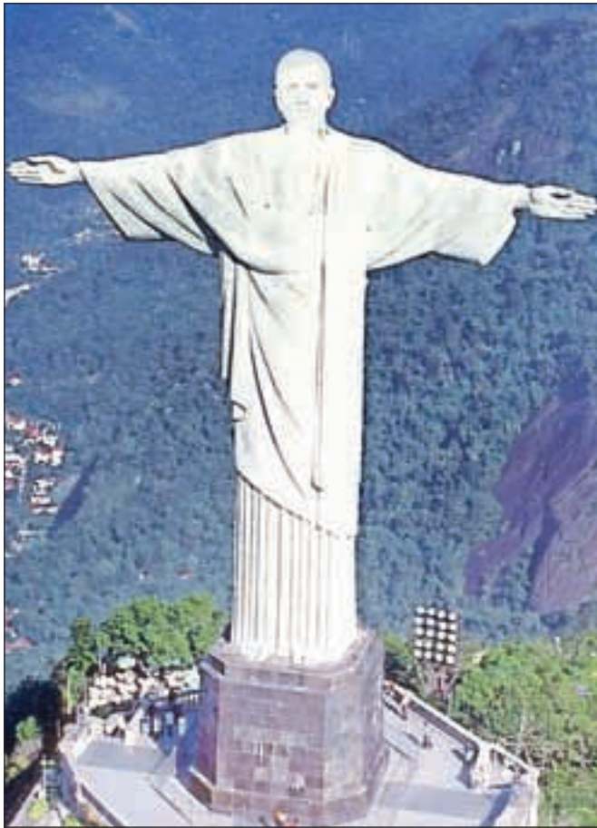
Srečko Katanec trenutno na skrivaj v Riu de Janeiru preverja splošno klimo v Braziliji. Če ga niste prepoznali, pomeni, da se je dobro skrili.