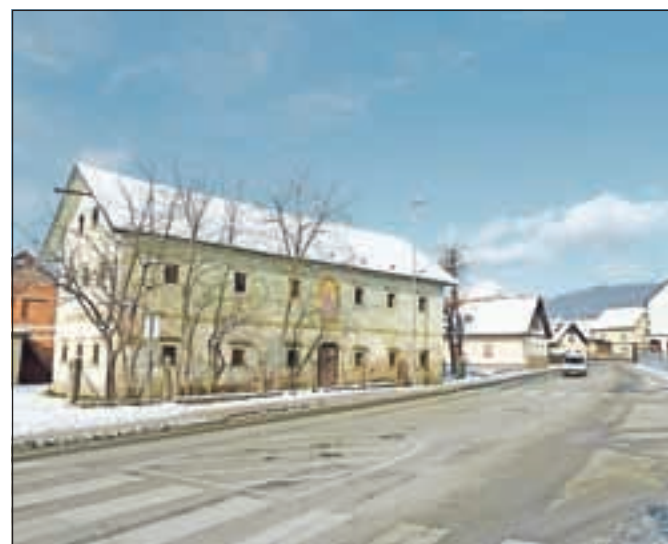
Premuzarjeva hiša v Cerkljah je že v lasti občine.