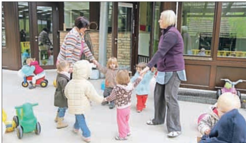
Zaposleni v vrtcih so se ta teden odločali o stavki.