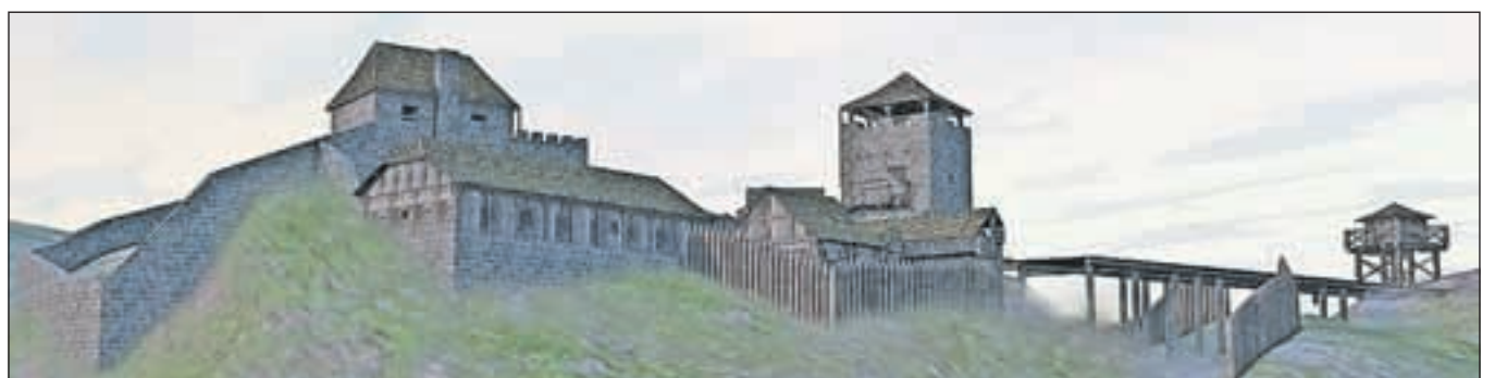
Vizualizacija rekonstrukcije gradu Wartenberg / Foto: arhiv Skupine Magelan, Gregor Novakovič

Organizatorji filmskih predstav si pridržujejo pravico do spremembe programa.