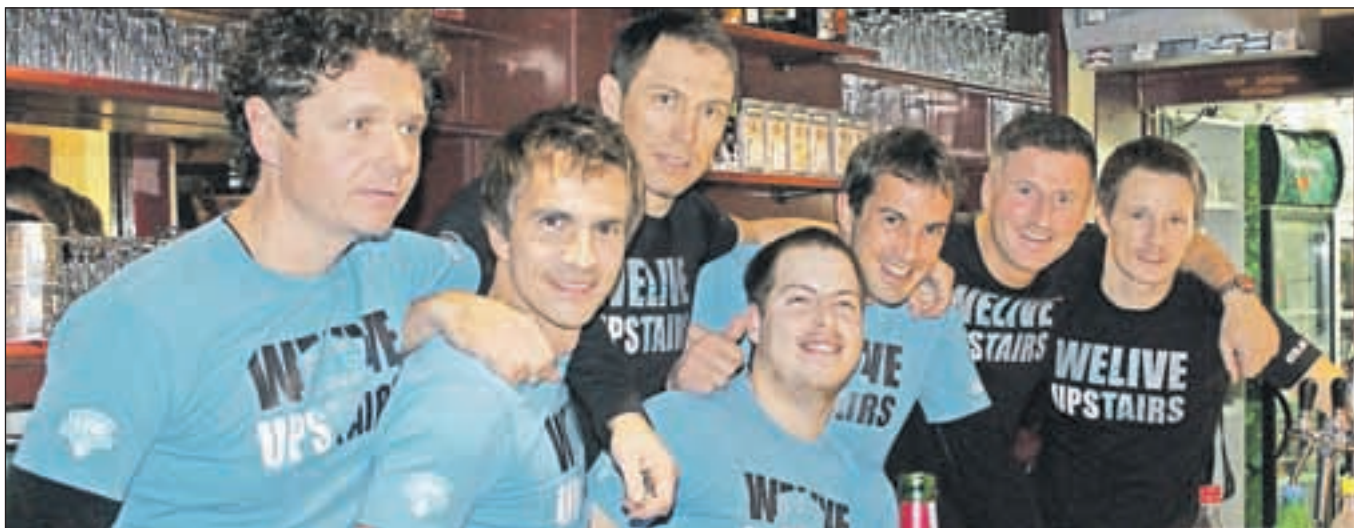
Ekipe dvanajstih ur je skrbela za razpoloženje in polne kozarce od šestih popoldne do šestih zjutraj naslednjega dne.

razstavlja božično-novoletne aranžmaje, ustvarjene iz odsluženega materiala. Razstava z naslovom Umetnost recikliranja prikazuje okoli devetdeset aranžmajev, narejenih na osnovi razbitih steklenic in drugih steklenih izdelkov. »Uporabil sem tudi stiropor, les, plastiko, papir, keramiko, skratka vse, kar doma dela šaro. Aranžmaje nato kombiniram z naravnimi materiali, kot so korenine, storži,« je pojasnil mladi umetnik. Ustvarjalno pot je začel pred dvema letoma, ko se mu je med pospravljanjem razbila steklenica, ob pogledu na črepinje pa je pomislil, da bi se jo dalo pobarvati in iz nje narediti kaj več. Razstava bo odprta do 30. decembra.