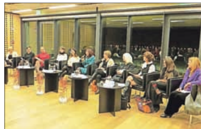
Uspešne Slovenke na pogovoru na Brdu