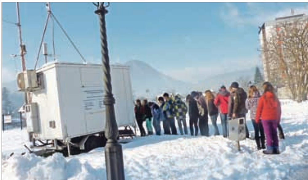
Mobilno postajo za merjenje kakovosti zraka so si ogledali tudi najbližji sosede, učenci Osnovne šole Škofja Loka – Mesto.

Dan pred občinsko predstavitev rezultatov merjenja zraka je novinarsko konferenco pripravilo tudi podjetje Knauf Insulation, ki ga kot proizvajalca kamene volne ljudje v okolici največkrat dolžijo, da onesnažuje