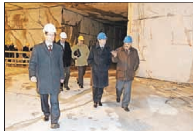
Minister Radovan Žerjav (v sredi) si je ogledal kamnolom, kasneje pa zagnal 210 tisoč evrov vredni stroj.

poudarja, da je bila družba pred meseci na robu obstoja. K optimizmu jih je z obiskom spodbudil gospodarski minister Radovan Žerjav, ki se ni mogel načuditi referencam družbe. Najnovejši sta prenova hotela Ritz Carlton in oprema velike luksuzne jahte. (Več na 17. strani)