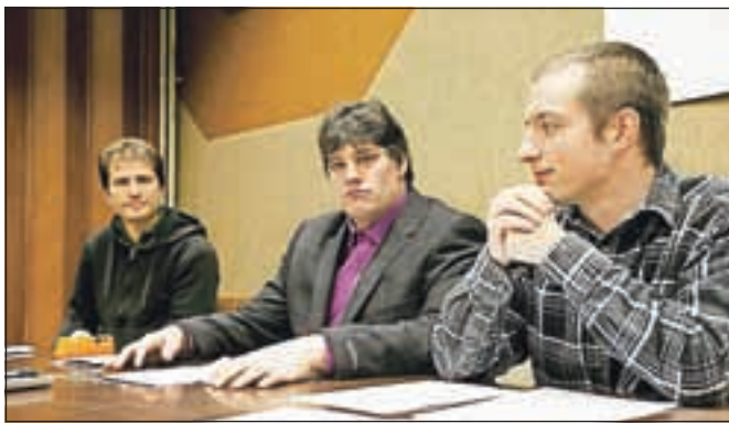
Centralni komite Rdečih radikalov na predstavitvi programa

»Potrebno je reinterpretirati marksistične in sorodne ideje, prilagojene današnji družbi in razvoju človeštva. Rdeči radikali se trudimo povezati delavski razred in napredne ljudi v idejah in principih znanstvenega socializma,« so v sredo pojasnili javnosti. Program so strnili v enajst ključnih točk. Menijo, da se je treba distancirati od virov turbo kapitalizma, izstopiti iz EU in NATO ter vzpostaviti gospodarsko samooskrbni in samozadostni sistem.