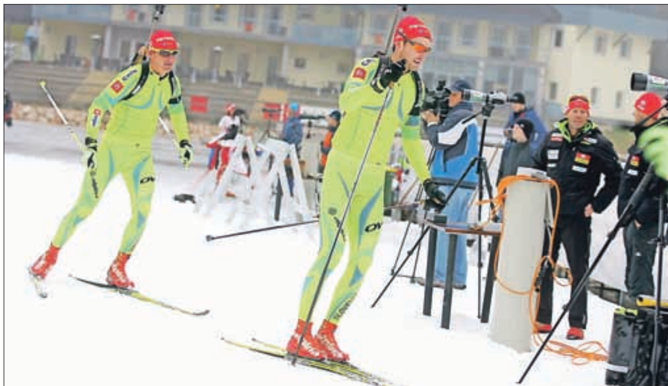
Poključka je postala pomemben vadbeni center, na njej pa z veseljem trenirajo in tekmujejo tudi vsi naši najboljši smučarski tekači in biatlonci.