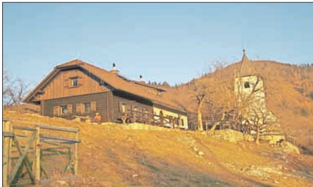
Koča na vrhu