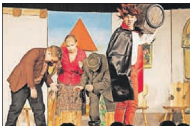
Brez glasbe in hudomušnih prizorov na odru tudi tokrat ni šlo.