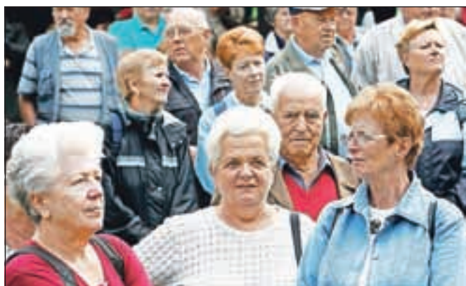
Nova pokojninska zakonodaja bo začela veljati 1. januarja 2013, na zavodu za pokojninsko in invalidsko zavarovanje pa opozarjajo, naj nikar ne hitijo v pokoj tisti, ki že letos izpolnjujejo upokojitvene pogoje.