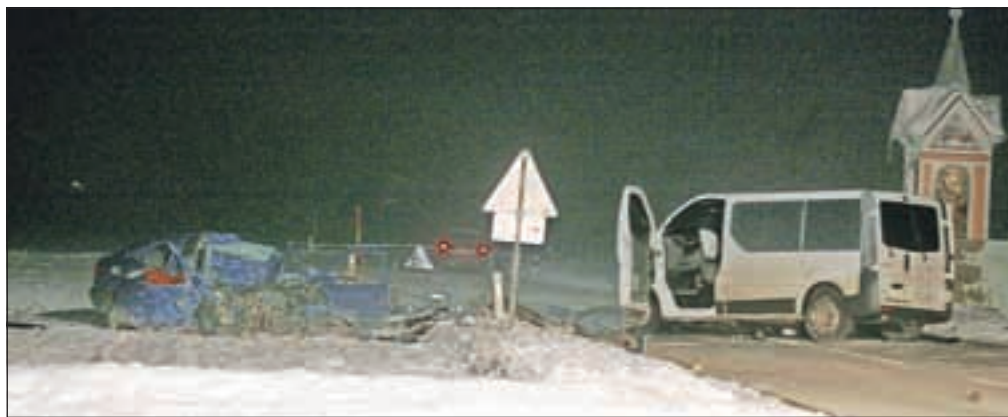
Nesreča blizu Voklega je bila usodna za 22-letnika.

V torek se je hujša prometna nesreča zgodila tudi na cesti pri Selu pri Žireh, v Zgornjih Gorjah pa je neznanec z belim vozilom zbil 82-letnega pešca in pobe gnil. Več na kroniki na strani 10.