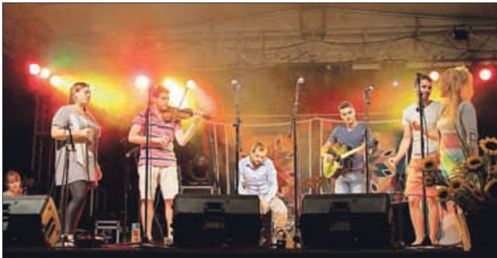
Glasbeniki iz petih evropskih držav so navdušili z ljudsko glasbo, združeno v projektu Folk it up!.

Dogajanje se v naslednjem tednu preselilo v idiličen Zdraviliški park, kjer so četrtkov poletni večer ob jezeru razgibali glasbeniki iz Francije, Cipra, Estonije, Škotske in Slovenije s projektom Folk it up!, ki že tri leta po vsej Evropi predstavljajo ljudsko glasbo, kar je v več kot dveh desetletjih namen tudi festivala Okarina. Za country-folk ritme je v petek poskrbela ameriška skupina