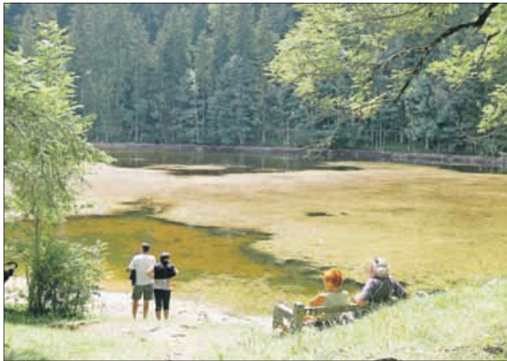
Posledice suše se kažejo tudi na Planšarskem jezeru na Jezerškem.

Najdlje sušne razmere trajajo na Primorskem, kjer že od oktobra ni bilo obilnejšega dežja. Skromne so bile padavine v tem obdobju tudi na večjem delu osrednje Slovenije ter v pasu proti jugovzhodnem delu, kjer jih je padlo od 50 do 100 mm. Padavinska slika v tem obdobju je nekoliko boljša proti severu in severovzhodu države.