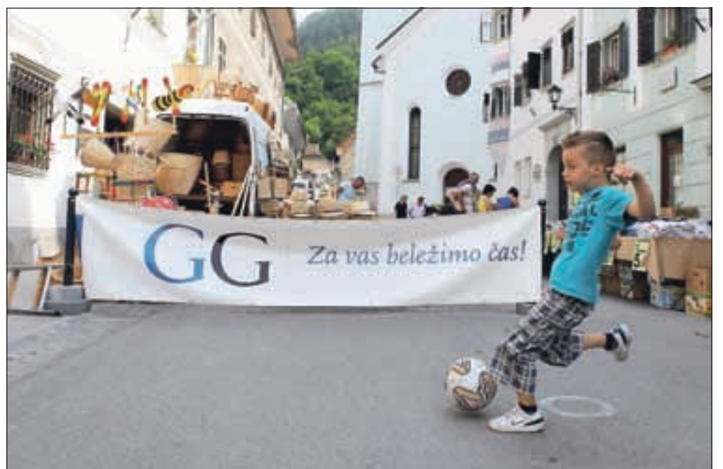
Sobotni tržni dan so v Tržiču s predstavitvo popestrili tudi nogometaši.

»Veseli smo, da je zanimanje za nogomet v Tržiču ostalo, dokaz za to pa je, da imamo že tako številno članstvo, pa tudi danes smo dobili tako nove člane kot nove igralce. Prek dvajset igralcev imamo že registriranih, še nekaj več jih čaka na registracijo. Do sedaj so morali starši otroke voziti na treninge drugam in veliko talentiranih igralcev je prav zaradi prevoza prenehalo igrati. Sedaj to ne bo več problem, saj bomo po 20. avgustu začeli trenirati tu, v Tržiču,