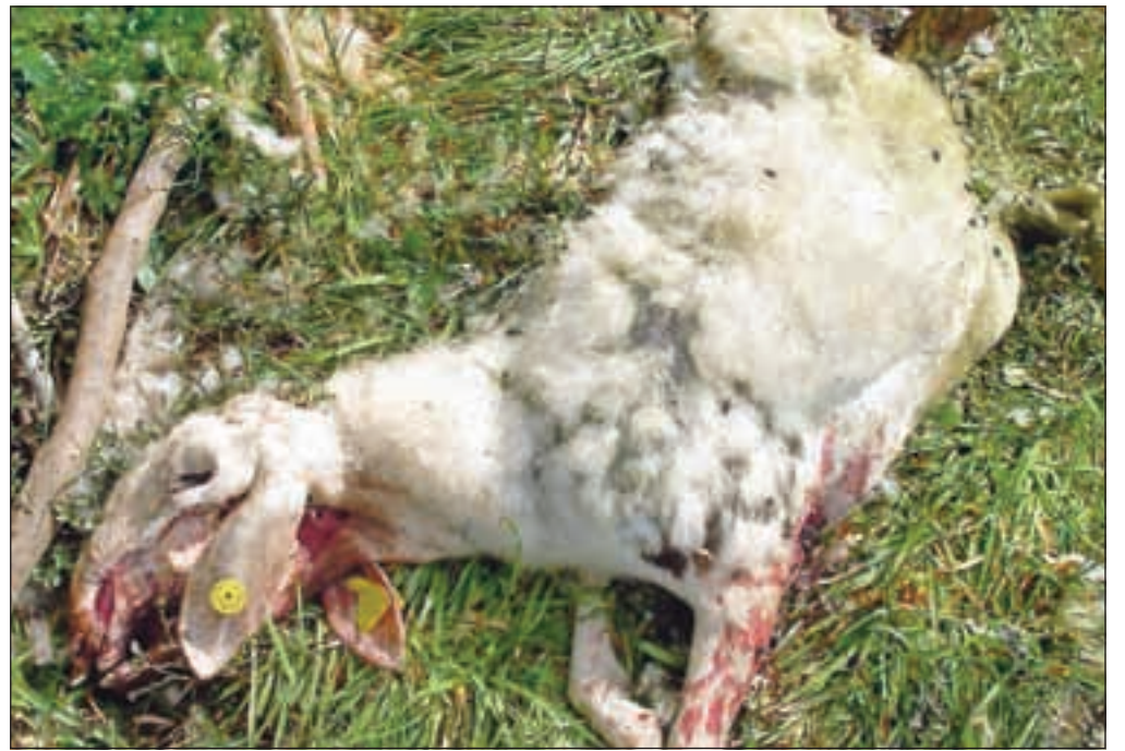
► 18. stran Ena od pokončanih ovc s planine nad Srednjim Vrhom

V zavodu za gozdove po vsakem napadu poskušajo zbrati dokaze, na podlagi katerih lahko potlej na ministrstvo za kmetijstvo in okolje tudi naslovijo zahteve za izplačilo odškodnine.