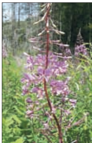
Ozkolistni vrbovec, rožnati lepotec z gozdnih jas in obronkov

O ne, to pa ni ta pravi vrbovec, bodo nemara ugovarjali nekateri. Za prostato je gotovo najboljši drobnocvetni vrbovec. Kakšen ozkolistni vrbovec neki! A to sploh obstaja ali je tale gospodična malce pregloboko pogledala v kozarec in pomešala imena. Ozkolistni trpotec že, ne pa ozkolistni vrbovec. No, ljubitelji narave, zelišč in ljudskega zdravilstva gotovo dobro vedo, da je ozkolistni vrbovec prav pogosta rastlina naših gozdnih posek, grušča, grmovja, obrežij in gozdnih jas. Včasih ustvarja čudovite škrlatne otoke sredi zelenih gozdov.