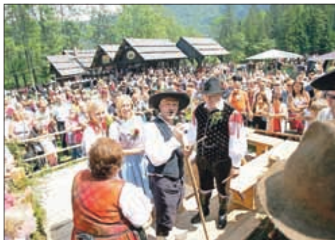
Vsakič Jezerjani uprizorijo tudi pogovor med gospodarjem na kmetiji in pastirji.