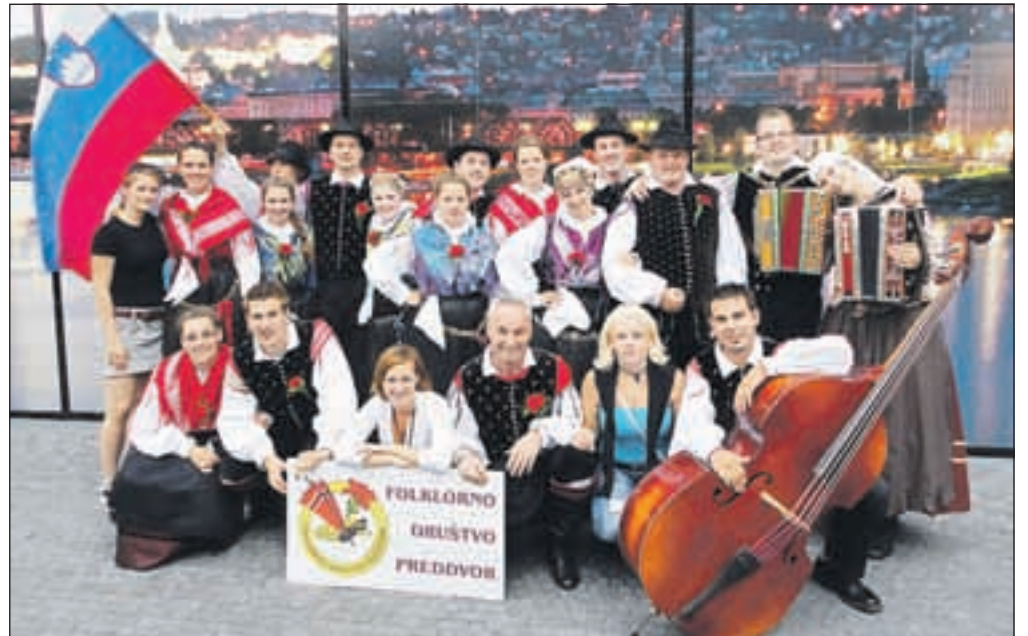
Folklorno društvo Preddvor je gostovalo v Bratislavi.