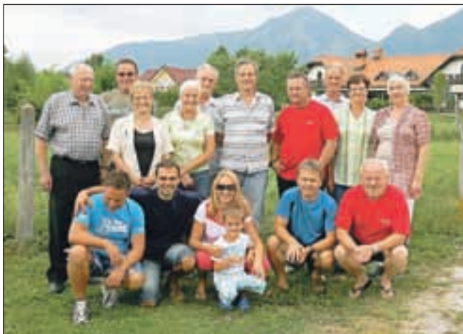
Skupnica tistih, ki so se iz Sr. Bele odselili, so se pa srečanja vaščanov udeležili.

zgodovinarjem Matijem Valjavcem. Lačen in žejen ni bil nihče, tako odrasli kot otroci pa so izkoristili priljubljenost za prijetno nedeljsko druženje.