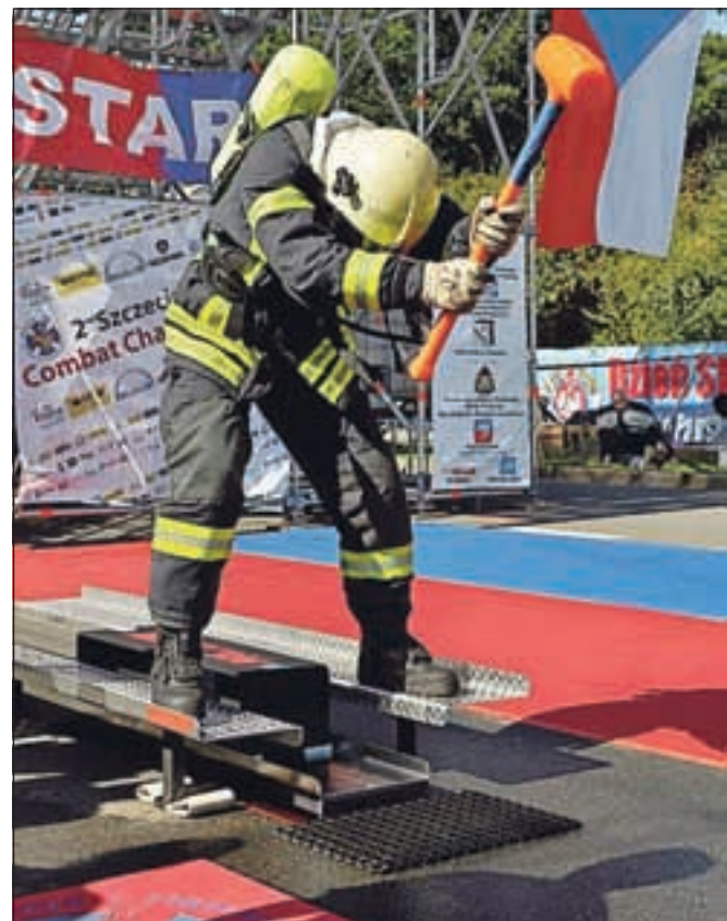
Najboljši tekmovalci v Firefighter Combat Challengeu se bodo med 21. in 23. pomerili tudi na državnem in evropskem tekmovanju na Bledu. / Foto: ekipa FCC Slovenija

Firefighter Combat Challenge ali »Najtežji dve minuti v športu« je tekmovanje iz gasilskih veščin. Tekmovalec mora v polni gasilski opremi, težki okoli 20 kilogramov, teči v 3. nadstropje z 20 kilogramov težko cevjo na ramenih, na vrh mora potegniti še enako težko cev, s kladivom potolči kladlo, potegniti cev pod pritiskom in s curkom zbiti tarčo ter skozi ciljno ravnino potegniti 80-kilogramskega ponesrečenca.