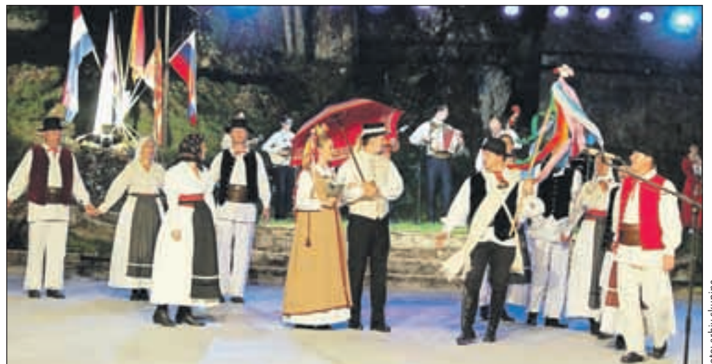
Folklorna skupina Sava Kranj je nastopila na Mednarodnem folklorinem festivalu Cetinje 2012.

so imeli čast, da so na gostovanju krstili štiri nove člane.