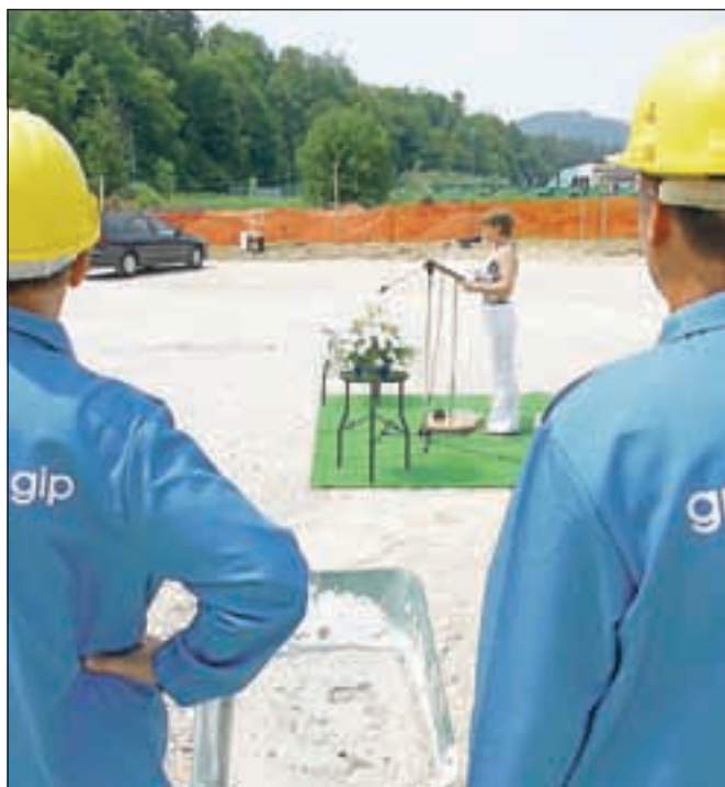
Evropska komisija bo z več kot sto milijardami evrov skušala predramiti evropsko gradbeništvu oziroma naložbe. Za številna slovenska podjetja žal prepozno.

Glavni elementi strategije so krepitev ugodnih naložbenih pogojev, zlasti pri obnovi in vzdrževanju stavb (tak primer je spodbujanje izkoriščanja svežnja posojil v višini 120 milijard evrov, ki ga je v okviru pakta za rast in zaposlovanje junija pripravila Evropska investicijska banka), pospeševanje inovacij in izboljšanje kvalifikacij delavcev s spodbujanjem mobilnosti, izboljševanje učinkovite rabe virov s spodbujanjem medsebojnega priznavanja trajnostnih gradbenih sistemov v EU, priprava gradbenih standardov, ki bodo gradbenim podjetjem olajšali delo v drugih državah članicah,