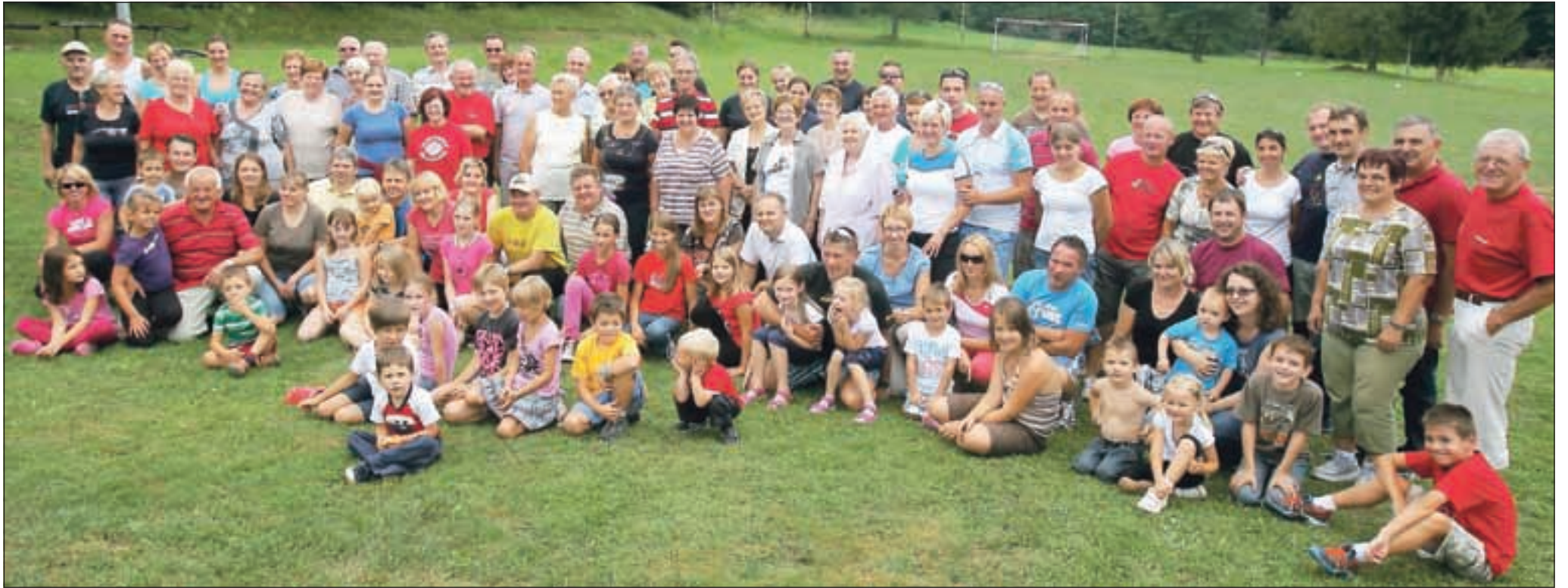
Srečanje vaščanov Sr. Bele pri Preddvoru