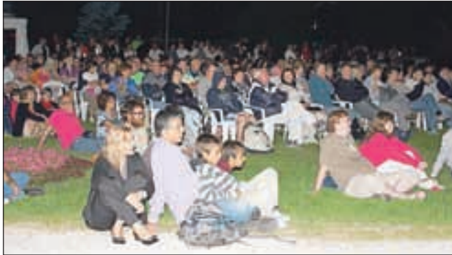
Festival Okarina je tudi tokrat na Bled privabil mnoge poslušalce etno glasbe.

Ahab, festival pa je v soboto zaključil legendarni Vlado Kreslin s skupinama Beltinška banda ter Mali bogovi, medtem ko je nastop ruskih kozakov s tradicionalno glasbo in plesi prestavljen na september. Okarina etno festival tako ostaja pomemben kamenček v mozaiku blejske poletne kulturne ponudbe in prepričani smo, da nas bodo kakovostni glasbeniki razvajali tudi v prihodnje.