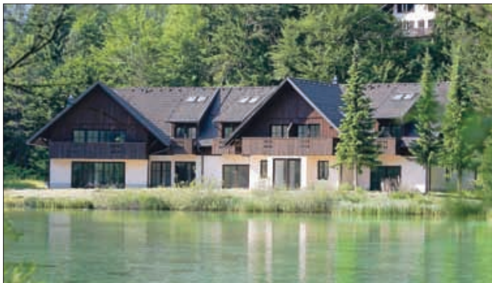
Prodaja Jasne za zdaj ni uspela, leta 2005 zgrajeni objekt na elitni lokaciji v Kranjski Gori ostaja zaprt.

Po teh načrtih naj bi leta 2005 po požaru na novo zgrajeni objekt, ki obsega 935 kvadratnih metrov neto tlorisnih površin na skoraj deset tisoč kvadratnih metrih zemljišča, delno preuredili in pritičje namenili gostinski dejavnosti, uredili pa naj bi tudi obalo in kopalnišče. Potencialni novi lastniki so v juniju celo že začeli delati; med drugim so odstranili ograjo, s katero so dosedanja lastniki avgusta lani obiskovalcem preprečili dostop do objekta, polovice jezera in parkirišča.