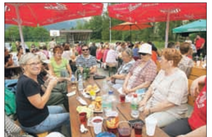
Dobre volje, hrane in pijače ni manjkalo.