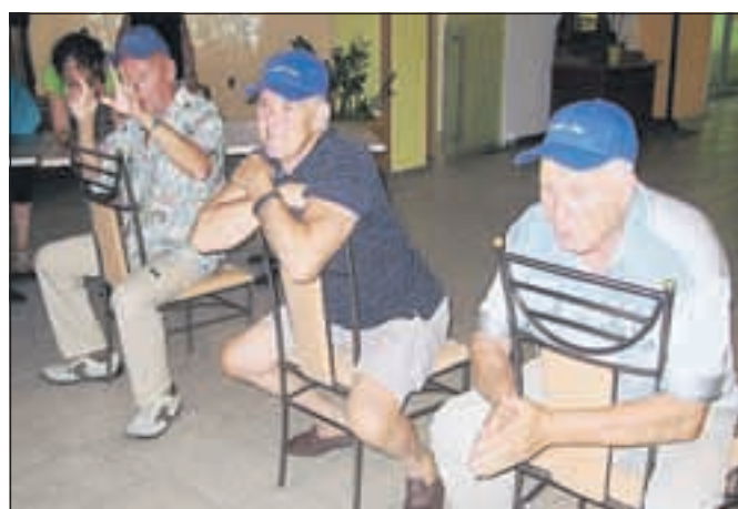
Gospodje so v zadnji igri spodbujali.