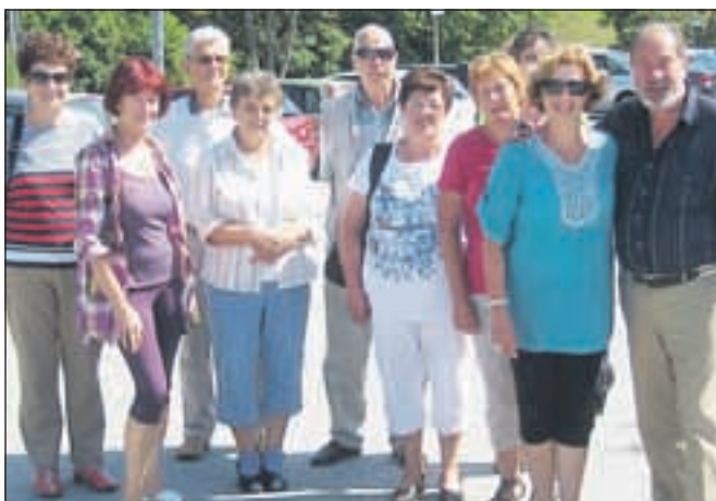
Novih obrazov je bilo na izletu za manjšo skupino. 'Prvošolčki' smo jih v šali poimenovali Glasovci .