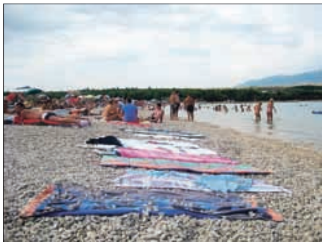
Večina Gorenjcev se pri izbiri dopusta odloči za morje.

Igralec, ki smo ga nazadnje srečali v vlogi Švejka na odru Poletnega gledališča Studenec Konrad Pižorn