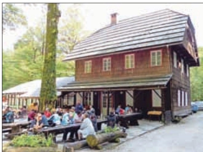
Za nakup okrepčevalnice Savica se zanima bohinjska občina.

za prodajo tričetrtinskega deleža v podjetju Šport hotel Pokljuka. Po besedah Ivana