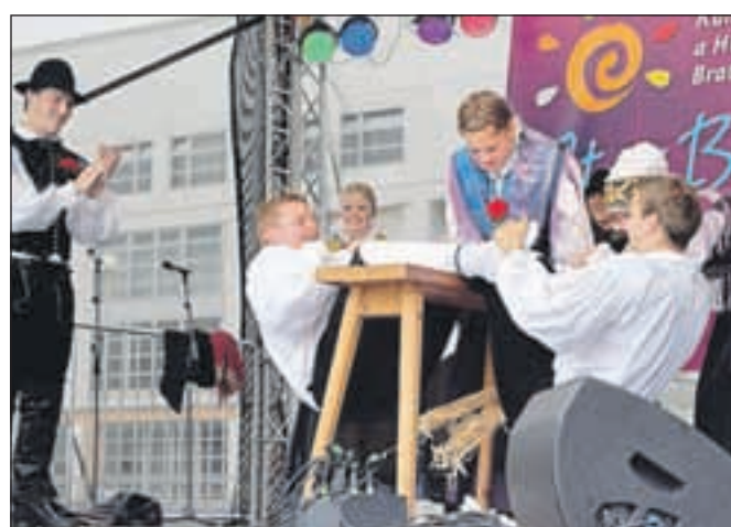
Preddvorčani so z vsakim plesom navdušili, Kranjčani pa so v Črni gori predstavili tudi gorenjsko kulinariko.