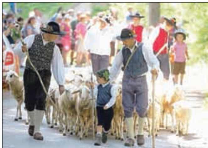
Bistvo in vrhunec ovčarskega bala prav gotovo predstavlja prikaz prigona ovc s planine.

so lahko prisluhnili harmoniki, spremljali folklorni nastop, na bližnjih stojnicah izbirali med številnimi domačimi izdelki, metali podkve, kegljali za ovco – seveda jezersko-solčavske pasme. V popoldanskem delu pa je s svojimi napevi za prijetno nadaljevanje bala poskrbel ansambel Roka Žlindre.