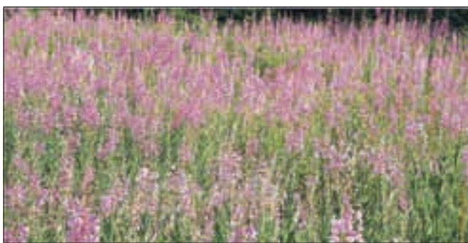
Ciprje ustvarja čudovite škrlatne otoke sredi zelenih gozdov.

Ciprje ( Epilobium angustifolium , Chamaenerion angustifolium ) navdušuje s svojimi rožnato rdečimi ali vijoličnimi cvetovi v dolgih gostih grozdastih socvetjih na vrhu poganjkov. Listi so podobni kot pri vrbah – od tod tudi ime vrbovec – podolasto ozki, na spodnji strani modrikasto zeleni, na robu spodvihani. Drobnocvetni vrbovec ( Epilobium parviflorum ) je našemu današnjemu izbrancu precej podobna, le da je manjši in ima posamične cvetove, ki so v zalistjih in v grozdastih socvetjih na vrhu poganjkov. No, kar se zdravilnosti pri težavah s prostato tiče, sta drobnocvetni in ozkolistni vrbovec povsem enakovredna. Pa še kakšnemu njunemu ožjemu sorodniku lahko