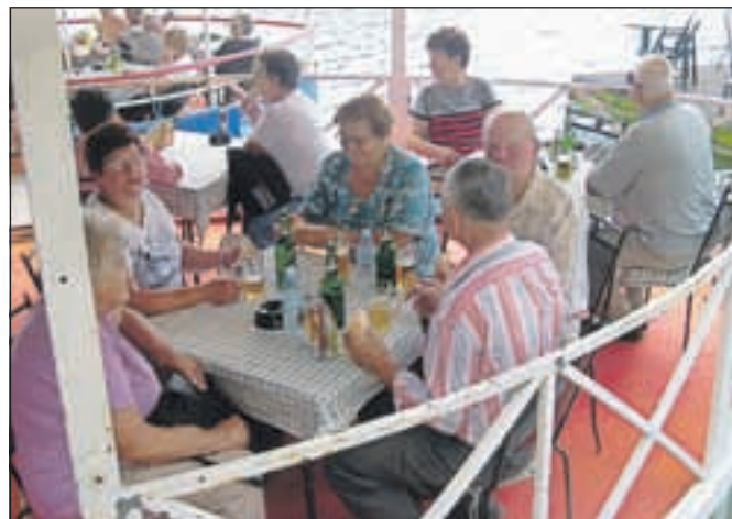
Nekateri so si privoščili kavo, sladoled, drugi pa le posedeli v senci zanimive jezerske kavarnice.