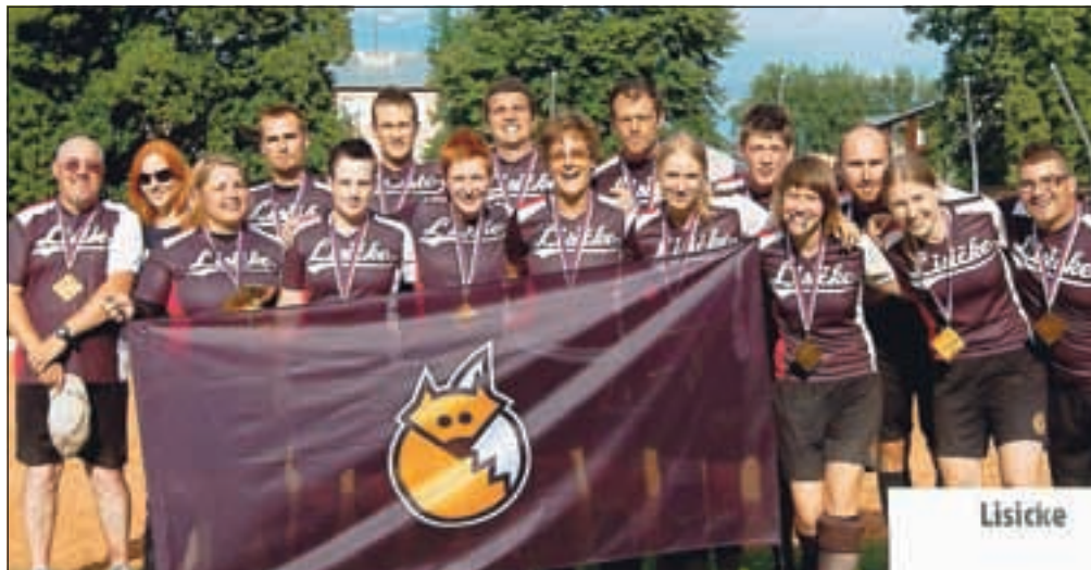
Slowpitch, ki se igra v mešani postavi fantov in deklet, je pri nas popularen zadnjih pet let, naslov evropskih prvakov pa je bil za ekipo Lisičk velik podvig.

»To je bilo naše prvo evropsko prvenstvo, zmaga, zlasti v finalu nad Angleži, ko smo jih