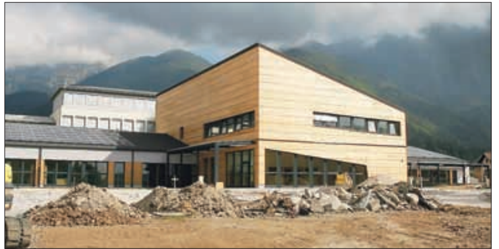
V začetku septembra bodo odprli vrata novega vrta v Preddvoru.