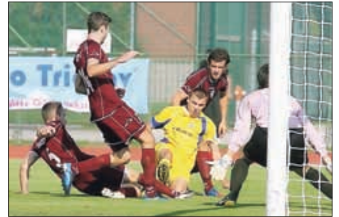
Kljub mnogim priložnostim domačih so v Kranju slavili Domžalčani.

V drugi slovenski nogometni ligi je bila že v petek odigrana tekma drugega kroga v Zavrču, kjer je Krka s tremi zadetki nekdanjega Triglavana Dejana Burgarja z 2 : 3 premagala Zavrč. V soboto je Šmartno 1928 presenetilo Dravinjo Kostroj in zmagalo z 2 : 4, Roltek Dob