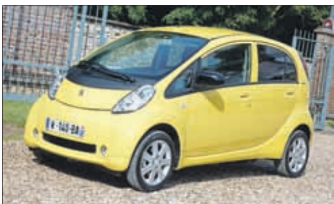
Premalo kupcev za Citroën C-Zero in Peugeot iOn zaustavilo proizvodnjo.

V Sloveniji je bil med tremi znamkami lani najuspešnejši Peugeot s štirimi registracijami modela iOn, pri Citroënu so našli kupce za tri