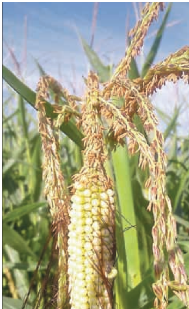
Koruza, ki vzbuja pozornost.

Kot smo izvedeli, je kmetijska inšpekcija v sredo odvzela vzorce koruze (tudi te, ki jo prikazujejo slike AAG) in jih še isti dan poslala na Nacionalni inštitut za biologijo, kjer jih bodo preiskali na prisotnost gensko spremenjenih organizmov v rastlinah. Po prejemu rezultatov bo ukrepala v skladu s svojimi pristojnostmi.