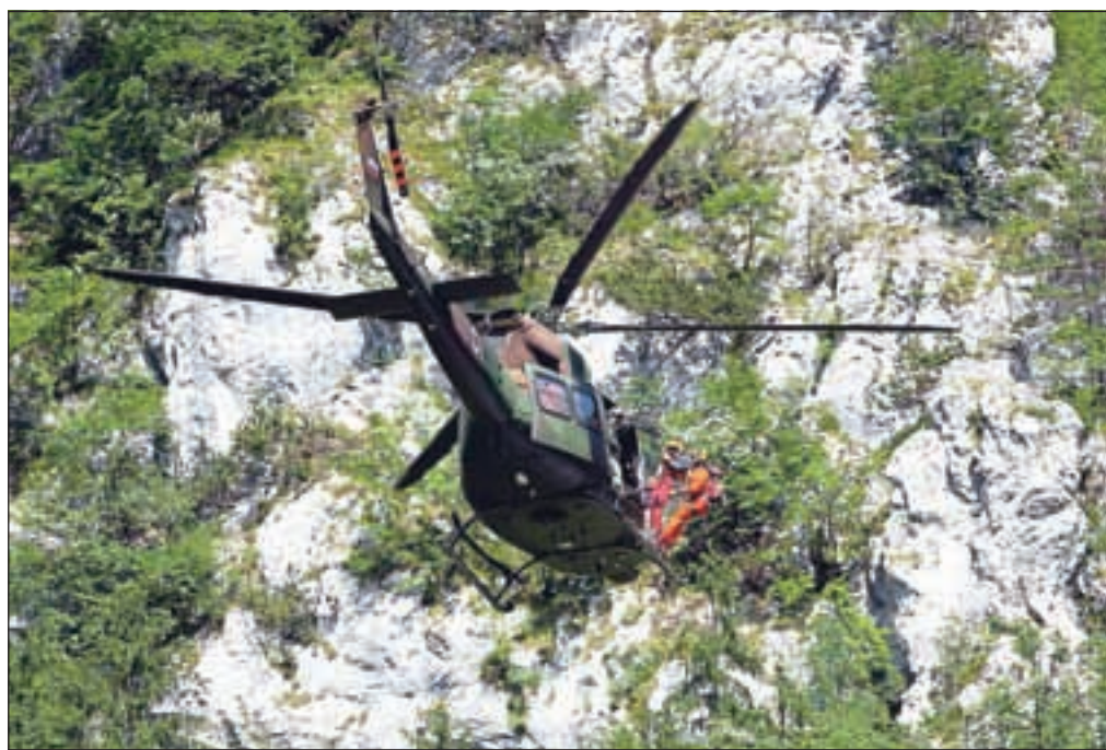
S pomočjo helikopterja so iz Triglavse severne stene rešili poškodovana alpinista (slika je simbolična).

Pomoč gorskih reševalcev sta najprej potrebovala alpinista, ki sta se poškodovala v Nemški smeri Triglavse severne stene. Do njiju so priplezali reševalci iz Mojstrane, ju oskrbeli in pripravili za dvig v helikopter Slovenske vojske, s katerim se je z brniškega letališča pripeljala dežurna ekipa gorske reševalne službe. Odpeljali so ju v jeseniško bolnišnico. Dežurna ekipa je istega dne poletela tudi na Komarčo, kjer je planinka padla v globel. Prvi so ji pomagali bohinjski reševalci, nato so jo s helikopterjem prepeljali v jeseniško bolnišnico. V nedeljo popoldne se je na poti na Križno goro poškodovala planinka, katero so gorski reševalci iz Škofje Loke prenesli do reševalnega vozila Nujne medicinske pomoči Škofja Loka. Popoldne pa je pet planincev