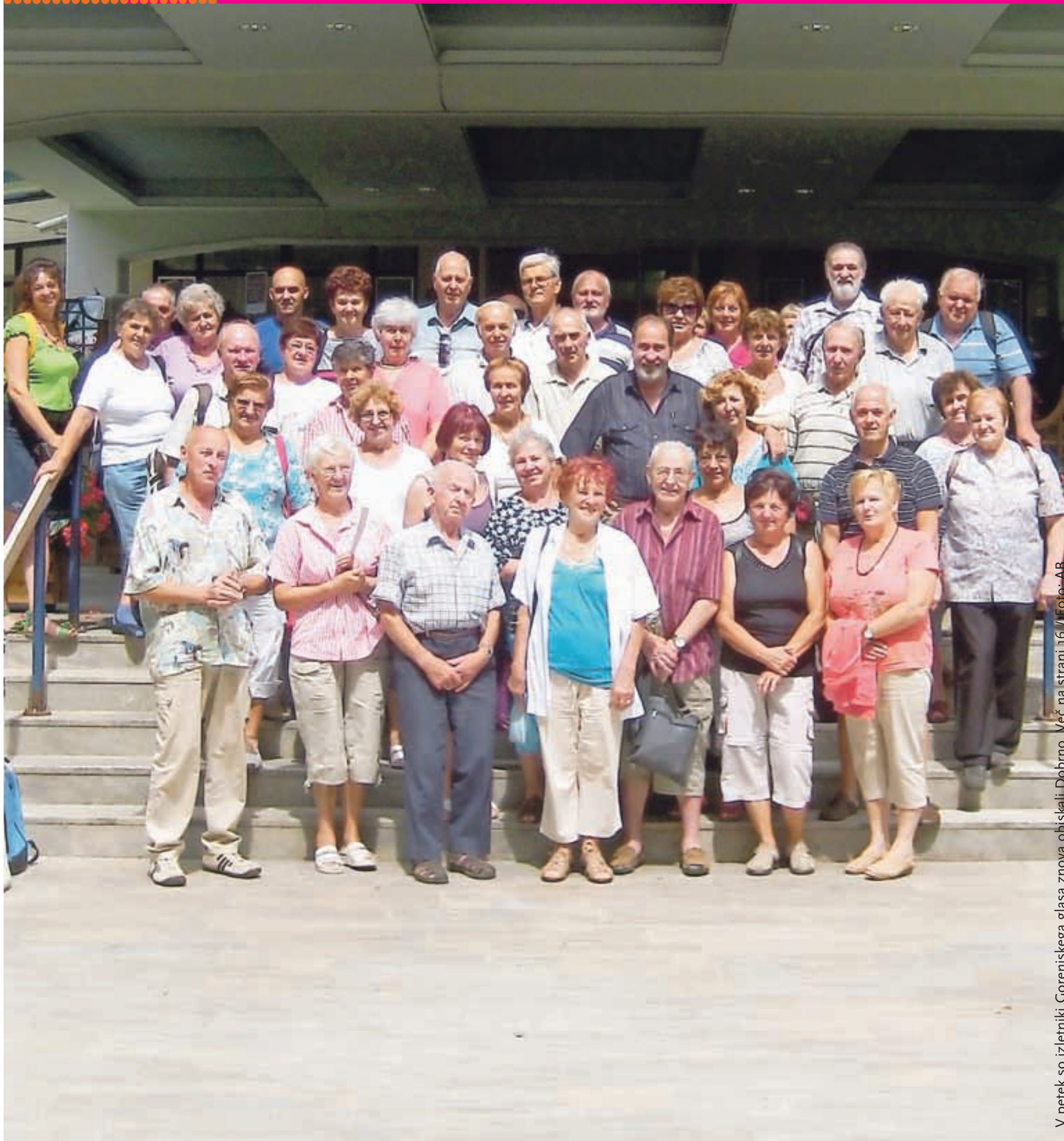
V petek so izletniki Gorenjskega glasa znova obiskali Dobrno. Več na strani 16