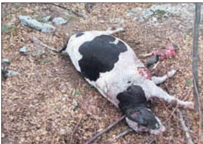
Pobita krava z bohinjske planine Polana

volka, vendar se doslej za to še nismo odločili, ker smo pričakovali, da se bodo napadi polegali. Pa ne le to! Postopek za izdajo dovoljenja lahko v primeru, ko niso ogroženi ljudje, traja od dva do tri mesece, pa tudi lov na volka bi bil ob morebitni pridobitvi dovoljenja zelo težaven.«